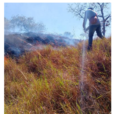
Se llama a evitar arrojar colillas a zonas boscosas.

La Dirección Operativa de Gestión del Riesgo de Desastres del Departamento reitera su compromiso con la protección del territorio e invita a la ciudadanía a sumarse activamente a las acciones de prevención. Evitar los incendios es tarea de todos.