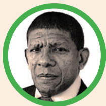
Por Martín López González