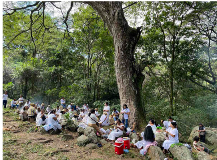
Para la URT es importante encontrar soluciones que sean dialogadas y concertadas entre todos.

En este sentido, procesos de participación y paz como los diálogos territoriales pueden ser capitalizados en regiones como la Sierra Nevada para fortalecer el encuentro, facilitar la interlocución y contribuir a la prevención y/o transformación positiva de cualquier tipo de discordia o escalamiento que se presente en la zona.