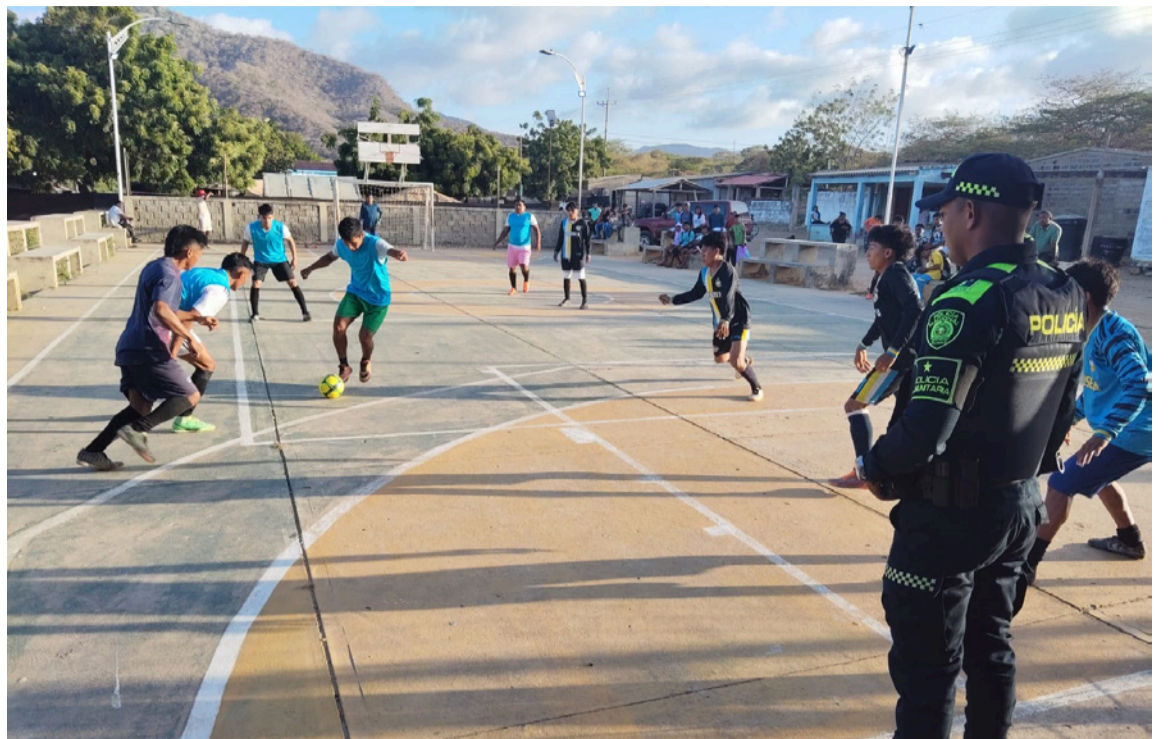
El campeonato es una apuesta por la vida, la paz y la esperanza.

EL PRESENTE AVISO SE DESFIJA DE LA CARTELERA DE LA ALCALDIA DISTRITAL EL DIA 28 DE JULIO DE 2025.