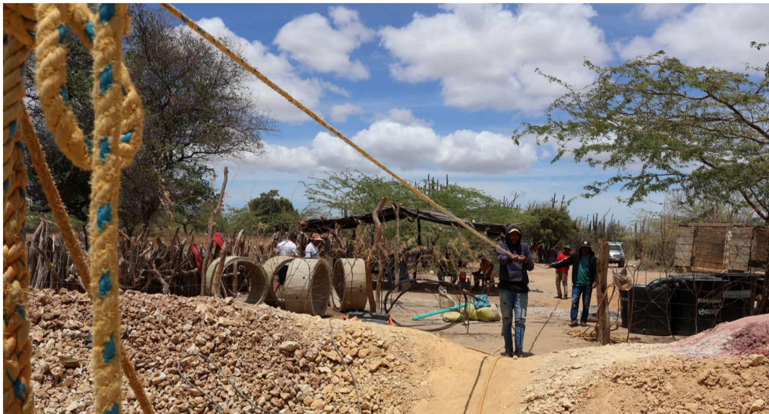
Hombres tiran de la pita para sacar a Noé Epieyu del pozo.

La siguiente tarea “es bajar los 22 anillos al pozo, lo bajamos con pura fuerza sostenidos de pitas gruesas y mientras va bajando las personas que sostienen se van acercando al pozo”, cuenta Noé Esperanzado.