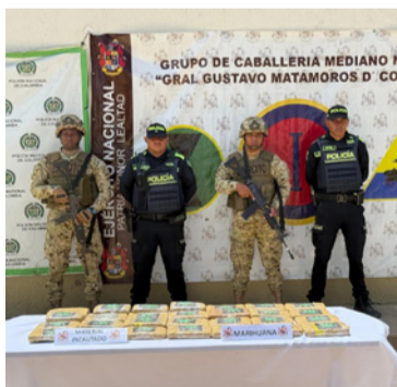
El alijo está valorado en 18 millones de pesos.

do del saco, las autoridades hallaron 28 panelas cuadradas marcadas con el logo de una planta de marihuana. El alijo tendría un valor estimado en el mercado ilegal de más de 18 millones de pesos.