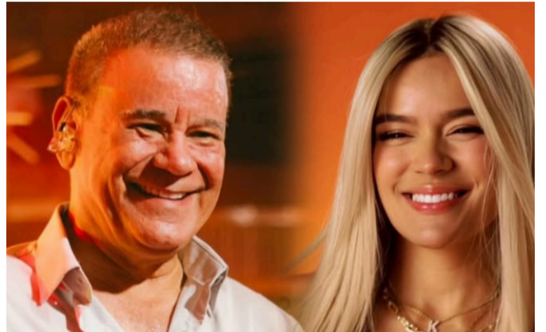
En palabras de Iván Villazón, la artista paisa, Karol G, cantó el paseo conservando la esencia vallenata.

"Queremos y apoyamos a nuestra juventud vallenata y creo que tenemos la autoridad para decirle cosas constructivas y convidarlos a que cuidemos el folclor vallenato", concluyó Iván Villazón.