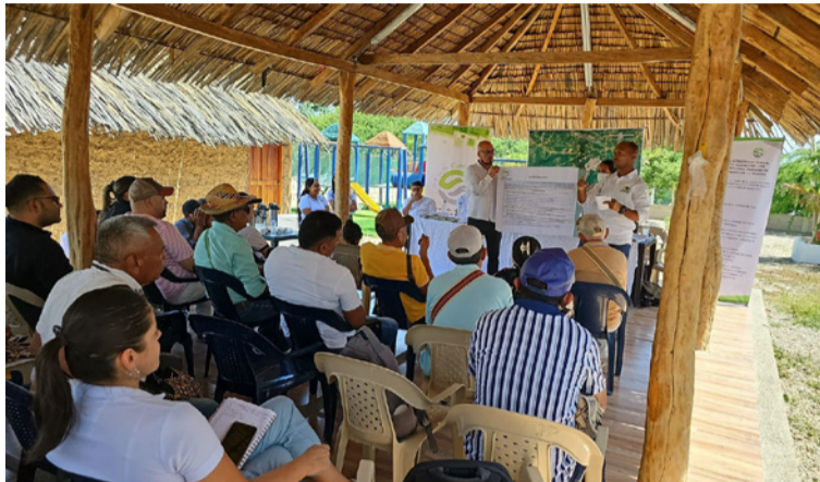
Es una oportunidad para promover el respeto por los derechos ambientales y culturales del pueblo wayuú.

El proyecto contempla la instalación y puesta en marcha de equipos para la medición en tiempo real, además de actividades técnicas de caracterización física y química de su comportamiento, así como el análisis de la calidad del agua superficial