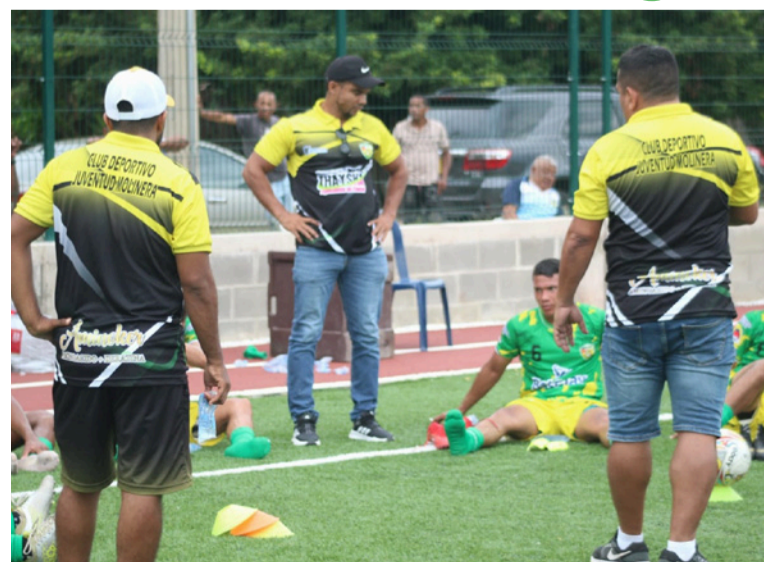
El equipo molinero buscará defender su invicto como local y seguir escalando posiciones en la tabla.

El equipo molinero buscará defender su invicto como local y seguir escalando posiciones en la tabla, en un duelo que promete emociones y que marcará un punto clave en su camino hacia las fases finales del torneo.