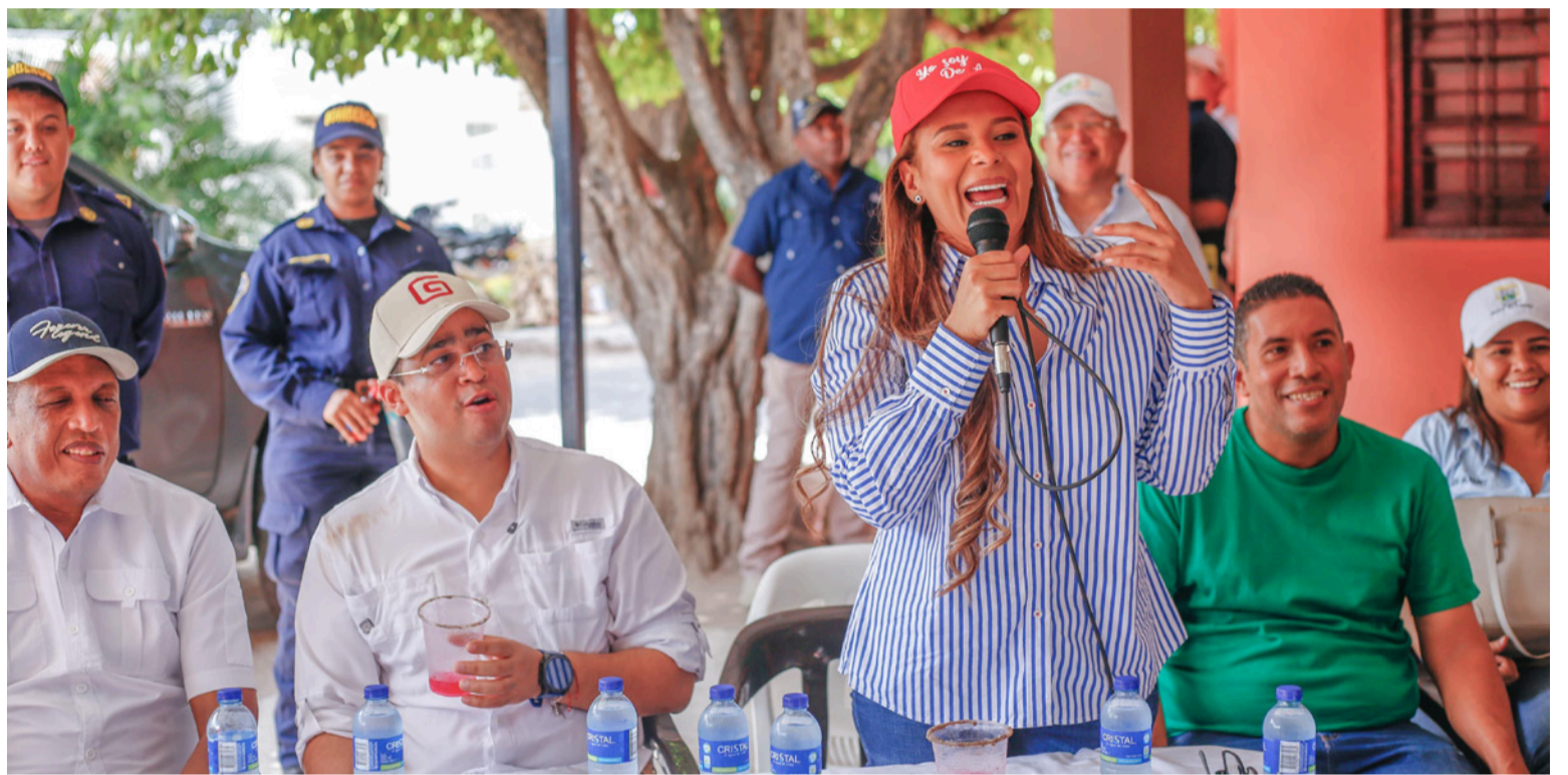
La Sentencia del 11 de julio de 2025 del Consejo de Estado, le devuelve plena validez jurídica a Esepgua.

Desde su creación a finales de 2020, Esepgua ha pasado de ser una iniciativa jurídica a convertirse en una de las herramientas más importantes del Gobierno departamental para atender una deuda histórica con las comunidades: el acceso