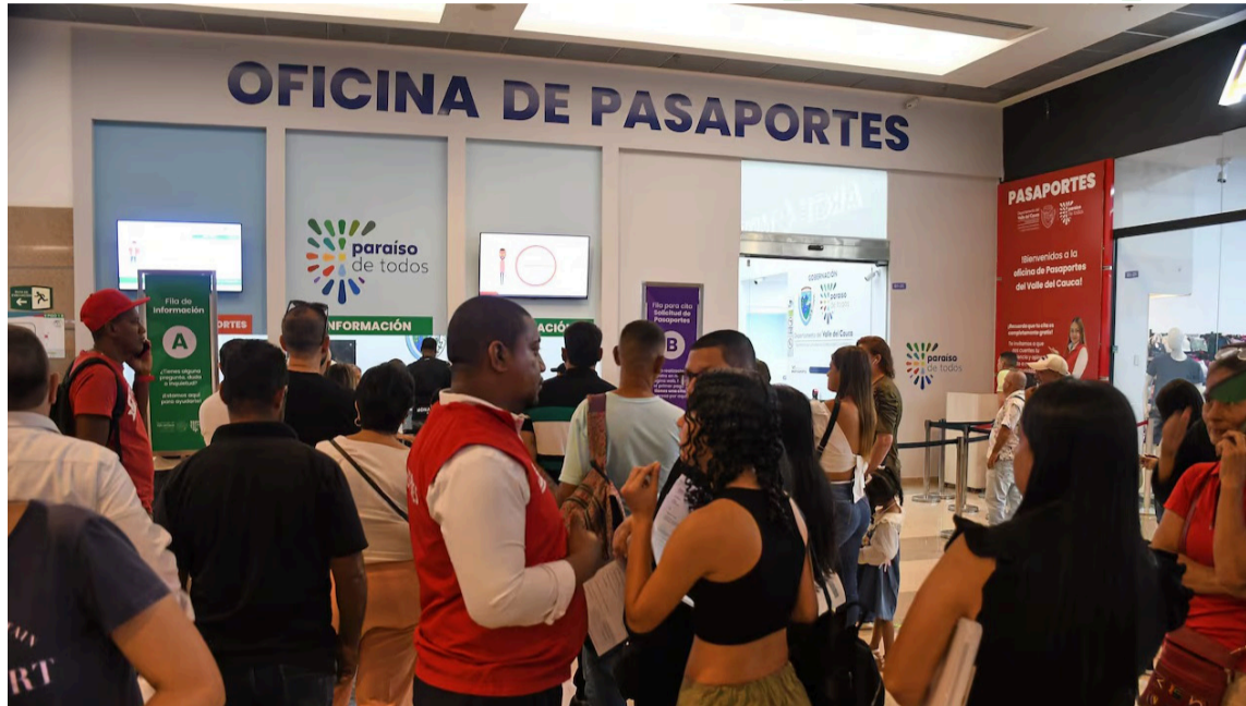
El presidente desacredita las operaciones de la autoridad electoral competente.

Existe predisposición en el Gobierno del presidente Gustavo Petro, desde