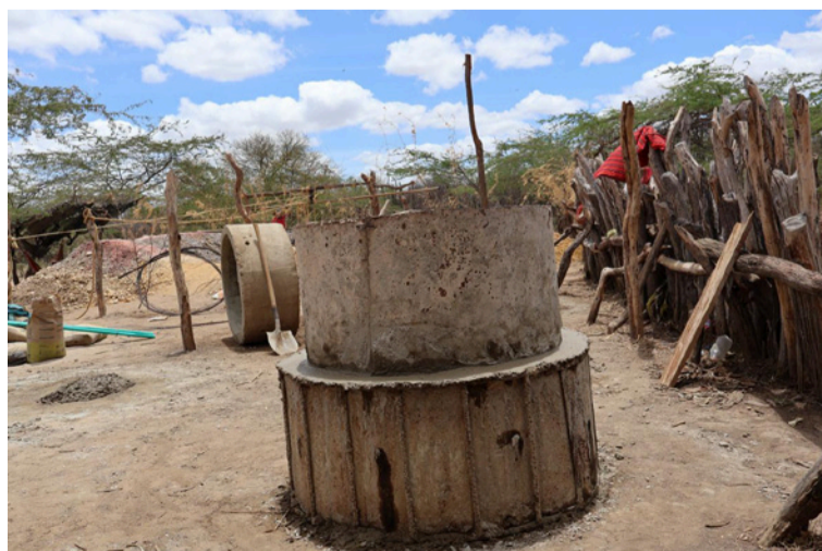
Anillos de concreto elaborados por los miembros de la comunidad.