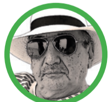
Por José Manuel Aponte Martínez