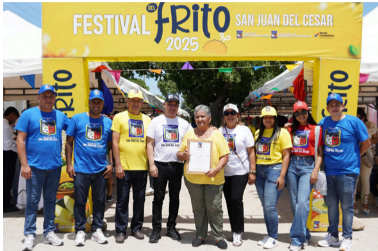
San Juan vivió una jornada llena de sabor, tradición y alegría con la realización del primer Festival del Frito.

El Festival del Frito no solo exaltó los sabores tradicionales, sino que también reafirmó el espíritu emprendedor y el orgullo de una comunidad que cree en sus raíces y trabaja por un futuro con más oportunidades.