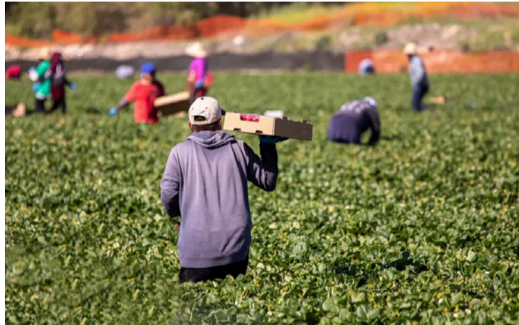
El país avanza hacia una agroindustria más robusta, integrada y con fuerte potencial de internacionalización.

El reto está lanzado. Y como en toda gran transformación estructural, el éxito dependerá no solo de la política pública, sino del liderazgo local y de una visión compartida que entienda que el campo —y su gente— no son el pasado, sino el futuro de Colombia.