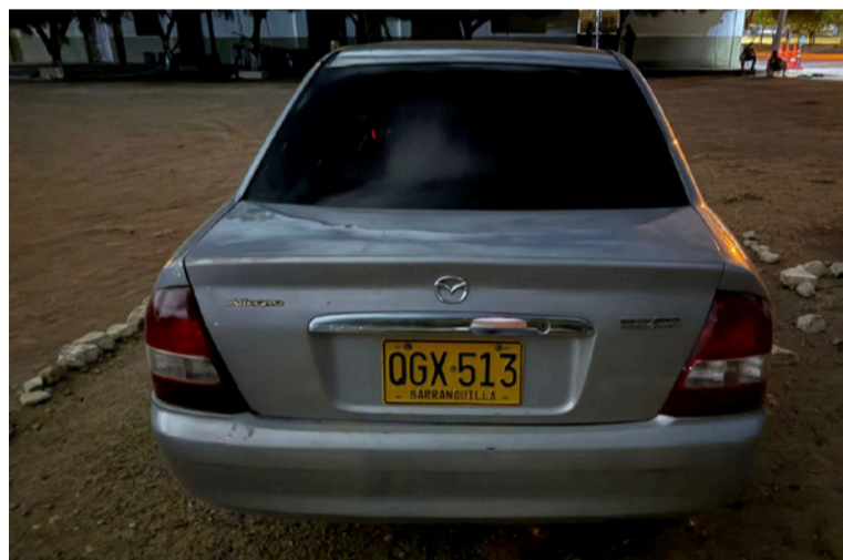
En el procedimiento no se efectuaron capturas. Las autoridades se encuentran en labores de investigación.

En horas de la tarde del lunes, en cercanías a la comunidad wayú Sirumat-chi-Loma, en la zona rural de Maicao, fue recuperado un automóvil de color gris y de placa QGX-513, que había sido hurtado desde el casco urbano de la entidad fronteriza.