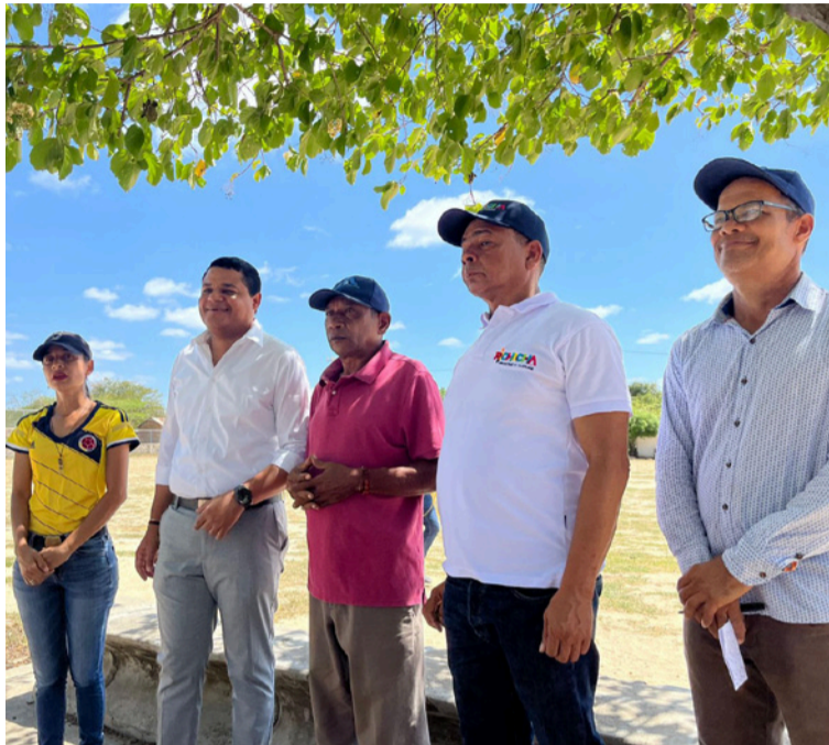
La iniciativa busca que las comunidades puedan acceder a más recursos del Gobierno nacional

Gracias al trabajo articulado entre la Alcaldía de Riohacha y la Secretaría de Planeación, avanza el proceso de saneamiento y titulación de predios como centros de salud, casas de cultura, canchas deportivas, colegios, parques, cementerios, corre-