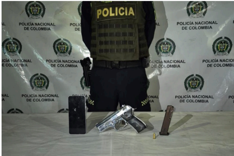
Según manifestaron los uniformados, el infractor fue interceptado a unas cuadras del sitio del hurto.

Una fuente policial informó que la persona, de quien se desconoce el nombre por ser menor de edad, fue capturada en la calle 18 con carrera 12, del barrio San José de Maicao. Al realizarle una requisita, los agentes descubrieron en su poder un arma de fuego tipo pistola niquelada, con empuña-