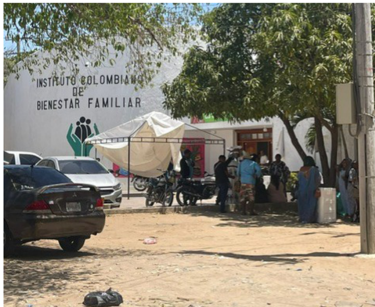
Las autoridades reclaman que la coordinadora del Centro Zonal de Manaure reasuma sus funciones.

Precisaron que fue una decisión que se tomó de la noche a la mañana, sin ningún aviso previo a la coordinadora que se le