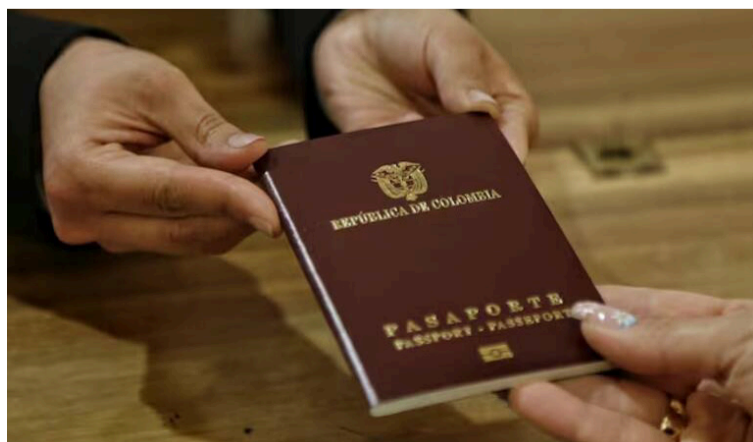
La Cancillería no dispone de cantidades suficientes de pasaportes, ordinarios y ejecutivos, para soportar una crisis.

Necesitamos alivio y afianzamiento, no más confrontaciones agrestes políticas, remembrando antecedentes trágicos y cuestionando a otras autoridades, que no les copian o complacen en decisiones y pretensiones. Menos manipulaciones, mantos de dudas, especulaciones e incertidumbres. Estamos en SOS, con oración, clamor, exhortaciones y la fe en Dios, procurando lograr paz anhelada y querida, dependiendo de nuestra recia voluntad.