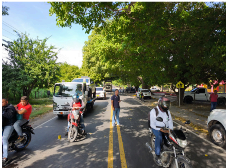
Los manifestantes atravesaron sus maquinarias agrícolas, impidiendo completamente la movilidad vehicular.

Productores arroceros del sur del departamento de La Guajira bloquearon la vía nacional a la altura de Fonseca, frente a las instalaciones de la sede de extensión de la Universidad