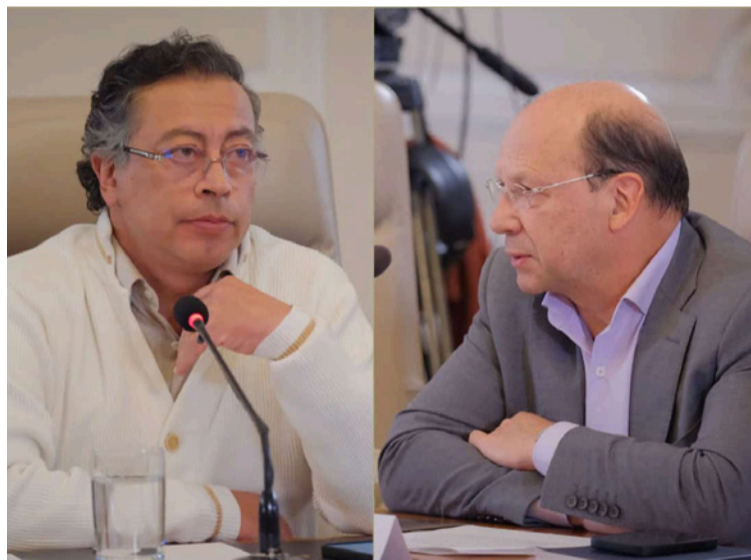
Desafortunadamente, las expectativas de mayores ingresos gracias a dos reformas no se cumplieron.