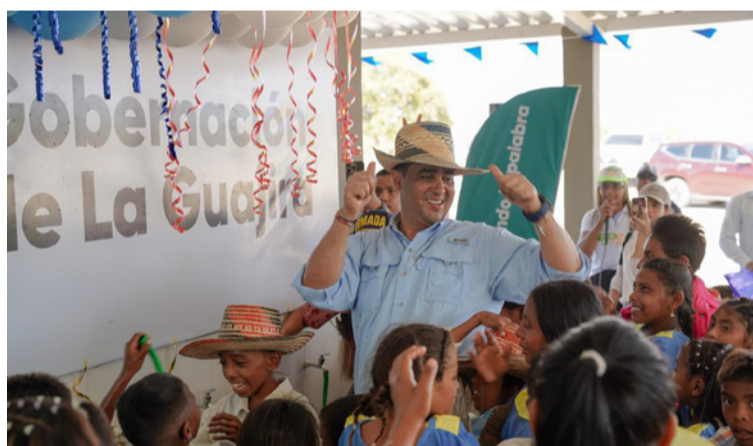
La Gobernación reitera su decisión de seguir tramitando y manteniendo activa la ejecución de proyectos.

al agua. Bajo el convenio 046 de 2022, la empresa ha ejecutado cerca de 60 proyectos que hoy benefi-