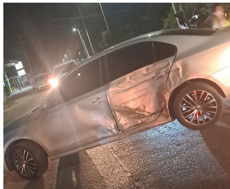
El percance registrado en el barrio Villa Sharín, solo dejó daños materiales y personas con lesiones leves.