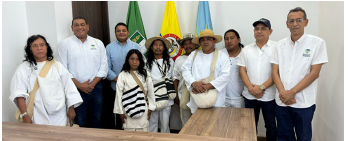
El acuerdo representa una inversión de cerca de $3 mil millones, para ser ejecutados.

Dos de los proyectos estratégicos darán vida a esta inversión, inicialmente con el fortalecimiento