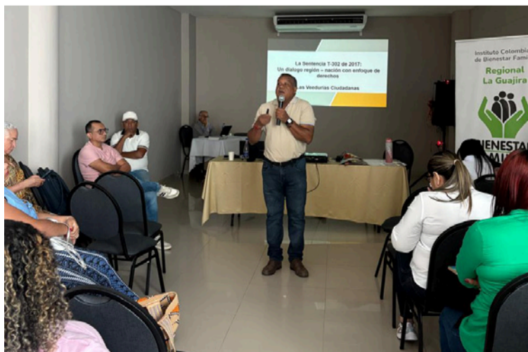
Ayaawata nació como un observatorio que no mira desde afuera, sino desde adentro, desde el corazón del territorio.