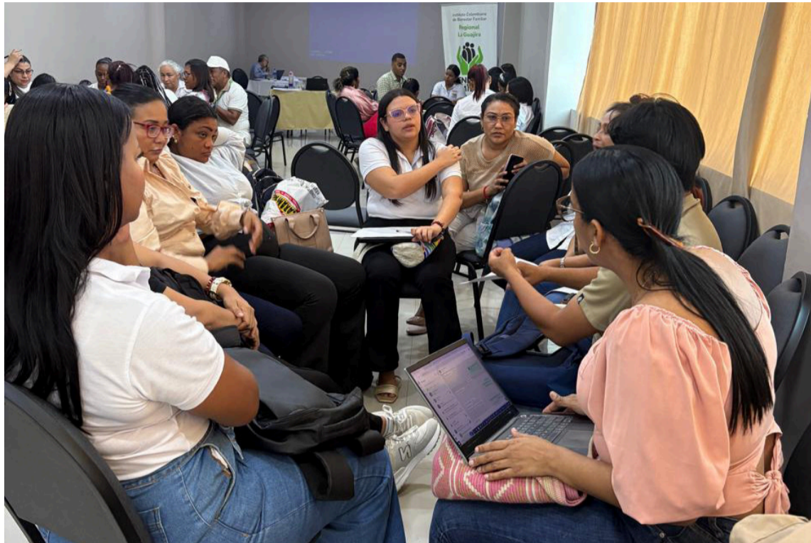
La reunión no era un acto de palabras vacías; su objetivo era la acción concreta.

En ese espacio, Ayaawata se presentó como un sistema que no se basa en códigos ni en pantallas frías, sino en la presencia atenta de ojos, oídos y corazones en guardia. No era un simple sistema de información, sino un verbo en movimiento, una forma de actuar con sensibilidad y prontitud. La madre que reporta a tiempo, el líder que alza la voz, la abuela que rememora las palabras antiguas para enseñar las nuevas, forman parte de este tejido humano y comunitario. Cada uno aporta su rol como vigía de la vida, atravesando protocolos y obstáculos para garanti-