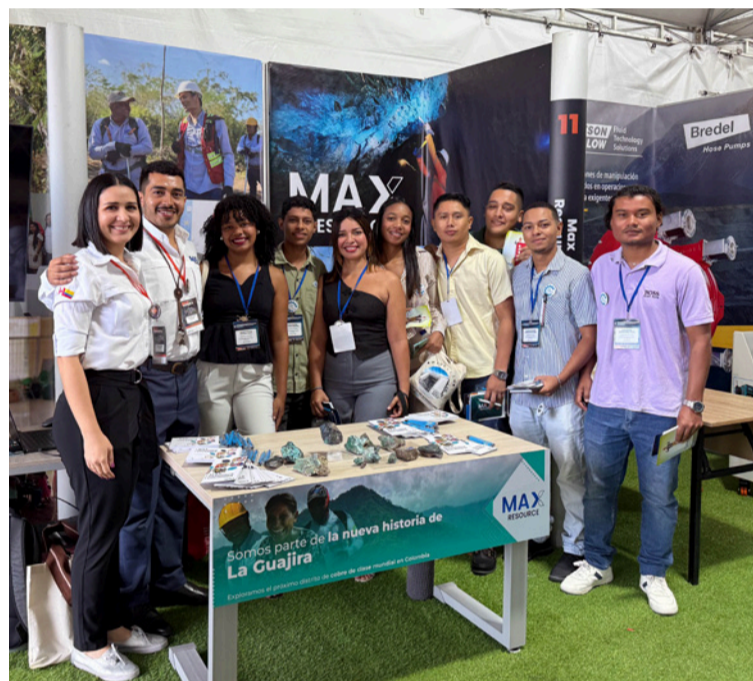
El equipo de Max Resource junto a los estudiantes de la Universidad de La Guajira.

Max Resource tuvo una destacada participación esta semana en el Cobre Colombia 2025, uno de los encuentros más importantes del sector minero-energético en el país, realizado en la Facultad de Minas de la Universidad Nacional de Colombia, sede Medellín.