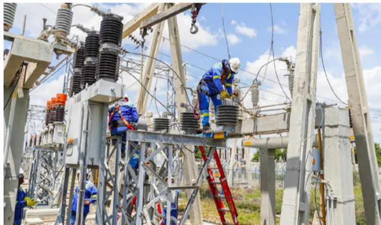
Para garantizar la seguridad durante los trabajos, será necesario suspender el servicio en varios sectores.

Durante la misma fecha, también se llevarán a cabo adecuaciones técnicas en la línea 592. Para garantizar la seguridad durante