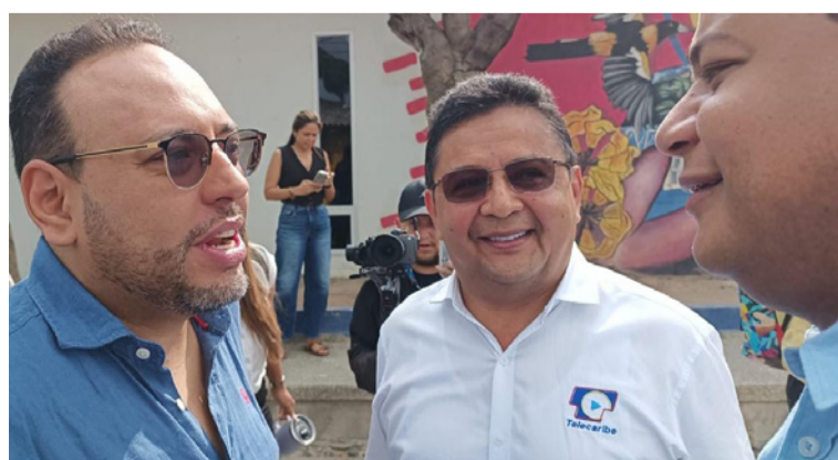
El gerente de Telecaribe le ha hecho acompañamiento al señor ministro de las TIC, Julián Molina.

La ceremonia será en Miami, Estados Unidos, en el marco de la celebración del 28 aniversario de esta institución gremial internacional sin fines de lucro, fundada en 1997.