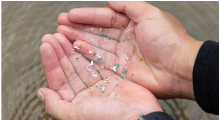
En La Guajira, las playas presentan una alta presencia de residuos plásticos que afectan el turismo y la pesca.

El impacto de los microplásticos en los seres vivos puede ser físico y químico.