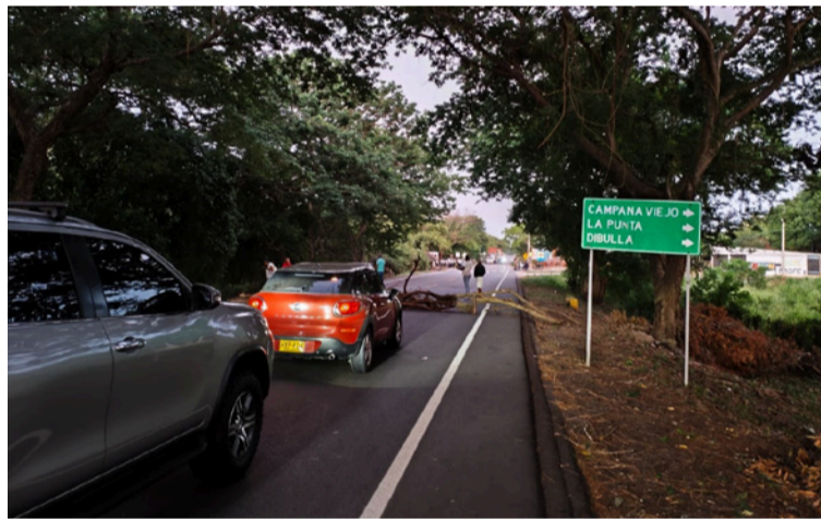
Los manifestantes aseguran que no están dispuestos a levantar el bloqueo hasta que se retomen los acuerdos.

La protesta se mantenía a la altura del kilómetro 42 del sector de