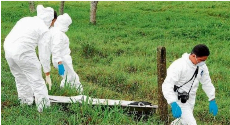
Una fuente informó que esta persona vestía un pantalón de color negro y tenía puestas botas pantaneras.

En la tarde de ayer lunes 7 de julio, hallaron el cuerpo sin vida de una persona de sexo masculino decapitado y sin su brazo derecho a orillas de un cauce en zona rural del municipio de Albania.