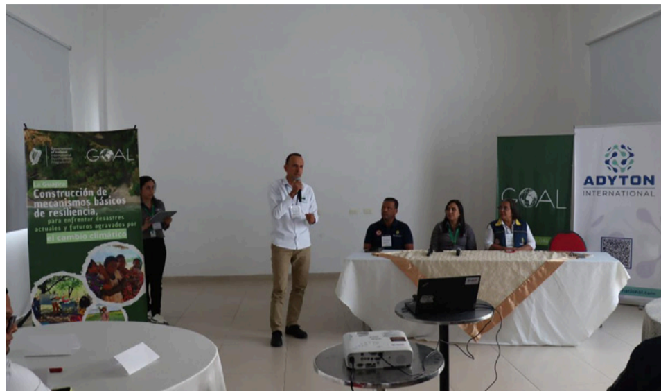
Este espacio permitió promover una visión compartida frente a los desafíos climáticos, y avanzar hacia una gobernanza ambiental.

Se busca aportar desde la experiencia técnica