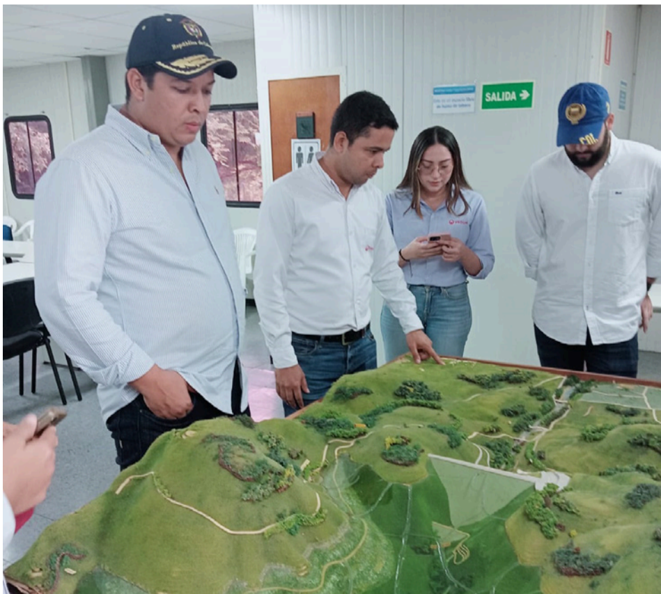
Los concejales de Barrancas exigieron que se adelanten de manera urgente las investigaciones pertinentes para esclarecer los hechos.

El resguardo indígena kogui-malayo-arhuaco tiene presencia en los departamentos del Cesar, Magdalena y La Guajira, siendo este último el territorio que alberga el 49% de la población del resguardo, con aproximadamente 4.567 personas. Esto convierte a Riohacha y su área rural en la máxima representación territorial de este pueblo indígena, con una responsabilidad cultural e histórica de enorme relevancia.