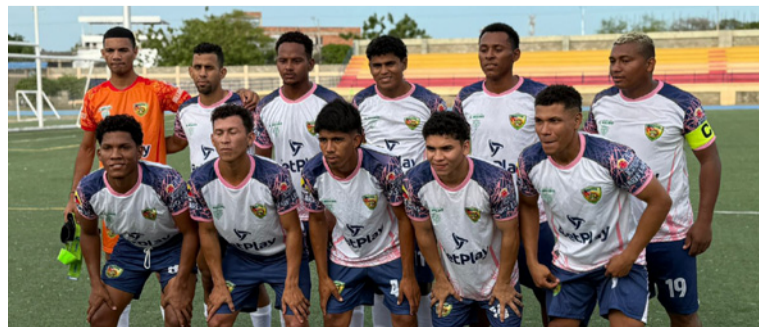
Juventud Molinera aún mantiene opciones de avanzar en el torneo, aunque deberá sumar de a tres puntos.

Juventud Molinera aún mantiene opciones de avanzar en el torneo, aunque deberá sumar de a tres puntos y esperar resultados favorables en la última jornada de esta primera fase.