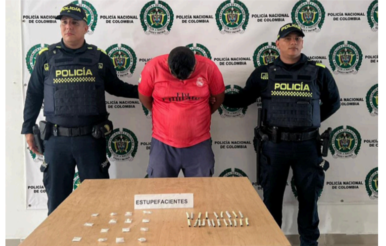
La Policía informó que a esta persona se le hallaron en su poder 20 cigarrillos artesanales y 15 bolsitas de coca.

De inmediato, se le hicieron saber sus derechos como persona capturada por el delito de tráfico, fabricación o porte de estupefacientes, siendo dejado a disposición de la Fiscalía General de la Nación para que responda por los hechos imputados.