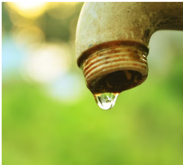
Las comunidades deben programar siembras y actividades con base en las predicciones climáticas.

Cerca de 260.000 hectáreas (ha) dentro de la frontera agrícola nacional podrían verse afectadas por exceso de agua