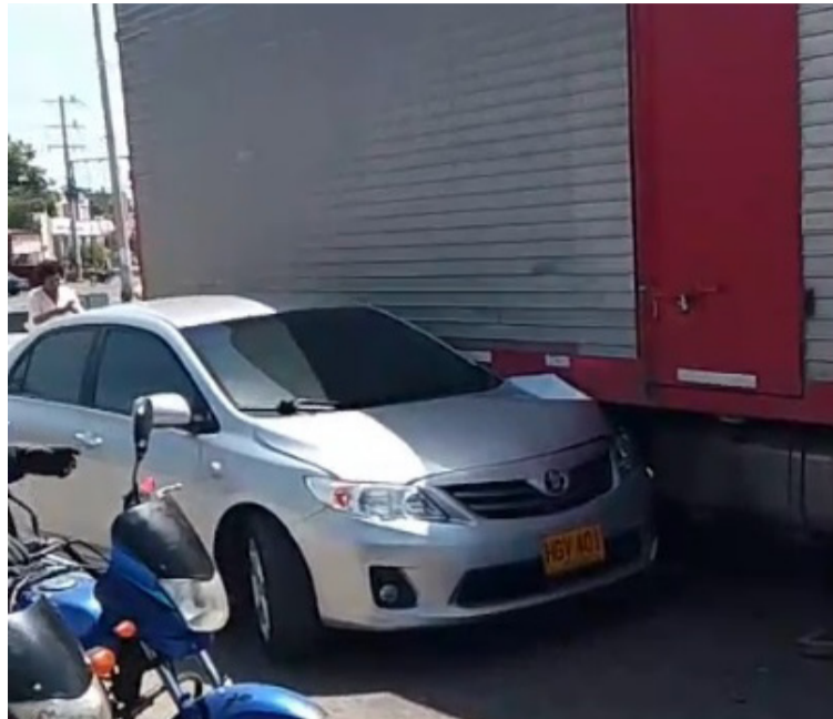
La mujer resultó atrapada en el automóvil, y fue auxiliada por algunos ciudadanos que transitaban por allí.

Secretario de Gobierno y Asuntos Administrativos