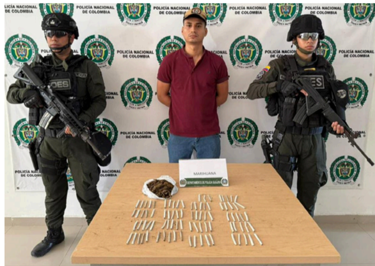
A esta persona se le incautaron 88 cigarrillos artesanales de marihuana y 220 gramos de marihuana.

En el procedimiento de registro y allanamiento se logró capturar en flagrancia a esta persona, se incautaron 88 cigarrillos