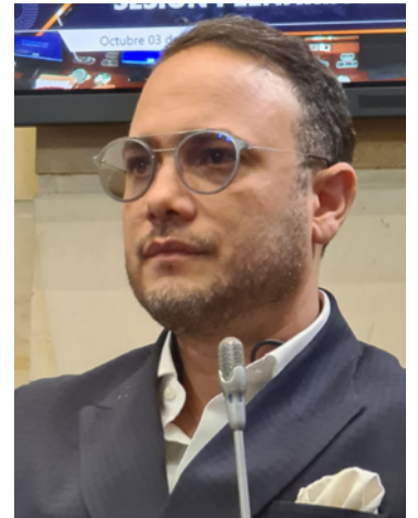
Alfredo Deluque, senador de la república

El senador también respaldó iniciativas en favor de la niñez, las mujeres y el bienestar animal, como la eliminación del matrimonio infantil, el fortalecimiento de derechos para