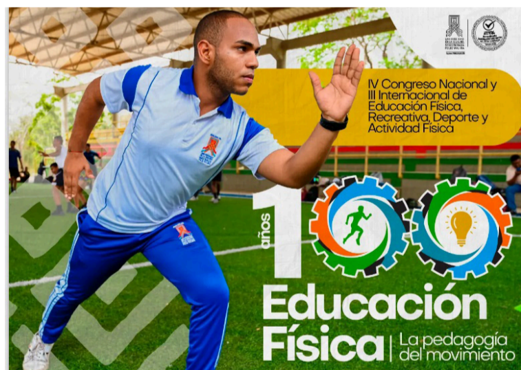
El evento se desarrollará del 4 al 6 de septiembre de 2025 en la universidad de La Guajira.