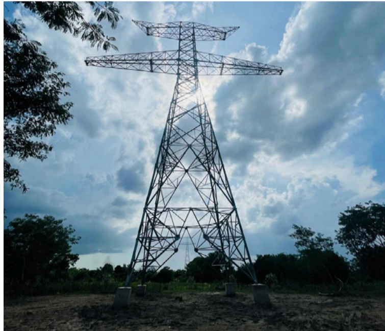
La empresa con las comunidades ha desarrollado 44 proyectos de inversión social en La Guajira y Cesar.

Mientras en el tramo Cuestecita - La Loma se han finalizado 509 cimentaciones, montado 487 torres y están en proceso 182 kilómetros de tendido; en el tramo Colectora - Cuestecita, se construyen actualmente 148 cimentaciones y se