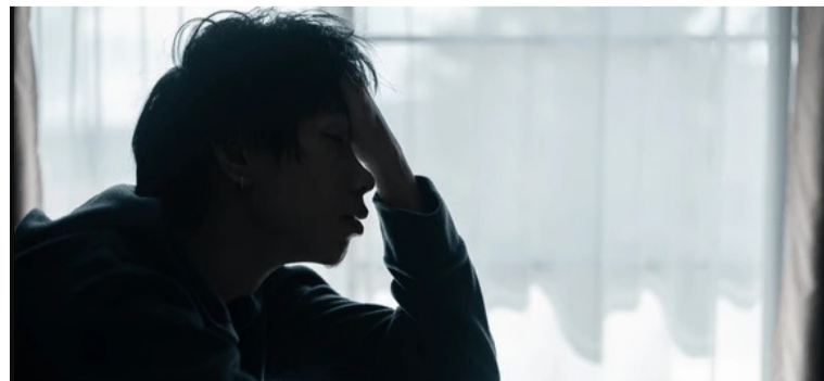
Por fortuna familiares del joven lograron auxiliarlo a tiempo y trasladarlo hasta un centro clínico.

DESTACADO Este tipo de casos continúan generando alarma en el Distrito de Riohacha, debido a la problemática de salud pública que se registra en la capital de La Guajira.