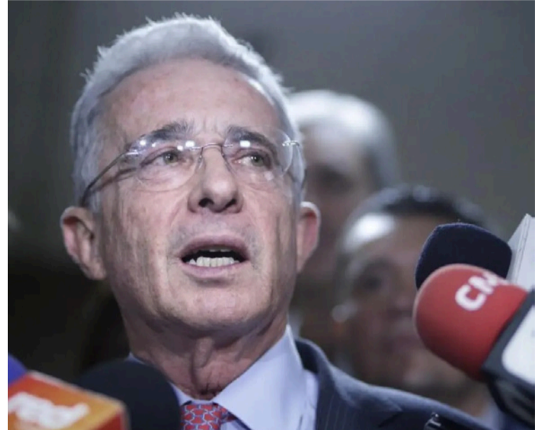
Uribe aseguró: 'Este juicio ha sido inducido por el actual Gobierno, por su más representativo senador'.

Asimismo, cuestionó la designación del fiscal que lo acusó, asegurando que fue nombrado por el entonces fiscal general Eduardo Montealegre,