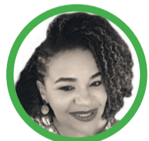
Por Carmen Tereza Palmarrosa Bruges