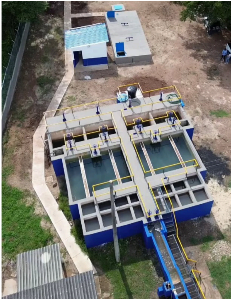
La acción busca evitar riesgos que puedan afectar a las comunidades y comprometer la gobernanza territorial.

La Procuraduría Delegada para la Gestión y Gobernanza Territorial - Pdggt en ejercicio de las funciones otorgadas por el artículo 277 de la Constitución Política, así