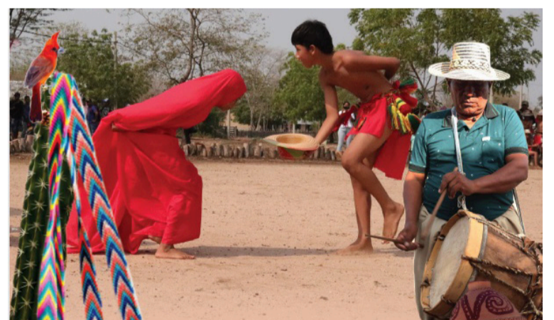
Se dará a conocer la cocina tradicional wayuú, muestras artesanales, competencias deportivas y culturales.