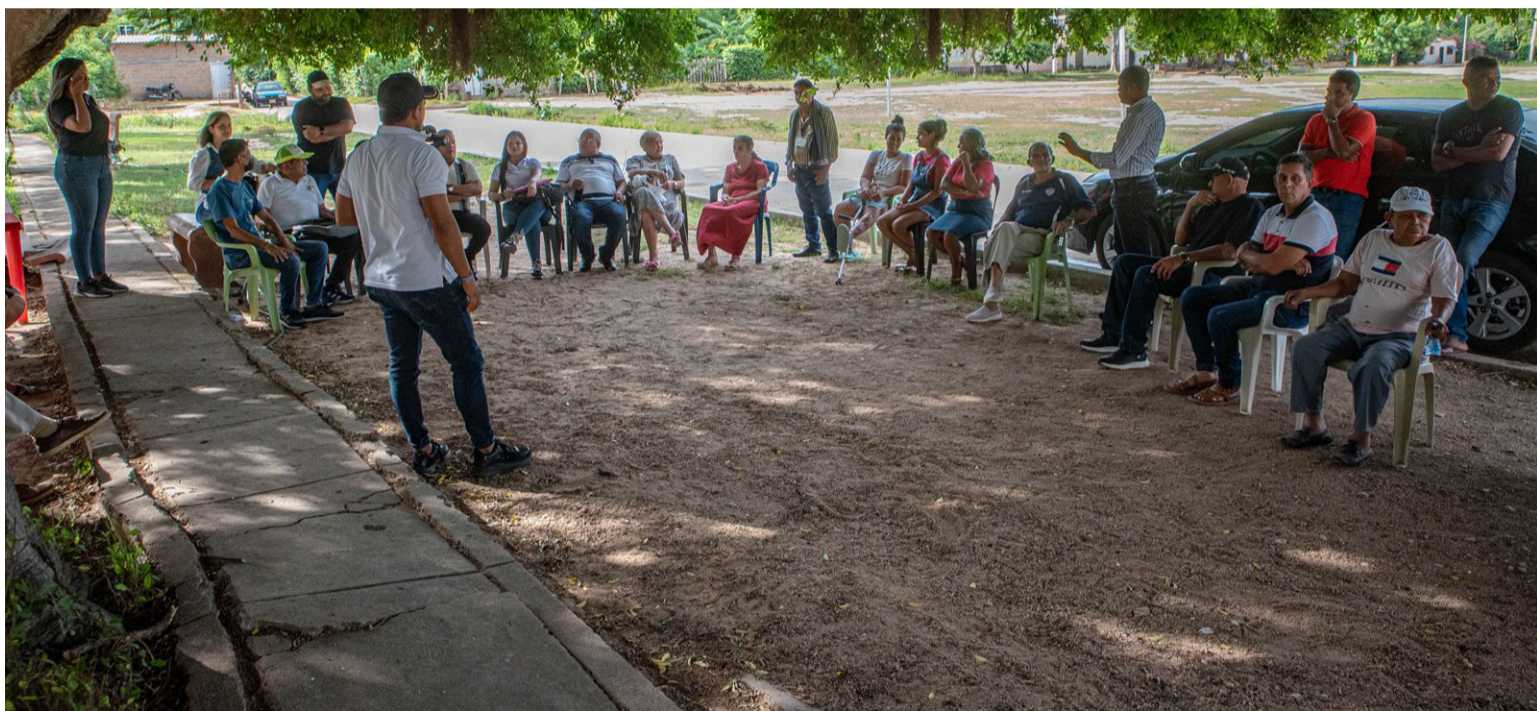
El alcalde 'Cubita' Urbina destacó que el municipio será un veedor más para que el servicio sea óptimo y sin abusos.