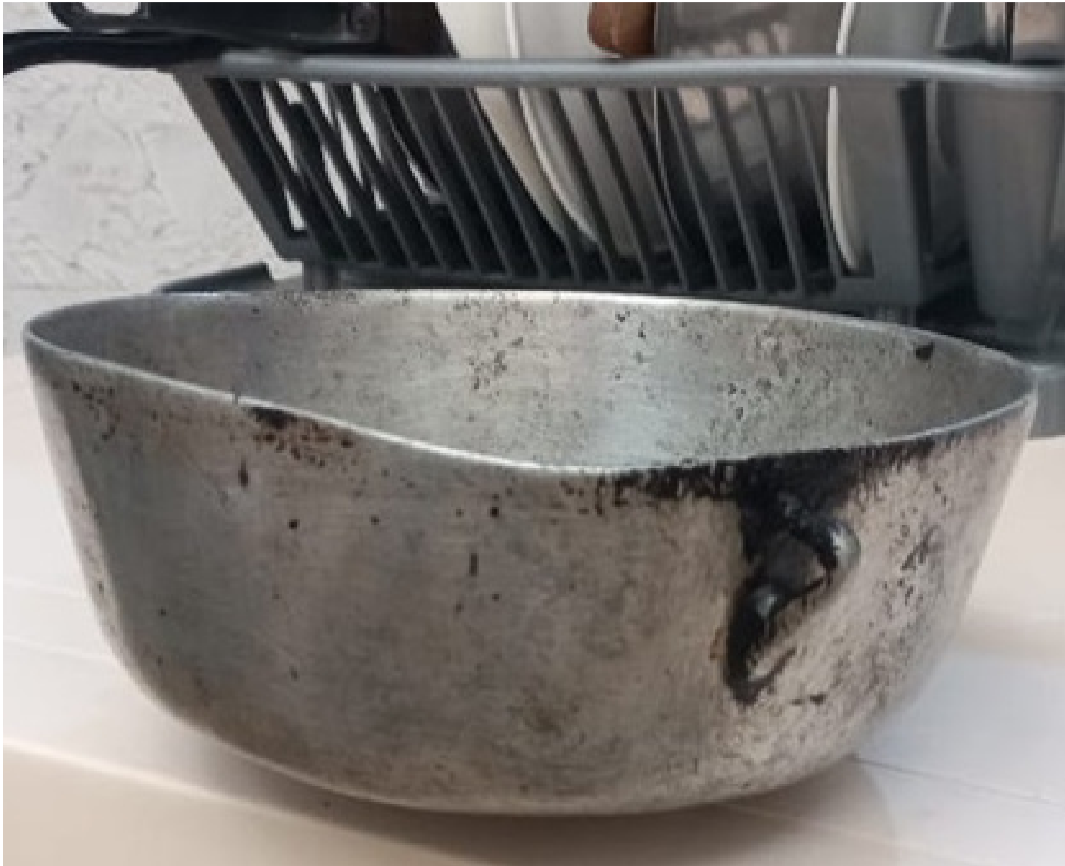
En nuestra cultura los utensilios no son desechables. Se curan, se heredan, se protegen. Se les respeta su función.

La cultura también vive en los gestos cotidianos