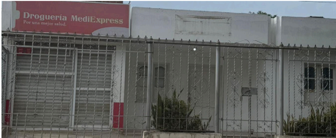
El médico desde hace días viene recibiendo amenazas por el no pago de extorsión.

El hecho se registró en una vivienda ubicada en la calle 27 con carrera 10A del barrio La Loma del Distrito de Riohacha, en donde los sujetos pasaron a bordo de una motocicleta y dispararon en varias oportunidades dejando solo daños materiales en la infraestructura.