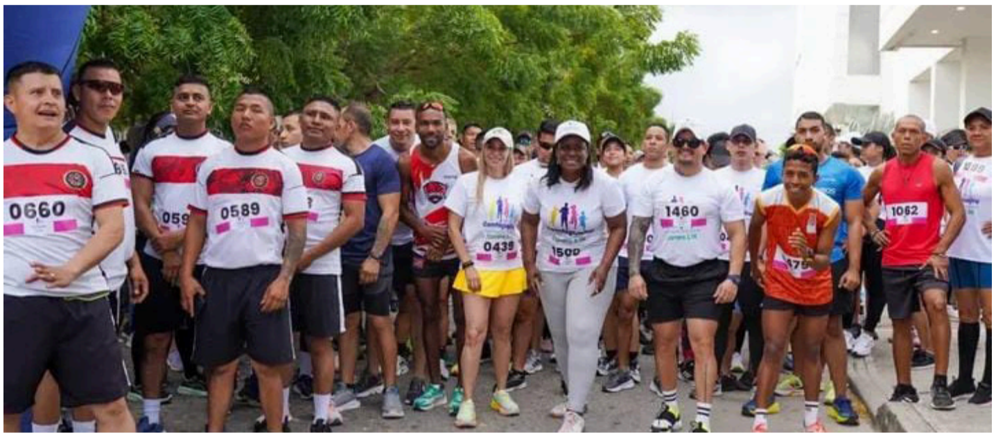
La entidad ha desarrollado actividades culturales, educativas, deportivas y recreativas en distintos municipios.

En municipios como Fonseca, San Juan del Cesar y Hatonuevo, se realizaron talleres educativos, actividades empresariales y encuentros culturales y recreativos que fortalecen el tejido social y comunitario. En el norte del departamento, Uribia fue escenario de InterArtes y de un recorrido empresarial dirigido a empresas afiliadas, enfocado en mejorar los servicios para comunidades indígenas y