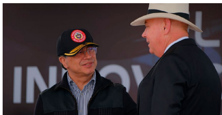
Petro ha reiterado que su intención no es confrontar a EE.UU, sino mantener una relación más justa y equilibrada.

habría buscado apoyo del presidente Donald Trump para 'tumbar a Petro'.