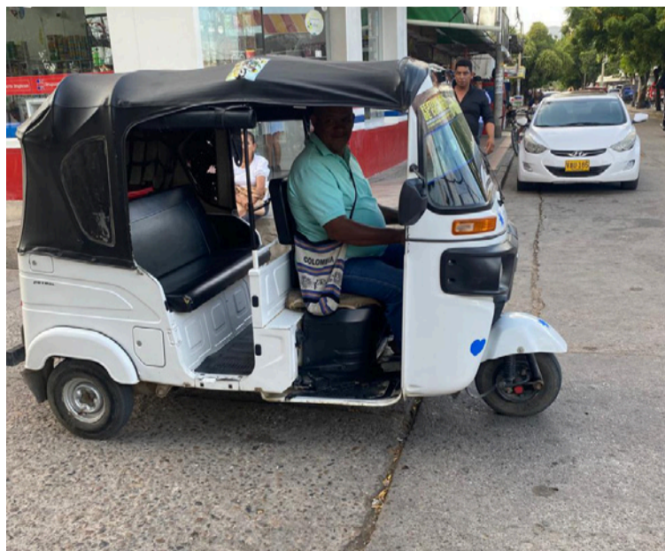
La actividad de mototaxista se ha convertido en un mal necesario como diría un alcalde preocupado.

dice: “no tiene nada que ver con la realidad, señora periodista, le cuento que gracias a este trabajo he salvado mi matrimonio, usted no se imagina qué situación estábamos viviendo, hasta el genio me cambió, me volví grosero, siempre estaba bravo, producto del desempleo, ver pasar el tiempo sin nada qué hacer, a pesar de mi título de ingeniero agrónomo, con más de cinco años desempleado sobreviviendo con lo