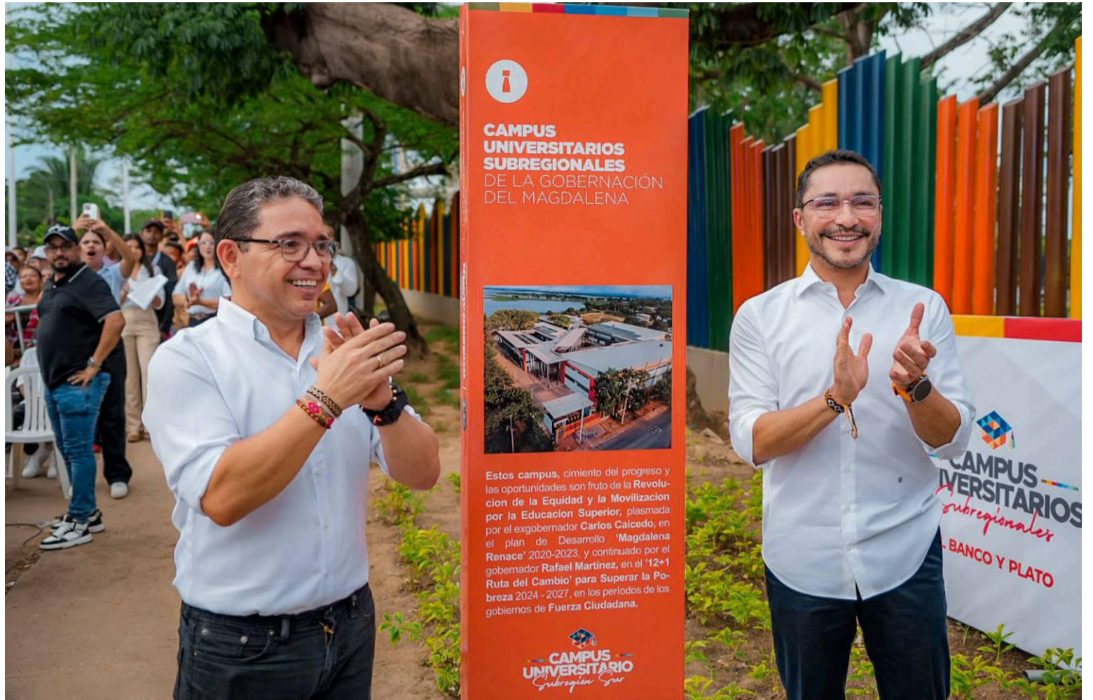
El campus universitario para el sur del departamento se suma al construido en Plato para la subregión Centro.

Carlos Caicedo y su proyecto político batallan