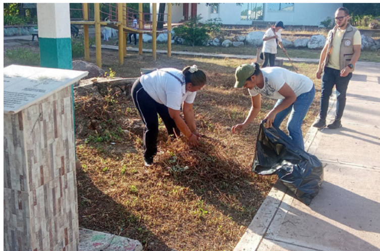
El esfuerzo colectivo de la comunidad es tener un parque en condiciones adecuadas.