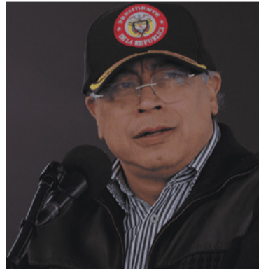
Gustavo Petro, presidente de la República.

A través de su cuenta en X, el jefe de Estado