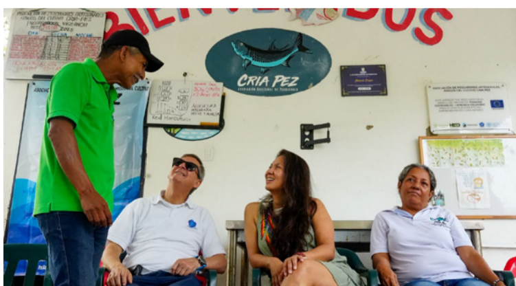
Se trataron temas como la erosión costera, el Canal del Dique, la situación de los corales y los incendios forestales.

“El presidente Petro está muy interesado en que para la conmemoración de los 500 años de Santa Marta le demos la relevancia a este escenario y por eso hemos decidido venir acá, para también darle un paneo a todos los procesos”, agregó la ministra.