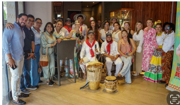
En el encuentro se generaron espacios de diálogo entre enclaves culturales con enfoque diferencial y territorial.

"Desde la Administración departamental, a través de la Dirección de Cultura, continuamos reafirmando el compromiso con el fortalecimiento de los procesos culturales en La Guajira, reconociendo la riqueza de nuestras expresiones artísticas y el valor de la identidad como motor de transformación social. Participar en estos espacios nacionales permite seguir construyendo una agenda cultural incluyente, articulada y en sintonía con las realidades del territorio, impulsando políticas públicas que reflejen la diversidad y el potencial creativo de los guajiros".