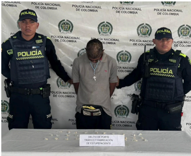
El sujeto capturado vestía suéter gris, sudadera negra, zapatos blancos y cargaba un bolso negro.

El procedimiento policial se llevó a cabo el día 12 de julio de 2025, aproximadamente a las 15:25 horas, en la calle 17 con carrera 19, barrio Pastrana del municipio de Maicao, cuando los uniformados observaron