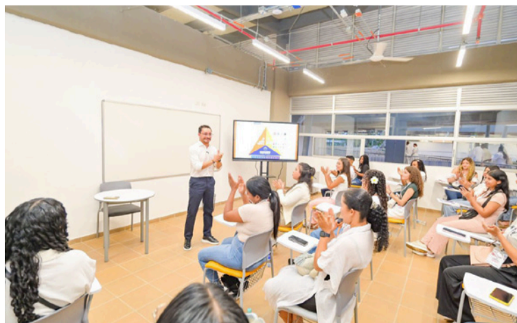
La proyección hacia 2030 de la cobertura en el Magdalena alcanzará un 59%, superando el promedio nacional.

desde hace más de dos décadas para consolidar este modelo holístico, que incluye obras en Santa Marta y el Magdalena. Al entregarse este campus se consolida un hito de política pública que integra en un solo eje el acceso, la cobertura, la pertinencia y la permanencia educativa.