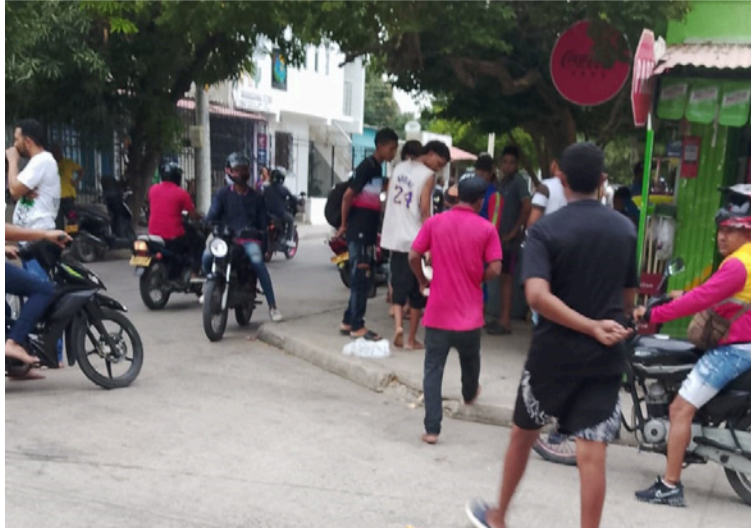
Los heridos fueron trasladados hasta diferentes centros médicos donde se encuentran con pronóstico reservado.