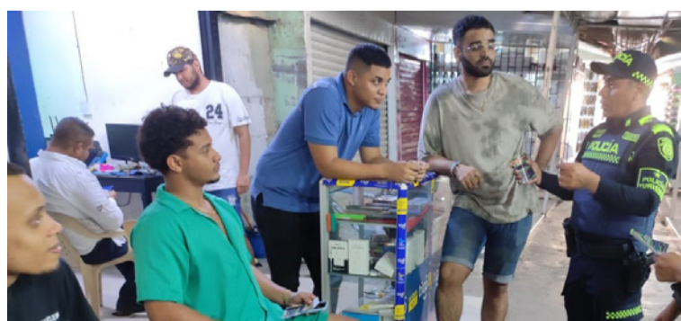
La actividad se cumplió mediante acciones de prevención y control en el sector comercio de Maicao.

Este esquema se desarrolla alineado al modelo del servicio de Policía orientado a las personas y