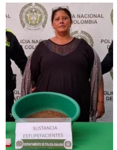
La mujer es conocida con el alias de 'La Mery'.

Durante el operativo, las autoridades incautaron 573 gramos de mari-