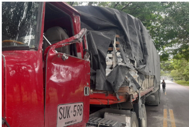
Según un conductor, el accidente se generó cuando intentó esquivar a los jóvenes para evitar una tragedia.

Uno de los transportadores, que se dirigía hacia Medellín con una carga de yeso en polvo procedente de Uribia, manifestó que el accidente se generó cuando intentó esquivar a los jóvenes para evitar una tragedia. "Intenté sacarle el cabezote del camión y en ese momento venía el otro carro con remolque. Fue ahí que chocamos de lado", relató.