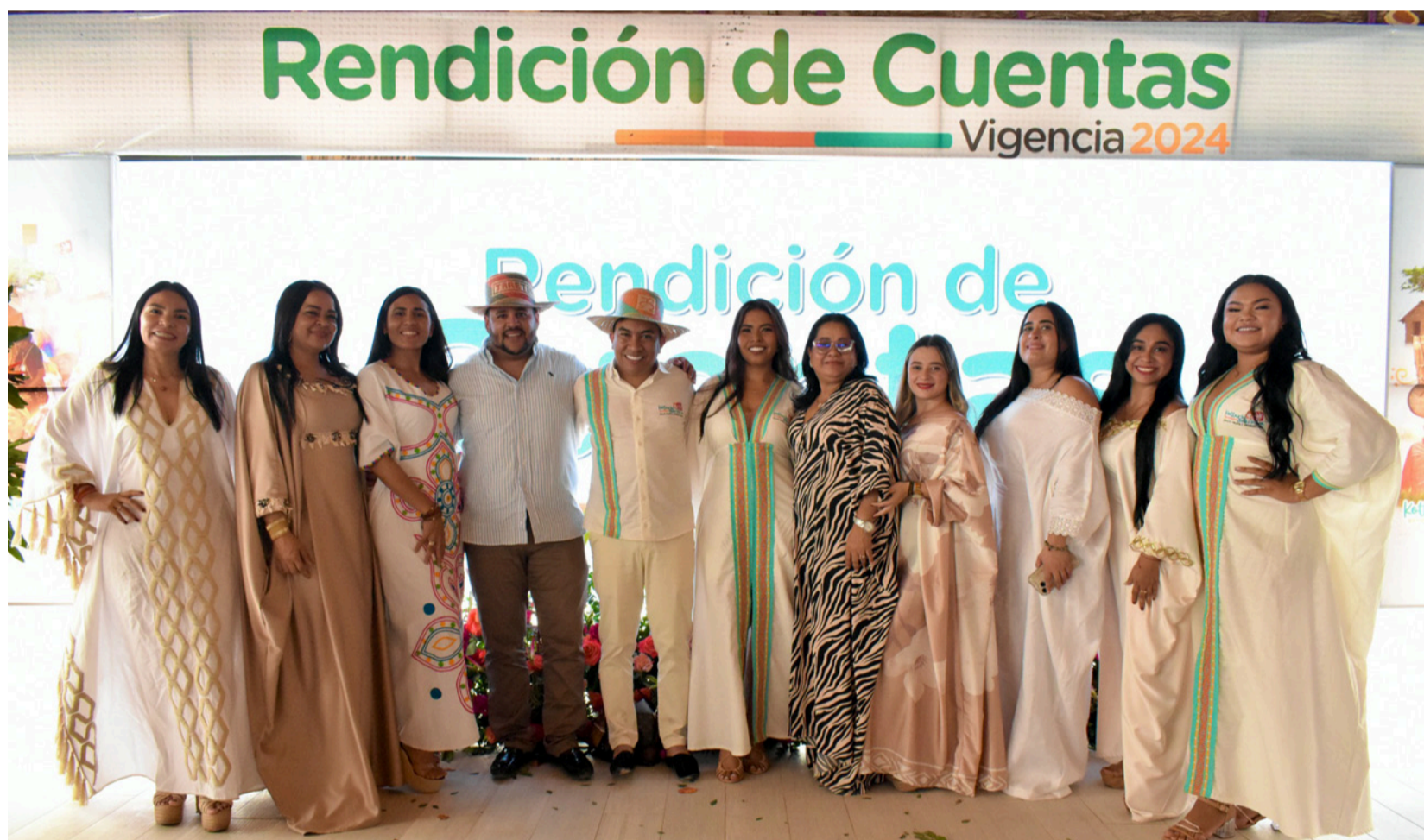
Los coordinadores de la IPS Indígena Kottushi Sao Anaa en todas las sedes.

Con más de 862 mil atenciones en salud, cero muertes maternas y un crecimiento sin precedentes, la IPS Indígena reafirma su compromiso con la vida y las comunidades wayuú.