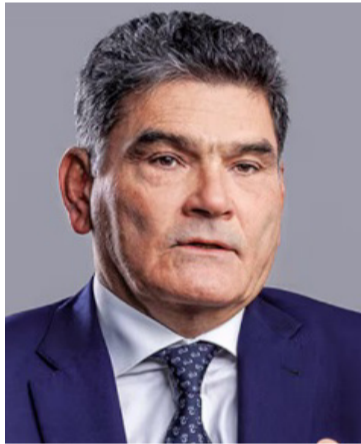
Gregorio Eljach Pacheco, procurador General.

En el anterior contexto, dentro de sus ejes de acción se encuentra el fortalecimiento de la gobernanza territorial, que busca impulsar alternativas estratégicas desde un enfoque misional y preventivo, orientadas a optimizar la gestión de las autoridades nacionales y locales. En este caso particular, dicho enfoque se dirige a garantizar la eficiente prestación de los servicios