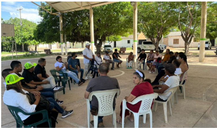
Los habitantes también manifestaron su inconformidad por el retraso en la asignación del operador.