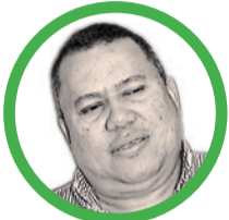
Por Luis Eduardo Acosta Medina