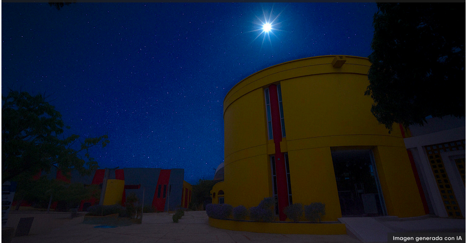
Imagen generada con IA