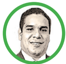
Por Roger Mario Romero Pinto