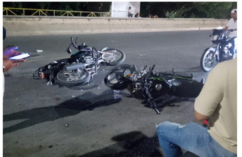
El percance se presentó en la Circunvalar frente al monumento La Araña en la salida hacia Maicao.

Las autoridades competentes hacen un llamado a los conductores para que cumplan las normas de tránsito y no conduzcan bajo los efectos del alcohol con el fin de evitar situaciones que pongan en riesgo sus vidas.