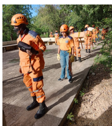
Se adelantó la preparación de voluntarios.

La Defensa Civil Colombiana seccional adelantó en el municipio de Barrancas la preparación de sus voluntarios en las diferentes emergencias que se puedan llegar a presentar y en este caso frente a los incendios forestales que se registran a lo largo del Departamento, en especial en los municipios del sur de La Guajira.