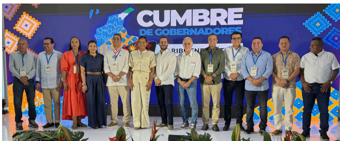
Los gobernadores a través de la Federación de Departamentos llegaron a La Guajira y analizaron en conjunto la problemática de sus regiones.