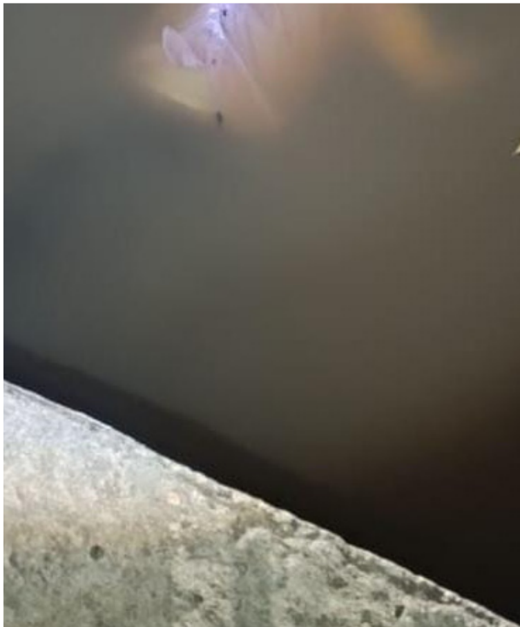
Las autoridades informaron que las víctimas fallecieron, al parecer por inmersión, al caer en un jagüey.

Las autoridades hacen un llamado a los usuarios viales para que cumplan las normas de tránsito y eviten situaciones que pongan en riesgo sus vidas y las de sus acompañantes.