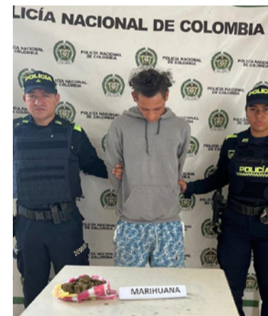
A este persona se le halló un paquete de marihuana.

Tras la incautación del material, se le leyeron los derechos como persona