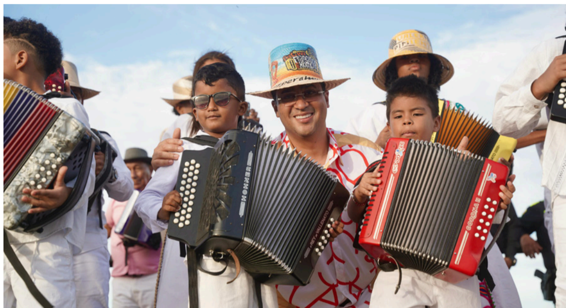
El gobernador dijo que se sacarán esas obras que la comunidad está exigiendo.

colocará la primera piedra del nuevo malecón de Riohacha, una obra con-