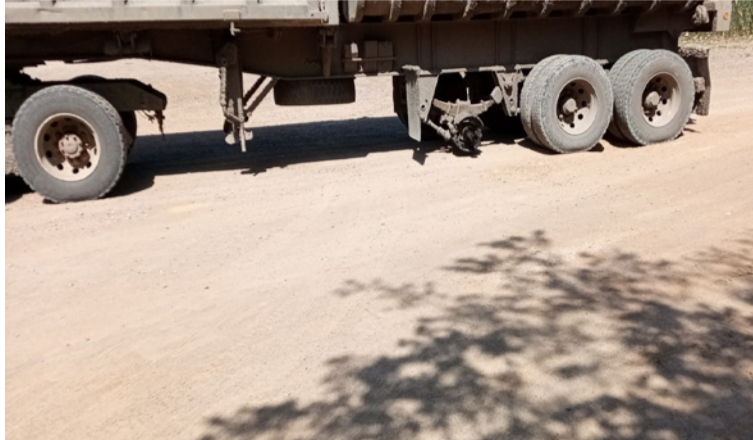
Las autoridades investigan las causas del desprendimiento de las llantas de la tractomula.