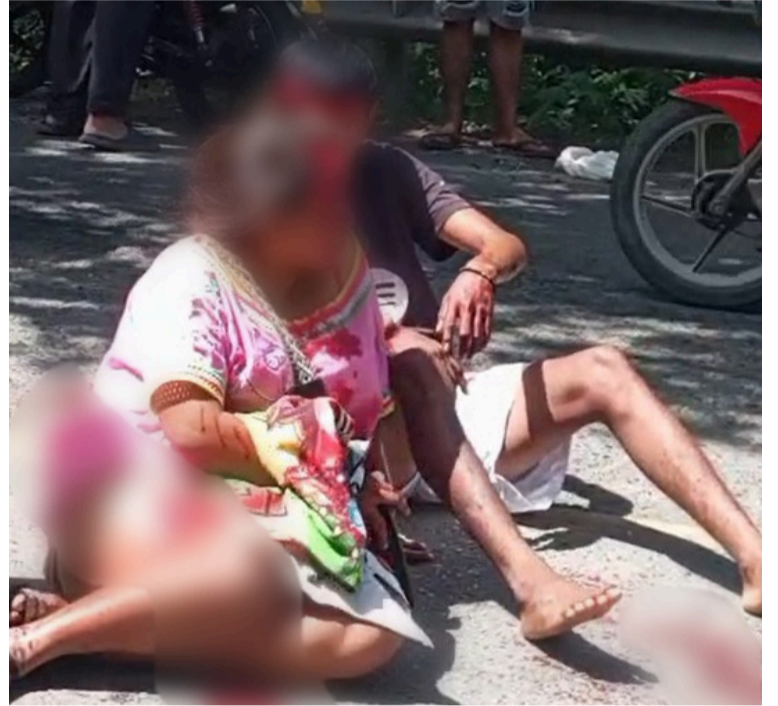
Las víctimas, pertenecientes al pueblo indígena wayuú, sufrieron heridas de consideración.

Las autoridades investigan las causas del desprendimiento de las llan-