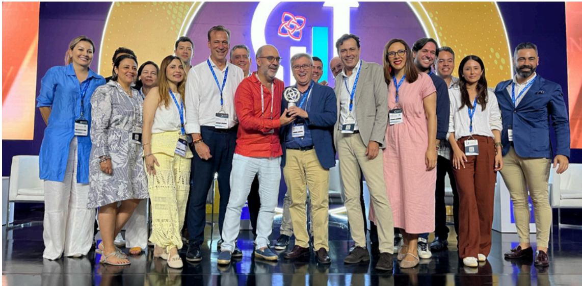
Con este premio, Aqualia consolida su liderazgo en el sector de servicios públicos, apostando por una transformación desde el talento humano.