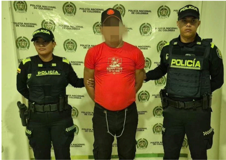
Esta persona fue trasladada a la Estación de Policía para luego dejarla a disposición de la Fiscalía URI en San Juan.

La acción operativa tuvo lugar en la calle 14 con carrera 1 del barrio Pompilio, donde unidades del Modelo Nacional de Vigilancia Comunitaria por Cuadrantes adelantaban actividades de patrulla-