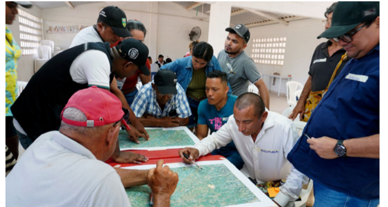
El proyecto busca conservar, recuperar y gestionar el recurso hídrico, para bienestar comunitario y agropecuario.

En este proyecto se verán beneficiadas las comunidades campesinas y étnicas de los municipios de Santa Marta, Ciénaga, Aracataca, Fundación, en el Magdalena; Dibulla, Fonseca y San Juan del Cesar, en el departamento de La Guajira, así como, La Paz, Manaure Balcón del Cesar, San Diego, Pueblo Bello, Agustín Codazzi, Berceril, La Laguna de Ibirico y