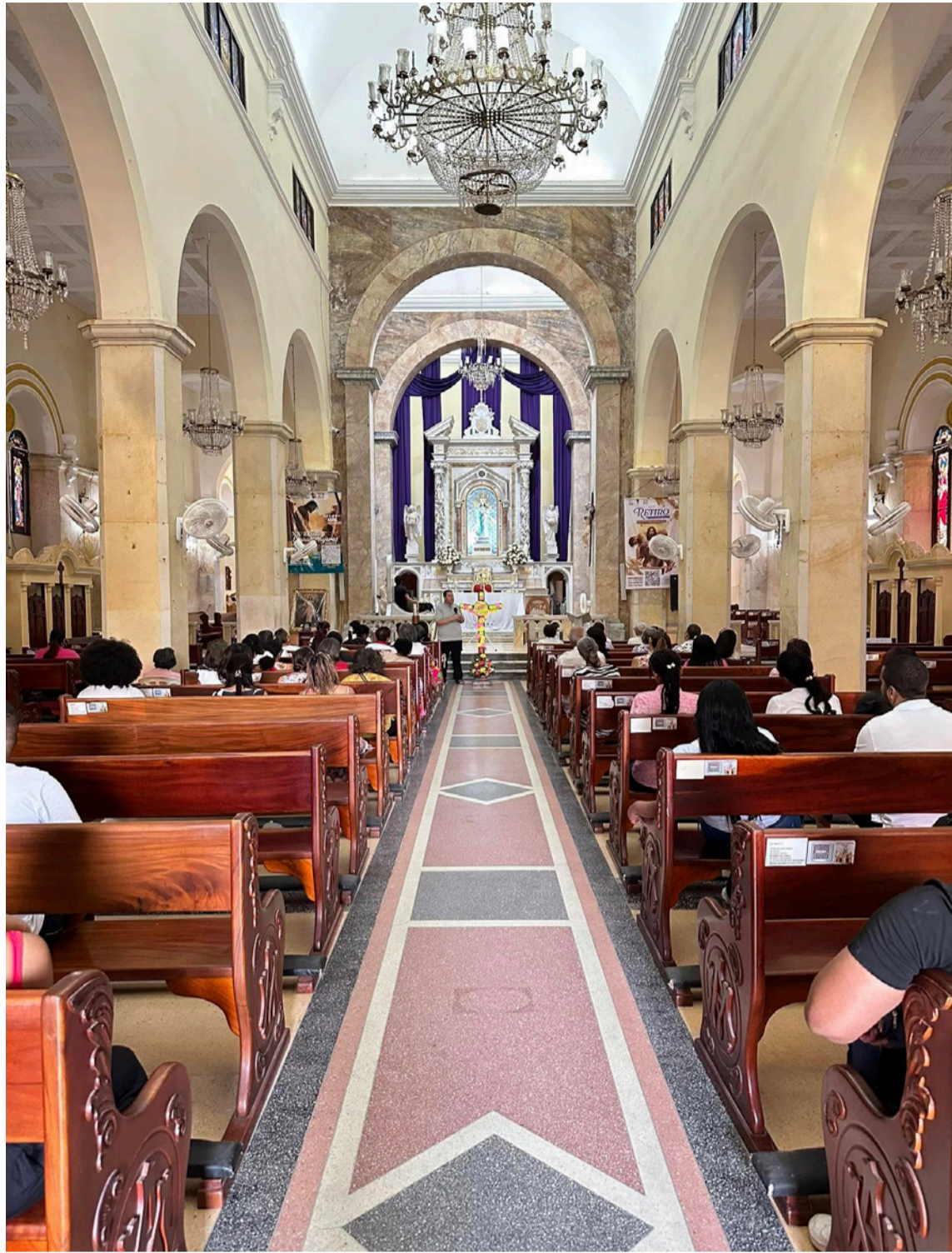
En la catedral se realizará hoy la eucaristía por los sesenta años de La Guajira.

En este sentido, el plan se estructura en líneas estratégicas que abordan áreas clave para el desarrollo de La Guajira: 1. El Desarrollo y la justicia social; 2. La prosperidad económica y la gestión del conocimiento; 3. El territorio sostenible y resiliente; 4. La gobernanza y la convergencia territorial.