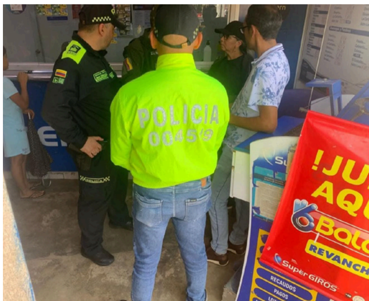
Las autoridades visitaron diversos establecimientos de comercio y recorrieron las principales calles del municipio.

En una decidida articulación entre el Inspector de Policía y unidades de la Policía Nacional, se desarrolló en el municipio de El Molino una significativa jornada de prevención, vigilancia y control, orientada a fortalecer la seguridad ciudadana y la convivencia pacífica en el territorio.