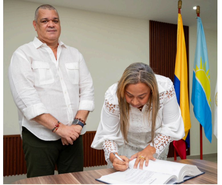
Uniguajira reafirma su visión de promover el talento local y proyectar liderazgos que impulsen la transformación educativa en la región.

Con experiencia laboral en el sector educativo