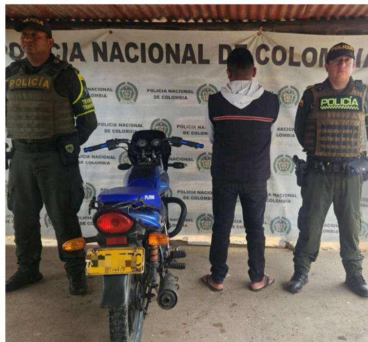
Informó la Policía Nacional que la persona fue capturada en flagrancia por el delito de receptación.

Con este resultado, la Policía Nacional ratifica su compromiso con la seguridad vial y el combate frontal contra el hurto de automotores en el departamento de La Guajira.