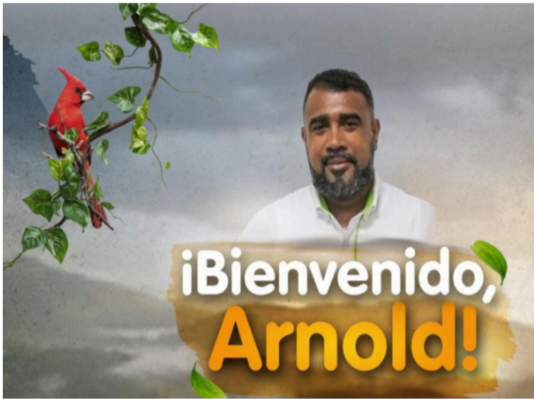
Corpogujira hizo un llamado urgente para que se refuerce la seguridad y protección del personal ambiental.