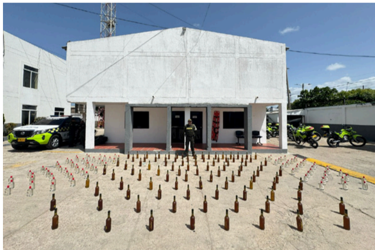
Estas acciones buscan concienciar a comerciantes sobre la importancia de cumplir con la normatividad aduanera.

En el marco de las campañas de sensibilización y control a los establecimientos comerciales, la Policía Fiscal y Aduanera (Polfa), a través de la Policía Judicial y en coordina-