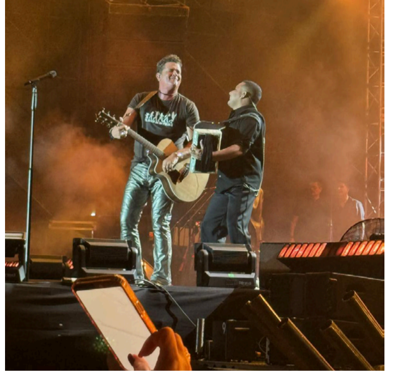
Silvestre Dangond y Carlos Vives le desaron feliz cumpleaños' a La Guajira, cerrando así una noche histórica.