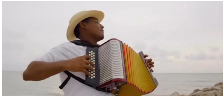
Telecaribe mantuvo una programación especial que celebró las tradiciones, música y folclor del Caribe.

Riohacha recibió y acogió a los talentos de Telecaribe, que llegaron para realizar los programas 'Nuestras Mañanas', 'Entre Mujeres', 'Grandes del Vallenato' y 'Dale Play', los