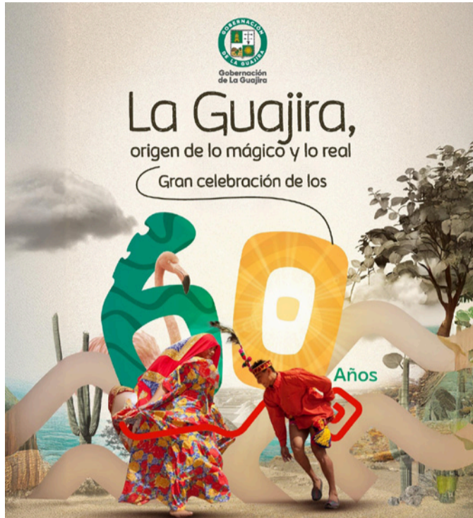
El departamento de La Guajira celebra sus 60 años con una gigante programación cultural, deportiva y recreacional, con la participación de los 15 municipios.

Es un día histórico, evidentemente, el cual desde la Academia de Historia destacamos como fecha de sublimes connotaciones y en mi caso con mayor razón porque la Rama Judicial fue y sigue siendo mi casa. Indudablemente los dos más grandes actos de coraje que Dios le puede deferir a un hombre o a una mujer es Administrar Justicia y ser padre o madre, porque son como un curso intensivo de cómo querer una actividad o a alguien más que a nosotros mismos, nuestras felicitaciones a todos los funcionarios públicos en sus niveles departamental y municipal, a los diputados y concejales, a los magistrados y jueces y funcionarios judiciales en general y a mis colegas conjuces del Tribunal Administrativo de La Guajira. Dios proteja de toda asechanza a La Guajira hermosa, a la que todo mundo dice que la quiere, pero muy pocos la pechichan.