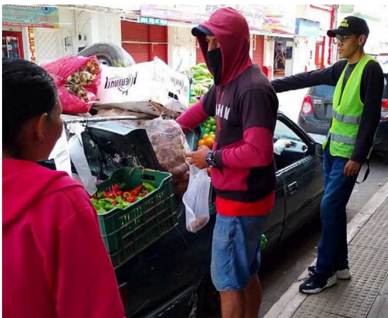
Se trató de una jornada de sensibilización vial en el espacio público, dirigida a transeúntes y actores viales.

DESTACADO Las actividades se concentraron en la vía nacional, así como en la zona céntrica y comercial del municipio de Villanueva, donde se ejecutaron distintas acciones clave.