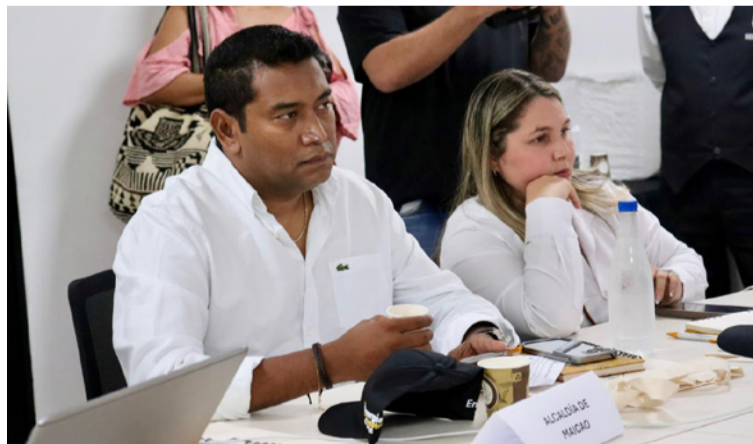
Según dijo el alcalde, Maicao es ruta obligada de la operación minera y, por lo tanto, también sufre afectaciones.

“Es un baldado de agua fría para nuestro municipio. Nos vamos profundamente preocupados porque, a pesar de que el tren minero atraviesa Maicao y genera múltiples impactos en nuestras comunidades, no fuimos tenidos en cuenta. ¿Aca-