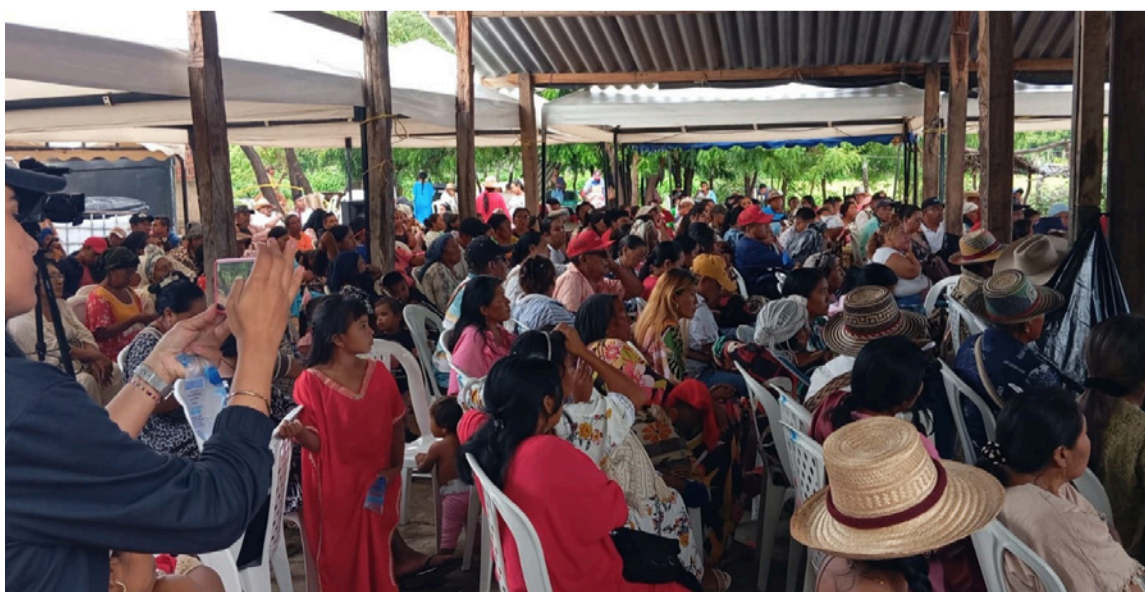
Se busca ejecutar una estrategia de salud comunitaria con enfoque étnico.

permitan un clima de respeto y confianza, en pro de una comunidad horizontal a un mismo nivel por parte de los diferentes actores del proceso de participación.