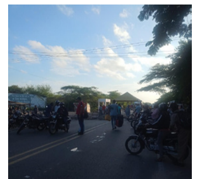
Los docentes exigen el pago de sus servicios.

Los uniformados de la Seccional de Tránsito y Transporte (Setra) se encuentran en la zona del bloqueo para garantizar la seguridad a los usuarios viales que se encuentran a la espera de que se restablezcan la movilidad vehicular.