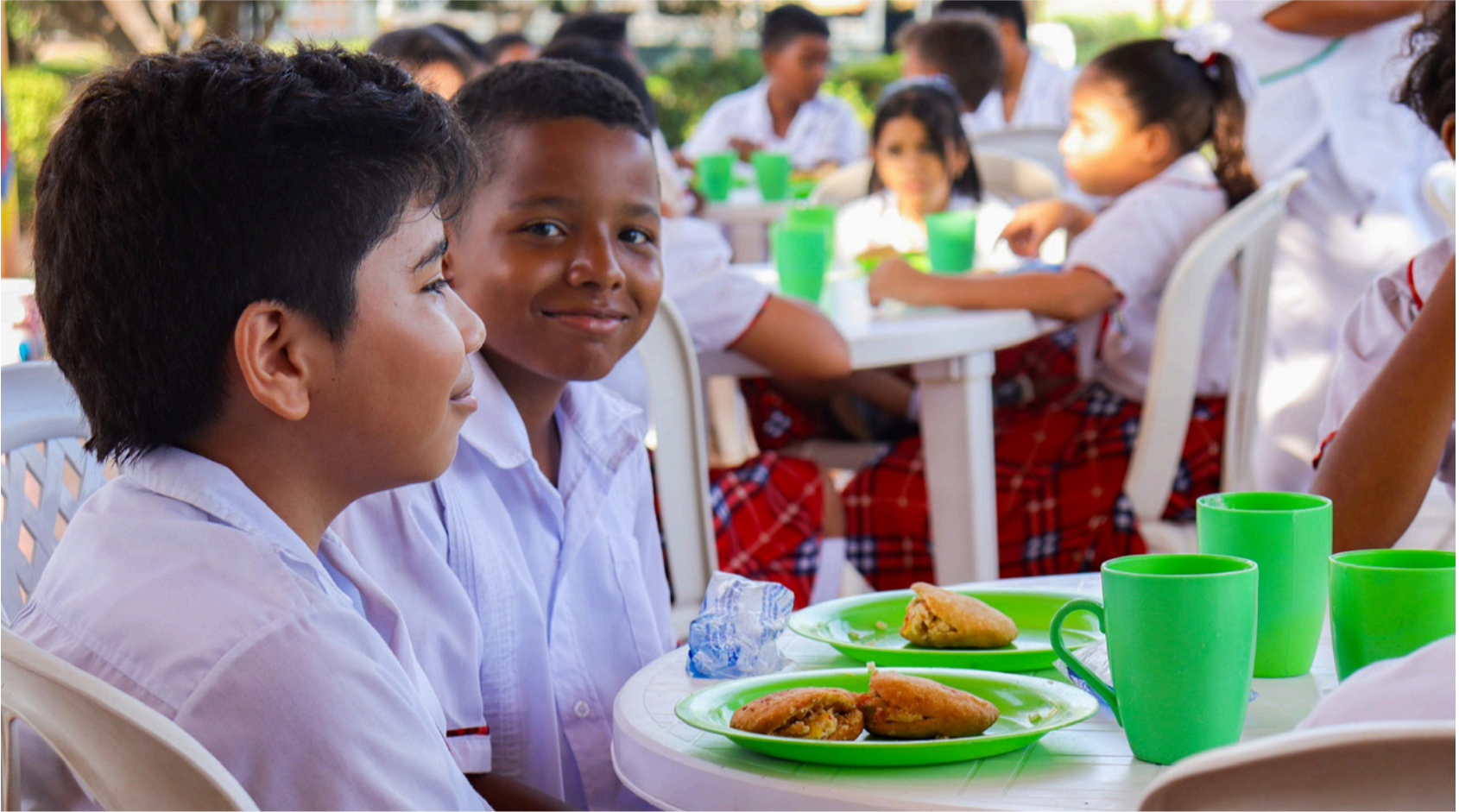
El PAE es hoy ejemplo de cómo se puede garantizar la nutrición de los estudiantes y ofrecer bienestar en el territorio.