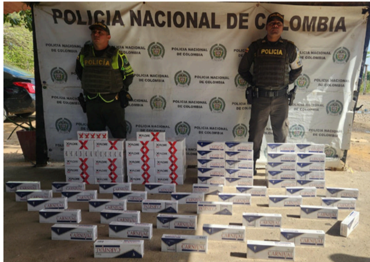
El valor comercial de la mercancía incautada fue estimada por la Policía en cerca de 40 millones de pesos.

El valor comercial estimado de la mercancía incautada asciende a $40.000.000 millones de pesos, representando una afectación significativa al tráfico ilegal de productos de contrabando en esta zona del departamento.