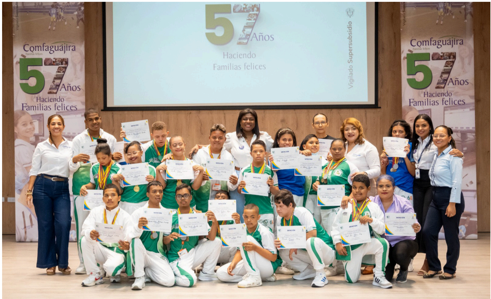
Estos jóvenes representaron con dedicación y talento a La Guajira en las XXV Olimpiadas Fides - 50 años Colombia.

Demostraron esfuerzo, disciplina y pasión