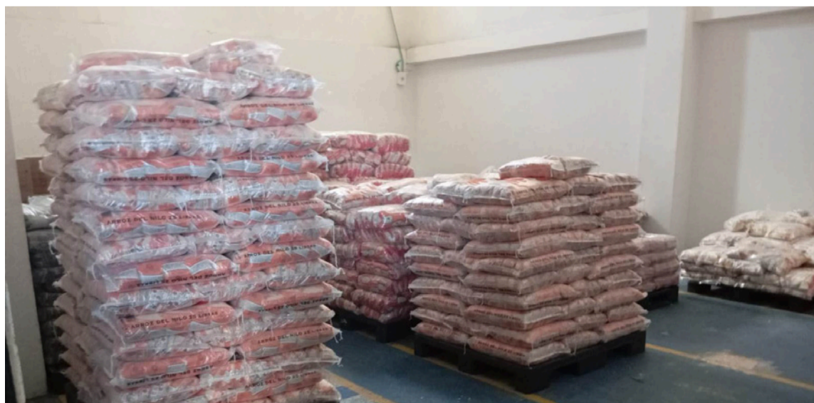
El Banco de Alimentos es un ejemplo de cómo la solidaridad puede hacer la diferencia.

Estoy convencida que la generosidad es el puente que une la abundancia con la necesidad, cada acción, cada donación, es un paso hacia un mundo donde nadie se quede sin comer, actuemos hoy con gestos de humanidad, con sentimiento cultural y de pueblo, mi opinión para ti.