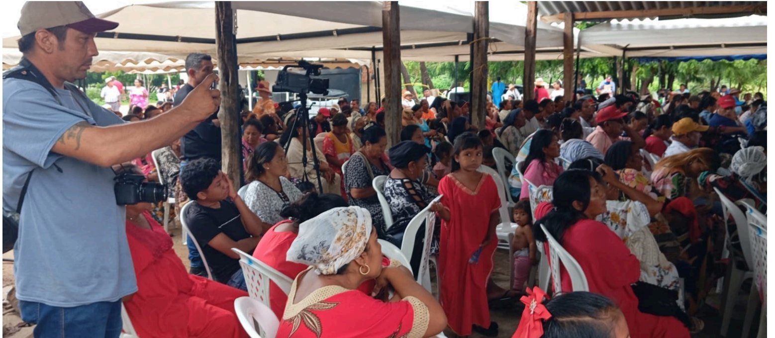
El objeto del convenio es desarrollar de manera exclusiva las acciones tendientes a cumplir la Sentencia T 302 del 2017.

Socialización del plan provisional de acción ordenado a través del auto 696 del 2022 y 1290 del