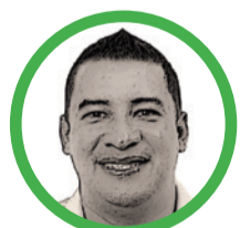
Por Breiner Robledo Meza