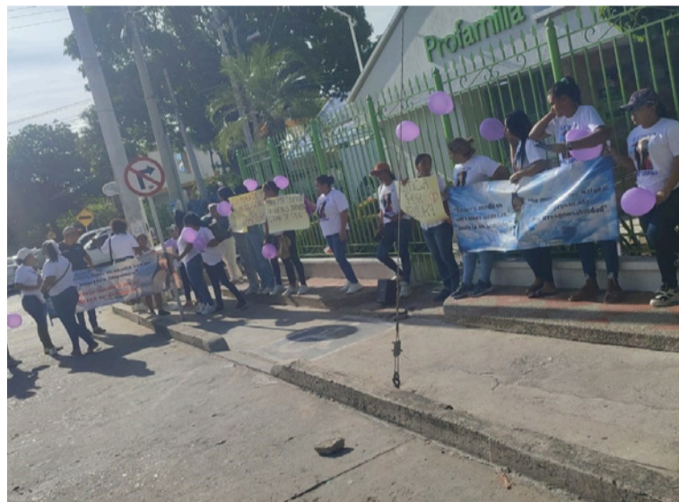
Profamilia está abierta a dialogar con los familiares de la fallecida y juntos buscar un punto de entendimiento.