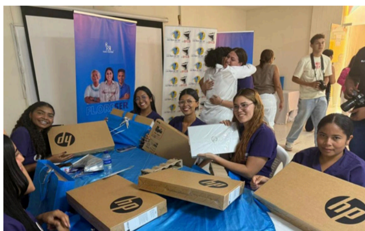
La entrega de 30 computadores y 10 becas para estudiar inglés, simbolizó mucho más que un gesto.

cación científica de 30 jóvenes del programa de Nutrición, conectando el conocimiento académico con los desafíos reales de sus comunidades.