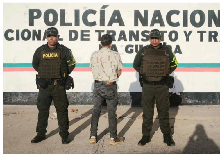
El ciudadano fue capturado por el delito de falsedad para obtener prueba de hecho verdadero.