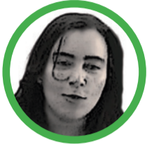
Por Yarlin Carolina Díaz Bonilla