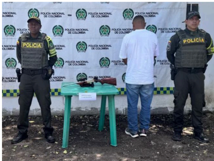
Esta persona fue dejada a disposición de la Fiscalía URI de turno en el municipio de San Juan del Cesar.

Al solicitarle la documentación correspondiente para el porte legal del arma, el ciudadano manifestó no tener ningún tipo de permiso o autorización. Por tal motivo, se procedió a su captura y fue dejado a disposición de la Fiscalía URI de turno en el municipio de San Juan del Cesar.