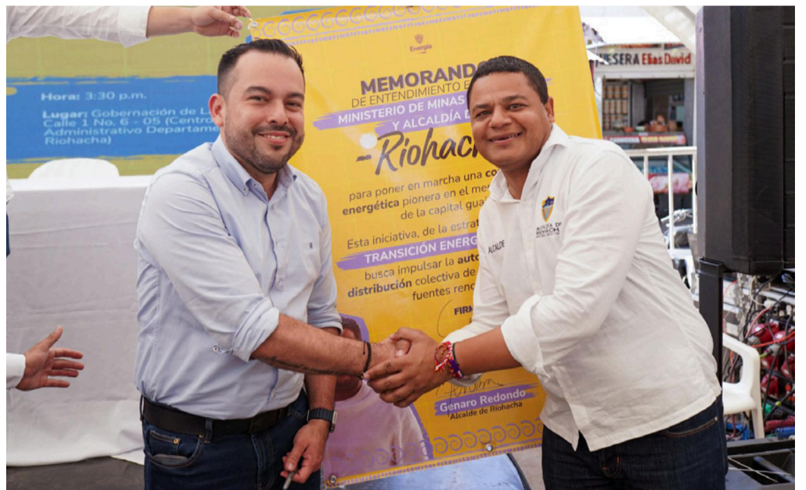
Esto demuestra el compromiso del alcalde con la calidad de vida de los riohacheros.