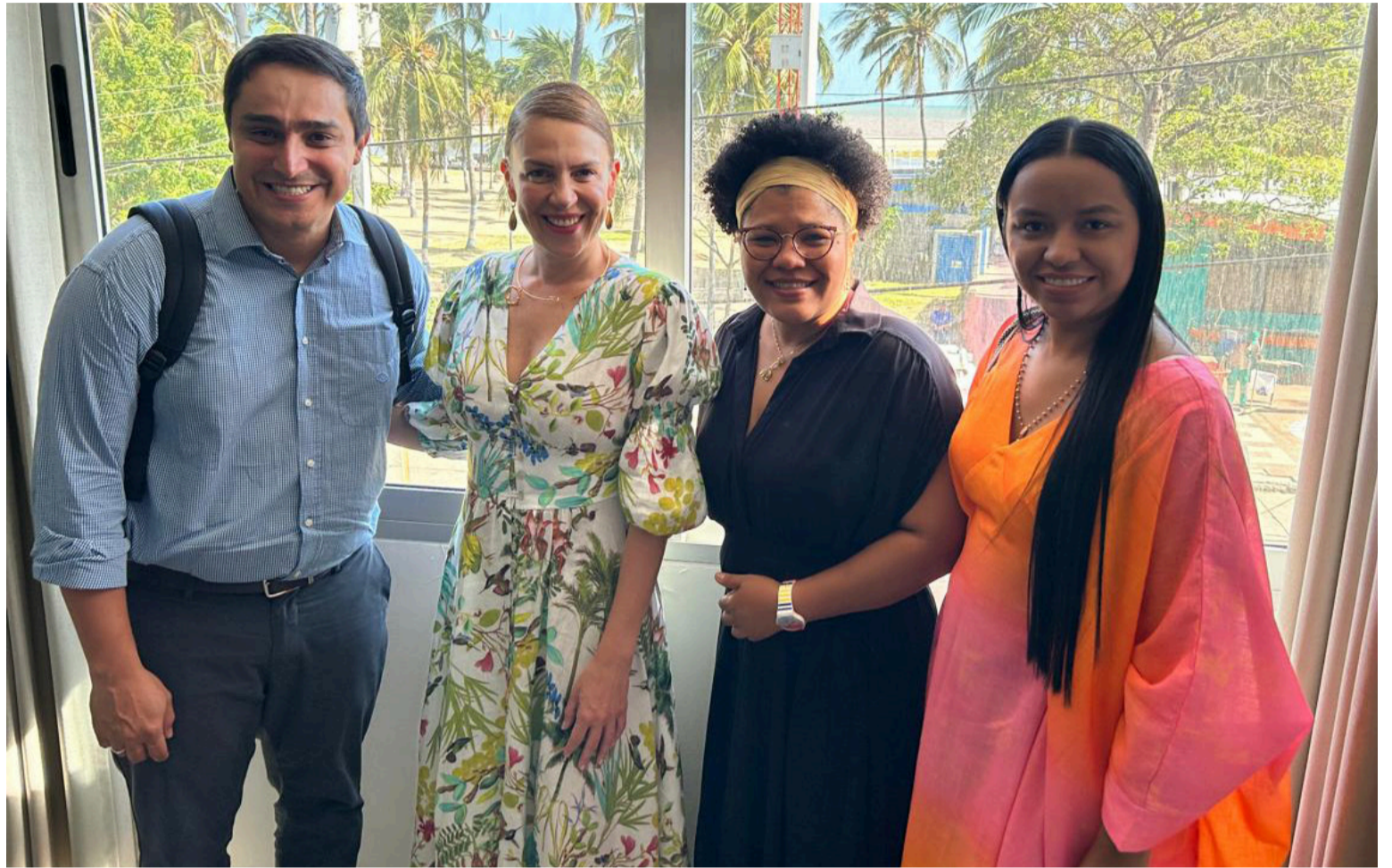
FloreSER es una iniciativa que llega a su tercera versión como parte de nuestra apuesta global por la equidad en salud.

La Jornada FloreSER marcó la clausura del programa 'Elarca: Científicas para la Salud', una iniciativa liderada por la Organización Los hijos del sol en alianza con Novo Nordisk y la Universidad de La Guajira. Este programa formativo, desarrollado mediante metodologías vivenciales y participativas, fortaleció la autoestima, el liderazgo y la vo-