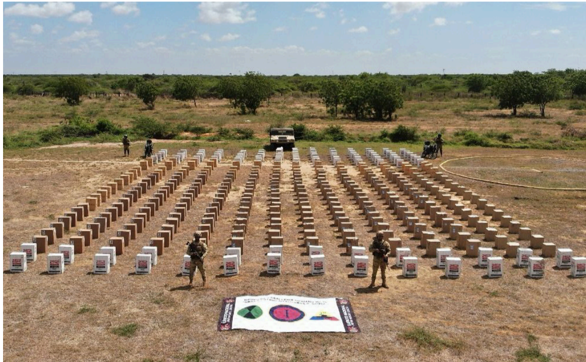
Este contrabando ingresó al país ilegalmente con fines de distribución nacional.

En el marco del Plan de Campaña Ayacucho Plus y como parte de las acciones permanentes contra las economías ilícitas, tropas del Grupo de Caballería Mediano N° 10 General Gustavo Matamoros D'Costa, adscritas a la Décima Brigada, lograron en las últimas horas un importante resultado operacional en el municipio de Maicao.