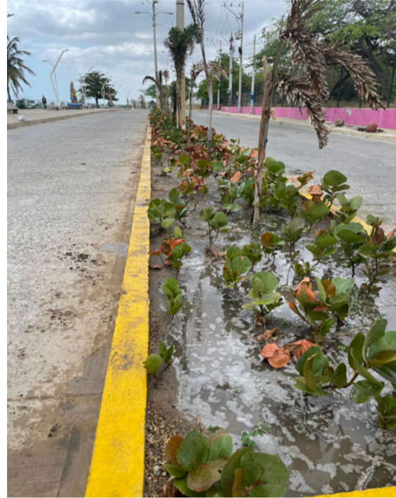
Corpoguajira implementa el cuidado de la flora en la Avenida Primera en Riohacha.

formales e informales, así como a transeúntes y turistas que frecuentan esta zona de la ciudad.