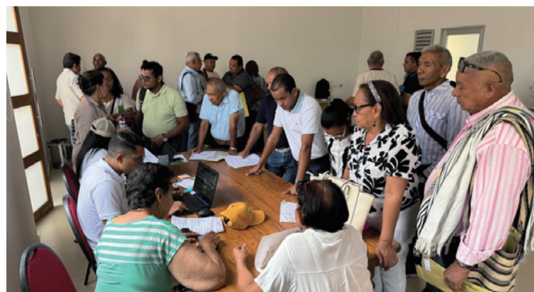
La ANT adelantará ahora las debidas validaciones en materia tanto jurídica como técnica y agronómica.