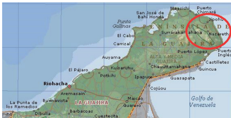
Se generó un debate por la propuesta de crear un nuevo municipio en La Guajira escindiéndolo de Uribia.