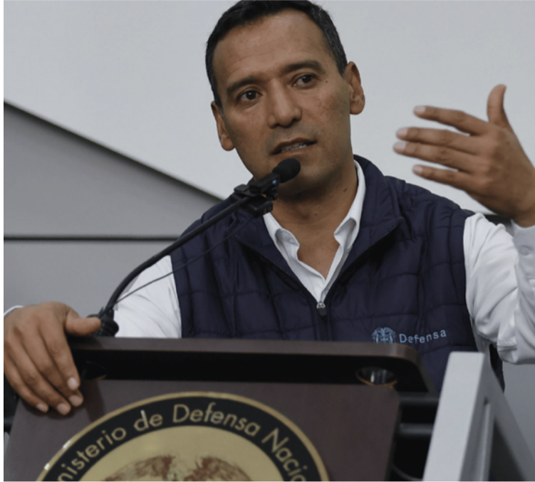
Sánchez explicó que el Gobierno ha abierto canales de diálogo sin restringir la acción de la Fuerza Pública.

En declaraciones a W Radio, aseguró que "jamás el Gobierno ha organizado a las disidencias", y advirtió que si eso hubiera ocurrido sería un acto delictivo, destacando que el Gobierno ha abierto canales de diálogo sin restringir la acción de la Fuerza Pública.