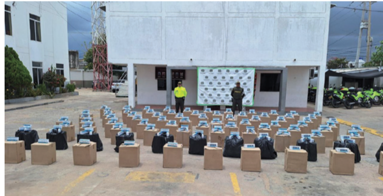
Los importantes operativos de la Polfa, permitieron asestar un nuevo golpe a las economías ilícitas.

En el primero de los procedimientos, y mediante orden de allanamiento y registro en zona rural del municipio de Maicao, liderado por personal adscrito a la Unidad Básica de Investigación Criminal de la Polfa de Riohacha, se logró la incautación de 72.500 cajetillas de cigarrillos de procedencia extranjera,