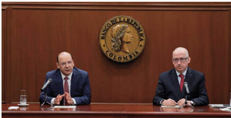
El Emisor señaló que la nueva reducción mantiene una postura cautelosa de la política monetaria.

En un comunicado, al cierre de la junta de este 30 de abril de 2025, el Banco de la República