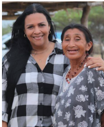
Desde el 7 de mayo se pagará a los beneficiarios.