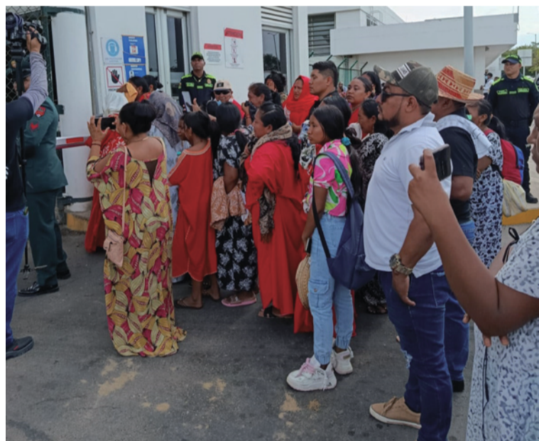
Sus familiares, conmovidos por la llegada de los cuerpos sin vida de los jóvenes wayuú, se desgarraron en llanto.

Una de las situaciones preocupantes de todo este conflicto armado, es el alto número de jóvenes soldados guajiros que han fallecido en estos hechos, y hasta el momento no hay respuesta de encarcelar a los culpables de arrebatarle la vida a estos uniformados que buscaban un mejor futuro para sus vidas y las de sus familiares que hoy los lloran, sin tener un culpable físico a quién denunciar.