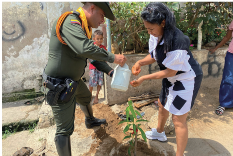
La siembra de árboles además de embellecer, tiene importantes beneficios para la comunidad y el medio ambiente.

Esta iniciativa busca aumentar la cobertura de árboles en la ciudad y también sensibilizar a la comunidad sobre la importancia de cuidar y conservar los recursos naturales para un futuro sostenible.