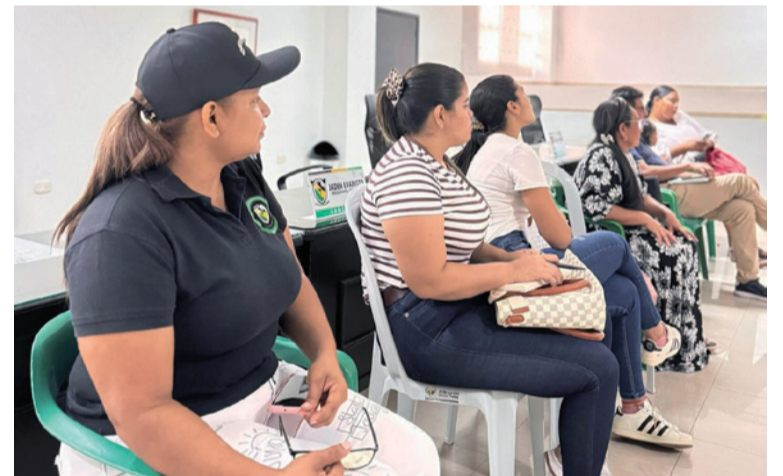
Esta socialización de ruta busca capacitar a los educadores para abordar y prevenir la violencia de género.

Los capacitadores indicaron que se espera que los centros educativos implementen acciones preventivas y de apoyo para abordar la violencia de género y crear un entorno escolar más seguro, la charla contribuirá a proteger los