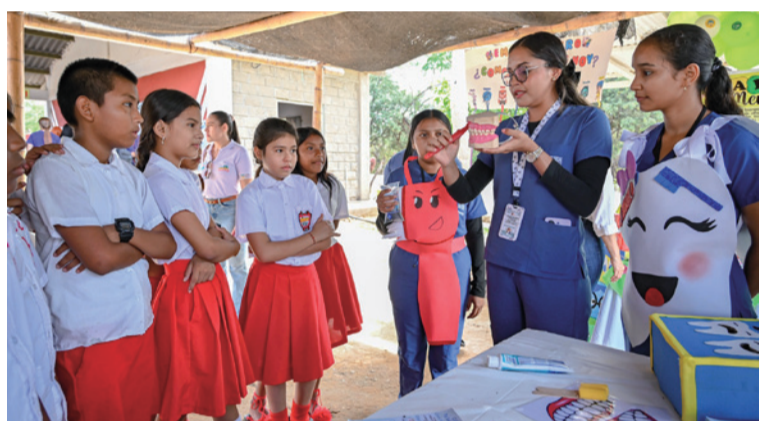
La Uniguajira continúa impulsando acciones que contribuyen al bienestar integral de las comunidades.

A través de estas iniciativas, la Universidad de La Guajira continúa impulsando acciones que contribuyen al bienestar integral de las comunidades, promoviendo estilos de vida saludables y el autocuidado en la comunidad educativa.