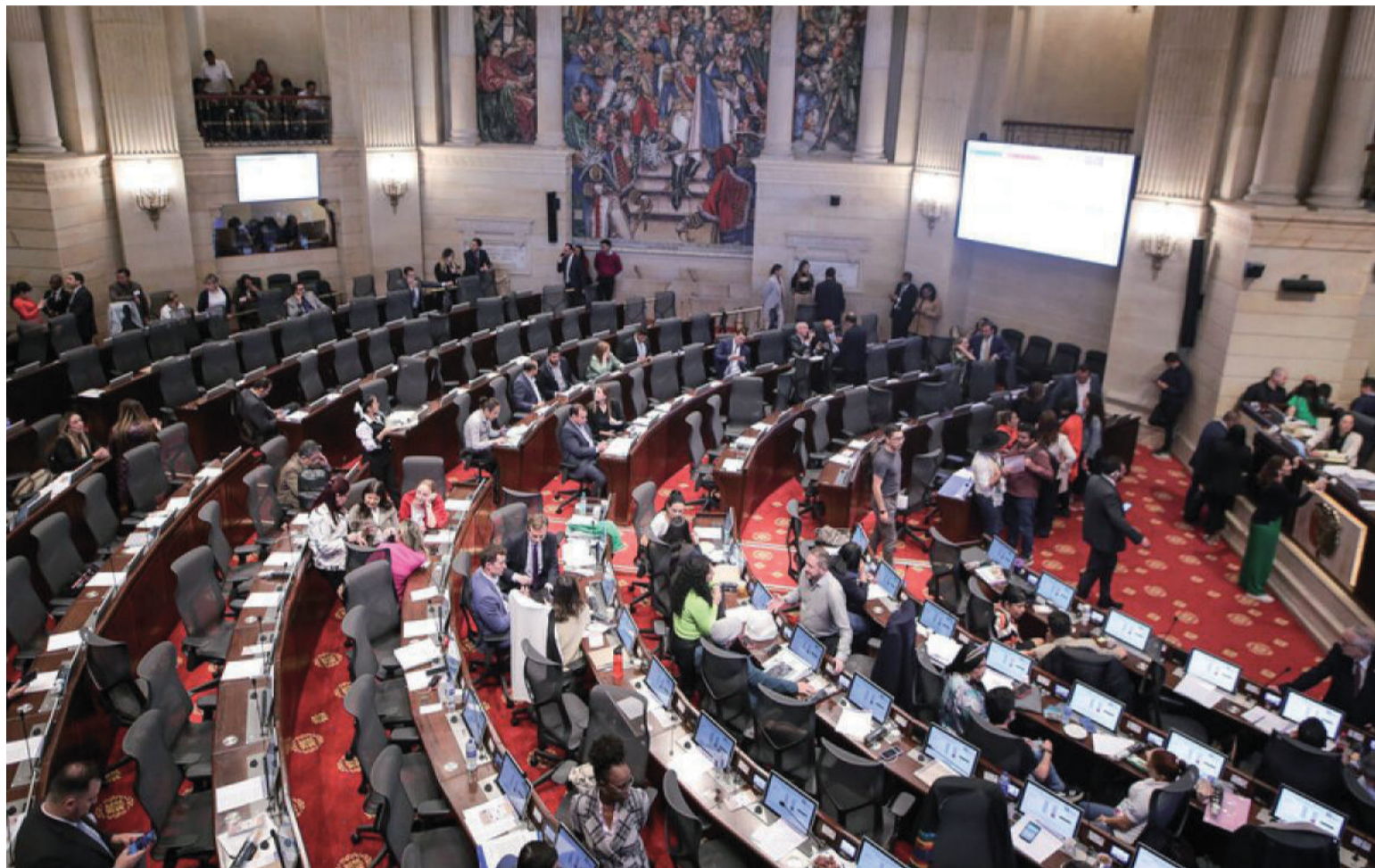
Es exclusivo del Congreso de la República la definición de límites territoriales de Distritos y municipios.

Aterrizando el presente análisis, el artículo 311 CP reconoce al municipio como la entidad fundamental de la división político-administrativa del Estado. Partiendo de la importancia dada por el propio constituyente a esta entidad territorial, se ocupó el legislador de prever los requisitos para su creación y el procedimien-