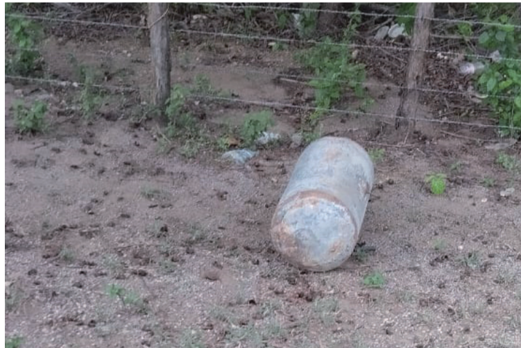
La policía descartó la presencia de algún artefacto explosivo que pusiera en riesgo a la población civil.

Es de recordar que, en horas de la mañana del miércoles, se dio a conocer de la presencia de un cilindro en esta vía, por lo que la comunidad dio aviso de manera oportuna a las autoridades. El hecho quedó evidenciado en un video aficionado de una