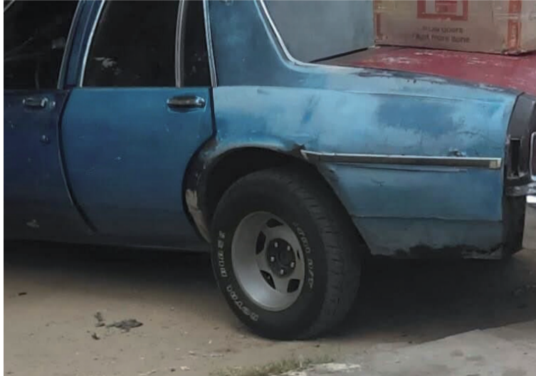
El conductor del vehículo que recibió la herida de bala se encuentra bajo pronóstico reservado.

De manera inmediata fue llevado hasta la urgencia de la Clínica Maicao,