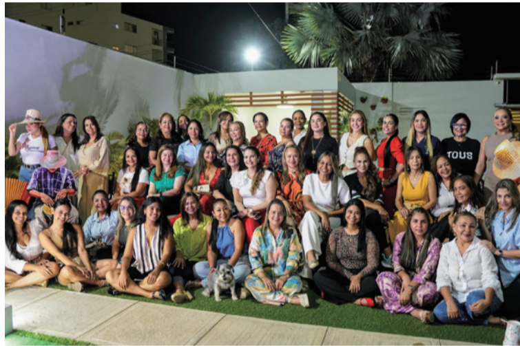
La música vallenata será el alma de esta fiesta que se proyecta como una de las más memorables.

Durante la asamblea, se resaltó la prioridad de preparar a la ciudad para reci-