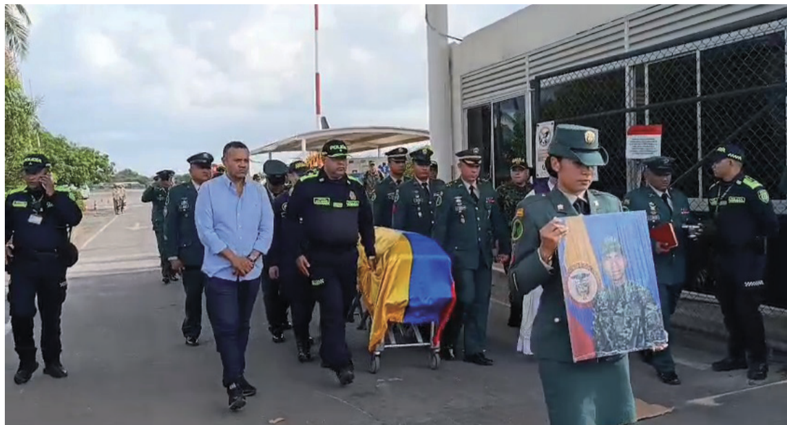
Las autoridades recibieron los féretros donde reposaban los cuerpos de los soldados.