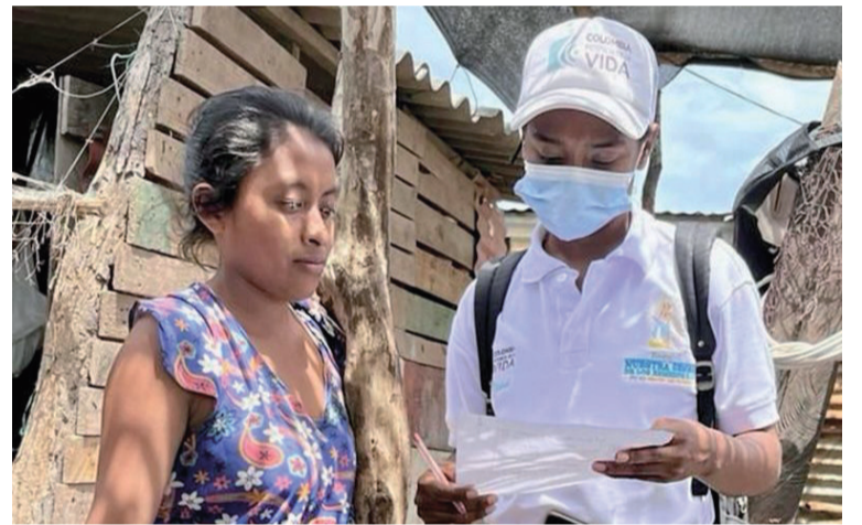
Las actividades fueron posibles gracias a los acuerdos logrados con los líderes comunitarios, ediles y edilesas.

"Nos sentimos complacidos por los resultados de este primer proceso en el que la suma de esfuerzos hizo posible cada lo-