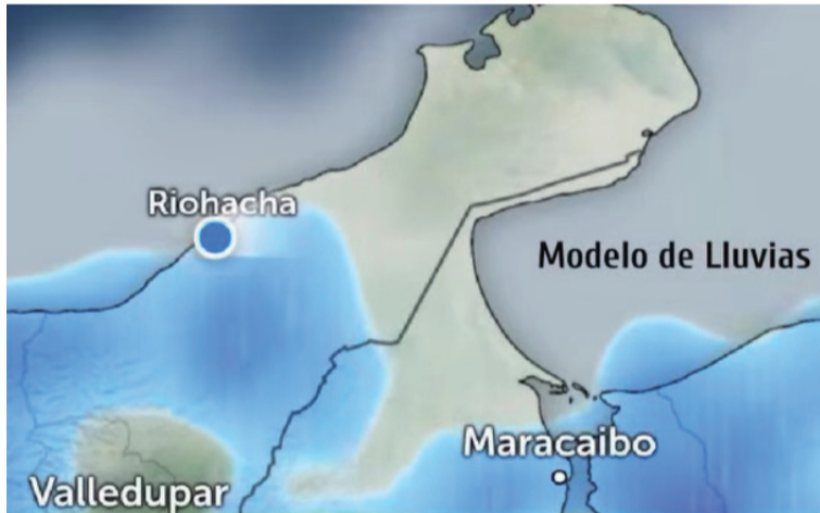
Se prevén lluvias en el sur, la Sierra Nevada, la Serranía del Perijá, la zona media (Riohacha) y el norte.

El departamento de La Guajira enfrenta un patrón de inestabilidad atmosférica desde ayer miércoles 30 de abril, que se extenderá de manera progresiva durante las próximas 72 horas (jueves, viernes y sábado).