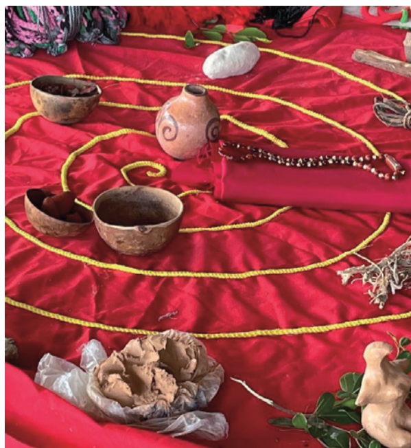
Demostración de las medicinas tradicionales wayuú y algunos elementos de la cultura.

Actualmente Ompiwa está involucrando a las mujeres tejedoras en el uso de las Tecnologías de la información y la comunicación (TIC), para que puedan estar conectadas a través de la tecnología, logren promocionar su trabajo a través de las redes, y sobre todo, para que puedan estar atentas y participar en convocatorias de formación e invitaciones a ferias de artes y artesanías. Así como también la Organización de Mujeres Indígenas del Pueblo Wayuú está ayudando a las mujeres a participar en diferentes convocatorias.