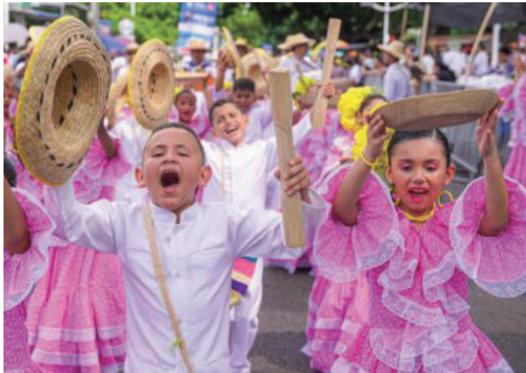
El desfile se convirtió nuevamente en un homenaje al folclor vallenato y en una expresión de amor por las raíces.