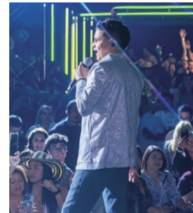
Jorge Celedón, artista vallenato.

Jorge Celedón, el ídolo mundial del vallenato, tendrá esa presentación exclusiva en el Rumbódromo, donde interpretará su excelente catálogo