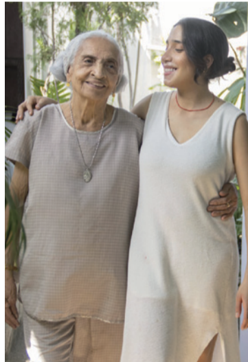
‘Donde florece el amor’, una canción homenaje a nuestras abuelas que entregan vida de su vida a la nuestra.

sencillo con impacto universal. Su más reciente sencillo se llama ‘Donde florece el amor’, es una propuesta que mezcla el género musical de la samba argentina, pop alternativo y sonidos del patio de su abuela, el lugar y la persona en quien se inspiró. Ella refiere que, comenzó a escribirla sin buscar nada inicialmente solo soltar el sentimiento de extrañarla que empezó a hacerse muy presente. Tenía tiempo sin ver a mi abuela, por estar en ciudades diferentes. Era como una sensación que insistía en salir, en hacerse voz y así, este gran trabajo lo pueden conseguir y deleitar en las diferentes plataformas musicales.