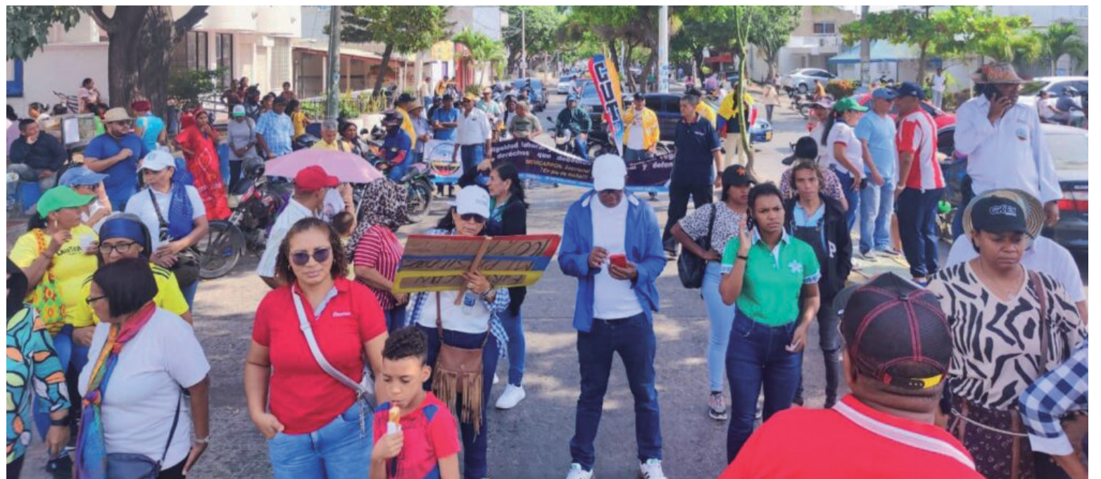
En Riohacha los marchantes se concentrarán en el parque Simón Bolívar y recorrerán hasta llegar a la plaza Padilla.