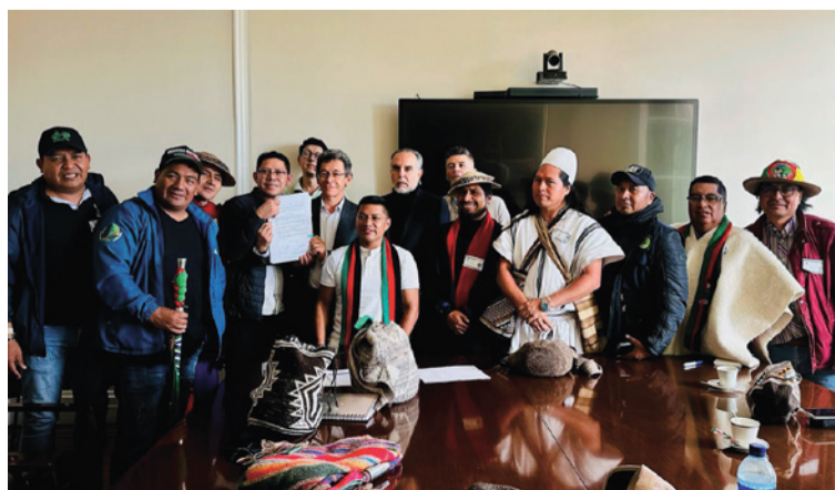
El Decreto 480 de 2025, implementa el Sistema Indígena de Salud propia e intercultural de los pueblos indígenas.

2025, que implementa el Sistema Indígena de Salud propia e intercultural de los pueblos indígenas, se establece en uno de sus artículos que las instituciones propias de salud indígenas debidamente reconocidas o autorizadas por el onsejo o estructuras de Gobierno propio del territorio indígena, podrán adecuarse, transitar o incorporarse en aplicación de los principios de progresividad y voluntariedad y en ejercicio de su autonomía al Sispi.