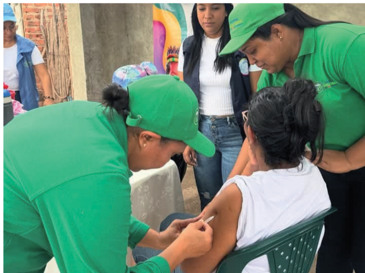
Se priorizó la aplicación de biológicos esenciales, con énfasis en la prevención de enfermedades.

El personal de salud desempeñó un papel fundamental en el despliegue de las actividades, apoyado por una intensa campaña de difusión a través de medios locales y redes sociales, lo que permitió sensibilizar a la población sobre la importancia de la vacunación como herramienta para el cuidado de la