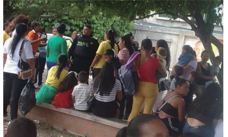
La menor tuvo que ser intervenida quirúrgicamente para la extracción de la bala.

En ese centro asistencial la menor fue evaluada por los médicos que determinaron que se trataba de una herida causada por un arma de fuego, pero que el proyectil no tenía salida, por lo que tuvo que