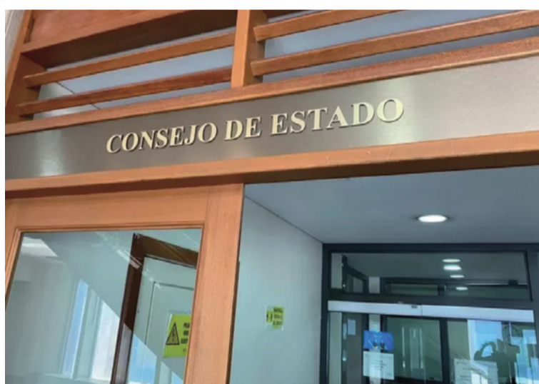
La Asamblea es el órgano competente para analizar, debatir y decidir sobre la creación de municipios.