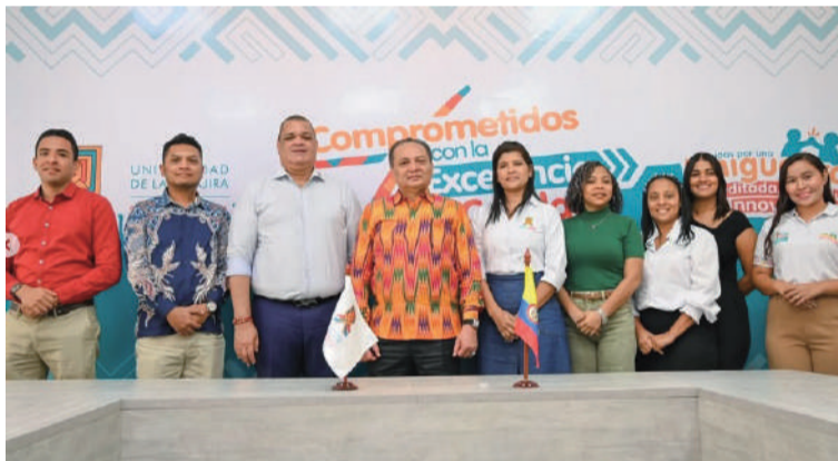
El diplomático compartió con estudiantes una visión sobre el crecimiento económico de Indonesia.

el diplomático compartió con estudiantes de Negocios Internacionales y Administración Turística y