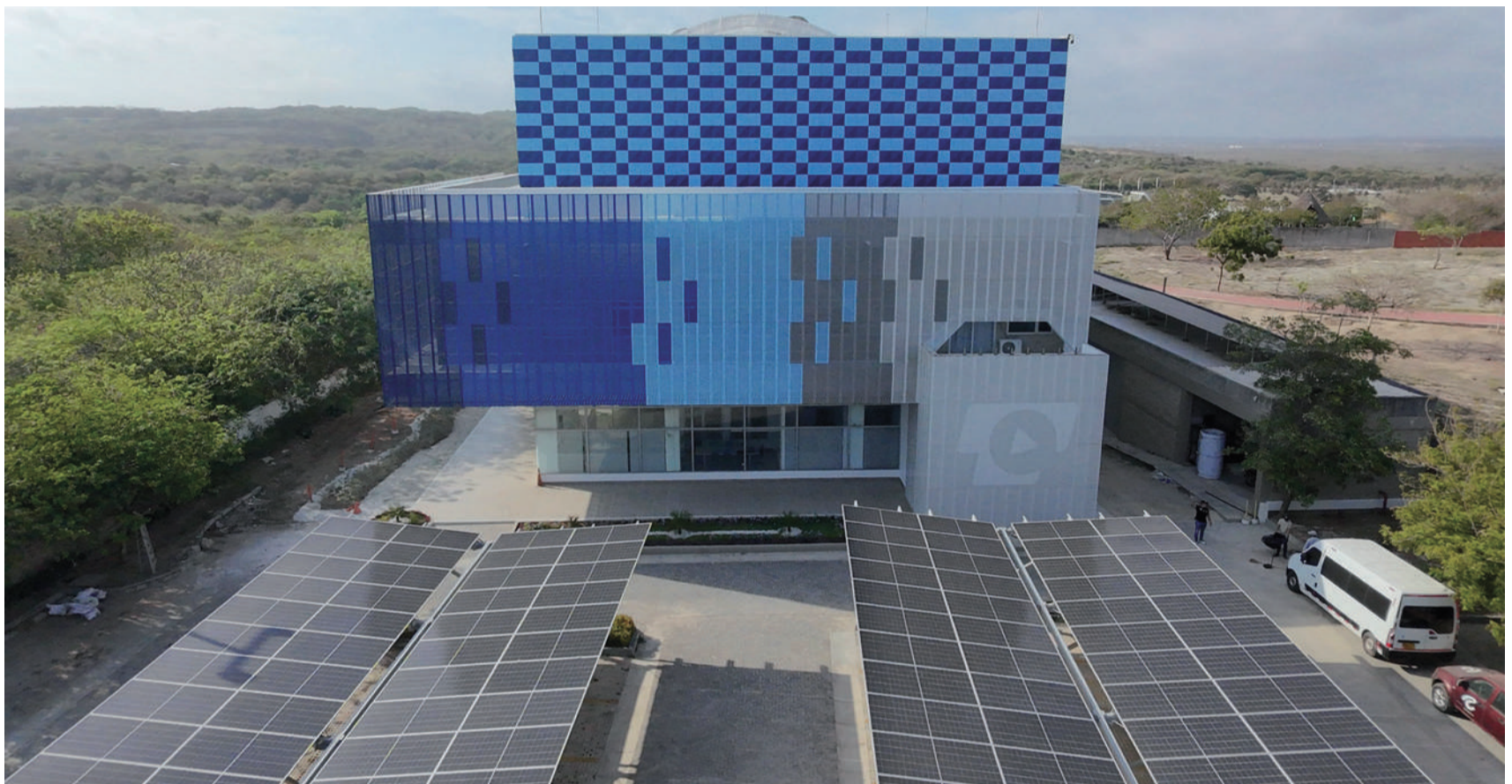
Telecaribe renovó su infraestructura física, dando paso a una arquitectura moderna, funcional y segura.

Finalmente, ayer el Ministerio de Relaciones ratificó que el Fmmd se hará en Riohacha. ¡Se ratificó! Bueno, ahora hay que ponerse las 'botas' para trabajar fuerte. Unir a todos los guajiros para demostrar que ¡sí podemos con el reto! Ayer en Bogotá se realizó la primera reunión. Ahora vienen las mesas técnicas para organizar el evento global. La primera semana de mayo llegarán las avanzadas. ¿Quién dijo miedo?