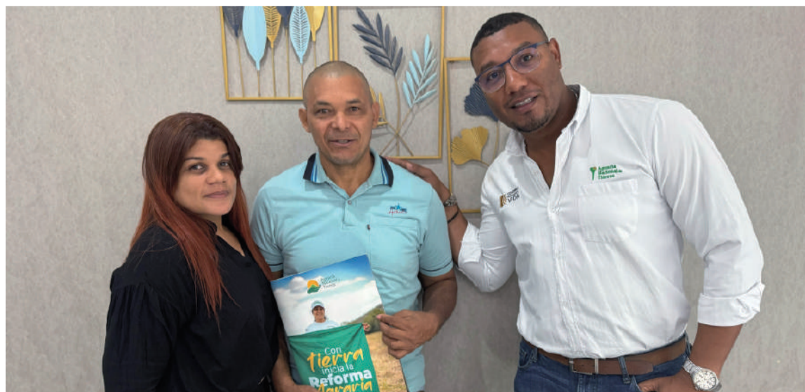
La notificación demuestra el compromiso de la institución con las comunidades rurales.

Finalmente, la ANT reafirma su compromiso con la Reforma Agraria y con el objetivo de promover la justicia social y la igualdad en el acceso a la tierra en la región. Esta notificación es un paso importante en este proceso y demuestra el compromiso de la institución con las comunidades rurales del departamento y su desarrollo.