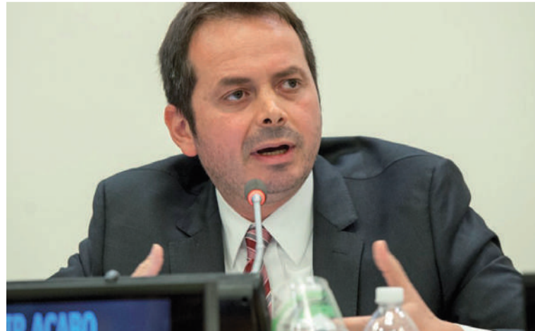
Carlos Ruiz Massieu, reconoció los esfuerzos del Gobierno colombiano en la ejecución del Acuerdo.

Aunque estas políticas han tenido un inicio tardío, el Gobierno ha manifestado su determinación para fortalecer la seguridad en áreas vulnerables mediante las disposiciones de seguridad inclui-