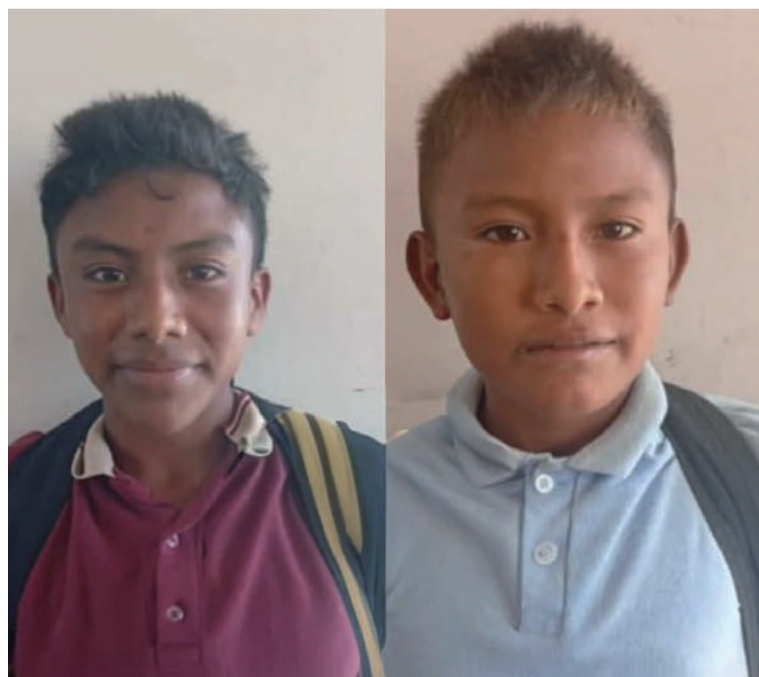
Familiares de los niños agradecieron a quienes aportaron en sus redes sociales para encontrarlos.

Luego de que en la mañana del jueves 24 de abril se diera a conocer sobre la desaparición de dos menores de edad que salieron de su comunidad Manashtu rumbo a su institución educativa en Sillamana el día miércoles, sus familiares, que no sabían nada de su paradero, hicieron públicas sus fotografías y pidieron ayuda para encontrarlos sanos y salvos.