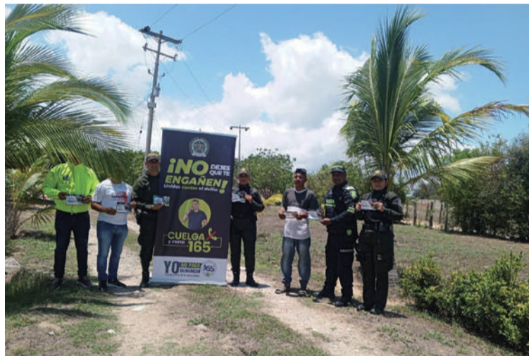
El objetivo es fortalecer la cultura de la denuncia, y fomentar el trabajo articulado con las autoridades.

Durante la actividad, se socializaron estrategias para prevenir el secuestro y la extorsión, delitos que afectan la tranquilidad y el desarrollo económico de quienes trabajan la tierra. A través de charlas pedagógicas, entrega de material informativo y un espacio de diálogo abierto, los asistentes pu-