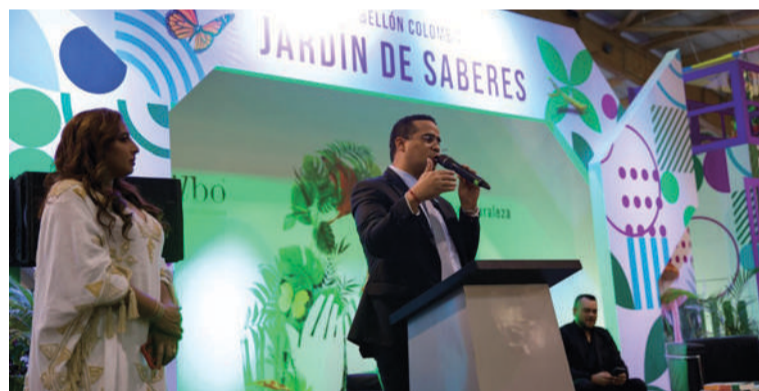
Los visitantes podrán disfrutar desde hoy viernes, de una muestra permanente de las tradiciones locales.

Con 63 estímulos para producción de contenidos