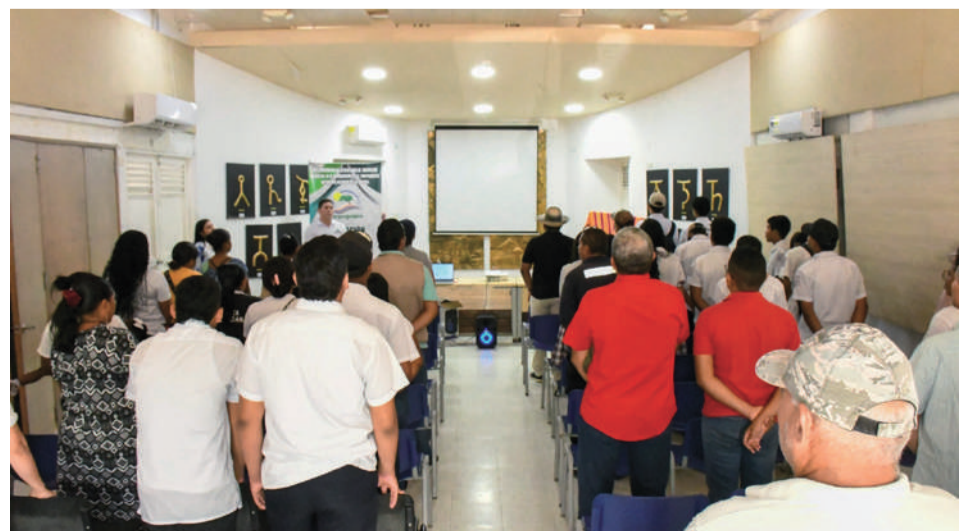
El objetivo de estas capacitaciones en los municipios del departamento, es promover una mayor conciencia ambiental entre los asistentes.