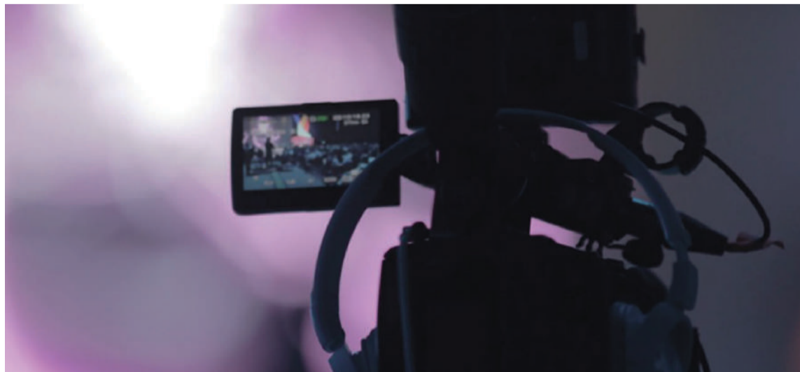
'Abre Cámara' cuenta con seis categorías dirigidas a fortalecer los contenidos públicos.

DESTACADO La convocatoria entregará recursos por $14.000 millones, que contemplan un aumento del 5% en el valor unitario de los estímulos, ajustado a la inflación del 2025.