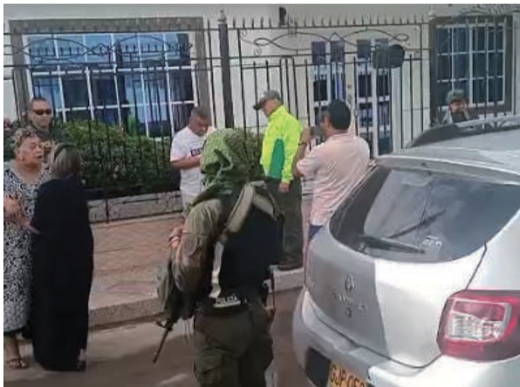
La DEA y la Dijin han ejecutado 7 capturas, pero no se conocen los detalles de los delitos imputados.

Asimismo, se estableció que desde el inicio de esta semana el grupo de inves-