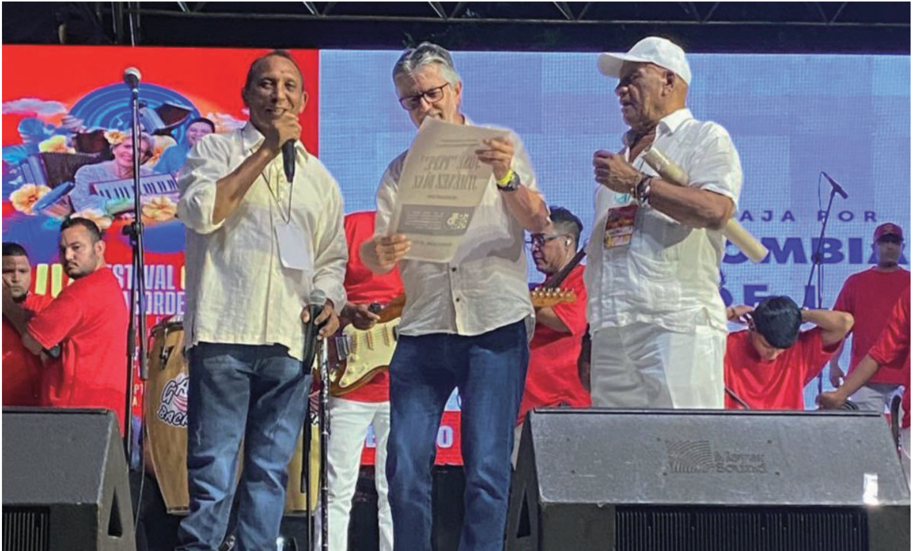
La promoción cultural en Villanueva, en particular este año, ha estado como el Caballero de la triste figura; colmada de ilusiones.