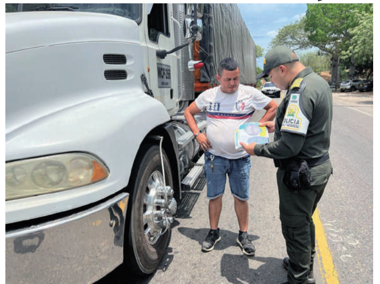
En la jornada se socializaron recomendaciones clave para la adquisición responsable y legal de autopartes.

Con este tipo de iniciativas, se reafirma el compromiso institucional con la legalidad, la seguridad ciudadana y el desarrollo del Departamento.