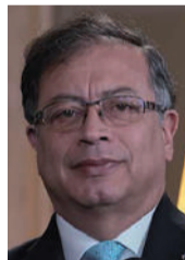
Gustavo Petro Urrego, presidente de la República de Colombia.

2. Suspender también los términos de prescripción del proceso administrativo que adelanta el CNE.