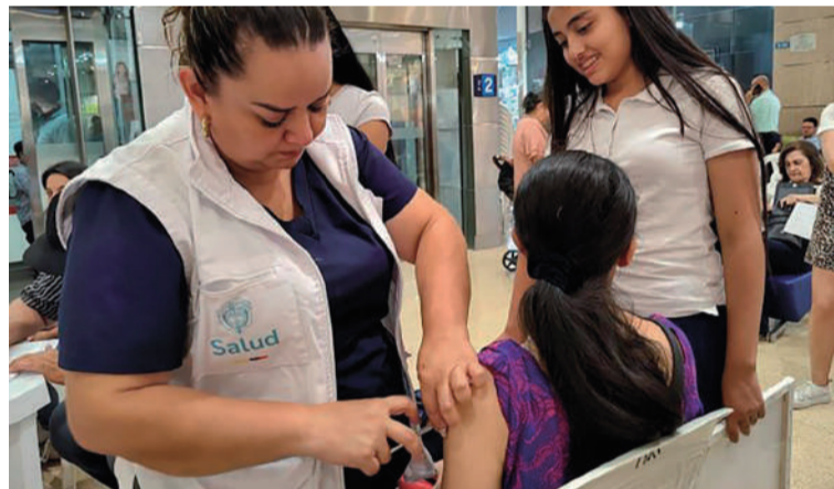
El ministerio avanza en la articulación de una estrategia para la cobertura de vacunación en zonas priorizadas.

Así lo confirmó el ministro Daniel Rojas, quien explicó que ya se intensificaron las acciones con actores del sector educativo en todos los niveles y añadió que “esa es una articulación que estamos haciendo desde el día de ayer y en días pasados estábamos hablando, pero hoy estamos ya concretando cómo llegar, de manera inmediata, también con