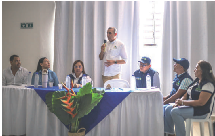
En la reunión participaron Corpoguajira, las alcaldías de Urumita, Villanueva, El Molino, San Juan y La Jagua.

mental para reafirmar el compromiso institucional de Corpoguajira con la gestión integral del recurso hídrico, a través de una planificación participativa que incorpore las necesidades de las comunidades y el enfoque ecosistémico.