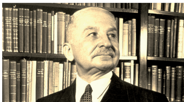
Ludwig Heinrich Edler von Mises, precursor de la escuela austriaca de economía en el siglo XX.

Y pensar, que a los jóvenes economistas los lanzan al mundo ocupacional en medio de la ignorancia del mercado laboral para ellos. Pero el grueso no sabe que un viejo colega les ha martirizado, les ha cortado las alas, les ha castrado la posibilidad de desenvolverse en un trabajo digno, al punto de llevarlos a oficios totalmente ajenos a su profesión; me refiero al maestro de maestros del neoliberalismo, don, Ludwig Heinrich Edler von Mises, del cual la mayoría de los profesores, encamisados, repetían los mismos postulados; economista del siglo XX, encarnizado contra el socialismo y la planificación centralizada. Enemigo acérrimo del Estado como coordinador del desarrollo económico bajo la dirección del proletariado.