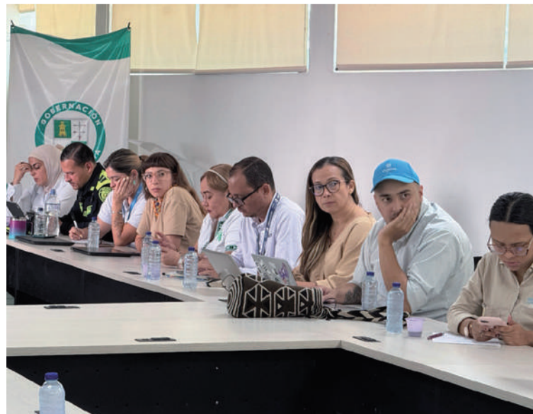
Las instituciones integrantes de la mesa se comprometieron también en la preparación del Foro Global.

Este último, aportará el documento sobre población migrante, como insumo clave para la caracterización.