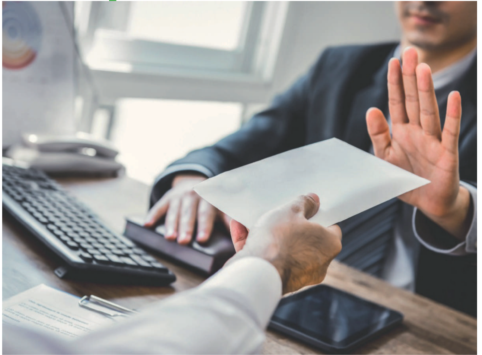
La función pública no solo exige preparación y conocimiento, sino una ética inquebrantable.

La función pública no solo exige preparación y conocimiento, sino una ética inquebrantable. El dinero del erario no es un botín para repartir entre amigos y familiares, sino un recurso sagrado destinado a resolver problemas de la gente como la falta de agua, la desnutrición infantil, el desempleo crónico, y la pobreza extrema. Pero en La Guajira esos recursos se desvanecen en contratos amañados, obras inconclusas y proyectos fantasmas que solo existen en el papel. Y mientras esto sucede, la gente sigue viendo cómo desfilan sus gobernantes con un cinismo vergonzoso, exhibiendo riquezas