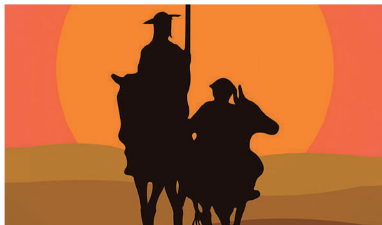
El problema de la cultura, que también lo tuvo don Quijote, son los medios deficientes con que cuenta.

No existe un buen presupuesto para la Casa de la Cultura de Villanueva allí se trabaja con las uñas- ¿Cuánto es el presupuesto de la cultura