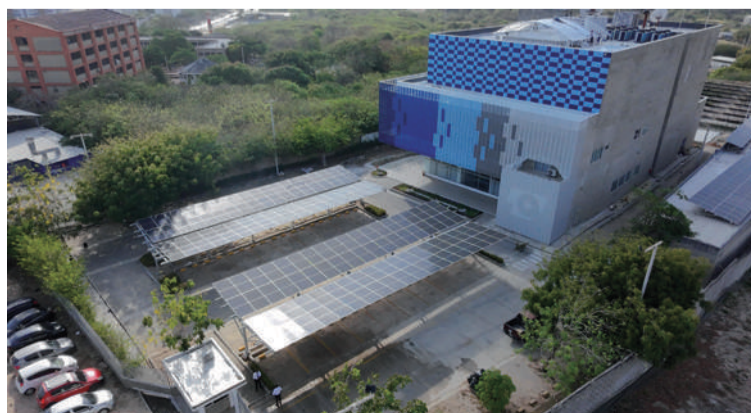
Se puso en marcha un sistema de paneles solares el cual tuvo una inversión cercana a los 4.000 millones de pesos.

a una arquitectura moderna, funcional y segura. Con este dinero también se logró hacer un mantenimiento general de la edificación, restaurar el sistema de climatización; y adecuar las salas de edición y postproducción de contenidos.