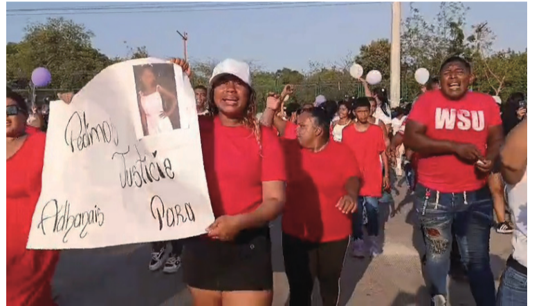
Con pancartas y arengas, familiares, amigos y comunidad exigen a las autoridades justicia.

"Vamos a estar muy cerca como Administración y