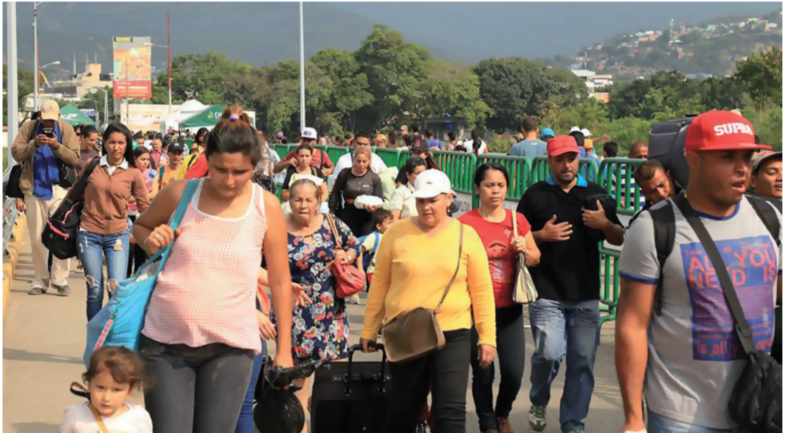
El Foro representa una oportunidad sin precedentes para proyectar a Riohacha como un territorio de dignidad.