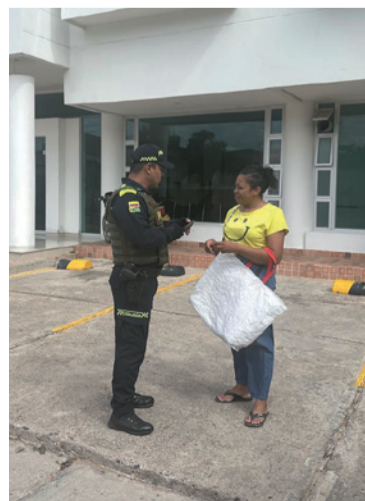
Estas jornadas lideradas por la Policía incluyen acciones pedagógicas y preventivas.