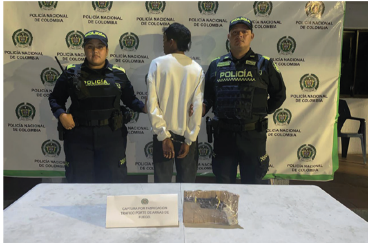
Los uniformados encontraron en poder de esta persona un arma de fuego tipo artesanal sin documentos.

La Policía Nacional reafirma su compromiso