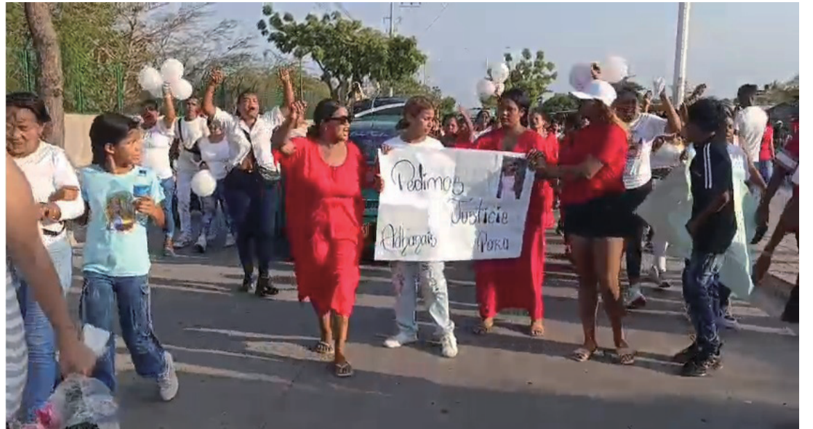
La ciudadanía en general pide que se castigue ejemplarmente al señalado autor.

Resolución numero 1039 del 27 de noviembre 2024