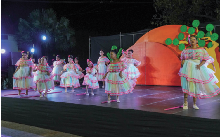
El proyecto 'Sueños de Ranchería', busca resaltar lo mejor del teatro, la música, la danza y la oralidad.

La iniciativa comenzó en el Distrito de Riohacha con el proyecto 'Sueños de Ranchería', que busca resaltar lo mejor del teatro, la música, la danza y la oralidad del territorio.