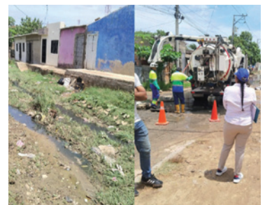
La comunidad clama por una pronta solución.

La comunidad se reunió en el lugar para solicitar a la empresa y a las autoridades municipales que realicen un estudio detallado de la situación, con el fin de obtener un diagnóstico preciso y definir las soluciones apropiadas.