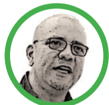
Por Mauricio Molinares Cañavera