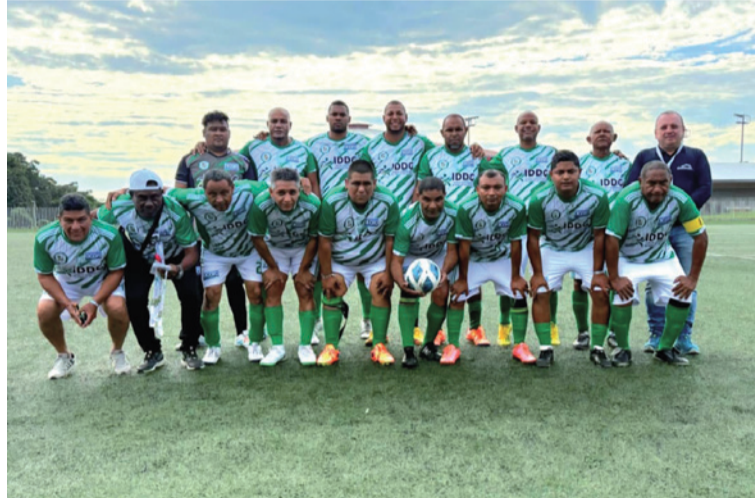
Cinco medallas se lograron en el marco de los XVIII Juegos Nacionales para Periodistas, realizados en Ibagué.

La delegación de La Guajira, recibió un reconocimiento por ser la primera vez que gana el trofeo en deportes de conjunto, fútbol, y dos medallas de oro en atletismo.