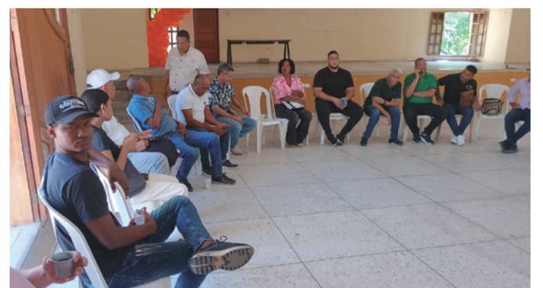
El tema central de la reunión fue el diagnóstico de la situación actual de las ONG ambientales en La Guajira.

Los asistentes discutieron estrategias para desarrollar acciones efectivas de gestión ambiental, con el objetivo de fortalecer el trabajo conjunto en pro de la conservación y protección del entorno natural de la región.