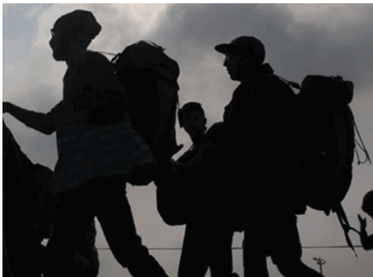
La comunidad wayuú, sujeto central de la Sentencia T-302, debe tener una participación activa en este Foro.