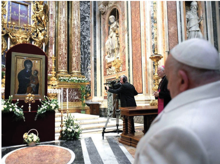
Francisco murió por un ictus cerebral y en sus últimas voluntades manifiesta su esperanza en la vida eterna.

El testamento de Francisco detalla además que los gastos del entierro serán cubiertos por un benefactor designado y que sus restos serán entregados a Santa María la Mayor.