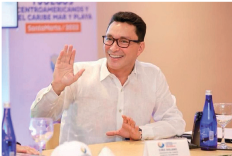
Caicedo recordó que por más de 20 años enfrentó amenazas contra su vida por parte de paramilitares.

Así lo reiteró la Fiscalía General de la Nación a través de una resolución de acusación contra ambos exjefes paramilitares, proferida por medio de su Dirección Especializada contra las Violaciones a los Derechos Humanos -o Fiscalía 228-, en la que da cuenta que el crimen obedeció por motivos de odios ideológicos,