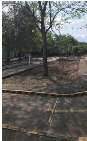
Se trata de un espacio único, que podría convertirse en una herramienta clave para la formación ciudadana.

recupere este espacio y lo ponga al servicio de los colegios y la ciudadanía.