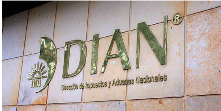
La medida busca hacer efectiva la garantía de pago de los contribuyentes con más de seis meses en mora.

La entidad realizará entre el 21 y 25 de abril la Jornada Nacional de Cobro 'Al día con la Dian, le cumpla al país', que busca hacer efectiva la garantía de pago de los contribuyentes con más de seis meses en mora. Estas personas se ven expuestas a accio-