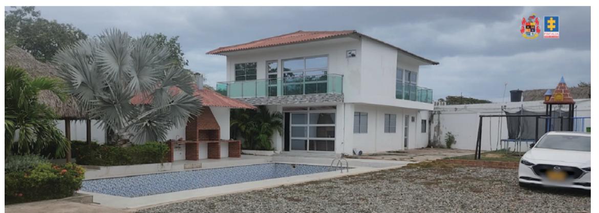
Un fiscal de Extinción del Derecho del Dominio habría constatado que las propiedades fueron adquiridas con recursos del narcotráfico.