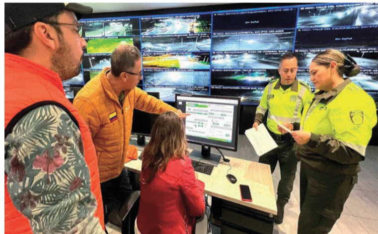
En total, durante la Semana Santa se movilizaron 9.968.746 vehículos por las principales vías nacionales.

El Ministerio de Transporte, en coordinación con la Dirección de Tránsito y