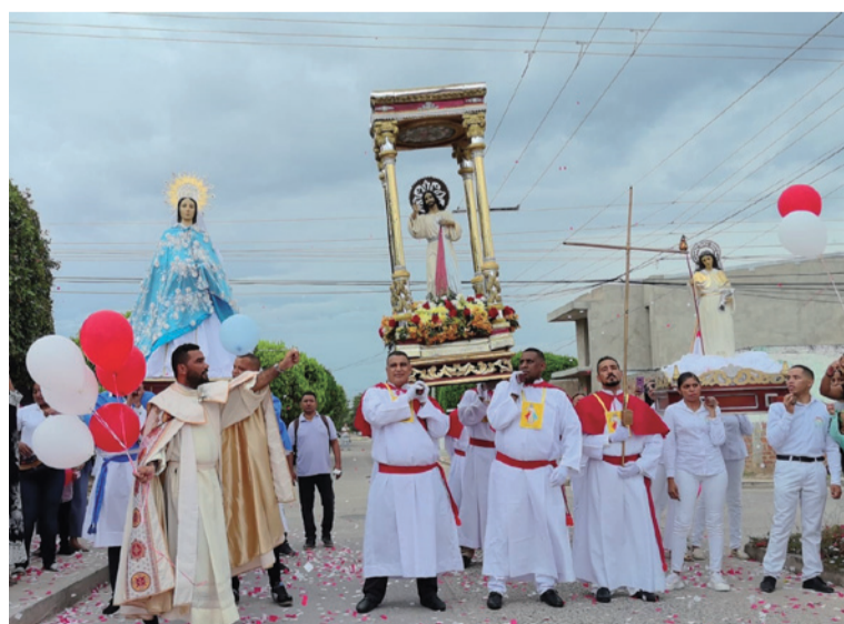
Las misas son ofrecidas por sacerdotes que vienen de diferentes partes del país.