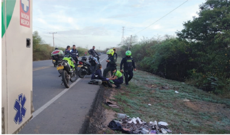
Los delincuentes luego de arrebatarse la moto la dejaron en el lugar con lesiones producto del forcejeo.

Sin embargo, los sujetos luego de arrebatarse la moto la dejaron en el lugar con lesiones producto del forcejeo entre ella y los