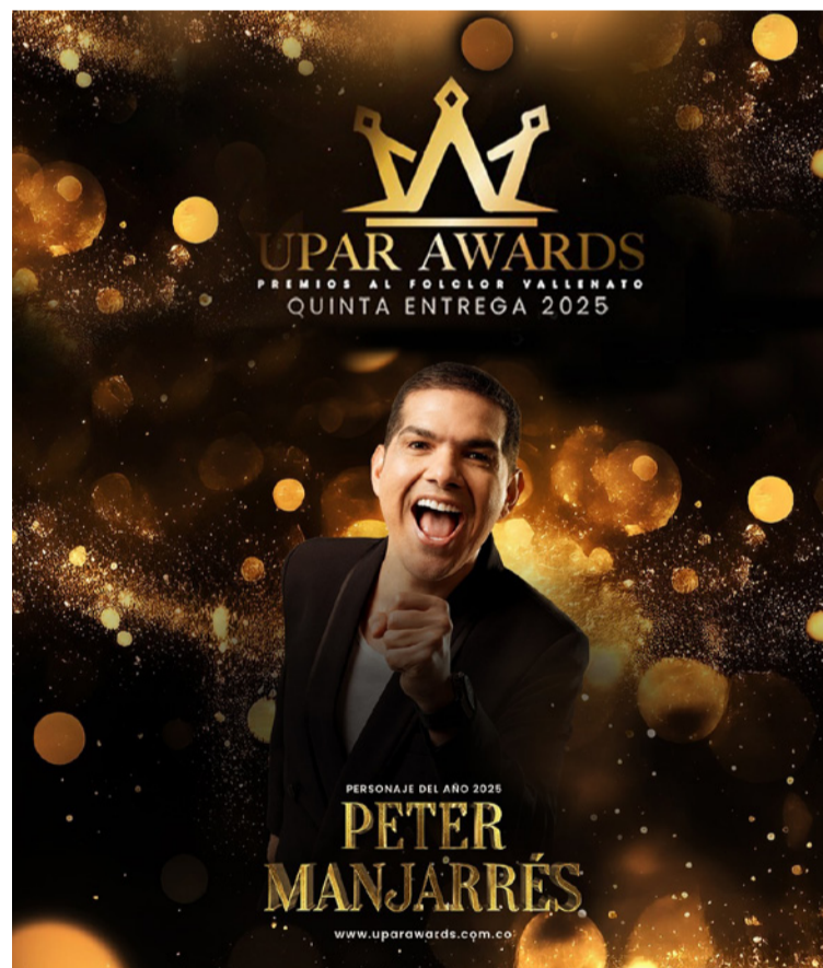
La gala de los premios se realizará el próximo 29 de abril en la ciudad de Valledupar.