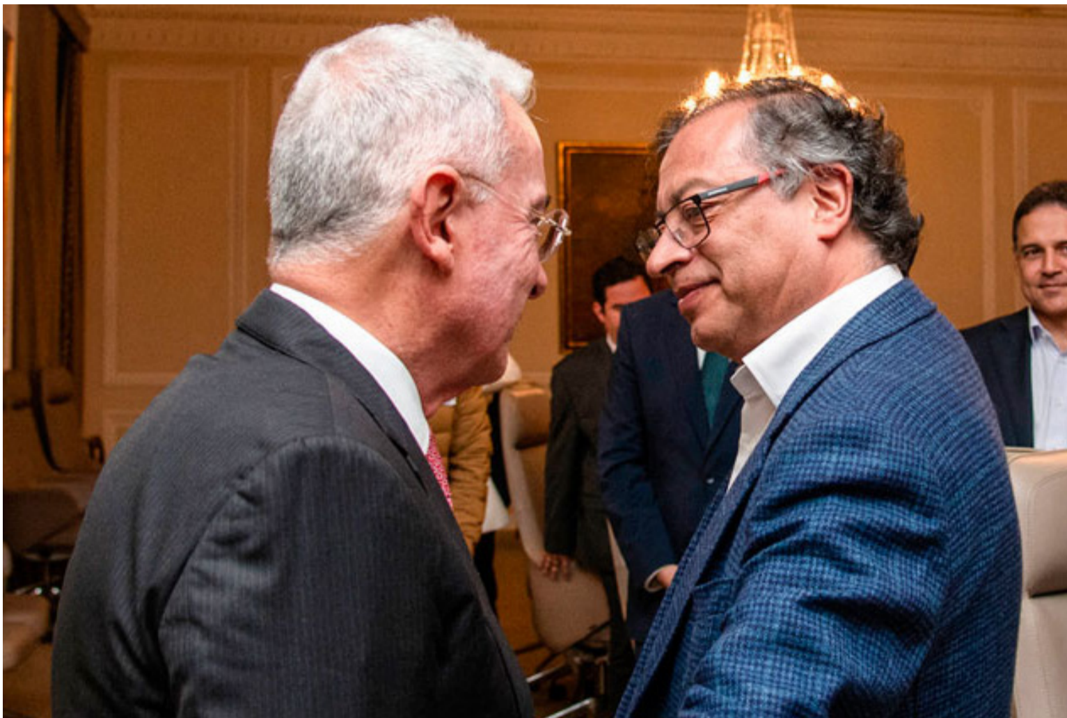
Estamos en un Gobierno del cual los que lo defienden son Petristas y los que están contra son Uribistas.