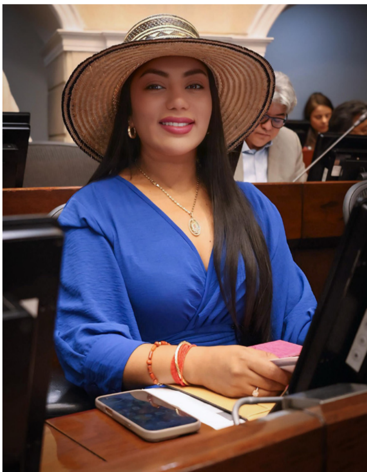
La senadora aseguró que deben discutir con responsabilidad y compromiso la crisis profunda del sistema.