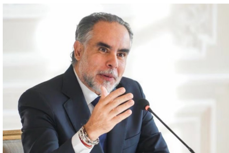
El fallo responde a un incidente de desacato presentado por la Veeduría Ciudadana wayuú - Sülió'ü.

Además, se menciona que la Asociación de Autoridades Tradicionales Indígenas Shipia Wayuú ha solicitado medidas cautelares a la Comisión Interamericana de Derechos Humanos en favor de grupos vulnerables dentro de las comunidades wayuú. Esto resalta la importancia y urgencia de proteger los derechos de estas comunidades, que siguen enfrentando desafíos significativos en su reconocimiento y autonomía.