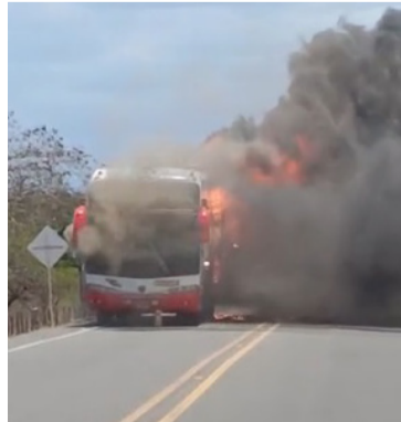
Se investigan las causas del incendio del bus.

Star, que tenía como destino la ciudad de Riohacha y venía con pasajeros, pero se desconocen las causas que originaron el incendio en el automotor que circulaba por la vía Troncal del Caribe.