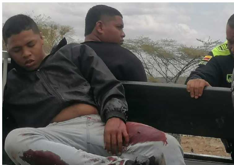
Los sujetos fueron detenidos y llevados hasta un centro asistencial en Hatonuevo para la atención médica.