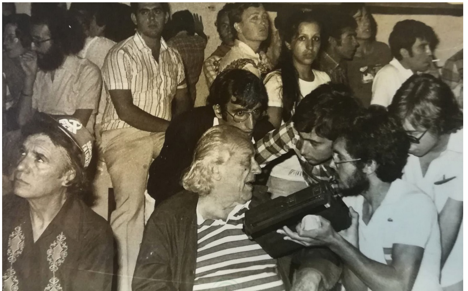
Rafael Alberti militó en el partido comunista español; publicó una serie de libros que llamó 'El poeta en la calle'.

El 28 de octubre de 1999, a los noventa y siete años, falleció este ilustre poeta y dramaturgo español, que en vida recibió numerosos reconocimientos, como el Premio Lenin de la Paz (1966) y el Premio Cervantes (1983).