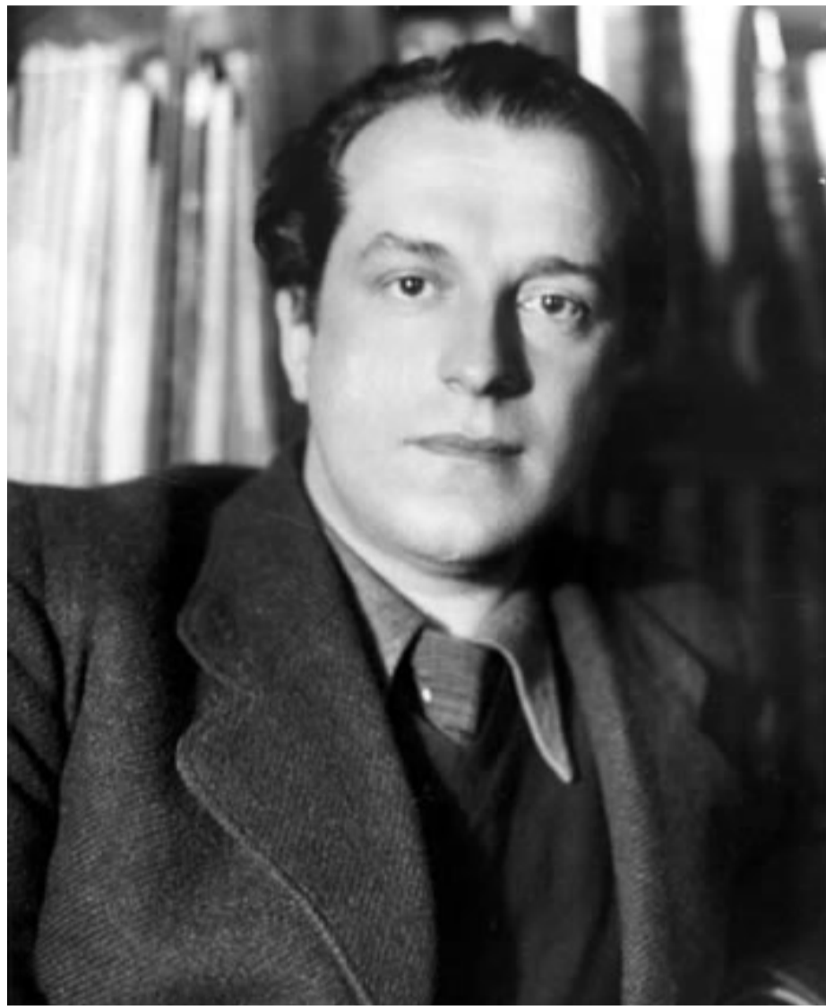
Alberti, influido por Góngora, escribió 'Cal y canto' y 'Sobre los ángeles'.

El poeta gaditano, en medio de una crisis personal publicó 'Sermones y moradas' (1930) y se ubicó plenamente en el surrealismo. Por algo estaban