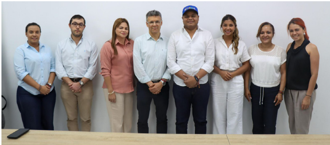
El alcalde se reunió con el presidente del Icetex, Álvaro Urquijo y su equipo.

En primer lugar, el mandatario se reunió con el nuevo presidente del Icetex, Álvaro Hernán Urquijo Gómez y su equipo, con quienes avanzó en estrategias y acciones que permitirán mejorar las oportunidades de acceso a la educación superior en el Distrito. Este acercamiento busca establecer mecanismos que faciliten a los jóvenes riohacheros