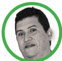
Por Henry Peñalver Herrera