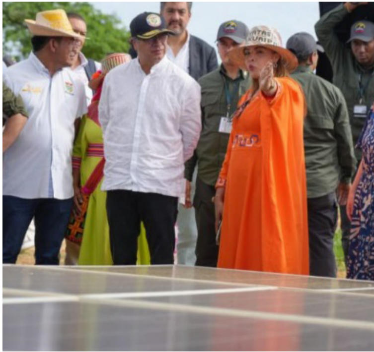
Colombia y el Gobierno sueco anunciaron inversiones sociales, entre ellos, sistemas de agua para La Guajira.

empresario añadió que "en el contexto de los aviones de combate está el proyecto de un centro de apoyo, y también trabajar en paneles solares y purificación de agua junto con la industria colombiana y otras iniciativas. Queremos estar involucrados en dichos proyectos que son importantes para la sociedad en Colombia".