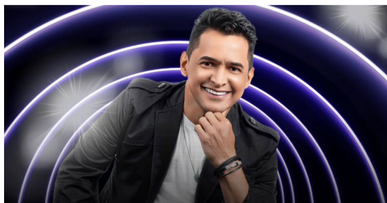
El artista villanuevero continúa llevando los aires vallenatos a los mejores escenarios de Estados Unidos.

El destacado cantante Jorge Celedón sigue abanderando el vallenato internacional y en la presente semana regresa a Estados Unidos para continuar con su agenda de presentaciones.