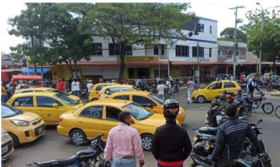
El director de Tránsito explicó que el estudio arrojó que el cobro de la tarifa sería por km.

También reclaman que se mejore la movilidad en la ciudad y se ofrezca otro sistema de transporte.