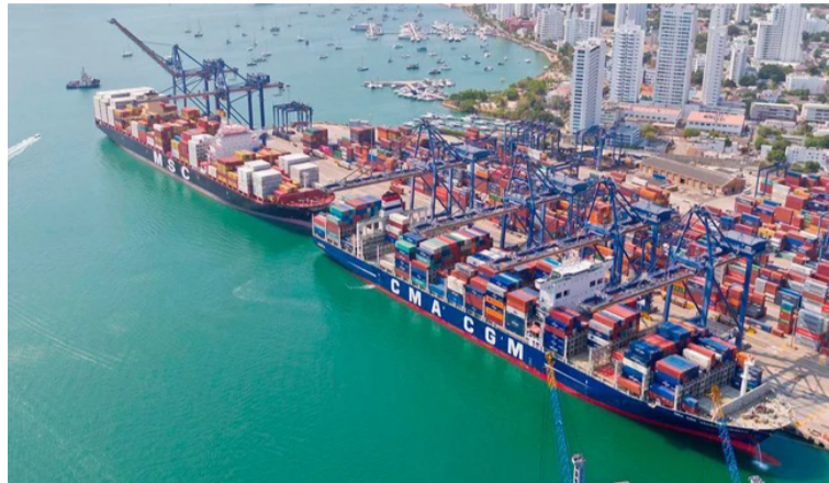
Entre enero a diciembre de 2024 el carbón fue el tipo de carga que más se movilizó con 59,7 millones de toneladas.

En 2024 se registró un incremento del 2,5% en la carga movilizada, lo que representó un incremento en 4,3 millones toneladas respecto al mismo período de 2023. En términos porcentuales, el mayor aumento se produjo en el Río Magdalena con un crecimiento del 32,1%, lo que