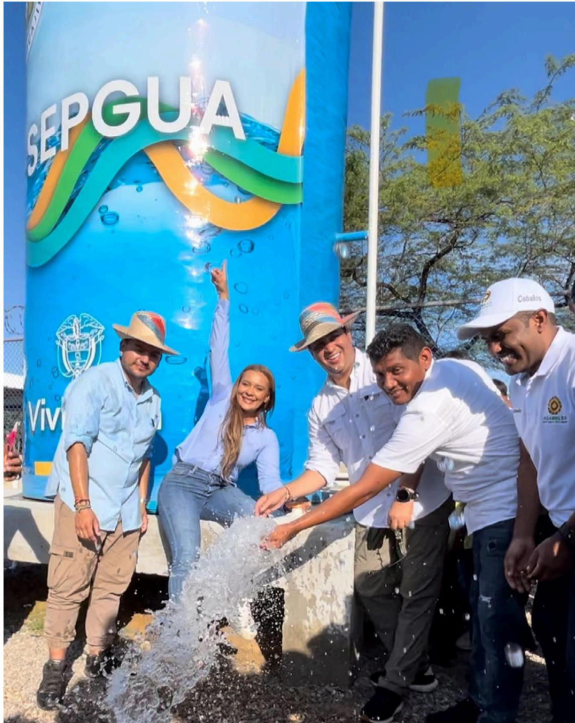
El gobernador Aguilar y Esegua se han propuesto llevar el agua a diversas zonas.

Adicional a lo anterior, para revertir la situación de estancamiento de la economía departamental se debe llegar a conocer