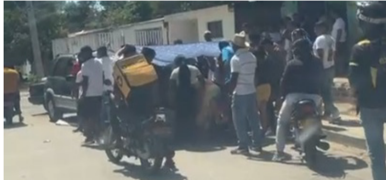
Al parecer el joven se voló una escuadra lo que originó que perdiera el control de la moto y cayera.

De manera inmediata fue auxiliado por algunas personas que lo llevaron hasta un centro asistencial donde fue atendido