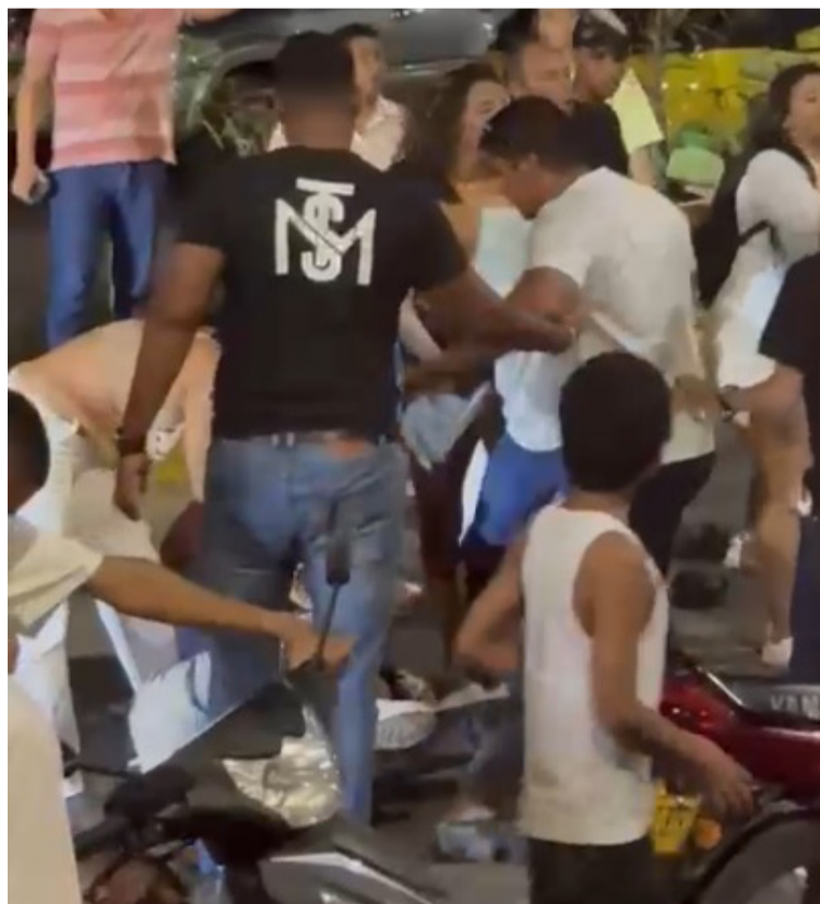
La pelea quedó registrada en videos aficionados, que captaron la alteración del orden público en la zona.

Una riña registrada entre varias personas que se cayeron a los golpes generó una alteración del orden público en horas de la