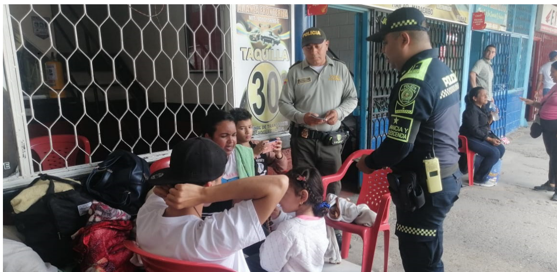
El objetivo es fortalecer la seguridad y la convivencia en los destinos turísticos.

Estos esfuerzos buscan reducir riesgos y garantizar la protección integral niños, niñas, adolescentes, ciudadanía en general y todos los involucrados en actividades turísticas.