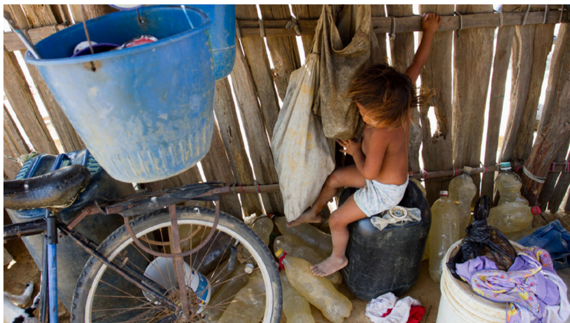
Mortalidad infantil en La Guajira en 2024 es 8,54 veces mayor que el promedio nacional.

Por Veeduría para la Implementación de la Sentencia T-302 de 2017.