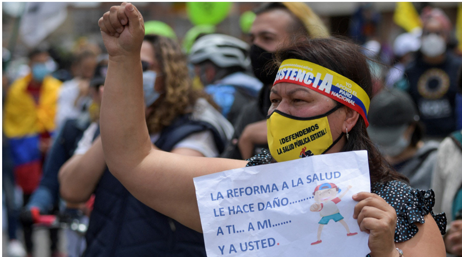
La peor desgracia de la salud ha sido quedar bajo el dominio de los carteles o bandas politiqueras y corruptas.