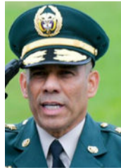
Eduardo Enrique Zapateiro, general retirado del Ejército.

Tolima. Sin embargo, su salida coincide con la divulgación de graves señalamientos que lo vinculan con presuntos actos de acoso sexual ocurridos en 2022, cuando era comandante del Ejército Nacional.