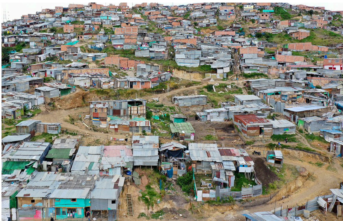
Colombia se ha caracterizado por un desarrollo desigual con enormes brechas.