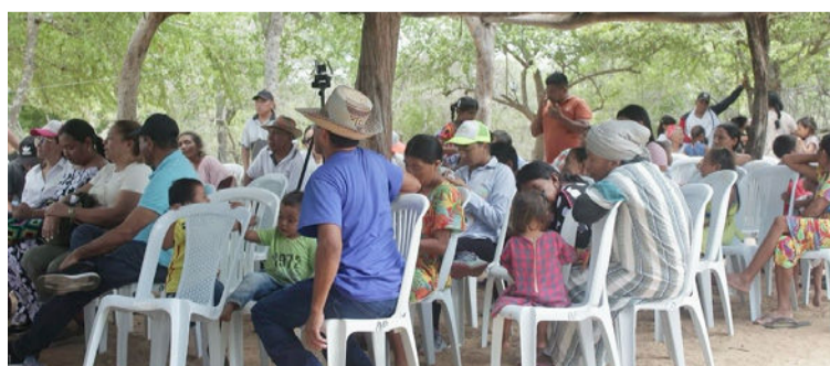
Se busca romper el círculo vicioso del escaso crecimiento económico en que se encuentra sumida La Guajira.