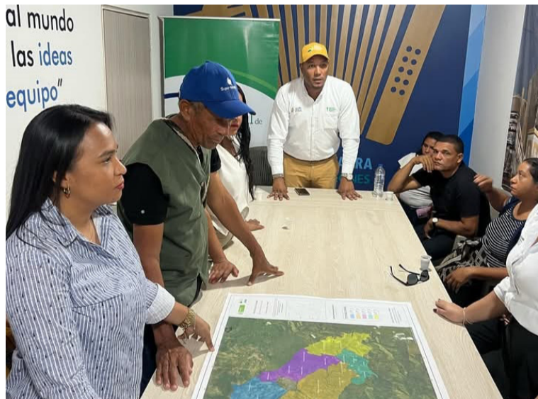
La legalización de predios permitirá que los campesinos puedan acceder a los beneficios de créditos.