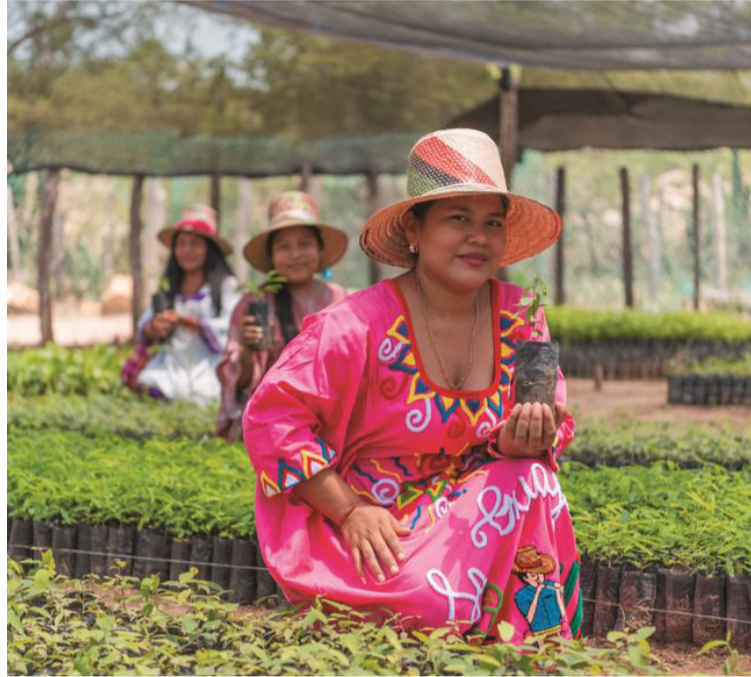
El Cerrejón continúa impulsando la inclusión de más mujeres en su fuerza laboral.

En 2024 se destacan dos programas clave en comunidades reasentadas por la empresa. Por un lado, el programa de Fortalecimiento Educativo, que benefició a 174