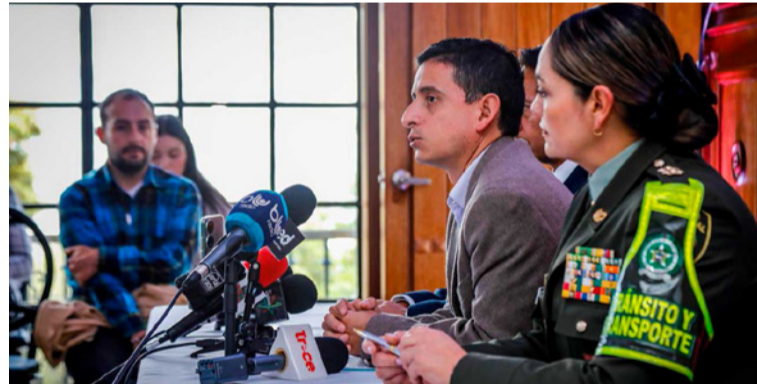
La campaña invita a los colombianos a descubrir la riqueza natural, cultural e histórica del país.

Durante el Gobierno del presidente Gustavo Petro, el MinCIT y Fontur han aprobado 220 proyectos en la línea de promoción y mercadeo turístico, con una inversión de $395.191 millones, impactando a 343 municipios en los 32 departamentos. Estas acciones reflejan el compromiso del Gobierno con el desarrollo del turismo en todo el país.