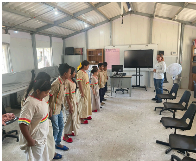
El objetivo fue sensibilizar a los estudiantes sobre la importancia del agua como recurso vital para la subsistencia.

Para celebrar el Día Mundial del Agua, el grupo de Educación Ambiental de Corpoguajira dictó un taller pedagógico desde el enfoque diferencial étnico y de grupos etarios de educación ambiental, desarrollando temáticas de gobernanza, ahorro y uso eficiente del agua, en la Institución Etnoeducativa Integral Rural Internado Mapuain de Uribia.