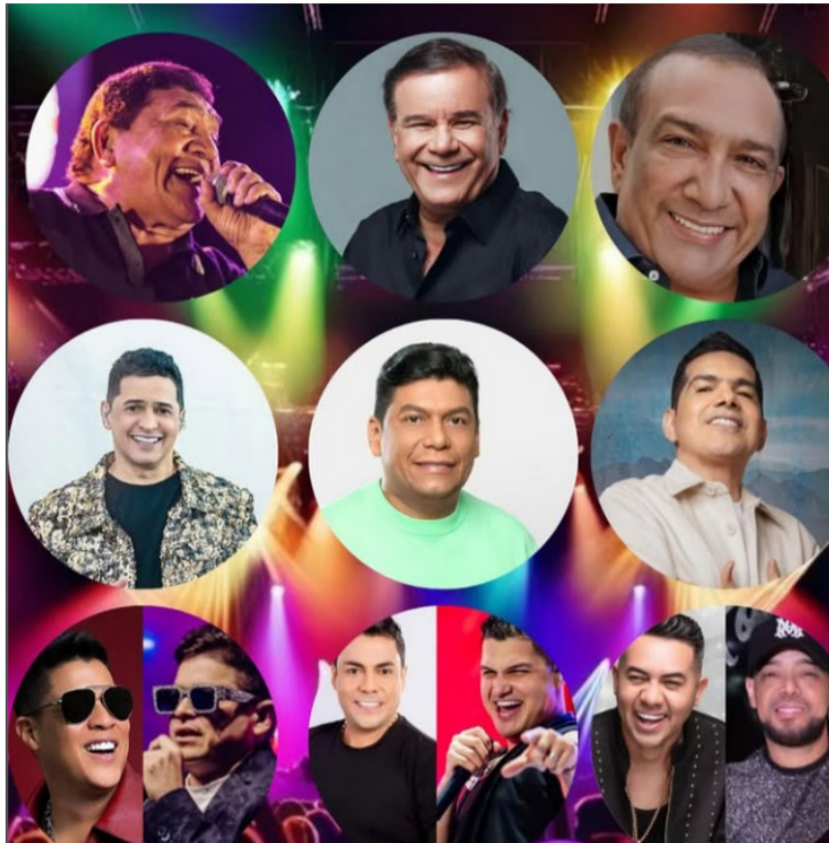
Estos cantantes hacen parte del selecto repertorio de los artistas de las tres generaciones del vallenato.

Todos ellos, estarán en un mismo escenario: el Rumbódromo, 'El Festival del Pueblo', que se realizará el viernes 2 y sábado 3