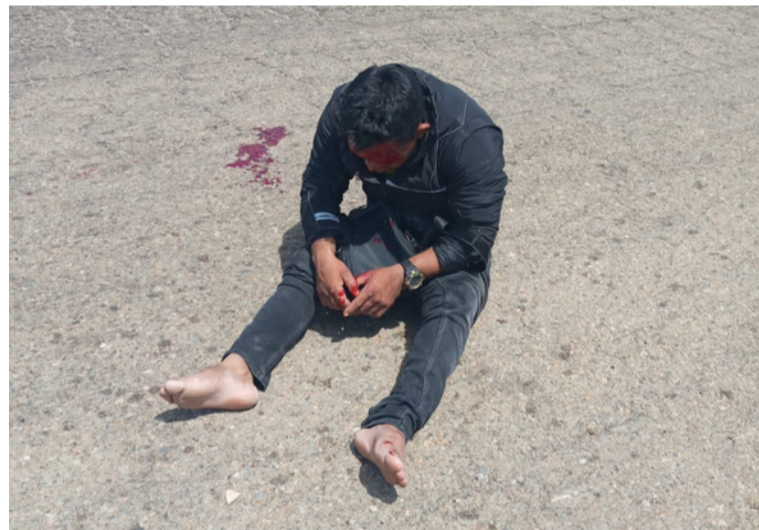
El joven wayuú recibió fuertes golpes en la cara, siendo auxiliado y llevado a un centro asistencial en Uribia.

Las autoridades competentes continúan haciendo el llamado a los usuarios viales para acatar las normas de tránsito y poder evitar situaciones como estas que ponen en riesgo sus vidas y las de los acompañantes.