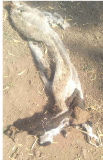
Los cuatreritos sacrificaron algunos animales.

La propietaria del lugar manifestó que este flage-