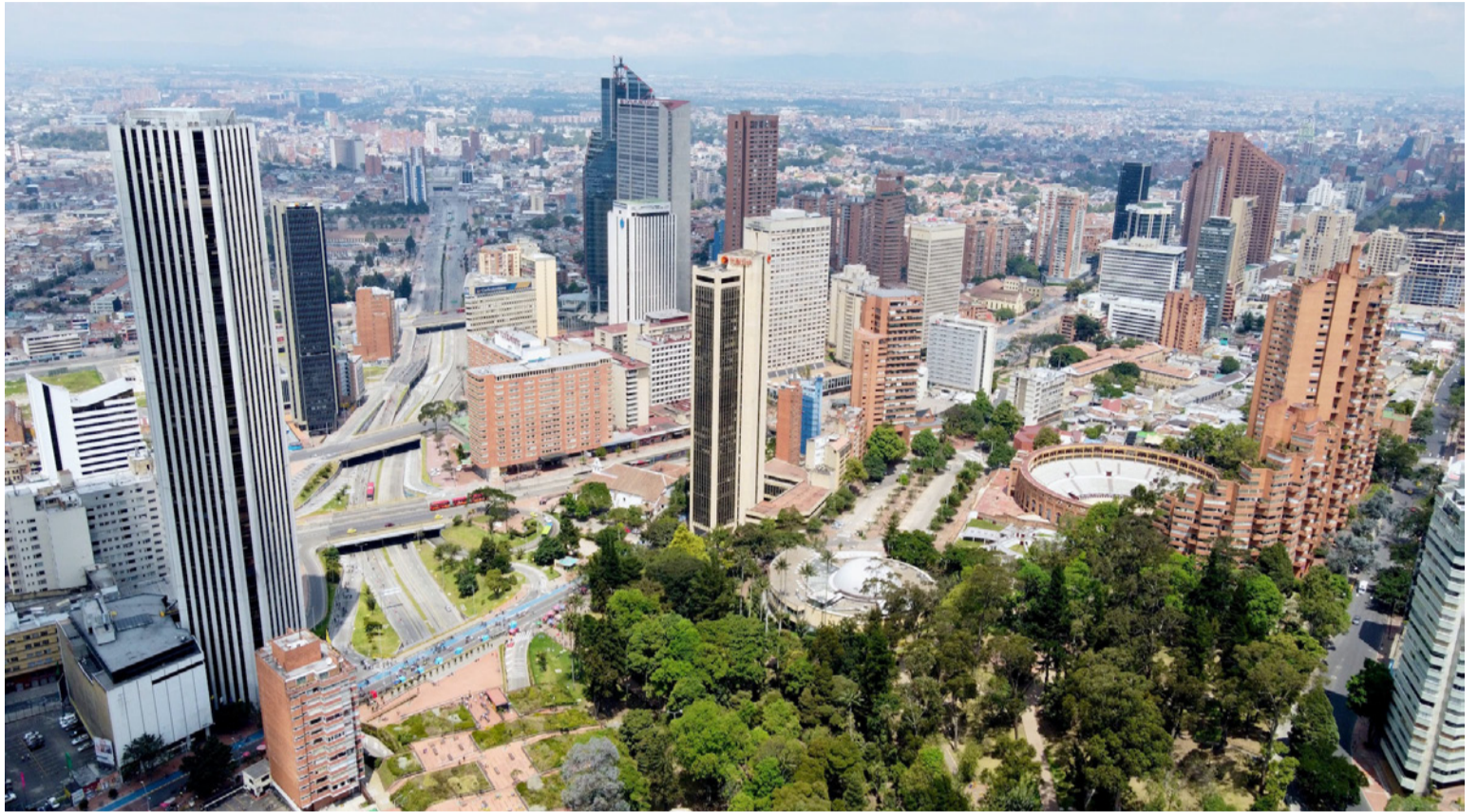
Del PIB nacional de 2023, Bogotá, Antioquia y el Valle del Cauca sumaron $780.1 billones, es decir el 49.2%.

La gran torta, que es el PIB nacional en 2023 alcanzó los $1.584 billones. Pero, los promedios suelen ser engañosos y a la hora del reparto salta a la vista el enorme desequilibrio entre unas regiones y otras. A saber: mientras el Distrito especial de Bogotá, Antioquia y el Valle del Cauca suman $780.1