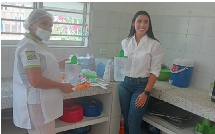
Con la donación se garantiza el normal funcionamiento de este Centro de Desarrollo Infantil.

Cabe recordar que inescrupulosos sustrajeron utensilios de cocina, como calderos grandes y