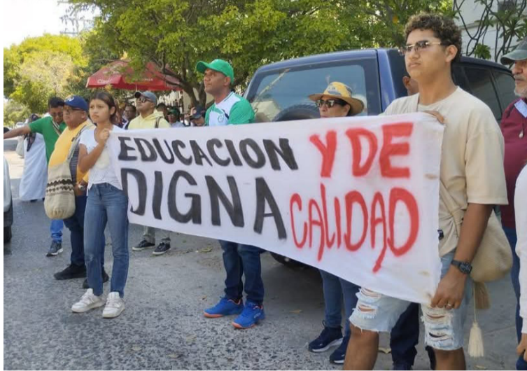
Los maestros en La Guajira marcharon con el apoyo de Asodegua y de los diferentes sindicatos de este territorio.

Este pliego de peticiones consta de cinco ejes: