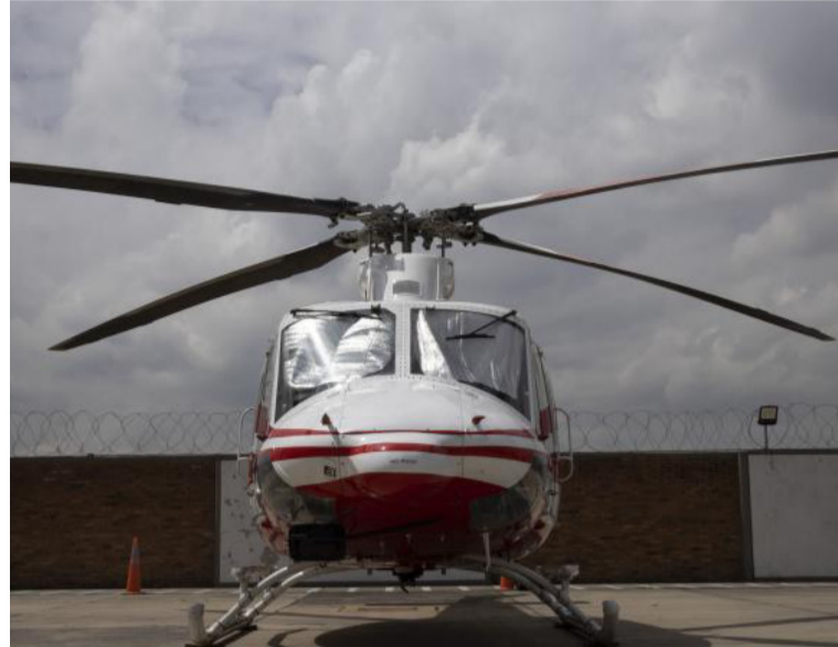
Helicol señala que la terminación del contrato vulnera principios fundamentales del debido proceso.

Este caso no solo afecta a las dos compañías, sino que también podría tener repercusiones sobre la confianza en la administración pública y los procesos de contratación en el país.