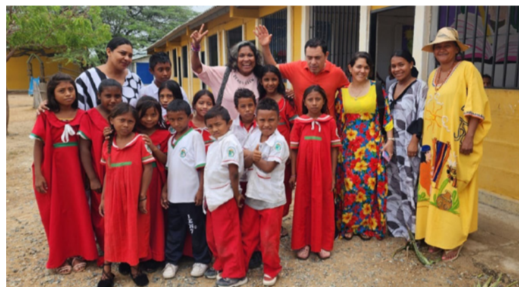
La infancia y la juventud no son el futuro lejano, sino el presente activo y digno de toda la garantía de sus derechos.

Es importante activar alianzas para aportar a los jóvenes