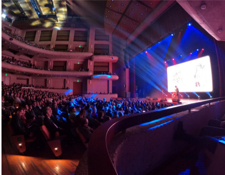
Los asistentes al Teatro Mayor Julio Mario Santo Domingo, estuvieron felices por esta velada musical.

Entrando en el campo folclórico se presentó el