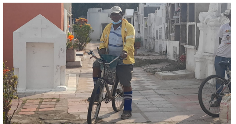
Su labor no solo consistió en enterrar a los difuntos, sino también en cuidar y preservar el camposanto.

Su retiro marca el final de una era para el cementerio municipal, dejando un legado de entrega, resiliencia y compromiso con la comunidad de Villanueva.