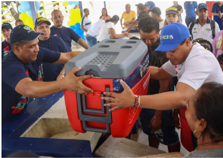
El Tambo ahora no solo es un lugar de trabajo, sino un símbolo de dignificación para los vendedores.

Todo cambió con la llegada de una iniciativa impulsada por la Admi-