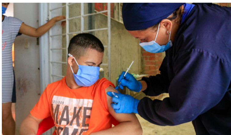
Este año se han confirmado 39 casos de Covid-19 en Sucre, de los cuales 27 se concentran en Sincelejo.

Las autoridades departamentales reiteraron su compromiso con la vigilancia epidemiológica y exhortaron a la ciudadanía a no bajar la guardia frente a estas enfermedades.