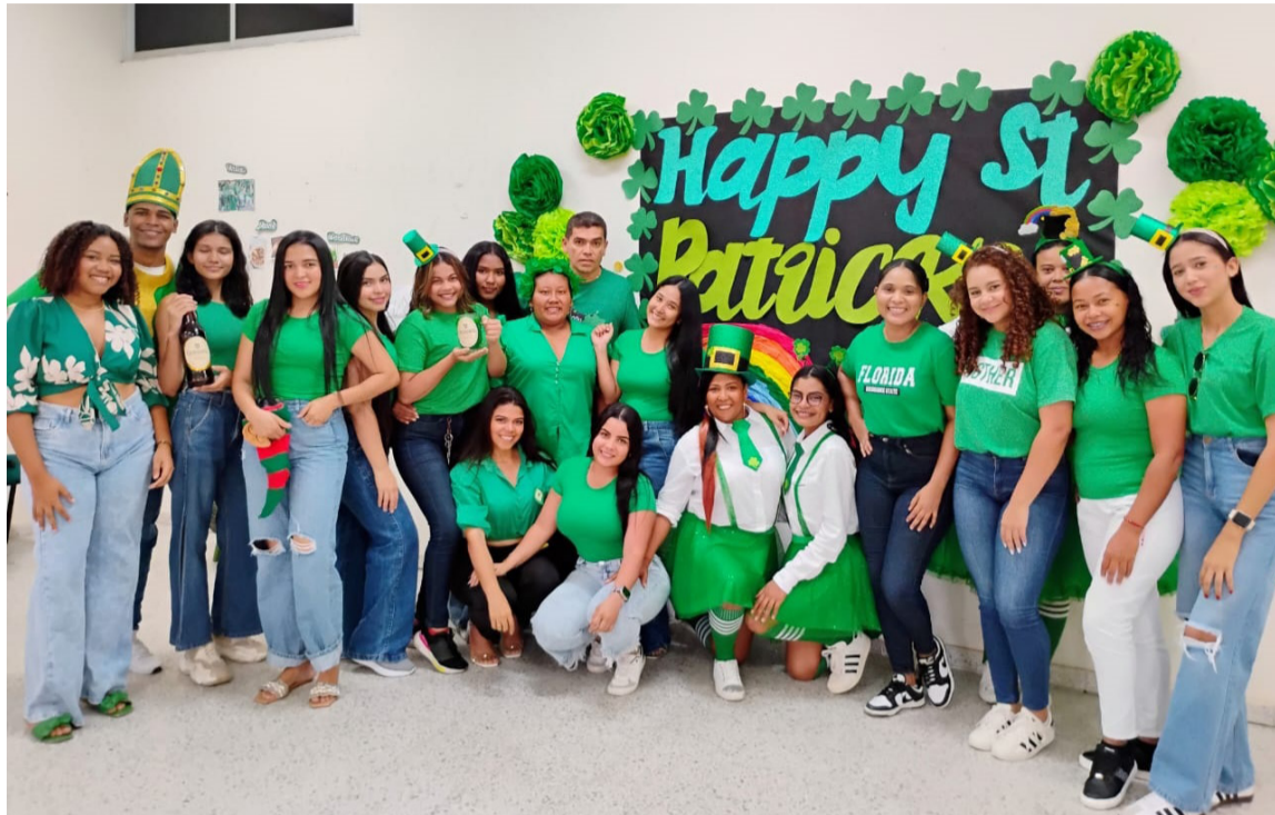
El aprendizaje y cultura de la lengua inglesa ha tenido relevancia en los estudiantes.

"Fue una experiencia muy motivadora para mis estudiantes, nos vestimos de verde, nos vestimos como ellos durante el festival, personificación personajes claves de la fecha, compartimos información relevante, la decoración de nuestros salones, la creatividad e ingenio de los chicos fue sorpren-