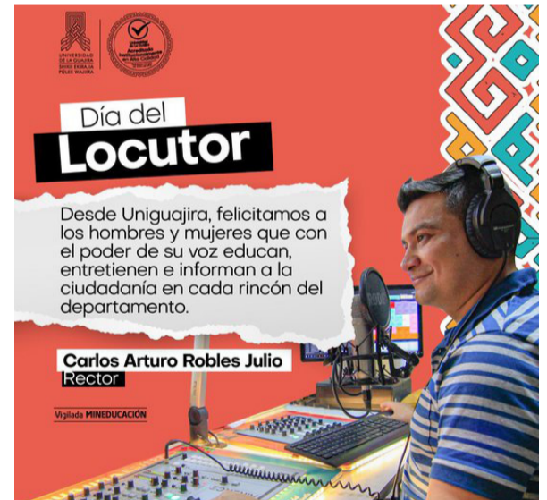
Explica Uniguajira que gracias a los locutores se cuenta con una alternativa diaria para educarse y entretenerse.

En su actuación en Dallas, Celedón expresó su entusiasmo por el festival, describiéndolo como el evento musical más importante de Colombia y recordando su amistad con Omar Geles.