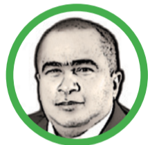
Por Arcesio Romero Pérez