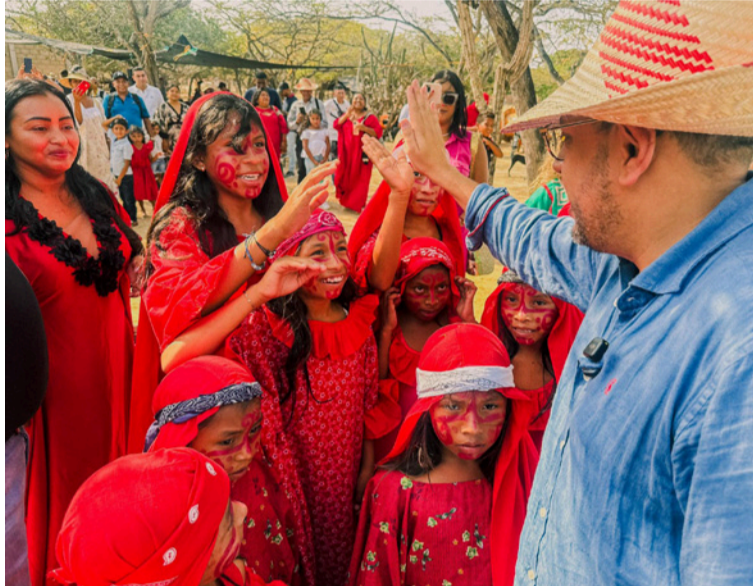
Los usuarios por primera vez, podrán acceder a este servicio esencial desde su propia comunidad.

“El Internet es para promocionar la cultura, para promover la economía, para educarse. Esa es la idea del Gobierno del presidente Gustavo Petro, que quiere que esta comunidad se conecte a la red, y que la sepan aprovechar”, afirmó el ministro TIC, Julián Molina, durante la inauguración de la Junta de Internet. “Ahora ustedes pueden dar a co-