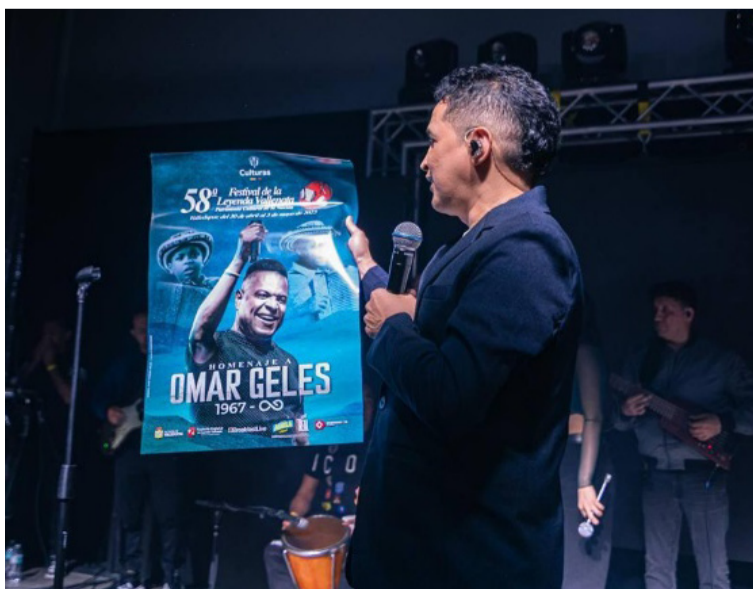
La gira internacional de Jorge Celedón abarca varias ciudades de Estados Unidos y otros países.

tará en la programación principal del festival, se presentará el 3 de mayo en el Rumbodromo 'El Festival del Pueblo', en la capital del Cesar. Su gira, titulada '2025 más internacional', abarca varias ciudades de Estados Unidos y otros países, habiendo comenzado en lugares como Paraguay y República Dominicana, y ya ha tenido más de 15 conciertos con entradas agotadas.