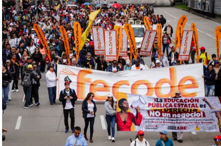
Las marchas anunciadas por Fecode y varias centrales obreras se llevarán a cabo en todo el país.

DESTACADO El presidente de Fecode, Domingo Ayala, defendió el actual modelo de salud establecido para los maestros, reconociendo que presenta problemas de implementación.