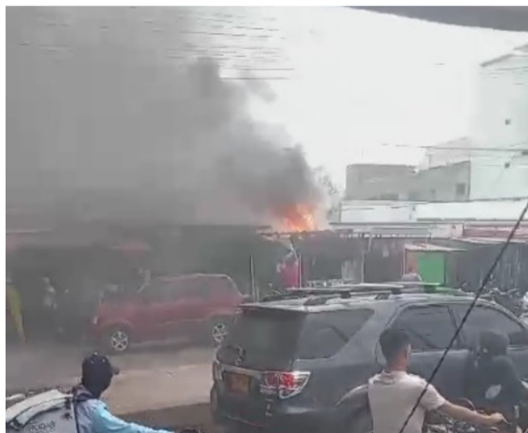
Autoridades hicieron un llamado a los comerciantes a tener extintores para enfrentar estas emergencias.

Gracias al apoyo de otros comerciantes que contaban con extintores de incendio, se logró controlar las llamas que se originaron en un local comercial de venta de celulares en el sector del mercado viejo del Distrito de Riohacha.