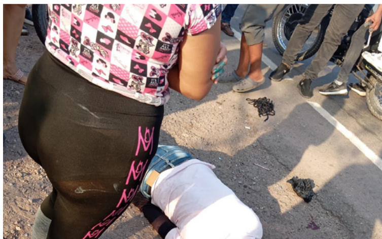
Personas que se encontraban en el lugar le brindaron auxilio a la víctima que quedó inconsciente.

Las autoridades hacen un llamado a los motociclistas para que conduzcan con precaución y respeten las normas de tránsito, con el fin de evitar este tipo de incidentes en las vías del municipio.