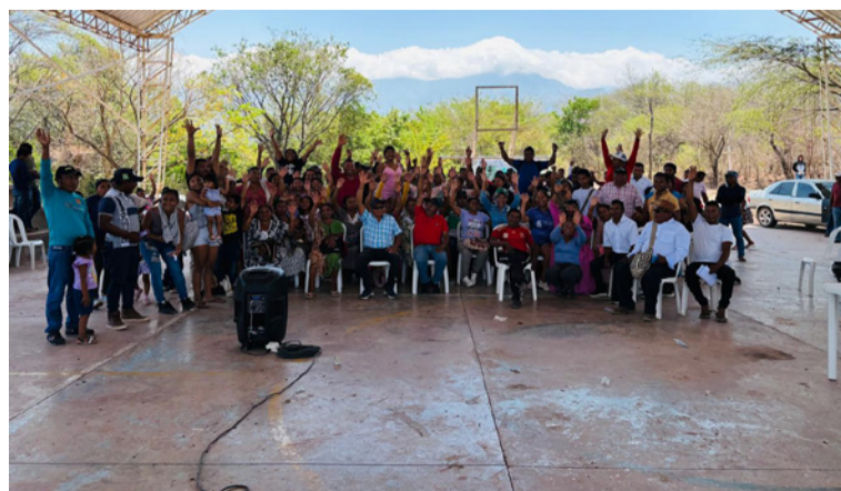
El proceso de consulta debe ser amplio, transparente y colectivo, tal como lo aprobó la asamblea general.

El pasado 23 de marzo de 2025, se llevó a cabo una asamblea en el marco de la autonomía con el propósito de tomar una decisión sobre el proceso de consulta previa, con la presencia de la Junta Directiva y el cabildo gobernador, autoridad tradicional y miembros en general. Esta citación fue realizada de manera abierta a toda la comunidad mediante la convocatoria No. 02 de 2025.