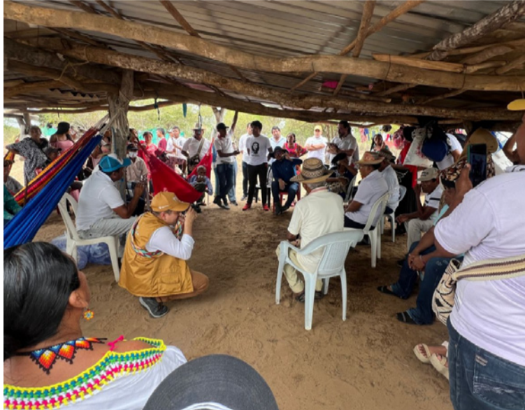
La agencia reitera la protección de los derechos de las comunidades étnicas y su acceso a la tierra.

• Insta, por consiguiente, a las autoridades competentes a suspender de inmediato cualquier acción que implique el desalojo