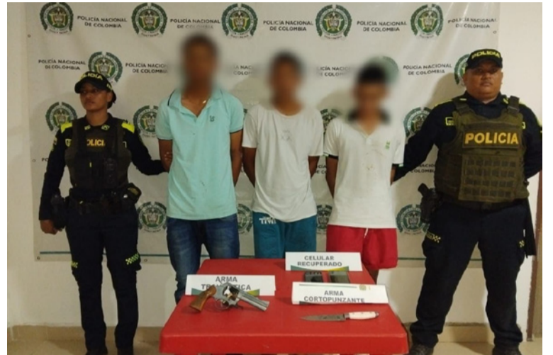
Los tres individuos están señalados de cometer un hurto con arma de fuego en el barrio El Campo.

La Policía Nacional reiteró su compromiso con la seguridad y el bienestar de la comunidad, e invitó a la ciudadanía a denunciar cualquier hecho delictivo a través de las líneas de atención.