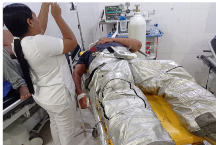
Varias personas resultaron afectadas por el ataque de abejas africanizadas en el corregimiento El Hatico.

ron atacadas, por lo que debieron ser trasladadas al hospital San Agustín de