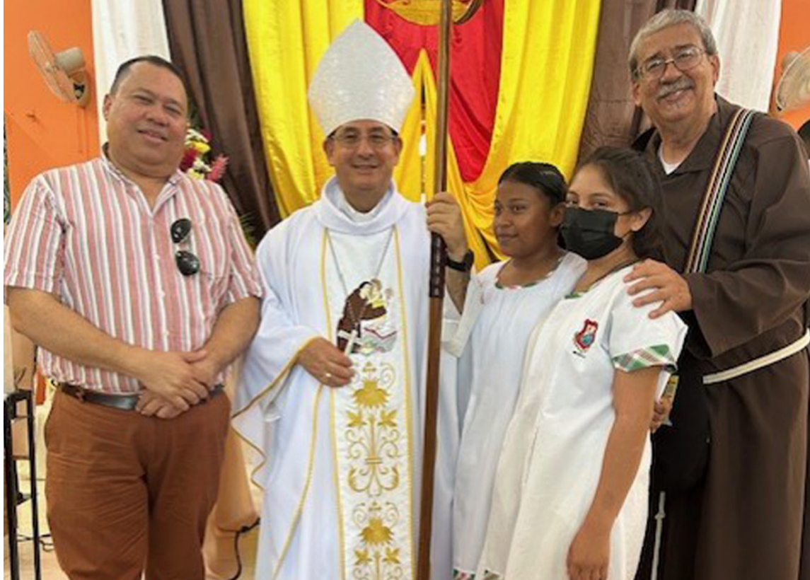
El obispo de Riohacha debería solicitar que se abra la discusión entre todos y se examine peso a peso qué se hizo, qué se está haciendo y qué se va a hacer.

Es indiscutible que como ya lo habíamos dicho, nuestro Departamento (Aclaro no la Gobernación) es en este momento un corcho bien liviano en medio de un endiablado remolino que si no se le presta atención se convertirá en tornado, todo potenciado por la corrupción, las ambiciones,