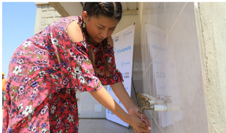
Según MinVivienda, el propósito del Gobierno es garantizar el derecho al agua apta para el consumo humano.

Con una inversión de $93.338 millones se benefician más de 147 mil personas y 349 comunidades indígenas, a través de la terminación de 184 intervenciones para garantizar el acceso al agua en La Guajira (3 proyectos de acueducto, 176 rehabilitaciones y 5 módulos