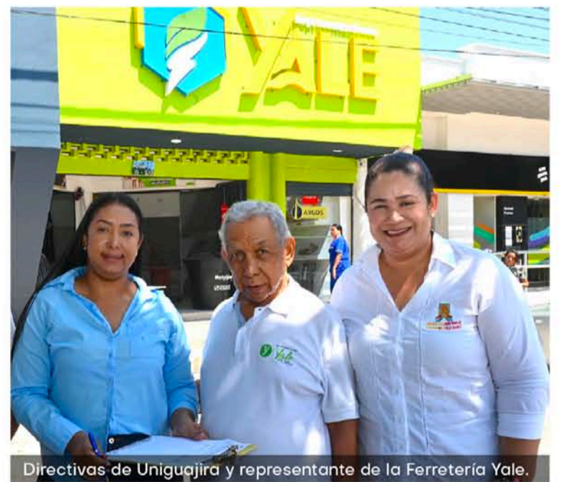
Directivas de Uniguajira y representante de la Ferretería Yale.

Con esta iniciativa, la Alma Máter reafirma su compromiso constante con la creación de alianzas estratégicas en el territorio, con el propósito de generar beneficios que impulsen el bienestar de sus estudiantes, graduados y comunidad académica en general.