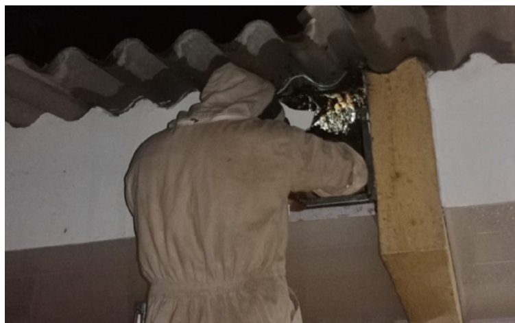
El enjambre de abejas fue llevado a un área de menor riesgo para que continúen su migración.

DESTACADO La Defensa Civil recomienda mantener la calma frente a la presencia de estos insectos que en muchos casos son de paso y no representan peligro mientras no se sientan atacados.