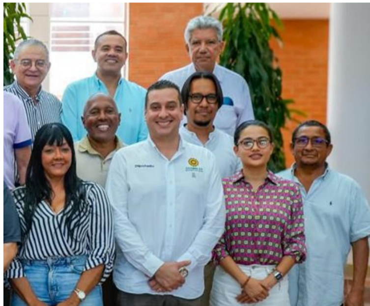
Se promoverá la construcción de relaciones basadas en la confianza, la cooperación, el respeto y la transparencia.

En su lugar, promueven la construcción de relaciones basadas en la confianza mutua, la cooperación, el respeto, la transparencia y el uso responsable de los recursos públicos, priorizando el bienestar colectivo y la generosi-