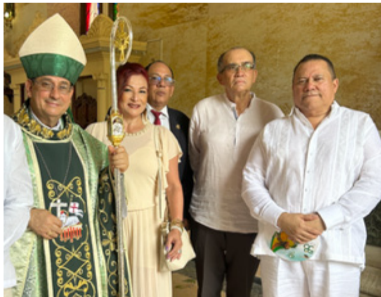
Con monseñor tenemos justificadas razones para el optimismo y la fe para que ese ejercicio ecuménico a varias manos contribuya al restablecimiento del orden.

El diálogo es el mejor medio para tender puentes entre personas que piensan diferente, es el instrumento eficaz para aunar esfuerzos frente a las posibilidades que se tienen de lograr objetivos comunes y de beneficio colectivo y es eficaz además para desarmar los espíritus de tal manera que la fuerza de los argumentos vuelva a ser más importante que el argumento de la fuerza, no es posible que en este Departamento que por su situación geográfica ofrece tantas potencialidades para su desarrollo socioeconómico haya tanta miseria, los recursos no