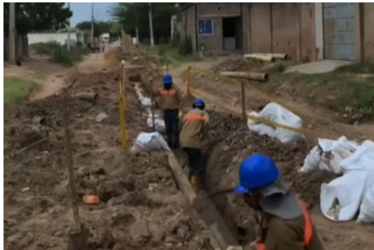
En abril de este año se iniciaría la contratación de la firma que adelantará los estudios y diseños.

Puntualizó que los estudios y diseños totales estarían para el mes de junio de 2026, pero el área que comprende básicamente lo que son los sectores de la comuna 10 estaría aproxi-