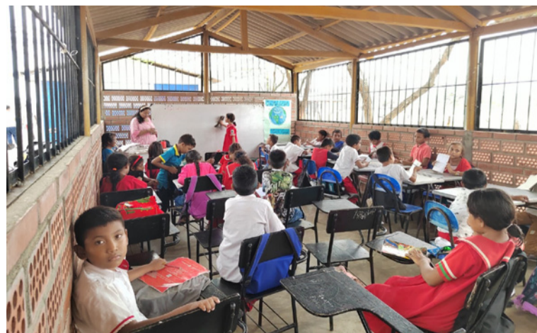
El 65% de los jóvenes participantes de este pilotaje completaron el perfil de salud.