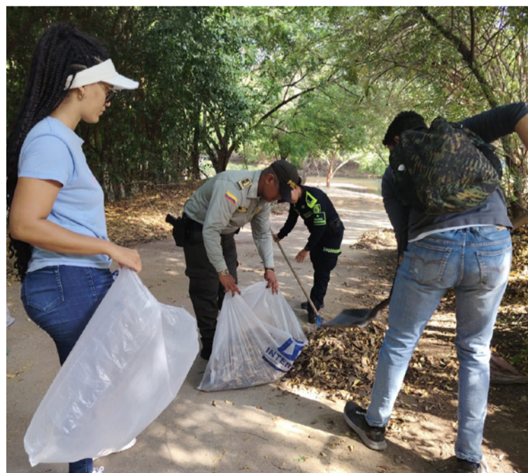
Con estas acciones, la Policía Nacional reafirma su compromiso con la conservación de los recursos naturales.

Gracias a este esfuerzo conjunto, se logró retirar más de una tonelada de residuos sólidos, contribu-