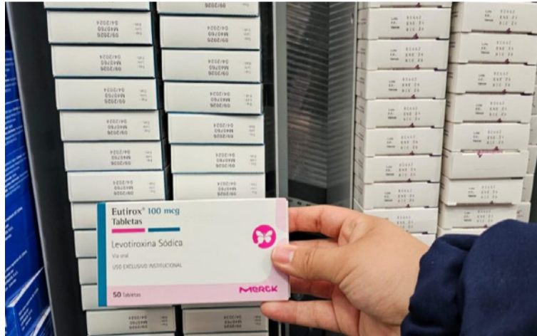
La Supersalud advierte que no se puede demorar o entregar de manera incompleta un medicamento.

Durante la auditoría, se verificó una base de datos que reportaba 6.116 unidades de medicamentos pendientes de entrega. Sin embargo, al cotejar la información con el inventario físico en la bode-