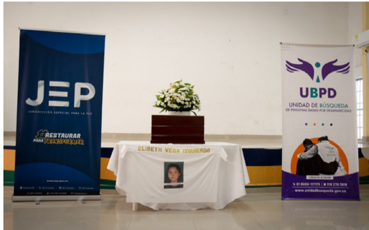
Su hermano guarda recuerdos de ella, como su alegría y su crianza protectora por ser de las mayores.

Sin la esperanza de volver a escuchar la voz de su familiar, ni de disfrutar de la felicidad que irradiaba o ver su larga cabellera azabache ondear por las ráfagas de brisa fría que descienden de la Sierra Nevada de Santa Marta, la familia Vega alimentó nuevamente sus fuerzas