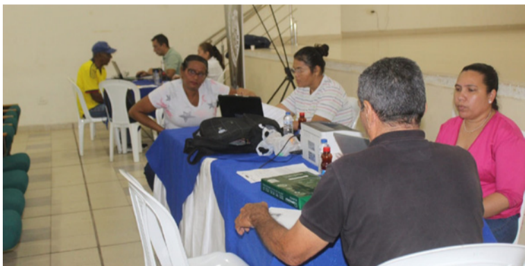
El motivo de esta jornada es la caracterización de los afectados por el conflicto armado.