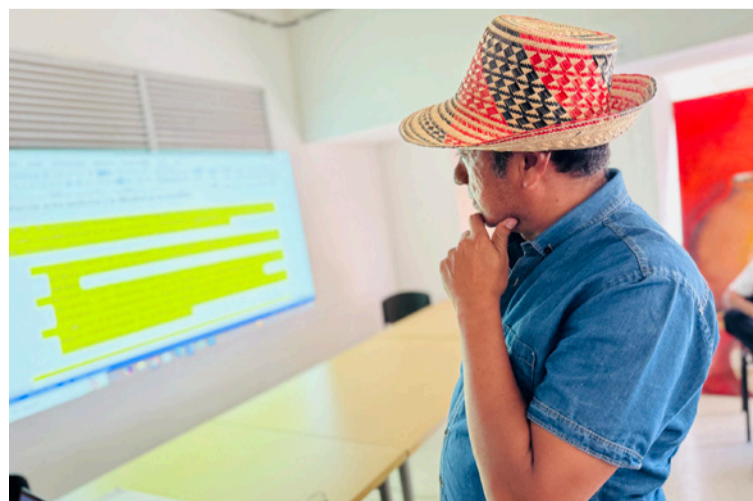
Se anuncia también que se producirá un podcast y un producto audiovisual en wayuunaiki.

implementación de la Sentencia T-302 de 2017. Por eso, con este Auto 1743 se busca revisar la estructura de gobernanza del pueblo wayuú y reforzar su autonomía”.