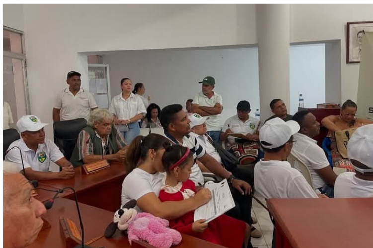
Se destacó en la jornada, la importancia de generar conciencia ambiental desde las aulas y en la vida cotidiana.