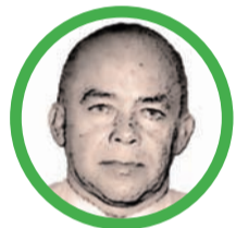
Por Eloy Farfán Bello