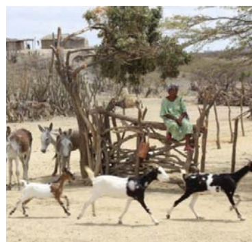
El ántrax sigue presente en el municipio de Manaure.

Indicó que se está esperando la manifestación de la Administración municipal al respecto, puesto que