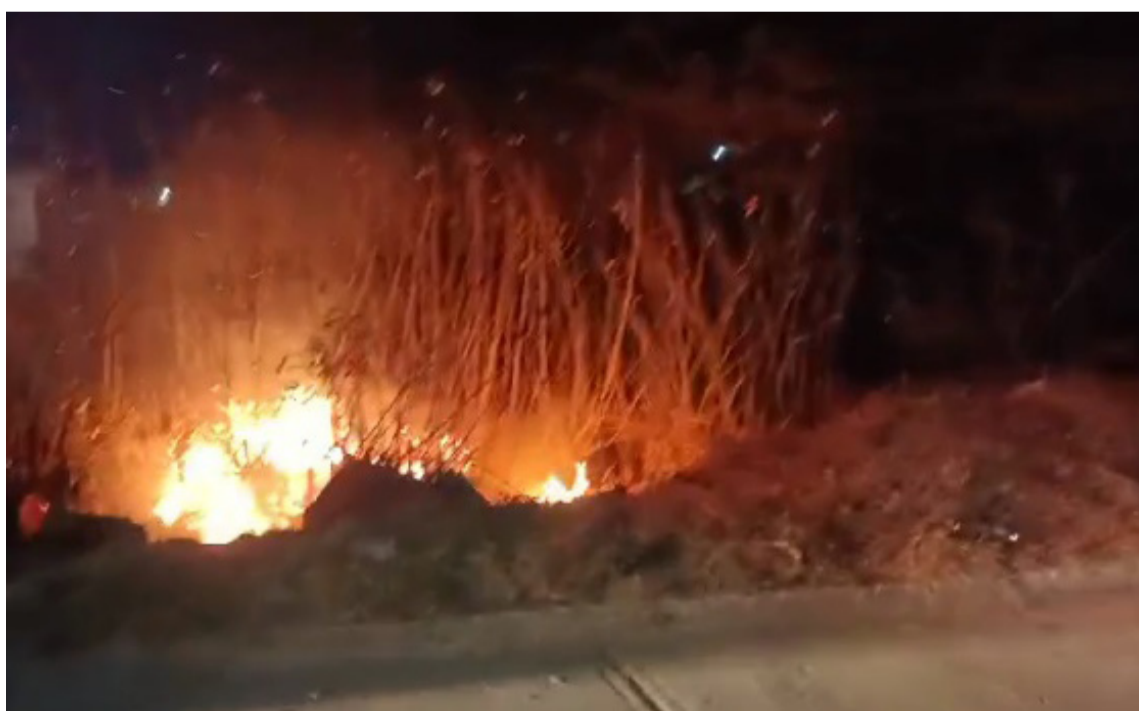
Las autoridades iniciaron la investigación para determinar las causas del incendio.

El primer incendio se originó en la mañana del lunes, cuando los bomberos acudieron al llamado y lograron controlar las llamas. Sin embargo, en horas de la noche, aproximadamente a las 7:00 p.m., se presentó un nuevo conato de incendio, el cual, según versiones preliminares, pudo haber sido provocado por pirómanos.