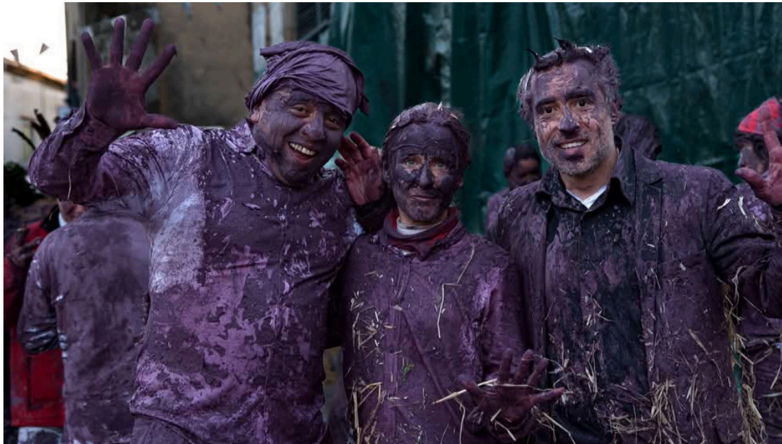
La similitud resalta la universalidad de ciertas tradiciones carnalescas.

El Carnaval en Cournonterral no tiene carrozas ni coreografías ensayadas. Su origen se remonta a 1346, cuando una disputa territorial entre los habitantes de Cournonterral y el vecino pueblo de Aumelas derivó en un enfrentamiento. Para ahuyentar a sus rivales, los de Cournonterral idearon una estrategia: se cubrieron con vino, sangre y desechos, y adoptaron un aspecto aterrador. La táctica funcionó, y desde entonces, la historia se recuerda cada Miércoles de Ceniza, con una persecución simbólica en la que los Pailhasses—vestidos con ropas viejas y empapados en lías de vino—persiguen