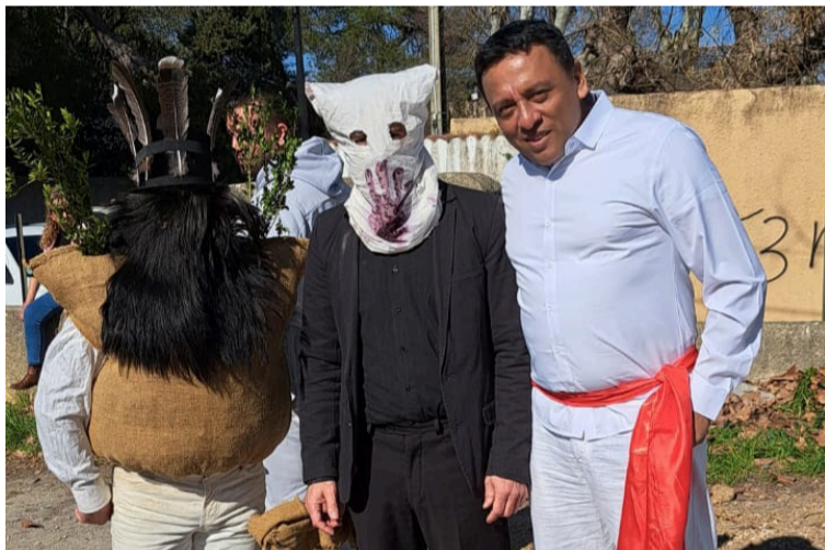
Alrededor de las 2:30 p.m., comienza el desfile de Pailhasses y Blancs, antes de que comience el caos.

a los Blancs, aquellos que aún están limpios. Si no estás manchado, eres un objetivo. El juego consiste en correr, esquivar y tratar de evitar ser embadurnado por los Pailhasses, quienes, con paciencia y astucia, persiguen a los Blancs hasta que no quede nadie limpio.