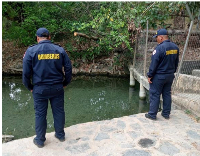
La cantidad de basura que se encuentra alrededor del manantial contamina el agua y el medio ambiente.

Las comunidades de Pozo Hondo, Guaya canal y Cerro de Barrancas, así como los propietarios de fincas aledañas se encuentran preocupados debido a que la cabecera del arroyo de Pozo Hondo, único afluente que existe en la zona para el abastecimiento de agua, se encuentra a punto de ser cercada.