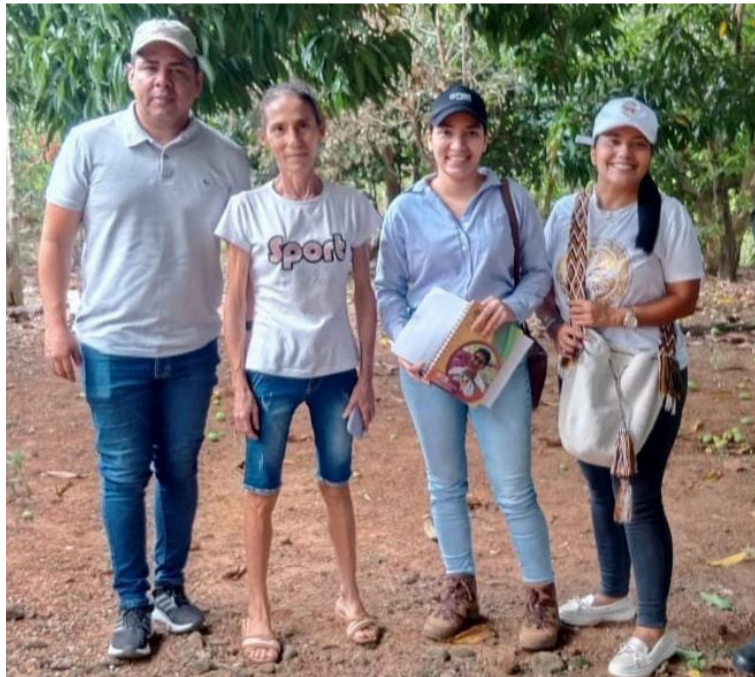
La Jagua de Ibirico presenta un total de 46 sentencias de restitución de tierras.

En dicha época, la presencia de las Farc en La