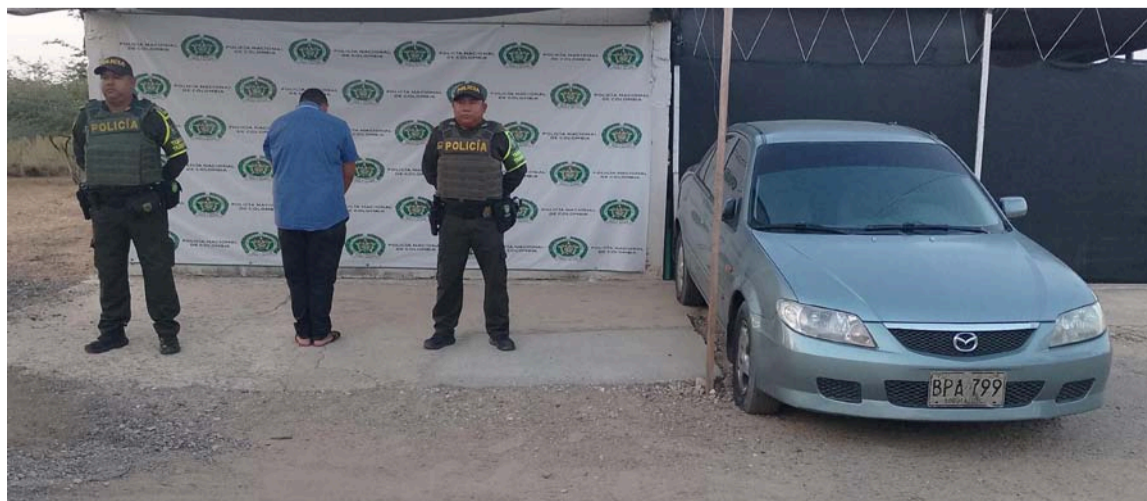
El auto inmovilizado es marca Mazda 2005 de color gris, de placas BPA799.

El vehículo solicitado es un automóvil marca Mazda 2005 de color gris, de placas BPA799, que estaba avaluado en $30.000.000 millones de pesos.