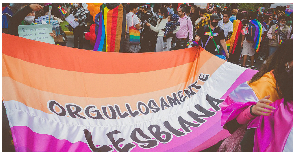
Por qué aún existen tantos obstáculos para que puedan vivir sin miedo.

bación, restricciones en su libertad o, en los peores casos, castigos físicos y expulsión del hogar.