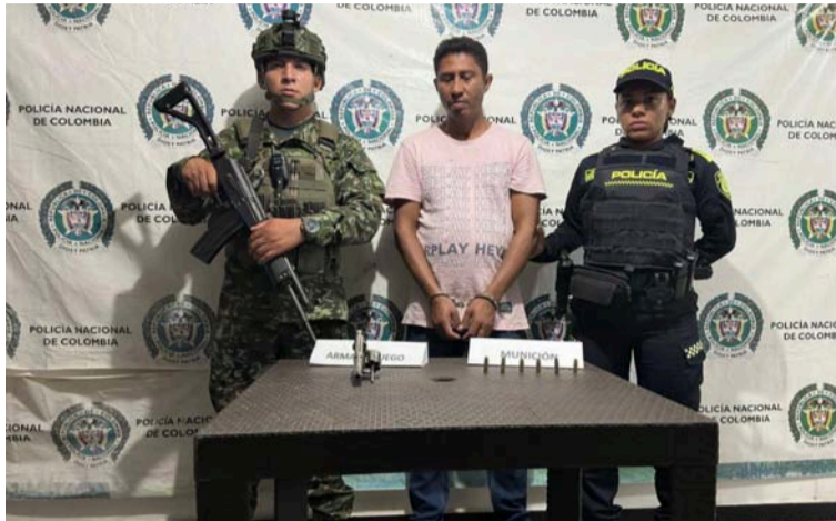
Uniformados encontraron en poder de esta persona un revólver calibre 38 milímetros con seis cartuchos.

El procedimiento se llevó a cabo en el kilómetro 32 de la vía que comunica La Paz con Distracción, en la zona rural del municipio de Villanueva. Durante actividades de registro y control, los uniformados