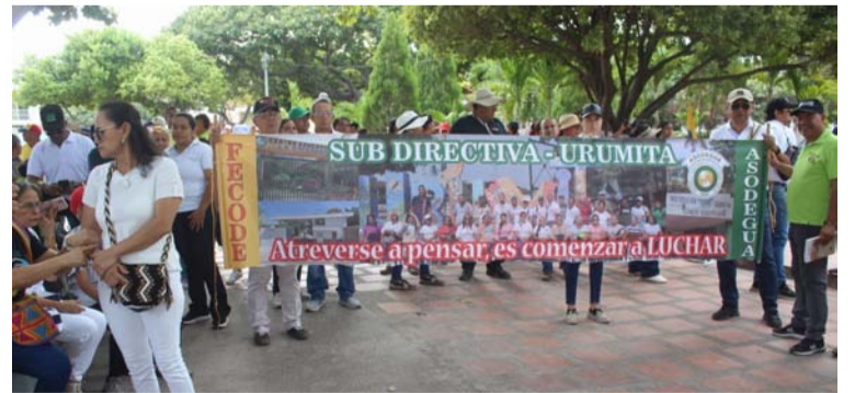
A la marcha se unieron docentes, trabajadores del Cerrejón, empleados del Sena y campesinos.

A la marcha se unieron diversos sectores, incluidos docentes, trabajadores de empresas carboníferas como Cerrejón, empleados del Sena y campesinos,