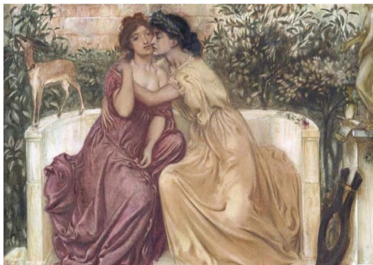
Safo de Lesbos, poetisa lírica de la antigua Grecia. La atracción entre mujeres ha sido parte de la diversidad humana.

DESTACADO Ser lesbiana en Colombia es, muchas veces, un acto de valentía. Es desafiar las normas impuestas, es enfrentar el juicio de la familia, es luchar contra la invisibilización y el rechazo.