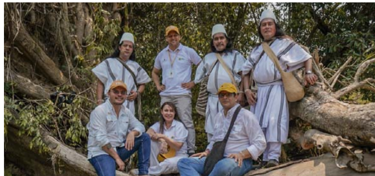
La entrega fue liderada por la Agencia Nacional de Tierras, en cumplimiento de la directriz presidencial.