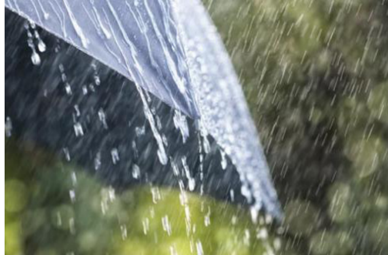
Frente frío en el mar Caribe, dará la posibilidad de registrar lluvias ligeras en el Departamento.

VISITANOS diariodelnorte.net @diariodelnorteguajira @diario.delnorte @DiarioDelNorte