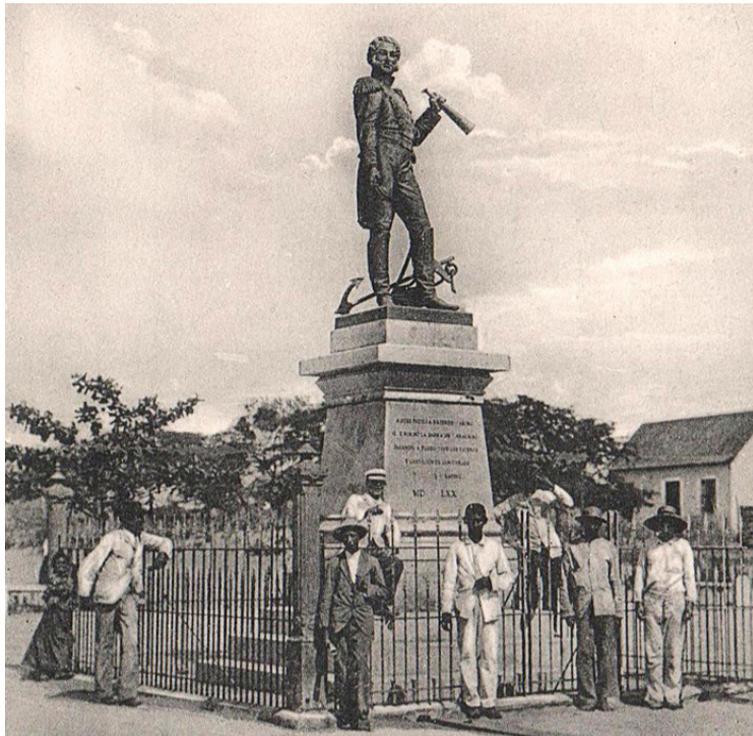
El prócer guerrero riohachero y militar naval al servicio de la patria, se hizo notar por su valor militar.