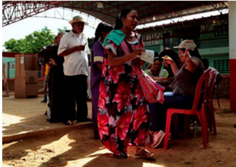
La Gobernación garantiza todas las medidas para que el proceso electoral se desarrolle en completa tranquilidad.

Puntualizó, que la Administración brindará todo el apoyo logístico que se requiera para que la actividad electoral se cumpla de acuerdo como