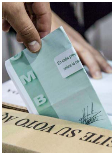
La decisión se tomó con base en la resolución 3173.

Con base a la Resolución número 3173 del 18 de marzo de 2025, los comicios se realizarán el