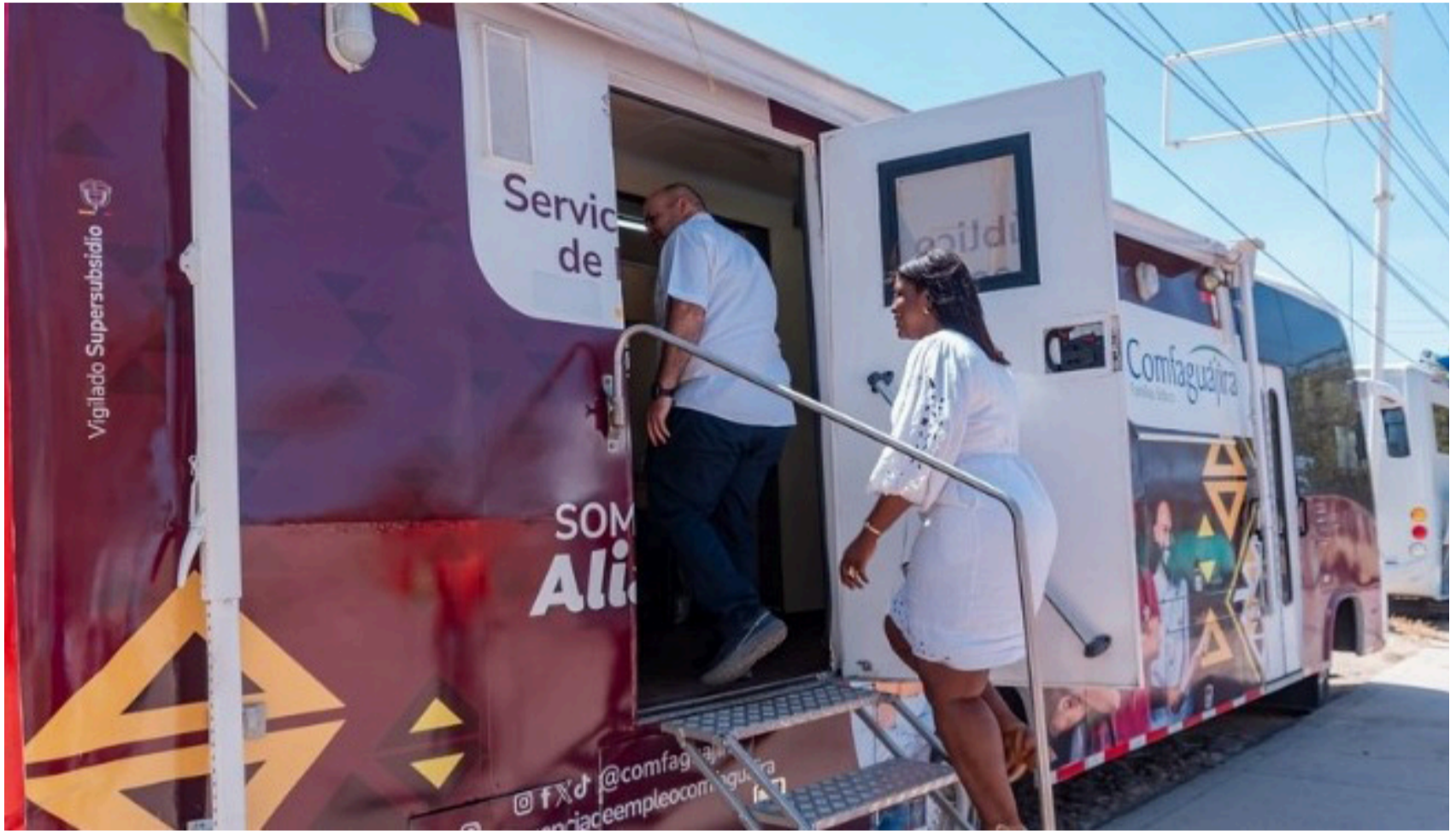
Sí hay empleo, sí hay trabajo y la Agencia de Empleo de Comfaguajira, aporta a que esta necesidad sea satisfecha.