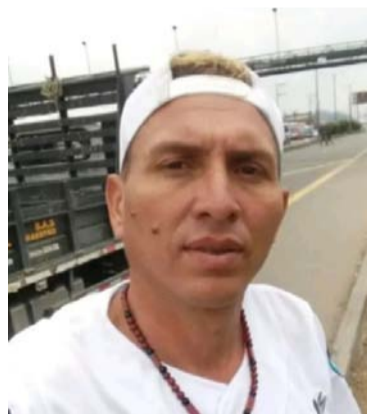
El CTI de La Guajira adelantan las indagaciones para determinar los móviles de las dos muertes violentas.

Ambos casos fueron atendidos por miembros del Cuerpo Técnico de Investigación (CTI) de la Fiscalía seccional La Guajira, quienes adelantan las indagaciones para determinar los móviles de las dos muertes violentas. Hasta el momento se desconocen mayores detalles de los homicidios.