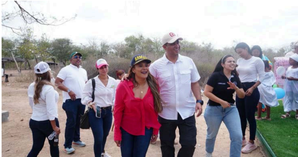
El gobernador Jairo Aguilar explica que a través de Esepgua siguen cumpliendo la palabra, llevando soluciones reales a las comunidades.

La Gobernación de La Guajira, a través de Esepgua sigue cumpliendo la palabra, llevando soluciones reales a las comunidades que más lo necesitan. Con cada sistema de abastecimiento puesto en marcha, se mejora el acceso al agua potable y se transforma la vida de miles de familias.