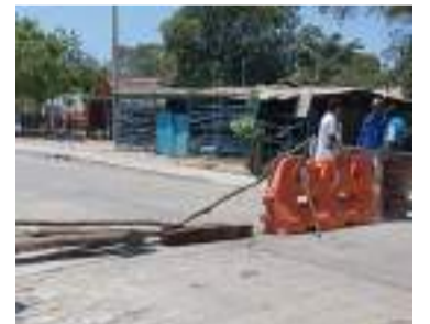
Comunidad se queja del servicio de agua potable.

Asimismo, los usuarios han manifestado que hay un completo descontrol en cuanto a la llegada de los recibos del servicio de agua potable, ya que en