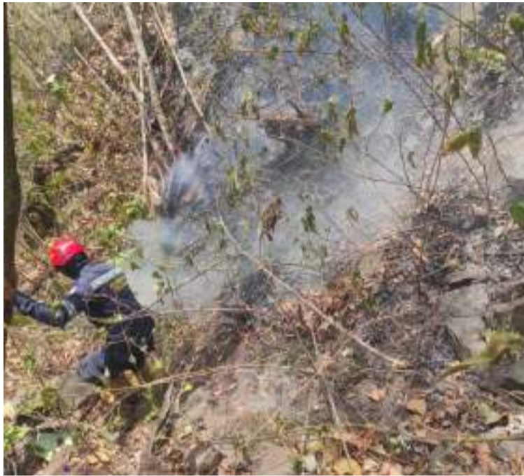
Gestión del Riesgo ha desplegado 20 unidades del Ejército especializadas en incendios forestales.

La Administración municipal reafirma su compromiso con la protección ambiental y la seguridad de la comunidad, asegurando que continuará con labores de prevención y