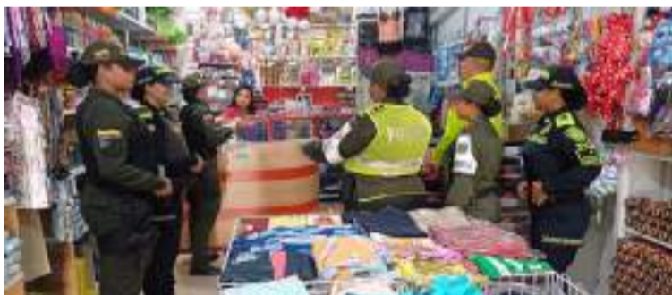
Los uniformados socializaron recomendaciones de autoprotección dirigidas a los comerciantes y ciudadanos.

mación personal en espacios públicos o redes sociales.