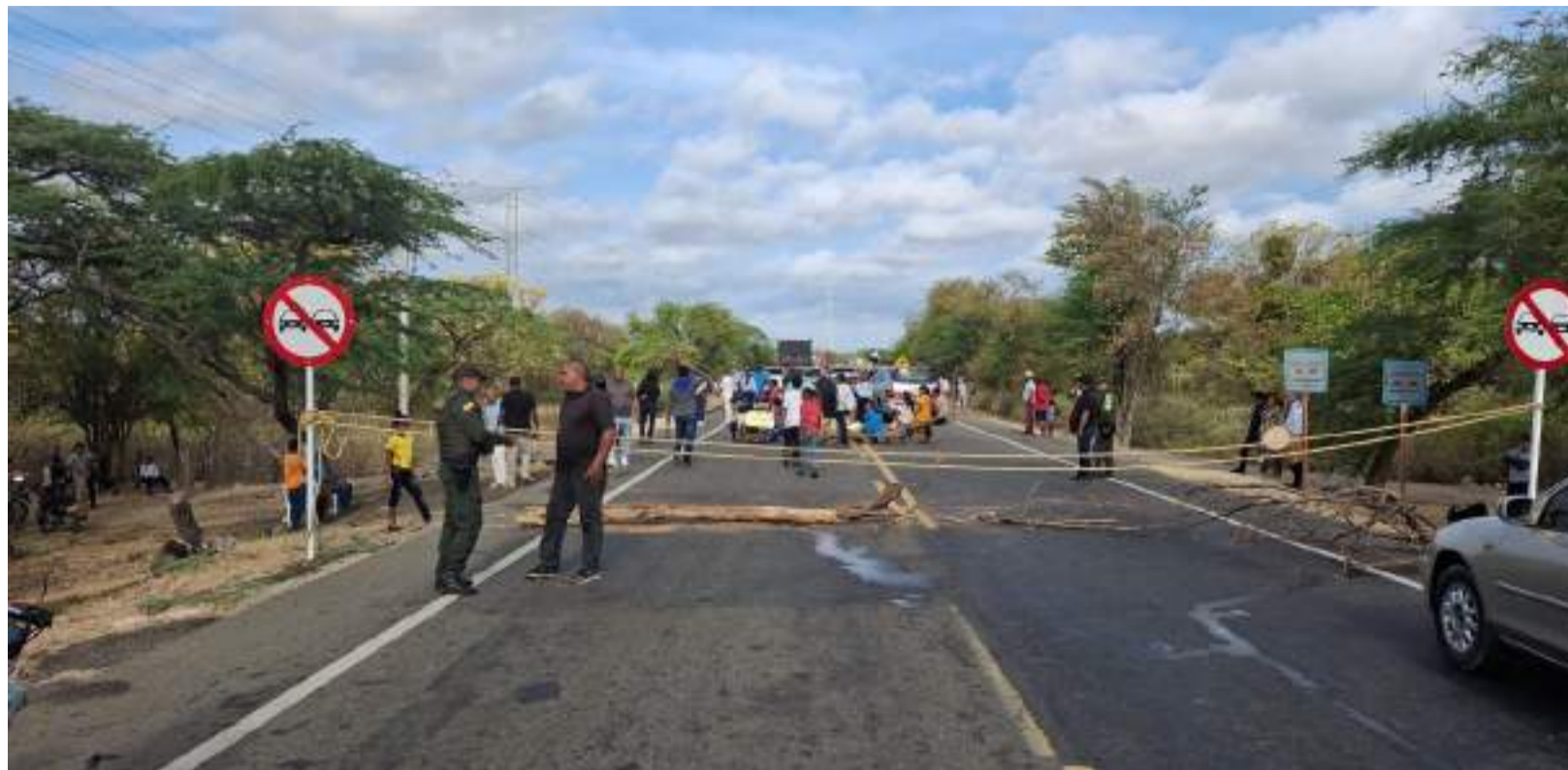
La población sufre los estragos del desempleo, el abandono estatal y la corrupción rampante.