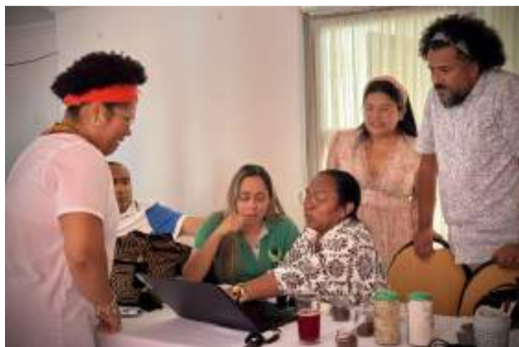
El resultado de estas indagaciones alimentará el Plan de Acción Estructural de la Sentencia T 302 de 2017.

metas de bienestar y desarrollo integral de la niñez en esta región”.