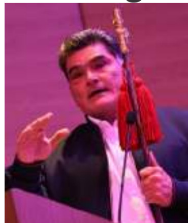
Procurador Gregorio Eljach recibe bastón de mando.

El gesto simbólico representa el respeto, la confianza y el compromiso mutuo entre el Mi-