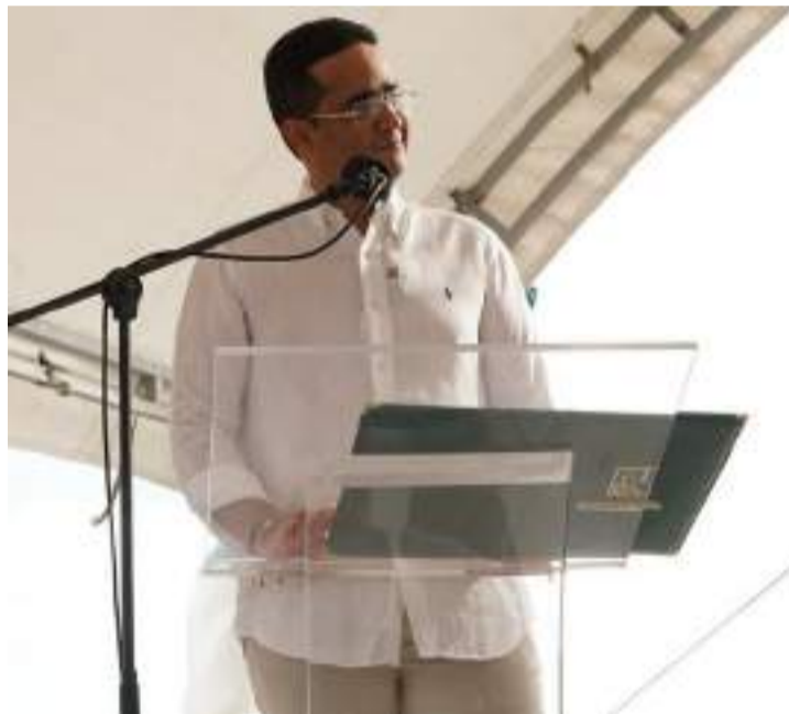
Se han identificado cuatro líneas de acción para potenciar Obras por Impuestos en La Guajira.

"Obras por Impuestos es una prioridad de nuestro Gobierno. Nos permite articular esfuerzos con el sector empresarial y entidades nacionales para cerrar brechas y enfrentar los desafíos que tenemos. Entre 2018 y 2023 se asignaron cerca de $63 mil millones en distintas iniciativas. Nuestra meta es que, al finalizar 2027, La Guajira haya duplicado, al menos, esas inversiones, y lo estamos logrando, trabajando en equipo con los contribuyentes, municipios, Gobierno nacional, especialmente con la Agencia de Renovación del Territorio, ministerios, y gremios como la Andi, con quienes conformamos la Mesa Departamental de Obras