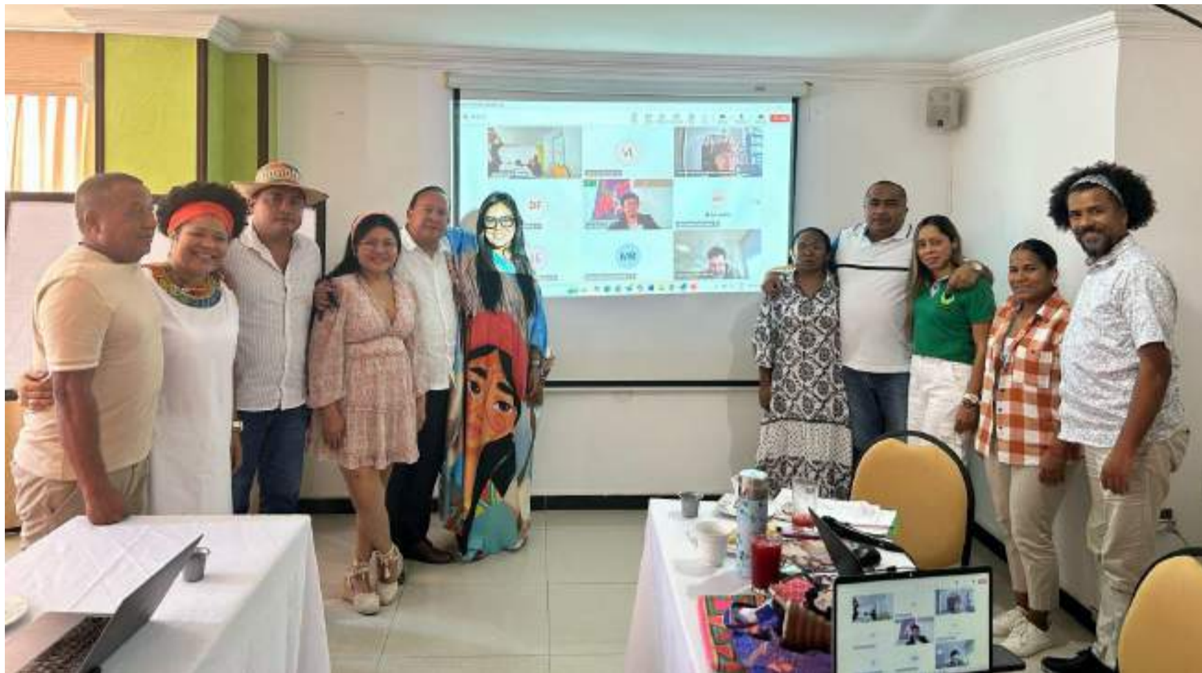
La CAC tiene como misión estudiar los determinantes sociales, culturales y ambientales de la desnutrición en La Guajira.

En cumplimiento de la Sentencia T 302 de 2017