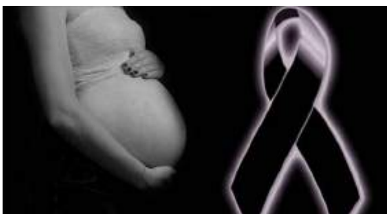
La mortalidad materna sigue siendo uno de los graves problemas de la población de La Guajira.

Todos los sectores en La Guajira, encabezados por los 16 hospitales públicos del primer nivel y los tres (3) hospitales regionales de 2° nivel, apoyados por la red de clínicas privadas como complementarias, debemos multiplicar nuestros esfuerzos para fortalecer la red, e integrar diversos actores, quienes, desde distintos puntos, podamos proveer tecnologías de punta que nos permitan ser prestadores de salud, abordando desde una manera efectiva y eficiente servicios de salud integrales. Aquí todos importan, cada persona representa una vida, familia y comunidad que tiene oportunidades de bienestar, y desde el empresariado debemos estar abiertos a aportar en que esto sea posible para que esto sea una realidad.