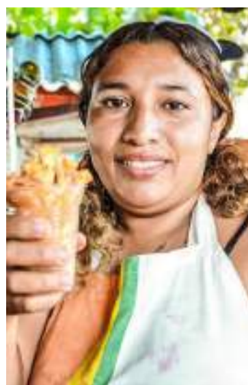
Fuero seleccionadas 200 familias beneficiarias.

Este proyecto tiene como objetivo activar rutas de acompañamiento social, entregar insumos