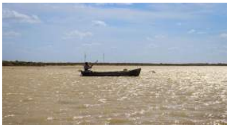
El objetivo principal de estas misiones es fortalecer el posicionamiento turístico del Departamento.

Con el firme propósito de seguir promocionando y posicionando turística-mente el Departamento, la Gobernación de La Guajira,