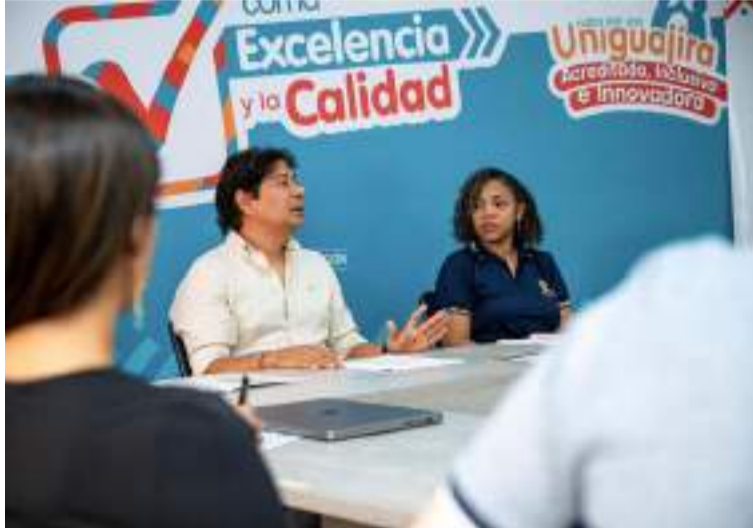
Se busca afianzar la educación de estudiantes y docentes con actividades académicas, investigativas y culturales.

También se pretende implementar programas