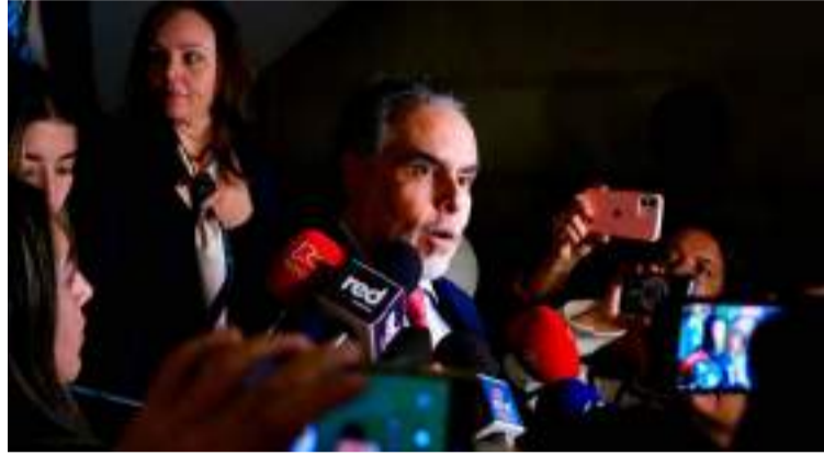
El presidente Petro con la firma de todos los ministros, puede pedir lo que es una consulta popular.

Reiteró que lo que busca la reforma laboral es que "se paguen las horas extras un poco más, un poco más los festivos, que las mujeres que tienen la menstruación puedan estar un poco más en sus casas, que los jóvenes que están en su primer trabajo, las prácticas, se les pague, que no se esclavicen. Básicamente era eso, no