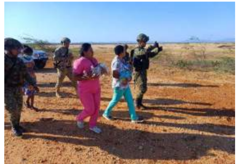
Con el apoyo de los militares, los niños y sus madres fueron embarcados en un helicóptero.

Al aterrizar en el Batallón Cartagena, en Riohacha, los menores fueron llevados de urgencia a la Clínica Renacer, donde actualmente reciben atención médica especializada para estabilizar