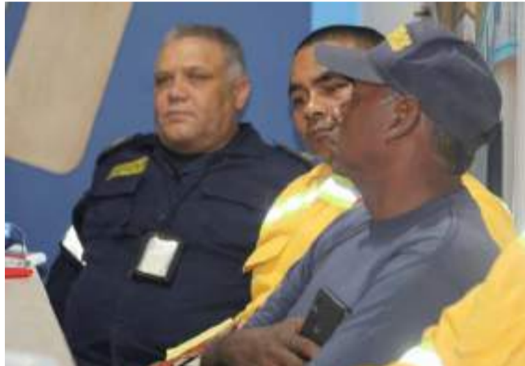
El comité busca la articulación entre los organismos de socorro y alcaldías para mitigar la emergencia.

El comité busca fortalecer la articulación entre los organismos de socorro y las instituciones locales para mitigar la emergencia y evitar la expansión del fuego. "Desde el sábado tuvimos conocimiento de que el foco del incendio se había desplazado a