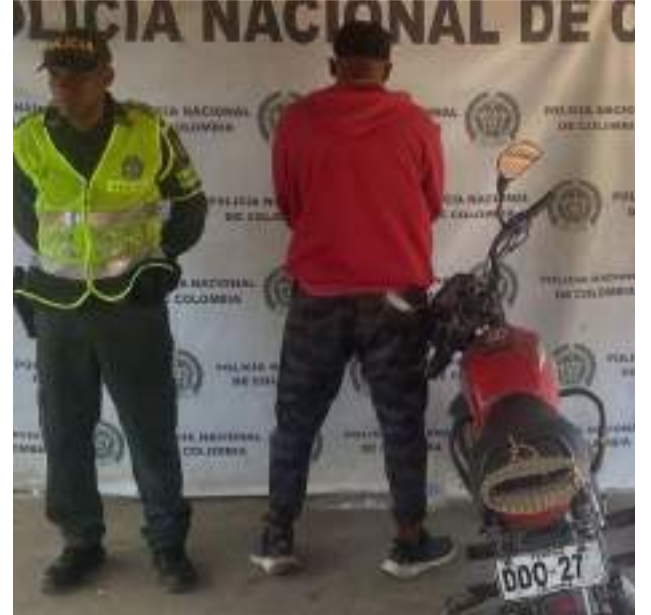
Las capturas de estas tres personas se realizaron por diferentes delitos, en operativos que se cumplieron en los corredores viales de la región.

La Seccional de Tránsito y Transporte de La Guajira sigue fortaleciendo los controles de seguridad en las vías de La Guajira, logrando en las últimas horas la captura de tres personas por diferentes delitos, en operativos realizados en los corredores viales de la región.