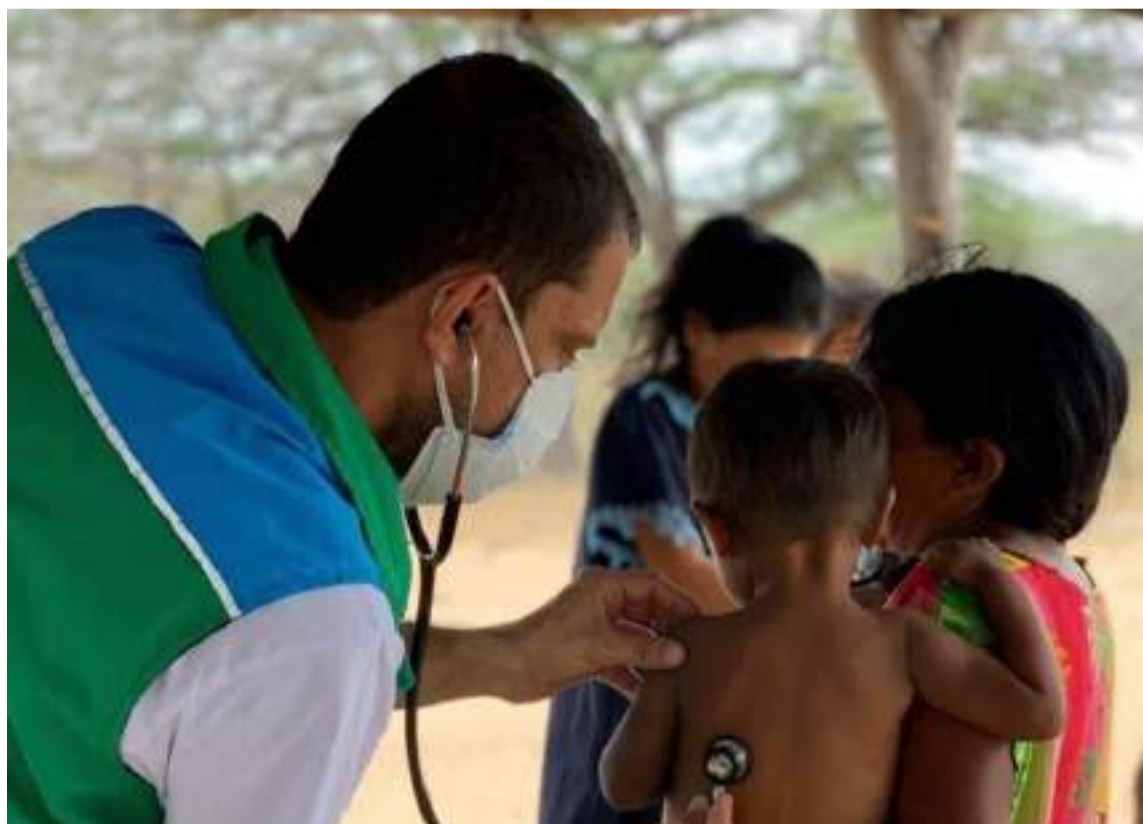
Los niños mueren de desnutrición mientras los politiqueros se reparten el poder.

La Guajira necesita dirigentes con verdadero compromiso y entiendan que gobernar es mucho más que administrar recursos o repartir cargos. Se requiere una visión integral de desarrollo donde la educación, la salud, la infraestructura y la generación de empleo sean prioridades reales. Es urgente que los políticos dejen de robar y se enfoquen en una gestión efectiva basada en transparencia y responsabilidad. El saqueo institucional debe detenerse, y para ello es fundamental que la sociedad civil se mantenga vigilante y exija cuentas a los gobernantes.