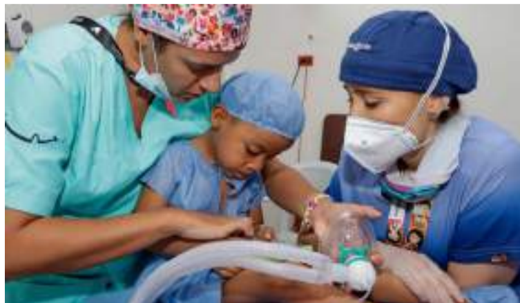
Se realizarán cirugías reconstructivas a 30 pacientes, en alianza con el Hospital Nuestra Señora de los Remedios.

"Desde hace 30 años creemos en el poder de las sonrisas, por eso nuestro propósito es transformar la vida a niños y niñas del país con labio fisurado y/o paladar hendido, pero no solo mediante cirugías, sino mediante una atención integral en salud. Es un orgullo para nosotros volver al departamento