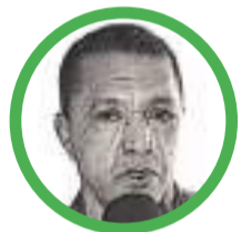
Por Rafael Humberto Frías Mendoza

rafaelhumbertofrasiamendoza226@gmail.com