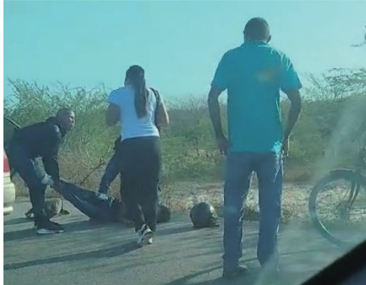
Los heridos fueron llevados a un centro asistencial de Riohacha donde se encuentran bajo observación médica.

Indicaron algunos testigos que los sujetos que dispararon en contra del hombre y el adolescente, huyeron hacia la zona enmontada llevándose una motocicleta.