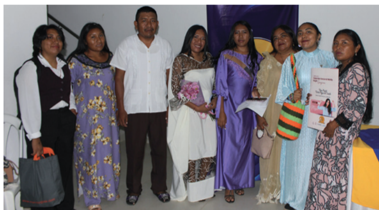
El colectivo wayúu que recibió el galardón Honor al Mérito, por su trabajo comunitario.

continuar la lucha hasta lograr la justicia y equidad con compromiso y resiliencia, para que las jóvenes encuentren en su voz y su poder la transformación social por la que se lucha.