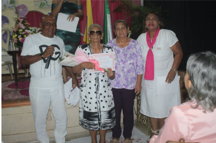
En desarrollo de la conmemoración se otorgó reconocimiento en nota de estilo a nueve mujeres.