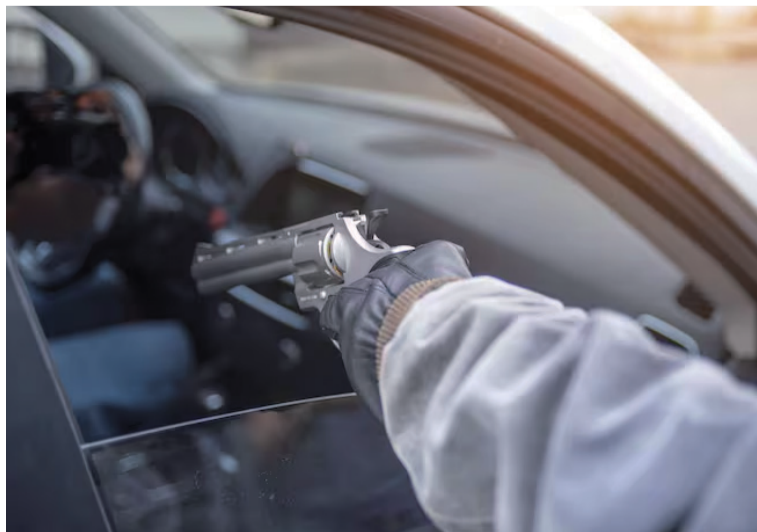
Este nuevo caso de inseguridad en la Troncal del Caribe ha generado preocupación entre los transportadores.

Un grupo de sujetos armados perpetró un atraco en la vía Maicao - Paraguachón, a la altura del kilómetro 81. Los delincuentes interceptaron un vehículo de servicio particular con varios pasajeros y los despojaron de sus pertenencias, en hechos registrados en horas de la mañana del domingo 9 de marzo.