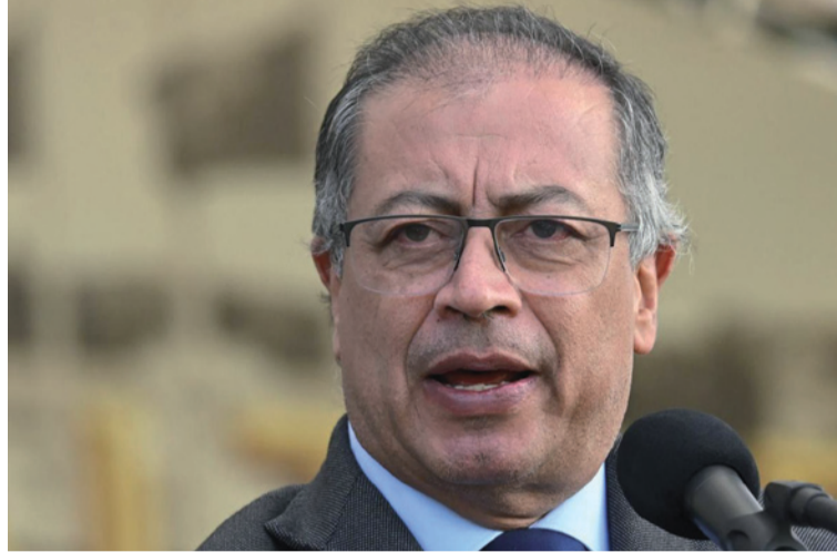
El mandatario enfatizó que es fundamental que los campesinos sean legítimos dueños de sus territorios.

En este contexto, el presidente hizo un llamado a la comunidad campesina, instándola a decidir entre continuar con economías ilícitas que generan violencia y desesperanza, o unirse al Gobierno en la búsqueda de una economía sostenible y productiva, orientada hacia la agroindustria y la