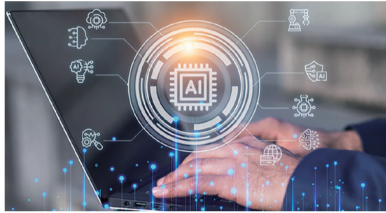
El país cuenta con 204 programas de educación superior activos, relacionados con esta tecnología.

"No se trata solo de incorporar tecnología en las aulas, sino de generar capacidades para que las