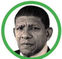
Por Martín López González