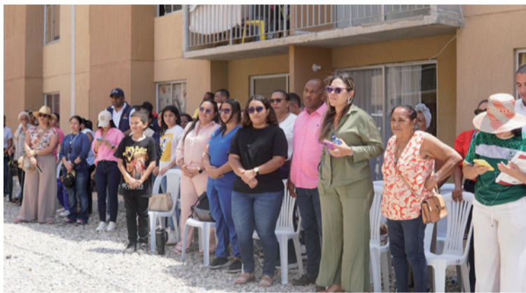
El acto de entrega de viviendas, lo encabezó el gobernador Jairo Aguilar y la viceministra de Vivienda.

de la Gobernación de La Guajira, su Gobernador y el Ministerio de Vivienda. Gracias al Gobernador. Y orgullo siento por aque-