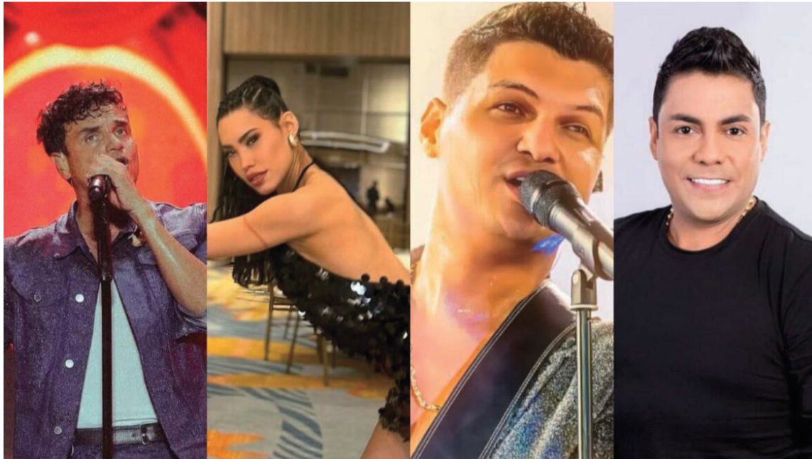
La ceremonia de premiación se llevará a cabo el próximo 24 de abril en Bogotá.