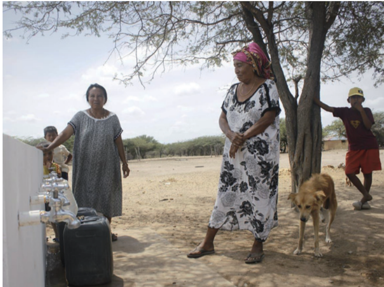
El proyecto fue financiado con más de $434 millones que aportó en su totalidad el Gobierno nacional.

La rehabilitación del sistema de agua potable de