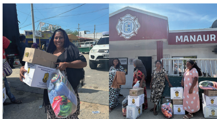
Las ayudas incluyen kits de alimentos y elementos de aseo y cocina para velar por la higiene y la salud.

Estas entregas de Asistencia Humanitaria se realizan en atención al Decreto de Calamidad Pública de Desastre Nacional 1372 del 13 de noviembre del 2024.