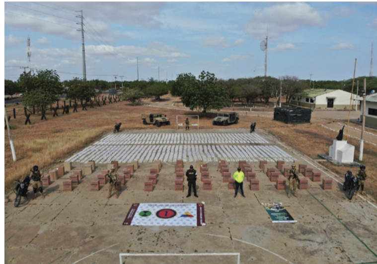
La mercancía aprehendida fue puesta a disposición de la Dirección de Impuestos y Aduanas Nacionales.

La Polfa hace un llamado a la ciudadanía para que apoyen la legalidad, adquiriendo productos en establecimientos autorizados y denunciando actividades ilícitas relacionadas con el contrabando, reiteramos nuestro compromiso en la lucha para combatir el contrabando e invitamos a denunciar cualquier irregularidad