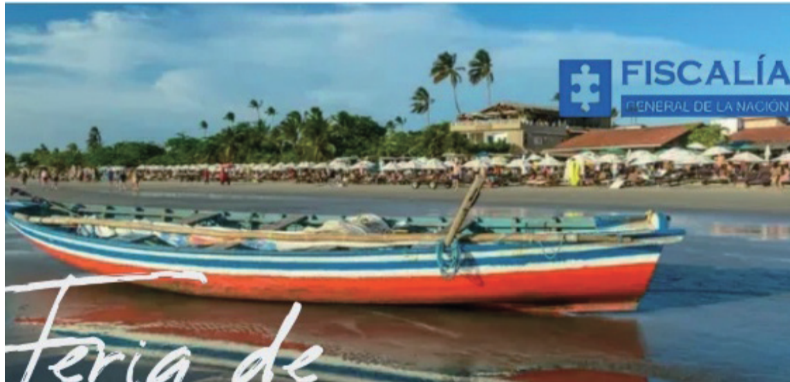
Uniguajira participará hoy en la Feria de Servicios organizada por la Fiscalía.

La Fiscalía seccional de La Guajira tiene el placer de hacerlos partícipes de la gran Feria de Servicios, un evento que busca fomentar de manera didáctica, que todos los