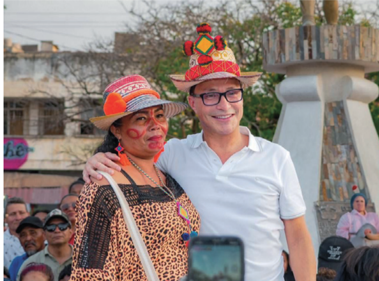
En la plaza Simón Bolívar, se dieron cita miles de personas provenientes de todo el Departamento.

La consulta está dirigida a todos los ciudadanos para que aporten sus iniciativas en el marco del proyecto de Nación que convoca a todos los sectores. En esta zona fronteriza, donde se viven tantas adversidades, lanzó un mensaje de unidad.