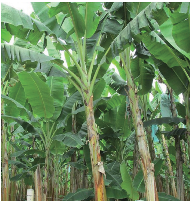
El área sembrada abarca cerca de 300 hectáreas, distribuidas en alrededor de 150 unidades productivas.

El área sembrada en las veredas priorizadas abar-