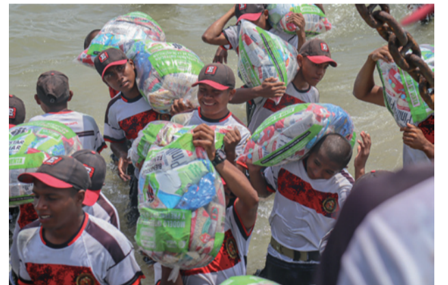
En esta ocasión, se transportan 130 toneladas de alimentos a bordo del buque ARC Golfo, de la Armada Nacional de Colombia.