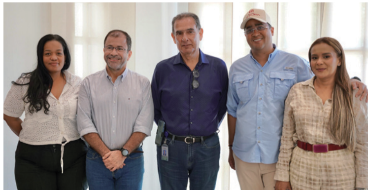
Aguilar destacó la importancia de la represa del Ranchería para mejorar calidad de vida de los guajiros.

"Estamos decididos a garantizar el suministro de agua 24/7 en Hatonuevo, Barrancas y Albania. Para ello, confiamos en el apoyo de Cerrejón, una empresa clave para el desarrollo de La Guajira", afir-