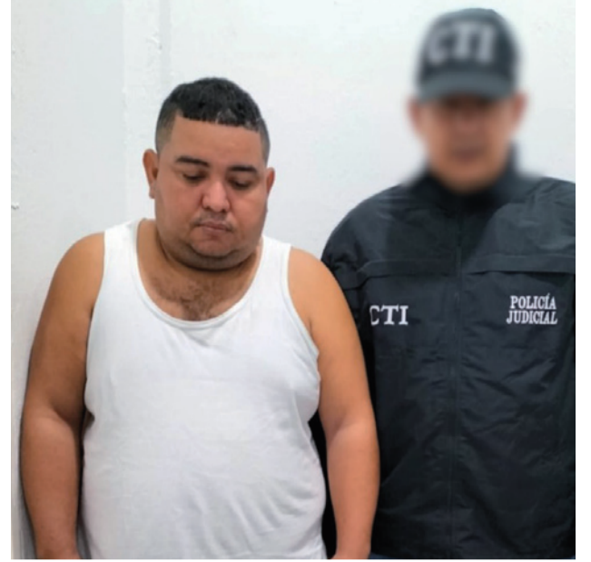
Los procesados no aceptaron los cargos y deberán cumplir medida de aseguramiento en establecimiento carcelario.

David Antonio Sierra Palacio fue asesinado el 5 de julio de 2023