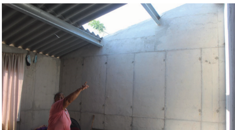
El fenómeno natural ocurrió cerca del mediodía, cuando fuertes vientos levantaron el Eternit.

Un inesperado torbellino generado por una fuerte brisa el sábado 8 de marzo, a eso de las 11:27 de