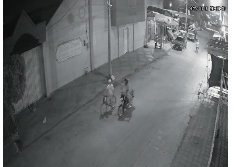
En el video quedó detallado que el sicario venía siguiendo a la víctima, y se le acercó y disparó.

El cadáver del extranjero fue trasladado hasta la morgue de Medicina Legal de Maicao en donde le practicaron la necropsia correspondiente. En el momento del ataque se