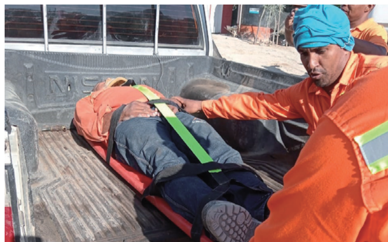
La capacitación estuvo acompañada de jornadas de simulacros para una mayor comprensión de los asistentes.