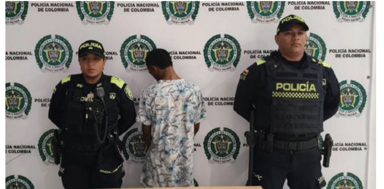
El capturado fue dejado a disposición de la Fiscalía URI de Riohacha por el delito de hurto.

En otro operativo, realizado en la calle 13 con carrera 18, fue recuperada una motocicleta marca Boxer, línea Bajaj, color negro, de placa DLU 62F, modelo 2016, la cual fue encontrada en vía pública. Tras la inspección, se evidenció que el vehículo presentaba alteraciones y deformidad en las características de sus guarismos de identificación, con el número de chasis