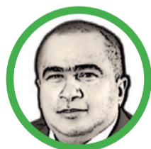
Por Arcesio Romero Pérez