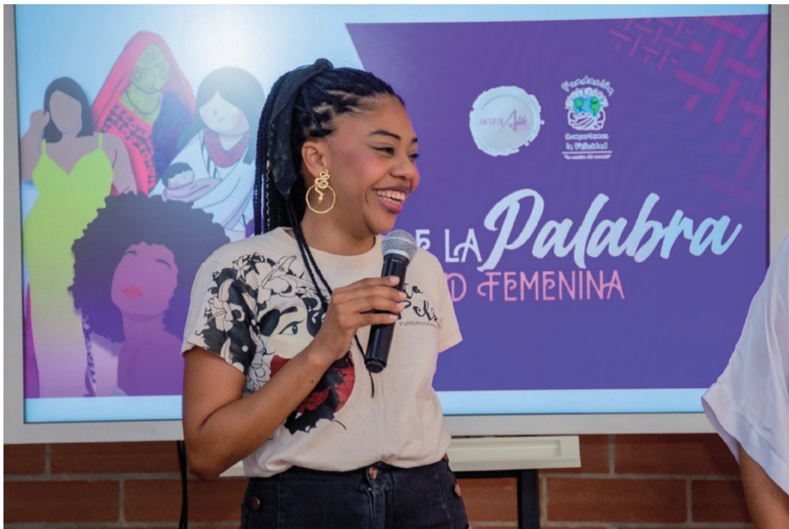
Identidad desde la estética, etnocomunicación, liderazgo, y derechos sexuales.

Desde niña se perfiló carismática, polifacética, comunicativa y dinámica. Convencida de lo necesario que era para su generación formarse, cruzó la frontera y estudió Licenciatura en Administración en la Universidad Rafael Belloso Chacín en la ciudad de Maracaibo. Posteriormente, ha adelantado estudios complementarios con el fin de fortalecer su perfil profesional, al tiempo que su gestión social se ha impulsado, gracias a los conocimientos obtenidos. Hoy cuenta con una amplia experiencia profesional que la ha llevado por varios rincones de Colombia, como: Bolívar, Córdoba, Atlántico, Magdalena, Cesar, San Andrés y Providencia y La Guajira. Mediante alianzas como existente con la red cultural del Banco de la República, ha estado en: Popayán, San Andrés y Bogotá en el Museo del Oro; también en Chocó y Antioquia siendo parte de proyectos de alto impacto, convirtiéndose en un referente departamental y nacional en temas de género, étnicos y afro. También