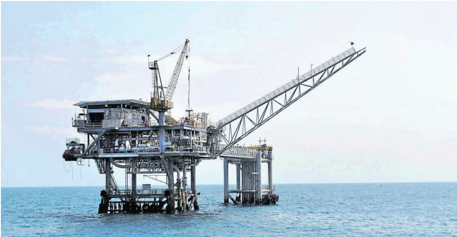
A las empresas distribuidoras de gas las inculparon como especuladoras y responsables de las altas tarifas de energía.