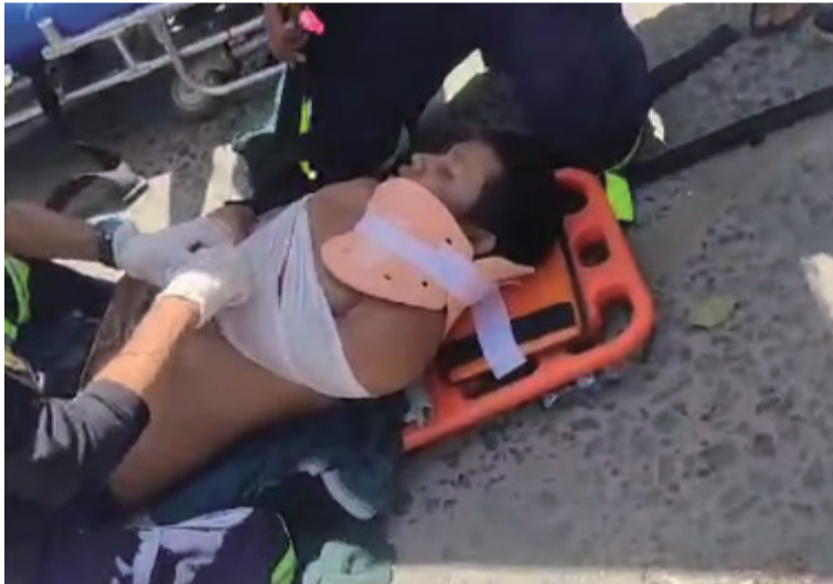
Se informó que debido al fuerte impacto, el conductor de la motocicleta resultó herido de gravedad.

Un fuerte accidente de tránsito tipo choque se registró en horas de la tarde del miércoles 5 de febrero en la carrera 7H con calle 34 entre una motocicleta y un camión, en la que el conductor de la moto resultó herido de gravedad.