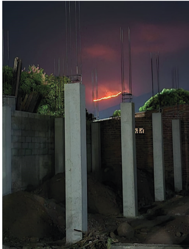
Debido a la magnitud del evento, se contempla la posibilidad de solicitar apoyo aéreo al Ejército Nacional.

Aunque aún no se ha determinado con exactitud la cantidad de hectáreas consumidas, los reportes iniciales de campesinos de la zona sugieren cifras que oscilan entre 12 y 19 hectáreas afectadas. La vegetación, compuesta principalmente por pastizales secos debido a la temporada de sequía, ha facilitado la rápida propagación del fuego impulsado por las fuertes brisas.