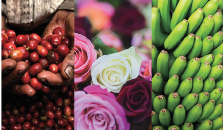
Las nuevas tarifas impuestas por Trump forman parte de una estrategia más amplia de proteccionismo económico.