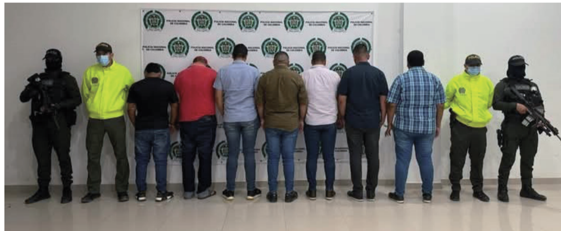
Según las investigaciones estas personas desviaban narcóticos para darlos a terceros.

Asimismo, se pudo conocer que en los próximos días se realizarán las audiencias para la legalización de captura e imputación de cargos de estas personas, detenidas la semana pasada en operaciones adelantadas por Fiscalía General de la Nación, en conjunto con la Policía Nacional y la agencia estadounidense DEA, quienes, a través de all-