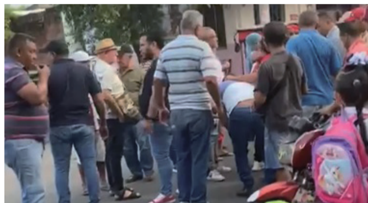
La moto era conducida por una mujer, que transportaba a dos menores a una institución educativa.

Cinco menores de edad resultaron con lesiones leves tras un accidente de tránsito ocurrido en la calle 14 con carrera 8 esquina, en el sector conocido como El Ceibote.