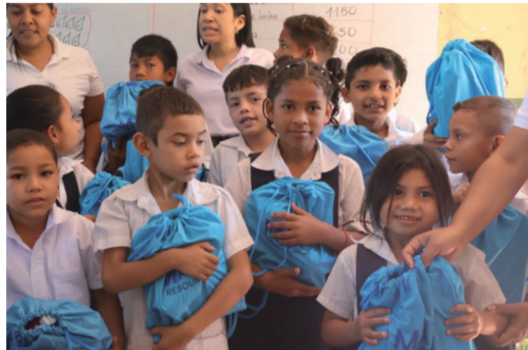
Las jornadas se enmarcaron en un ambiente de alegría y esperanza para los niños y niñas en su proceso educativo.

Las jornadas estuvieron marcadas por un ambiente de alegría y esperanza para los niños y niñas que avanzan en su proceso educativo, brindándoles un valioso apoyo para su desarrollo académico. Max es exploración sostenible que contribuye a la construcción de la Nueva Historia de La Guajira.