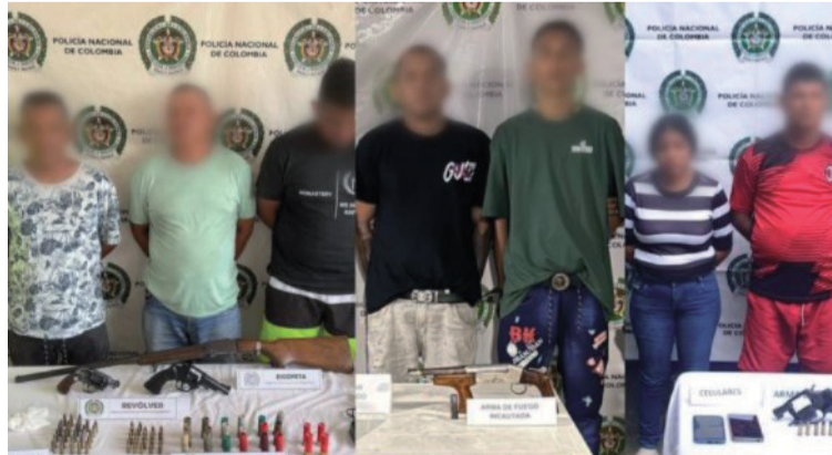
Los capturados están presuntamente vinculados a las bandas delincuenciales del 'Clan del Golfo' y 'Los Primos'.