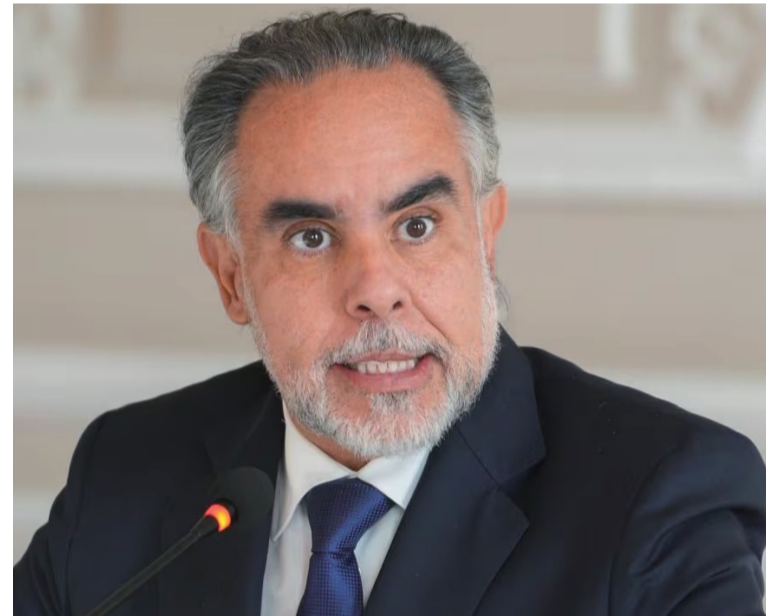
El MinInterior explicó que no cree que las mayorías se formen a través de prácticas clientelistas.

Respecto al papel del Congreso, Cepeda afirmó que se mantendrá la independencia del Senado, aunque la relación con Benedetti será de respeto mutuo. Por su parte, el ministro Benedetti rechazó las acusaciones que sugieren que su gestión se basará en la 'mermelada', subrayando que no cree que las mayorías se formen a través de prácticas clientelistas. Enfatizó que su principal objetivo es reorganizar la coalición de Gobierno y mejorar la comunicación entre el Ejecutivo y el Legislativo.