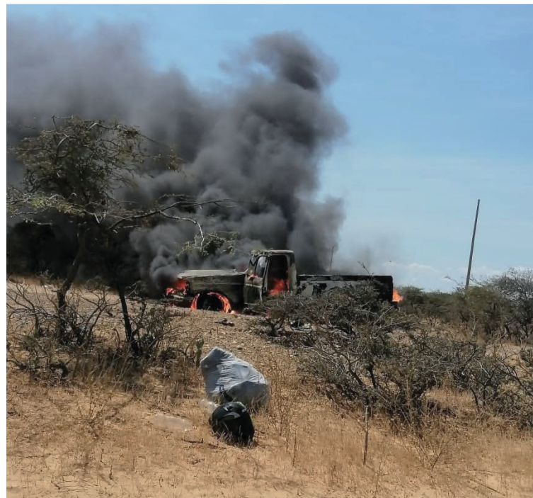
Se informó por parte de las autoridades que las llamas consumieron por completo el automotor.

Las autoridades llegaron hasta el lugar de los hechos para indagar lo sucedido y verificar que los daños solo hayan sido materiales por el incendio del camión. Se espera conocer cuáles fueron las causas reales que ocasionaron las llamas.