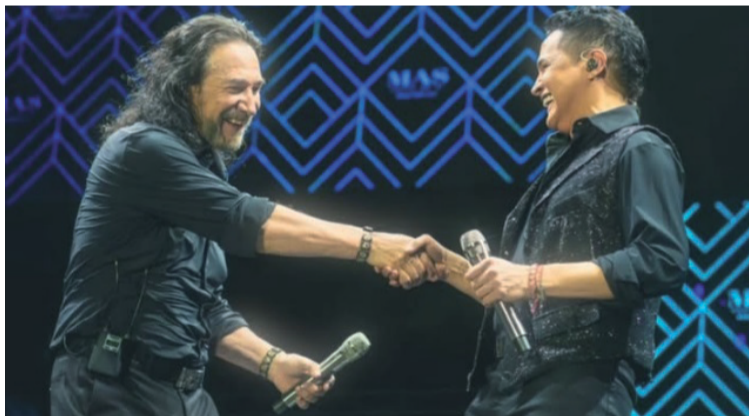
Los dos artistas pusieron a vibrar al maravilloso público paraguayo que se deleitó por más de cinco horas.

Celedón, quien fue aclamado en la Feria del Sol en Mérida (Venezuela); aplaudido en Asunción (Paraguay), y ovacionado el lunes 3 de marzo en Puerto Ordaz (Venezuela), sigue abanderando el vallenato internacional en América Latina, llenando los mejores escenarios y mostrando ese gran po-