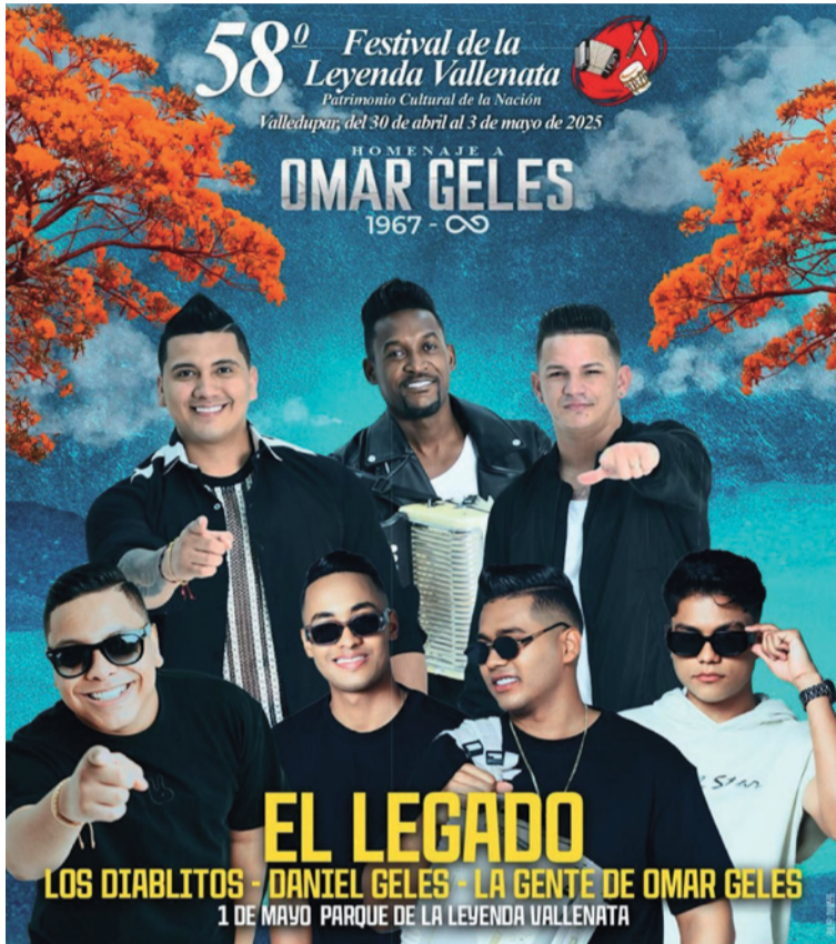
Este año, el certamen rendirá un homenaje al Rey Vallenato Omar Geles, destacado compositor y acordeonero.

✓ Los Diablitos: Agrupación fundada en 1983 por Omar Geles y el vocalista Miguel Morales, este