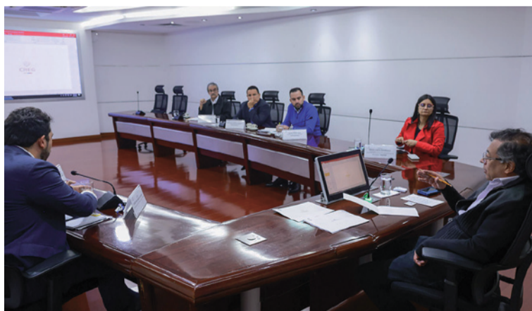
Se evaluó la sostenibilidad en los temas de gas y los resultados de la intervención de la empresa Air-e.