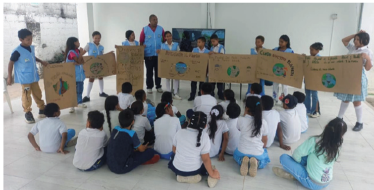
Se realizaron actividades pedagógicas en diversas instituciones educativas del departamento de La Guajira.

En el Corregimiento de Rioancho, estudiantes de 2do a 6to grado del Centro Educativo Rural participaron en una actividad lúdica en la que participó el Grupo Cereambiente. Allí se destacó el compromiso de la comunidad educativa