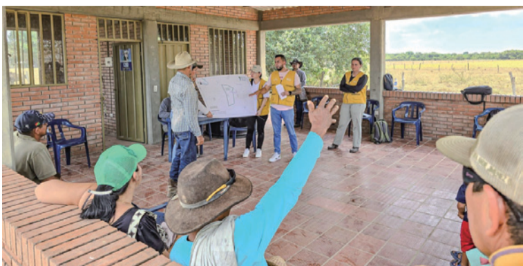
Se busca emitir los reglamentos de uso y manejo sobre esos bienes de uso público en favor de la comunidad.

Con el objetivo de reglamentar alrededor de 8.200 hectáreas de bienes