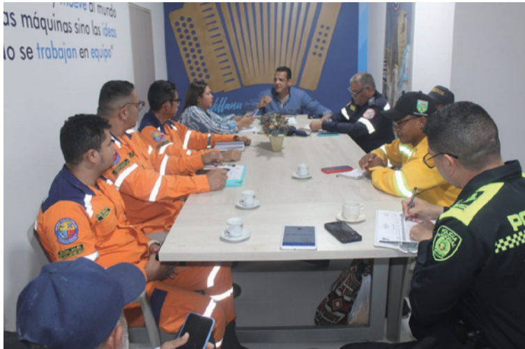
Las autoridades locales continúan en alerta y trabajando para contener la emergencia y mitigar impactos.

Las autoridades locales continúan en alerta y trabajando en conjunto con los organismos de socorro para contener la emergencia y mitigar sus im-