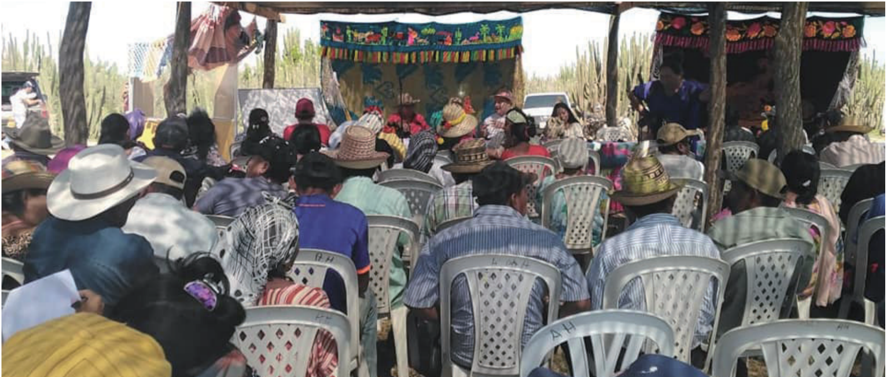
Al parecer el Mesepp ha estado trabajando sobre datos y no sobre la estructuración de información para tomar las mejores decisiones.

No se logró establecer la diferencia entre dato e información