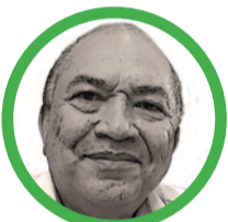
Por Amylkar Acosta Medina