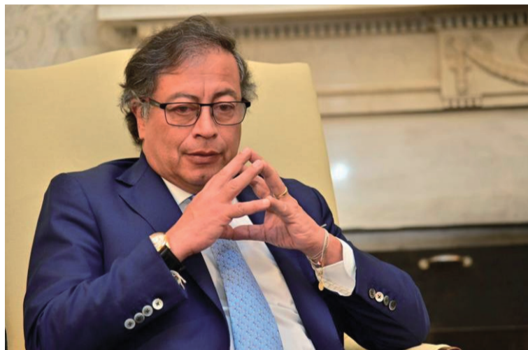
El mandatario aseguró que la prohibición de la marihuana en Colombia solo trae violencia.

"Le solicito al Congreso de Colombia legalizar la marihuana y sacar este cultivo de la violencia. La prohibición de la marihuana en Colombia solo trae violencia", escribió el mandatario en su cuenta de X. Además, pidió a los gobiernos del mundo que