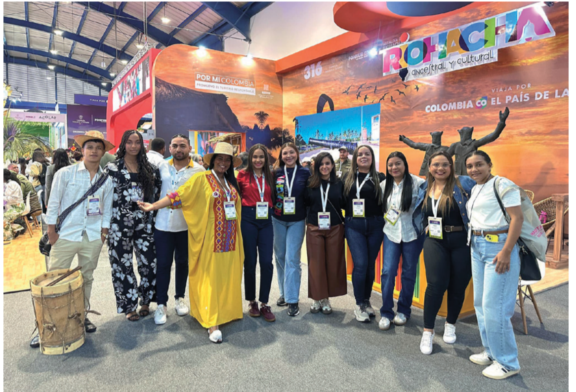
Los estudiantes adquirieron experiencia en el relacionamiento con el sector empresarial.

guajira ratifica su compromiso con la formación de profesionales que impulsen el desarrollo turístico sostenible y la competitividad de La Guajira en escenarios nacionales e internacionales.