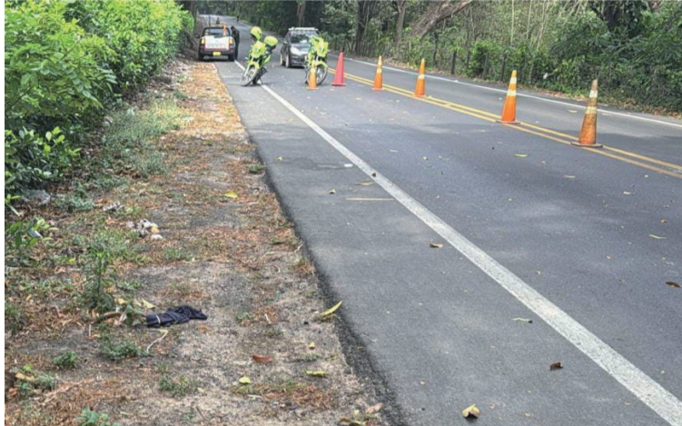
El cuerpo de la víctima fue encontrado a un costado de la vía en la Troncal del Caribe en jurisdicción de Dibulla.

El hallazgo del cuerpo se presentó en horas de la mañana del sábado 1 de marzo en la vía Río Palomino - Riohacha a la altura del