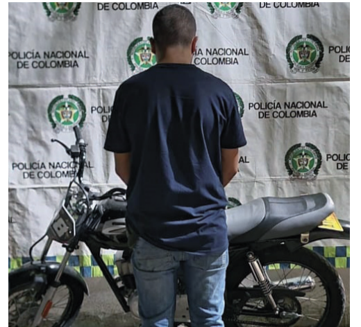
Se logró la captura de tres personas implicadas en receptación de vehículos y falsificación de documentos.

culo tenía una orden de inmovilización vigente por el delito de hurto, registrada el 30 de agosto de 2018 en la Fiscalía SAU de Bucaramanga. Por tal motivo, Pulgarín Suárez fue capturado por el delito de receptación y puesto a disposición de la Fiscalía en turno URI San Juan - La Guajira.