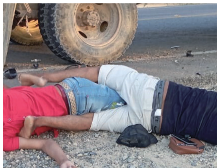
El fuerte impacto dejó a la moto incrustada en la puerta, mientras que los dos ocupantes fueron auxiliados.

Se espera el pronunciamiento por parte de las autoridades competentes para conocer mayores detalles de esta operación y determinar si hay más uniformados y personas civiles involucradas en estos actos delictivos.