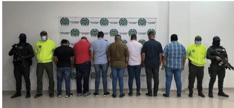
Esta red criminal manipulaba incautaciones de drogas para venderlas a grupos dedicados al narcotráfico.

Los capturados son dos subintendentes identifica-