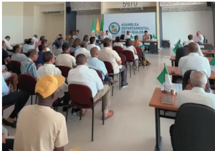
El secretario general con su equipo de trabajo adecuó el espacio con todos los servicios requeridos.

La decisión está fundamentada en que el edificio de la Lotería de La Guajira, donde sesiona la Asamblea, viene siendo