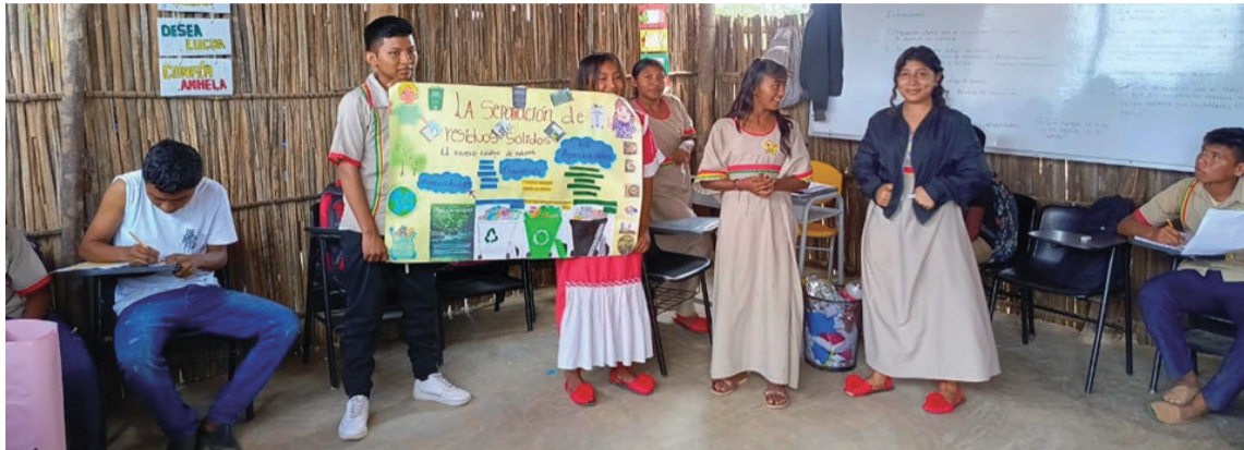
Estudiantes de grado noveno fueron los encargados de llevar a cabo esta presentación.

El punto de partida fue una jornada de educación ambiental centrada en la promoción de la lectura de literatura ecológica, abordando el tema de separación en la