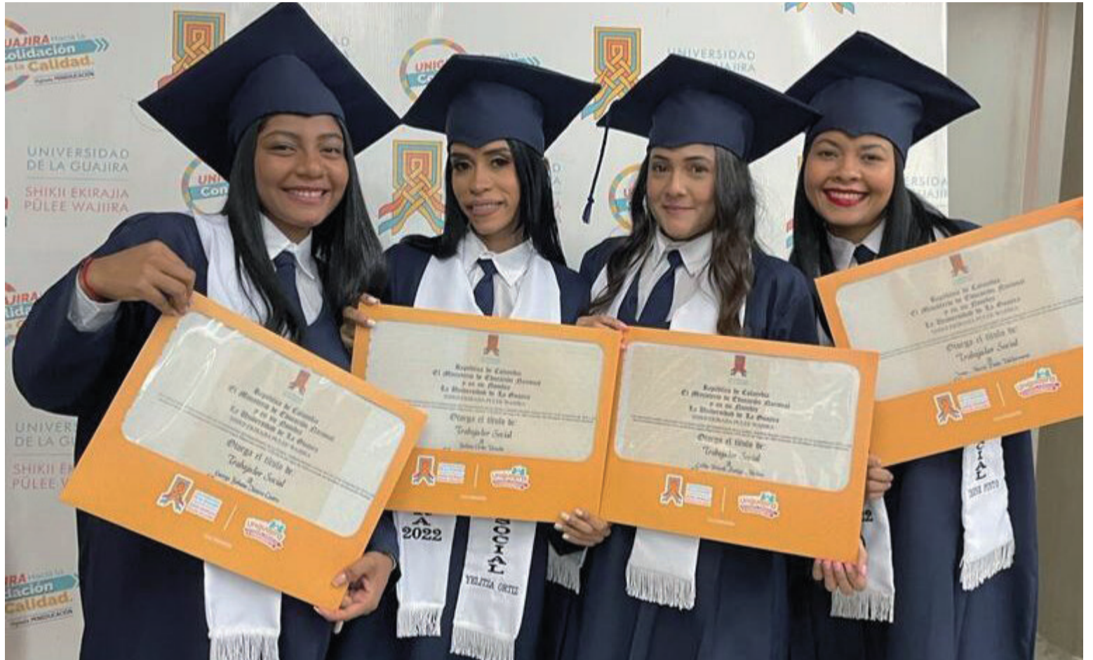
El título universitario es un principio de habilitación para iniciar el ejercicio de la carrera profesional.

Las acumulaciones de títulos profesionales, en cabeza de determinadas personas, utilizado en competencias o aspiraciones, de cargos públicos, no siempre acredita calidad, aun cuando estén condicionados a exigencia de requisitos (títulos), desplazando o subutilizando las experiencias de otros, en favor propios, desconociendo personas aspirantes, con tradición de antecedentes, positivos y efectivos, pero no ostentar título universitario de especialización, que tiene un aprendiz, que se ha dedicado a estudiar, durante más de 10 años