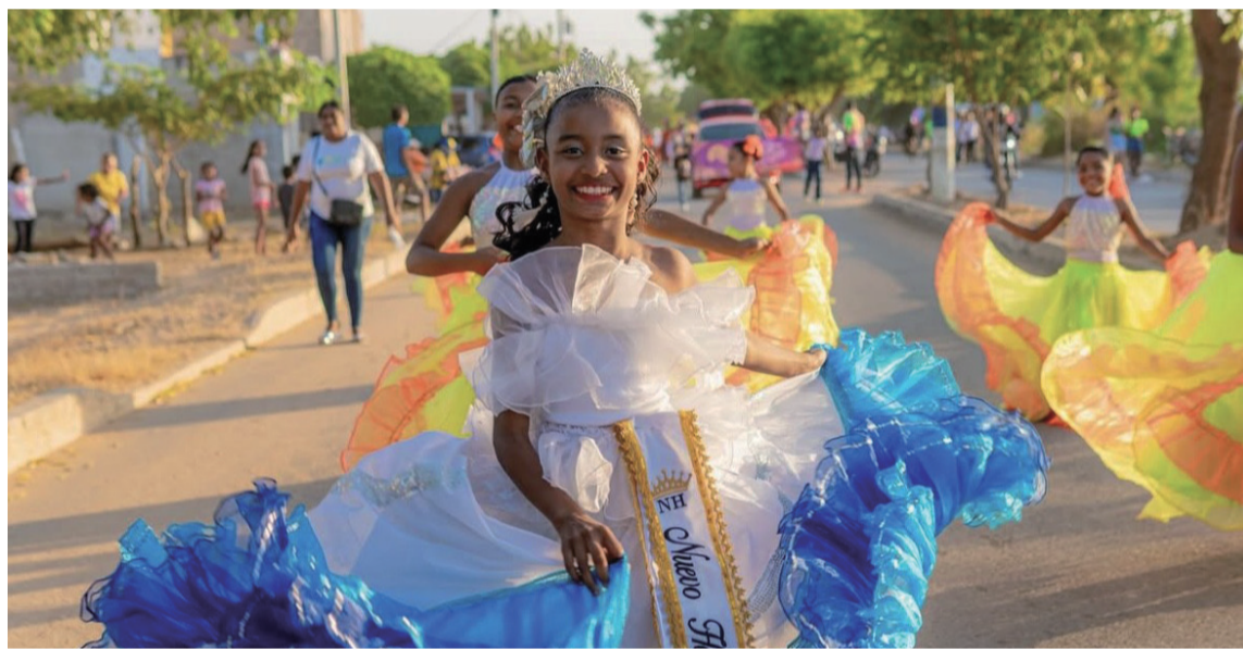
Las comparsas de niños disfrutaron del carnaval de Riohacha.