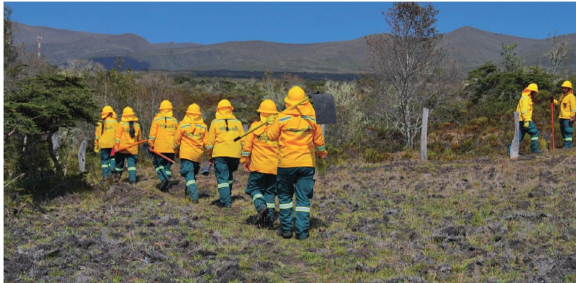
Las brigadas controlaron 67 conatos de incendios en 46 veredas del territorio nacional.

Las acciones tempranas de las brigadas permitieron la atención y control de 67 conatos de incendios en 46 veredas del territorio nacional. Adicionalmente, lideraron más de 1.500 espacios de apropiación social, enfocados en la prevención de incendios forestales, impactando a 8.000 personas de las comunidades rurales, que realizaron 30.000 reportes de seguimiento y monitoreo de incendios en los departamentos de Antioquia, Bolívar, Sucre, Santander, Córdoba, Chocó, Boyacá, Huila, Ca-