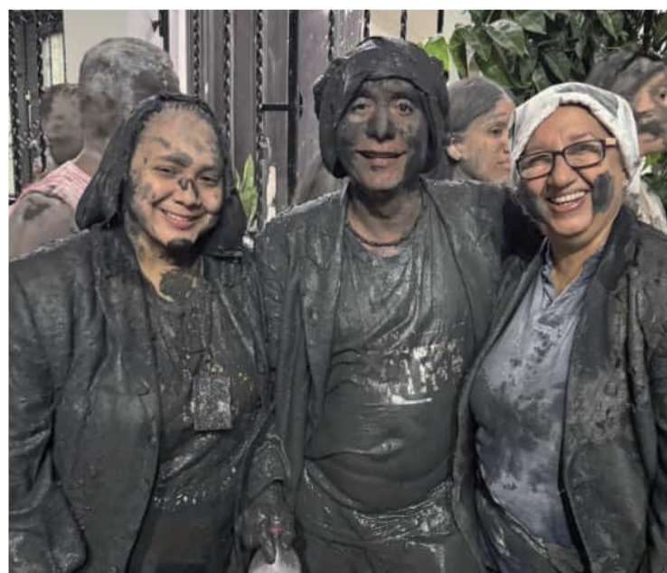
Los Embarradores de Riohacha son íconos del Carnaval del Distrito de Riohacha.