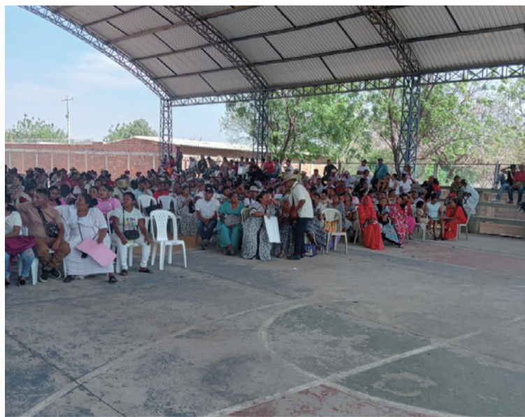
En la asamblea se ratificó la exigencia de la comunidad de mantener la actual red de prestadores.

Uno de los puntos más importantes del evento fue la participación de la Epsi, en cabeza de su delegado, quien en su intervención dejó claro que la entidad respetará la decisión de la comunidad y