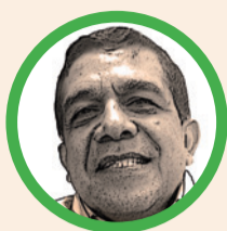
Por Hernán Baquero Bracho