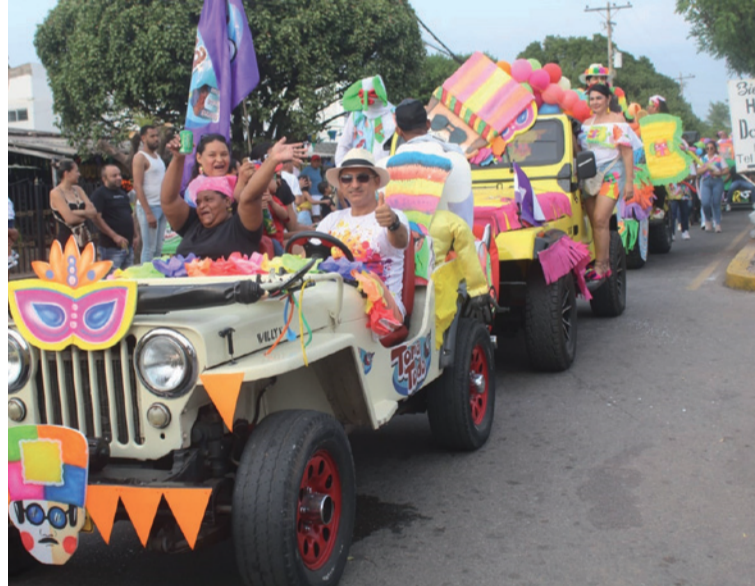
Villanueva sigue posicionándose como un municipio que apuesta por la creatividad y la inclusión.