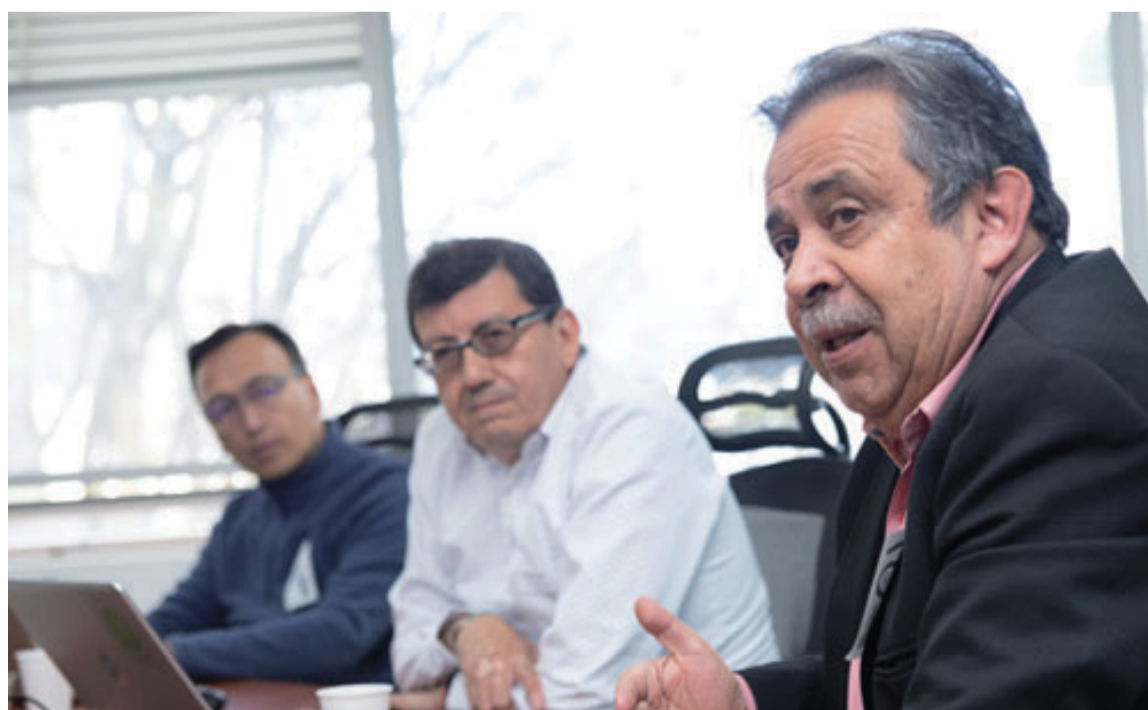
El avance de los Pdet ha sido fundamental para la mejora de las condiciones de vida.

La ART hace un llamado a todos los actores del país a respaldar esta iniciativa, que representa una oportunidad histórica para consolidar la paz y el desarrollo en las regiones más afectadas por el conflicto armado y la desigualdad social.