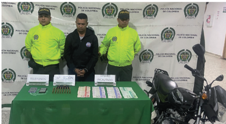
La Policía Judicial señala que alias 'Pava' sería un presunto dinamizador del tráfico de estupefacientes.

El operativo se llevó a cabo mediante diligencia judicial de allanamiento y registro en un inmueble ubicado en la calle 35B con carrera 13B, en el barrio