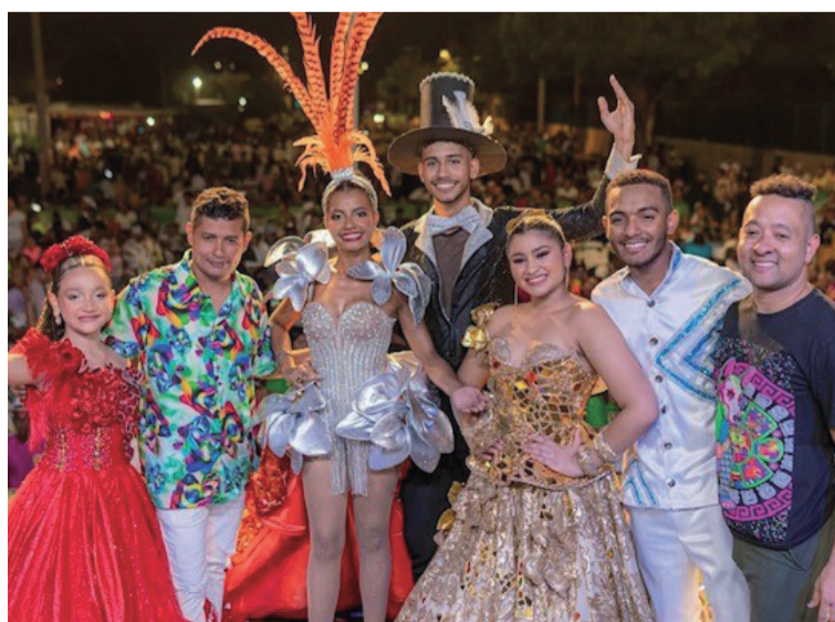
Las reinas del carnaval de Riohacha, se lucieron uno a uno en cada evento en el que participaron.