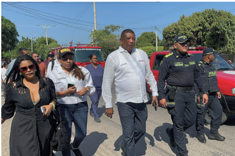
El alcalde ratificó la emisión de un decreto que prohíbe el uso de capuchas, incluso para la Policía Nacional.

La protesta, convocada por los mismos comerciantes, contó con el acompañamiento de la