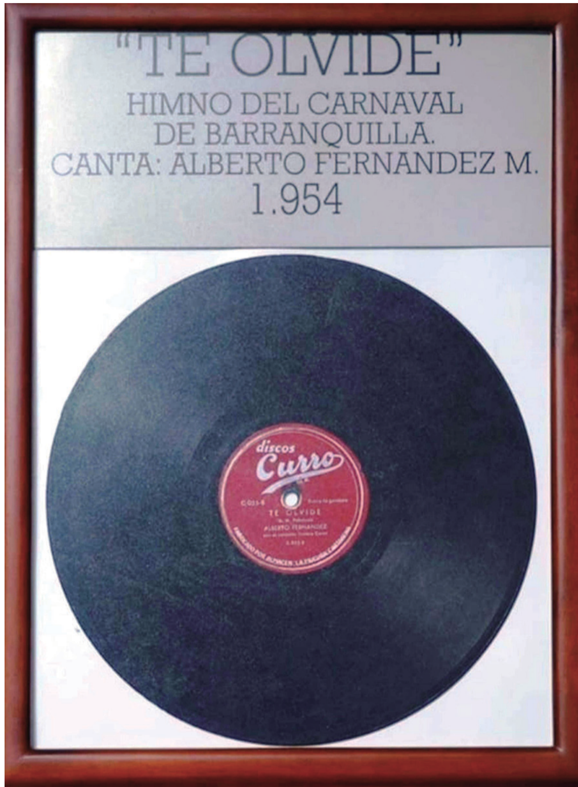
Disco 'Te olvidé' grabado en el año 1954.

El cantante de un metro con 80 centímetros de estatura, de ojos azules, herencia de su abuelo José Antonio Mindiola, quien era de procedencia holandesa, siguió extasiándose con las añoranzas de sus