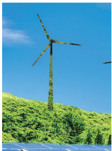
La entidad reitera su apoyo al sector energético.

La Procuraduría General de la Nación emitió una circular con el objetivo de promover un sector energético que favorezca el desarrollo sostenible y la competitividad nacional, una acción enmarcada dentro de los esfuerzos por garantizar una transición energética que equilibre la soberanía energética con el impacto ambiental, social y económico de los proyectos energéticos en Colombia.