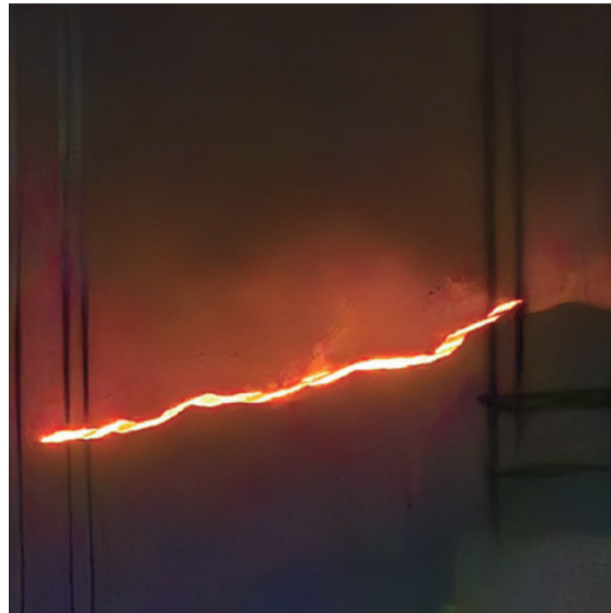
Las altas temperaturas y los fuertes vientos han complicado la emergencia.

Las altas temperaturas y los fuertes vientos han complicado la emergencia, impidiendo que las llamas disminuyan. La comunidad hace un llamado urgente a las autoridades para que intervengan y eviten que el incendio se expanda aún más, poniendo en riesgo la biodiversidad y los asentamientos cercanos.