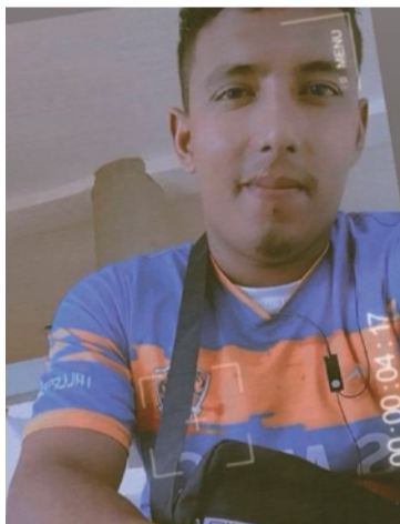
Estas dos personas fueron auxiliadas, pero lamentablemente fallecieron debido al fuerte impacto contra la vaca.

El levantamiento de los cadáveres estuvo a cargo de los miembros del