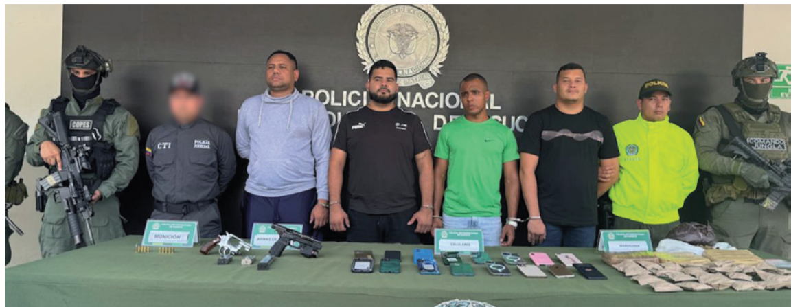
Los procesados compraron dos motocicletas y las llevaron al parqueadero de un hotel.