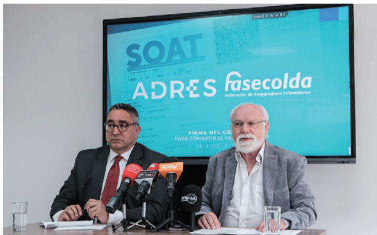
La Adres indicó que, tras las inspecciones realizadas en 2024, no se encontró evidencia física de 52 IPS.

Las auditorías realizadas por la Adres revelaron que el Caribe colombiano fue una de las regiones más afectadas por este esquema fraudulento, con IPS inexistentes registradas en 28 municipios de At-