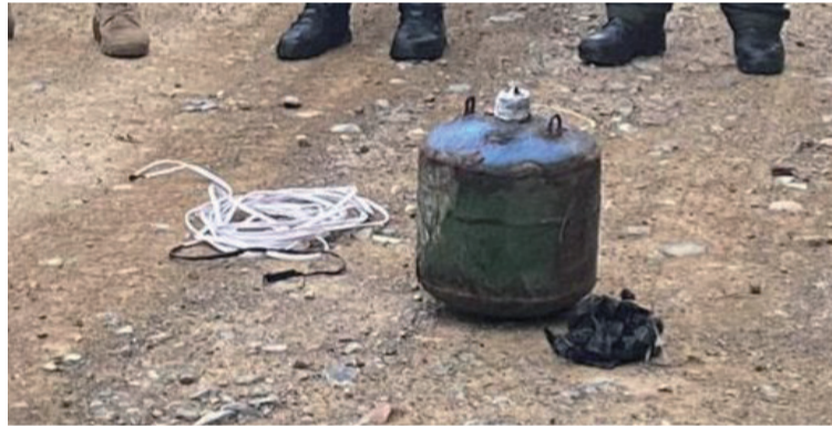
El Ejército Nacional reafirma su compromiso con la seguridad y estabilidad del territorio.

Este tipo de artefactos explosivos improvisados representa un grave peligro para la población civil,