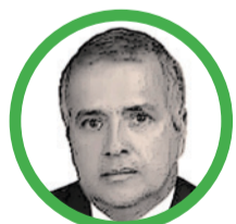
Por Rubén Darío Ceballos Mendoza