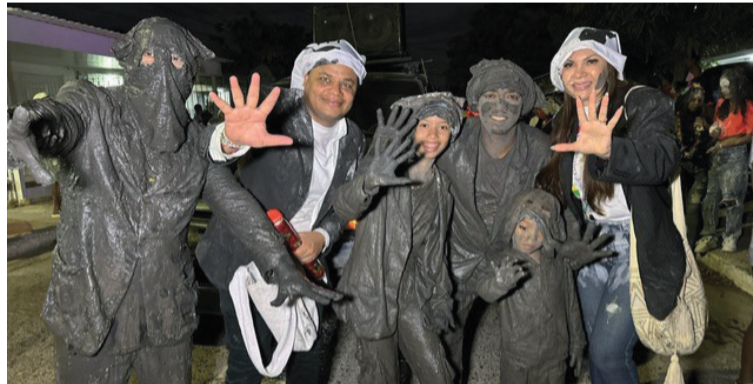
El alcalde reconoció que los riohacheros y visitantes mostraron su respeto por la ciudad y sus tradiciones.

Durante los desfiles de carrozas y comparsas, el desfile de la confraternidad, la coronación de la reina de la comuna 10 y la reina Lgbti, y el emblemático pilón de Los Embarradores, quienes además fueron homenajeados como íconos del Carnaval;