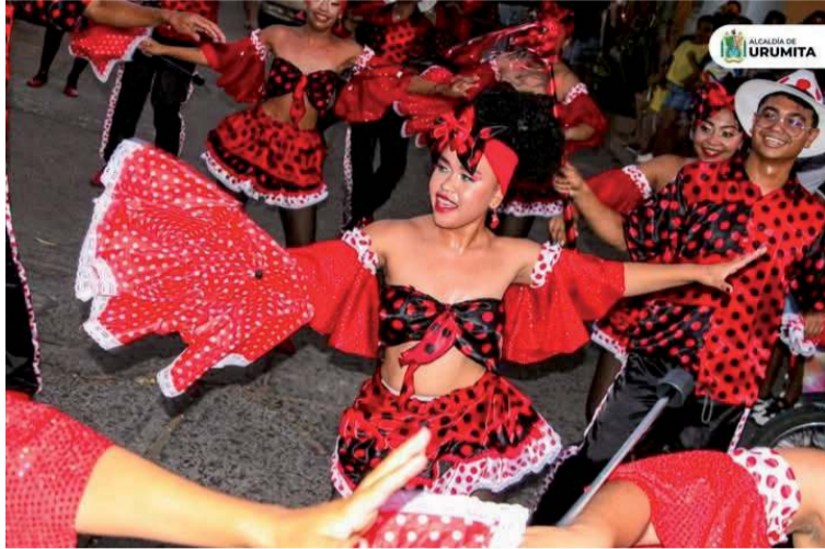
Propios y turistas disfrutaron de un espectáculo lleno de ritmo y folclor y un espacio de unión y celebración.

Los habitantes y turistas disfrutaron de un espectáculo lleno de ritmo y folclor, reafirmando el Carnaval como un espacio de