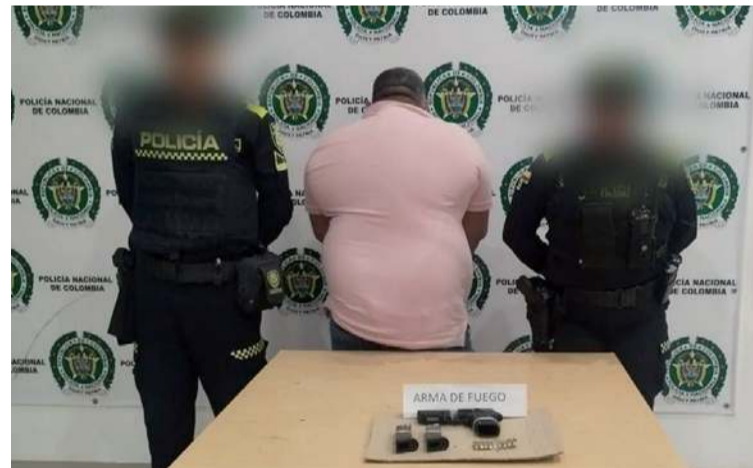
La Policía detuvo a un ciudadano que se encontraba en un vehículo realizando disparos al aire en vía pública.

Al llegar al sitio, los uniformados identificaron un automóvil Toyota Cor-