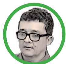
Por Luis Hernán Tabares Agudelo