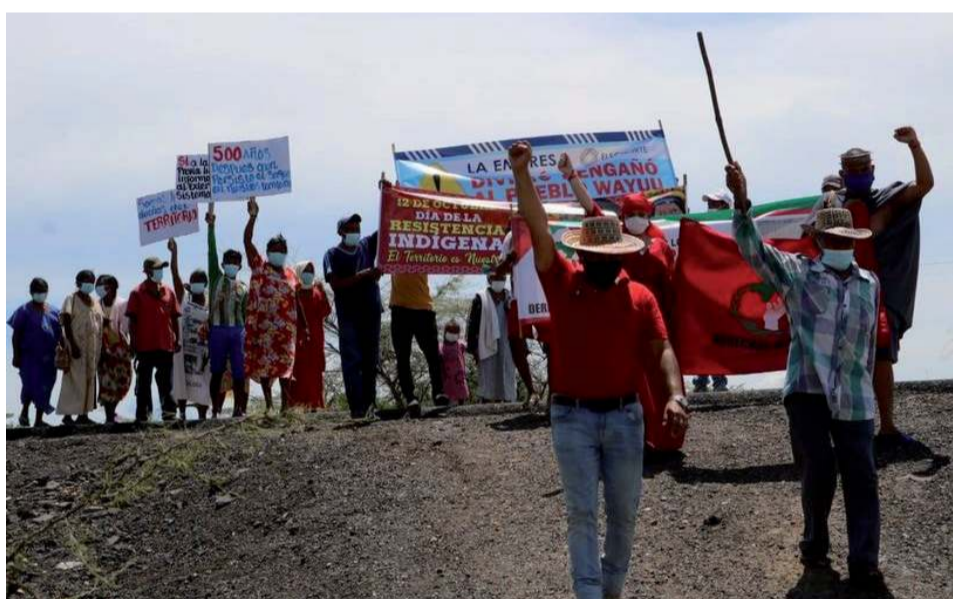
La acción permitirá buscar el restablecimiento de los daños.

La firma de este convenio representa un compromiso renovado hacia la gestión sostenible de los recursos naturales en La Guajira, reforzando la importancia de la colaboración interinstitucional para enfrentar los retos ambientales actuales y futuros.