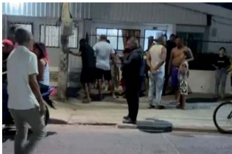
Por ahora las autoridades continúan las investigaciones para determinar qué tipo de material explosivo era.