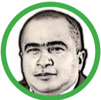
Por Arcesio Romero Pérez

Nuestras elecciones tienen un toque especial de surrealismo, clientelismo, compra de votos y manipulación.