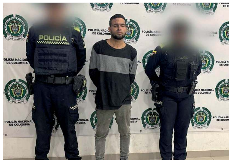
Esta persona tenía en su poder una bolsa con 100 cigarrillos artesanales de marihuana.

La Policía Nacional, en el marco de sus acciones operativas para combatir el microtráfico en el departamento de La Guajira, logró la captura de un individuo que portaba varias dosis de marihuana en el Distrito de Riohacha.