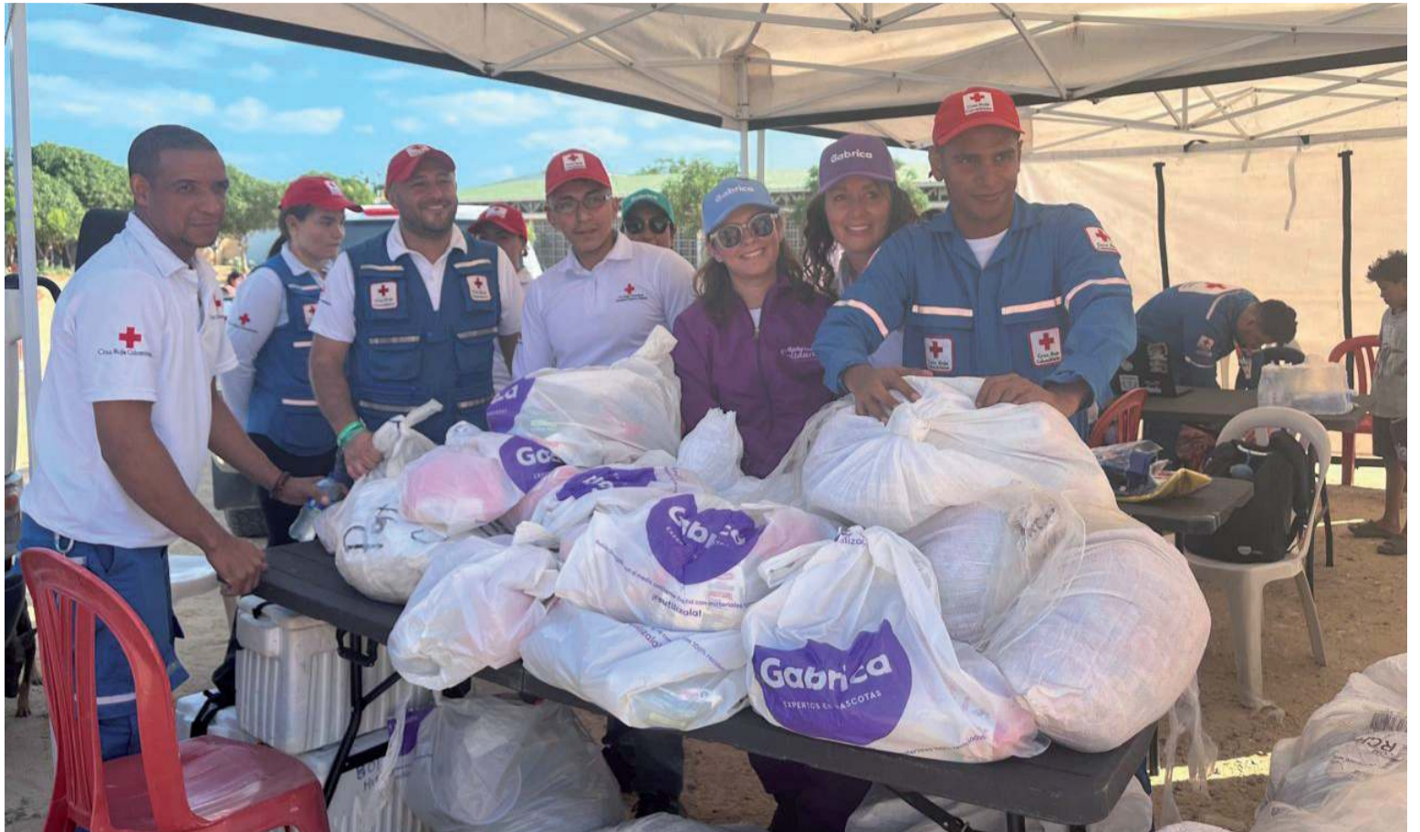
El éxito fue gracias a la coordinación de la Cruz Roja y organizaciones comprometidas con el desarrollo sostenible.

El éxito de esta jornada fue posible gracias a la coordinación de la Cruz Roja y otras organizacio-