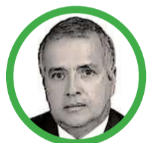
Por Rubén Darío Ceballos Mendoza