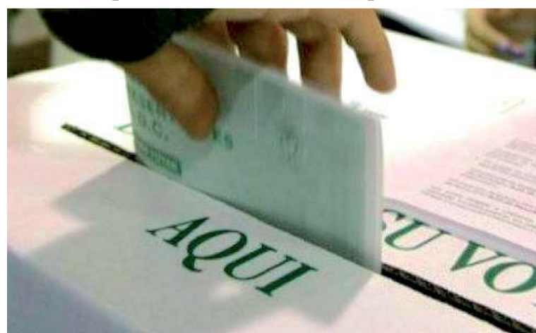
Los partidos y movimientos políticos definirán a sus candidatos para las elecciones de 2026.

El Consejo Nacional Electoral (CNE) ha establecido que el 26 de octubre de 2025 se llevarán a cabo las consultas populares, internas o interpartidistas, donde los partidos y movimientos políticos definirán a sus candidatos para las elecciones de 2026. Los partidos y movimientos con personería jurídica o grupos significativos de ciudadanos interesados en utilizar este mecanismo deben notificar al CNE antes del 26 de julio de 2025. Para llevar a cabo la