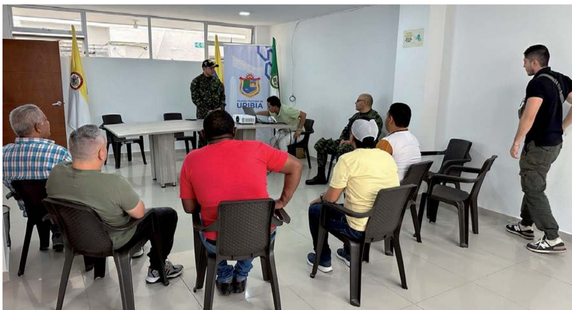
La actividad se realizó con la masiva participación del gremio de comerciantes de Uribia.

actuar de manera inmediata al ser víctima de extorsión, para que el Gaula