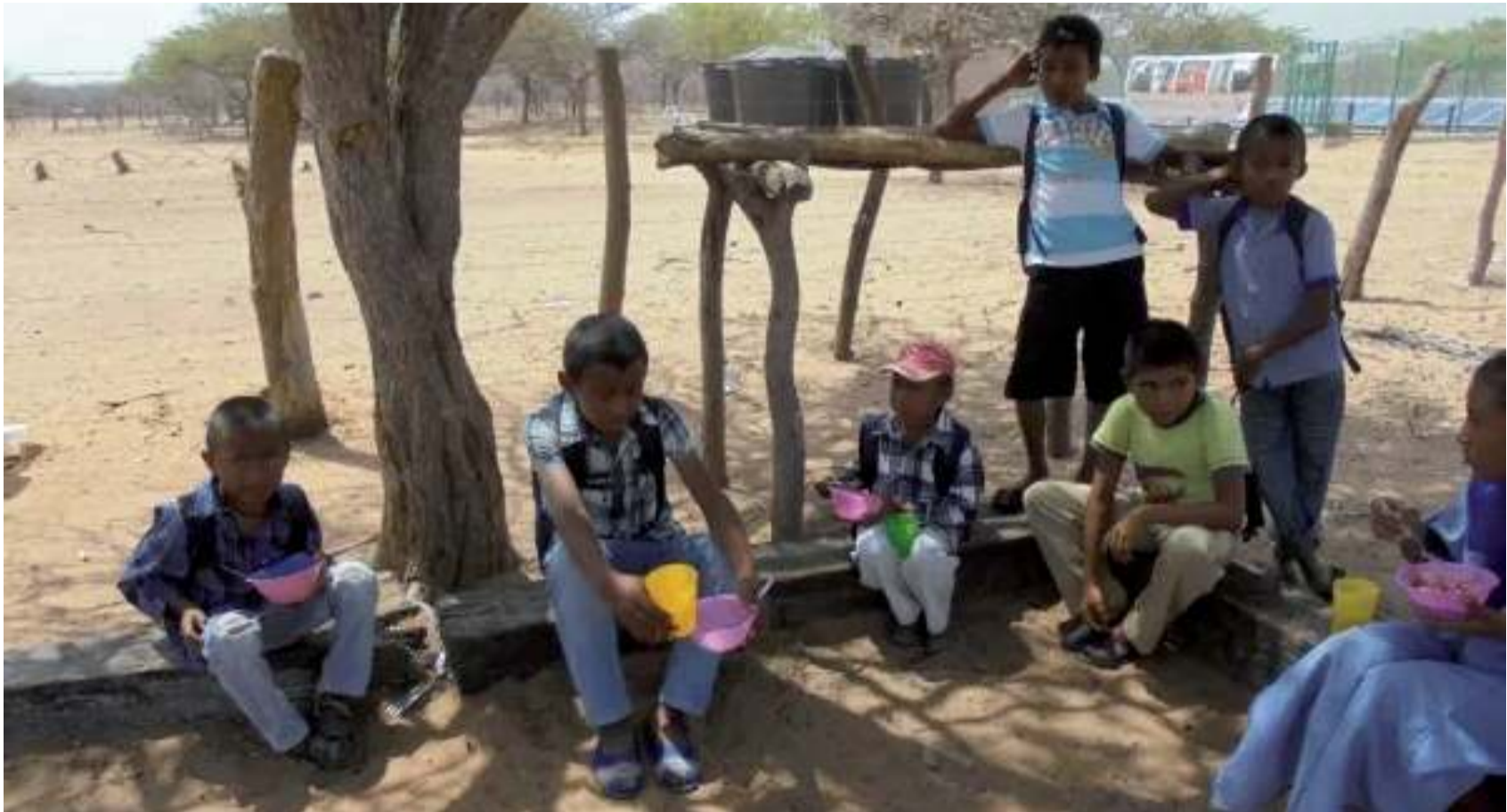
El ECI se entenderá superado en La Guajira cuando los indicadores de mortalidad de niños sean menores o igual al PN.

Usados para la evaluación de los resultados