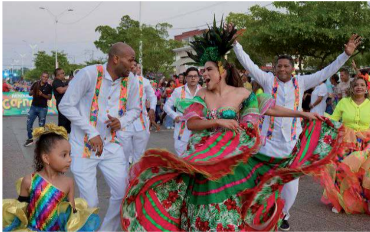
El Carnaval del Distrito de Riohacha es un motor para el desarrollo social y económico de la ciudad.

Por otro lado, no se puede olvidar que se trata de una de las manifestaciones culturales más antiguas del territorio, pues