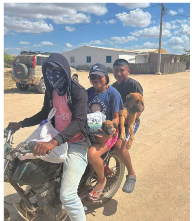
Cerca de 3.000 animales fueron alimentados con concentrado y comida húmeda, garantizando su nutrición y salud.