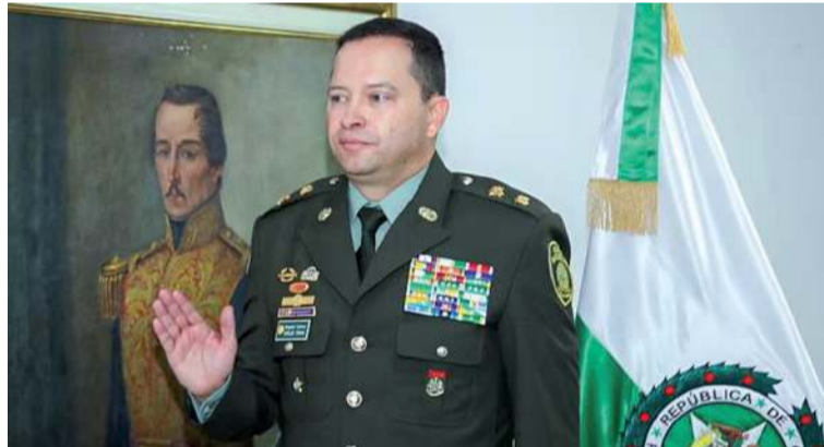
Carlos Fernando Triana, director de la Policía Nacional, advirtió una posible retaliación del grupo criminal.

“Estamos alerta de forma permanente en toda la Policía Nacional, es así como nuestros hombres y nuestras mujeres están preparados para minimi-