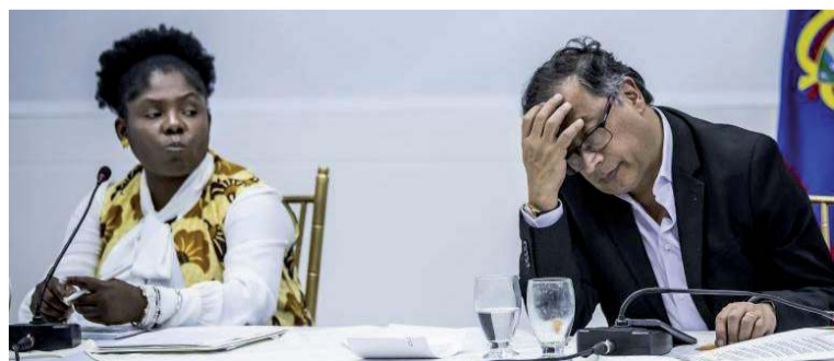
El MinIgualdad ha registrado un bajo nivel de ejecución presupuestal, que no supera el 2,5 %.

En una reunión sostenida esta semana en la Casa de Nariño, el presidente Gustavo Petro y la vicepresidenta Francia Márquez