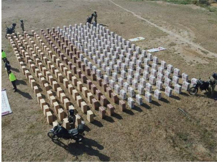
Las cajetillas de cigarrillos habían sido ingresadas ilegalmente al país sin la documentación requerida.

En la verificación realizada por los uniformados hallaron 151.000 cajetillas de cigarrillos de procedencia extranjera, que habían sido ingresados ilegalmente al país sin la documentación requerida. Estos productos, con un valor comercial de