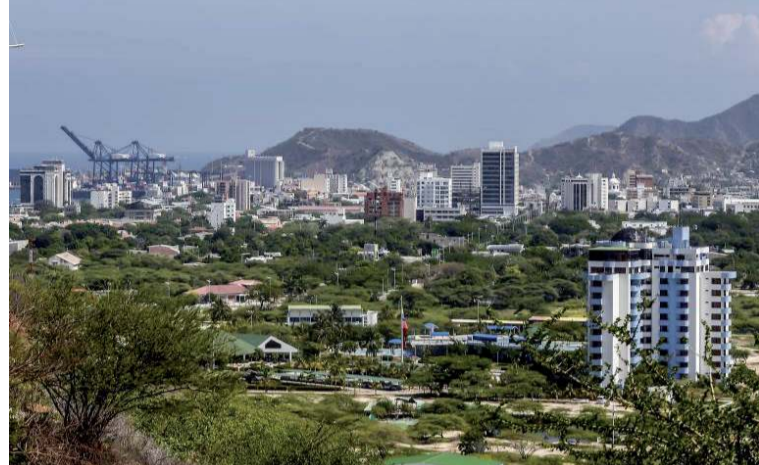
Santa Marta ocupa el puesto 26 a nivel mundial con una tasa de 45,24 homicidios por cada 100.000 habitantes.

De acuerdo con cifras oficiales, «la tasa real de homicidios en Santa Mar-