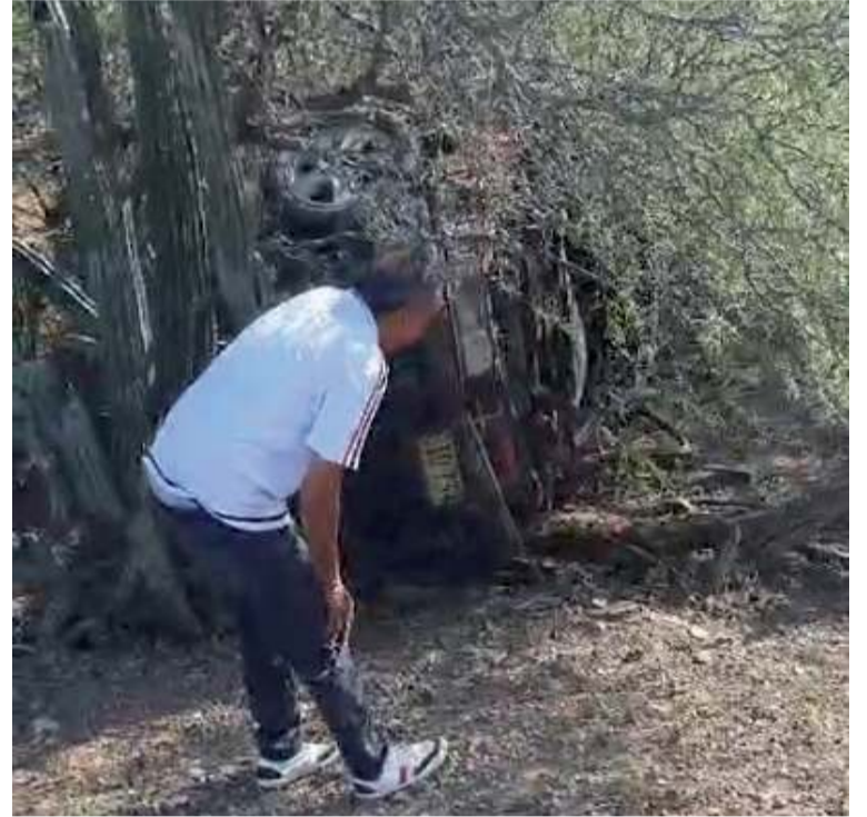
El llamado a los usuarios viales es a cumplir las normas de tránsito y verificar el buen estado de sus vehículos.

Las autoridades competentes continúan haciendo el llamado a los usuarios viales a cumplir las normas de tránsito y verificar el buen estado de sus vehículos a la hora de conducir para evitar situaciones que pongan en riesgo sus vidas y de los acompañantes.