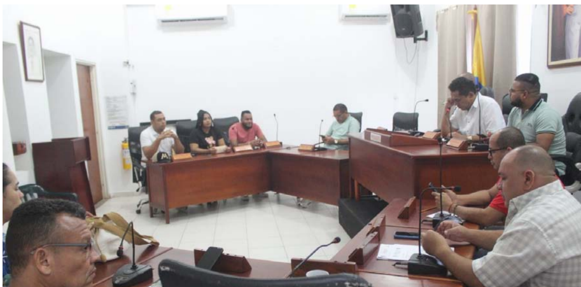
El proyecto continuará en el Concejo para aprobación en los próximos debates.

El proyecto continuará su curso en el Concejo municipal para su aprobación en los próximos debates, con el objetivo de brindar seguridad jurídica a los habitantes de Villanueva que se beneficiarán con la medida.