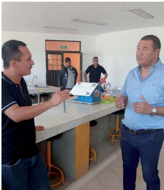
El funcionario verificó las condiciones en las que operan los planteles educativos.

Durante el recorrido, el funcionario verificó de primera mano las condiciones en las que operan los planteles educativos, con el propósito de definir las acciones prioritarias dentro del Plan de Infraestructura Educativa. Este plan contempla la construcción, adecuación y rehabilitación de diferentes espacios