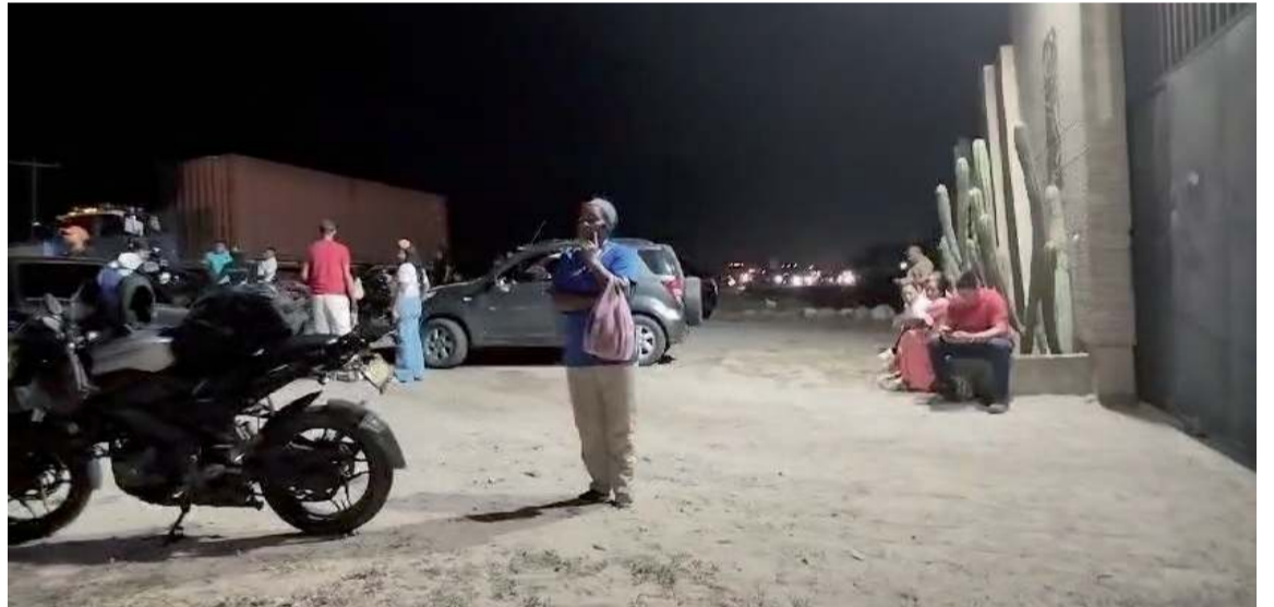
Una pareja que se bajó en ese punto dejó abandonada la caja con la bolsa.

Luego que se determinara que no contenía ningún artefacto explosivo la vía se volvió a restablecer para el paso vehicular que se encontraba a la espera que todo volviera a la normalidad y que se descartara cualquier situación que colocara en riesgo la vida de personas.