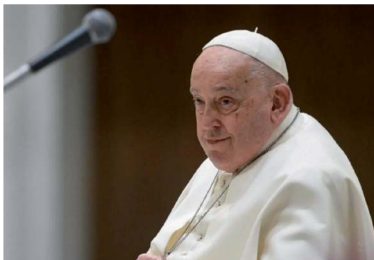
El papa ha enfrentado problemas de salud en los últimos dos años y tiene un historial de afecciones.

Durante la mañana del domingo 23 de febrero, en el piso habilitado en la 10ª planta, asistió a la Santa Misa, junto a quienes le están cuidando durante estos días de hospitalización.