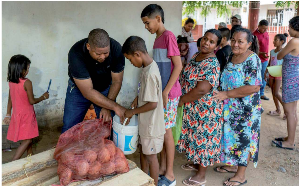
La donación, que incluye frutas se realizó en los barrios más vulnerables de Riohacha.

Esta entrega, que se realizó con el objetivo de mantener a las comunida-