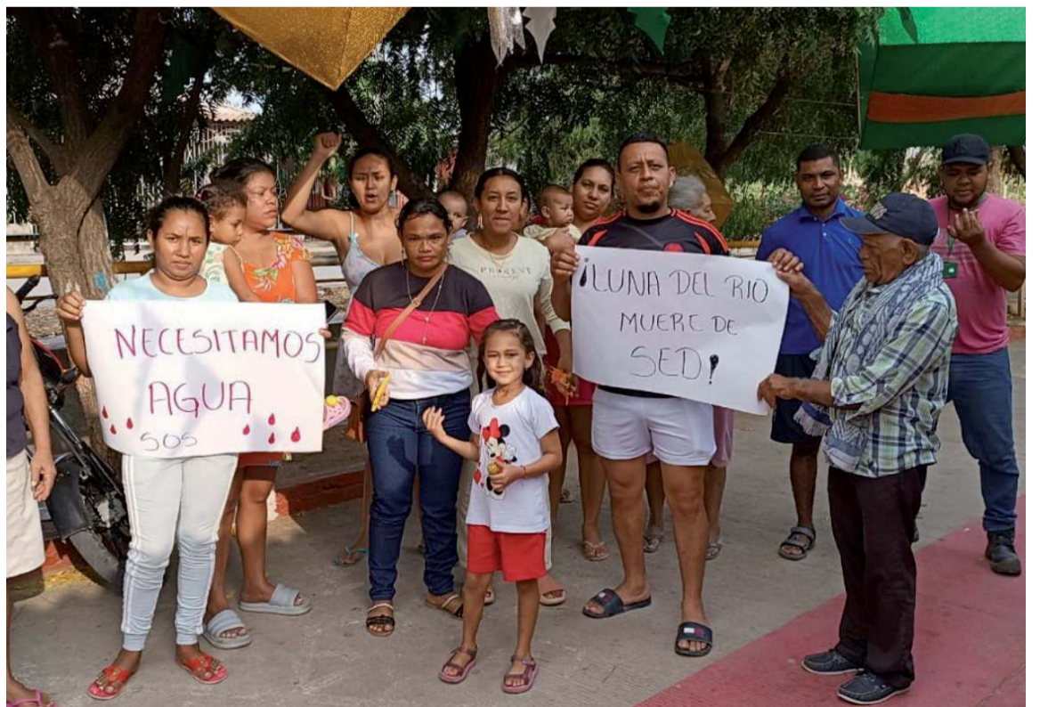
Los manifestantes se quejan de la inoperancia de la empresa Aguas de Albania.

Los usuarios del servicio de agua potable, salieron ayer a las calles del sector para hacer visible la necesidad por la que vienen padeciendo desde hace varios días ante la falta de agua.