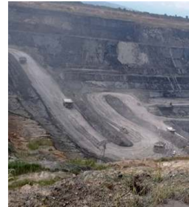
La URT priorizó a las víctimas de Mechoacán.

Hoy, siguiendo los lineamientos del Gobierno nacional, han sido inscritas al Rtdaf y pasaron a la etapa judicial del proceso de restitución de tierras, a partir de nuevos parámetros de valoración que han sido adoptados por la Unidad, en su propósito de garantizar los derechos territoriales de las víctimas desplazadas y despojadas por grupos al margen de la Ley.