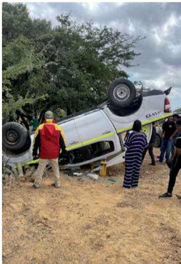
En la misma vía Uribia - Cabo de la Vela, a la altura del kilómetro 104 se registró este segundo accidente.

Ante estos hechos ocurridos la tarde del sábado en el municipio de Uribia la comunidad se encuentra alarmada debido a la situación de inseguridad vial y la necesidad del cumplimiento de las normas de tránsito que está cobrando vida de personas que transitan por esta vía de La Guajira.