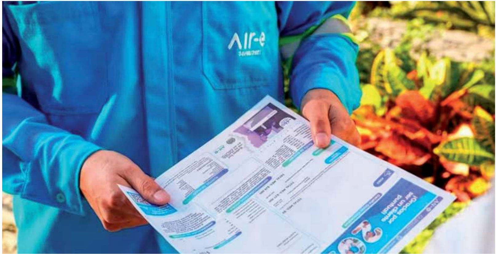
En el impuesto al alumbrado público, es la Ley 352 de 2016, la que establece que se debe cobrar con el servicio de energía.