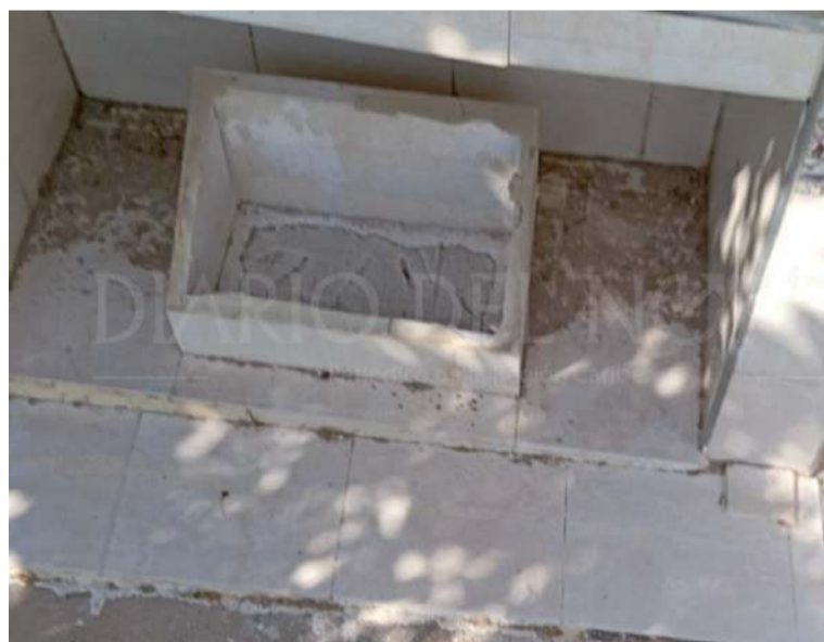
Pese a que el cementerio cuenta con vigilancia es poco lo que puede hacer el vigilante.

En el municipio de Albania, los delincuentes se han adueñado del camposanto, ya que ingresan a fumar sustancias psicoactivas, tienen relaciones sexuales, se llevan los floreros y las lápidas ubicadas como nomenclaturas en las tumbas. Ante esta situación, los familiares le piden a las autoridades que tomen cartas en el asunto.