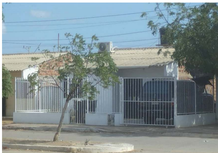
El crimen se registró en frente de su vivienda ubicada en el barrio Yosú de la capital indígena de Colombia.

petuo Socorro, pero al ser atendido por los galenos en turno, notificaron que había fallecido producto de los múltiples disparos