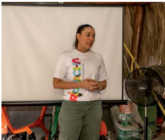
Entre los avances está la interacción con los actores en la cadena de suministro.