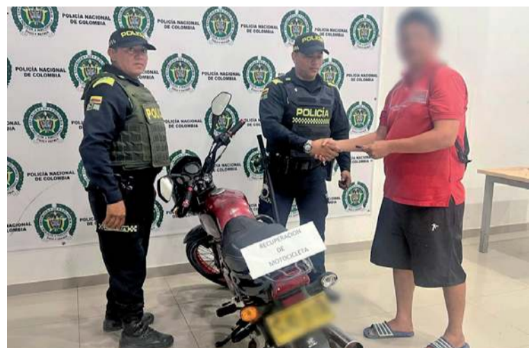
La motocicleta marca Bóxer de color rojo, fue devuelta por la policía a su propietario.