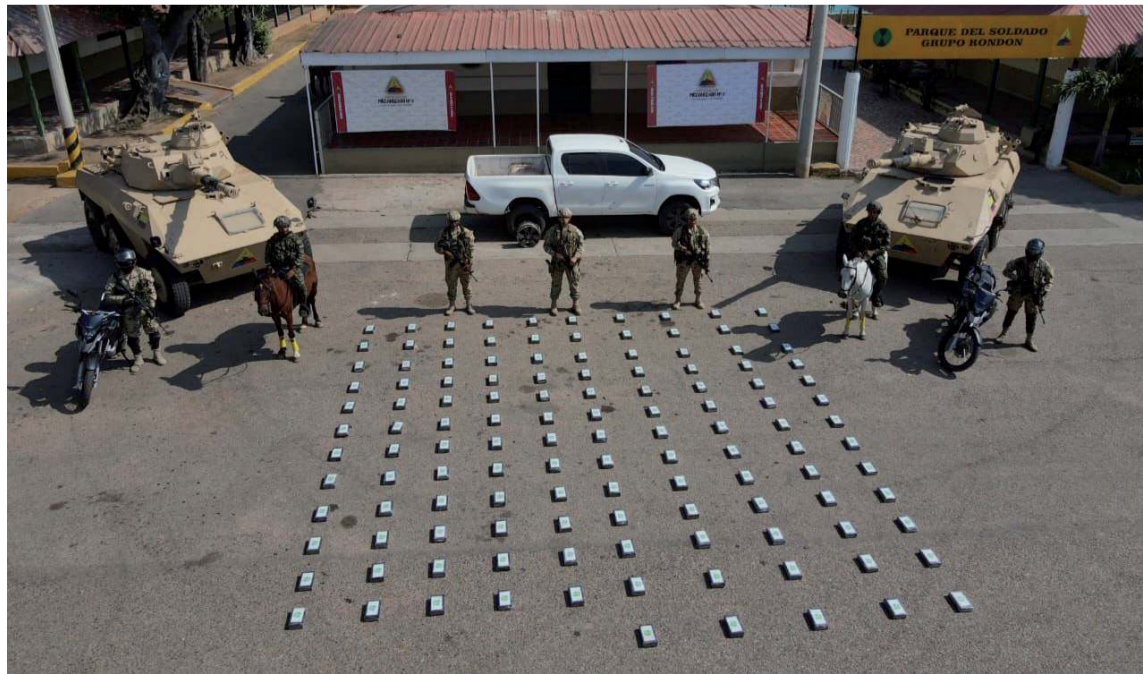
También se recuperó una camioneta Toyota Hilux, utilizada para transportar la droga.

El cargamento decomisado tendría un valor aproximado de 21.500 millones de pesos en el mercado internacional, lo que representa un duro golpe a la estructura financiera del ELN, responsable de este tráfico ilegal. La droga, proveniente de Norte de Santander,