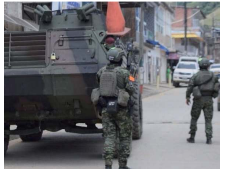
Para los mandatarios, la inestabilidad generada por estos grupos ha llevado a un aumento en el desplazamiento.

Ambos gobernadores están clamando por mayor autonomía territorial y acciones más decisivas del Gobierno central para enfrentar esta crisis de seguridad que afecta a sus comunidades.