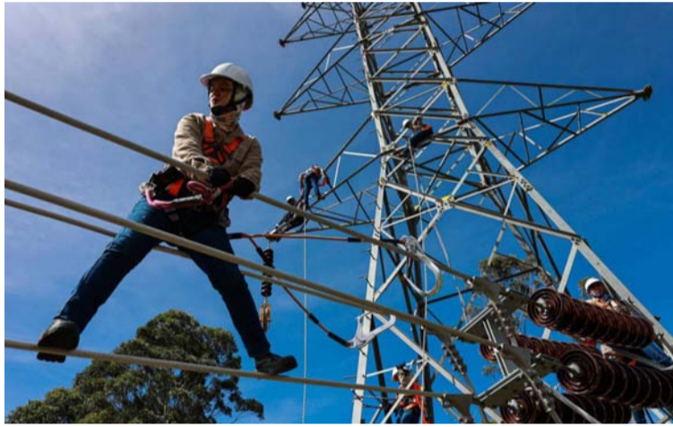
Esto permitirá que comunidades de Uribia y Manaure, entre otras del país, accedan a energía confiable.

Gracias a esta Resolución, que nace justamente de un compromiso pactado en las mesas técnicas lideradas por la congresista guajira, se podrán utilizar las redes eléctricas existentes para mejorar las condiciones de energía entregada a los usuarios, haciendo más eficiente el uso del sistema eléctrico. Esto permitirá que comunidades de regiones como Uribia y Manaure, en La Guajira, entre otras