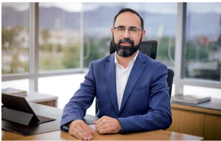
El negacionismo del ministro de Minas y Energía, Andrés Camacho, lo lleva a descartar la crisis energética.

Mientras tanto, sobre la deuda de los estratos 1, 2 y 3 con las empresas comercializadoras por concepto de la Opción Tarifaria, que asciende aproximadamente a los $2.5 billones y que el propio presidente Gustavo Petro se comprometió en mayo del año pasado a que la asumiría la Nación no se ha vuelto a hablar. Y este es el otro lastre que viene afectando la liquidez, la solvencia y el flujo de caja de las empresas comercializadoras, que amenaza con extenderse a las generadoras, causando un efecto dominó con graves repercusiones.