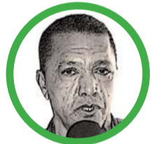
Por Rafael Humberto Frías Mendoza