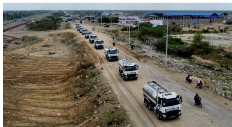
La Fiscalía acusó a estas personas, de acuerdo con su participación en el entramado de corrupción.

Y el tercer suceso es el direccionamiento de contratos a empresas referidas por terceras personas para cubrir otras actividades, bienes y servicios. En este caso, los recursos fueron obtenidos por las gestiones y trámites realizados por Barreto Gantiva, que permitieron la reducción de 100.000 millones de pesos de un convenio que la Ungrd celebró con la ANT.