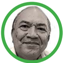
Por Amylkar Acosta Medina