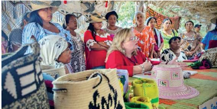
El Icbf anunció que la atención integral no está destinada a comunidades urbanas.

La directora también resaltó el valioso trabajo de las comunidades en la promoción de iniciati-