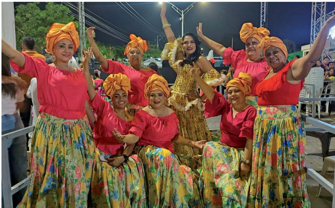
En la cultura del disfrute del Carnaval, hierve la alegría, entre quienes se lo gozan.

Aun cuando las celebraciones de carnavales tienen fechas establecidas, estas no son universales en sus conmemoraciones. Algunas se preestablecieron como anticipo a la cuaresma, previa a la Semana Santa que inicia el miércoles con la cruz de ceniza, poniendo fin a las festividades recocheras que tiene lugar en cada vigencia anual. Tampoco se celebran en todas las localidades del territorio nacional en las mismas fechas. Por ejemplo. En