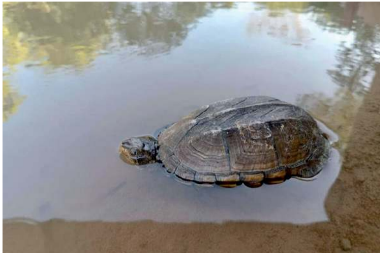
La hicotea fue entregada de manera voluntaria mientras el ave fue rescatada en un sector de la ciudad.

Por su parte, la hicotea fue entregada de manera voluntaria por un ciudadano que decidió