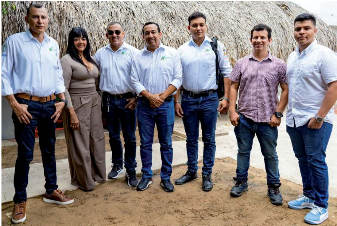
El próximo paso es la estandarización del producto para asegurar mercados.

Cabe recordar que la iniciativa se planteó como una serie de esfuerzos interdisciplinarios e institucionales, para fortalecer y diagnosticar esta cadena de valor, potenciar la capacidad productiva del sector, favorecer la interacción entre ofertantes y demandantes del queso