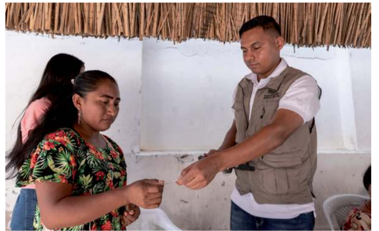
La jornada tuvo como escenario los municipios de Uribia, Manaure y Riohacha, en La Guajira.

La Registraduría Nacional del Estado Civil con-