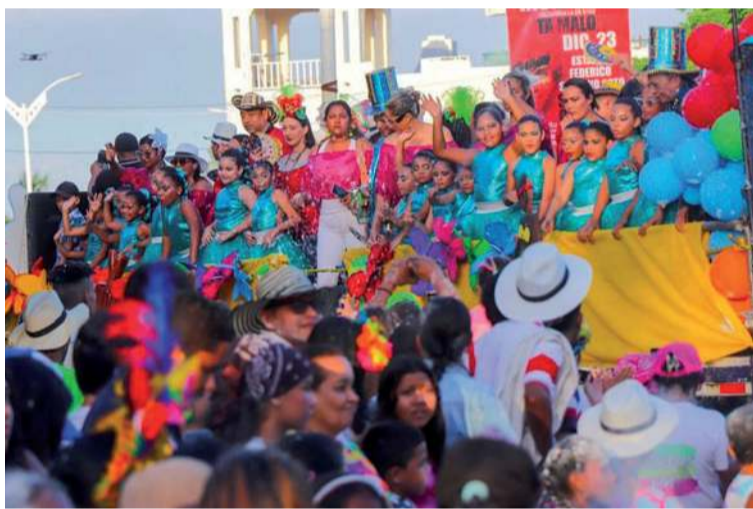
En Riohacha y casi todos los municipios de La Guajira, se ha bajado la participación de carnavales.

Colombia tenemos carnavales oficial en enero, de 'Negros y Blancos' en Nariño. En febrero y algunas veces a inicio de marzo, como ocurre este año, se celebraban en cuatro departamentos, Atlántico, Magdalena, La Guajira y Cesar. Hoy, solo se festejan en Atlántico y La Guajira, cuna de ingreso del Carnaval al territorio nacional, en igual forma que el acordeón. Todos los distintos festivales, fiestas religiosas y reinados de cada departamento y municipio, inciden con disfraces de Carnaval.