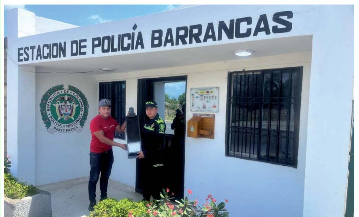
La Policía realizó la entrega del elemento recuperado al personal contratista.