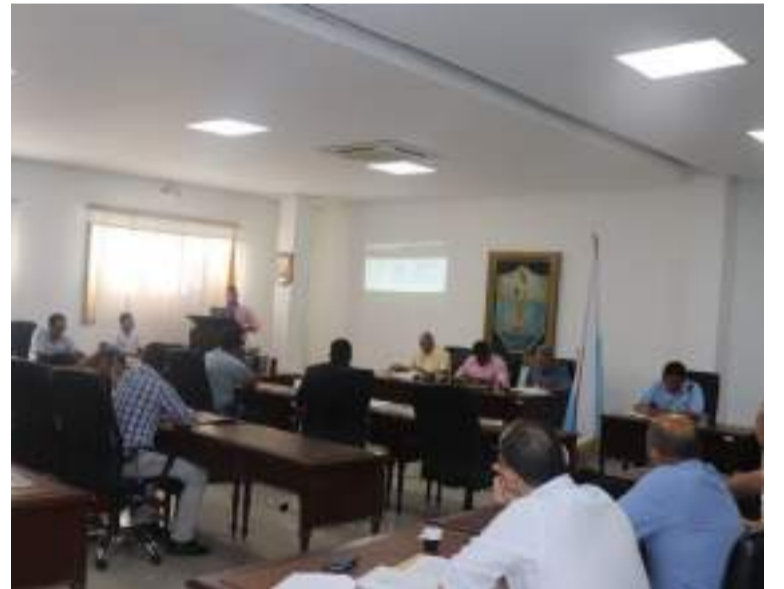
Esta situación llevó a que la presidenta del Concejo, suspendiera la sesión al no poder restaurar el orden.

Entre las pruebas requeridas están la copia de las credenciales en las que conste la declaratoria de elección los dos concejales, un informe sobre los antecedentes disciplinarios y otras como los videos y audios de la sesión en la que ocurrieron los hechos.