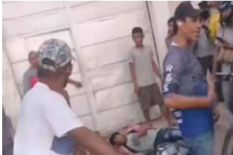
Algunas personas detuvieron al sujeto cuando intentaba huir y le asestaron una pedrada en la cabeza.

El hecho se registró la tarde del viernes 21 de febrero en un hotel de la calle 11 con carrera 18 en el sector de la Carbonera en el mercado público de Maicao, en donde la mujer logró salir del sitio dejando rastros de sangre por toda la habitación.