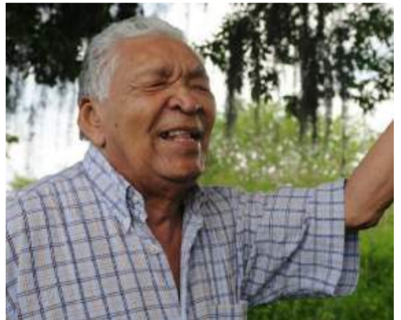
Destacan la importancia de recordar a Leandro Díaz a través de actividades que resalten su vida y su música.

Murgas enfatizó la importancia de recordar a Leandro Díaz a través de actividades que resalten su vida y su música, mencionando canciones como ‘Tocaimo’, ‘El pregonero’ y ‘La trampa’ que se las dedicó a esta región y lo hicieron reconocer en el tiempo.