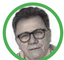
Por Indalecio Dangond