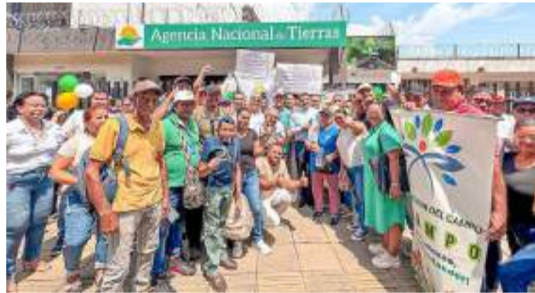
Seis mil campesinos debatieron en más de 200 Comités Municipales de Reforma Agraria en 26 departamentos.

Durante los días 14 y 15 de febrero a lo largo y ancho del país unos 6.000 campesinos, campesinas y comunidades indígenas y afros debatieron activamente en más de 200 Comités Municipales de Reforma Agraria en 26 departamentos del país, bajo el lema #SomosRe-