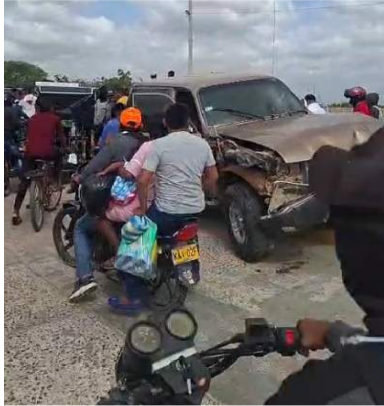
El conductor de la camioneta terminó subiéndose al andén y arrolló violentamente a tres personas.

Se pudo conocer que las tres personas resultaron gravemente heridas y fueron llevadas de