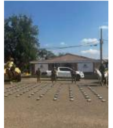
La droga está evaluada en $21.500 millones.

Hasta el momento se desconoce la identidad del atacante y de la mujer agredida con arma blanca, además de los motivos que llevaron a este sujeto a atacar a su víctima.