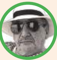
Por José Manuel Aponte Martínez