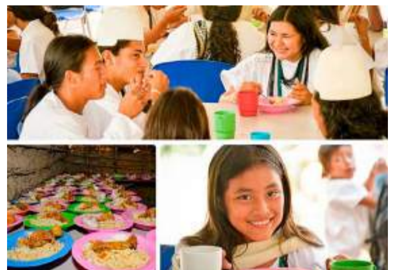
480.490 estudiantes indígenas reciben alimentación escolar a través del PAE diferencial.

De esta forma el Ministerio garantiza la equidad y la inclusión en la alimentación escolar de todas las poblaciones del país.