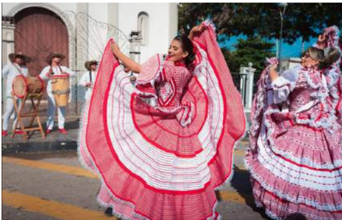
Hoy sábado, Telecaribe estará transmitiendo la Batalla de Flores de Santo Tomás.

DESTACADO El canal Telecaribe ofrecerá entre hoy y mañana a sus televidentes, una cobertura exclusiva de las celebraciones que se realizan en varios municipios del departamento del Atlántico.