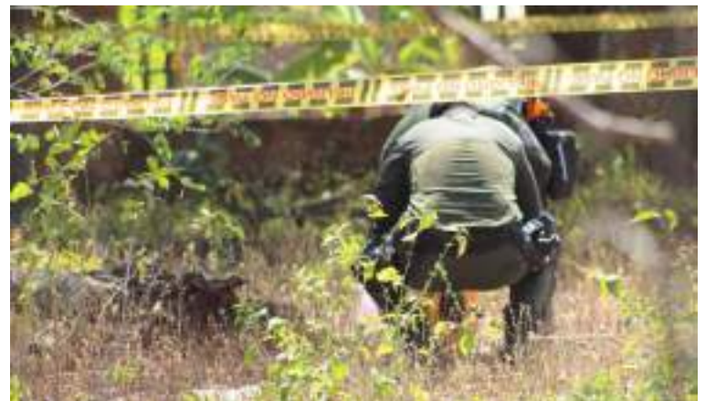
Las autoridades han iniciado una investigación para determinar el origen del artefacto.

Finalmente, el funcionario reiteró que Villanueva se encuentra en calma y que este hecho es una secuela del pasado. "Gracias a Dios no hubo nada que lamentar, pero debemos estar atentos y preparados para prevenir cualquier situación de riesgo en el futuro", concluyó.