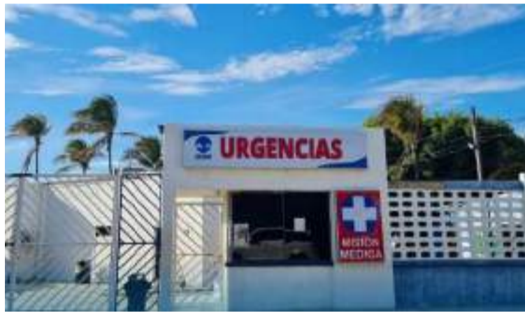
Algunos hospitales están pasando por una situación muy crítica a nivel administrativo y financiero.

"Es una situación muy complicada, hacen nueve meses no les pagan los sa-