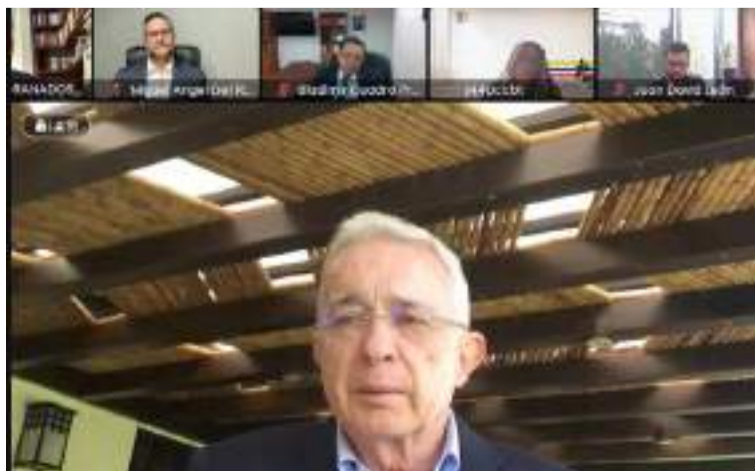
El juicio avanzará y se espera que el primer testigo de la Fiscalía, el senador Iván Cepeda, declare pronto.

Con la decisión del tribunal, el juicio avanzará y se espera que el primer testigo de la Fiscalía, el senador Iván Cepeda, declare pronto. Cepeda también está reconocida como una de las víctimas en este caso.