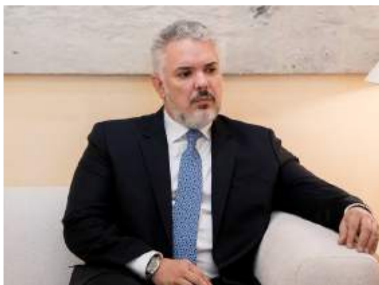
Duque dice que Vicky Dávila conecta con la gente.

de paz y se restablecen las relaciones con Israel”. Es notorio que el único propósito de esta entrevista fue atacar al Gobierno de Petro, sin expresar ningún tipo de indicador. No tiene una visión de país, habla de los políticos de siempre, sin mencionar a Uribe ni a Duque y hace lo mismo al tratar de sembrar el miedo para ganar votos.