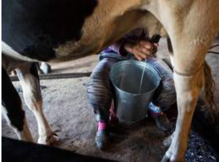
La Guajira reafirma su potencial en el sector agropecuario, destacándose por la excelencia en la proteína.