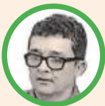
Por Luis Hernán Tabares Agudelo

Será que ahora sí la Secretaría de Tránsito instalará la señal prohibiendo el paso en la carrera 10 con 12, ya que yo, como lo prometí, no he podido hacerlo, vamos a ver quién pega primero, si ellos o yo.