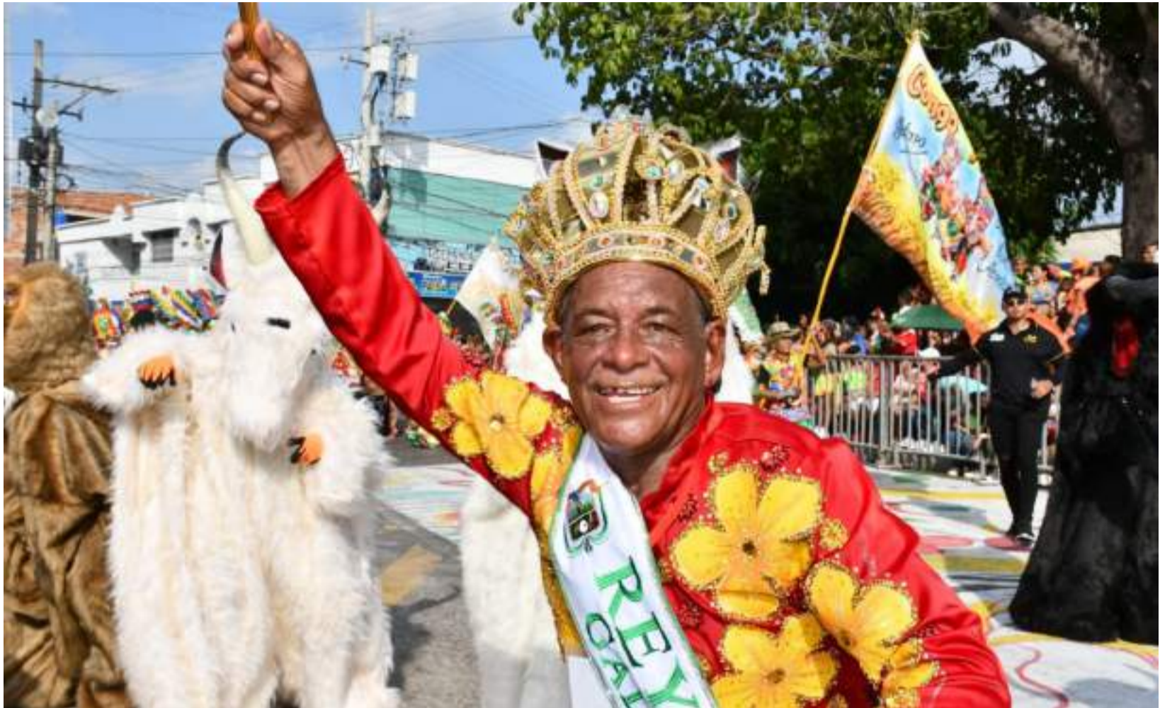
Este domingo se estará llevando a la audiencia de Telecaribe, la Gran Parada Departamental del Folclor en Galapa.