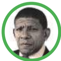
Por Martín López González