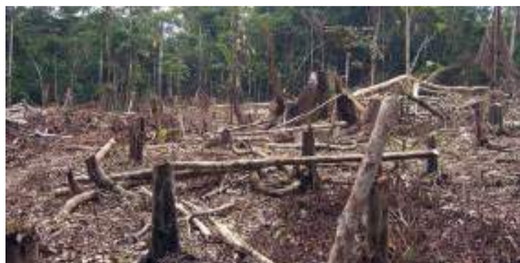
Este resultado refleja un compromiso firme y efectivo del Gobierno nacional con la sostenibilidad.

El avance significativo en la lucha contra la deforestación es resultado del Plan de Contención de la Deforestación, una estrategia integral que se ha consolidado como un modelo de éxito en la protección del ambiente.