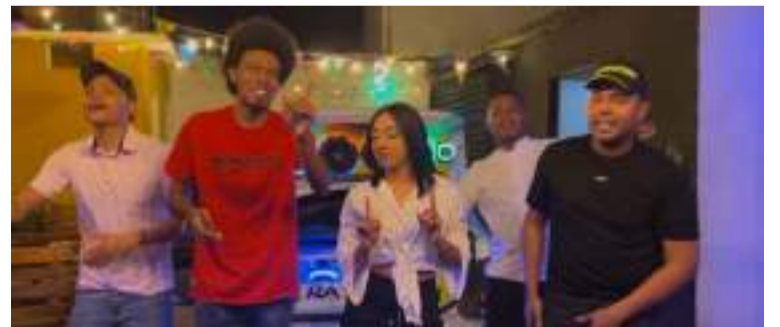
Se logró una propuesta musical única.

La canción transmite un mensaje de felicidad y disfrute, invitando a las personas a valorar el fruto de su trabajo sin dejarse afectar por críticas externas. La historia gira en torno a alguien que vive su semana laborando y, al llegar el viernes, se entrega a la diversión, manteniendo siempre el equilibrio entre el esfuer-