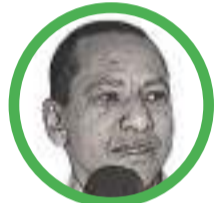
Por Jorge Naín Ruiz Ditta