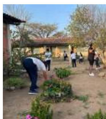
Desde temprano inició la jornada de limpieza.