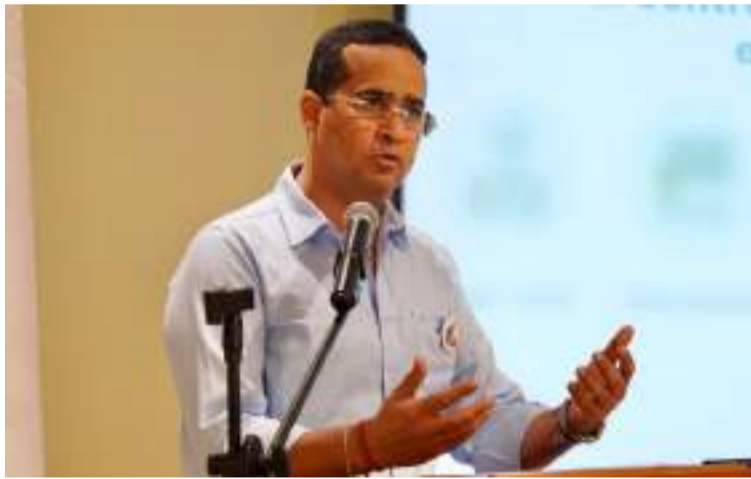
Para el sindicato, estas acciones reafirman el alto nivel de compromiso que tiene el mandatario guajiro.

responden a los de la Ley 550 a la cuota del año (2025), Gratuidad de Matrícula de la vigencia 2024 y los gravámenes por Estampillas Pro-Universidad