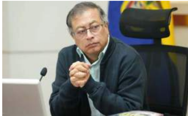
Dice Petro que fue la Corte la que por mayoría decidió declarar inconstitucional la tasa de interés cero.

Por su parte, el exministro de Hacienda Mauricio Cárdenas calificó la eliminación del subsidio como un "golpe al bolsillo de los jóvenes", advirtiendo que