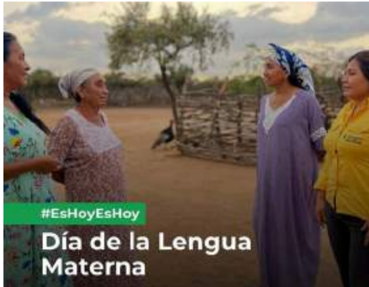
Cerrejón facilita a esta comunidad el acceso a información y contacto con la empresa en la lengua wayuú.

“Esta es una excelente manera de reconocer y valorar la diversidad cultural y lingüística. La preservación del wayuunaiki no solo enriquece a la comunidad, sino que también fortalece el sentido de