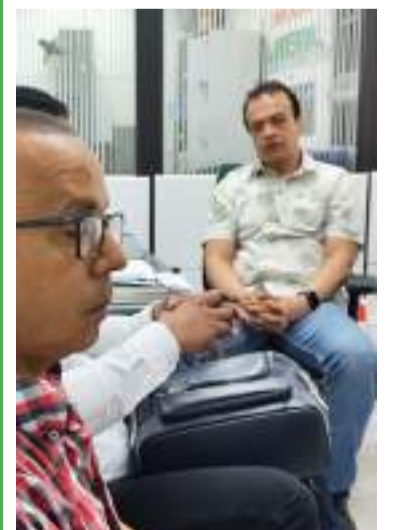
La iniciativa contribuirá a un futuro sostenible.

Se busca potenciar las capacidades de los estudiantes, fomentando su relación con la naturaleza y el medio ambiente, mientras se desarrollan actividades lúdicas y formativas.