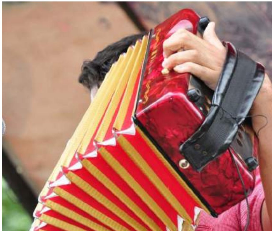
El acordeón, principal instrumento de la música vallenata, alma y nervio de los festivales y esencia del folclor vallenato.

Es escuchar el ritmo, saborearlo, dejarlo penetrar por los ojos, por los oídos, por la piel, que nos