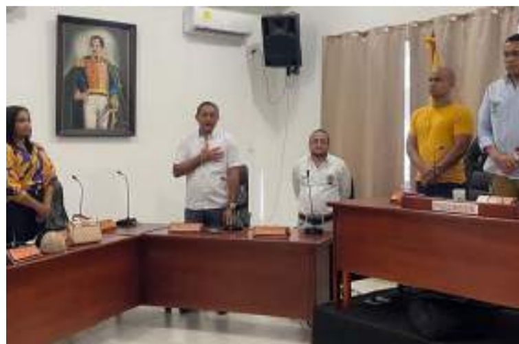
La demanda cuestiona la legalidad del acto de elección de la mesa directiva del Concejo.

Este fallo reafirma la importancia de cumplir con las normas electorales y los principios de transparencia en la conformación de los órganos de gobierno local.