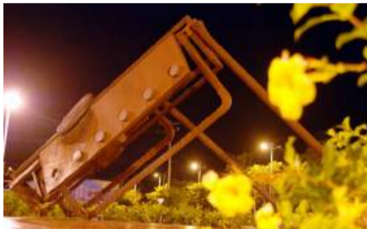
El 'pedazo de acordeón' como lo expresó Alejo Durán, se ha metido en el corazón de los seguidores de la música vallenata.

escudriñe y nos envuelva, que nos muestre nuestra vulnerabilidad, que saque a flote tantas realidades propias, tantos detalles valiosos escondidos allí, como en un vetusto baúl del olvido. Dejarse cortejar del acordeón, de ese ritmo que acompaña nuestros latidos, que conoce la flexibilidad del espíritu y algún día terminar preguntándose ¿cómo es posible que ese 'pedazo de acordeón' se asemeja a las cosas de su alma? Entonces, se entiende por qué todo el mundo hace silencio respetuoso en Valledupar, en Villanueva, en San Juan del Cesar, en Patillal y la fiesta se sublima en parrandas cuando comienza a liberar esa energía que transmite el trovador, quien por extraña simbiosis, se fusiona y convierte con todo el con-