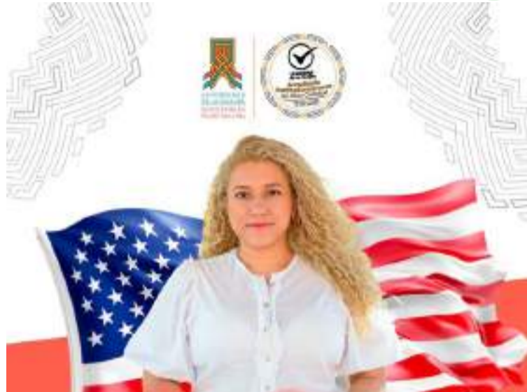
El curso está diseñado para desarrollar habilidades fundamentales del idioma inglés.

Dos opciones tendrán los inscritos en el curso. Opción 1: Martes, miércoles y jueves de 1:30 p. m. a 3:30 p. m. (miércoles pre-