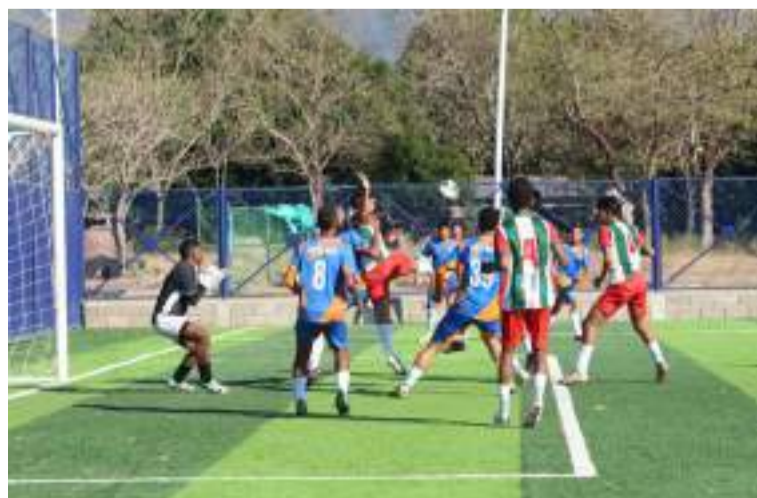
Una trifulca entre jugadores de ambos equipos obligó al árbitro a dar por terminado el partido.

El partido no pudo concluir de manera regular, ya que a falta de 10 minutos para el final, una trifulca entre jugadores de ambos equipos obligó al árbitro a dar por terminado el encuentro antes del tiempo reglamentario.