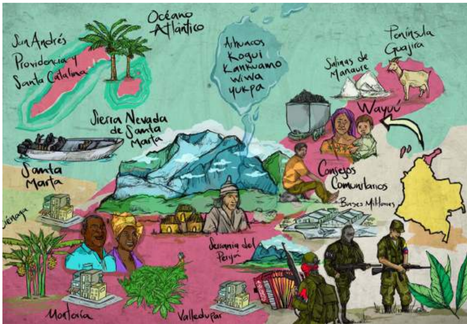
En este corredor se encuentran 19 resguardos de los pueblos indígenas, kogui, wiwa, arhuaco, wayuú y yukpa.

La Defensoría del Pueblo alerta sobre la existencia de al menos once focos de emergencia humanitaria en el país, que impactan de manera desproporcionada a comunidades campesinas, afrocolombianas e indígenas, así como a niñas, niños, adolescentes y jóvenes.