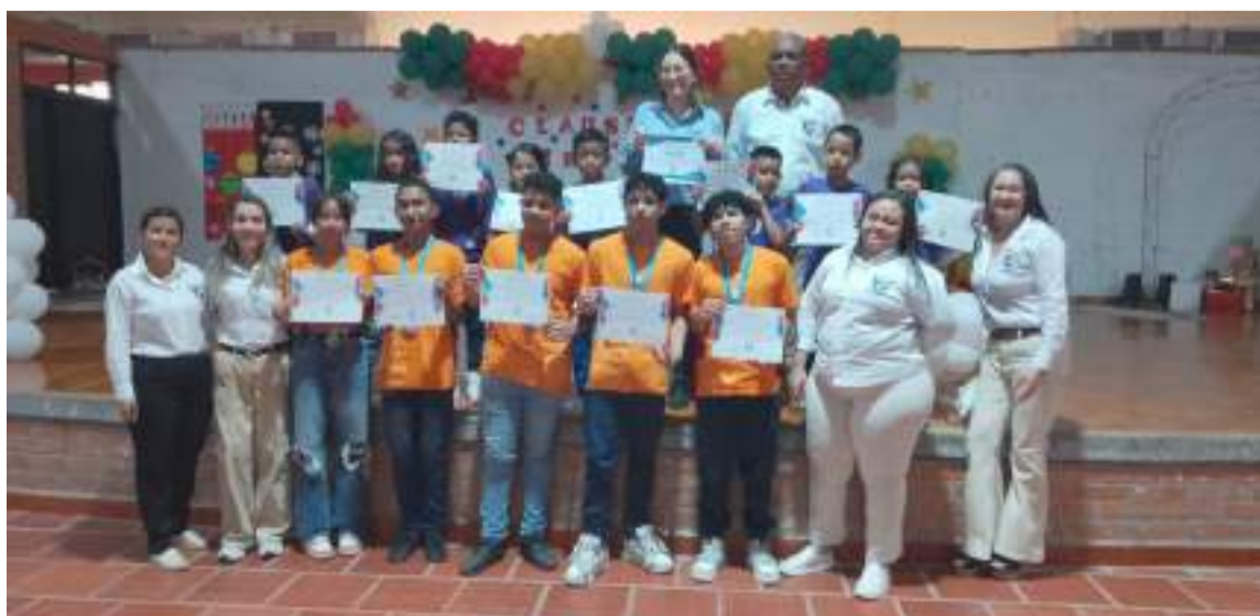
El Fest Stem de Cartagena, contará con cerca de 5 mil 200 participantes.

El festival de Ciencia y Tecnología Cartagena Fest Stem contará con cerca de 5 mil 200 participantes de todo el país, teniendo como escenario el parque Espíritu del Manglar, Centro de Convenciones de Cartagena, y el Palacio de la Proclamación.