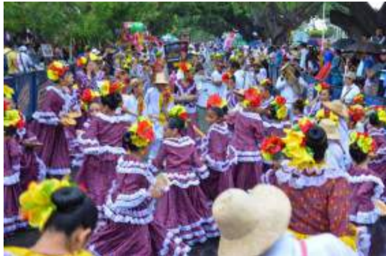
El desfile de las Piloneras es una gran tradición vallenata.

Por su parte para el concurso de piquería mayor se inscribió el verseador