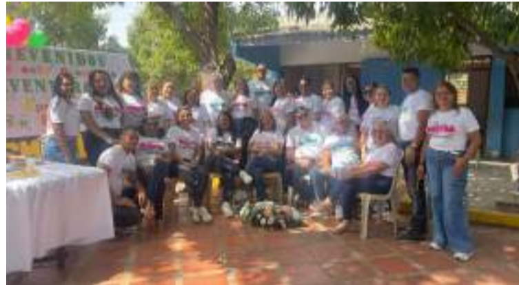
La solidez de la I.E. se basa en la interacción de directivos, docentes, padres de familia y estudiantes.

La I.E. Ismael Rodríguez Fuentes, fue el primer co-