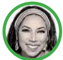
Por Marga Lucena Palacio Brugés