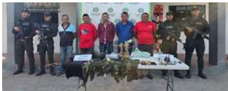
Estas personas tenían en su poder armamento y municiones de diferentes calibres, dinero y celulares.

Asimismo, se pudo conocer que en el momento de la detención estos cinco sujetos tenían en su poder dos pistolas, un revólver, proveedores de pistolas, 33 cartuchos de diferentes calibres, dinero en efectivo y