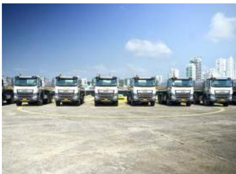
La Guajira, en cumplimiento de la Sentencia T-302 de la Corte, recibirá el mayor número de carrotanques.

La Unidad Nacional para la Gestión del Riesgo de Desastres (Ungrd), avanza en el plan de distribución de los carrotanques en el Caribe colombiano. El pasado lunes 17 de febrero se formalizó la entrega de 10 vehículos a los departamentos de Bolívar, Magdalena, Córdoba, Sucre y Cesar, así como a la Armada Nacional y a la Defensa Civil.