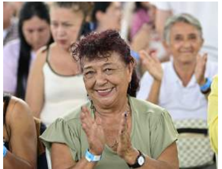
Del total de beneficiarios programados para este primer ciclo del 2025, 491.577 tienen más de 80 años.

Prosperidad Social invita a los beneficiarios a actualizar sus datos de contacto. Se pueden comunicar a las líneas de atención gratuita en Bogotá: 6013794840; desde el resto del país, al 01 8000 95 1100; o a través de los enlaces del programa en las alcaldías municipales.