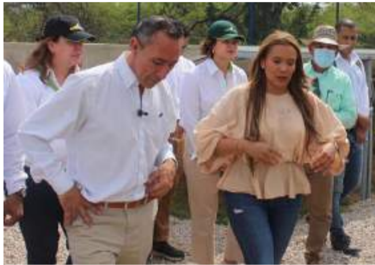
El convenio reafirma el compromiso del gobernador en seguir cumpliendo la palabra en materia de agua potable.

Este acuerdo permitirá la instalación de una planta desalinizadora que tomará agua del mar para su tratamiento, garantizando el acceso a agua potable en Punta Coco, una de las comunidades más apartadas de la Alta Guajira. La infraestructura está pensada como una solución permanente