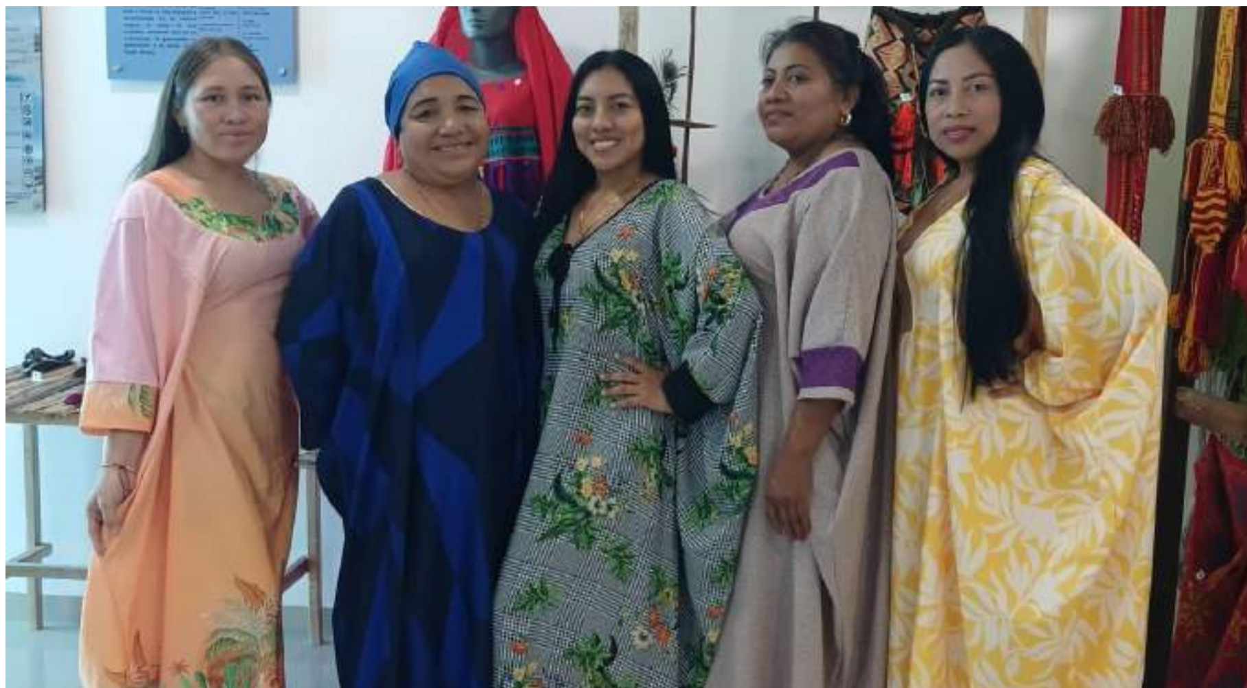
En el barrio San Martín de Maicao, varias mujeres originarias de la Alta Guajira hacen parte del museo que tiene el significado de 'Alma wayuú'.