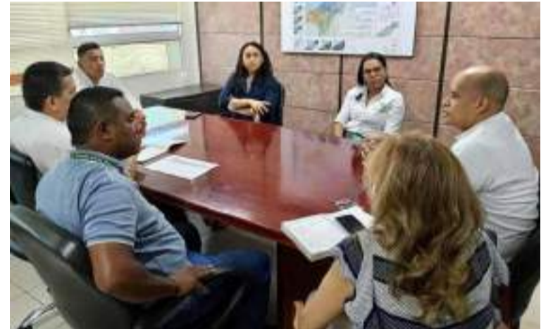
Corpoguajira llamó a la comunidad para que se abstenga de participar en los delitos ambientales.

A través del ejercicio de la autoridad ambiental, continúa trabajando de manera decidida en la protección de los recursos naturales, garantizando un futuro más sostenible para todos los habitantes de La Guajira.