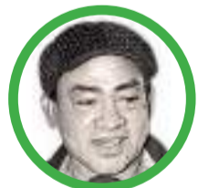
Por Abel Medina Sierra