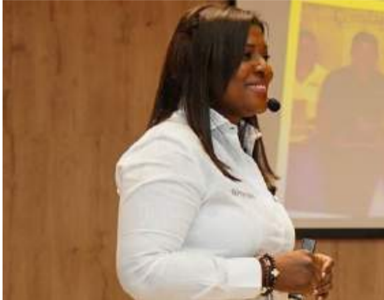
Dice la directora (e) de Comfaguajira que desde que llegó al cargo ha cumplido con esas obligaciones.