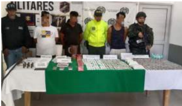
Dos de los capturados, alias 'Caliche' y alias 'Negro', estarían encargados de planear y ejecutar cobros extorsivos.

En desarrollo de operaciones militares, en el marco del Plan Ayacucho Plus, soldados del Gaula Cesar, de la Décima Brigada, en un trabajo coordinado e interinstitucional con la Policía Nacional y la Fiscalía General de la Nación, capturaron en flagrancia a tres presuntos integrantes del componente criminal focalizado de la Subestructura Francisco José Mórolo Peñate, del Clan del Golfo, en el corregimiento Villa Germania,