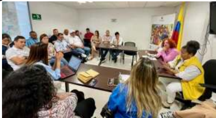
El modelo de integración local busca garantizar el acceso a vivienda digna y servicios esenciales a las víctimas.

La directora destacó la importancia de revisar los planes de vida que incluyen áreas como vivienda, salud y educación para asegurar soluciones integrales. "Hemos tenido una reunión extraordinaria con la participación de las secretarías de la Alcaldía,