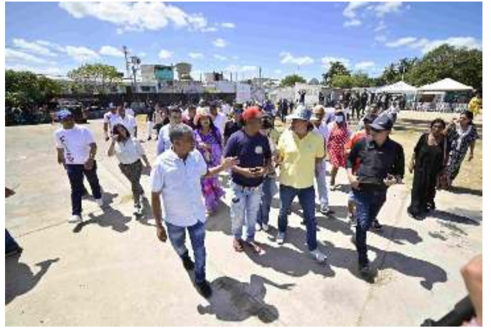
Prosperidad Social aportó $10.112 millones, recursos con los que se intervino un área de 3.642 metros, incluida luminarias y señalización.