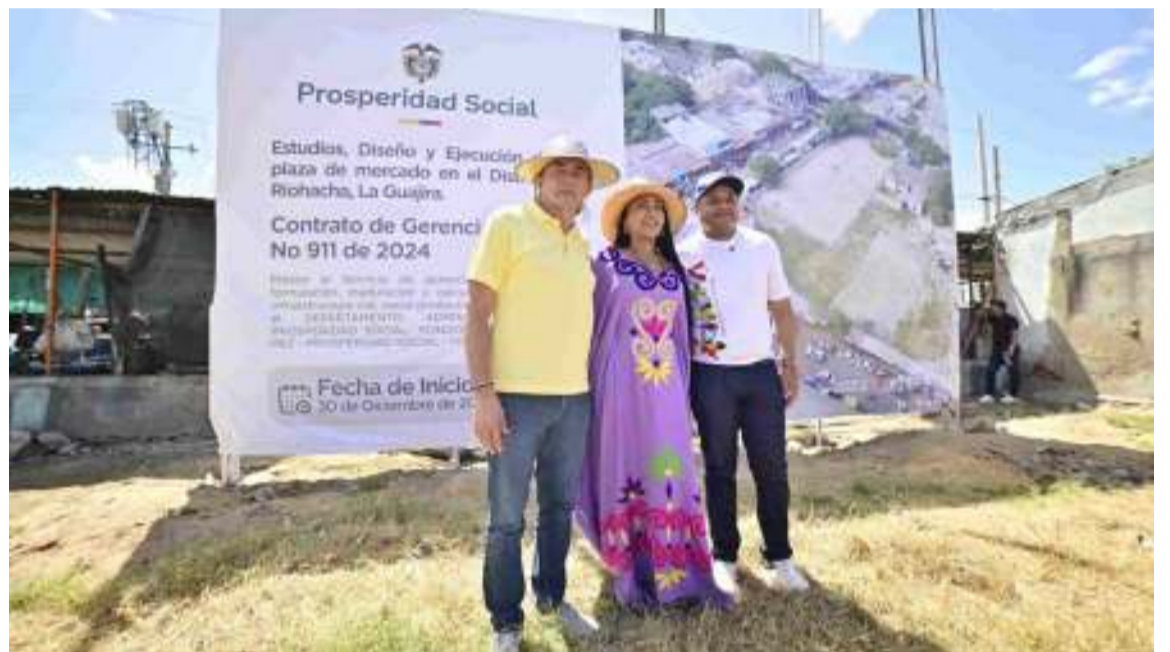
La población de Riohacha ha esperado más de treinta años por esta plaza.

vitalizar económicamente la zona. Le va a dar empleo a muchas personas y va a impulsar la economía popular. Espero que el presidente Gustavo Petro pueda venir a entregarla ya que ha sido uno de los compromisos de este gobierno." La ejecución se ha suscrito con la Empresa Nacional Promotora