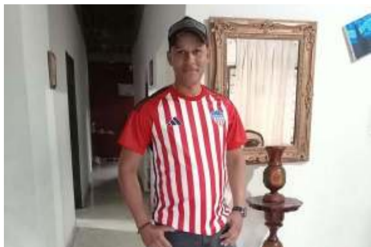
La víctima resultó herida cuando sujetos en moto pasaron y dispararon de manera indiscriminada.

En hechos que son materia de investigación por parte de las autoridades competentes, un hombre de 35 años de edad resultó herido cuando se encontraba cenando junto a dos personas más en un puesto de comida rápida en la calle 12A con carrera 11 de la ciudad de Riohacha.