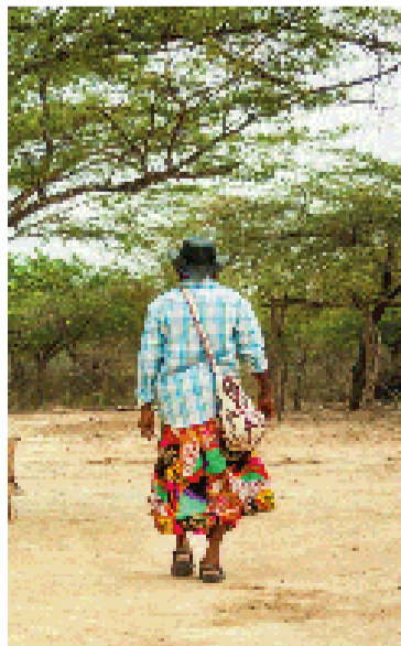
Se busca el control social y convivencia pacífica.

La Sala Segunda de Revisión conoció una problemática intercultural ocasionada por la tensión existente entre dos grupos sociales enfrentados - un pueblo indígena y una comunidad campesina - que conviven en un centro poblado de un municipio y defienden, desde la diferencia, sus propios modos de vida. Los accionantes invocaron el amparo porque las autoridades indígenas aplicaron el derecho propio a los habitantes del centro poblado que no se identifican como indígenas, para el control de comportamientos contrarios a la convivencia. Tam-