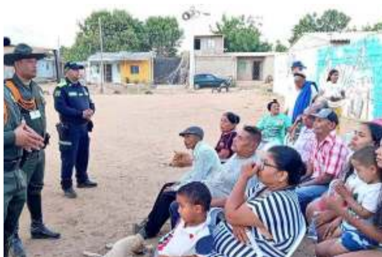
Los uniformados socializaron campañas en contra de los delitos sexuales en niños, niñas y adolescentes.

Con el objetivo de socializar la oferta institucional y escuchar a la comunidad se desarrolló un encuentro comunitario con la comunidad del barrio la Mano de Dios, donde se participaron los grupos preventivos del comando del Departamento de Policía Guajira como es el