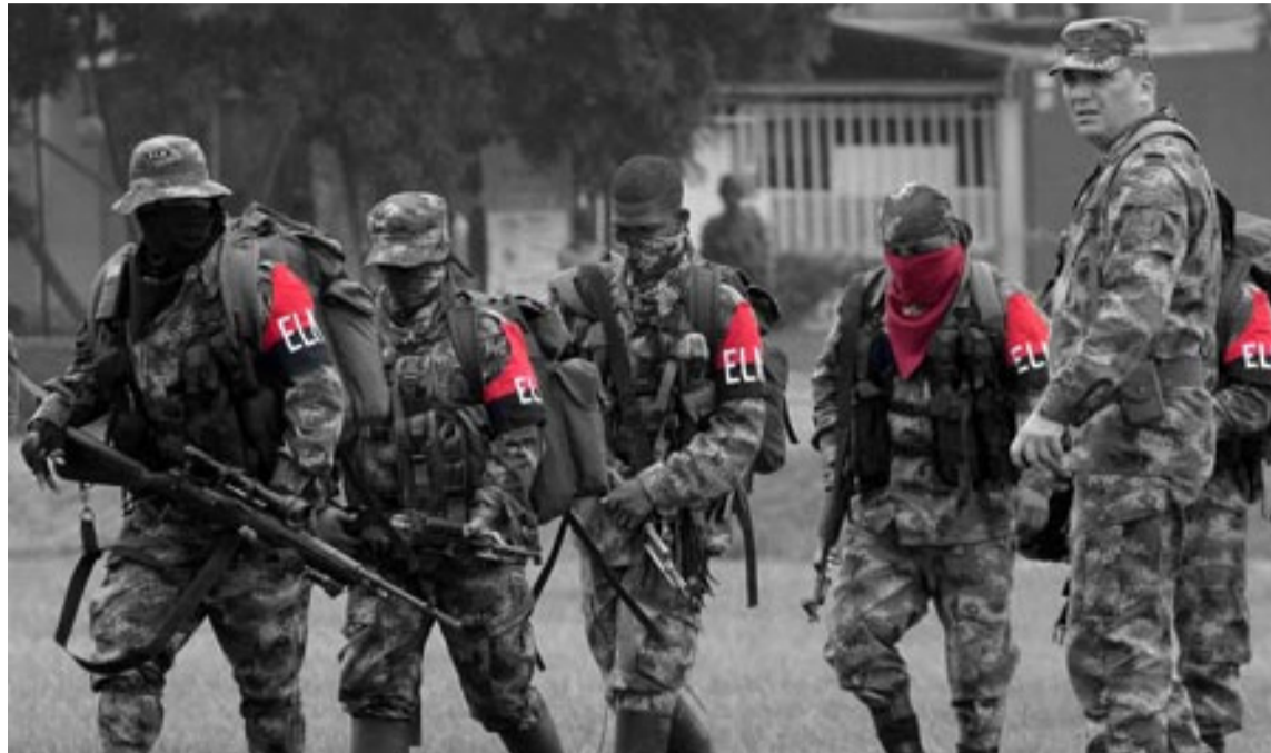
La comunidad internacional está preocupada por la escalada de violencia en el Chocó.

El Chocó es un territorio de gran importancia estratégica para los actores armados ilegales debido a su ubicación, que permite el acceso a corredo-