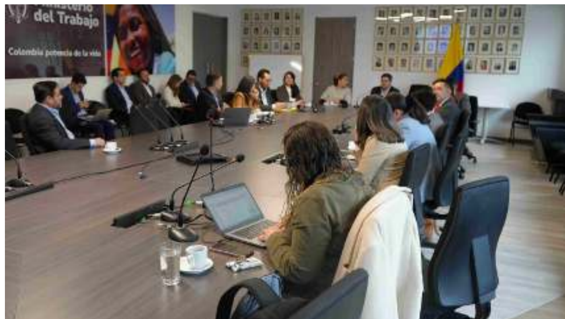
Se vigila que la migración de los datos se surta en cada uno de los actores del sistema.

En el encuentro, realizado en las instalaciones del Ministerio del Trabajo participaron representantes de las Administradoras de Fondos de Pensiones y Asofondos, es decir, las nuevas Administradoras del Componente Complementario de Ahorro Individual (Accai), de los ministerios de Hacienda y Crédito Público y de MinTrabajo, la Superintendencia Financiera y Colpensiones.