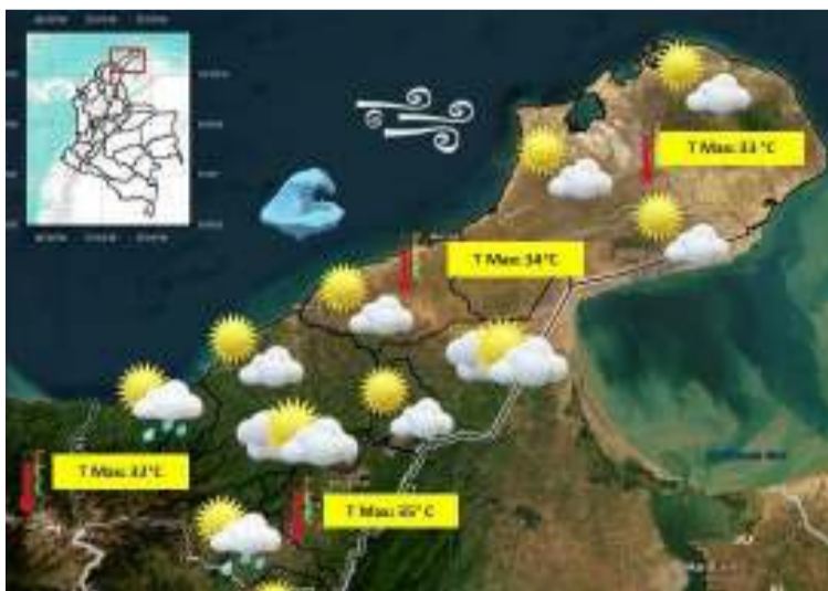
La entidad recomienda evitar quemas a cielo abierto, y extremar precauciones en actividades al aire libre.