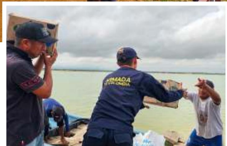
La Administración reconoce el trabajo articulado entre las entidades que hicieron esta gran labor humanitaria.