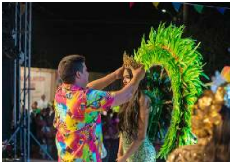
El alcalde solicitó a la comunidad acompañar a la Reina en cada una de las actividades del Carnaval.

DESTACADO Berardinelli dijo que se tiene garantizada la seguridad, para que la comunidad pueda disfrutar con tranquilidad de cada una de las actividades programadas.