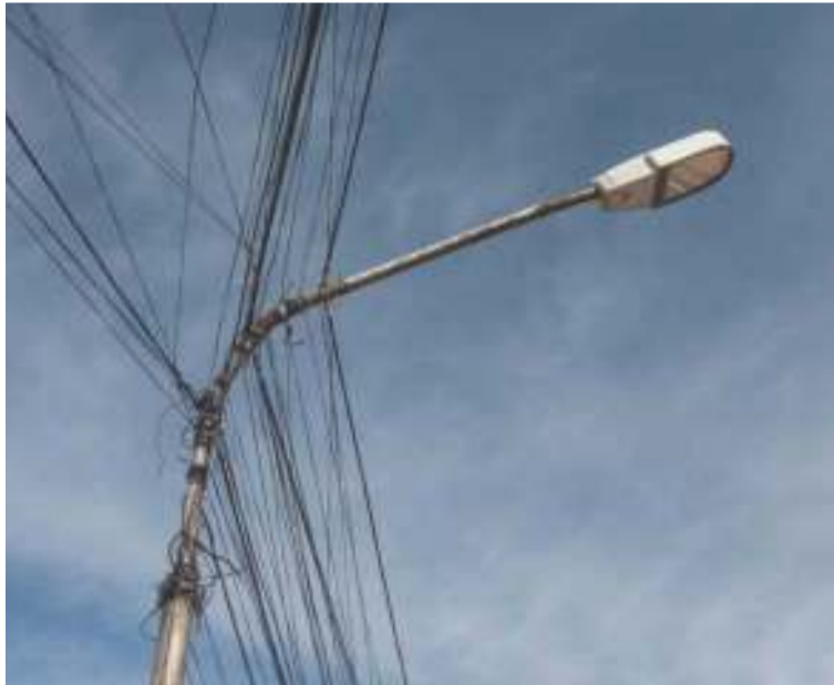
Los alcaldes deben actuar para garantizar que los recursos se destinen a cumplir sus propósitos específicos.

trol, a través de la delegada para la Gestión y la Gobernanza Territorial, resaltó que su actuación preventiva está enfocada en que los municipios y distritos realicen una buena prestación del servicio de alumbrado público, el cual impacta directamente en la seguridad y el desarrollo de las actividades comunitarias de los ciudadanos en cada municipio y Distrito.