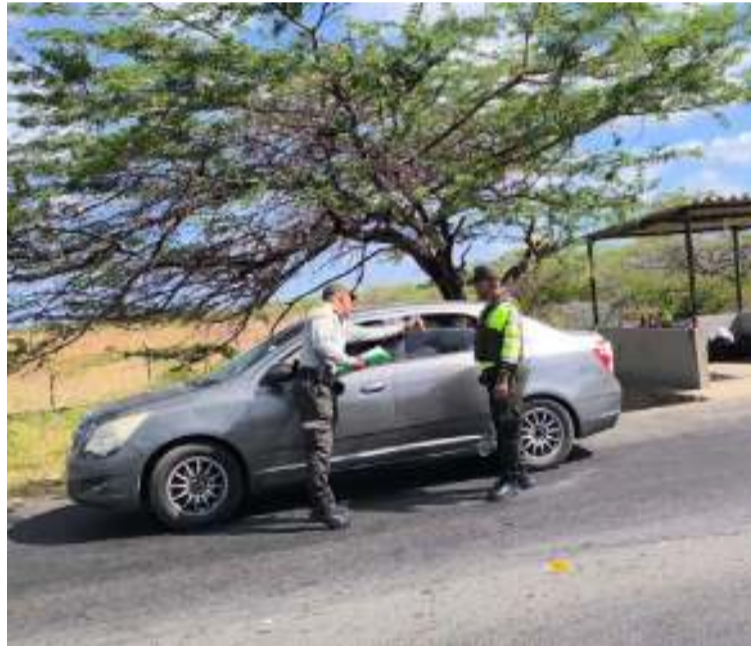
En desarrollo de la iniciativa, se realizaron actividades de prevención y control en la vía Maicao-Paraguachón.

conductores y empresas de transporte terrestre, con el fin de garantizar su seguridad y bienestar.