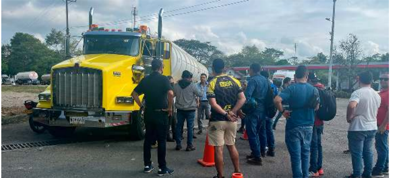
Un total de 16 departamentos, incluida la capital del país, lograron reducciones en fallecidos por siniestros viales.