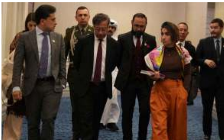
En Doha, la canciller Laura Sarabia acompañó al presidente Petro en el encuentro con el emir de Catar.

La ministra Laura Sarabia informó a la opinión pública que uno de los temas centrales en la reunión con el emir fue el apoyo en la liberación del ciudadano colombiano - israelí, Elkana Bohbot, en el marco de los esfuerzos por la paz que realiza el Gobierno de Catar: “Esperamos poder tener prontas noticias, hay varias operaciones en procesos y negociaciones para que haya paz en la región”, aseguró la canciller.