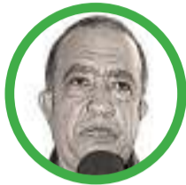
Por Martín Nicolás Barros Choles