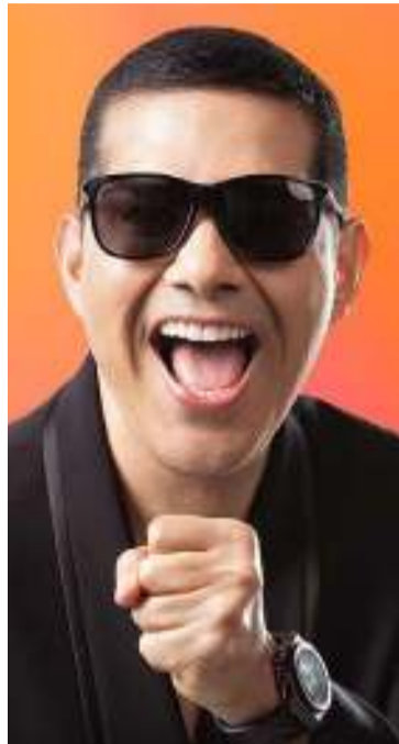
Peter Manjarrés en el 58 Festival Vallenato.

DESTACADO El público podrá disfrutar del repertorio de este gran artista que incluye sus más grandes éxitos, así como las nuevas canciones que siguen conquistando corazones.