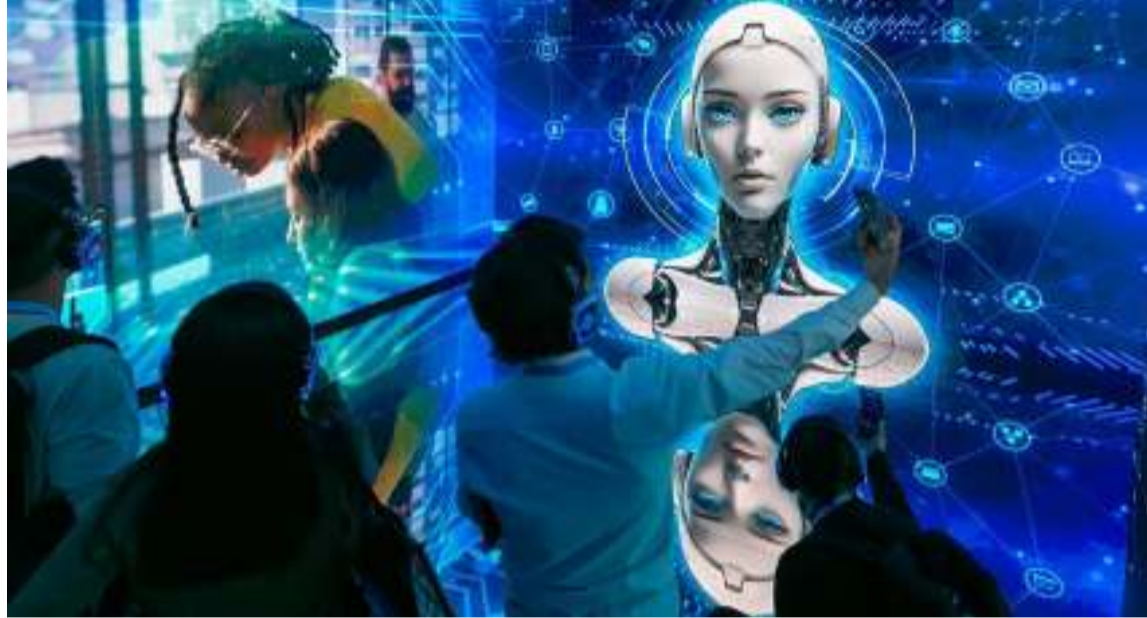
Colombia podrá seguir apostándole a la IA como un motor de crecimiento.

Para lograr que esta tecnología sea un catalizador del desarrollo y crecimiento económico y social del país, el Conpes de IA definió seis objetivos específicos: