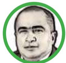
Por Arcesio Romero Pérez