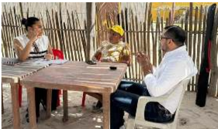
El avance es un testimonio del trabajo realizado por el Departamento a través de la Dirección de Turismo.