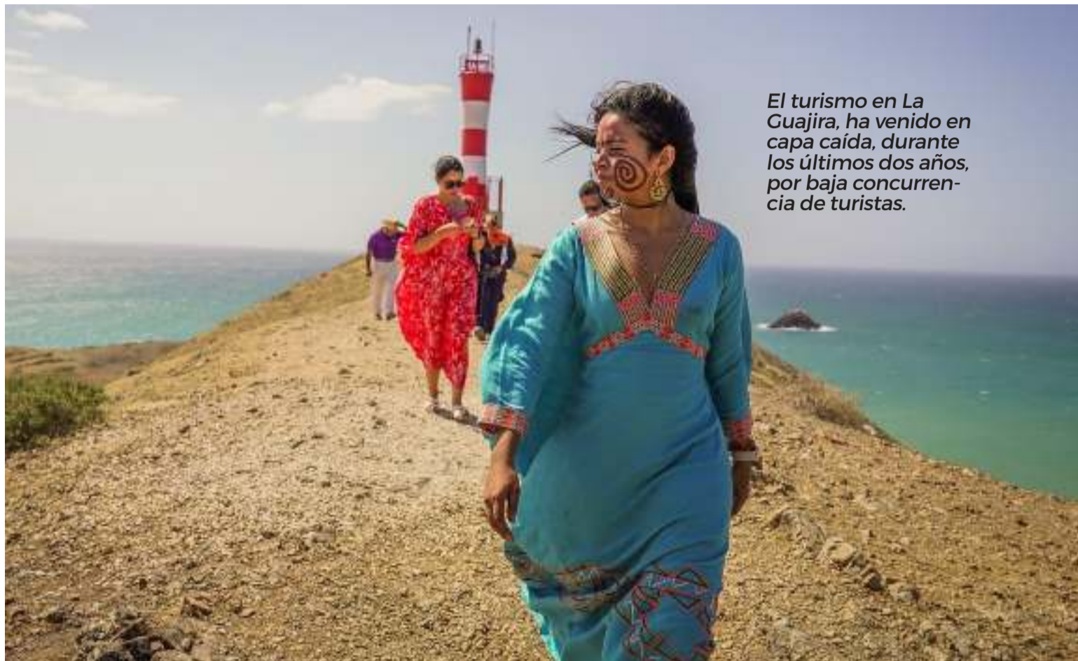
El turismo en La Guajira, ha venido en capa caída, durante los últimos dos años, por baja concurrencia de turistas.

El turismo en La Guajira, ha venido en capa caída, durante los últimos dos años, por baja concurrencia de turistas en altas temporadas, a pesar de estar limitado en capacidad de recepción de hospedajes voluminosos, por lo menos, en el Distrito Turístico de Riohacha, para atender las demandas de visitantes que llegan a quedarse o en tránsito, a conocer la península. Todavía estamos en pañales por falta o escasez del agua, principal causa del retraso, seguido de inseguridad y constantes bloqueos, que nos alejan y