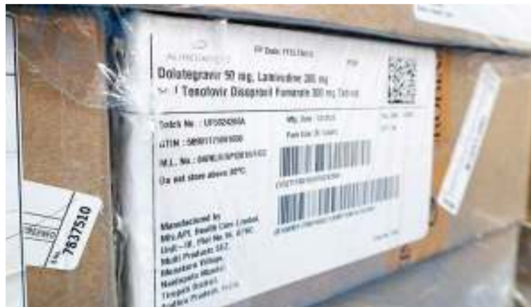
Este avance demuestra el compromiso del Gobierno nacional con el acceso equitativo a los medicamentos.

Con esta medida, se garantiza el derecho fundamental a la salud, protegiendo a la población y a quienes han encontrado en Colombia un hogar seguro, reafirmando así el compromiso gubernamental con la salud pública.