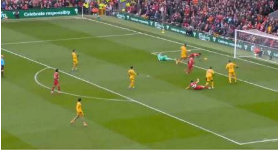
El entrenador Slot confió en él y le dio la oportunidad de destacar en esta ocasión.

Díaz volvió a ser titular en su posición habitual como extremo izquierdo, ocupando el lugar del lesionado Cody Gakpo. A pesar de las críticas por su falta de efectividad, el entrenador Arne Slot confió en él y le dio la oportunidad de destacar en esta ocasión.