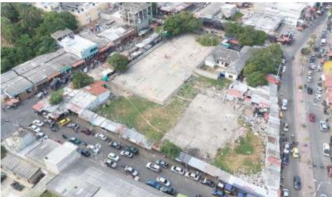
De acuerdo a lo expresado por el alcalde, el proyecto se desarrollará en varias fases.

Esta obra es una realidad gracias al esfuerzo del Gobierno local y nacional para darle viabilidad a este importante proyecto, que generará un impacto positivo en materia de sostenibilidad y desarrollo.