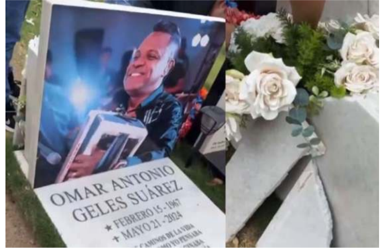
La esposa de Geles mostró en video cómo varias baldosas de mármol y flores en la tumba fueron destruidas.

García, viuda del cantante, denunció a través de sus redes sociales que la tumba donde descansan los restos de Geles fue vandalizada por desconocidos.