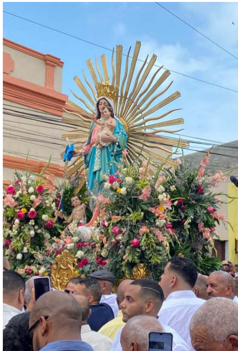
Históricamente los actos religiosos de la Virgen de los Remedios coinciden con la celebración de los precarnavales de Riohacha.

La historia y tradición describen la vinculación de las festividades religiosas