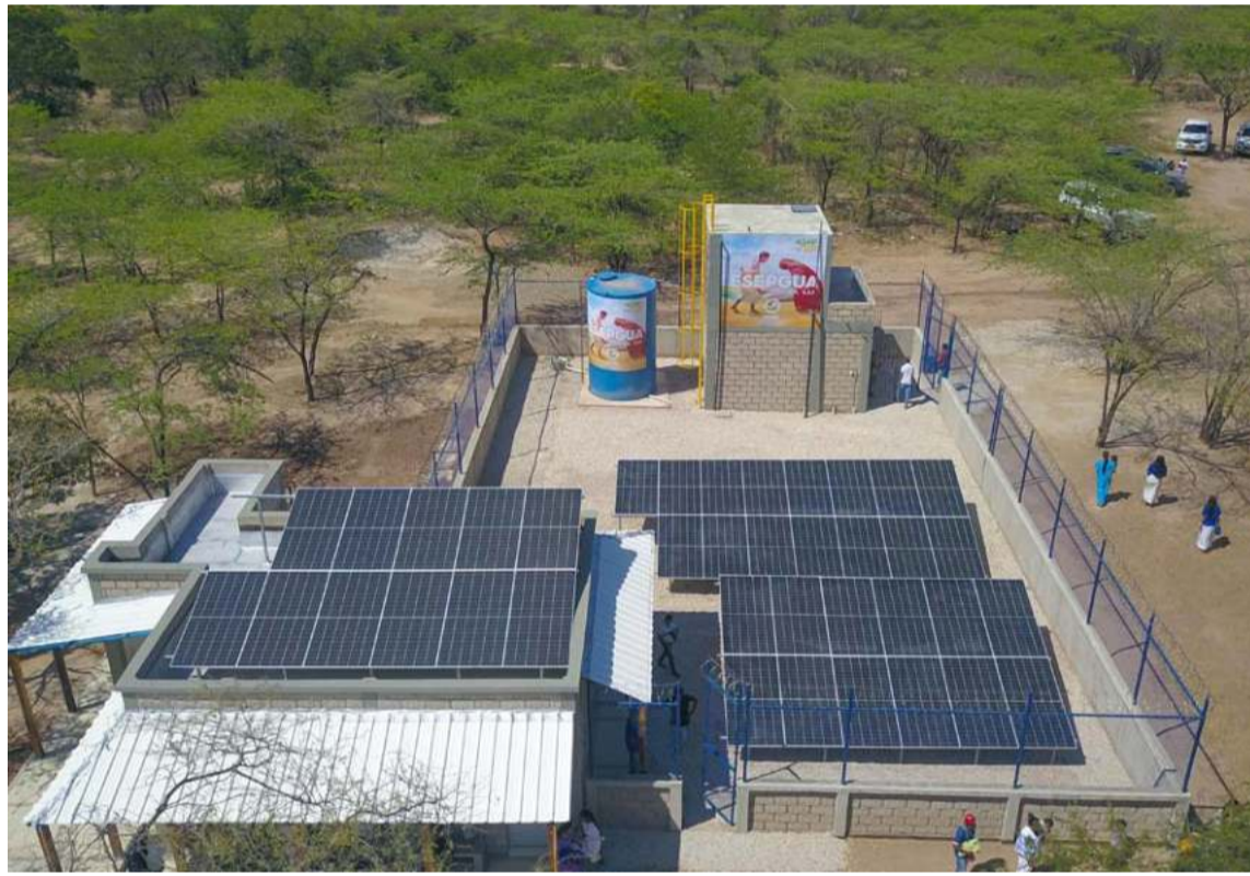
Gracias a la construcción y operación de Plantas de Producción de Agua Potable se ha logrado transformar el acceso al preciado líquido.

Como Empresa de Servicios Públicos de La Guajira, hemos logrado