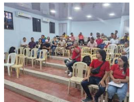
Docentes avanzan en nuevas metodologías.

Esta actividad académica es fundamental para que los docentes de educación física en Riohacha continúen avanzando en las nuevas metodologías para la enseñanza.