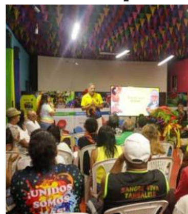
Desfilarán más de 15 mil danzantes.

Para este desfile, el Carnaval de Barranquilla recibió la participación de 117 grupos folclóricos y más de 218 disfraces que junto a orquestas, Reinas y Reyes e invitados, suman más de 15 mil danzantes que desfilarán por la carrera 44 organizados en 7 bloques temáticos que exaltan la diversidad folclórica del Carnaval e invitando al