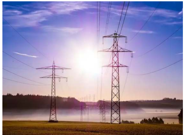
Una vez completadas las pruebas necesarias, XM comenzará a aplicar las nuevas reglas definidas.

La empresa ha asegurado que cumplirá con los plazos establecidos y ha estado trabajando internamente desde antes de la oficialización de la Resolución para adecuar su sistema a las nuevas normativas. XM reafirma su compromiso de operar con eficiencia y rapidez, siempre priorizando la estabilidad del mercado eléctrico en Colombia.