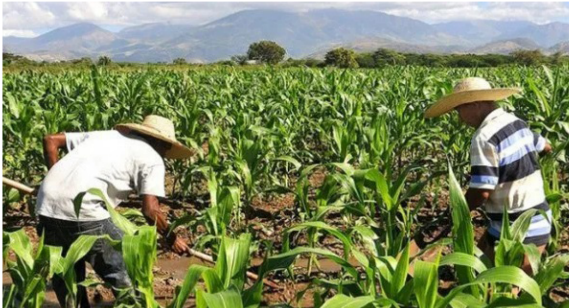
Según la ANT, se busca legalizar y regularizar las tierras de los campesinos.

La Agencia Nacional de Tierras (ANT) ha respondido a esta situación con la presentación del Plan de Seguridad Campesina, que busca legalizar y regularizar las tierras de los campesinos, ofreciendo una alternativa a la expropiación forzada. Esta estrategia parece centrarse en fomentar la