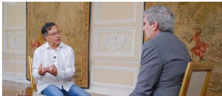
Petro no está de acuerdo con la forma en la que EE.UU. quiere sacar de su territorio a los extranjeros.

Al respecto, insistió que "nosotros admitimos que ellos tienen soberanía sobre su territorio. Nosotros llevamos los aviones y traemos los colombianos (la propuesta)". Incluso