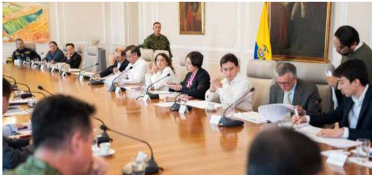
MinComercio explica que el descuento será equivalente al valor comercial de la noche de habitación.

A través del Decreto 0117 del 30 de enero del