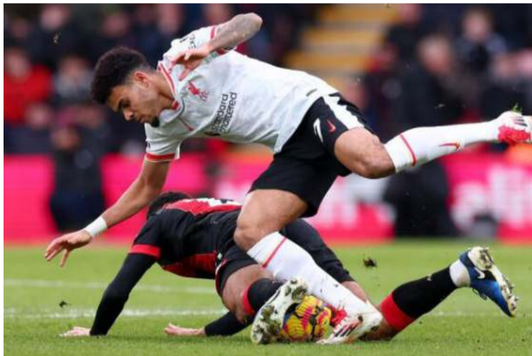
Liverpool se mantiene líder de la Premier con 56 puntos, 9 por encima del Arsenal que enfrentará al Manchester City.

El primer gol del encuentro llegó por parte de Mohamed Salah, quien convirtió un penalti a los 30 minutos con un potente disparo rasante que se coló por el poste izquierdo del portero español Kepa Arrizabalaga.