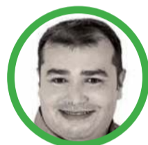
Por José Jaime Vega