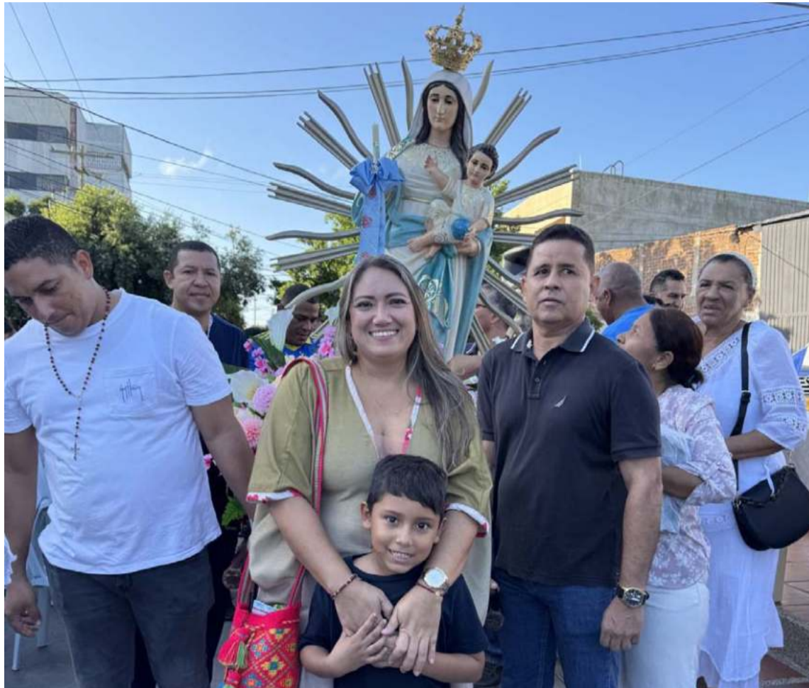
Bendecidos nos sentimos de recibir a nuestra amada Virgen de los Remedios en nuestro hogar.

Durante cada mañana del Santo Rosario la ruta es diferente. Independientemente del amor y la reverencia con que los muchos fieles acudimos a esa cita sagrada, cada día el rezo lleva un ritmo distinto, participan las comunidades de creyentes, las voces que entonan cánticos y plegarias varían, y muchos tienen la oportunidad de llevar la imagen de 'la Vieja Mello' en hombros, especialmente nosotras las mujeres, pues el 2 de febrero es casi imposible lograrlo por la enorme cantidad de varones quienes custodian como celosos guardianes, el turno para cargar la enorme imagen que ese día es delicadamente adornada con flores naturales hermosas de variados colores para recorrer de la mano de sus hijos amados, el marco de la icónica Plaza Almirante José Prudencio Padilla, al son de la música de la banda que cadenciosamente acompaña el lento paso de la multitud andante. Ciertamente presenciar este ritual anual llena de emoción el corazón y alimenta también la esperanza en un mejor presente y futuro para nuestra tierra, guiados por el amor de Dios