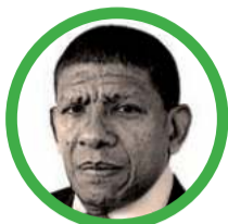
Por Martín López González