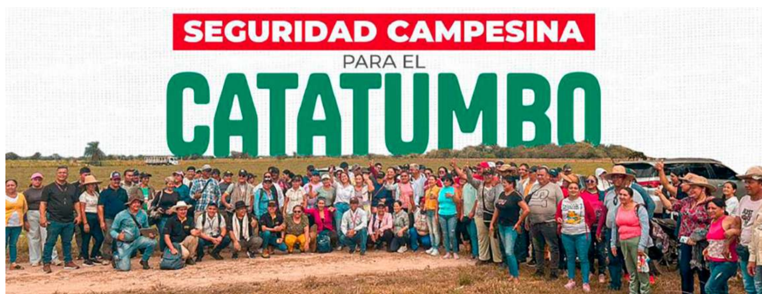
La ANT intervendrá en el ordenamiento social de la propiedad, con medidas sobre la titularidad.

El director de la ANT socializará hoy domingo 2 de febrero con las comunidades de Norte de Santander los alcances del 'Plan Catatumbo' que contiene estrategias para recuperar y fortalecer los sistemas agrícolas campesinos.