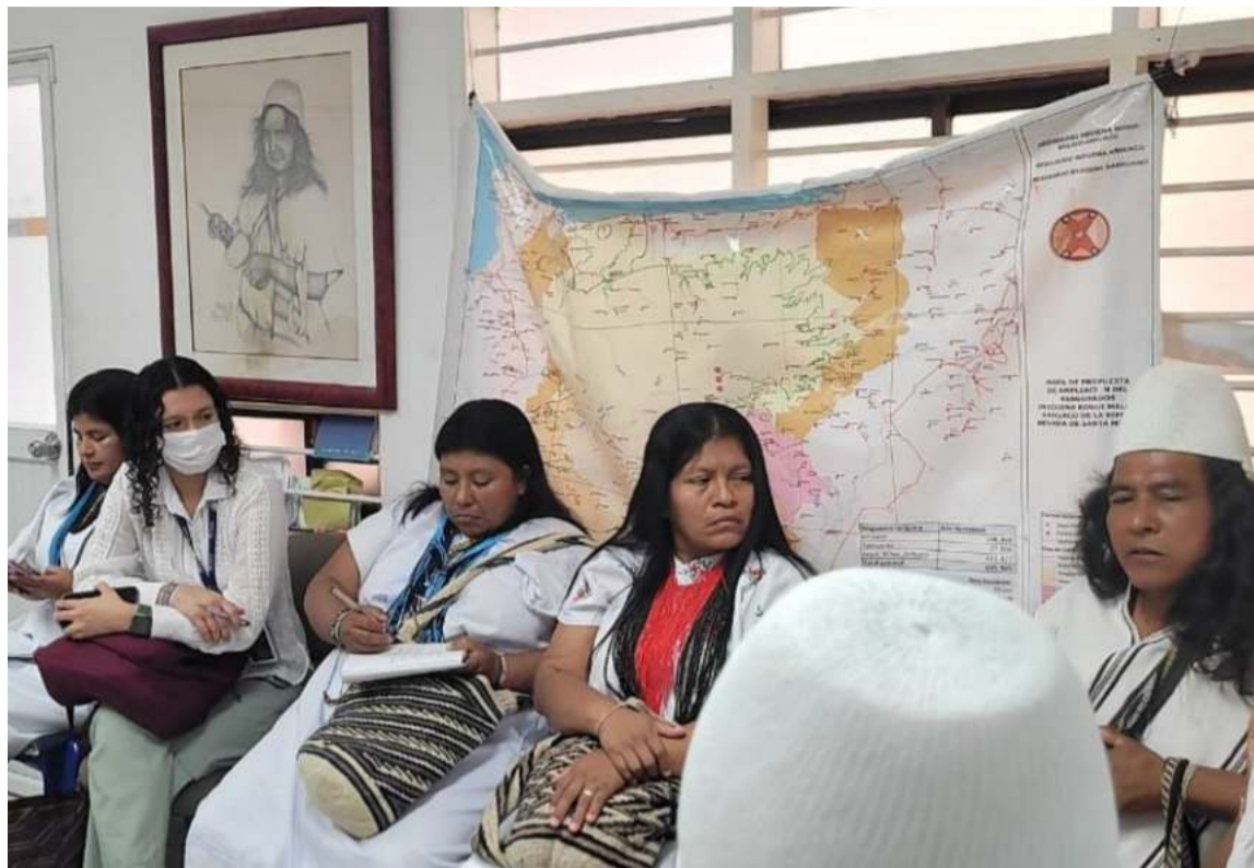
La Defensoría llamó a las autoridades a proteger y salvaguardar la vida de los arhuacos.

riesgo, reiterando el llamado a las autoridades competentes para que adopten las medidas pertinentes en materia de protección y salvaguarda de las vidas de estas comunidades, de cara a las continuas amenazas y situaciones de seguridad denunciadas por las autoridades indígenas del departamento. En la reunión, que con-