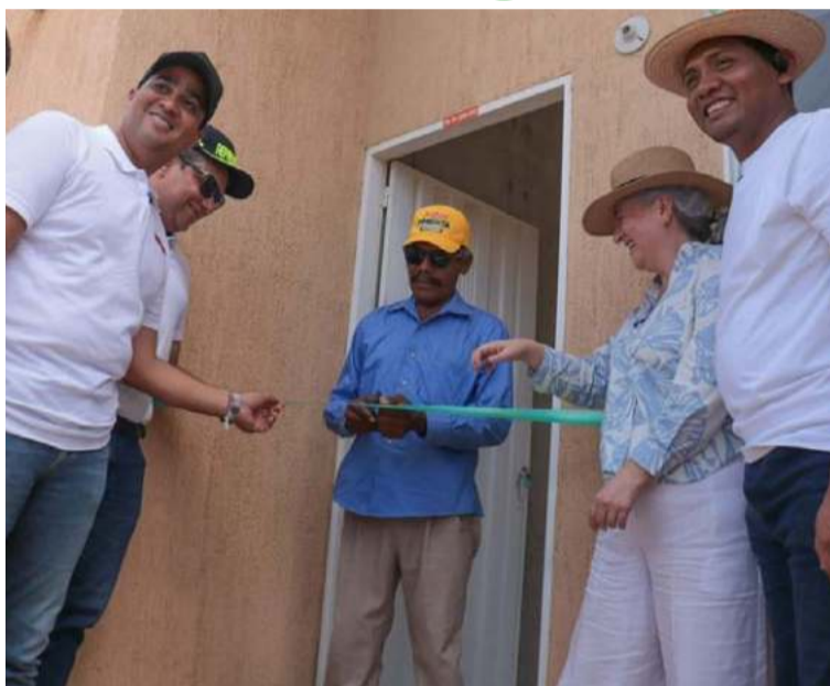
El gobernador hizo entrega de títulos de propiedad a 77 familias de los barrios El Prado y Majayura.