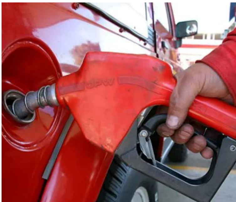
El galón de gasolina aumentó desde ayer $95, alcanzando un nuevo precio promedio de $15.753.