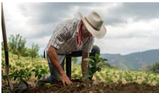
Dice la directora de la URT, que inscribir es la puerta para acudir ante la justicia.

E l desarrollo de herramientas de seguimiento al trabajo liderado por los abogados sustanciadores de la Unidad de Restitución de Tierras (URT), permitió que 4.383 solicitudes quedaran inscritas el año pasado en el Registro de Tierras Despojadas y Abandonadas Forzosamente (Rtdaf). De esta forma, se habilita el proceso para que 89.742 hectáreas regresen a sus legítimos dueños.