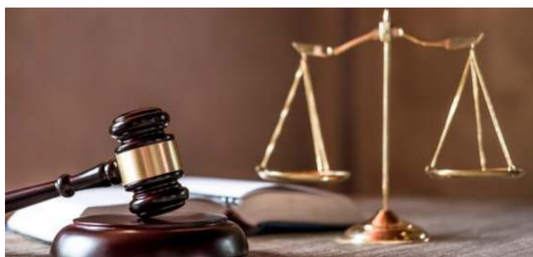
Se busca modificar el artículo 199 de la Ley 1098 de 2006, sobre mecanismos sustitutos y subrogados penales.

ñalar que el principio de oportunidad es la facultad constitucional que le permite a la Fiscalía General de la Nación, adelantar la persecución penal, suspenderla, interrumpirla o renunciar a ella, por razones de política criminal, según las causales taxativamente definidas en la Ley, con sujeción a la reglamentación expedida por el fiscal General de la Nación y sometido a control de legalidad ante el juez de Garantías.