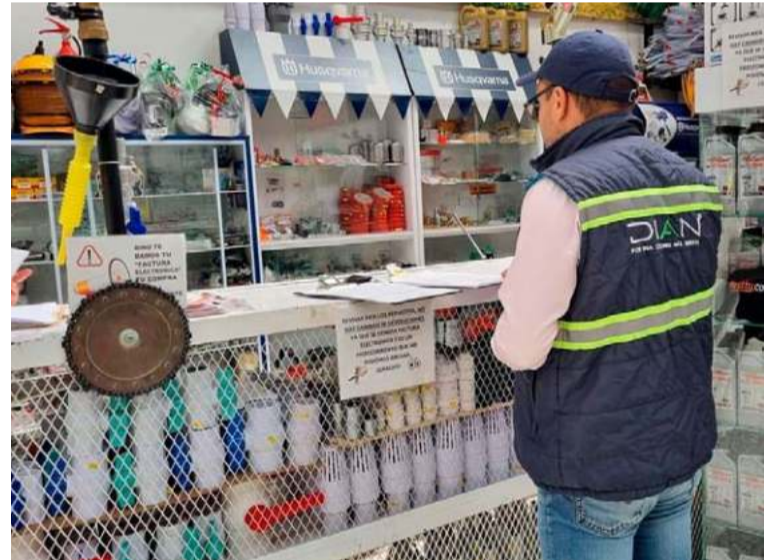
Deudores morosos no han cancelado obligaciones tributarias por valor de $1,2 billones.

En cuanto a cobro, en 2024 la Dian recuperó una cartera cercana a los $ 22,5 billones, de los cuales $ 12 billones fueron producto de las jornadas de cobro que se realizan mes a mes.