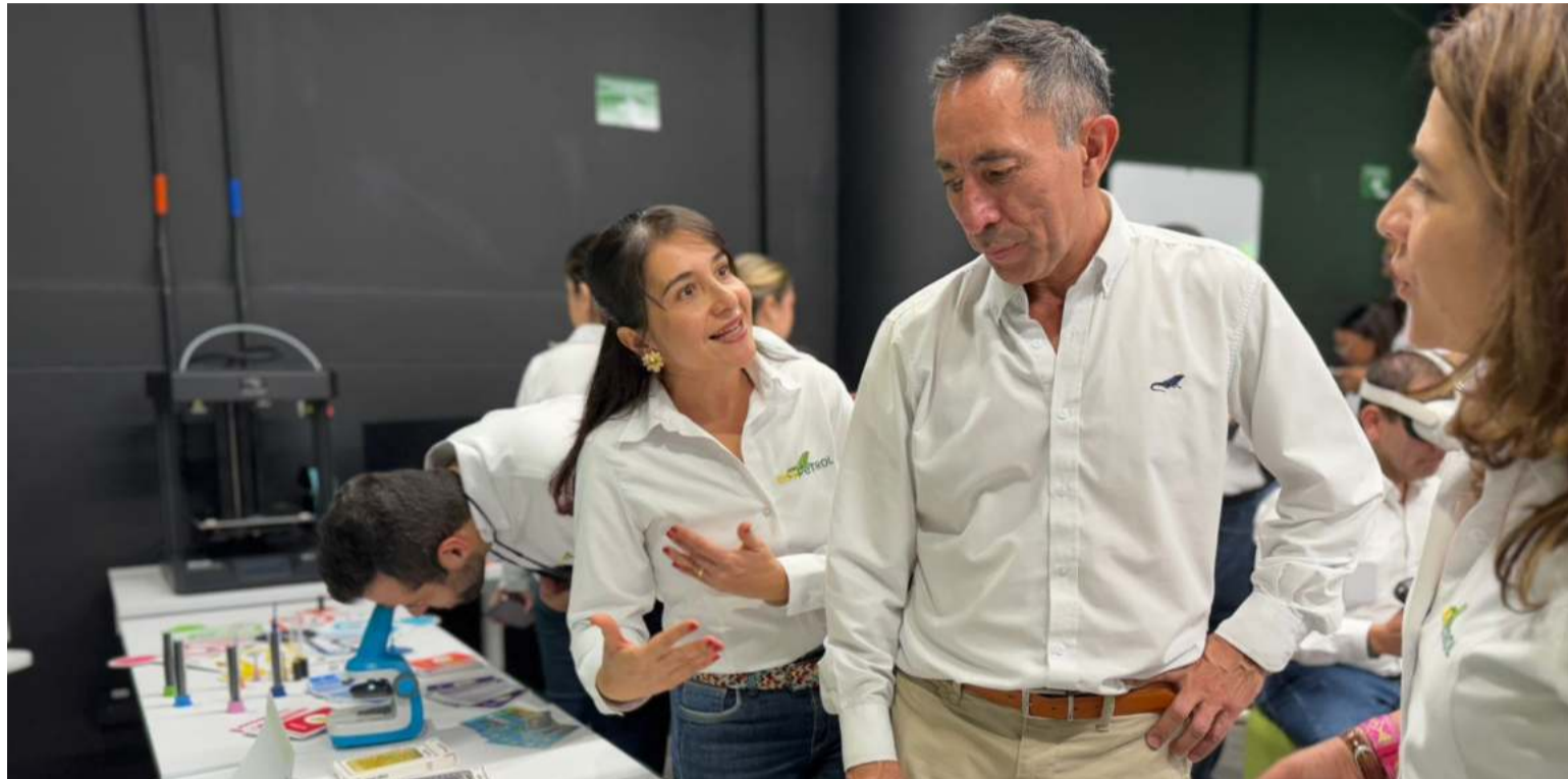
La reunión anunciada por el gobernador Aguilar y avalada por Ecopetrol se reprogramó para este 28 de enero.

Adicionalmente el mandatario acordó con el presidente Ricardo Roa, una reunión de alto nivel con la participación de Petrobras