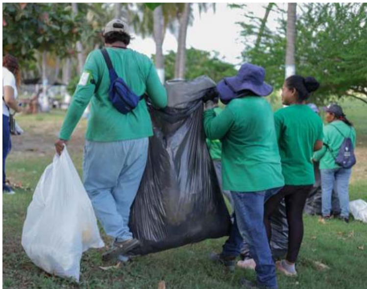
Se busca embellecer las playas y generar conciencia sobre la importancia de cuidar los ecosistemas.