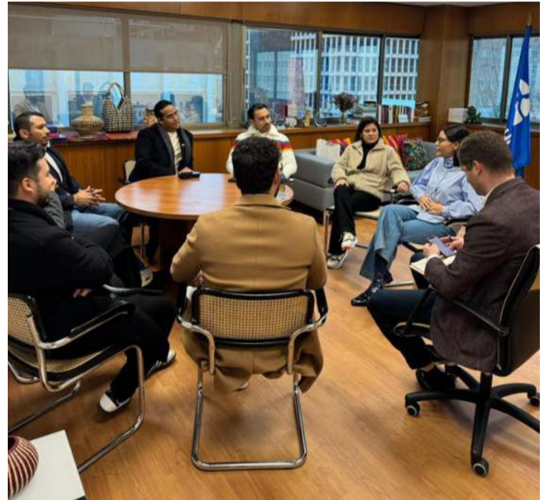
El gobernador Jairo Aguilar se reunió con Natalia Bayona, y definieron acciones para impulsar el sector.

De igual manera, se realizó una mesa de diálogo con Norwegian Cruise, una compañía naviera con operaciones en Sudamérica, para gestionar la posible inclusión de La Guajira en su portafolio de destinos. Además, Glenn Cauwenberghs, Ejecutivo de Innovación de ONU Turismo, ofreció su respaldo para desarrollar procesos innovadores en el sector y fortalecer las capacidades de los empresarios locales.