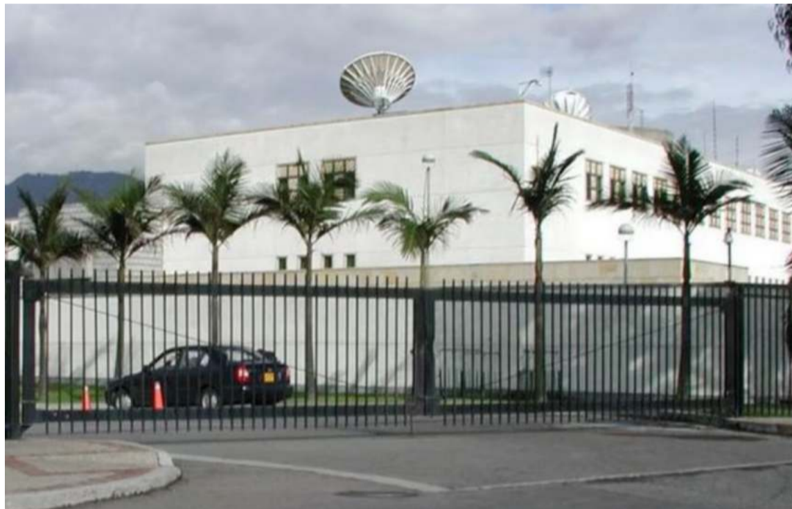
Marco Rubio ordenó el cierre de trámites de visado en Colombia a partir de hoy.

La administración Trump envió dos vuelos cada uno con 80 migrantes colombianos irregulares previamente detenidos en la Unión Americana. La deportación había sido previamente anunciada y aprobada por altos funcionarios de ambos países. Se espera que más medidas sean anunciadas en las próximas horas por el De-