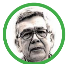
Por Normando José Suárez Fernández