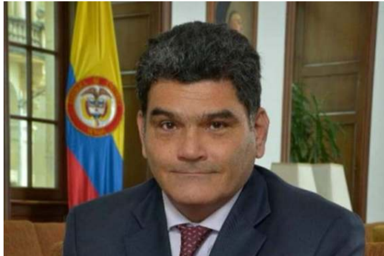
El tribunal adelanta el estudio de varias demandas que buscan tumbar la elección de Eljach.

Además desestimó el argumento de que Eljach fue seleccionado por el presidente de un listado de aspirantes elaborado por el Dapre pues menciona que, en ese caso,