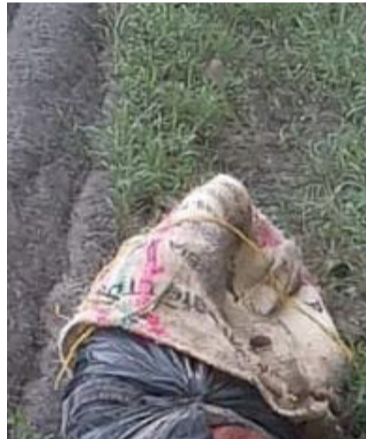
Se realizan diferentes pruebas para dar con la identidad de estas personas.

En la morgue de Medicina Legal de la ciudad de Santa Marta, permanecen los restos mortales de dos personas que hallaron en diferentes municipios del departamento de La