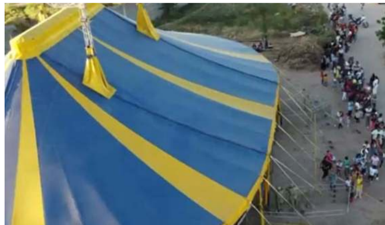
Los asistentes podrán apreciar mimos, payasos, acróbatas, deportistas, magos y mucho más.

Mimos, payasos, acróbatas, deportistas, magos y mucho más, apreciaron los asistentes a la función, un show que ofrece el Circo Colombia, donde por dos horas las personas estuvieron llenas de mucha alegría y risas, momentos inolvidables que queda-