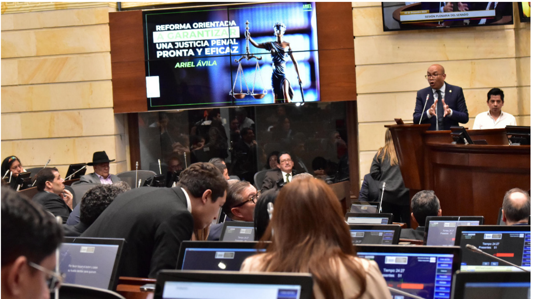
El primer cambio o propuesta de innovación busca modificar el artículo 77 de la Ley 906 de 2004 actual CPP.