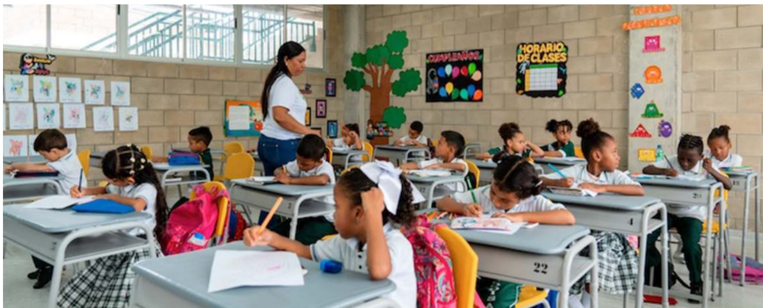
Se busca que los maestros brinden a los estudiantes mejores herramientas de enseñanza y aprendizaje.

De esta manera se sigue revolucionando la vida de los educadores de los territorios con mejores condiciones, formación pertinente y de calidad.