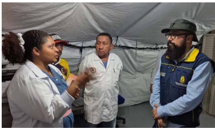
El hospital tiene capacidad para atender pacientes en condiciones de observación y hospitalización.

climatizadas, tiene capacidad para atender pacientes en condiciones de observación y hospitalización.