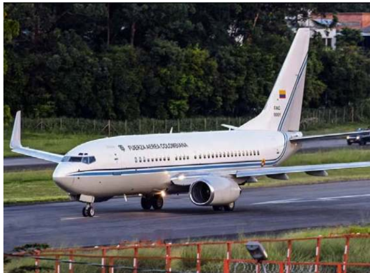
El Gobierno de Colombia mantiene conversaciones activas con la administración de los Estados Unidos.

En preparación para esta cumbre, se han sostenido conversaciones con Honduras, país que ocupa la presidencia de la Celac, con el fin de promover un enfoque regional frente a