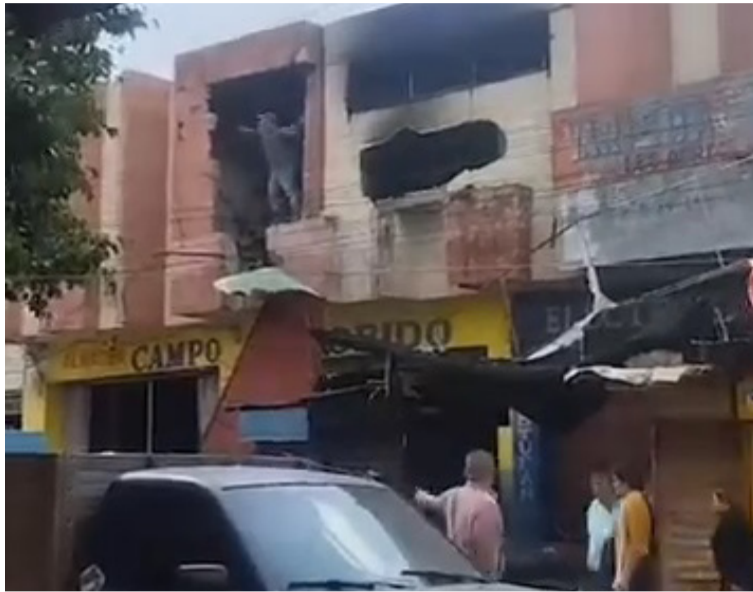
Las pérdidas materiales fueron millonarias en infraestructura y la mercancía se quemó por completo.

La conflagración duró más de 10 horas, tiempo en el que los miembros del Cuerpo Voluntario de Bomberos, Policía Nacional, Alcaldía de Maicao, comerciantes y población civil estuvo activo tratando de apagar las llamas que se encontraban en la parte interna del local co-