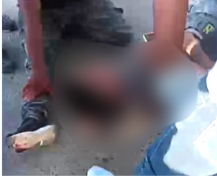
Al parecer el exceso de velocidad mezclado con licor sería la causa de dos accidentes en Riohacha.

Según la versión de testigos, el conductor de la moto perdió el control, lo que ocasionó que las dos personas cayeran a un costado de la mencionada vía, resultando un