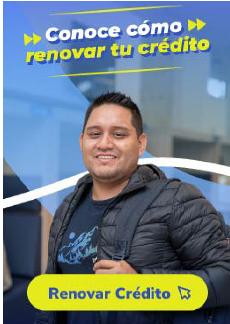
Si el estudiante cumple con los requisitos la IES se encargará de gestionar la renovación de la financiación.

Dentro de las Universidades que tienen convenio con esta entidad está la Fundación Universitaria San Martín, que la sema-