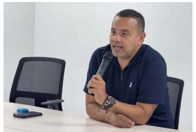
Velásquez dijo que en la mesa se analizará el documento que se construyó a través de la mesa de empleabilidad.

Al tiempo recordó que desde la Administración se brindan todas las garantías para aportar al proyecto y lograr que se convierta en una realidad