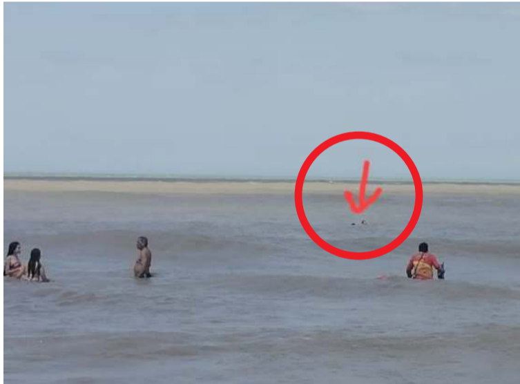
Los salvavidas atendieron la emergencia de manera inmediata. Sacaron sanos y salvo a los dos menores.

Los menores fueron llevados hasta la orilla de las playas en donde recibie-