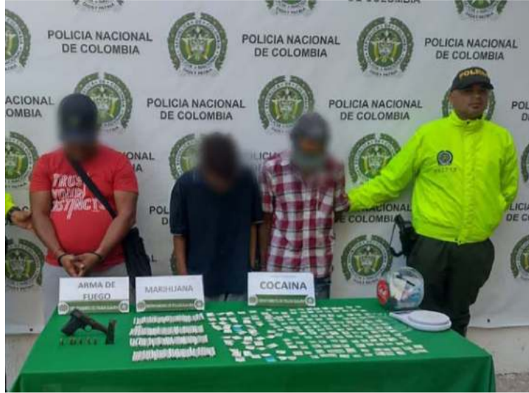
Los capturados y los elementos decomisados fueron puestos a disposición de la Fiscalía URI de Riohacha.

Durante el procedimiento, las autoridades capturaron a alias 'Luchito', señalado como uno de los principales dinamizadores del tráfico local de sustancias ilícitas en la zona. Además, se le en-