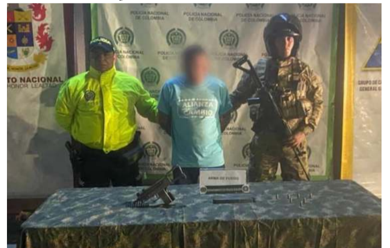
La diligencia de allanamiento y registro al mencionado sujeto, se realizó en zona rural de Maicao.

La Policía y el Ejército Nacional agradecen la colaboración de la comunidad e invitan a continuar denunciando cualquier actividad sospechosa que pueda poner en riesgo la tranquilidad y seguridad en el Departamento.