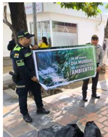
Grupo de Protección realizó actividades preventivas.

En conmemoración del Día Mundial de la Educación Ambiental, la Policía de Maicao realizó una serie de charlas educativas, distribución de volantes y mensajes en pendones que invitaban a reflexionar sobre la importancia de cuidar el medio ambiente.