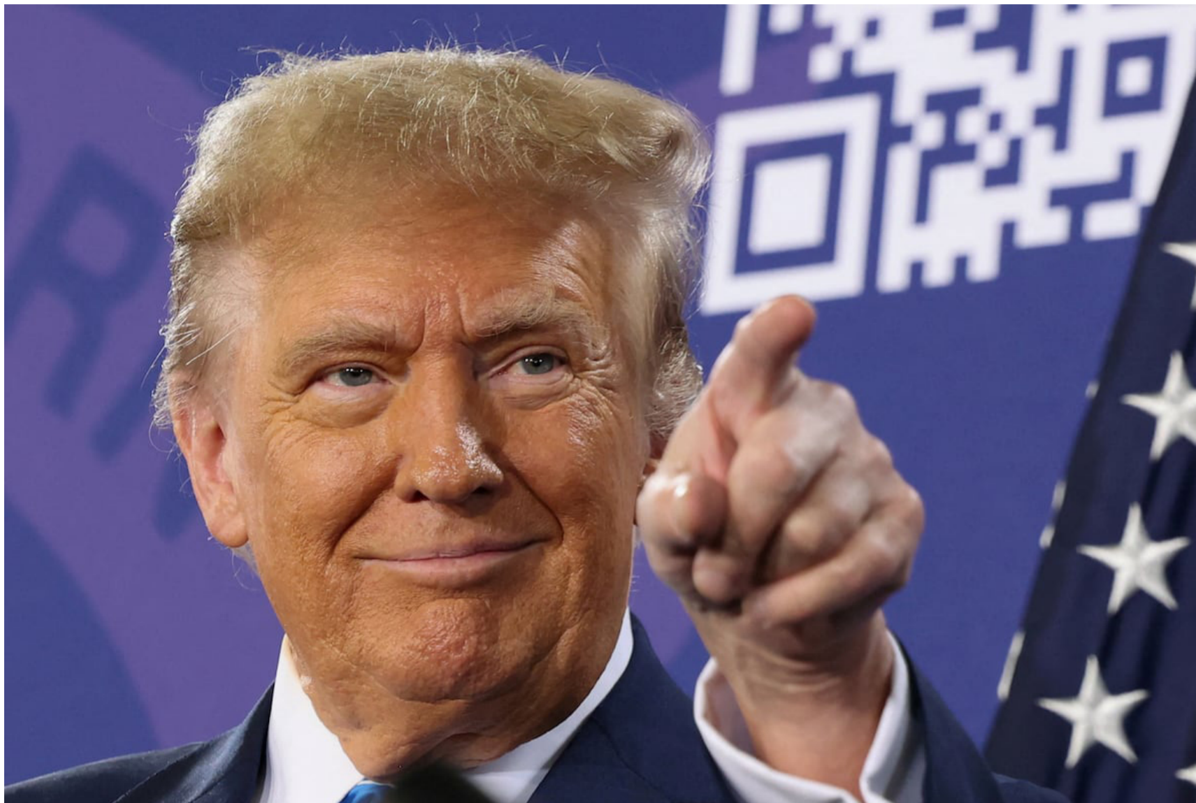
Donald Trump declara abiertamente una amenaza a sus vecinos México y Canadá con aumentos arancelarios del 25%.