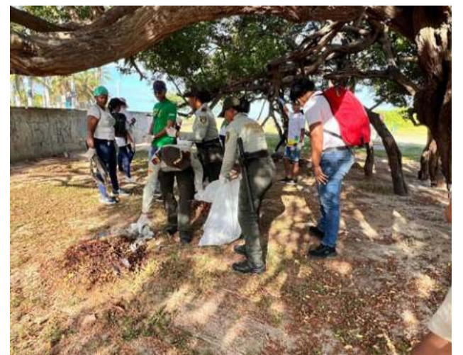
Este tipo de iniciativas son fundamentales para la protección y el disfrute de las playas y espacios urbanos,