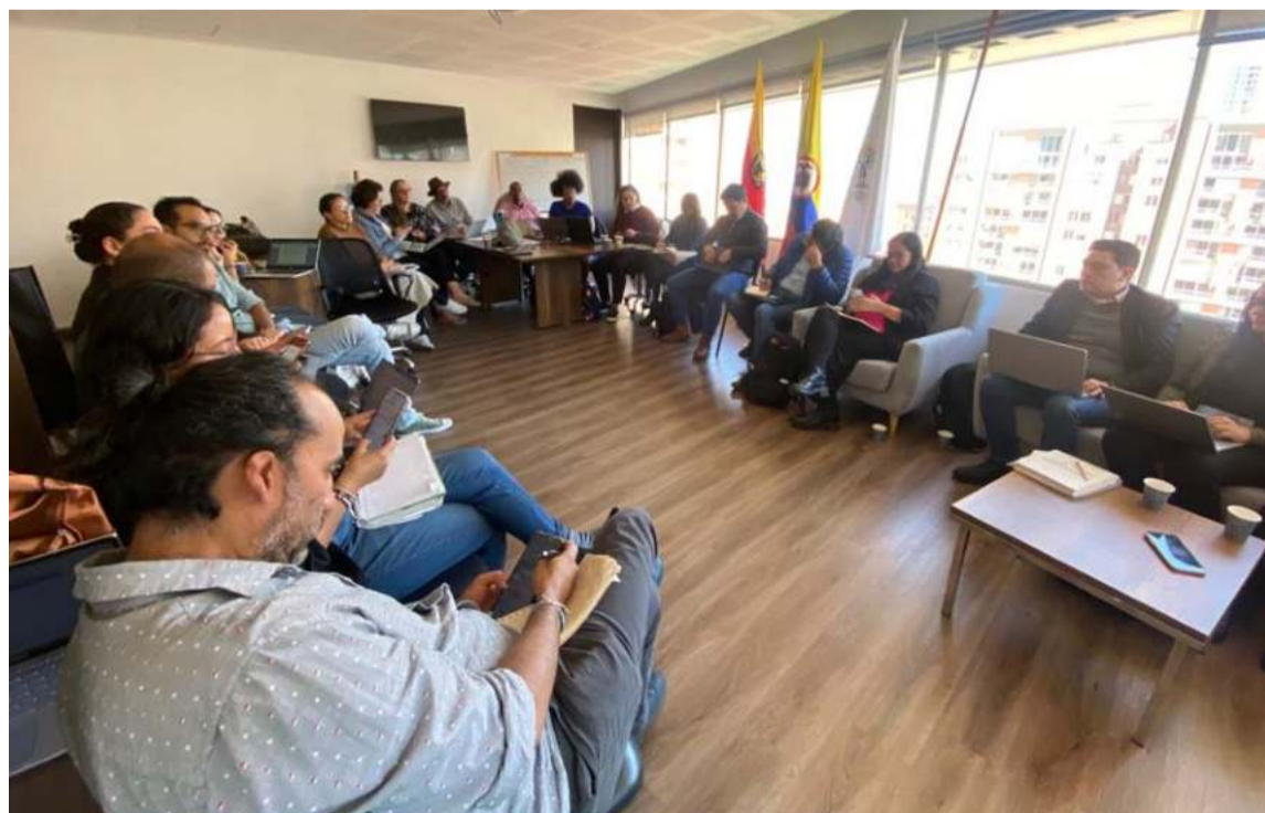
Se busca concretar y garantizar cambios importantes en los territorios afectados.

Las acciones están enfocadas en reuniones bilaterales que se adelantarán en el 2025, al igual que un Subcomité de Restitución de Tierras Ampliado, que se desarrollará con el fin de dar claridad sobre el proceso, su alcance y las acciones presupuestales a seguir para su cumplimiento.