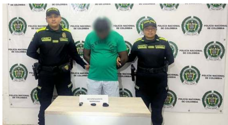
Uniformados le hallaron en su poder una bolsa plástica que contenía 110 gramos de marihuana.

En el marco de la lucha frontal contra el microtráfico, la Policía Nacional logró la captura de una persona que presuntamente pretendía comercializar sustancias estupefacientes en menores cantidades.