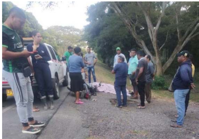
Se indicó como primera hipótesis que el conductor de la moto no utilizaba señales reflectivas o luminosas.

Las autoridades de tránsito continúan haciendo el llamado a los usuarios viales para que hagan uso de las señales e implementos de tránsito con el fin de evitar situaciones en las que pongan en riesgo sus vidas y las de sus acompañantes.