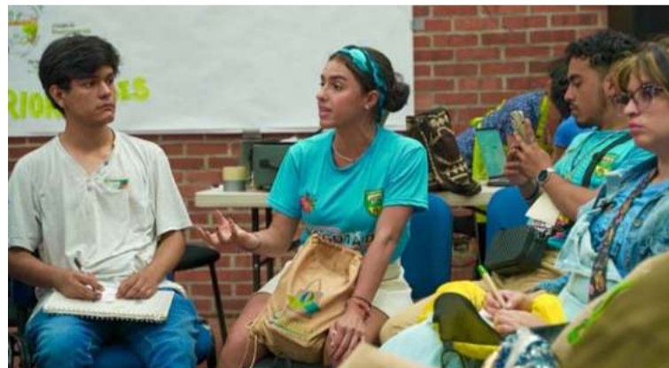
Para el Gobierno nacional, la educación ambiental es un pilar fundamental para el desarrollo sostenible.

“Estamos muy contentos porque hemos avanzado profundamente en el proceso de actualización de la Política Nacional de Educación Ambiental.