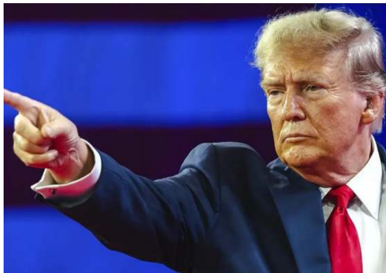
Trump advierte que la negativa de Colombia a aceptar deportaciones pone en riesgo a Estados Unidos.

Trump justifica estas acciones citando preocupaciones de seguridad nacional, argumentando que la negativa de Colombia a aceptar deportaciones pone en riesgo a Estados Unidos. Esta si-