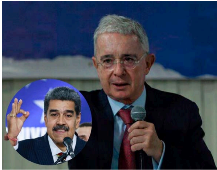
El partido CD le dijo a Maduro que cobarde el tirano que reprime la protesta, encarcela y persigue a sus opositores.

Ante esto, la colectividad aseguró que el verda-