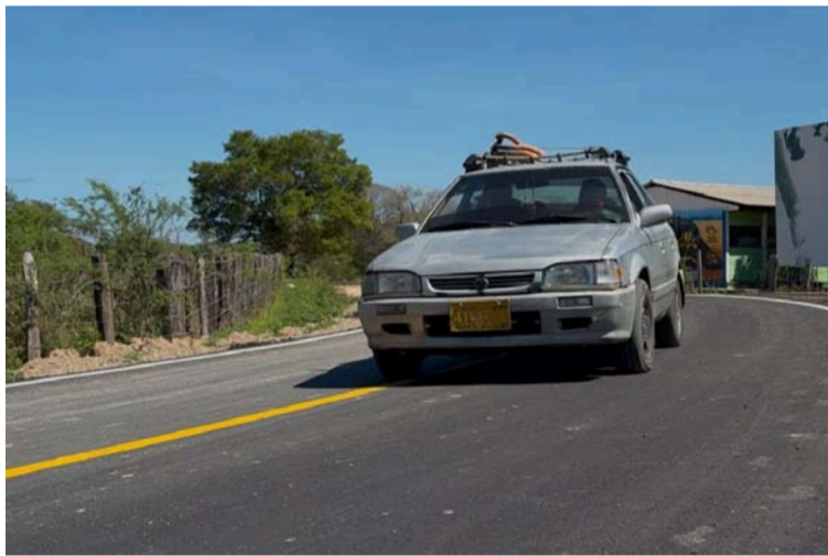
Explicó el gobernador Jairo Aguilar que esta obra fue retomada y finalizada durante la actual Administración.

El tramo vial conecta a comunidades que antes enfrentaban enormes dificultades de movilidad, lo que limitaba su acceso a servicios básicos y oportunidades económicas. Ahora, gracias a esta obra,