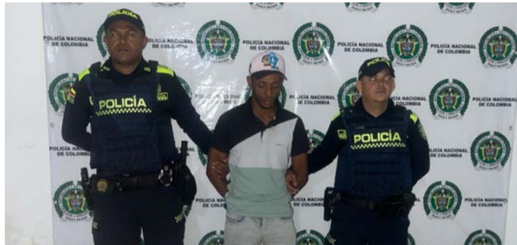
El operativo de captura fue realizado el pasado viernes 10 de enero de 2025, aproximadamente a las 12:50.

El procedimiento fue ejecutado por uniformados de la Estación de Policía de Barrancas, quienes reiteraron su compromiso con la seguridad y la convivencia ciudadana en la región.