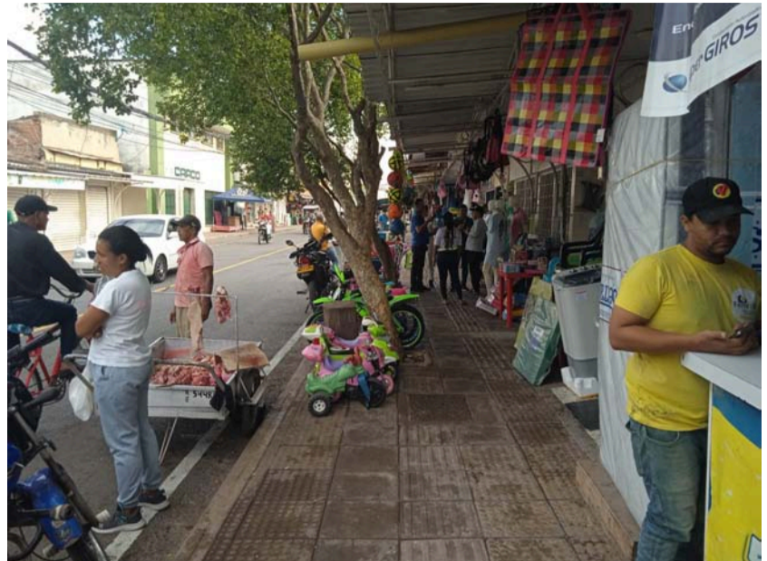
Se busca ordenar el tránsito y recuperar el espacio público para generar un entorno comercial más estructurado.

Eso sí, piden garantías en su reubicación