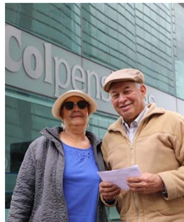
Afiliados tienen hasta el 16 para elegir su Accai.

El próximo 16 de enero vence el plazo establecido por la nueva Reforma Pensional (Ley 2381 de 2024) para que los afiliados a Colpensiones que no estén en régimen de transición elijan su Administradora del Componente Complementario de Ahorro Individual (Accai).