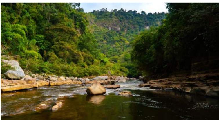
Esta selección reafirma el creciente interés global en la riqueza cultural, histórica y natural del país.

Estos medios destacan la creciente relevancia de la industria de cruceros en Colombia, impulsada por un hito trascendental en el turismo fluvial: la navegabilidad del río Magdalena, que se iniciará próximamente con los