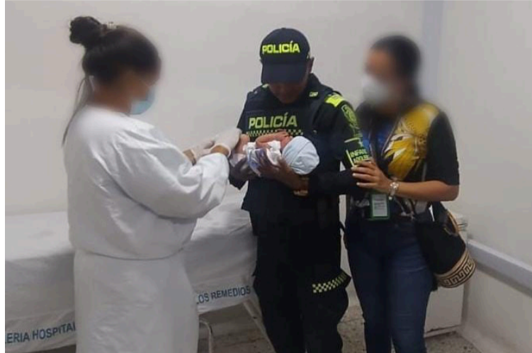
Los médicos dijeron que la bebé tenía apenas un día de nacida, lo que hizo aún más conmovedor el rescate.

En cuestión de minutos, funcionarios del Grupo de Protección a la Infancia y Adolescencia, junto con uniformados de la Estación de Policía Riohacha,