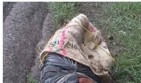
El cuerpo registraba evidentes signos de violencia. El hallazgo fue reportado por algunos conductores.

Asimismo, las autoridades competentes hicieron un llamado a los conductores y peatones de las calles y carreras de Fonseca a no exceder los límites de velocidad y tener mucha prudencia al momento de desplazarse en cualquier lugar, este llamado se hace con el fin de evitar este tipo de incidentes trágicos.