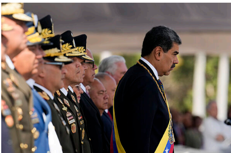
Hasta cuándo durará la tragedia de Venezuela por cuenta de un narco régimen instalado en ese país.

No sirvió la diplomacia para evitar que Maduro se quedara, entonces hay que mirar otras opciones. Aprovechando el aumento de la recompensa por la cabeza de Maduro, no queda otra vía que 'cazar' al dictador y sus cómplices, capturarlos, enjuiciarlos y condenarlos por los crímenes cometidos, o darles de baja en una operación militar tipo comando. Hay que sacar a Maduro por la fuerza, no hay otra, para liberar a Venezuela de ese Gobierno corrupto y mafioso que apesta y evitar que haga metástasis en otras democracias del continente.