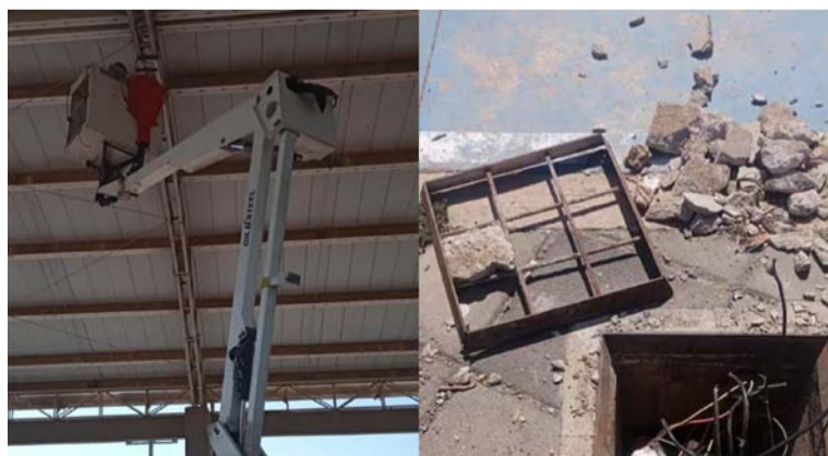
Los delincuentes sustrajeron 24 metros de tubería MT y más de 100 metros de cable forrado de cobre.

La infraestructura de alumbrado público del parque ‘Sacúdete’, en el barrio Nuevo Amanecer de Valledupar, fue objeto