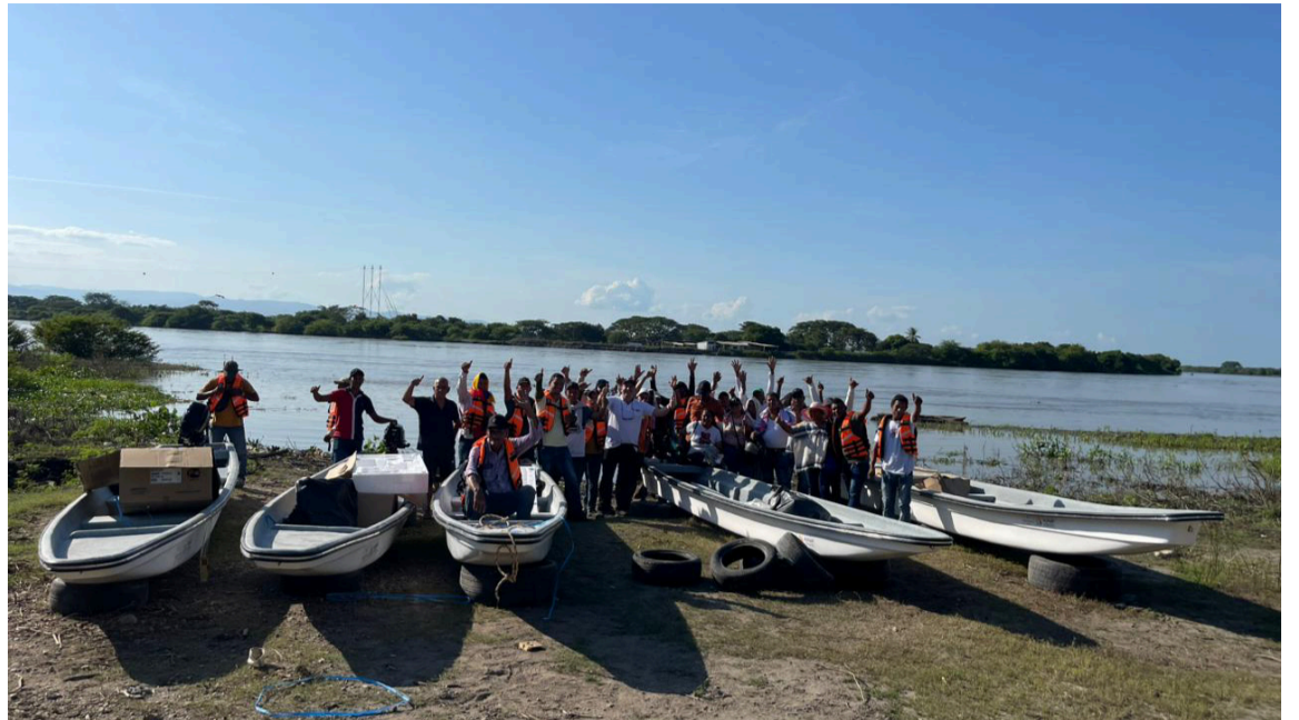
Las herramientas servirán para transformar la vida de los pescadores del municipio, al tiempo que fortalecerán la economía local.