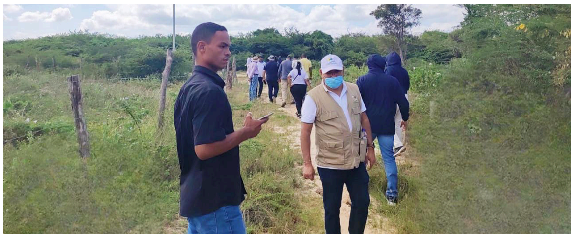
Las autoridades continuarán trabajando en conjunto para encontrar soluciones efectivas que beneficien a la comunidad.