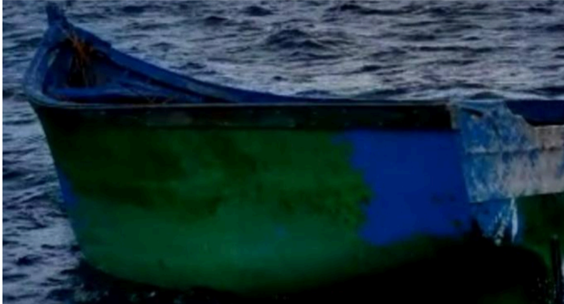
Pescadores locales se percataron de un fuerte olor proveniente de la embarcación.

Guardacostas y personal de rescate desplegaron un operativo para localizar la embarcación, una tarea