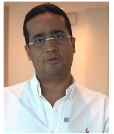
Jairo Aguilar, gobernador de La Guajira.

“Es cerrar el territorio para las operaciones que se están realizando dentro de este gran espacio, que hasta el momento no ha dejado ni una sola regalías, o sea, aquí están oportunidades laborales, en el caso por ejemplo