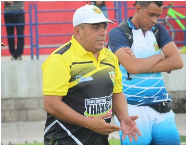
El llamado es para los jóvenes talentos que deseen formar parte de este ambicioso proyecto deportivo.

de vida de técnicos provenientes de Venezuela, Argentina, Valledupar, San Juan del Cesar, Barrancas y de otros lugares. Estamos evaluando cuidadosamente sus capacidades y trayectorias para tomar la mejor decisión", aseguró Romero.