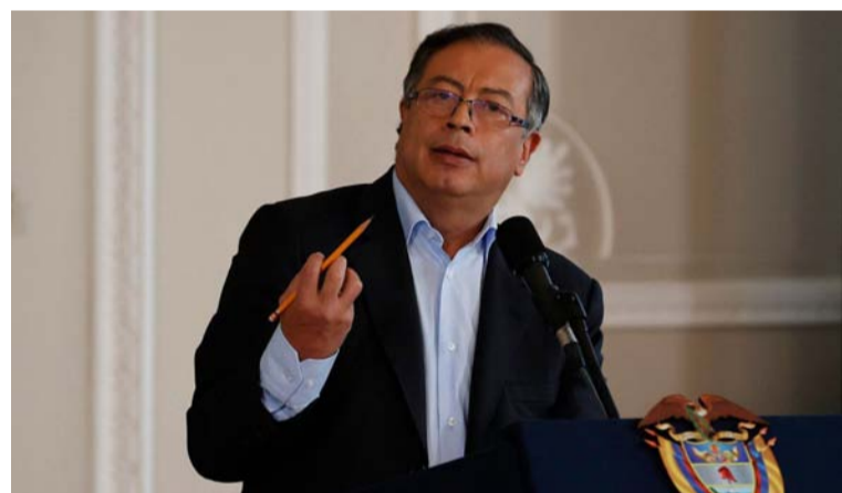
El presidente Gustavo Petro defendió la decisión de mantener relaciones diplomáticas con Venezuela.

Contratos formales: Se recomienda siempre contratar con profesionales inmobiliarios reconocidos y formalizar los acuerdos por escrito para evitar confusiones o conflictos legales.