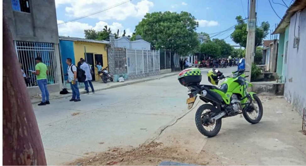
Testigos dijeron que las víctimas se encontraban departiendo desde la noche del sábado frente a su residencia.