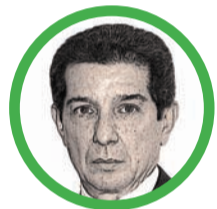
Por José Félix Lafaurie Rivera