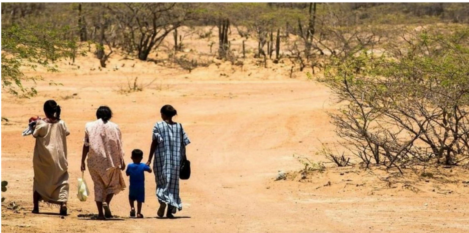
Dicen que han usado los bienes de la Nación sin que la región haya recibido réditos o mejoras en su bienestar social.

Entre las demandas que le presentarán al Ejecutivo estarán 'el retorno de las regalías' al Departamento y la 'reivindicación' de las riquezas naturales de La Guajira.