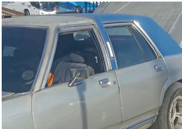
La acción no dejó personas heridas, sin embargo, pasaron el susto de ser víctimas de estos delincuentes.

DESTACADO Quienes viajan a diario por la vía de la Troncal del Caribe entre Maicao y Paraguachón, piden que las autoridades continúen con los operativos de vigilancia y control en la carretera.