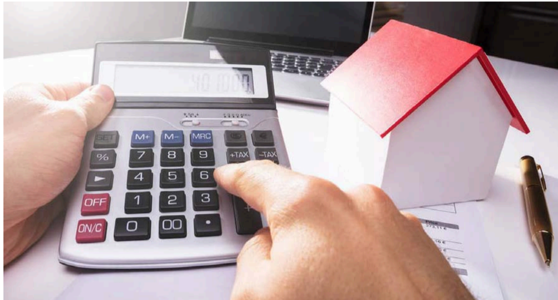
Este ajuste aplica únicamente a contratos que cumplan un año de vigencia.

En términos estadísticos, mientras que en