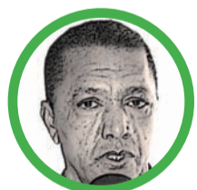
Por Rafael Humberto Frías Mendoza