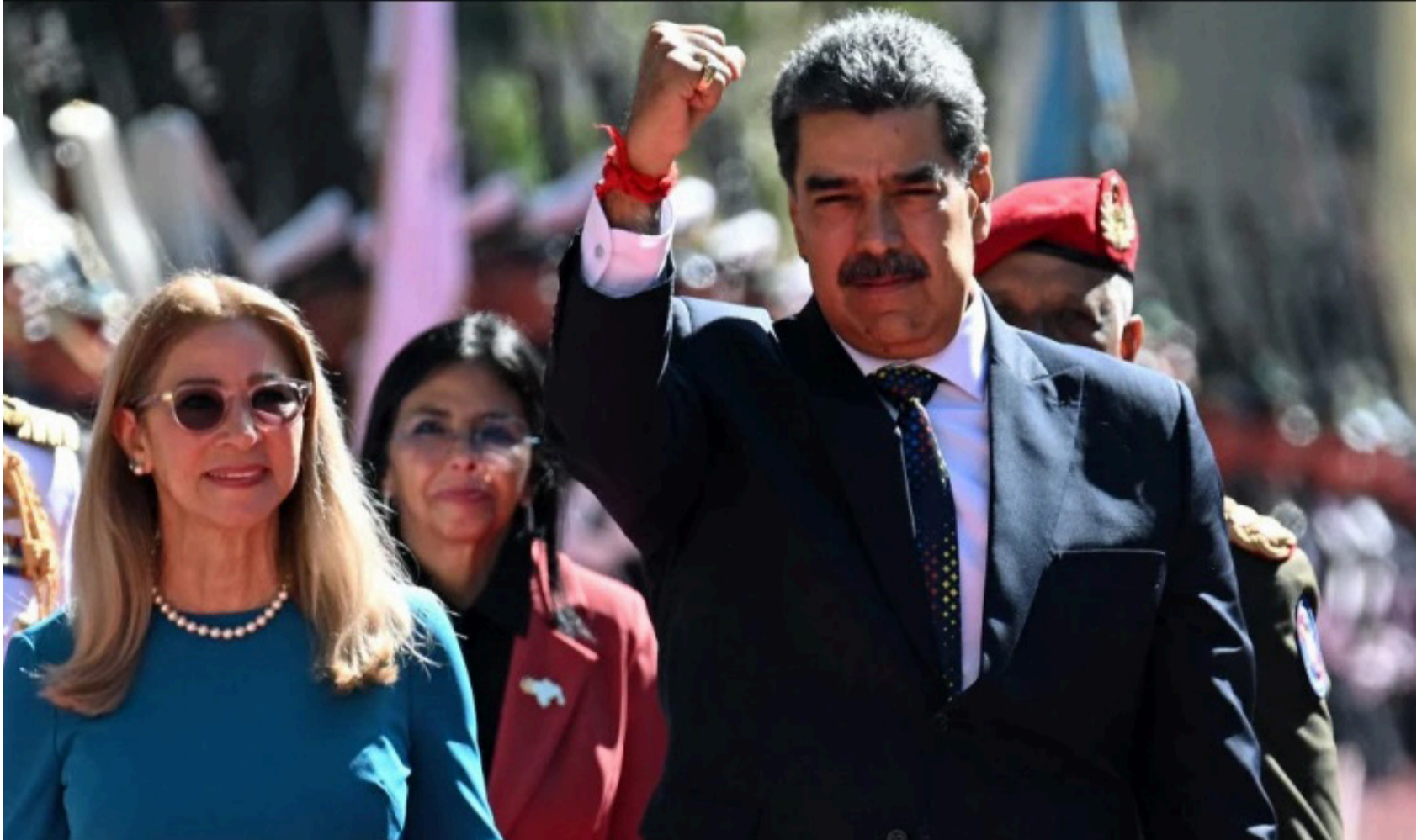
Hay que sacar a Maduro por la fuerza, no hay otra, para liberar a Venezuela de ese Gobierno corrupto y mafioso que apesta.

Las cosas cambiarán pronto para bien de Venezuela