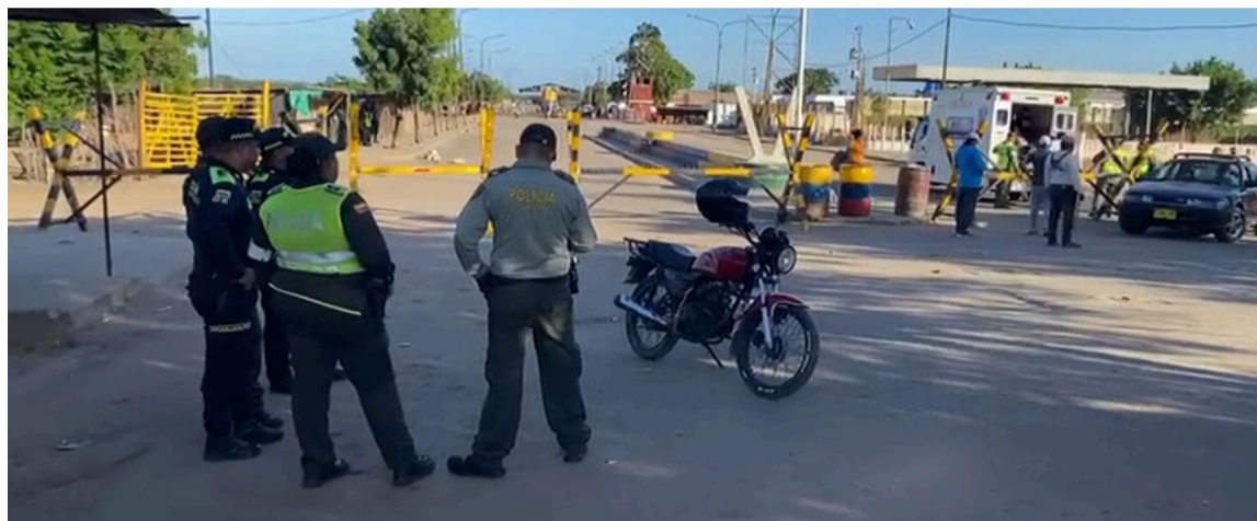
La ausencia de compradores venezolanos ha dejado pérdidas por $15.000 millones.

Finalmente, el presidente de Fenalco reiteró su llamado a que se garantice la estabilidad en la frontera y se fomente la reactivación económica de la región, vital para el bienestar de los comerciantes y las familias de Cúcuta y otras localidades de Norte de Santander.