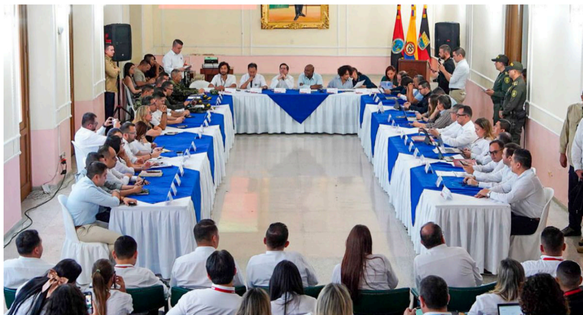
MinInterior reafirmó el compromiso del Gobierno con los habitantes de la frontera.

De acuerdo con la Cancillería, se busca de esta manera defender los intereses del pueblo colombiano, tanto en el ámbito económico como en lo referente a la paz y la seguridad de todos los connacionales y particularmente de aquellos que habitan en la zona fronteriza con el país hermano.