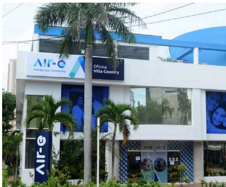
Se garantizará que las actuaciones administrativas en curso sean conformes con el orden jurídico.

A fin de obtener una mayor comprensión sobre el proceso de toma de posesión de Air-e S.A.S. E.S.P. y su estado actual, el ente de control ha convocado una mesa de trabajo presencial para hoy lunes 13 de enero de 2025, a las 10:00 a.m. en la sede de la Procuraduría General en Bogotá.