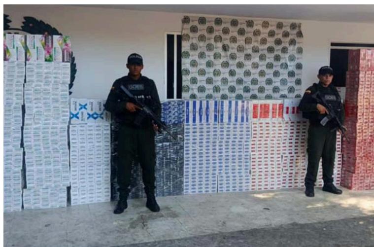
Uniformados del Goes detuvieron dos vehículos que se movilizaban por este importante corredor vial.

En el marco de operativos de prevención, disuasión y control orientados a garantizar la seguridad ciudadana, el Grupo de Operaciones Especiales (Goes) logró la incautación de 700.000 unidades de cigarrillos de contrabando, mercancía evaluada en aproximadamente 57 millones de pesos.