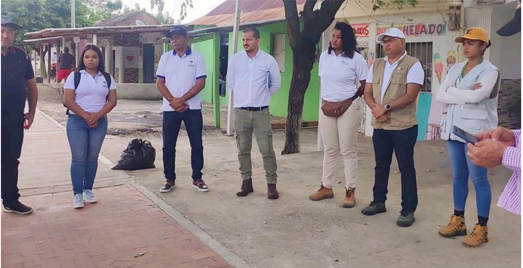
Aqualia se comprometió a implementar medidas de mitigación para reducir el impacto del derrame de aguas residuales.

E n respuesta a la queja presentada por dirigentes, líderes y habitantes del corregimiento de Camarones, Corpoguajira se trasladó a la población para evaluar la situación del vertimiento de aguas residuales provenientes de la Planta de Tratamiento (Ptar).