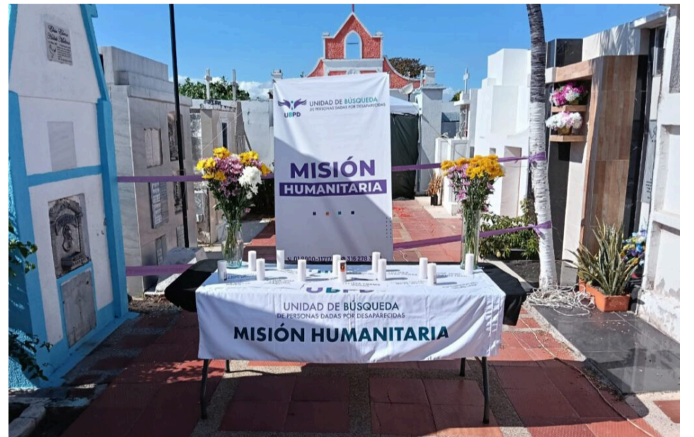
El Plan Regional de Búsqueda del Sur del departamento de La Guajira y el norte del Cesar, abarca un universo de 1.574 personas desaparecidas.