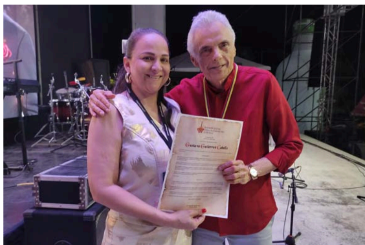
Los organizadores del Festival Tierra de Compositores de Patillal, exaltaron la obra musical del compositor Gustavo Gutiérrez.

con 'Pacho' Galán y sus sabaneros', en el que Gustavo canta dos de sus primeras canciones: 'Morenita' y 'Suspiros del Alma'. En 1965 tocó la concertina en el L.P. 'Ensueños y más cantos vallenatos'. Bovea, Fernández y Fontanilla interpretan los cantos Vallenatos de Gustavo Gutiérrez Cabello. En 1969, en Orbe, grabó el L.P. 'Confidencia'. Concierto Vallenato. Volumen 4. En 1974 hizo el L.P. Gustavo Gutiérrez canta sus canciones y las de Freddy Molina. En 1976, Alfredo Gutiérrez,