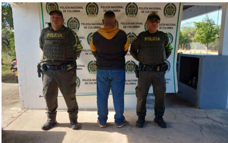
La Policía a través de sus planes diferenciales de seguridad, realizó importantes capturas e incautaciones.

Estos resultados son parte de los esfuerzos constantes de la Seccional de Tránsito y Transporte para garantizar la seguridad y legalidad en las carreteras de La Guajira.