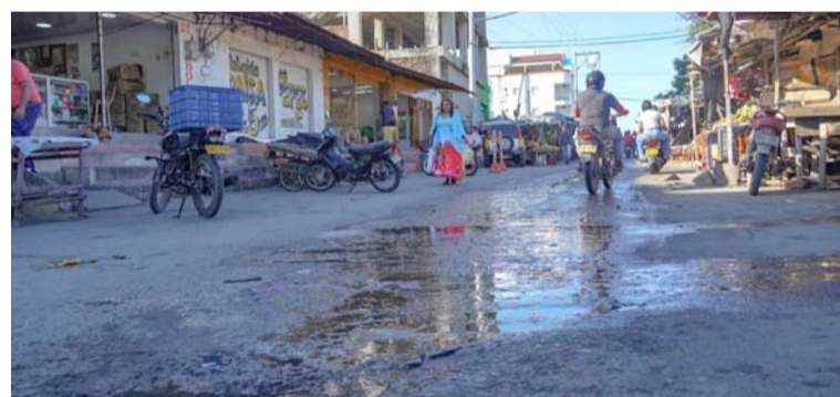
Este problema viene generando un riesgo inminente para la salud pública en el Distrito de Riohacha.

Esta infraestructura forma parte de los tres hospitales de campaña con los que cuenta la Ungrd, listos para desplegarse en cualquier región del país que enfrente emergencias de gran impacto asociadas a fenómenos naturales, crisis humanitarias o situaciones de salud pública.