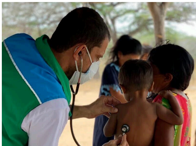
Es imperativo garantizar que en La Guajira las cifras de desnutrición disminuyan drásticamente.

Abandonar el ECI es una tarea colectiva que requiere el compromiso de las entidades públicas, las empresas privadas, los órganos de control, la sociedad civil y, por supuesto, el pueblo wayuú, siempre enfocados en mejorar la calidad de vida de sus niños y niñas y la pervivencia de su pueblo. Por La veeduría ciudadana para la implementación de la Sentencia T-302 de 2017.