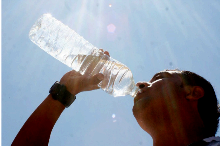
Recomendaciones básicas hizo Corpoguajira a la ciudadanía ante las altas temperaturas que se registran.

que protector solar de amplio espectro con un SPF de al menos 30, incluso en días nublados, y reaplique cada dos horas, especialmente si está sudando o en contacto con el agua.