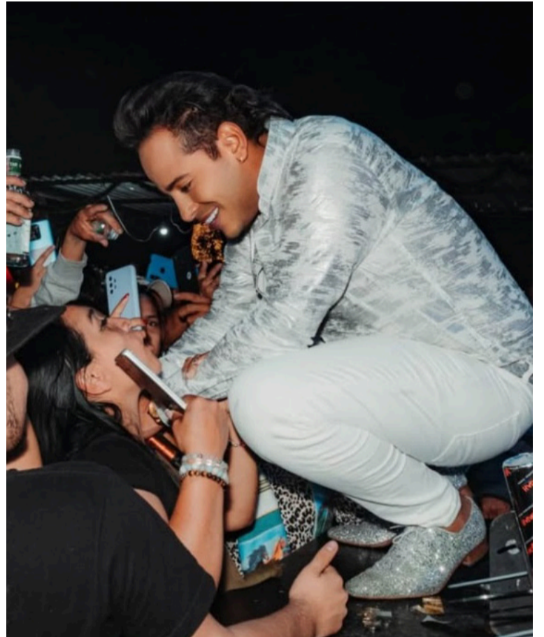
El también conocido como 'El timbre original' cautivó al público tolimense con su gran actuación.

El artista vallenato fue el encargado de prender la parranda en el Festival del Retorno en el municipio de Icononzo - Tolima.