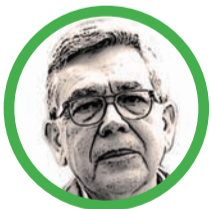
Por Normando José Suárez Fernández