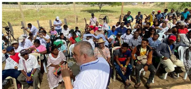
Esto representa un crecimiento del 50% frente al año anterior cuando se otorgaron más de $24,8 billones.

En medio de la reactivación económica y los buenos resultados del PIB