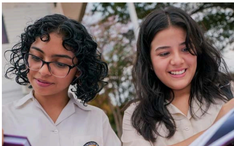
Los interesados en postularse deben cumplir con los requisitos establecidos en la convocatoria.

La posibilidad de obtener un crédito 100% condonable para estudios de pregrado es una gran oportunidad para que jóvenes de esta comunidad puedan continuar su formación académica sin la carga de una deuda.