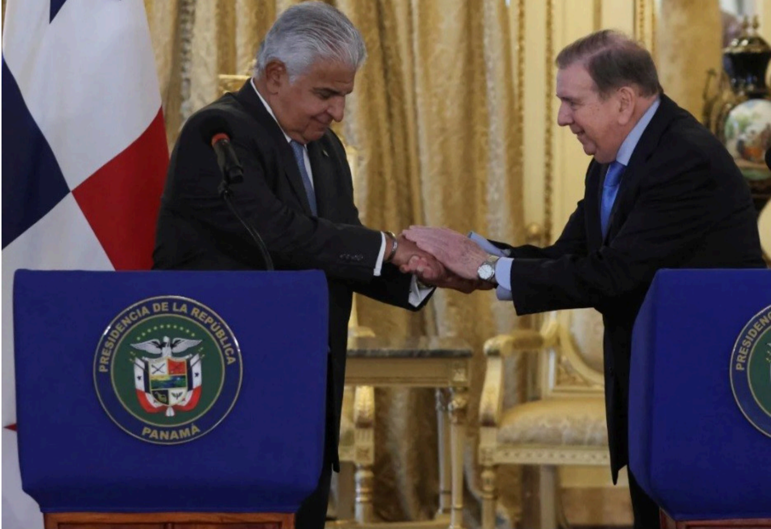
El presidente de Colombia Gustavo Petro, quien ha visitado varias veces a Nicolás Maduro, no asistirá a la posesión del mandatario del vecino país.