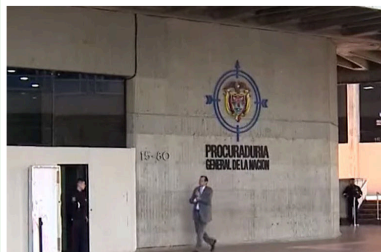
El nuevo procurador deberá empezar a tener acercamientos con el Ministerio de Hacienda.

La tarea ahora deberá quedar en manos del nuevo procurador General de la Nación, Gregorio Eljach, quien desde el próximo 15 de enero deberá empezar a tener acercamientos con el Ministerio de Hacienda y el Gobierno Petro, para tratar de conseguir los recursos que afectaron directamente a la entidad.