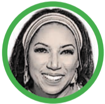
Por Marga Palacio Brúgés