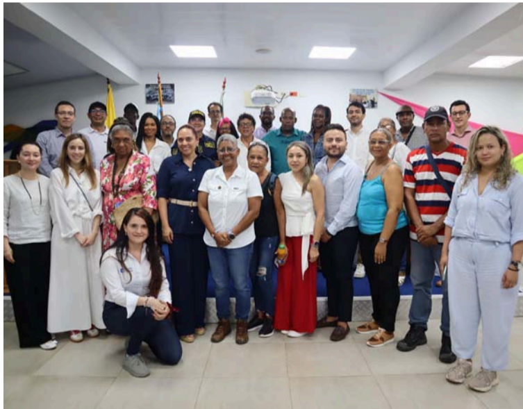
Así se consolida el objetivo de la Cancillería de asegurar presencia efectiva del Estado en las fronteras.

Esta política, busca garantizar la participación activa de los territorios de