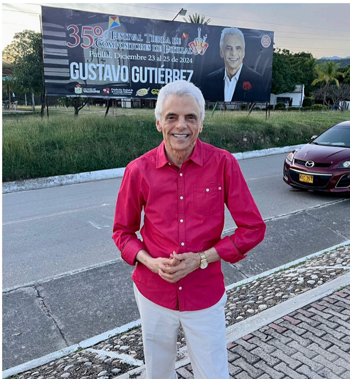
El Festival de Patillal (Cesar) se realizó en homenaje al compositor Gustavo Gutiérrez.

Muchas son las canciones que se han escuchado en los últimos años de la autoría de un poeta vallenato y continúa con el mismo brío y el mismo sentimiento que lo expresa en sus canciones. En 1964 'Pacho' Galán lo invitó a grabar el L.P. 'Fiesta