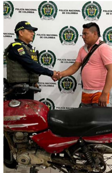
Recuperan moto en la vía Riohacha-Santa Marta, y capturan hombre solicitado por orden judicial.

Durante el procedimiento, se constató que el mencionado ciudadano presentaba una orden de captura vigente, emanada por el Juzgado de Instrucción Penal Militar 37 de Ocaña - Norte de Santander, por los delitos de hurto calificado y agravado y deserción. De manera inmediata, se procedió a materializar la captura y dejarlo a disposición de la autoridad judicial competente.