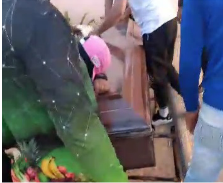
La madre explicó que no fue fácil salir de Colombia con el cuerpo de su hijo, pero en Paraguachón la entendieron.

Lo que más deseaba su madre era llevarlo a su tierra natal en Carora en el estado Lara - Venezuela, a donde efectivamente, ese mismo 24 de diciembre lo trasladó. Allí sus familiares y amigos esperaban sus restos mortales para darle cristiana sepultura. "No fue fácil salir de Colombia con el cuerpo de mi hijo, pero gracias a Dios en Paraguachón entendieron todo y pudimos pasar. Fue un largo viaje hasta llegar a nues-