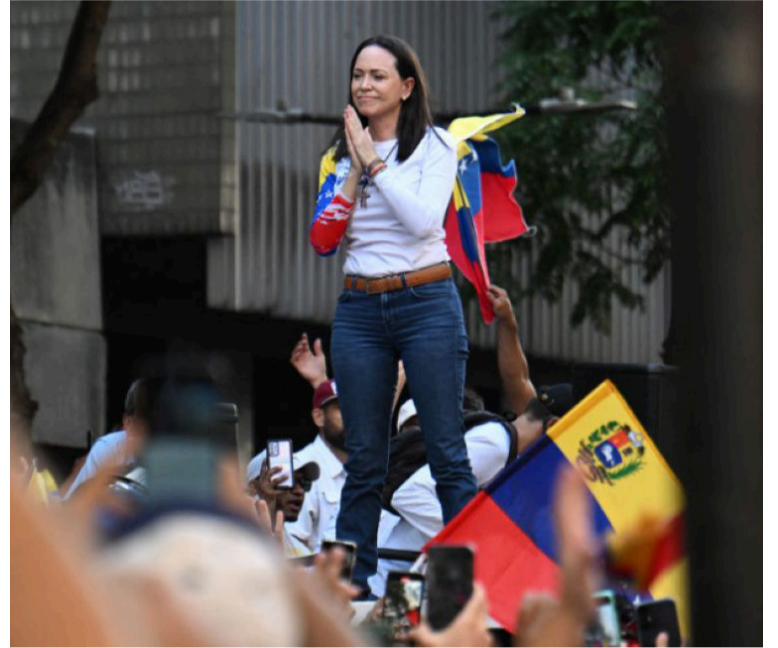
Machado fue interceptada mientras se desplazaba en motocicleta y obligada a grabar varios videos.

En su lugar, el embajador de Colombia en Caracas, Milton Rengifo, representará al país en el evento. El Gobierno colombiano ha señalado que su objetivo es mantener relaciones cordiales con Venezuela para asegurar la protección de los colombianos que residen en territorio venezolano.