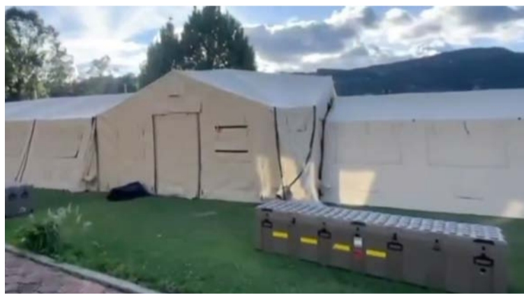
El hospital tiene nueve carpas interconectadas y climatizadas, equipadas con sistemas autónomos de energía.

Esta infraestructura busca atender las necesidades sanitarias y garantizar los servicios de salud en una de las comunidades más aisladas por las recientes emergencias climáticas.