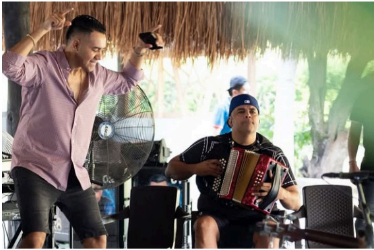
Estos dos talentosos artistas han despertado gran expectativa en la nueva generación del vallenato.