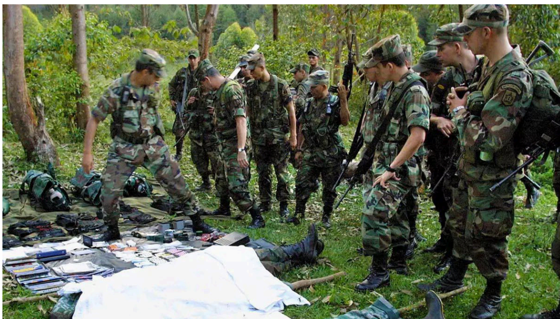
Se informó que los cuerpos entraron a Barranquilla como NN y así permanecen.

Es de recordar que según las versiones de las autoridades estos cuatro cuerpos fueron encontrados en una zona apartada del Distrito de Riohacha, en el sector de El Cerrón el 30 de diciembre, luego de un mes de conocerse que el pasado 29 de noviembre hubo un fuerte enfrentamiento entre grupos armados que operan en esta región de la capital de La Guajira.