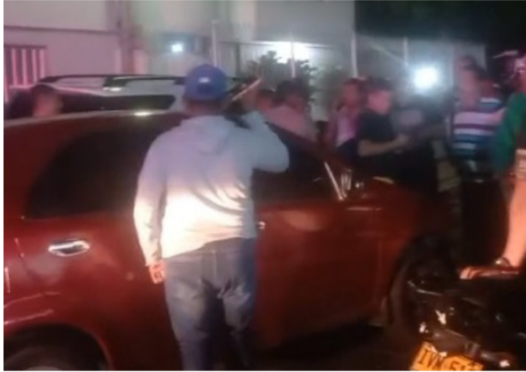
La comunidad estaba molesta por la actitud del conductor, pero los uniformados calmaron los ánimos.

Se pudo conocer que hasta el lugar del acci-