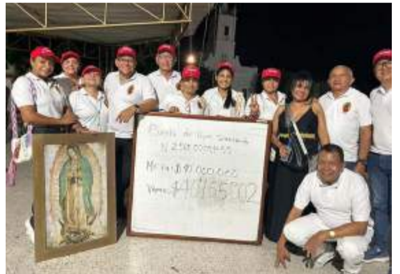
Lograron recaudar un total de $40,155,002, superando los 40 millones proyectados inicialmente.

El próximo 12 de diciembre, día de la Virgen de Guadalupe, se realizará una celebración eucarística en el sitio de la construcción, permitiendo a