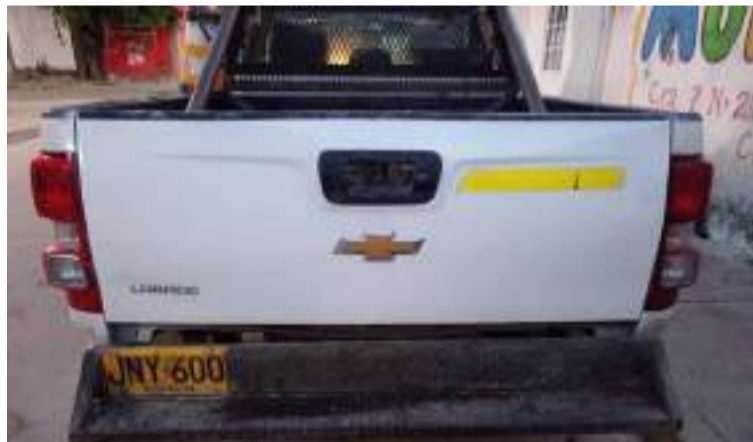
Los sujetos bloquearon la carretera y obligaron a los cuatro ocupantes a descender para luego llevarse el vehículo.