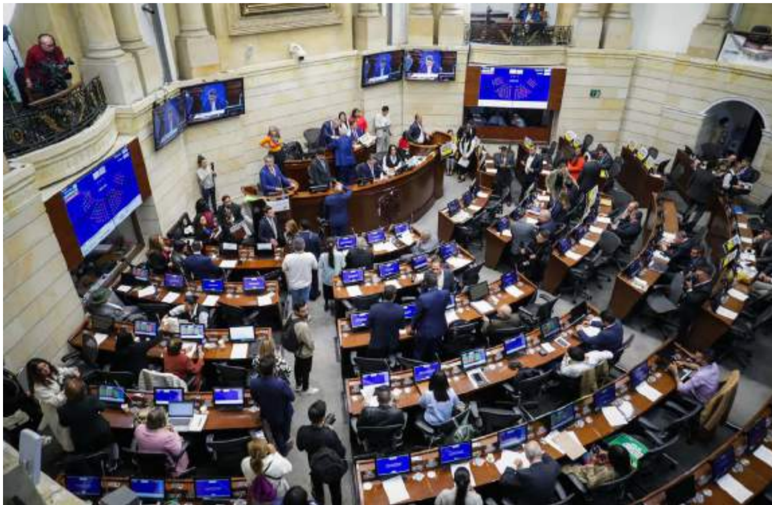
No se puede seguir insistiendo en que con este paso se estarían descuadrando las finanzas del Estado.