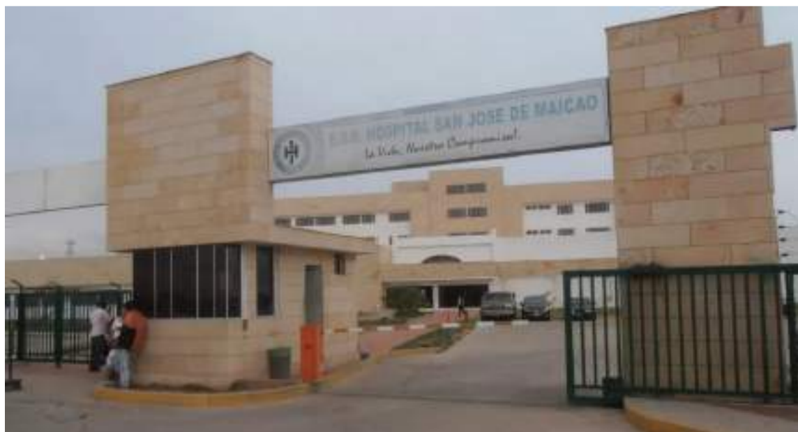
Sin un control, la estampilla corre el riesgo de convertirse en un frente de corrupción.

Y como dijo el filósofo de La Junta: "Se las dejo ahí..."