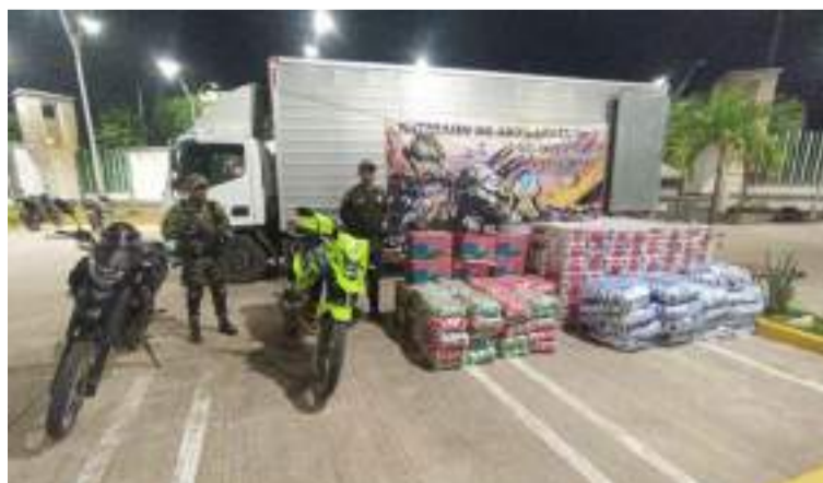
La mercancía y el vehículo fueron entregados a sus propietarios por los uniformados.

autoridades recibieron la llamada por parte de la comunidad sobre el hurto, y de inmediato reaccionaron con tropas del Batallón de artillería de defensa antiaérea No 1, Batallón Grupo Matamoros y Policía de la estación de Albania.