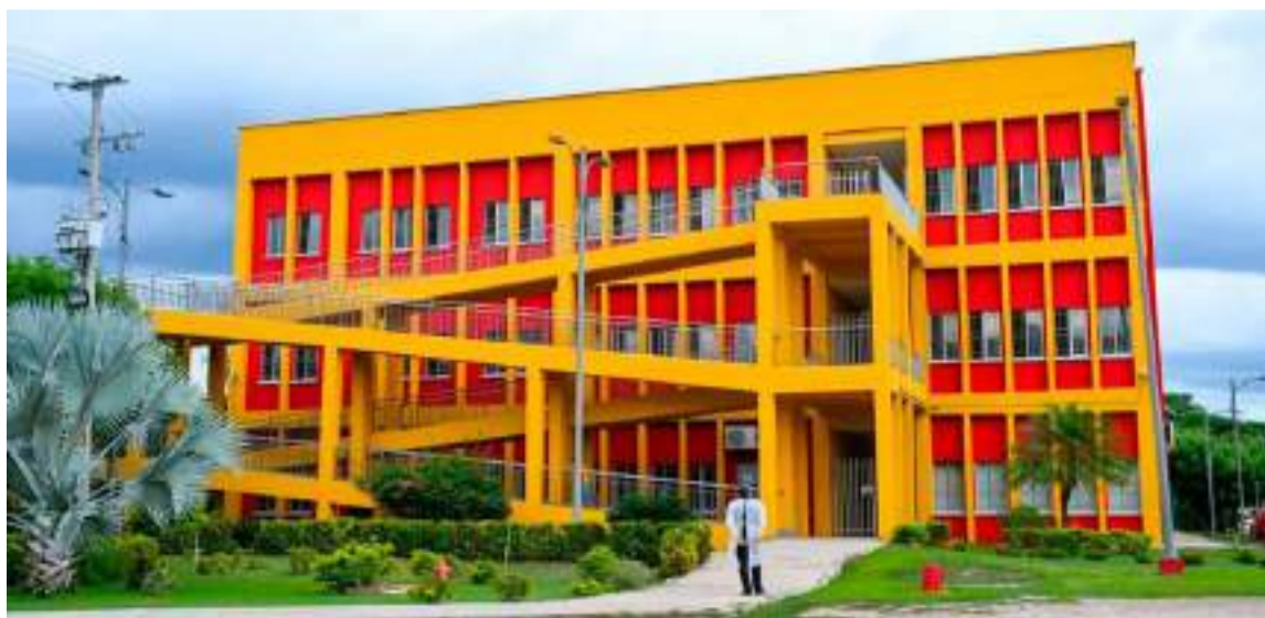
En los dos bloques de Uniguajira se haría una inversión de 50.757 millones de pesos.

Por último, en el municipio de Medio Baudó, en el Chocó, se construirá la sede de la Universidad Tecnológica del Chocó, con una inversión de 12.397 millones de pesos. Se estima que la entrega de la obra, que va a favorecer a 1.300 estudiantes, se realice en el 2026.