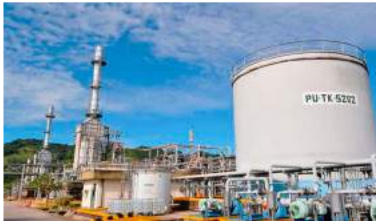
Se averigua también por qué algunos productores no cerraron contratación.

que, según el Gestor del Mercado de Gas Natural, el gas disponible en el mercado primario para 2025 es 112,1 GBTUD, de los cuales 72 GBTUD corresponden a gas natural