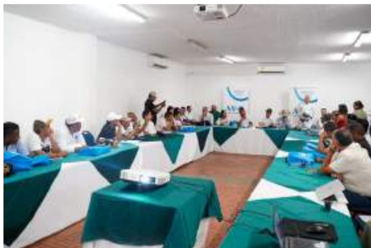
Dice Palma que esto demuestra el esfuerzo del Gobierno por fortalecer la infraestructura eléctrica en la región.

Además un equipo técnico de la compañía se desplazará a estos municipios para adelantar labores de diagnóstico y ejecución de soluciones, con el fin de garantizar la estabilidad del servicio eléctrico y mejorar la calidad de vida de los ha-