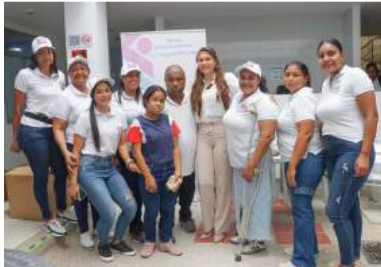
La Administración ratifica el compromiso de seguir trabajando por una ciudad más inclusiva.