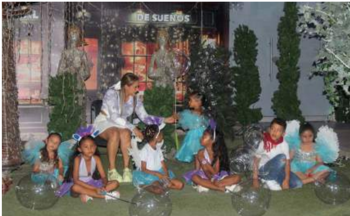
Los niños de Esepgua fueron los grandes invitados a la mágica noche del encendido de las luces navideñas.

Esepgua la empresa de todos los guajiros. Como