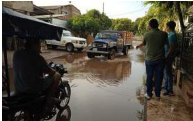
Los peatones y vehículos enfrentan dificultades para transitar por la zona, generando riesgo de accidentes.

Los problemas van más allá de la incomodidad, ya que los vecinos reportan casos de enfermedades