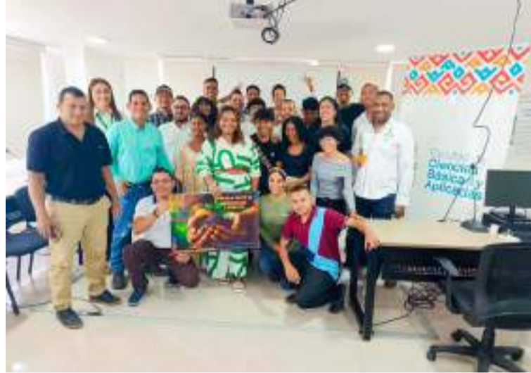
La actividad incluyó conferencias sobre agroecología, agricultura sintrópica y propuestas educativas innovadoras.

DESTACADO La jornada académica reunió a estudiantes, docentes, expertos y representantes de entidades como la Asociación Hortifrutícola de Colombia, el ICA y Ecopetrol.