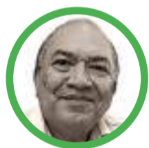
Por Amylkar Acosta Medina