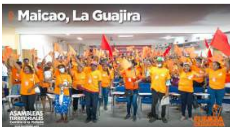
A las asambleas asistieron militantes, simpatizantes, sindicatos, campesinos e indígenas, entre otros.

A su vez, el líder de Fuerza Ciudadana invita a los colombianos a sumarse a este camino sumándose a la comunidad digital lafuerzaciudadana.com.