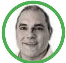
Por José David Name Cardozo