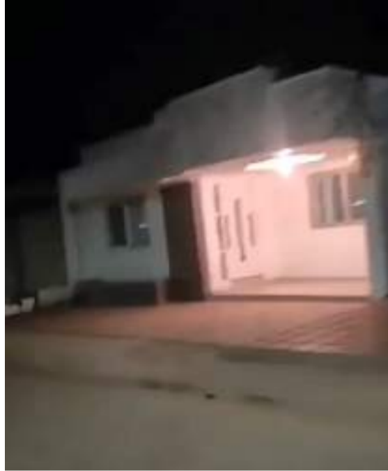
Los delincuentes se grabaron cuando disparaban y luego difundieron el video.

Dos sujetos que se desplazaban en una motocicleta dispararon en repetidas oportunidades contra la terraza de una vivienda, con la intención de intimidar a sus ocupantes para cometer el delito de extorsión, según las primeras indagaciones de las autoridades investigativas.