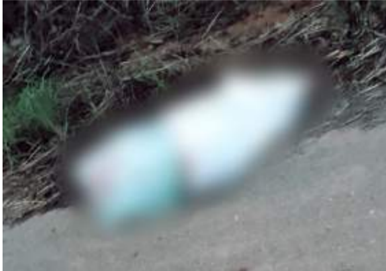
El cadáver del joven presentaba evidentes signos de tortura y varios impactos de bala en su cuerpo.

Hasta el lugar del hallazgo llegaron las autoridades competentes, quienes procedieron a la verificación del contenido de