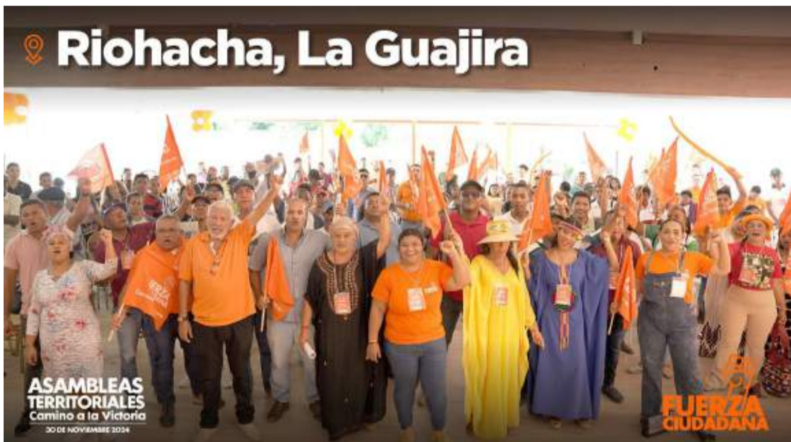
Se eligieron las mesas territoriales, las vocerías públicas y los comités políticos sectoriales de los militantes.

Después de debatir las tesis políticas de Fuerza Ciudadana, conocer los aspectos organizativos y los restos de cara al 2026, 8 mil asistentes aceptaron la propuesta de trabajar para que este movimiento conquiste, a través de los medios de