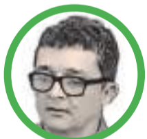
Por Luis Hernán Tabares