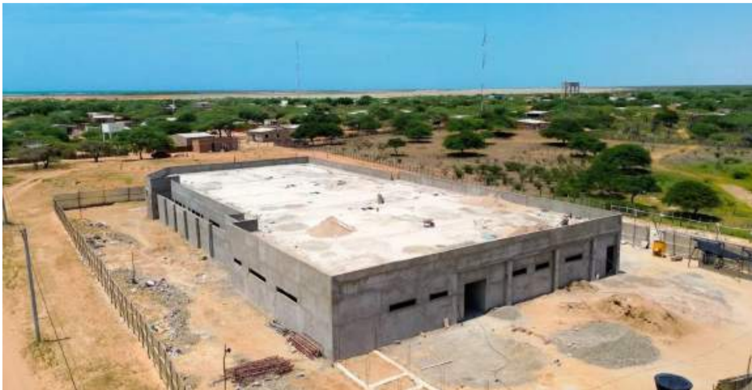
La Gobernación y los 15 municipios tienen el desafío de recaudar la Estampilla Pro-Hospitales de manera transparente.