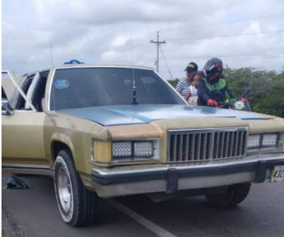
Las víctimas informaron el hecho a la Policía de Paraguachón y les solicitaron que colocaran la denuncia.

Una fuente policial indicó que las víctimas informaron el hecho en la