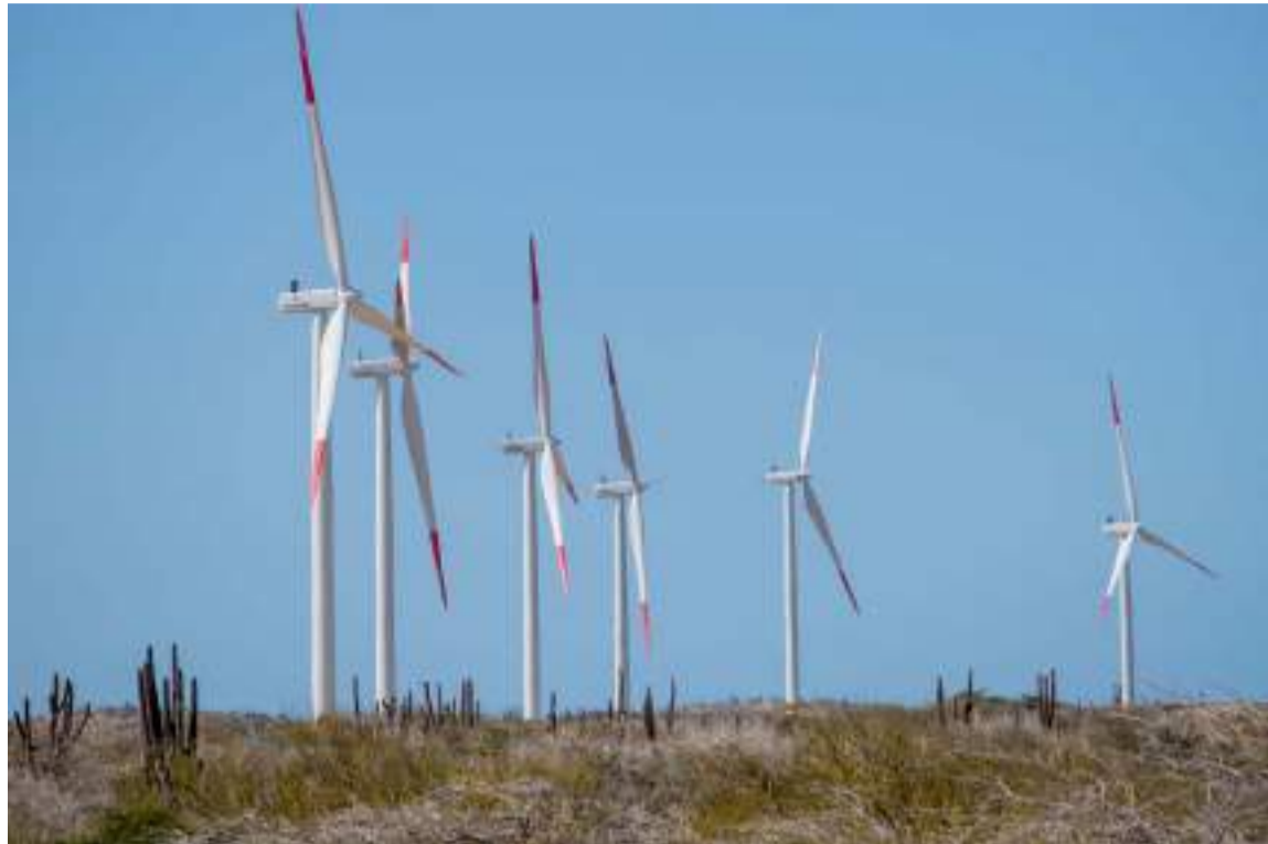
Los dos proyectos, Alpha y Beta, obtuvieron permisos ambientales en agosto de 2019.

Estos dos proyectos obtuvieron permisos ambientales en agosto de 2019. Posteriormente, en la subasta promovida por el Gobierno de Colombia en octubre de 2019, se adjudicaron contratos de compraventa de energía a largo plazo (PPA) para una producción anual de 1,7 TWh de energía renovable durante un período de 15 años, efectivos a partir de 2022, junto con los pasivos y garantías asociados a los PPA. Más adelante, Edpr contrató una parte sustancial del Capex, concretamente 90 aerogeneradores mo-