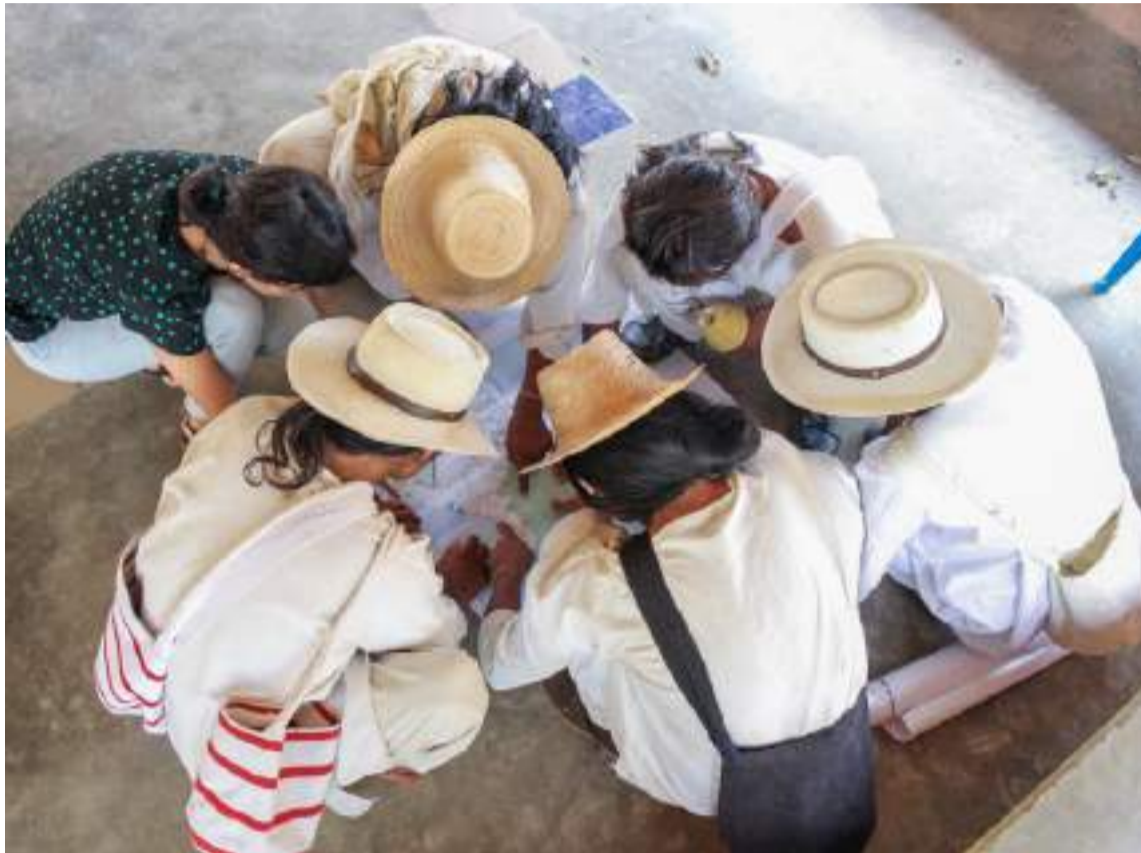
La Sierra Nevada y Perijá fueron epicentros de desplazamientos y desapariciones.