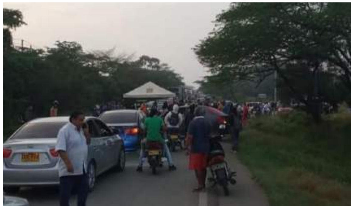
Los bloqueos afectan la agricultura, la ganadería, el comercio, el turismo, entre otros.