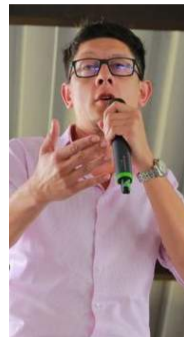
Daniel Rojas Medellín, ministro de Educación.

Esta controversia es un recordatorio de la importancia de establecer y mantener altos estándares en la cultura y el arte, así como de la necesidad de que los artistas y figuras públicas actúen con responsabilidad