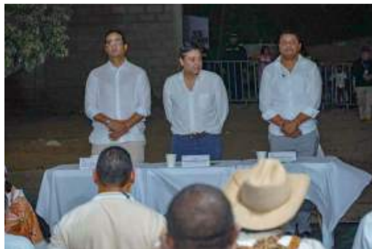
Con una inversión estratégica Findeter desarrollará un centro tecnológico de 1,246 metros cuadrados.