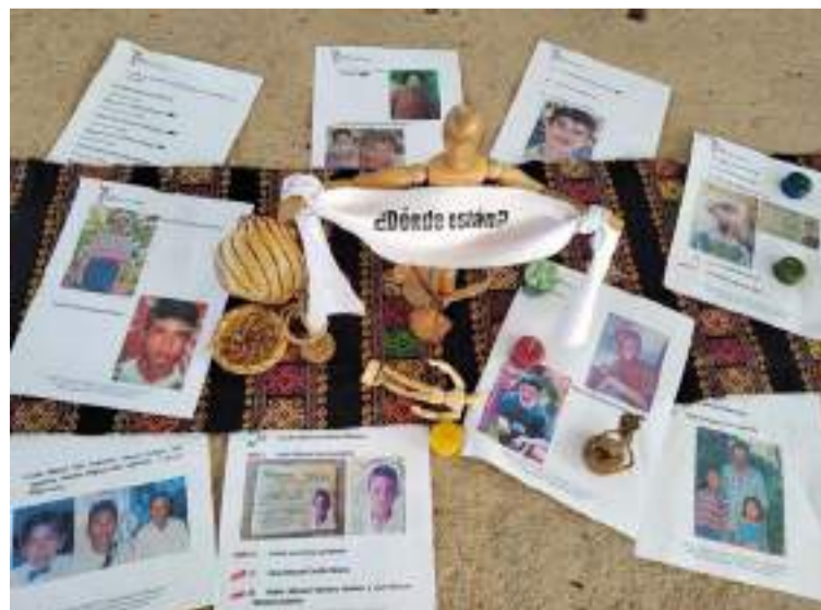
La colaboración entre wiwa y la Ubdp, busca reparar años de violencia y dar respuesta a familias de las víctimas.

Estos avances representan un paso importante en el camino hacia la verdad, la reparación y la reconciliación, llevando esperanza a las familias que aún buscan a sus seres queridos.