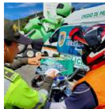
El objetivo es prevenir accidentes y salvar vidas.

4. Use el cinturón de seguridad y el casco (en caso de motociclistas): Estos elementos son fun-