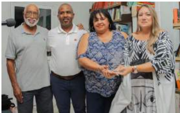
Recibiendo el reconocimiento de la Fundación Rancho por los aportes culturales a la celebración de los 200 años de la ciudad de Oranjestad.

ne, y demás gestores culturales locales.