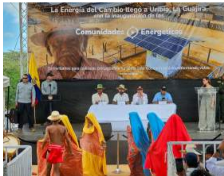
148 comunidades tendrán acceso a energía 24 horas y será parte de este capítulo de la transición justa.

"En la zona rural dispersa de este departamento y territorio en donde el Go-