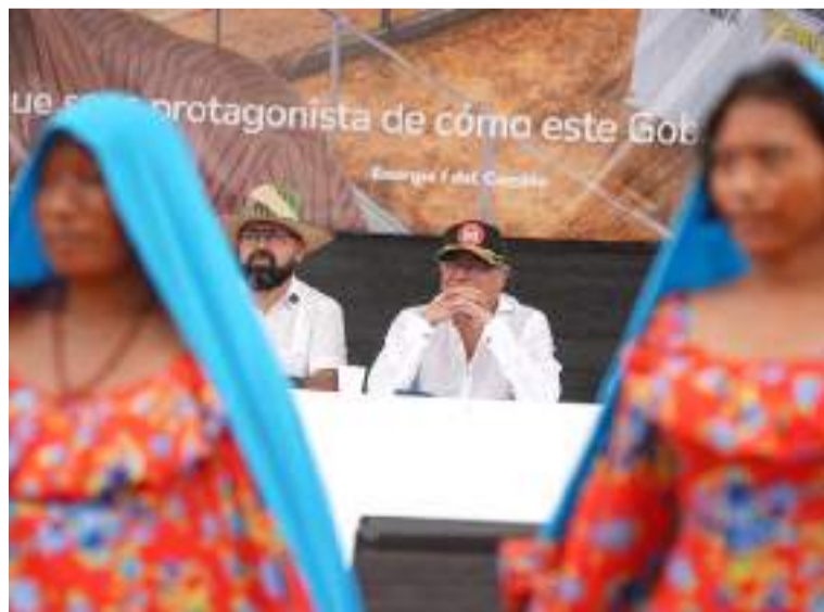
Petró entregó 80 Casas del Sol del pueblo a cabildos indígenas en el departamento de La Guajira.

Estas casas están localizadas en varias zonas del municipio de Uribia. Se espera que antes de que finalice el año sean entregadas 64 Casas más para esta región del país.