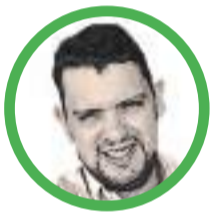
Por Miguel Lugo Romero