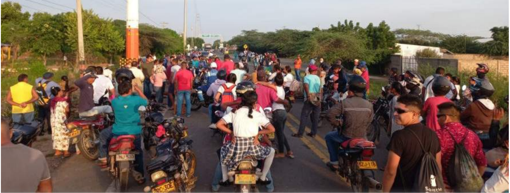
Colfecar hizo un llamado al Gobierno y autoridades locales para que tomen medidas que garanticen la libre movilidad.