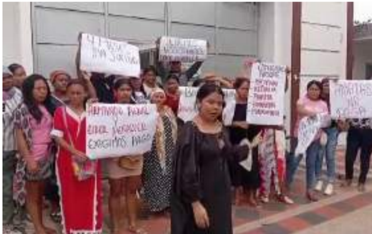
Los manifestantes señalaron que no desistirán hasta que el dinero se vea reflejado en sus cuentas.

Desde las horas de la mañana del viernes 20 de diciembre estas personas con pancartas en mano se tomaron la sede