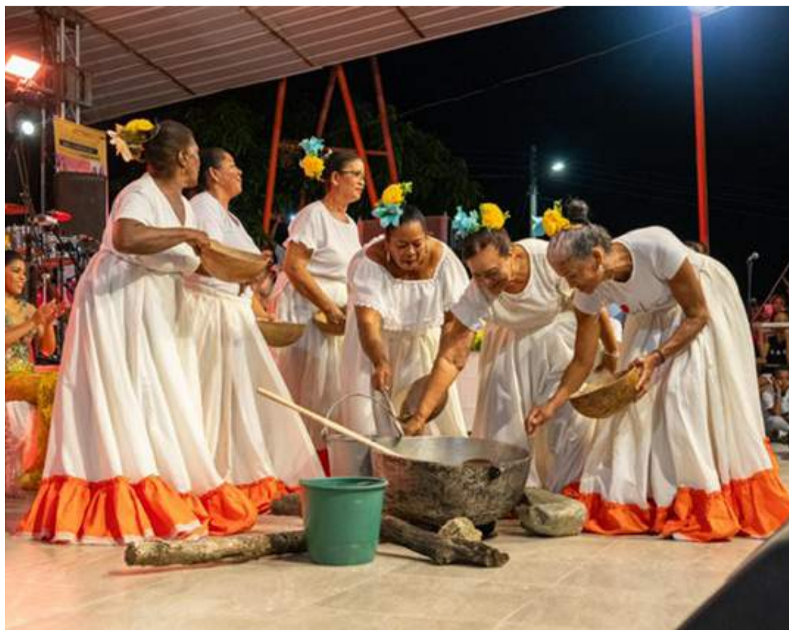
Presentación de la Danza Dulce de las hacedoras de dulce.