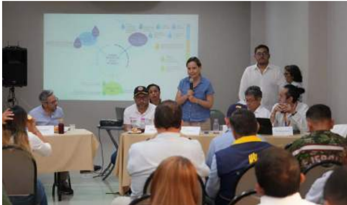
Este logro es gracias al esfuerzo del Gobierno nacional y la Gobernación de La Guajira.

La jornada de Minvivienda en la capital de La Guajira continuó con participación de la ministra Rivas Ardila, en el Consejo del Mesep, en el que señaló que desde el Gobier-