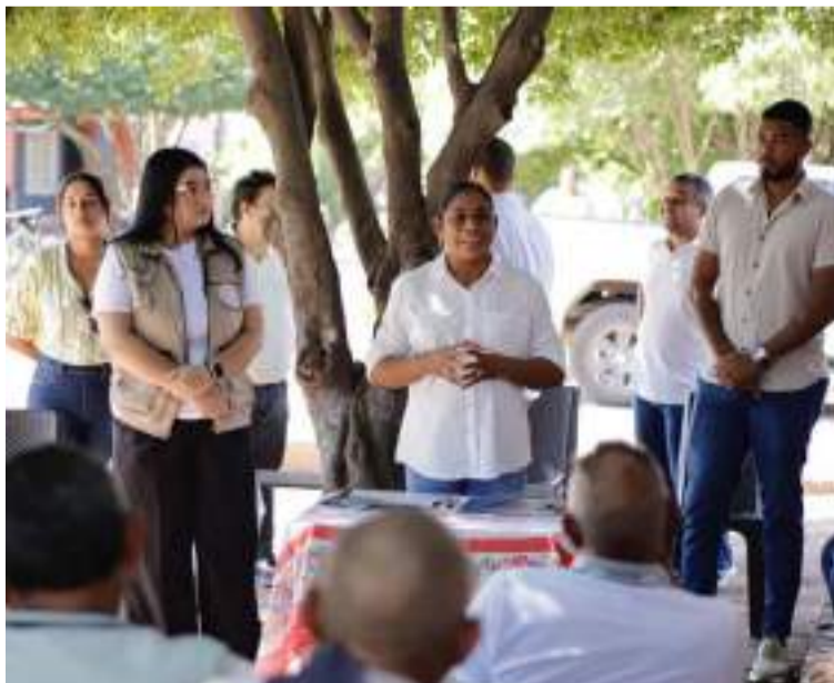
También se está llevando a cabo la reposición de redes de alcantarillado en varios barrios.

Estas obras no solo buscan mejorar la calidad de vida de los habitantes, sino también preparar las calles para su pavimentación, consolidando un desarrollo integral en Villanueva.