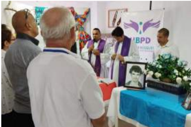
Los cuerpos fueron ubicados e identificados mediante investigación y análisis forense.

Los cuerpos fueron ubicados e identificados mediante investigación y análisis forense, resultado del trabajo liderado por la JEP y la Unidad de Búsqueda, con el acompañamiento de otras entidades como