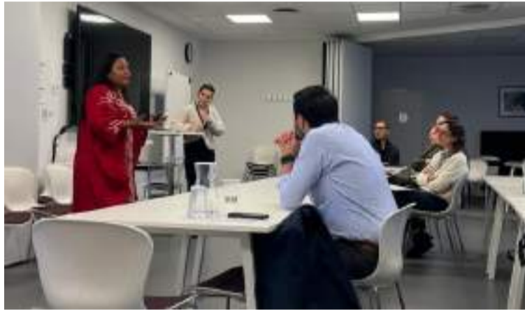
El departamento cuenta con un enorme potencial para el desarrollo de proyectos de energía eólica.

Durante su intervención, Ojeda Mengual destacó que La Guajira posee condiciones excepcionales de viento y sol, lo que la posiciona como el epicentro de la transición energética en Colombia.