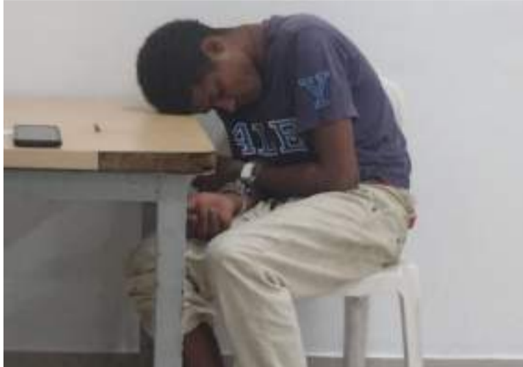
El joven fue conducido por los uniformados de la Policía Nacional a un CAI mientras esperaban la denuncia.

El hecho se registró la madrugada del lunes 16 de diciembre en una vivienda ubicada en la calle 37 con carrera 7H de la ciudad de Riohacha, en donde según las primeras versiones una mujer quien dormía en una de las habitaciones sintió