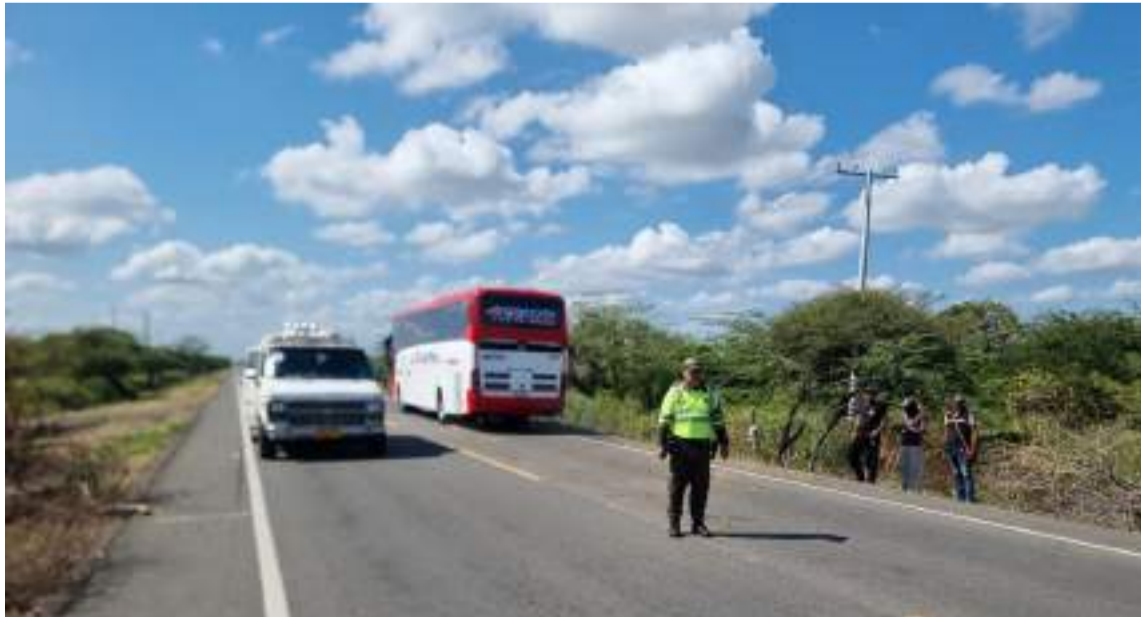
La comunidad luego del diálogo decidió restablecer la movilidad vehicular.

La comunidad luego de conocer los argumen-