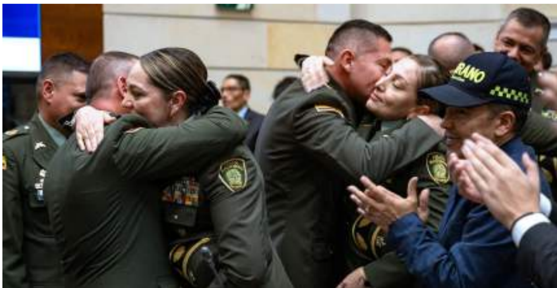
Ostentarán los grados de brigadier general, mayor general, contralmirante y almirante.

Los ascendidos ostentarán los grados de brigadier general, mayor general, contralmirante y almirante y la ceremonia de imposición de insignias se cumplirá en los próximos días.