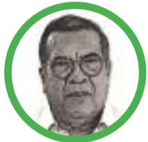
Por Jaime De la Hoz Simanca