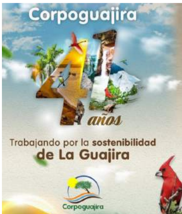
Corpoguajira trabaja por la preservación, gestión y sostenibilidad ambiental en el Departamento.

Este esfuerzo se enmarca en las medidas ordenadas por la Corte Constitucional para mitigar la crisis hídrica que afecta a las comunidades guajiras, especialmente a las poblaciones indígenas que han denunciado la precariedad en el acceso al agua potable.