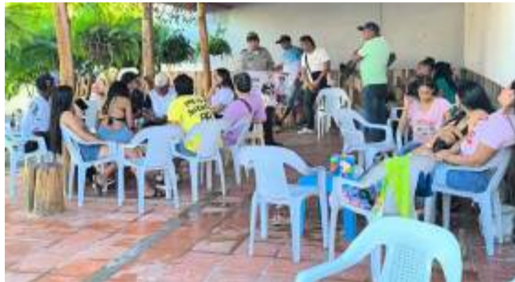
El propósito principal de esta estrategia es minimizar riesgos para la salud y la vida de los usuarios.

Durante las visitas, se llevaron a cabo charlas pedagógicas y sensibilizaciones sobre el cumplimiento de normas de seguridad, higiene y convivencia ciudadana, basadas en la Ley 1801 de 2016, conocida como el Código Nacional de Seguridad y Convivencia Ciudadana, y en regulaciones específicas como la Ley 1209 de 2008 y el Decreto 554 de 2015, que establecen los estándares de seguridad