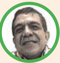
Por Hernán Baquero Bracho