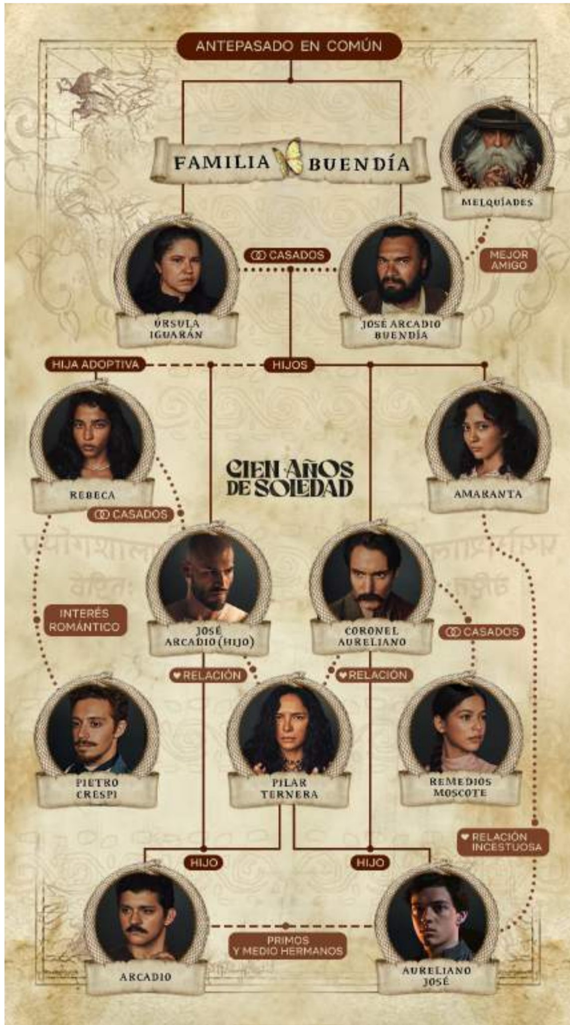
El mapa familiar de Macondo de 'Cien años de soledad', la serie basada en la obra de Gabriel García Márquez.

Al comienzo pensaba que el desafío estaba en llevar a la imagen en movimiento los recursos complejos de la magia como las levitaciones, la lluvia de flores amarillas o la peste del insomnio y del olvido;