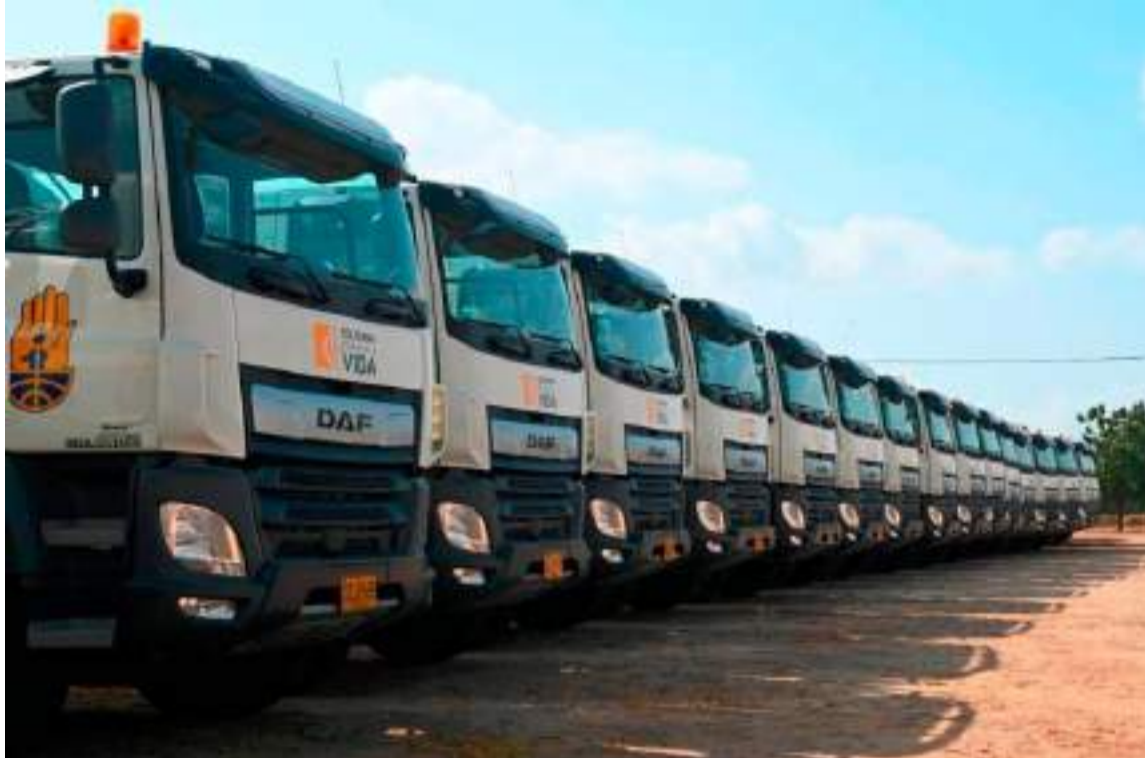
Carrotanques irán a revisión técnica para garantizar que estén en óptimas condiciones.

La distribución de los vehículos se realizará de la siguiente manera: dos para Uribia, dos para Manaure, dos para Maicao y dos para Riohacha. Según la entidad, los municipios de Uribia y Maicao ya presentaron la documentación requerida para recibir la flota, lo