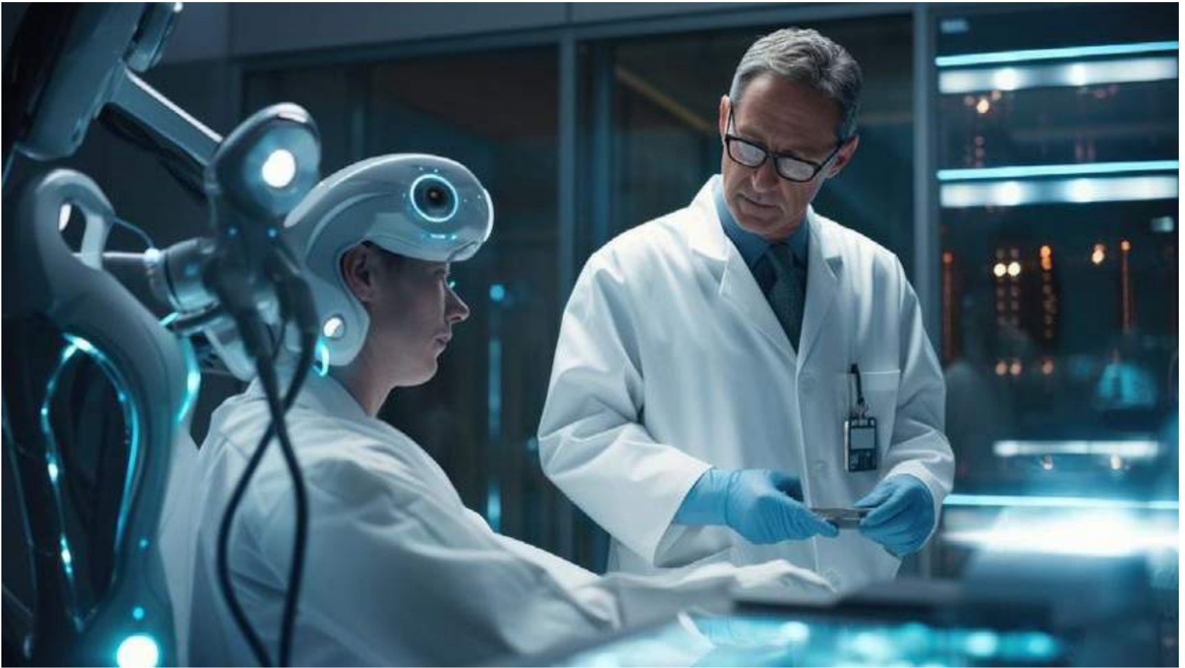
Lo que se ve venir con la inteligencia artificial (IA) está cambiando las prioridades de la formación y de la práctica médica.