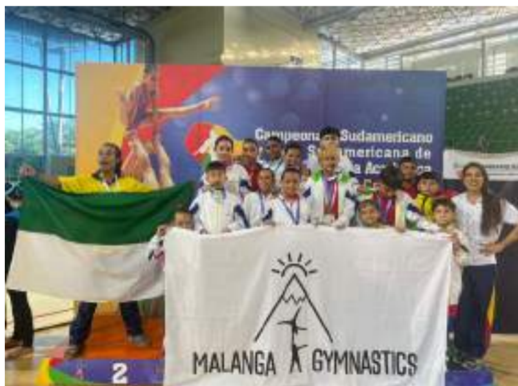
El club está conformado en su mayoría por estudiantes de la IE Rural San Antonio.