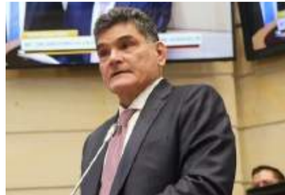
Gregorio Eljach Pacheco tomará posesión como nuevo Procurador General en la ciudad de Riohacha.