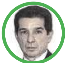
Por José Félix Lafaurie Rivera