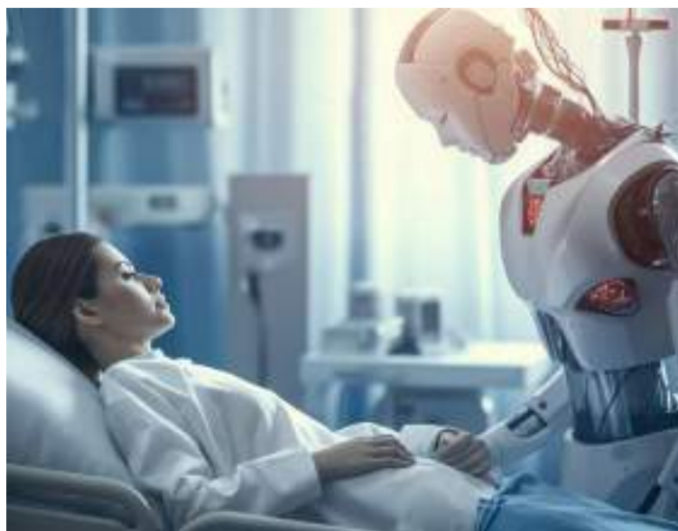
El mensaje para los nuevos galenos es que la tecnología no debe deshumanizarlos para ejercer como médicos.

Para evitar el fin (final) de la medicina debemos reenfocar la finalidad de la misma, reflexionando sobre cuál es el propósito fundamental de la atención médica. Aliviar el sufrimiento, prolongar la vida y mejorar su calidad son objetivos loables, pero tan importante es curar como acompañar, siempre desde el respeto a la dignidad de la persona enferma intentando potenciar el bienestar integral de los pacientes. Un bienestar físico, mental, social y espiritual, al final somos humanos no máquinas.