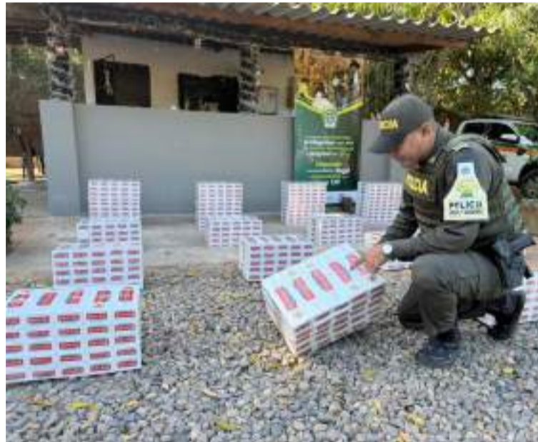
La operación se cumplió en el km 23 de la vía Palomino-Riohacha, jurisdicción del corregimiento de Mingueo.

El procedimiento tuvo lugar en el kilómetro 23 de la vía Palomino-Riohacha, en jurisdicción del corregimiento de Mingueo, donde los uniformados