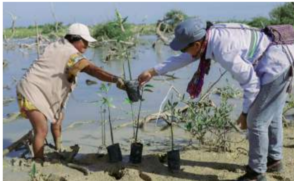
El mangle es vital para la estabilidad de las costas y el equilibrio ambiental, además actúa como una barrera natural frente a la erosión.