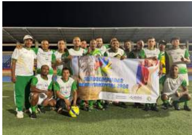
El evento reunió a más de 100 deportistas provenientes de las selecciones del sur y centro del Departamento.

Resultados destacados de las Sordolimpiadas