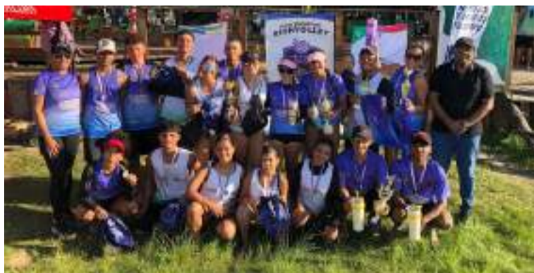
Durante estas jornadas se realizaron competencias en tres categorías: femenino, masculino y mixto.

Las playas de Riohacha fueron el escenario de la Tercera Copa Interclubes de Navidad de Voleibol Playa, un evento deportivo que reunió a más de 50 jóvenes atletas de los departamen-