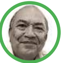
Por Amylkar Acosta Medina www.amylkaracosta.net