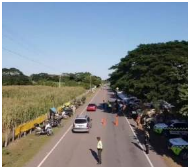
De la estrategia hacen parte más de mil policías y tropas de cinco batallones de la región.

Desde las vías, las autoridades de La Guajira ratifican el despliegue de tropas de la Fuerza Pública para reforzar la seguridad en las diferentes rutas del Departamento y darle un parte de tranquilidad a propios y visitantes.