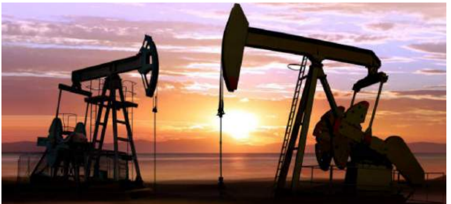
El petróleo que deja de producir Colombia lo provén otros países, entre ellos Guyana y Brasil.

Y más recientemente, la comidilla en los medios es la noticia proveniente de Argentina, en donde se registra un inusitado boom de los hidrocarburos, gracias al enorme potencial del yacimiento no convencional de Vaca muerta y a la utilización intensiva de la técnica del fracking en su explotación. Esta explica y responde por el 56.6% de la totalidad de la producción petrolera y el 54.8% de la de gas natural. Según el más reciente reporte según el cual en los últimos 10 años pasó de producir 500.000 barriles de crudo por día hasta alcanzar los 700.000 actualmente, en contraste con Colombia que pasó de producir 1 millón de barriles/día en 2014 a los 750.000 barriles/día actualmente!