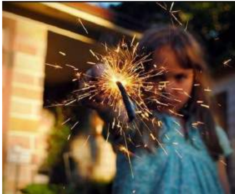
La Administración departamental reiteró que la magia de la Navidad está en el amor y la unión, no en la pólvora.

* Se llevará a cabo un concurso de videos y di-