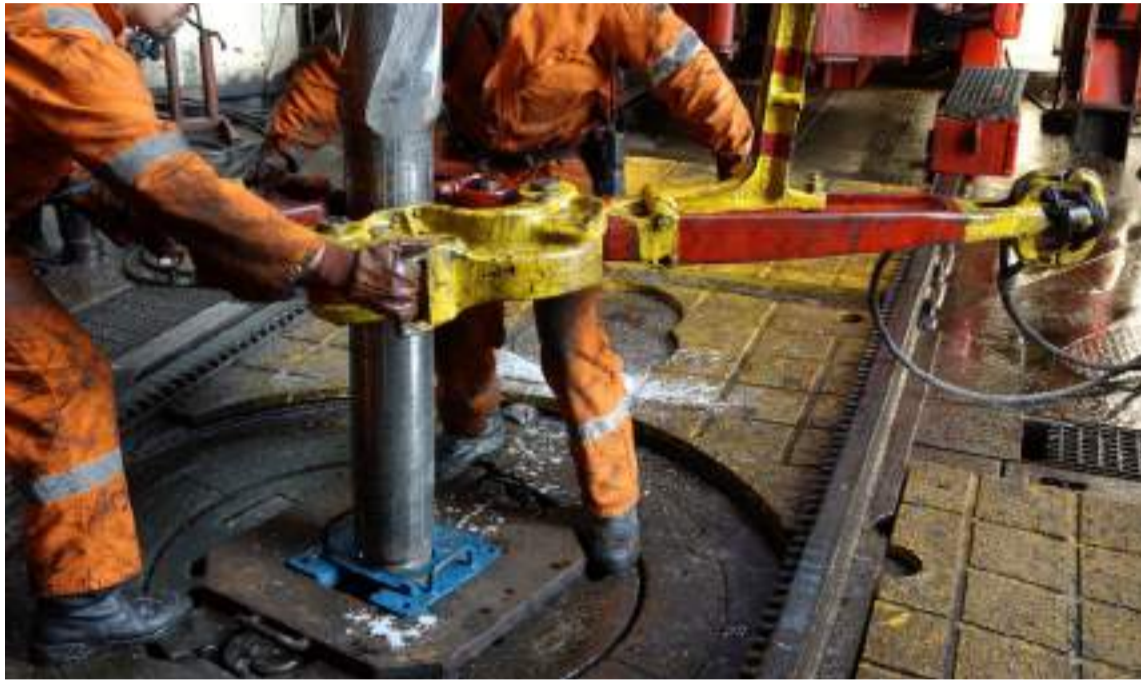
Colombia pasó de producir 1 millón de barriles/día en 2014 a los 750.000 barriles/día.

S e repite la historia en viceversa: hace 10 años, cuando la producción de crudo de Colombia alcanzó el millón de barriles al día, se hizo popular en la industria petrolera el gracejo como acertijo tratando de establecer cuánto tiempo haría falta para que se cruzara la curva de producción de Colombia en ascenso con la de Venezuela en declive. Y efectivamente, la producción de Colombia alcanzó su clímax con la producción de 1 millón de barriles/día, mientras Venezuela, después de producir 4 millones de barriles/día bajó hasta los 2'370.000 ese mismo año.