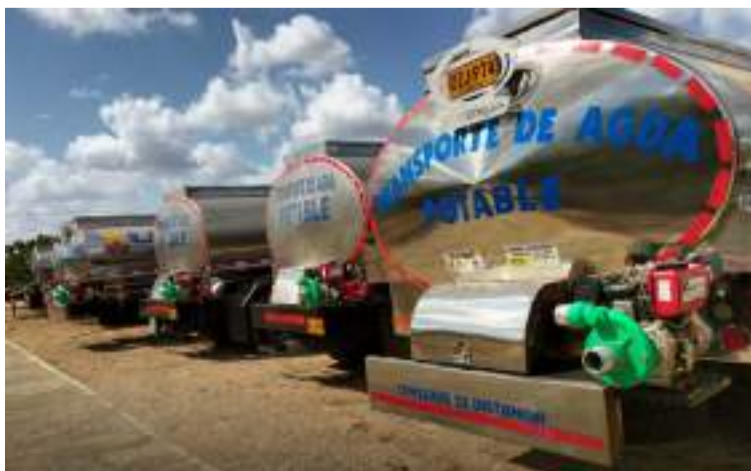
El mandatario cuenta con los documentos enviados a la entidad, y espera que la Ungrd entregue los vehículos.

El mandatario cuenta con los documentos enviados a la entidad, y espera que finalmente la Ungrd entregue los vehículos ofrecidos para suministrar agua potable a las familias wayú de la Alta Guajira.