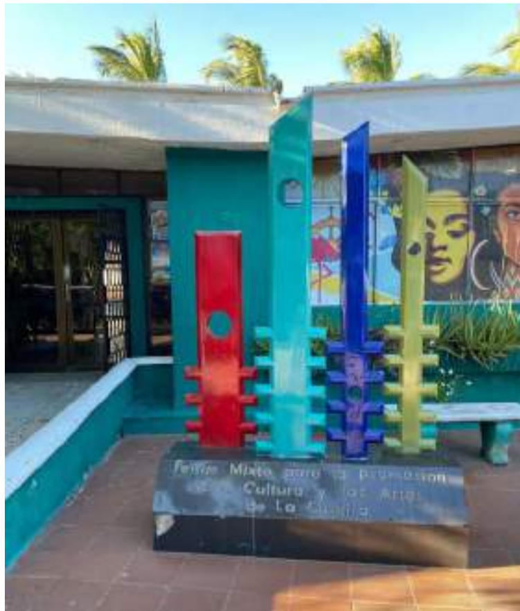
El evento será una ocasión especial para reconocer a los mejores talentos artísticos y culturales del Departamento.

“Celebrar los 31 años del Fondo Mixto es honrar un legado de trabajo incan-