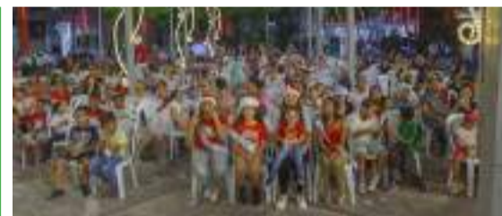
El alcalde hizo un llamado a los padres presentes y les pidió cuidar y proteger a los niños.