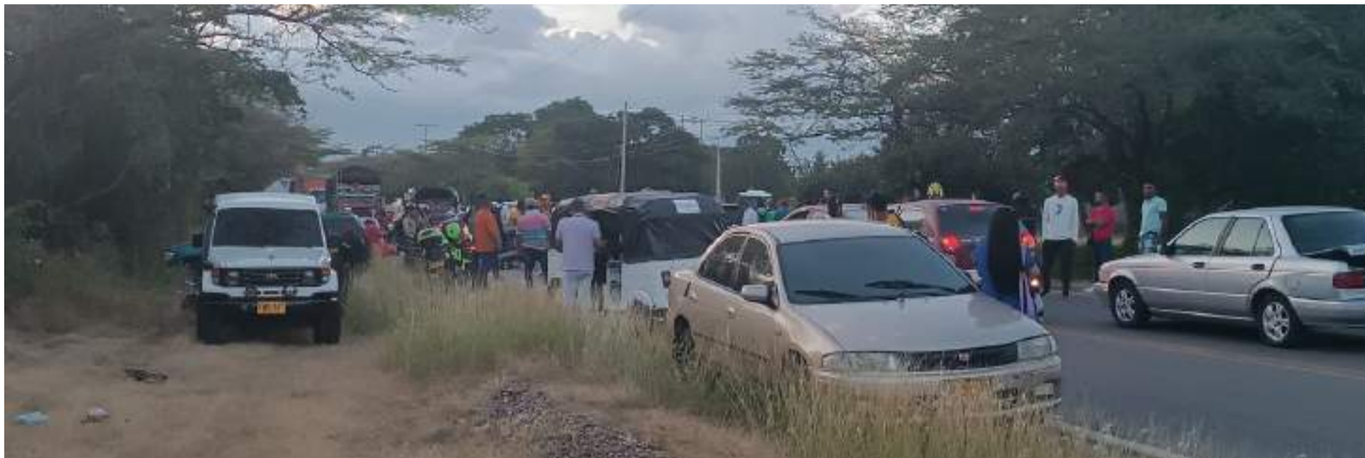
Estamos rajados en el principio de autoridad por la serie de bloqueos de vías sin que hayan sufrido el Departamento y varios municipios.

Estimo que se obtendrán resultados variados