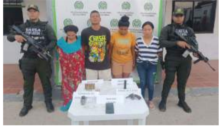
A alias 'Sheila' la capturaron en el barrio Alfonso López y alias 'Héctor', 'Delmis' y 'Sharon', en el barrio Santa Isabel.

De acuerdo a las investigaciones, los cuatro capturados serían integrantes del grupo criminal 'Los Yeikos' o 'Chili', que durante el año 2023 había sido desarticulada pero estas personas habrían tomado el nombre de la estructura delictiva para continuar con las extorsiones a comerciantes de los municipios de Maicao,