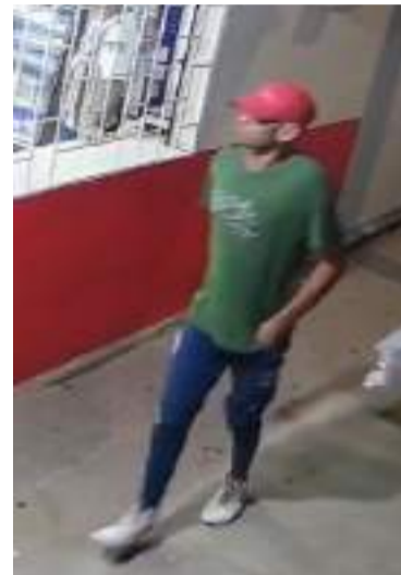
Este es uno de los ladrones de celular.

En el video se observa que uno de los sujetos desciende de la moto y verifica la zona alrede-