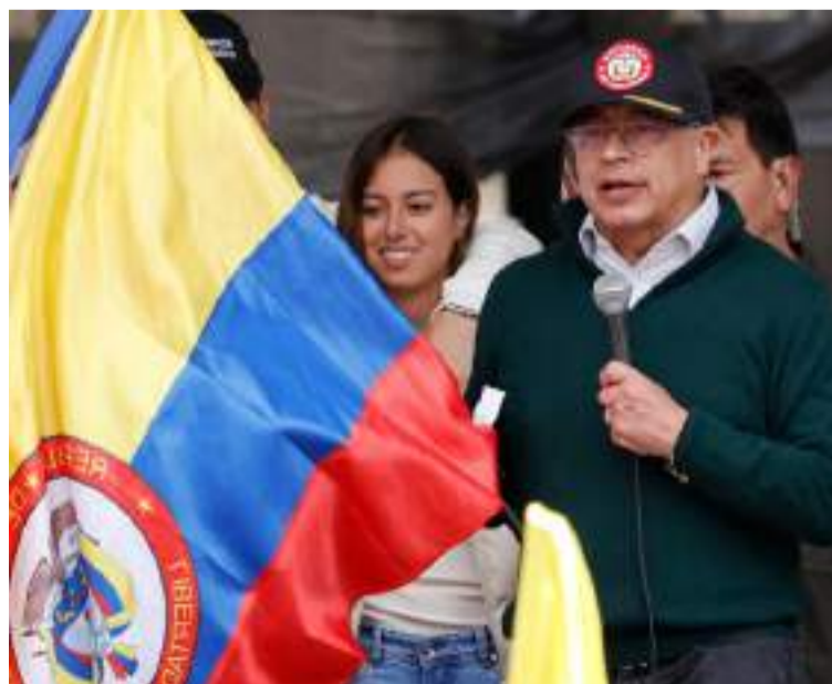
Algunas decisiones y acciones de Petro en su Gobierno pueden tener efectos caóticos en el panorama político.

Se podría argumentar que las decisiones de Petro combinan elementos de la teoría del caos y el efecto mariposa, ya que sus acciones pueden provocar cambios inesperados en la estabilidad del país. Al introducir políticas que alteran el status quo, podría estar generando reacciones en cadena que desestabilizan lo que ya estaba funcionando. Esto resalta cómo en sistemas complejos, incluso pequeñas decisiones pueden tener grandes repercusiones.