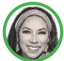
Por Marga Palacio