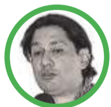
Por Jacobo Solano Cerchiaro