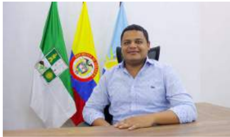
Redondo indicó que está trabajando con el gobernador Aguilar, para sacar adelante algunos proyectos.

Precisó, que está a un paso de firmar un conve-