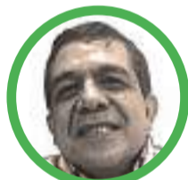
Por Hernán Baquero Bracho

La teoría del caos puede ayudar a entender cómo las crisis políticas pueden surgir de situaciones aparentemente triviales.