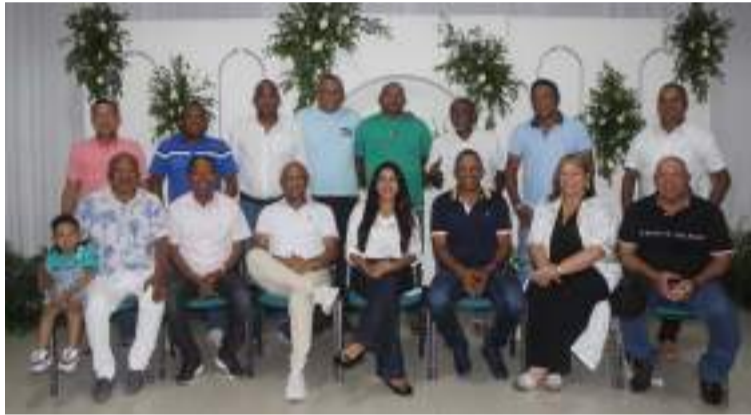
Un puñado de reconocidos líderes de la región, han estado estructurando una propuesta democrática.

Se pretende que oriente y aporte lineamientos sólidos, e impulsen a un