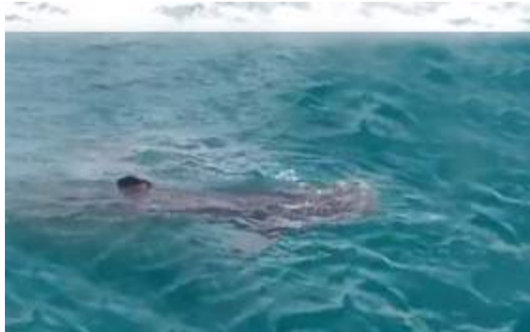
Es una especie cosmopolita que habita en todas partes del mundo y es altamente migratoria.

Este es el pez más grande del mundo, el cual puede alcanzar una talla máxima de 16 metros; es una especie cosmopolita que habita en todas partes del mundo y es altamente migratoria. Es una especie planctívora, es