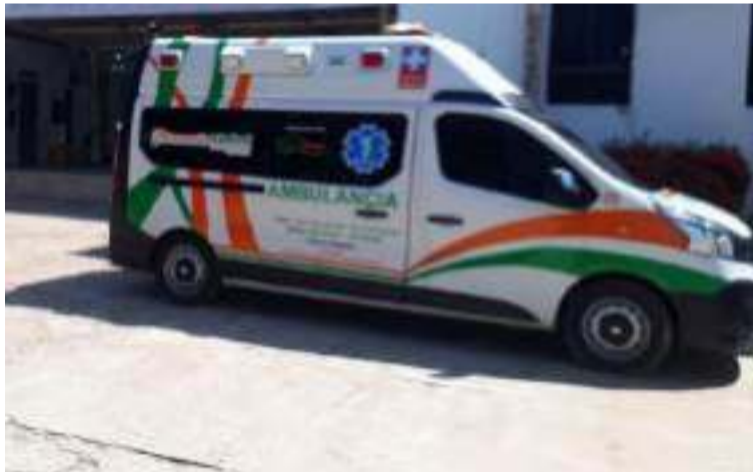
Los asaltantes despojaron de sus pertenencias a los conductores de las ambulancias y a médicos.

Una vez se detuvieron, los asaltantes despojaron de todas sus pertenencias a los conductores de las ambulancias, así como