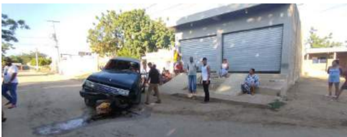
El incidente ocurrió en el barrio Patio Bonito, viéndose involucrada una Toyota Burbuja.

controles para evitar situaciones como la registrada, para evitar que pongan en riesgo la vida de personas producto de la combinación de alcohol y velocidad.