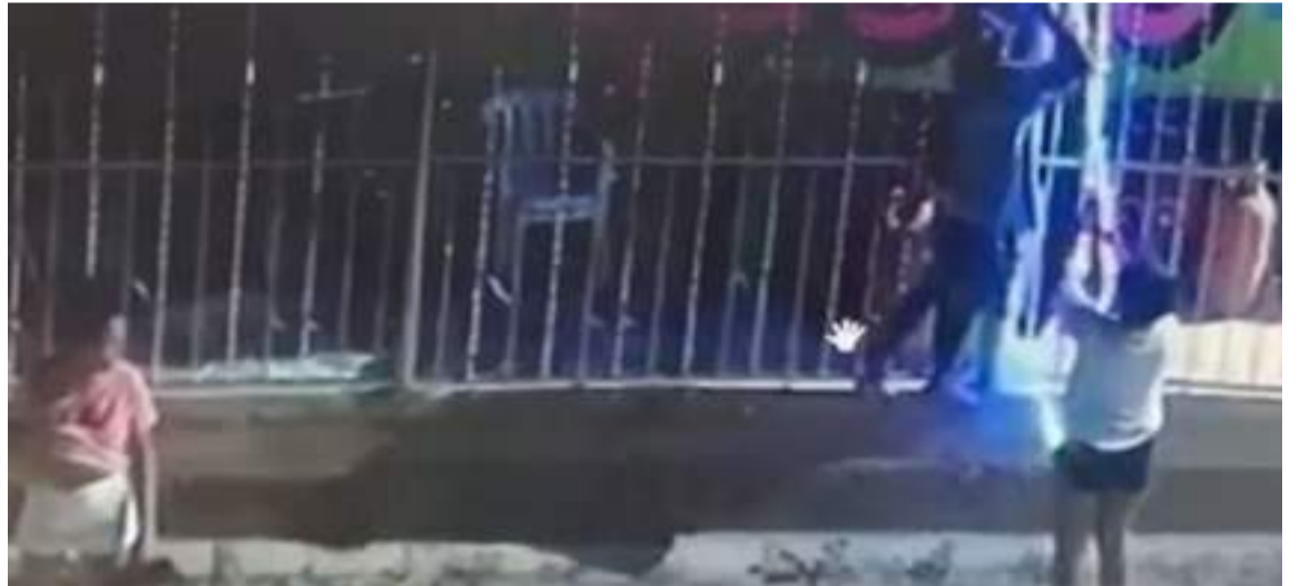
Tres personas se llevaron las luces navideñas que decoraban una tienda.

DESTACADO El gremio de comerciantes calificó el deplorable hecho como un acto de vandalismo y pidieron a las autoridades ejercer mayores controles en horas de la madrugada.