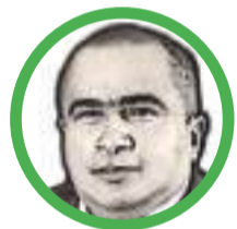
Por Arcesio Romero