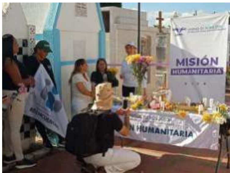
En el caso de los desaparecidos, corresponde a la Fiscalía como a la JEP esclarecer la verdad y hacer justicia.

cada no sabemos si haya sido una de las que se intervinieron y se colocaron los restos en otro lugar y se hayan mezclado”, dijo Cala a Diario del Norte.