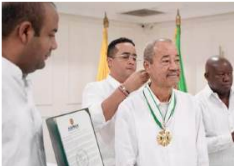
El gobernador Jairo Aguilar, condecorando al exgobernador de La Guajira, Jairo Aguilar Ocando.

"Tenemos que convertirnos nosotros en verdadero referente y dar esa lucha entre todos, y debo agradecer que en este año junto a la Asamblea departamental, hemos generado unos espacios de concertación, de hablar más allá de lo que podemos construir nosotros con nuestros esfuerzos, y de plantearle al Gobierno nacional la posibilidad de que vea La Guajira no solamente como un territorio donde podamos nosotros construir esos grandes proyectos, sino que también se refrenda la impor-