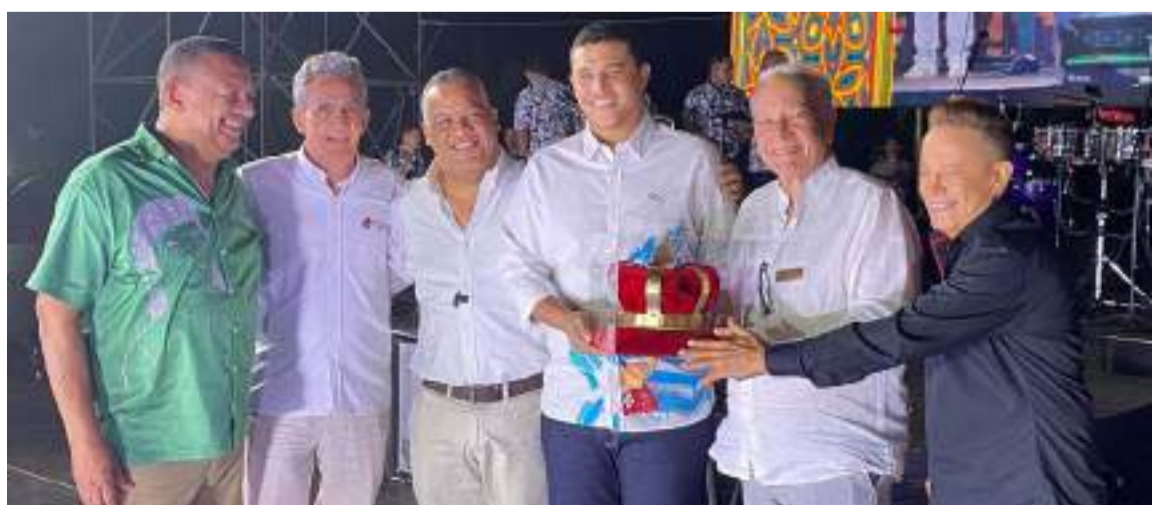
La Fundación Festival de la Leyenda Vallenata exaltó la vida y obra musical de Rois.