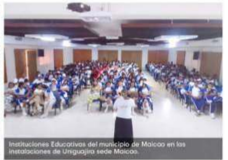
Instituciones Educativas del municipio de Maicao en las instalaciones de Uniguajira sede Maicao.

compromiso de fortalecer los lazos con las comunidades educativas de la región, motivar a los jóvenes a seguir su camino académico y proporcionándoles las herramientas necesarias para alcanzar el éxito profesional.