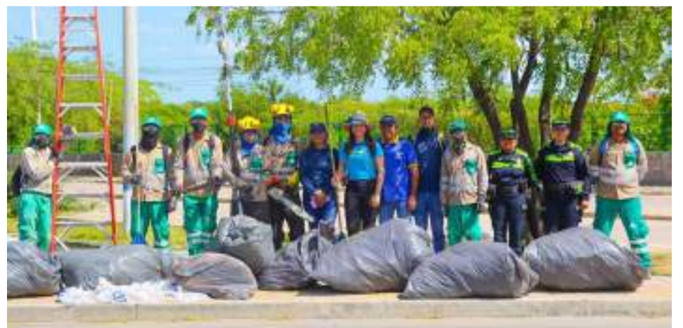
La actividad, además de la empresa Interaseo y la Policía Nacional, contó con la colaboración de la Dirección de Servicios Públicos.