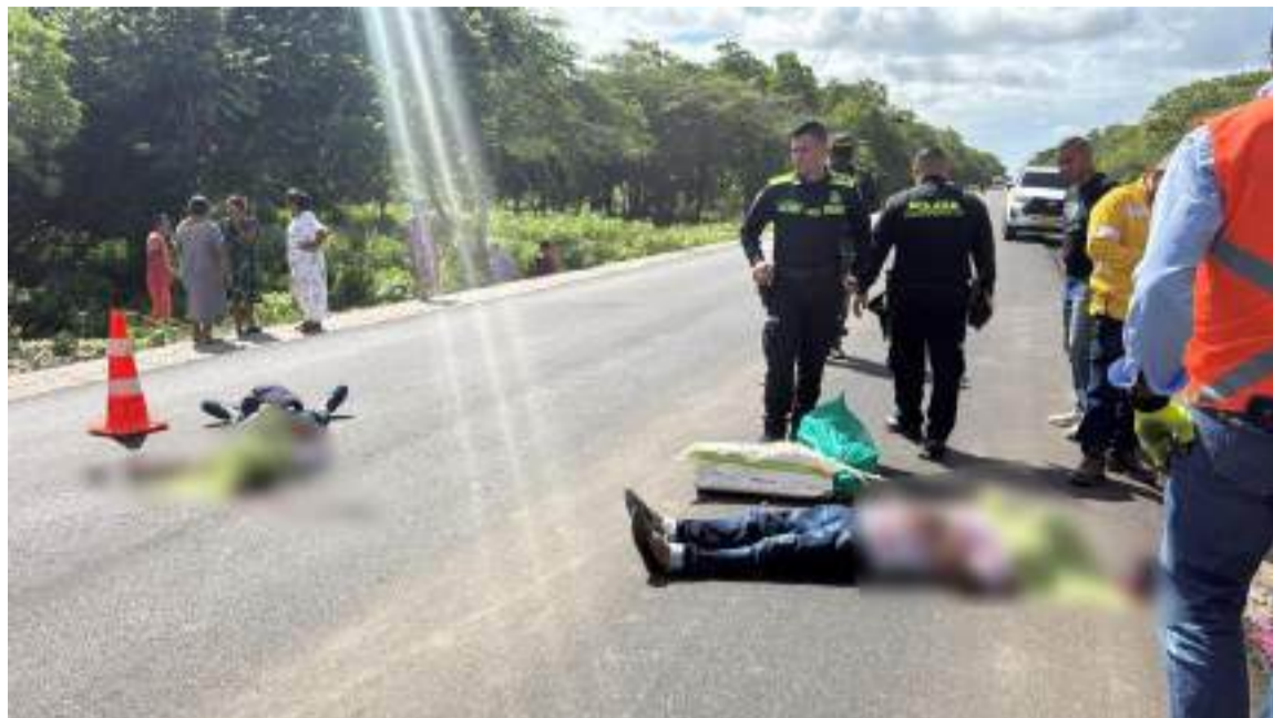
Las autoridades señalaron que los dos hombres habían salido a bordo de una moto desde la comunidad de Kaipaa en el sector de Chivo Mono.