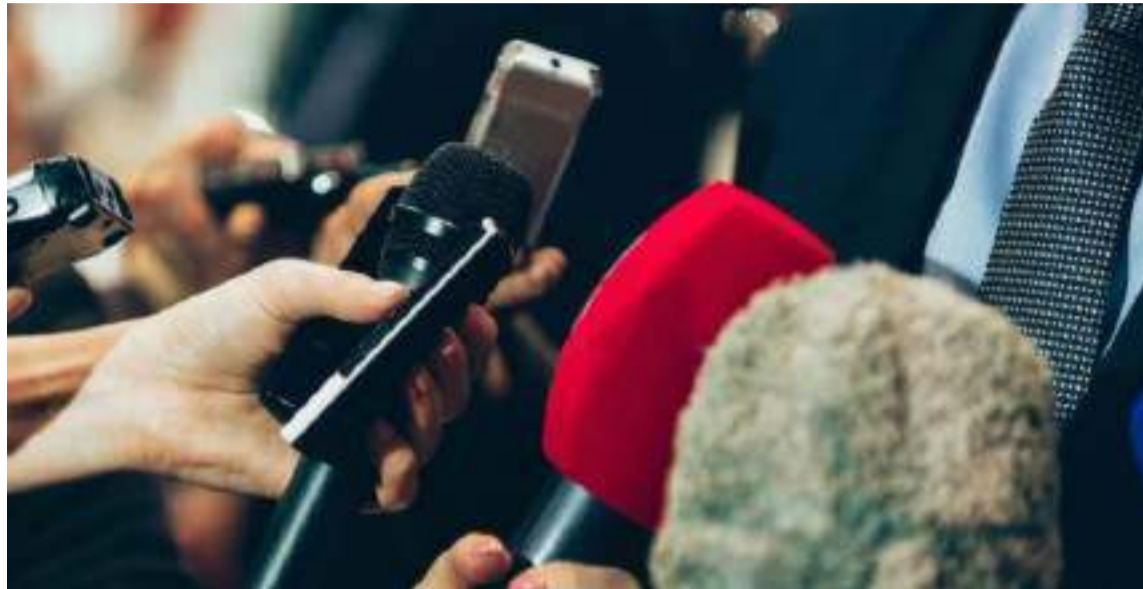
Los receptores son jurados que termometrizan el rating de tendencias en el periodismo.

Los receptores son los jurados populares, que termometrizan, el rating de tendencias, en el periodismo rutinario. Estos gustos pueden asimilarse a un menú (platos de co-