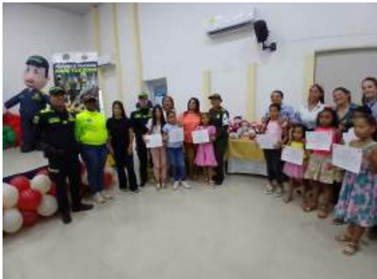
El programa benefició a niños, niñas, adolescentes, jóvenes y adultos a través de distintas actividades.

El evento contó con la participación de diversas entidades y autoridades, entre ellas la Alcaldía municipal, la gestora social,