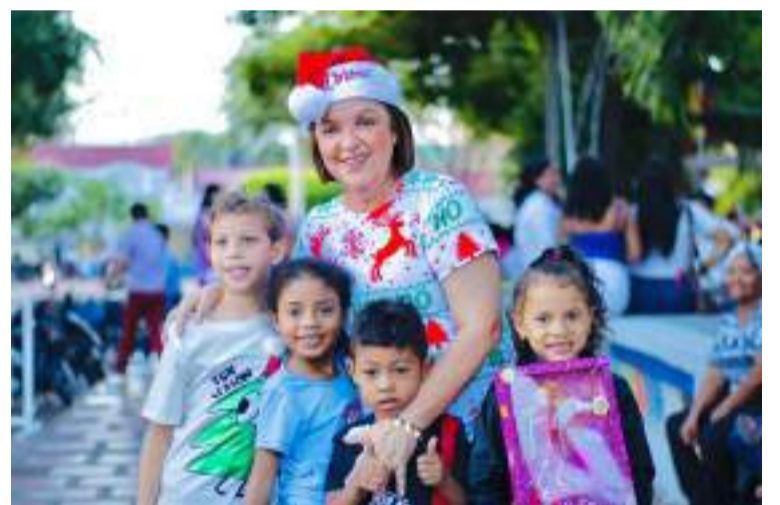
La alcaldesa de Villanueva expresó su felicidad y orgullo por celebrar estas fechas con la comunidad.