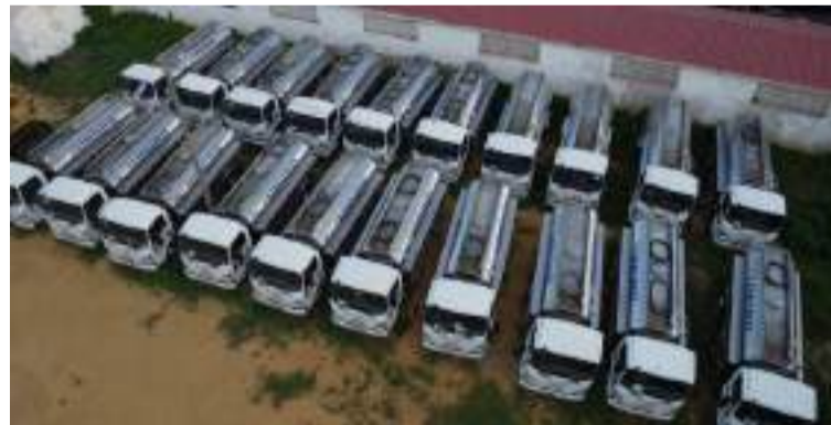
Los vehículos fueron contratados durante la administración de Olmedo López, en la llamada ‘Feria del Agua’.

“Si hubiésemos sabido que los carrotranques los sacarían en las horas de la madrugada, habríamos bloqueado la vía para evitar que se los llevaran