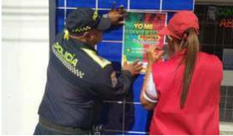
Estas acciones buscan reducir los altos índices de quemados registrados en años anteriores.