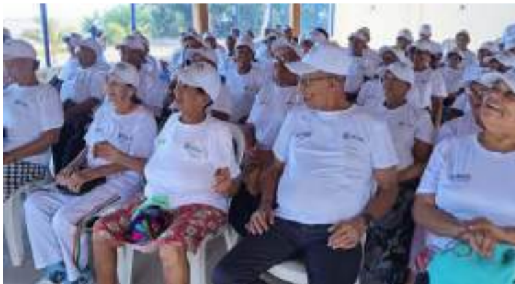
Con esta acción, La Guajira reafirma entornos donde la recreación, la salud y la dignidad sean prioridades.

por la organización de este tipo de actividades.