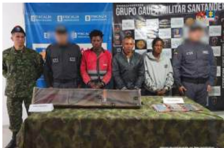
Los procesados no aceptaron cargos y un juez de control de garantías les impuso medida de aseguramiento.

La Fiscalía General de la Nación judicializó a tres presuntos integrantes del 'Clan del Golfo' que estarían involucrados en extorsiones e intentos de homicidio en Santander, Bolívar y Cesar.