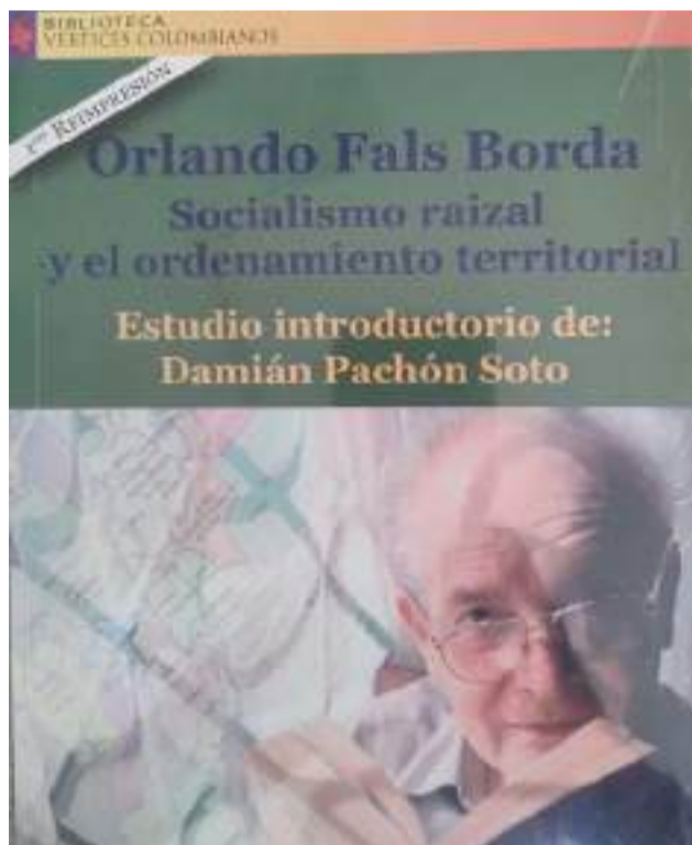
El 11 de julio de 2025 se cumple el centenario del natalicio de Fals Borda y se debe aprobar la ley de competencias.

En cuanto a la distribución de los recursos entre la Nación y las entidades territoriales plenas se pactó por los regionalistas y los departamentalistas de la Asamblea Nacional Constituyente. Las fórmulas matemáticas de los originales artículos 306 (Situado fiscal) y 307 (Participaciones en los Ingresos Corrientes de la Nación), objeto de modificación por el Acto Legislativo aprobado hace