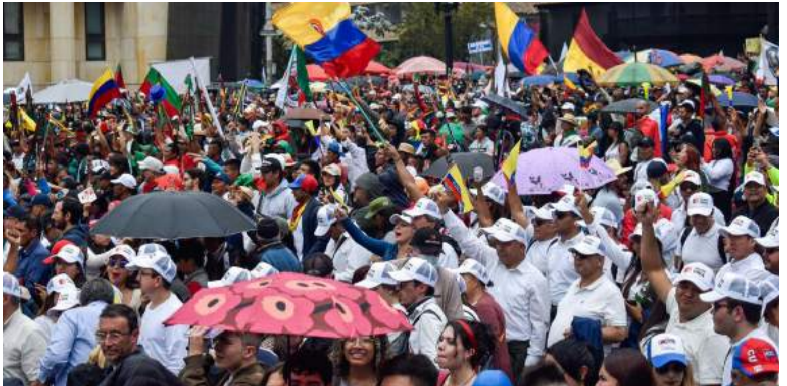
Los paros son utilizados para ejercer presiones de inconformismo con determinadas autoridades.

Los paros son utilizados para ejercer presiones, de inconformismo con determinadas autoridades, por incumplimientos, en compromisos, obligaciones o soluciones de problemas y necesidades; pero no deben coartar, el libre derecho de movilización, afectando gravemente a muchas personas, sobre todos, quienes necesitan de atenciones de salud. No se deben utilizar medidas abusivas de protestas, que derivan y perduran, por negligencias, de mandatarios. Antes de iniciar diálogos, con manifestantes, la autoridad debe exigir el desbloqueo, para luego, concertar, con quienes dirigen y coordinan, los paros. Mostrar debilidades, es inaceptables.