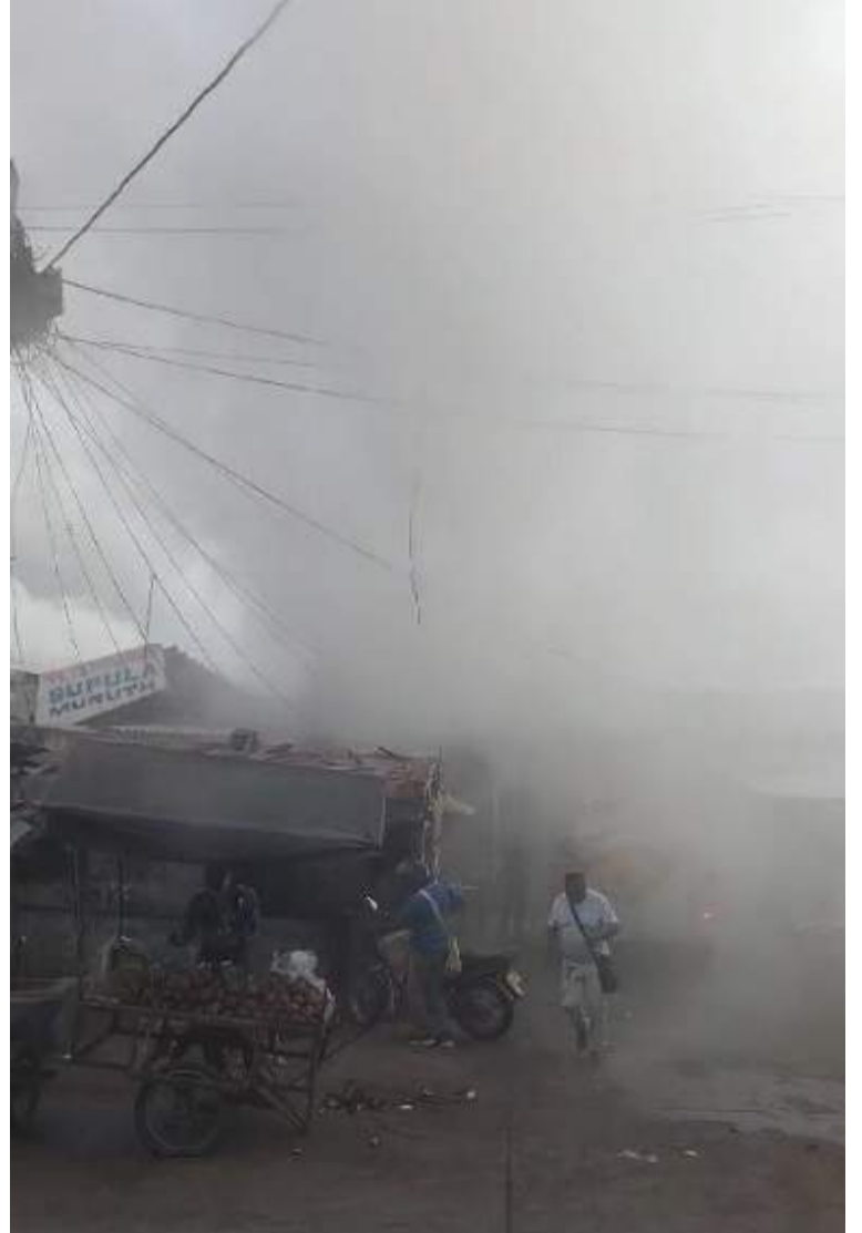
El incendio se presentó en horas de la mañana de ayer en uno de los sectores del mercado nuevo.