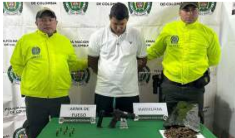
Esta persona, junto con los elementos incautados, fue puesta a disposición de la Fiscalía URI de Riohacha.

Esta persona, junto con los elementos incautados, fue puesta a disposición de la Fiscalía URI de Riohacha y deberá responder por los delitos de fabrica-