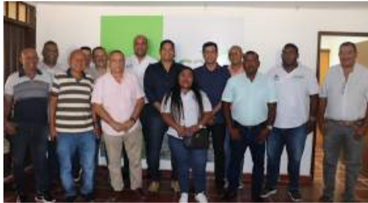
Los usuarios podrán realizar trámites de movilización interna de animales, solicitar Gsmi y guía de transporte.

"Esta institución que va a fortalecer a nuestros campesinos, pero que tiene una connotación muy especial y es evitar el desplazamiento de ellos