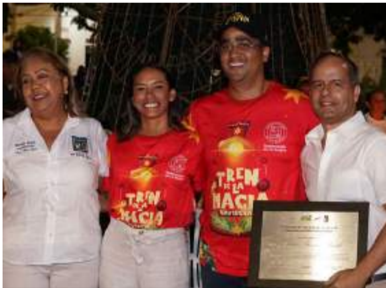
Con esta actividad, la Gobernación busca alegrar a los pequeños y fortalecer los lazos de esperanza y amor.

Este recorrido navideño tiene como objetivo brindar a los niños y niñas de