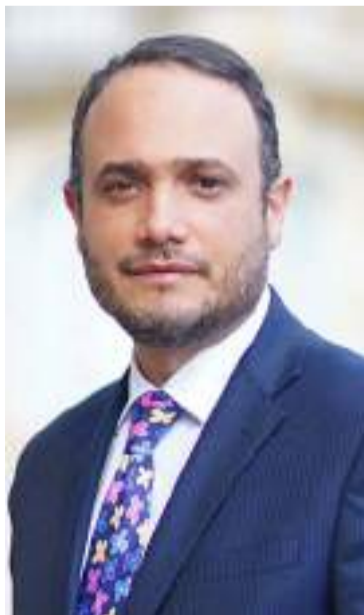
Senador Alfredo Deluque Zuleta.

Fue aprobado por unanimidad en la plenaria de la Cámara de Representantes, el octavo y último debate del Proyecto de Acto Legislativo (PAL) de la autoría del Senador Alfredo Deluque, que busca crear una verdadera política de seguridad alimentaria en Colombia. Con la aprobación de este proyecto se modifica el artículo 65 de la Constitución Política de Colombia para establecer la obligación del Estado de dirigir sus políticas hacia el aseguramiento del derecho a la alimentación, a estar protegido contra el hambre y la desnutrición y a garantizar la soberanía y