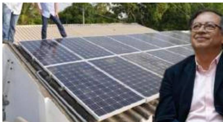
El presidente Petro dijo que estos paneles se pueden financiar también vía subsidios y hacer una operación financiera.

En el marco de la Asamblea Popular de la Democracia Energética en el Caribe, realizada en Barranquilla, el presidente Gustavo Petro anunció un