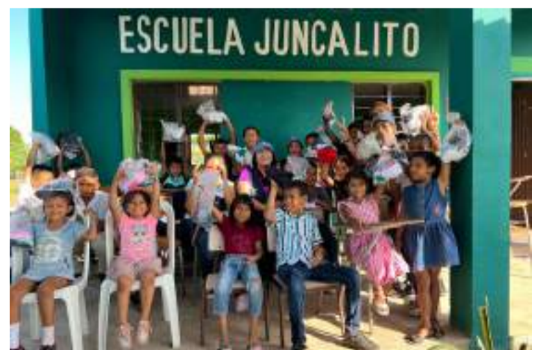
La distribución de ayudas a familias vulnerables llegó a colegios y comunidades rurales.

"Villanueva va a brillar esta Navidad, llevando alegría y esperanza a cada rincón del municipio", concluyó la gestora social.