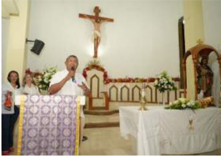
Este acto espiritual abrió oficialmente las festividades, encomendando a Dios el éxito del festival.

Durante la misa, se colocó en manos de Dios estas festividades folclóricas