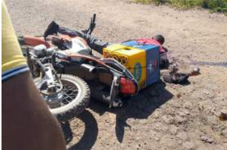
La víctima mortal era muy conocida en esta zona rural y pertenecía a la disidencia del grupo armado.

El crimen se registró en el sector conocido como 'El Cero' en el municipio Guajira del estado Zulia, a pocos kilómetros de la frontera, entre el poblado