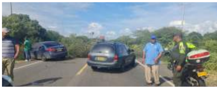
El descontento de los usuarios es evidente ya que por cuarto día las vías de La Guajira se han visto afectadas.

Según los manifestantes, debido a la falta de atención por parte de la Alcaldía de Manaure, decidieron bloquear la vía para exigir sus derechos, sin embargo, solo hasta el mediodía llegaron funcionarios con quienes dialogaron y llegaron a acuerdos para restablecer el servicio de energía.