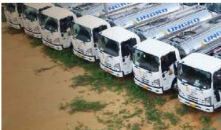
Entre las alertas de la Procuraduría, se encuentran que hay evidencias de daños en algunos vehículos.

Además, se evidenció que un carrotanque carecía de motobomba, por lo que de acuerdo con el Ministerio Público sólo se observaron los orificios donde estaba instalada, con rayones y rastros de oxidación.