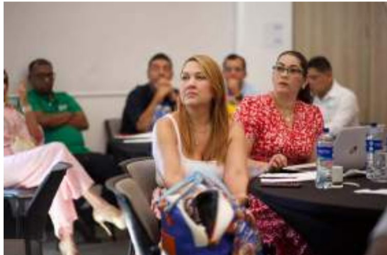
Corpogujaira destacó su compromiso con la sostenibilidad ambiental y su liderazgo en la región.

Durante el encuentro, Corpogujaira destacó su compromiso con la sostenibilidad ambiental y su liderazgo en la región, presen-