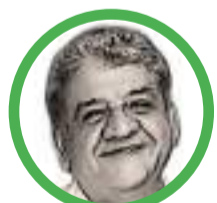
Por Jesualdo Fernández Valverde