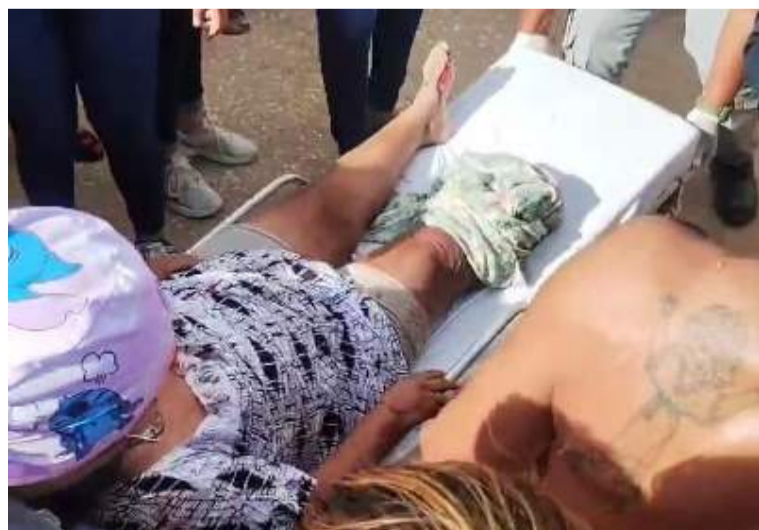
Familiares de la víctima lograron detener al conductor del vehículo a pocas cuerdas del lugar del incidente.

Este hecho ha causado gran conmoción entre los habitantes del municipio de Uribia debido a la magnitud de lo sucedido ya que la mujer perdió una de sus piernas en un accidente de tránsito lo que pone en evidencia la falta de atención a la seguridad vial en la localidad.