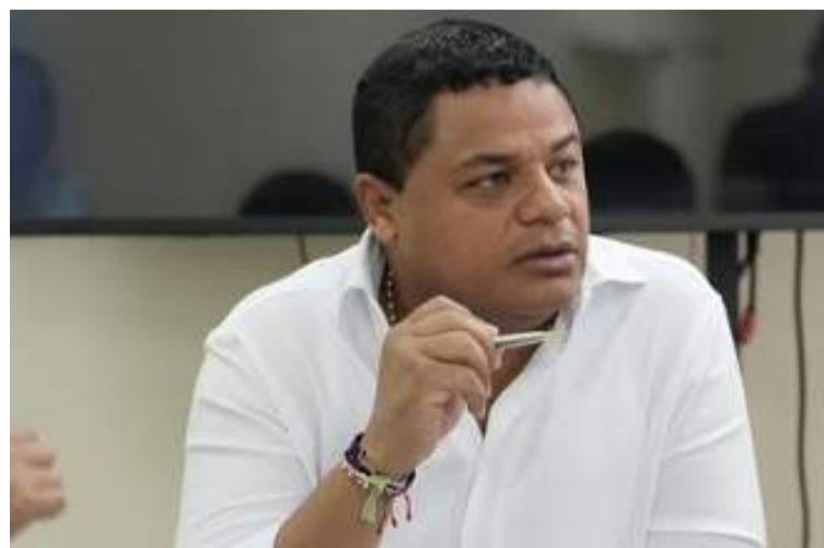
Redondo solicitó aplazar el desalojo para seguir buscando mecanismos y así atender a las familias wayuú.

"Nuestra voluntad como Administración Distrital, es lograr satisfacer el goce efectivo del derecho fundamental que fue amparado por la jueza, por lo que reitera que tenga en cuenta nuestra solicitud", dijo.