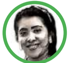
Por Delia Rosa Bolaño Ipuana