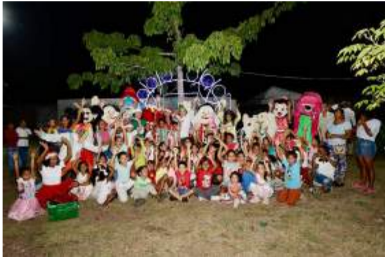
Los parques del municipio han sido intervenidos para lucir renovados y listos para la temporada navideña.

Como parte de la agenda navideña, hoy viernes 13 de diciembre a partir de las 4:00 p.m., la comunidad está invitada a disfrutar de un show navideño en la plaza principal.