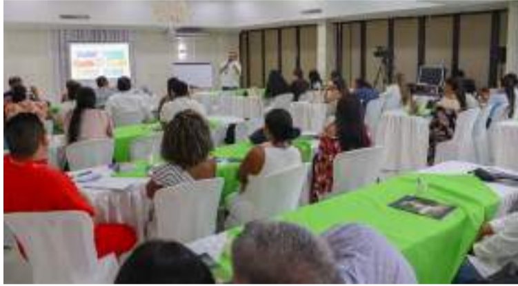
La formación estuvo dirigida a ginecólogos, médicos generales, enfermeros y auxiliares de enfermería.

El objetivo principal fue capacitar al talento humano de las diferentes instituciones prestadoras de servicios de salud, fortalecer las habilidades en