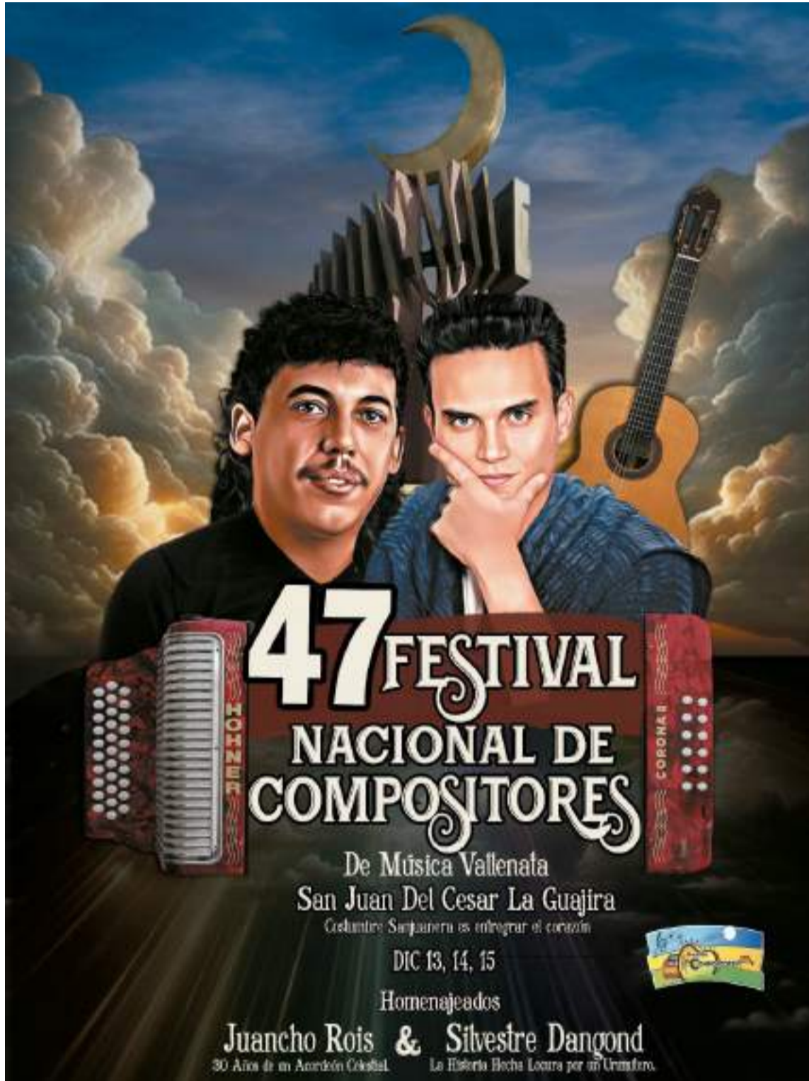
Afiche promocional de la versión 47 del Festival de Compositores de San Juan del Cesar en homenaje póstumo a ‘Juancho’ Rois y reconocimiento en vida a Silvestre Dangond.

En sus 47 años de vida, el festival ha dejado el le-