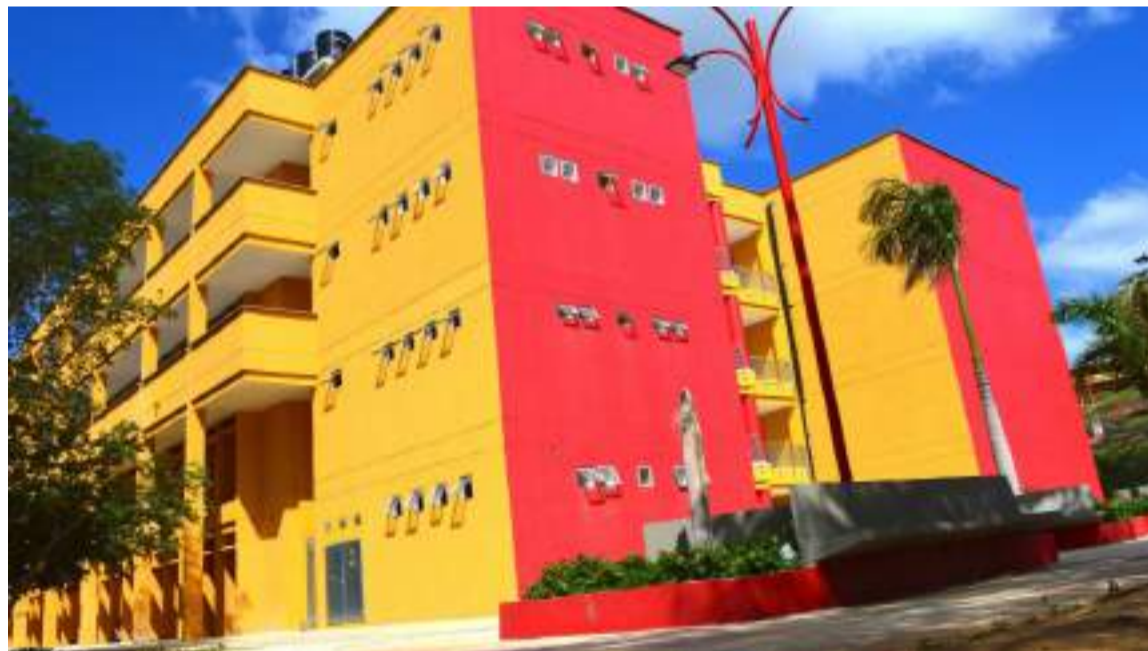
En 2024 se realizó una serie de encuentros en instituciones educativas de La Guajira.

Esta iniciativa busca transformar la enseñanza de la literatura con un enfoque intercultural, mediante herramientas que reflejen las particularidades culturales y sociales de las regiones, para una enseñanza más contextualizada.