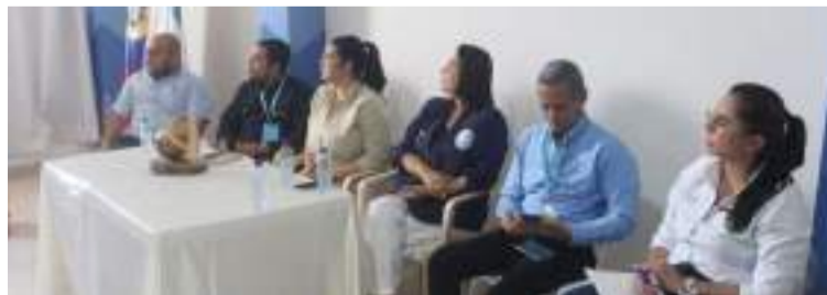
El objetivo es que los pacientes guajiros no deban desplazarse fuera del Departamento.

"La idea es que el guajiro no salga de La Guajira. Esto