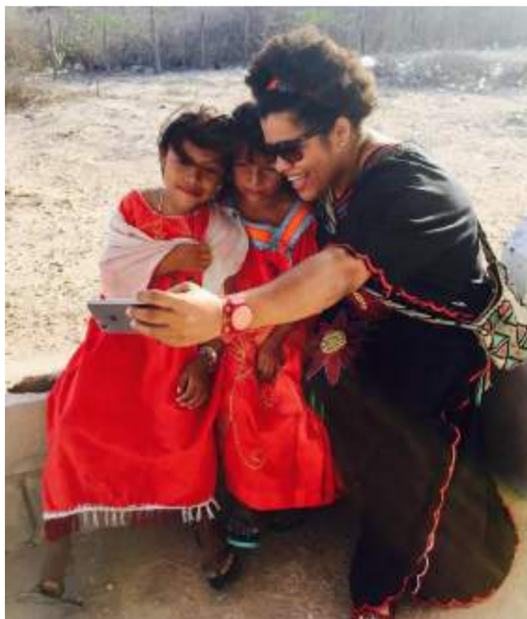
Un niño en la región tiene 60 veces más probabilidades de morir por desnutrición que un niño en Bogotá.

sé a la región y, junto con mi esposa, fundamos una organización no gubernamental llamada Los Hijos del Sol. Nuestro objetivo ha sido llevar a cabo investigaciones escuchando a las comunidades indígenas, lo que nos permite planificar modelos de atención sanitaria más adecuados.