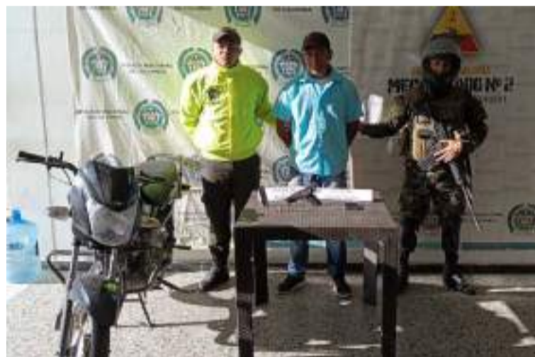
Este sujeto se dedicaba a su accionar delictivo atemorizando a los pobladores de esa jurisdicción.

La fuente militar informó que la captura de alias 'Yeison', se efectuó la mañana del martes 10 de diciembre en un sector del corregimiento Los Haticos en zona rural del San Juan del Cesar, en donde pre-