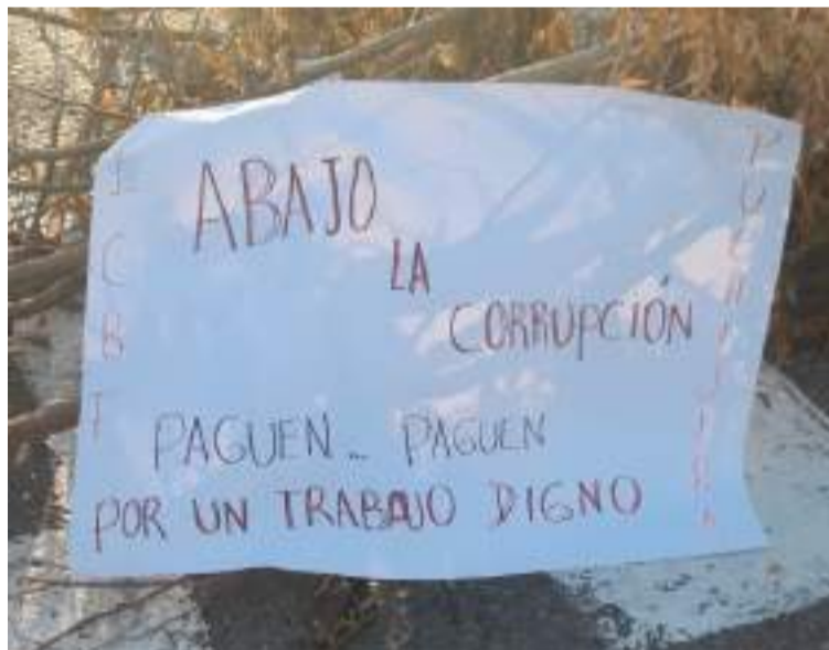
Una vez logrado el acuerdo, los protestantes decidieron reabrir el paso vehicular.

Uniformados de la Seccional de Tránsito y Trans-