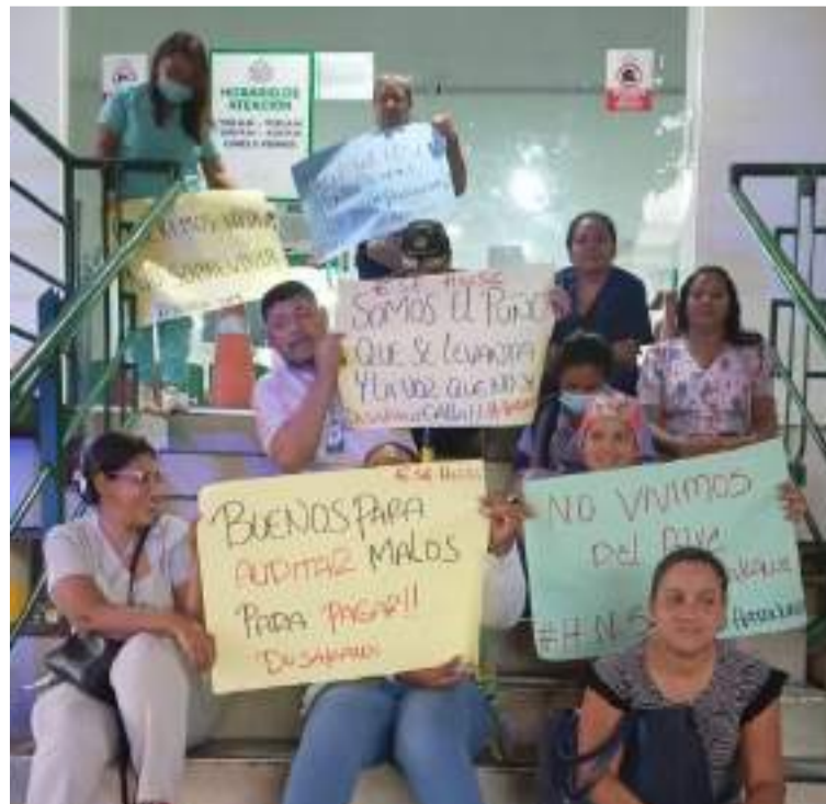
Se instaló una mesa de negociación entre representantes de los manifestantes, médicos, auxiliares y funcionarios de la EPS Dusakawi.