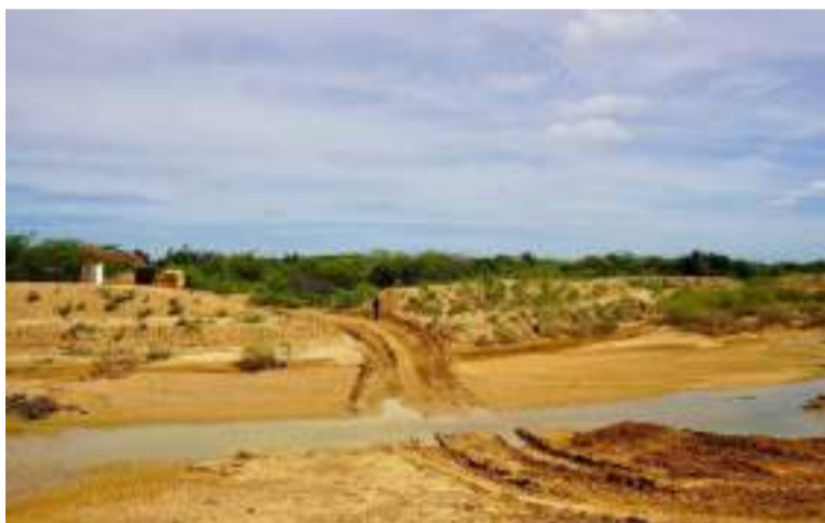
Las obras mejorarán la movilidad de más de 2.500 familias de las comunidades del sector norte y sur.

Con el compromiso de promover el desarrollo de las comunidades del Departamento, la Gobernación de La Guajira, a través de la Secretaría Departamental de Obras, ha iniciado un importante proyecto de mitigación y adecuación vial en el corregimiento de Shiruria, en Manaure.