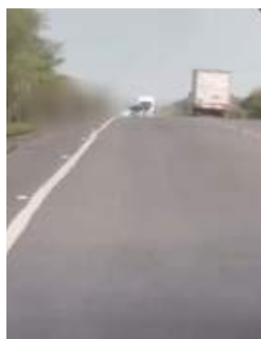
Se desconoce la identidad de los heridos.

Un bus chocó con una motocicleta dejando como resultado a tres personas heridas de gravedad, entre ellas una mujer, quienes eran los ocupantes de la moto.