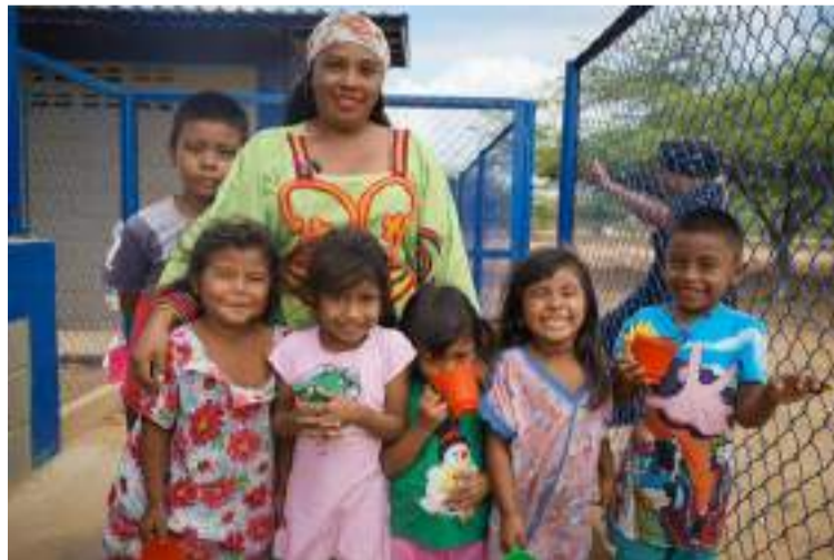
La planta de agua potable de ósmosis inversa, tiene capacidad para producir 20.000 litros de agua al día.

La planta de agua potable de ósmosis inversa, tiene capacidad para producir 20.000 litros de agua al día, utilizando energía solar. Este avance representa un hito en la mejora de la salud y las condiciones de vida de las comunidades locales, que durante años carecieron de acceso a agua potable.