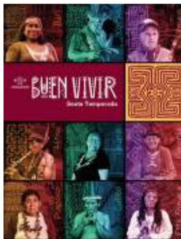
El Buen Vivir es una iniciativa multiplataforma.

DESTACADO Habrá un conversatorio que reunirá a representantes de siete pueblos indígenas de Colombia, quienes compartirán sus conocimientos sobre temas de relevancia global.