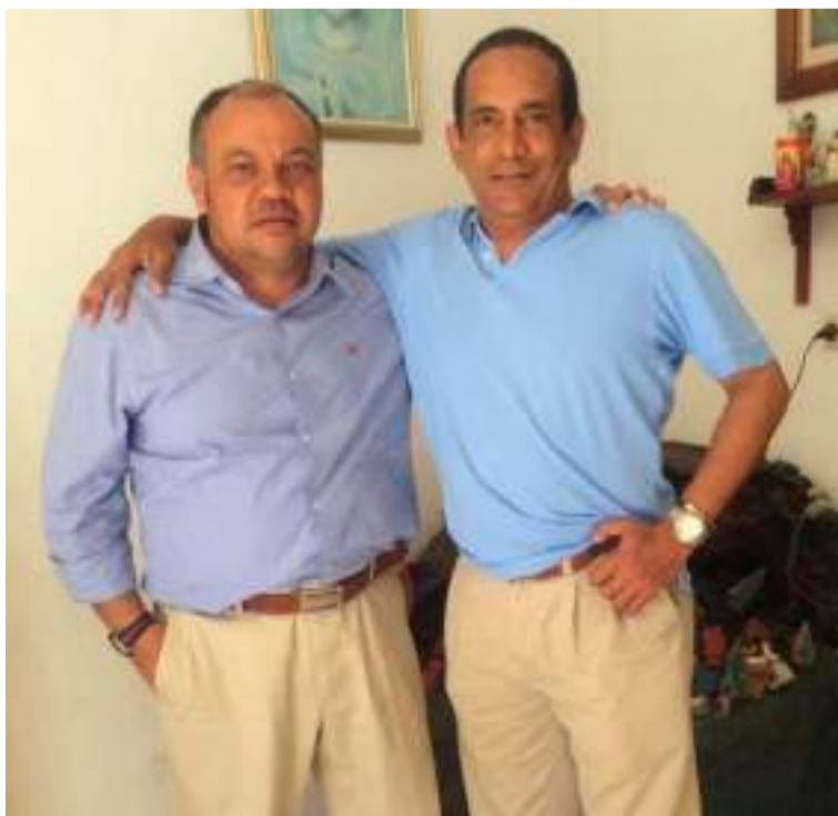
Su talento para jugar con las palabras le ha permitido que sus obras se conviertan en clásicos.

Y como dijo el filósofo de La Junta: "Se las dejo ahí.."