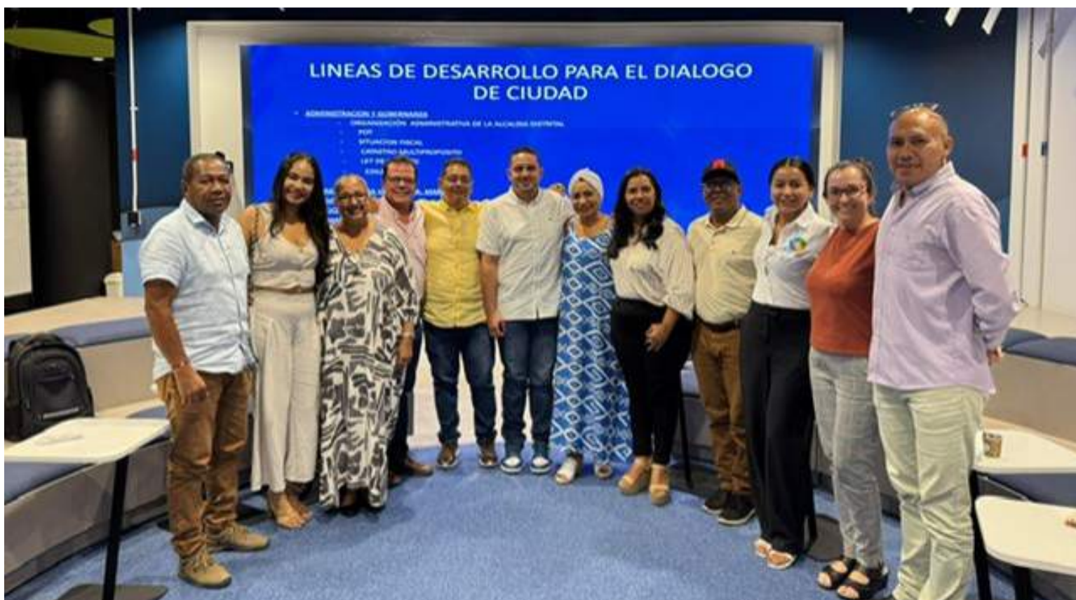
Este primer encuentro se cumplió en el CIE en la biblioteca Héctor Salah Zuleta del Distrito de Riohacha.