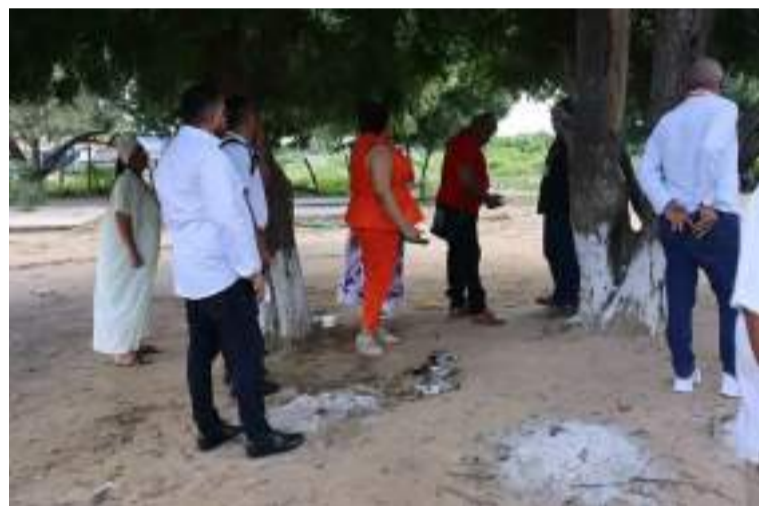
La Institución Educativa Indígena No 3 sede 'Pueblito Wayuú' está ubicada en la salida de Maicao hacia el corregimiento de La Majayura.

salidas del contexto social y del sentido de convivencia.