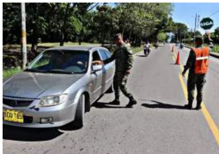
El objetivo es proporcionar seguridad a propios y turistas que transiten por los ejes viales de la región Caribe.

De esta manera, las tropas de la Décima Brigada, Segunda Brigada y Fuerza de Tarea de Armas Combinadas, han dispuesto 36 puestos de control de manera estratégica, así mismo, la participación activa de los grupos Gaula Militar, los cuales realizarán trabajos conjuntos y coordinados para prevenir delitos como la extorsión y el secuestro, potenciando la seguridad de los viajeros que tengan como destino el Caribe colombiano.