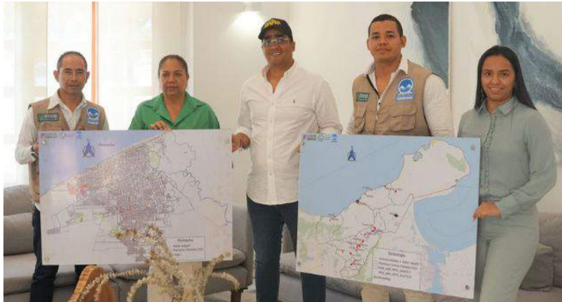
Aguilar destacó los avances obtenidos durante la ejecución del proyecto en La Guajira.

• Durante este periodo, se mantuvo la tasa de letalidad por dengue confirmada en cero, y la incidencia de dengue grave se mantiene a un bajo ni-