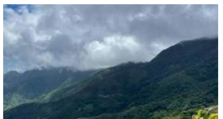
Estos sistemas montañosos son esenciales para el equilibrio ambiental y la conservación del agua.

Desde Corpoguajira se impulsan estrategias de conservación que buscan mitigar la degradación ambiental, promover la restauración de ecosistemas y fortalecer la gestión sostenible del territorio.