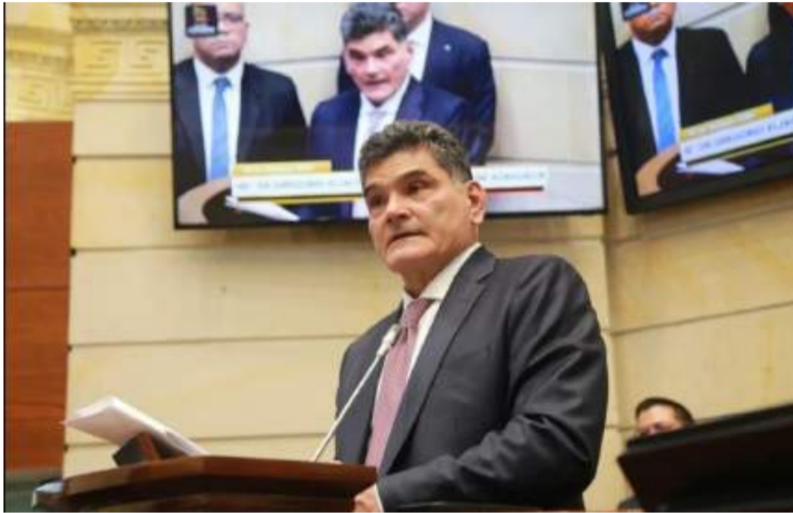
Gregorio Eljach es el nuevo Procurador General de la Nación. Asume el 15 de enero.

El organismo avanza en la investigación que abrió en abril pasado, por irregularidades en la contratación en la Unidad Na-