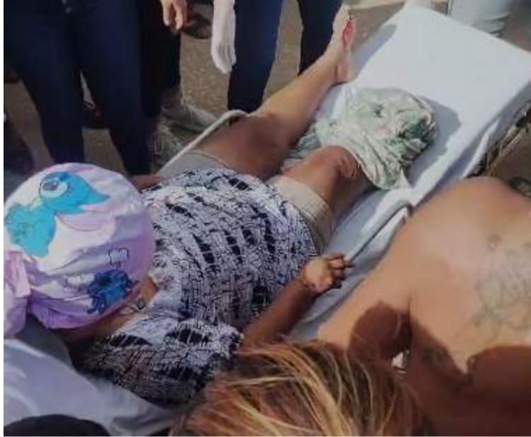
El conductor responsable de las graves lesiones de la mujer huyó del lugar con rumbo desconocido.

El accidente ocurrió el miércoles 11 de diciembre frente La Institución Educativa Escuela Normal Superior Indígena de Uribia, de donde la mujer fue auxiliada por algunos transeúntes que dieron aviso a una ambulancia, la cual trasladó a la mujer de manera oportuna hasta