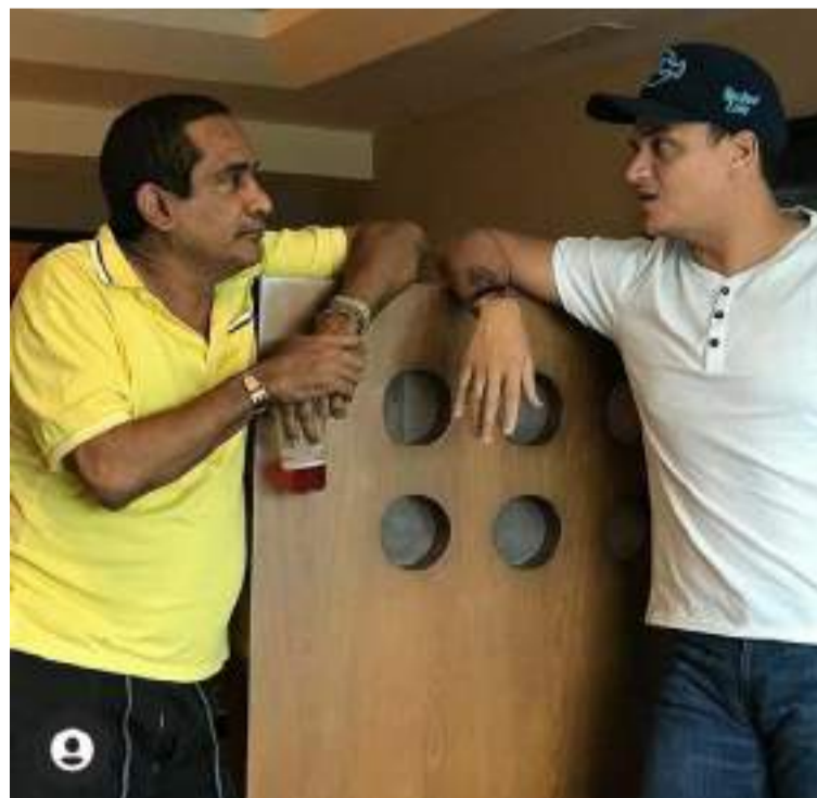
La poética de Manjarrez se distingue por su capacidad para capturar la esencia de la vida cotidiana.