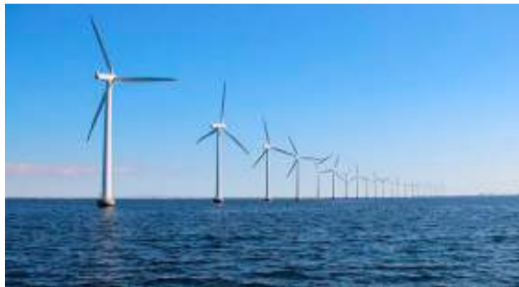
Esta transición posiciona a Colombia como un punto de referencia para Latinoamérica y el Caribe.

"Este es el inicio de la expansión de la Transición Energética Justa hacia