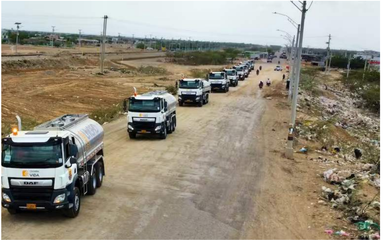
El escándalo de los carrotanques destapó el entramado de corrupción dentro de la Ungrd.

Inició el presidente Petro su gestión de Gobierno con un gabinete que para la mayoría de los colombianos, tenía hombres y mujeres de las más altas calidades profesionales y técnicas. Sin negarlo, algunos de ellos familiarizados con las prácticas de gobiernos anteriores, con ideología de derecha o de centro, duchos todos en el manejo de todo tipo de gestión en la función pública y privada; formados como estadistas o funcionarios de alto nivel en las más altas esferas de la gerencia latinoamericana.