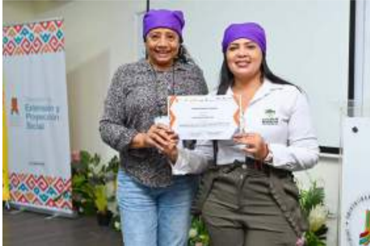
El programa fortaleció las capacidades de los participantes para actuar como agentes de cambio en sus comunidades.

En la formación, se trabajaron temas como: