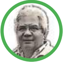
Por Rodrigo Daza Cárdenas