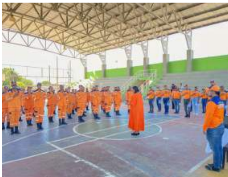
Se llevaron a cabo también los grados de 26 nuevos voluntarios que ingresan a esta institución.

El pasado 6 de diciembre la Defensa Civil Colombiana celebró en el municipio de Barrancas el Día Internacional del Voluntario donde se entregaron medallas y reconocimientos a voluntarios que se han destacado en tiempo de servicio y actividades que desarrolla esta institución a nivel departamental.