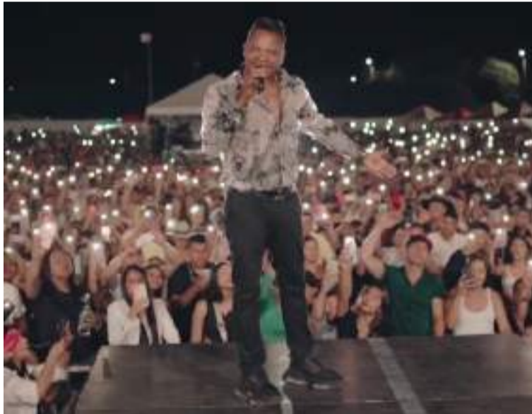
Su capacidad para componer lo llevó a la fama como uno de los más grandes exponentes del folclor vallenato.

Geles, quien falleció el 21 de mayo de 2024 a los 57 años, será recordado en la edición número 58 del Festival, que se llevará a cabo del 30 de abril al 3 de mayo del próximo año. La decisión de rendirle homenaje fue tomada en conjunto con su familia, según confirmó Rodolfo Molina Araújo, presidente de la Fundación Festival de la Leyenda Vallenata.