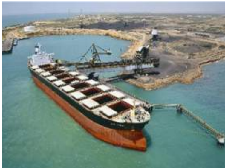
Puerto Brisa fue evaluado además de otros sitios, y se determinó que no cumple con las especificaciones mínimas.

"Eso no quiere decir que hay que mejorar, o hacia futuro colocan otro puerto, pero por ahora