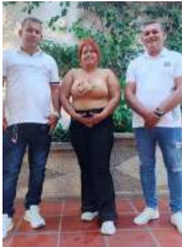
Solicitan plan de emergencia para la Alta Guajira.