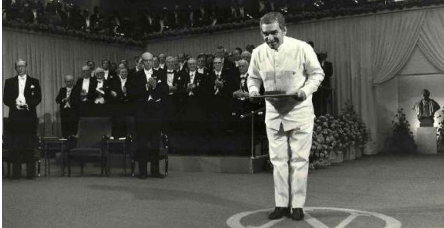
Día memorable para Colombia cuando 'Gabo' recibió el Premio Nobel de Literatura.

El título del libro, cuya portada estuvo a cargo de la diseñadora argentina Iris Pagano, apareció en el último párrafo después de dar vueltas por el marmotroto de hojas: "En el instante en que Aureliano Babilonia acabara de descifrar los pergaminos, y que todo lo escrito en ellos era irrepensible desde siempre y para siempre, porque las estirpes con-