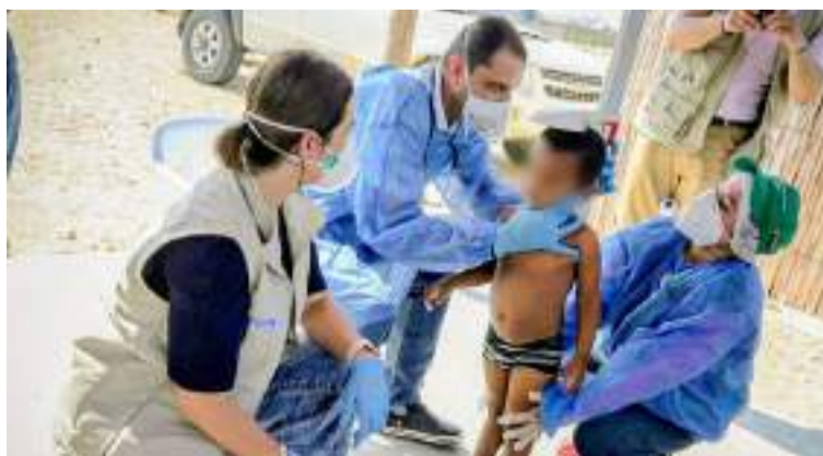
La Guajira durante 2024 está cerrando por debajo de las expectativas en materia de morbilidad infantil.

Por Veeduría para la Implementación de la Sentencia T-302 de 2017.