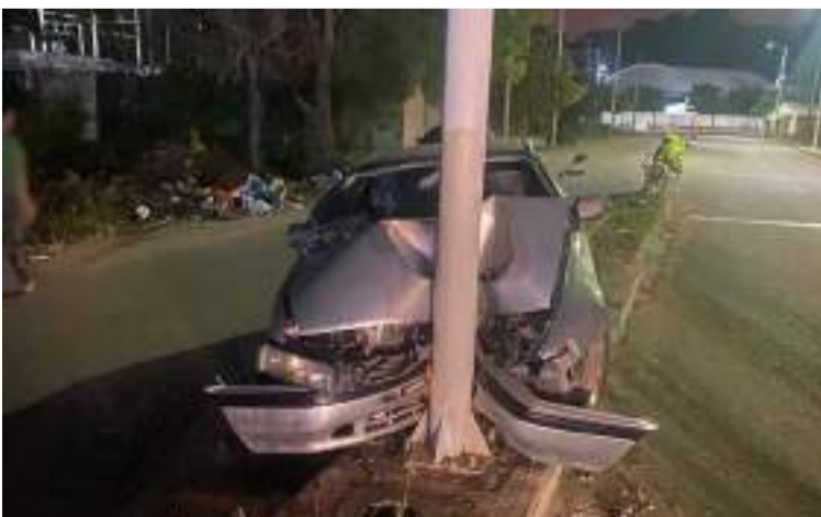
El accidente al parecer, ocurrió debido a la explosión de una de las llantas delanteras del vehículo.

Este hecho pone en evidencia la importancia de mantener en óptimas condiciones los vehículos y reforzar las medidas de seguridad vial en la región.