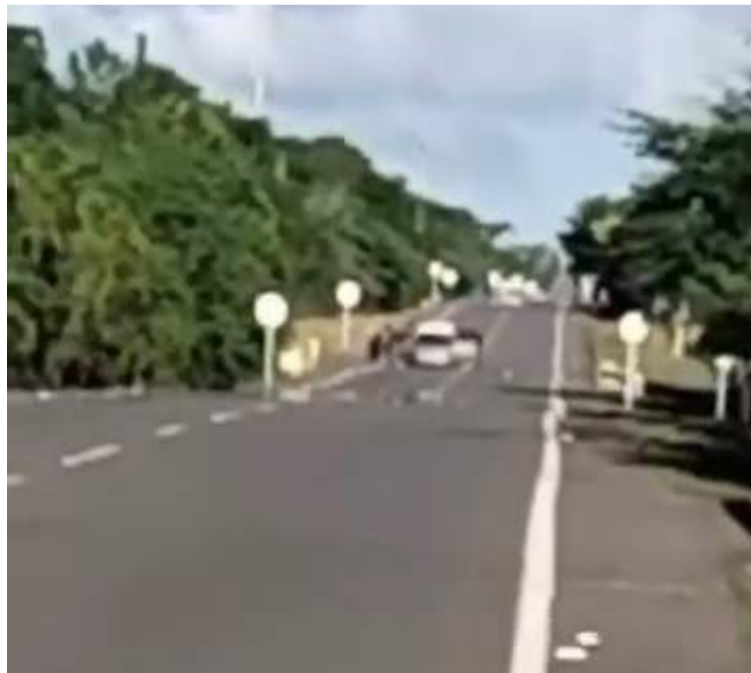
Conductores piden a las autoridades hacer control permanente para evitar que estos casos se repitan.

El hecho se registró la tarde del domingo 8 de diciembre en la vía Albania - Maicao a la altura del corregimiento de Porciosa, en donde los sujetos portando armas cortas salieron a la vía y obligaron a detener un automóvil que llevaba varias personas como pasajeros, al igual que un motorizado que iba con una persona de parrillero. Todos ellos fueron víc-