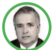
Por Rubén Darío Ceballos Mendoza