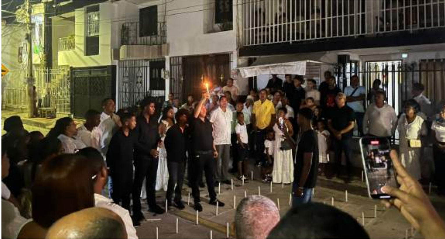
La actividad se realizó el fin de semana con motivo de la noche de velitas y para que el hecho no quede impune.