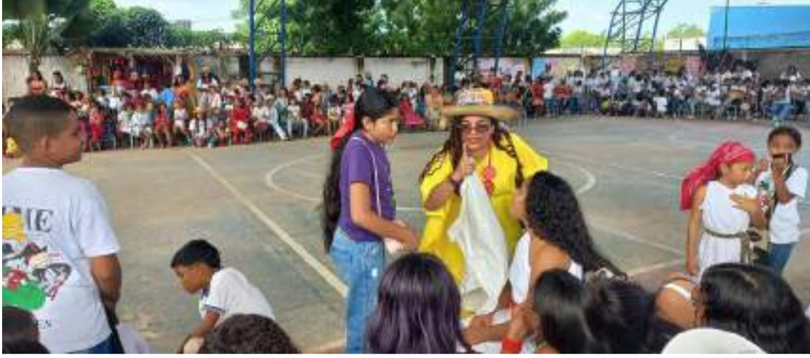
Se realizó sensibilización sobre el cuidado y protección de los animales, así como la preservación de los árboles y zonas verdes.