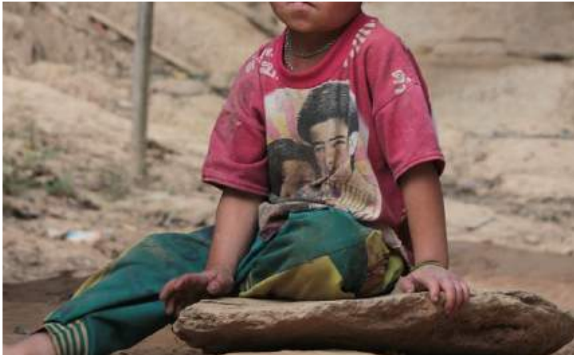
La desnutrición aguda moderada y severa se ha generalizado en el Departamento.

Al analizar la clasificación de los eventos de la vigilancia integrada de mortalidad de casos probables y confirmados en población menor de 5 años, se identifica que la mortalidad probable y confirmada por IRA, es de 35 y la mortalidad por EDA presenta 30 casos. El municipio de residencia con mayor número de muertes fue Uribia con 37 mortalidades, Maicao con 12, Riohacha 17 casos y Manaure con 24 casos. Según el informe de la Secretaría de Salud de La Guajira, para el corte analizado el municipio de Albania aportó 5, Dibulla 8,