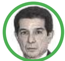
Por José Félix Lafaurie Rivera