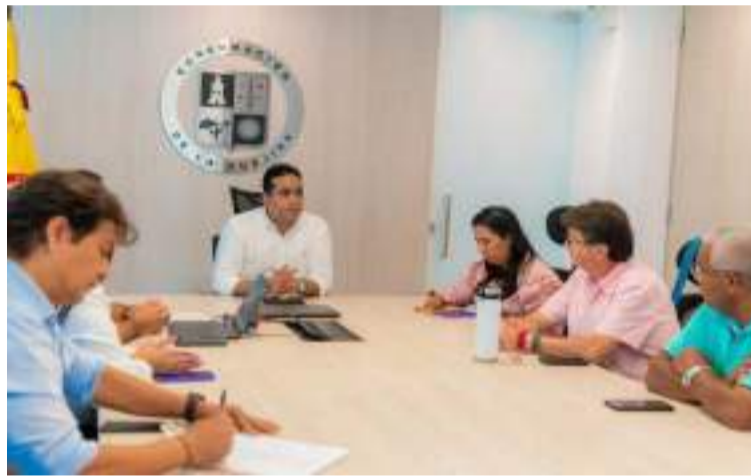
El gobernador Jairo Aguilar destacó que el turismo representa para La Guajira una posibilidad real.

nar que nuestro departamento es reconocido no solo por su biodiversidad y rica multiculturalidad étnica, sino también por su firme compromiso con la protección del medio ambiente y el bienestar social.