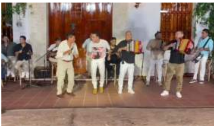
La producción se realizó en la plaza principal del pueblo, frente a la nueva casa colonial de Silvestre Dangond.

El homenaje de Silvestre Dangond al décimo rey vallenato 'Chemita' Ramos y su dinastía, saldrá para finales del presente año.