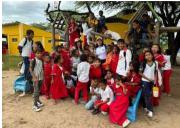
Mi reconocimiento a las organizaciones que entienden la importancia de las alianzas, de no competir sino de sumar.

el beneficio de la población; trabajar por la equidad, igualdad derechos y la no violencia no es un asunto trivial, requiere de varios sectores y actores, es un escenario multicausal, no lineal.