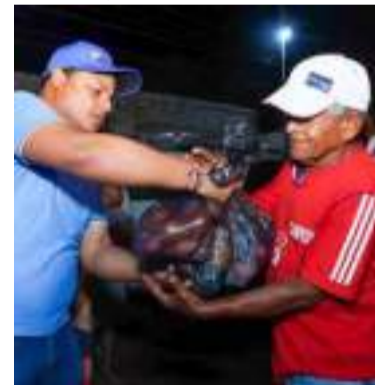
El Alcalde entregó ayudas a habitantes de dos barrios.

Estas acciones buscan aliviar las condiciones de los habitantes afectados por las intensas lluvias y ratificar el compromiso de la Administración con el bienestar de la comunidad. El alcalde expresó su solidaridad con las familias afectadas y destacó el papel de estas intervencio-