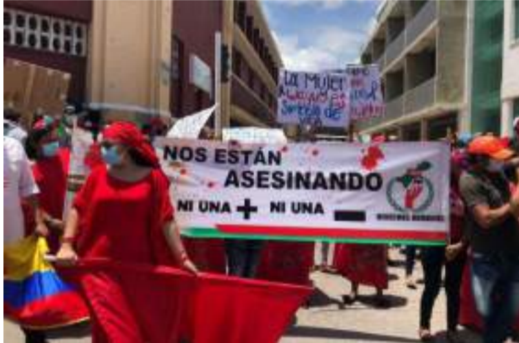
La U busca generar conciencia sobre la importancia de crear entornos libres de discriminación y agresión.

A través de programas académicos, actividades de sensibilización y proyectos sociales, la universidad busca generar conciencia sobre la importancia de crear entornos libres de discriminación y agresión, no solo en el ámbito educativo, sino