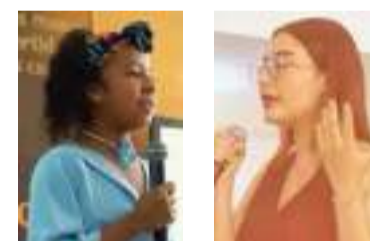
Este tipo de iniciativas resaltan el potencial de la juventud guajira.

Durante la jornada, los jóvenes participantes destacaron por su talento, creatividad e innovación al presentar propuestas inspiradoras que reflejan su compromiso con el futuro de la región. El concurso se convirtió en un