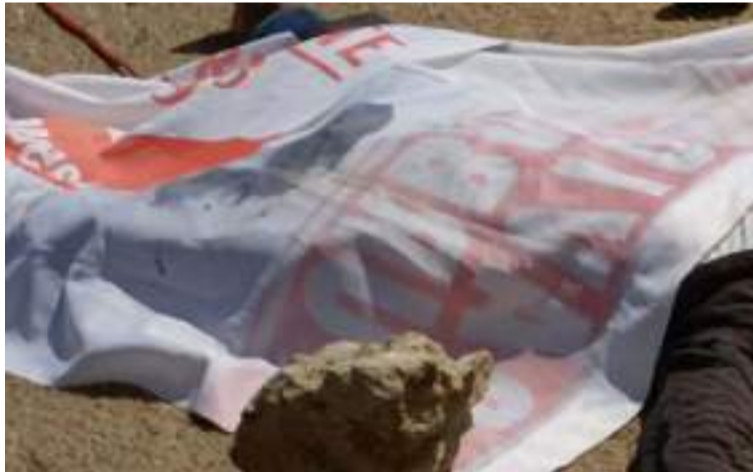
Hasta el sitio del accidente llegaron las autoridades competentes para el procedimiento de rigor.

Algunos testigos trataron de auxiliarlo luego del trágico accidente, pero