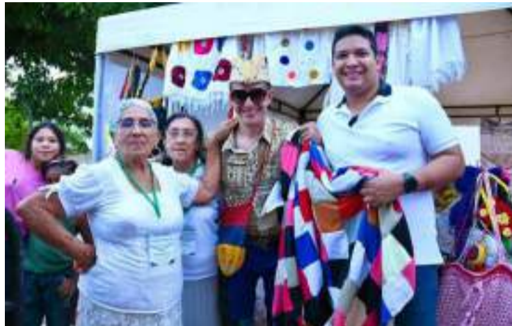
El alcalde, Vicente Berardinelli, reconoció el aporte de los adultos mayores en el desarrollo social del municipio.

"Hoy es un día muy especial para compartir con ustedes y para decirles que son lo más invaluable de nuestro municipio. Ustedes son los emprendedores de quienes hemos aprendido cada uno de los oficios y sus labores",