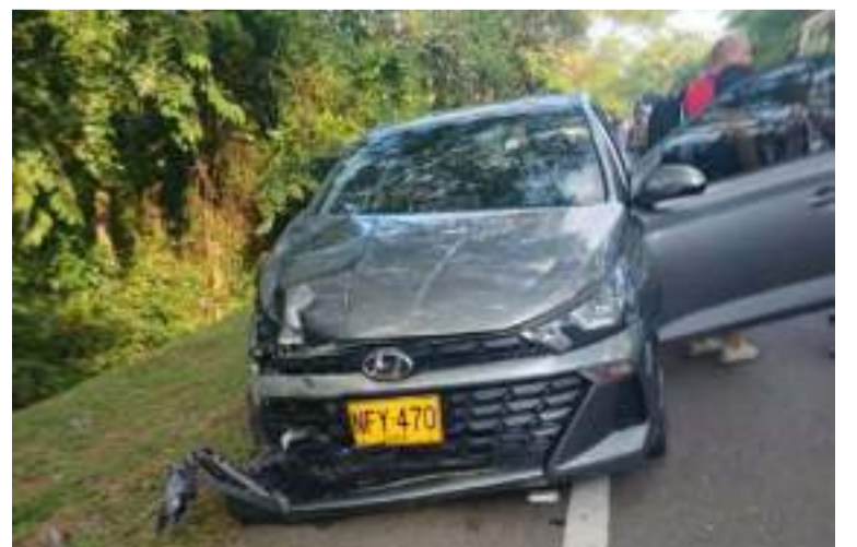
Los heridos son un adulto mayor y una menor de edad que iban en la motocicleta.

Las autoridades de tránsito hacen un llamado a la ciudadanía para conducir con prudencia y hacer usos de las normas al momento de conducir para evitar este tipo de situaciones que ponen en riesgo sus vidas.