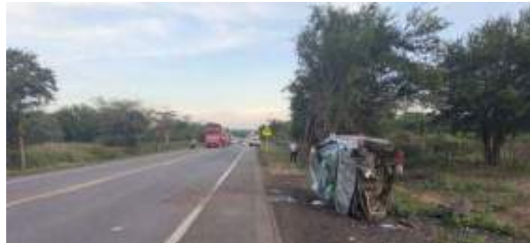
El menor fue auxiliado y trasladado de manera inmediata a un centro asistencial en la capital de La Guajira.

Los uniformados de la Seccional de Tránsito y Transporte (Setra) llegaron hasta el lugar del hecho.