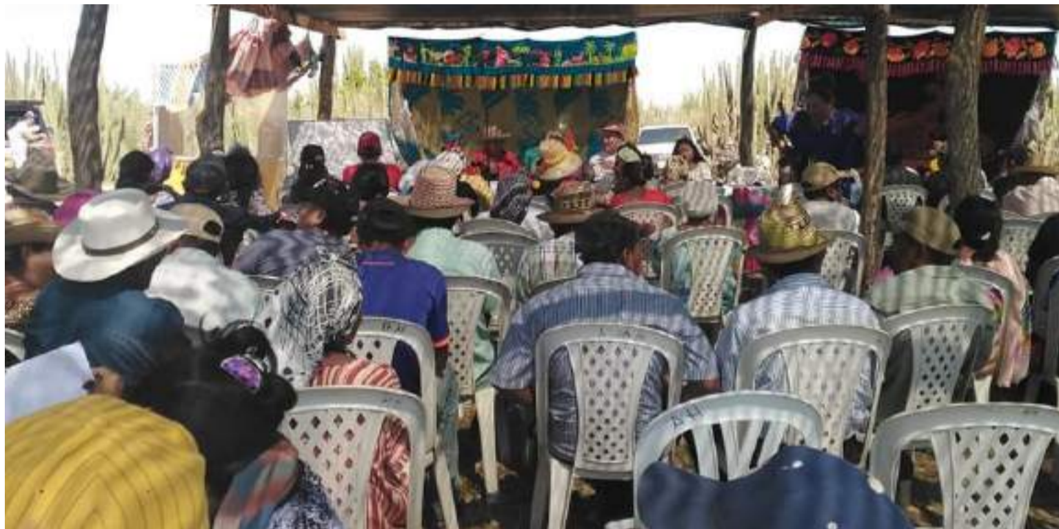
Los proyectos de inversión son de bajo impacto o enfocados a actividades familiares que tienen baja sostenibilidad.

Para la implementación del plan de acción provisional de la Sentencia T-302 de 2017, la Corte Constitucional identificó que la articulación interinstitucional y la transparencia son fundamentales para garantizar el goce efectivo de los derechos. La transparencia requiere de la articulación interinstitucional, la cual se concibe como el proceso mediante el cual, las instituciones se ponen de acuerdo y definen métodos de trabajo, acciones, propósitos, objetivos, metas y recursos. Así mismo, distribuyen roles y funciones para llevar a cabo dichas acciones y lograr los propósitos conjuntamente.