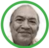
Por Amylkar D. Acosta M