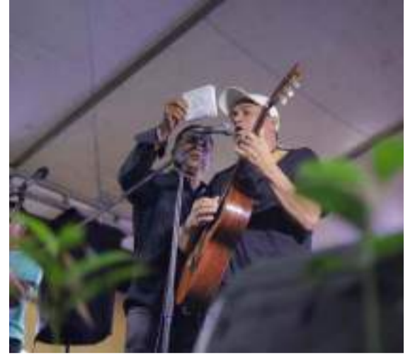
El Festival Cultural y Deportivo busca recuperar el vallenato tradicional a través del plan especial de salvaguardia.

Este año incluyó un componente ambiental