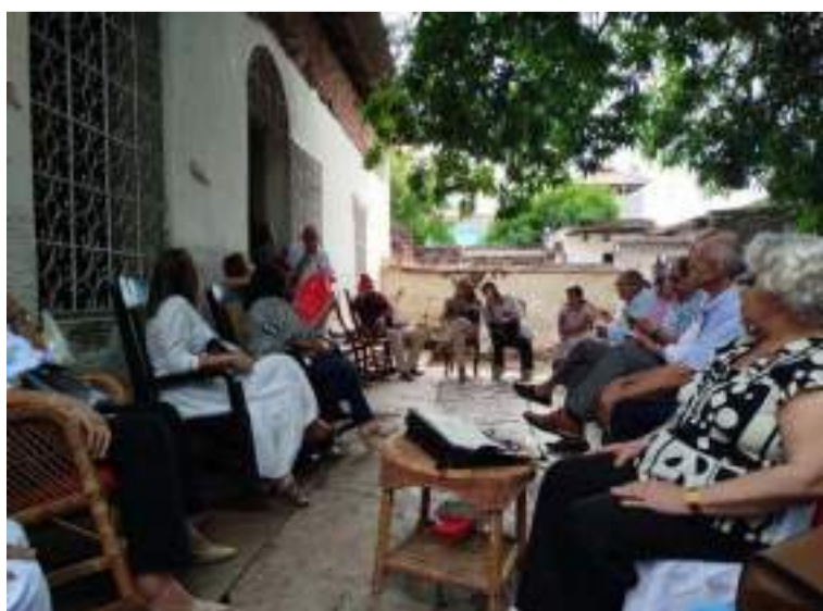
El encuentro se llevó a cabo en la histórica casa del general, ubicada en la calle principal de Villanueva.