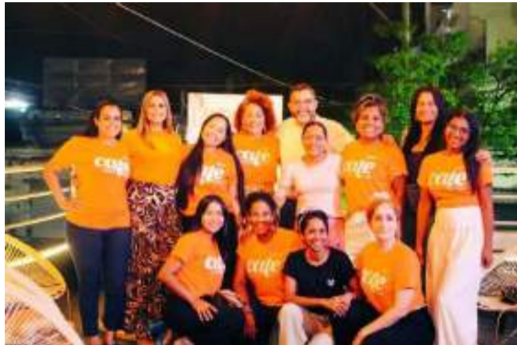
El trabajo por la no violencia requiere los contextos, las cosmovisiones y particularidades de cada cultura.

Es pertinente hacer un reconocimiento a las organizaciones que entienden la importancia de las alianzas, de no competir sino de sumar y priorizar