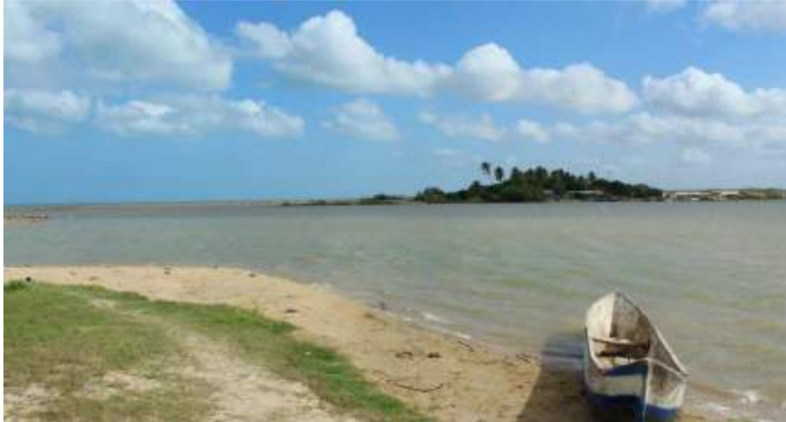
Los dos menores se salvaron gracias a una cava, luego que se volteara el cayuco.

Es de recordar que el reporte de las autoridades de socorro señaló que desde horas de la tarde del domingo fueron re-