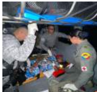
40 pacientes han sido evacuados hasta ahora.

Desde junio, con el inicio de la temporada de ciclones tropicales en el Mar Caribe, la Gobernación de La Guajira ha dispuesto un equipo humano y logístico para cumplir con su misión de salvar vidas. Este periodo trae consigo intensas lluvias que han provocado severas inundaciones. Este año, la ola invernal ha dejado incomunicadas a las comunidades de la Alta Gua-