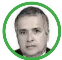
Por Rubén Darío Ceballos Mendoza