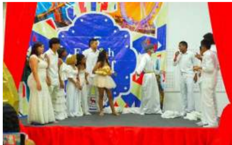
Los estudiantes de esta institución mostraron las habilidades y competencias adquiridas.

Los chicos de esta institución mostraron a través del Rey Mides, las habilidades y competencias adquiridas por los docen-