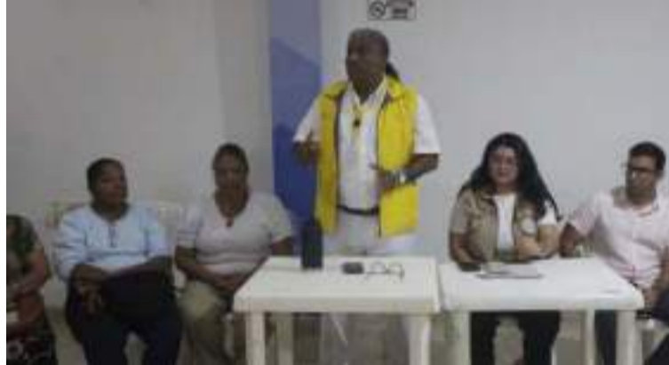
El director aseguró que las víctimas pueden emprender acciones legales si lo consideran necesario.