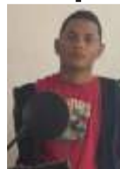
Esta persona está señalada de haberse hurtado una moto.

De inmediato, el cuadrante en servicio activó el plan c a n d a d o en la zona, logrando identificar al sospechoso en el sector conocido como la Avenida El Ramal. Este individuo, que se movilizaba a alta velocidad en la motocicleta reportada, hizo caso omiso a las señales de alto emitidas por los uniformados.