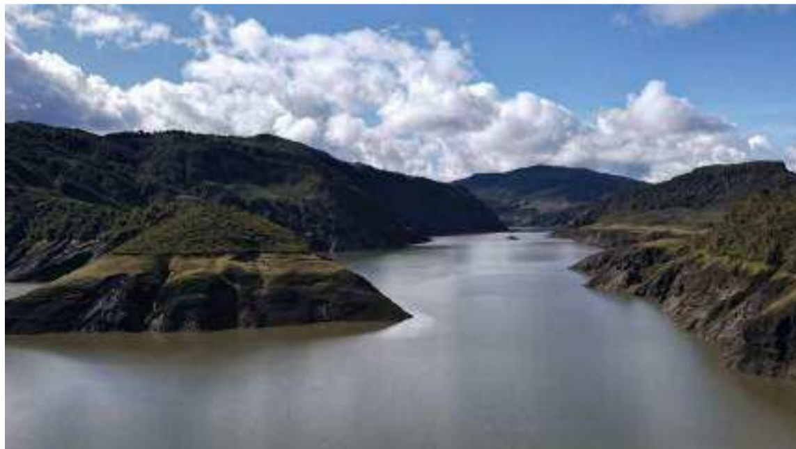
El cambio ha facilitado la desactivación de las medidas implementadas desde octubre.

La decisión, formalizada mediante la Resolución Creg 101-063 de 2024, se basa en un aumento en los niveles de embalses, que han superado las expectativas establecidas; según la Creg, el operador