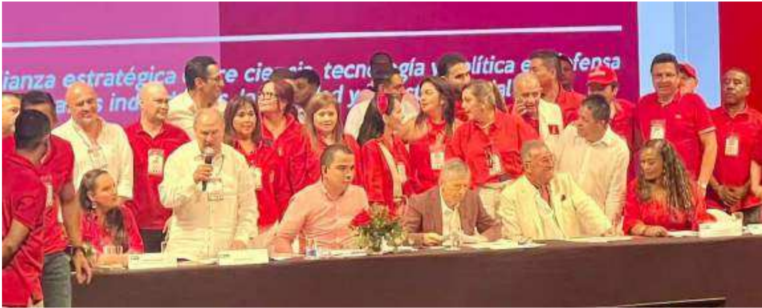
Los partidos políticos operan como empresas mercantiles. Carecen de escuela para formación de liderazgo.