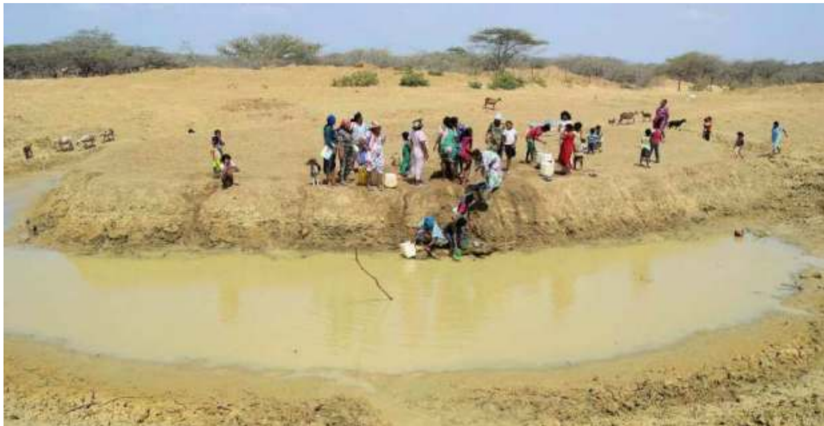
La Sala concluye que el Plan Provisional de Acción se ajusta a los parámetros formales exigidos por el Auto 696 de 2022.

La Corte Constitucional dejó claro que en La Guajira sigue el Estado de Cosas Inconstitucional, y que tampoco se ha superado el índice de goce efectivos de derechos de las niñas y niños wayuú, de acuerdo con la sala especial de seguimiento a la Sentencia T 302 de 2017 a lo ordenado en los autos 696 de 2022, 1290 de 2023 y 311 de 2024.