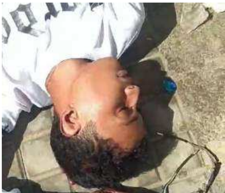
Los jóvenes fueron auxiliados por ambulancias que los trasladaron a un centro médico.