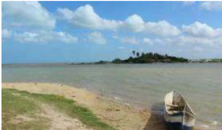
Los menores salieron a pescar en la mañana del domingo al sector conocido como la Boca de Camarones.

Según lo informado por los familiares a las autoridades, los dos jóvenes salieron en horas de la mañana de este domingo al sector conocido como la Boca de