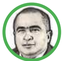
Por Arcesio Romero