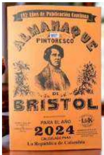
Almanaque pintoresco de Bristol.

Por obra y gracia del altísimo nos anuncia el Almanaque pintoresco de Bristol que está por concluir el mes de diciembre y que nos abraza ya el olor a Navidad y con la cercanía de esa fiesta grande que este año tendrá la gracia que además de recordar el nacimiento del Niño Dios también nos estremecerá a todos de alegría la resurrección del Festival más dulce del país, el 'Festival del Dulce de Leche' durante los días 13, 14, y 15 de diciembre en Monguí, el pueblo donde enterraron mi ombligo a la pata del palo de tamarindo que el tornado se llevó.