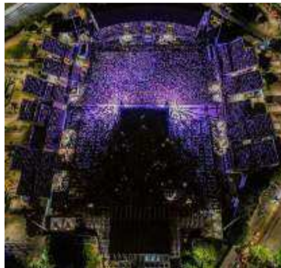
El Estadio Romelio Martínez de Barranquilla vibró y estuvo lleno a reventar.

La feria promete ser un espacio enriquecedor para reflexionar sobre los retos y oportunidades en la intervención social en un mundo cada vez más diverso. Para más información, los interesados pueden contactar a la Universidad de La Guajira.