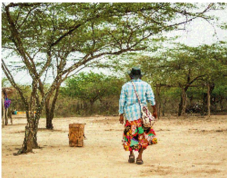
Fue declarado el cumplimiento medio de lo ordenado en los Autos 696 de 2022 y 1290 de 2023.

Acción que permita el goce efectivo los derechos fundamentales de los menores de edad protegidos por la Sentencia T-302 de 2017 y garantice la existencia de un diálogo genuino con las autoridades legítimas del pueblo wayuú.