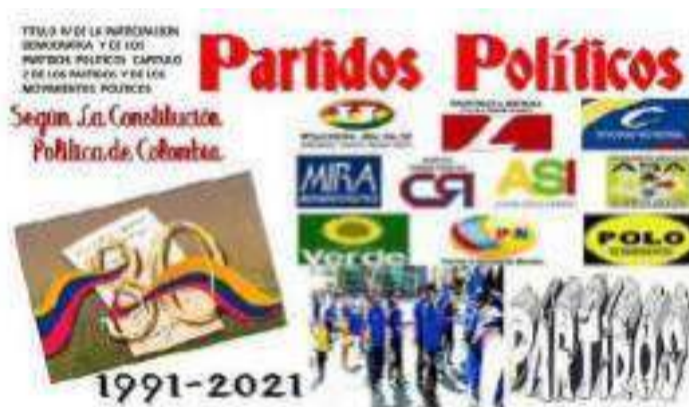
Los partidos políticos, deben crearse como estamentos de servicio a la humanidad.

Por Martín Nicolás Barros Choles marbacho@hotmail.com