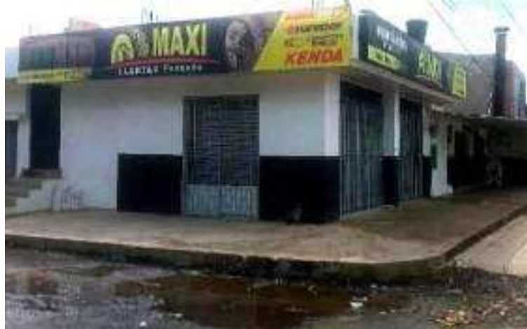
Los antisociales le exigieron el dinero, pero el hombre se negó y estos le dispararon en frente de su hijo.

Al notar lo sucedido, vecinos del sector auxiliaron al comerciante y lo llevaron de manera inmediata a la urgencia de la E.S.E Hospital San Agustín, donde fue atendido de manera oportuna por lo médicos de turno, pero debió ser remitido a un