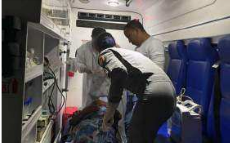
La mujer fue atendida por personal médico militar y rescatistas del Comando Aéreo de Combate No 3.