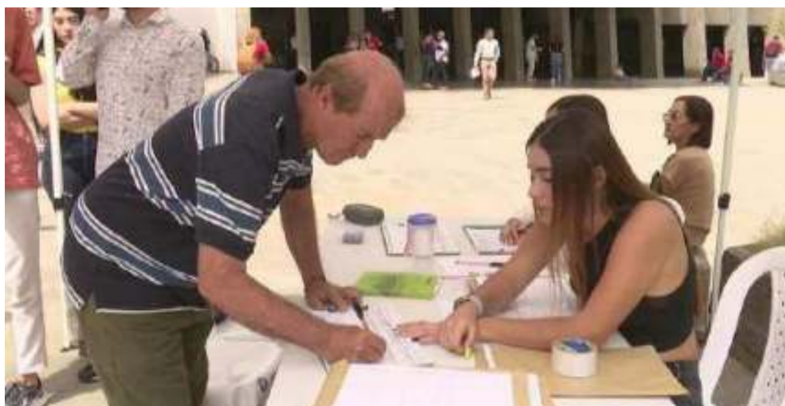
Se viene promoviendo un referendo por la Autonomía Fiscal Regional.