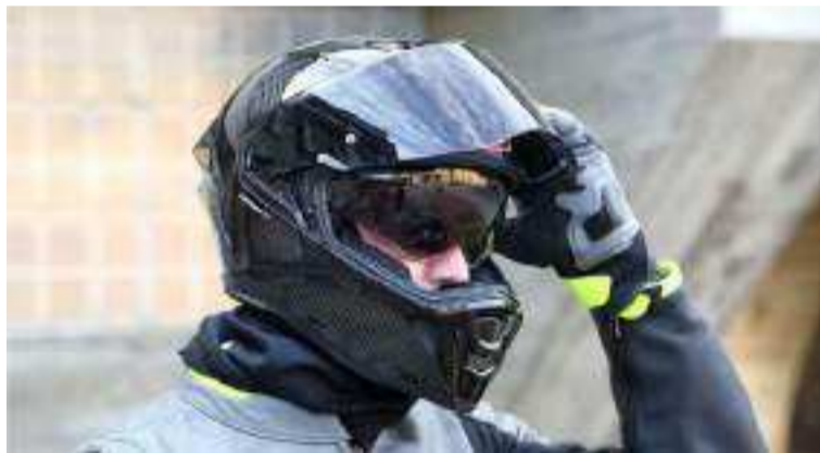
La petición es con el fin de evitar confundirlos con maleantes que se camuflan para cometer sus fechorías.

Dos hombres en motos intimidaron a un joven con arma de fuego y le robaron sus pertenencias.