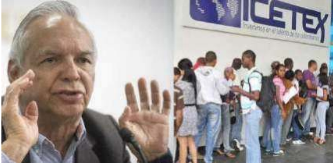
La deuda asciende a $402.000 millones, correspondientes a la actual vigencia.

La Presidencia también se pronunció, reiterando que los giros serán efectuados en los próximos meses. Estas declaraciones coinciden con las del ministro de Educa-