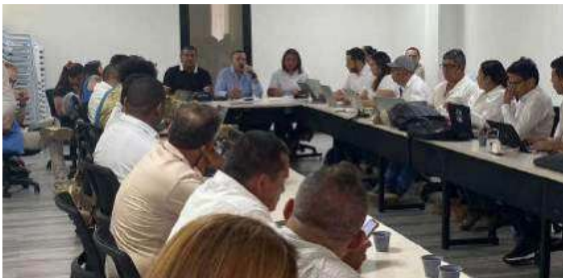
Se pactaron compromisos importantes sobre vivienda, acceso a tierras y seguridad.