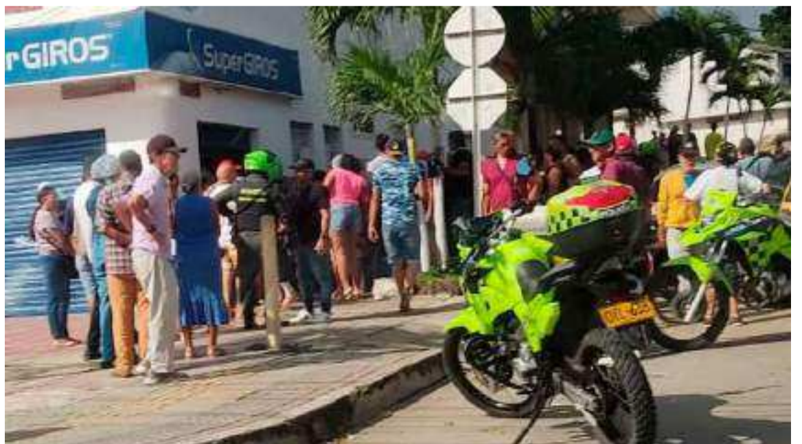
En Sincelejo, las sedes de Supergiros en las zonas norte y sur han cerrado sus puertas.

En la ciudad de Sincelejo, las sedes de Supergiros en las zonas norte y sur han cerrado sus puertas entre la noche del viernes y el mediodía del sábado debido a estas amenazas.