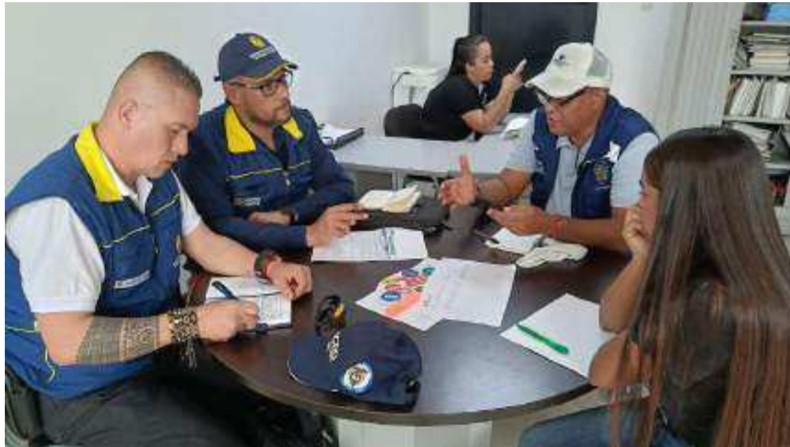
Se han entregado ayudas humanitarias gracias al apoyo de la Gobernación.

Agregó que actualmente se encuentran afectadas todas las veredas como la de Pénjamo, El Mamey, Los Rosales, Casa Aluminio, El Limonal, además de las aledañas a los