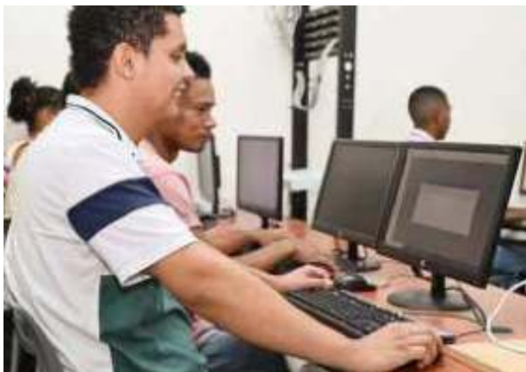
La elección busca fortalecer la articulación entre actores de ciencia, tecnología e innovación del Departamento.