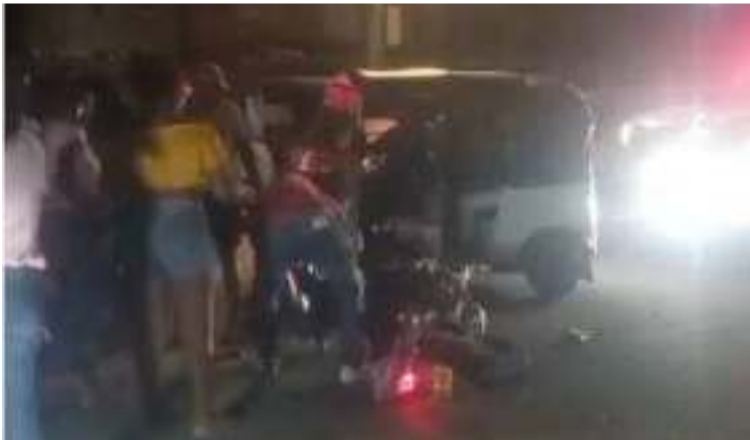
Los dos hombres resultaron heridos al parecer por exceso de velocidad de uno de los vehículos.

El percance vial se registró la noche del sábado 23 de noviembre en la calle 16, cerca a la Terminal de Transportes de Maicao, en la Troncal del Caribe, donde la motocicleta impactó con el automóvil.