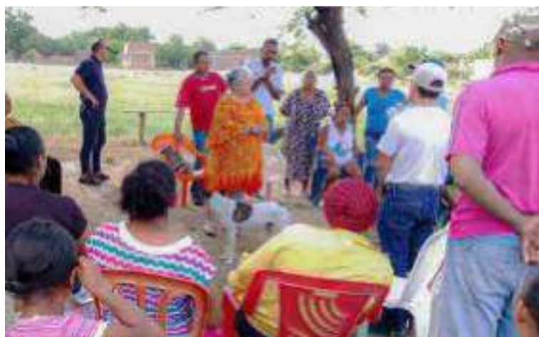
La senadora aseguró que la falta de acción por parte de las autoridades ha agravado el conflicto social en la región.