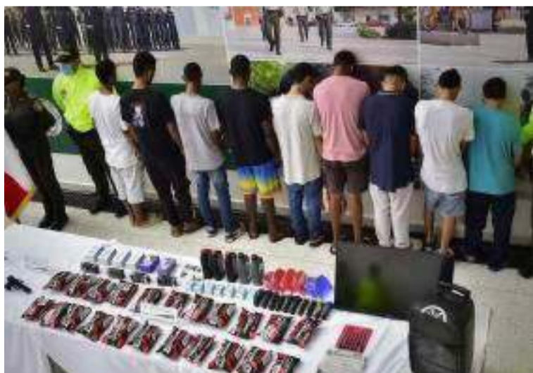
Los capturados estarían involucrados en diversos atracos por la carrera cuarta en Valledupar.

En la capital del Cesar, fueron detenidas 9 personas, vinculadas a la banda delincuencial conocida como 'El Combo de Villa', dedicados al hurto en todas sus modalidades.