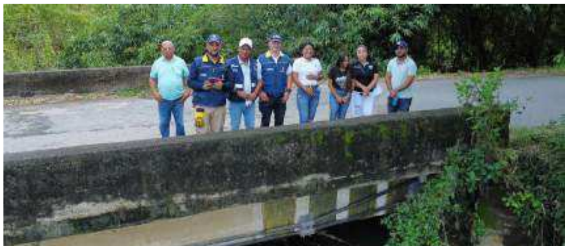
Las evaluaciones se concentran en los municipios de Manaure, Riohacha y Dibulla, así como en el corregimiento de Palomino.