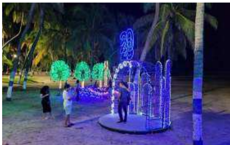
En Navidad la luna se ve más grande, acompañada de ese lucero guía que nunca se separa de ella.