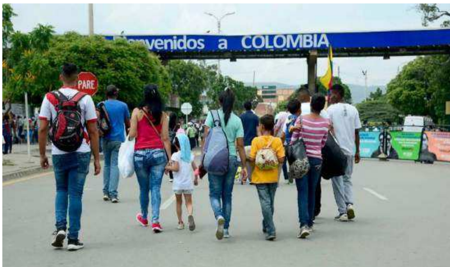
La decisión surge tras una tutela presentada por una pareja venezolana que denunció la vulneración de sus derechos.

Del mismo modo, el alto tribunal también le ordena al “Ministerio de Relaciones Exteriores publicar un documento de ruta claro para que los migrantes venezolanos en estado de solicitud de condición de refugiado conozcan la información detallada sobre cómo puede acceder a un tipo de visa que le permita trabajar legalmente en el país, mientras se resuelve su solicitud de refugio y/o PPT”, se lee en la sentencia de la Corte.