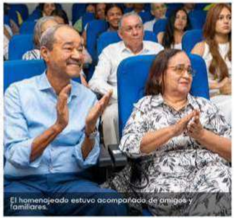
El homenajeado estuvo acompañado de amigos y familiares.

Conviene anotar que su visión innovadora, sentido de pertenencia y compromiso con el progreso y la sostenibilidad de la Universidad de La Guajira, sigue marcando una huella imborrable en la comunidad académica, en las nuevas generaciones y consolida un legado de progreso y bienestar que merece ser reconocido con tan alta distinción.