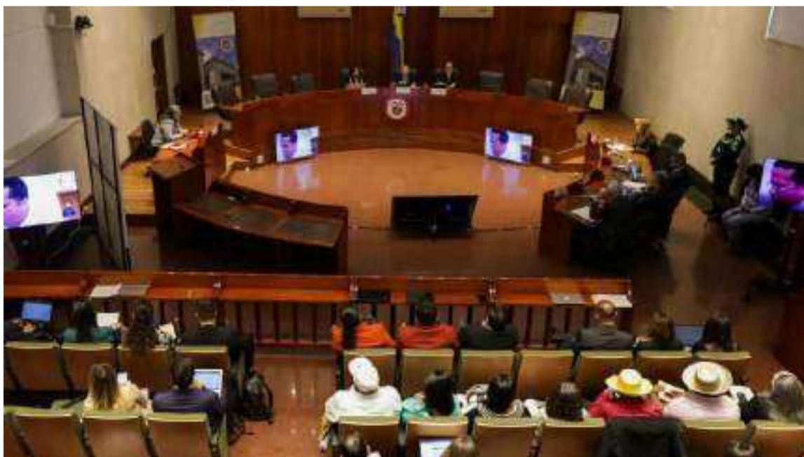
El Plan como medida provisional, se valora como un documento de planeación.

Finalmente, la Sala les recordará a las entidades obligadas al cumplimiento de la sentencia y esta providencia, de conformidad con lo anunciado en el Auto 480 de 2023, la necesidad de reportar los resultados de sus acciones con base en Iged, asimismo, que la falta al deber de información podrá generar la imposición de las medidas coercitivas desarrolladas en dicha providencia.