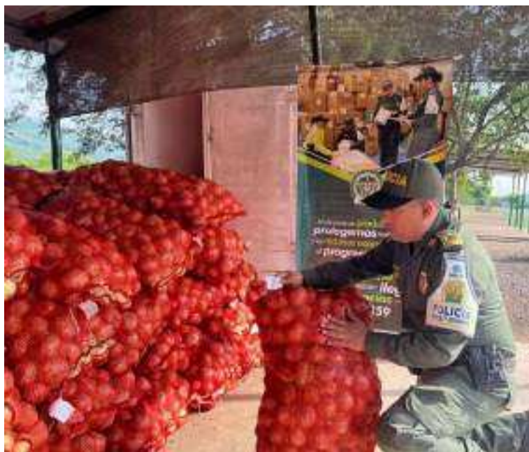
Los alimentos perecederos apprehendidos están valorados comercialmente en $67.681.590.

En el marco de las acciones para combatir el contrabando y el comercio ilícito en el territorio nacional, la Policía Fiscal y Aduanera (Polfa) de la Dirección de Impuestos y Aduanas Nacionales, realizó un importante operativo que resultó en la aprehensión de 13.460 kilos de cebolla procedente del extranjero.