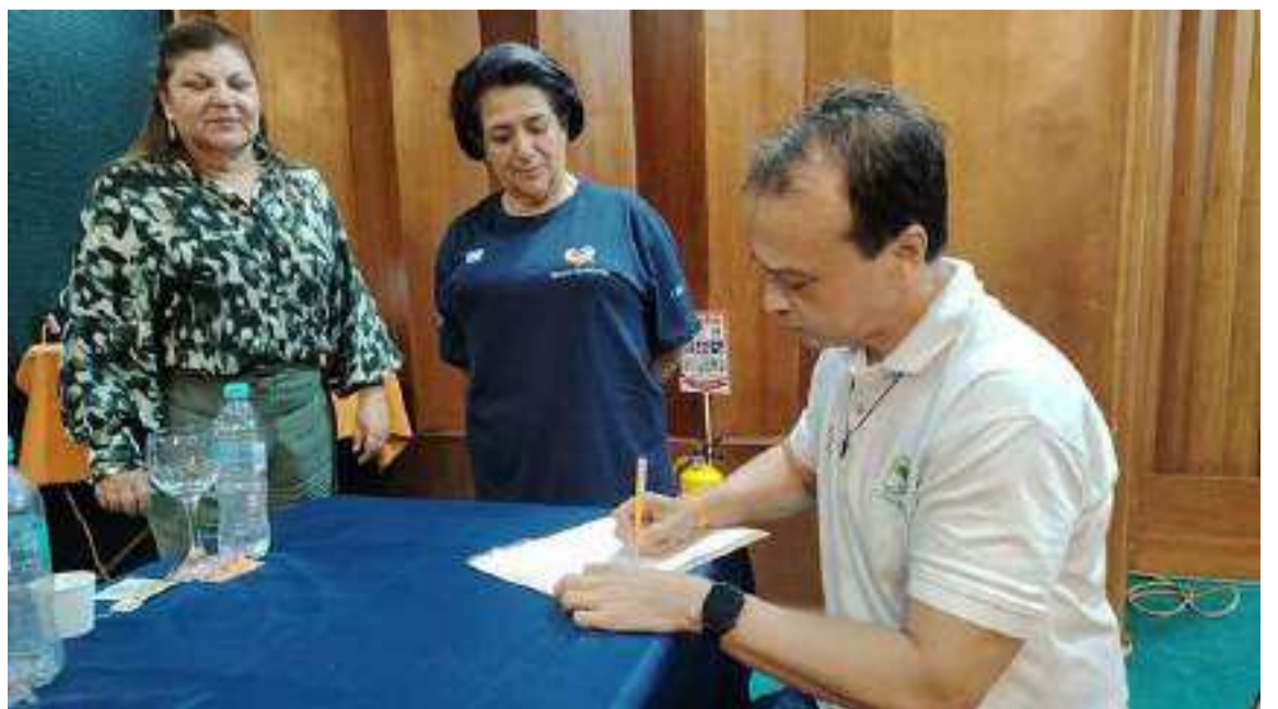
El acto se cumplió en el Archipiélago de San Andrés y Providencia.

Hacen parte de este importante proyecto Belice, Colombia, Costa Rica, El Salvador, Guatemala, Honduras, México, Nicaragua, Panamá y República Dominicana.