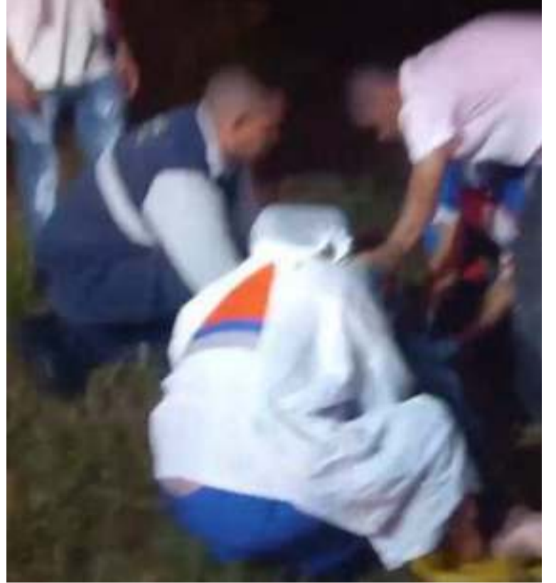
El incidente tuvo lugar en la vía que va de Riohacha hacia la sede principal de la Universidad de La Guajira.