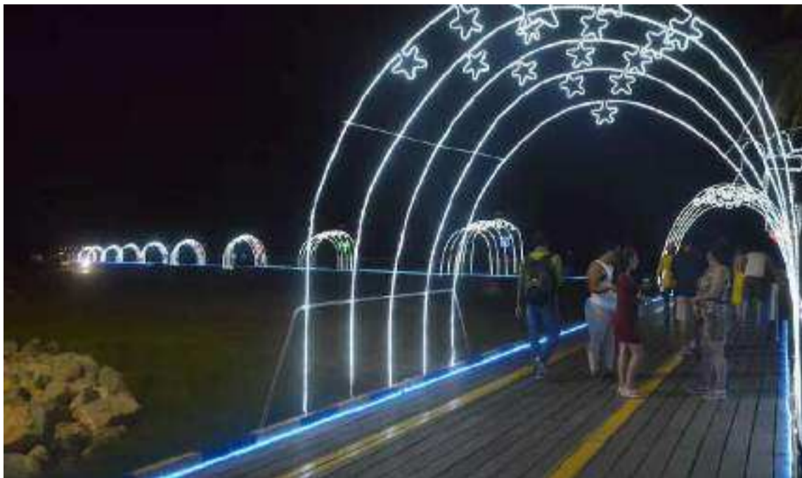
En las navidades de ahora todo es light, ya nada sabe a pueblo.