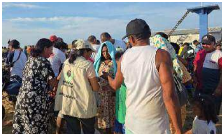
En el marco de esta respuesta, se prioriza la protección integral de los derechos de niñas, niños y adolescentes.

El Instituto Colombiano de Bienestar Familiar (Icbf) avanza con la entrega de ayudas humanitarias en zonas de difícil acceso durante la alerta por lluvias.