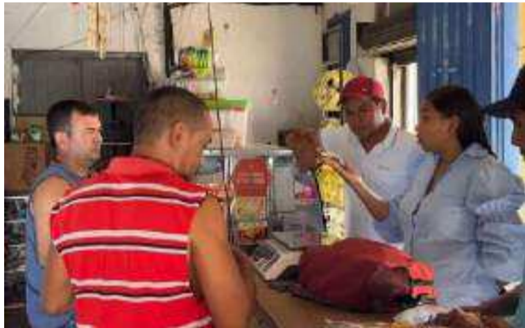
La unión de esfuerzos entre las autoridades y la comunidad será crucial para erradicar el abigeato.