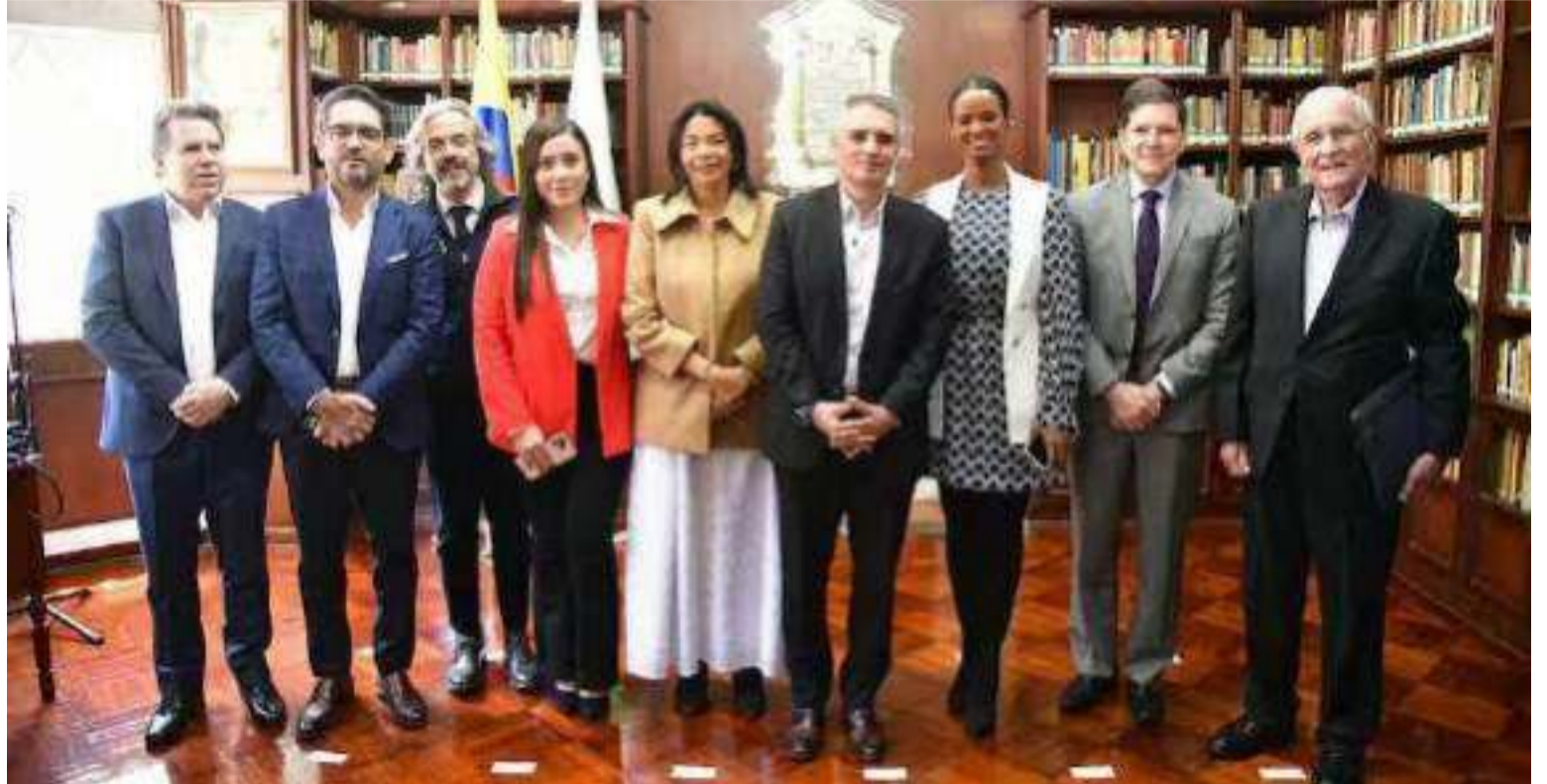
El departamento de Antioquia lidera una iniciativa del referendo por la autonomía fiscal regional.

Por su parte, el artículo 2 del Proyecto de Acto Legislativo modifica el artículo 357 de la Cons-