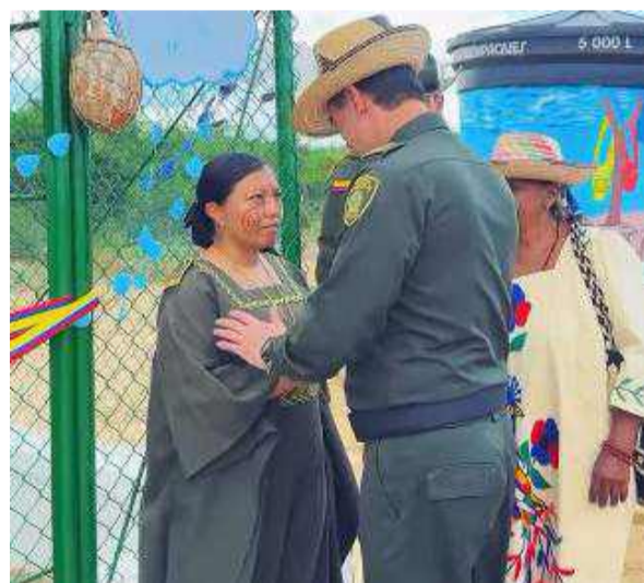
El general Salamanca agradeció a las autoridades ancestrales y a la comunidad por sus expresiones de cariño.

La Policía Nacional construyó un pozo de agua para las comunidades indígenas en la Alta Guajira, con el apoyo de la Alcaldía de Maicao y el Comando Sur de Estados Unidos.