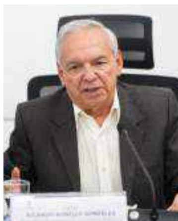
Ricardo Bonilla, Ministro de Hacienda.

Desde agosto pasado la Universidad Nacional de Colombia viene adelantando el proceso de formulación, legitimación y aprobación de su Plan Global de Desarrollo (PGD) 2025-2027, después de todos los sucesos acontecidos entre mayo y julio de los corrientes relacionados con la designación del rector. Su sistema de planeación se está homologado con el que rige para el nivel nacional y territorial contenido en la Ley 152 de 1994.