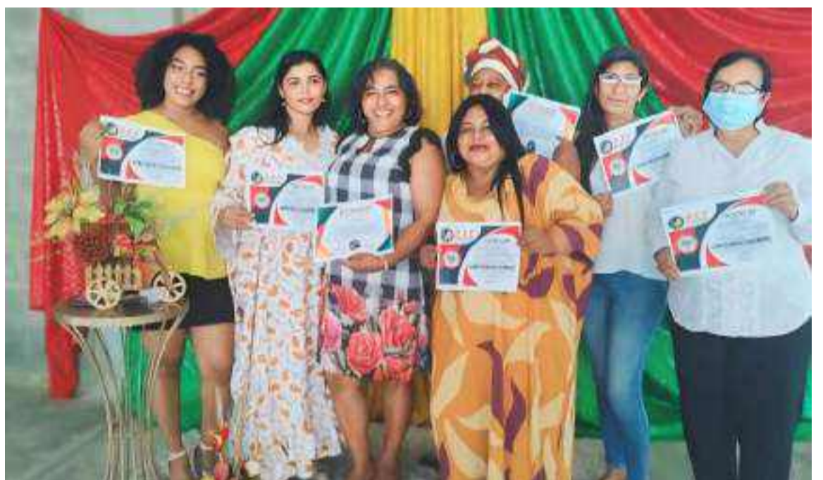
La docencia en zona rural es ejercida mayoritariamente por mujeres.