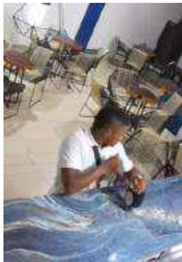
Gracias a las imágenes, los delincuentes ya han sido identificados por las autoridades.

En el intento por evadir a las autoridades, los sujetos dispararon contra los agentes, impactando a uno de ellos en el chaleco antibalas. A pesar de la rápida acción policial, los sujetos lograron escapar en dirección a la antigua pista de Maicao.