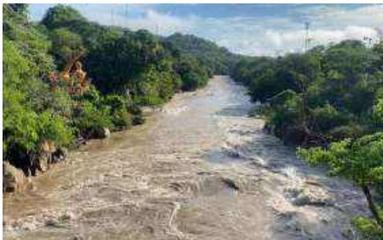
La Administración Municipal informó que estas precipitaciones han provocado deslizamientos y bloqueos de vías.

Por otro lado, las autoridades realizarán visitas técnicas en las zonas en riesgo en conjunto con la Policía Metropolitana y la Defensoría del Pueblo, con el fin de monitorear las áreas más vulnerables y reforzar la prevención de incidentes.