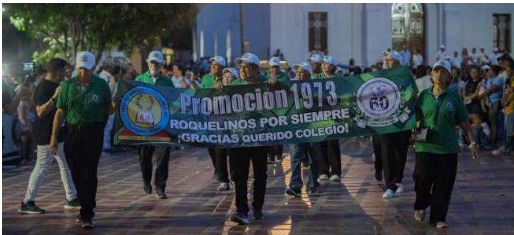
Me impactó cómo en el desfile del día 8 de noviembre, el pueblo se volcó a las calles a vitorear eufórico el paso de los marchantes.

El pueblo sentía que sus hijos alcanzaban el pináculo del saber