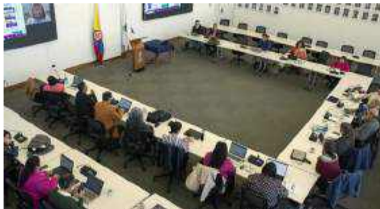
Se crea una nueva fuente de financiación para el Plan de Inversiones del PGD UN 2025-2027.