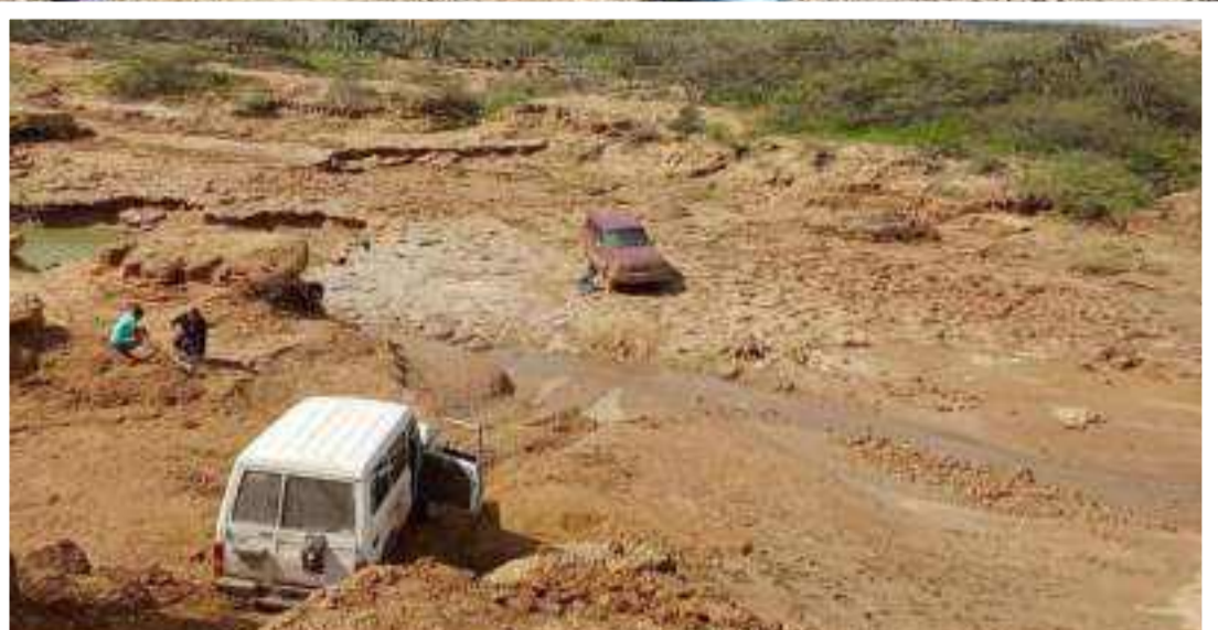
Fuertes lluvias e inundaciones vienen azotando a La Guajira, ocasionando que centenas de familias se encuentren hoy damnificadas.

“Las comunidades afectadas por las inundaciones en La Guajira necesitan con urgencia toldillos, alimentos no perecederos, repelentes, ropa seca, agua potable suficiente y albergues temporales. Pedimos al Gobierno local y autoridades nacionales asistencia urgente a la población”, dijo la Defensoría a través de su cuenta en la red social X.