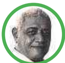
Por Alberto Palmarrosa Inciarte