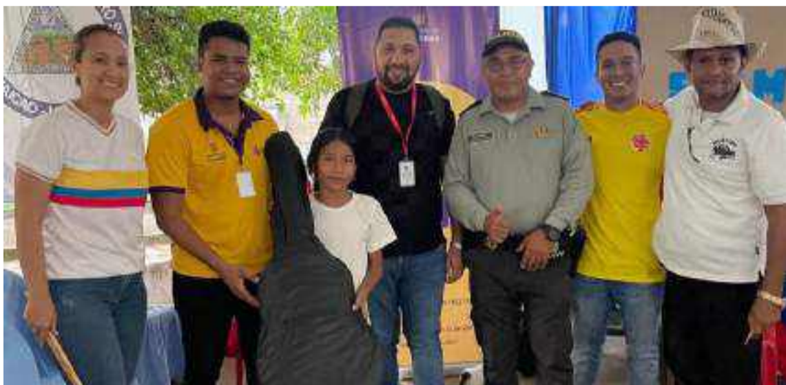
Para transformar las vidas de niños, niñas y adolescentes mediante las artes y la música.

En el marco del cierre del programa se realizó esta entrega en la institución educativa.