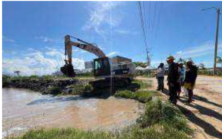
Las acciones han permitido mejorar el cauce del río hacia su desembocadura y reducir las inundaciones.

Para estas actividades, los batallones han dispuesto más de 30 hombres que apoyan con mano de obra, herramientas y equipos durante las