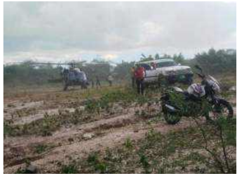
La Fuerza Aérea logró rescatar desde Nazareth a una migrante por síntomas de aborto y a un niño con neumonía.