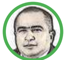
Por Arcesio Romero