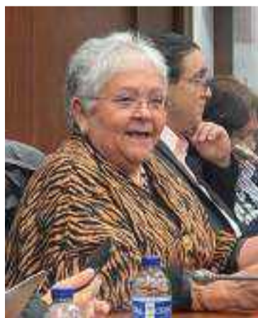
Senadora oriunda del Cesar, Imelda Daza Cotes.