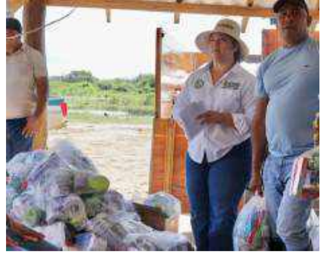
Desde la Administración departamental continúan el compromiso de cumplirle la palabra a los guajiros.