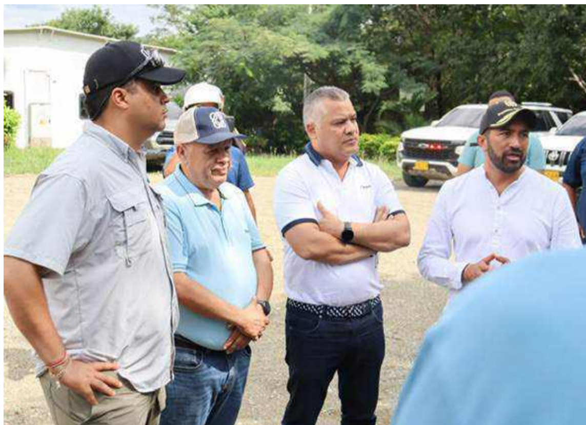
Aguilar dijo que se debe terminar con tantos años de desidia del Estado.

Agregó, que es urgente poner en marcha los Dis-