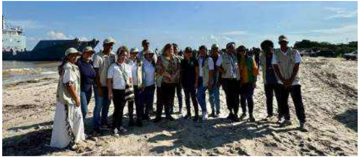
El Instituto de Bienestar Familiar coordina la atención de las cerca de 180 mil familias afectadas que viven en La Guajira.