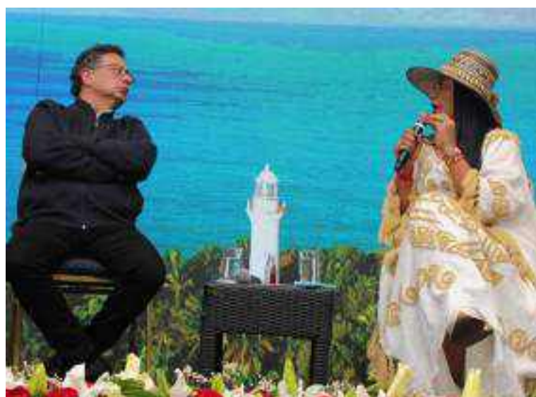
El partido Mais le dice sí a la unidad y sí a seguir construyendo un frente amplio.

Bajo el liderazgo de la senadora Martha Peralta Epieyu, el Movimiento Alternativo Indígena y Social (Mais) realizó con éxito su IV Convención Nacional para ratificar su respaldo al Gobierno del presidente Gustavo Petro y tomar decisiones de cara a lo que serán las elecciones presidenciales del 2026.