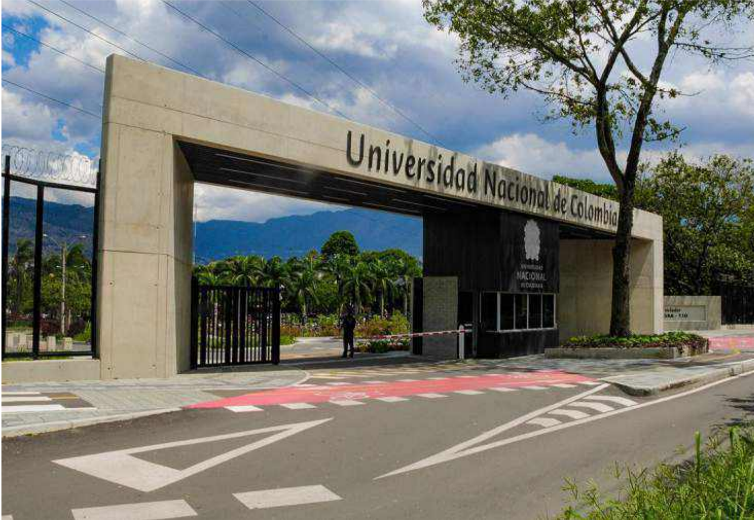
La Universidad Nacional de Colombia viene adelantando el proceso de formulación y aprobación de su PGD.