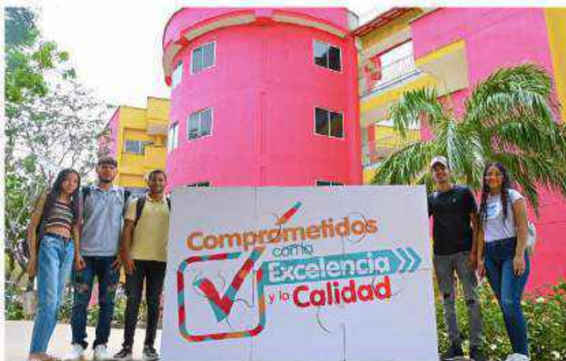
El proceso de Acreditación Institucional, generó en Uniguajira una movilización y participación activa de todos los estamentos universitarios e incluso, el sector externo.

Finalmente, este logro debe irradiar a todas las instituciones del sector público de La Guajira, para emprender este mismo camino de las buenas prácticas de gestión, viendo en la academia el brazo académico, instrumento asesor y mentor de sus proyectos de desarrollo e intervención social, con lo cual, no solo aportan bienes materiales, sino también, píldoras de credibilidad, amor y sentido de pertenencia por su institución.