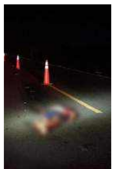
El cuerpo se encontraba tendido en la vía.

Según una fuente oficial, el cuerpo se encontra-