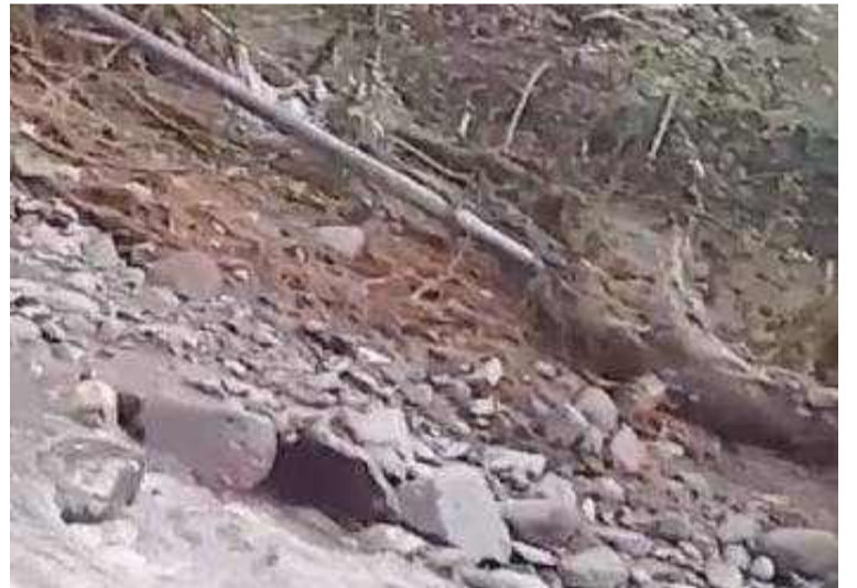
Concejal pidió a las autoridades competentes tomar medidas inmediatas para restablecer suministro de agua.