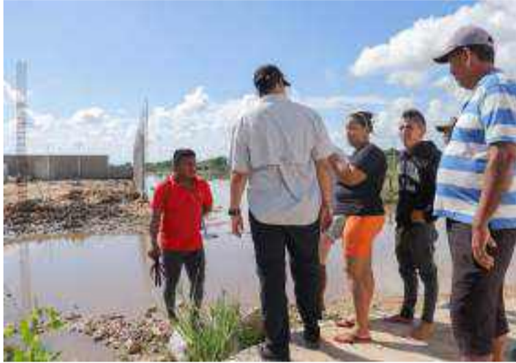
Pese a que el país lleva más de 730 días en situación de desastre, siguen sin corregirse las malas prácticas.

Este llamado del ministerio público se da por las falencias en la definición y ejecución de medidas para prevenir la aparición de nuevos riesgos