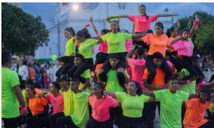
Es de interés destacar a Villanueva como una gran galería, de la más fina colección artística regional.

Se puede decir que con su arte musical, todo Colombia, Latinoamérica y parte del mundo ha sido invadida por los villanueveros; una invasión agradable, rítmica y contagiosa. Allí, en Villanueva vivió con sus hijos el más conocido, universal y versátil, Emiliano Zuleta Salas, el compositor del paseo e himno vallenato 'La gota fría', quien procede de una dinastía musical, y padre de los Hermanos Zuletas, prolongación de la dinastía, cuyos primeros pasos y retozos lo dieron en la grata Villanueva, en una casa inmensa donde solo cabían ellos, sus versos y sus arpegios. Los Romero, músicos y poetas consagrados, con el acordeonista insigne Israel Romero, sus hermanos y sobrinos con el conjunto musical 'El Binomio de Oro'; el poeta lírico de Villanueva, Rosendo Rome-