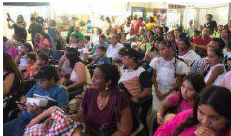
Los asistentes a Expoguajira 2024, también disfrutaron de actividades culturales, muestras gastronómicas locales y jornadas con temáticas de salud y tecnología.