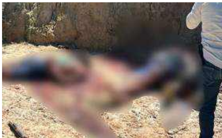
Los cadáveres se encuentran en la morgue de Santa Marta a la espera de ser entregados a sus familiares.

La comunidad ha expresado su preocupación por el aumento de la violencia entre grupos armados en la zona.