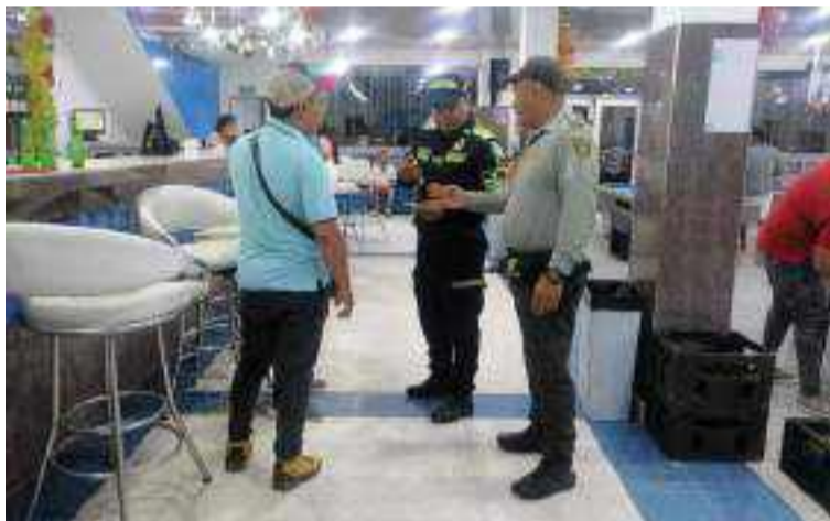
La Policía adelantó planes de vigilancia y control orientados a mejorar la seguridad y convivencia en Maicao.

La Seccional de Protección y Servicios Especiales de La Guajira, a través de sus Grupos de Protección al Turismo y Patrimonio Nacional y Protección a la Infancia y Adolescencia, implementaron planes de vigilancia y control orientados a mejorar la seguridad y convivencia ciudadana en lugares de esparcimiento como ba-