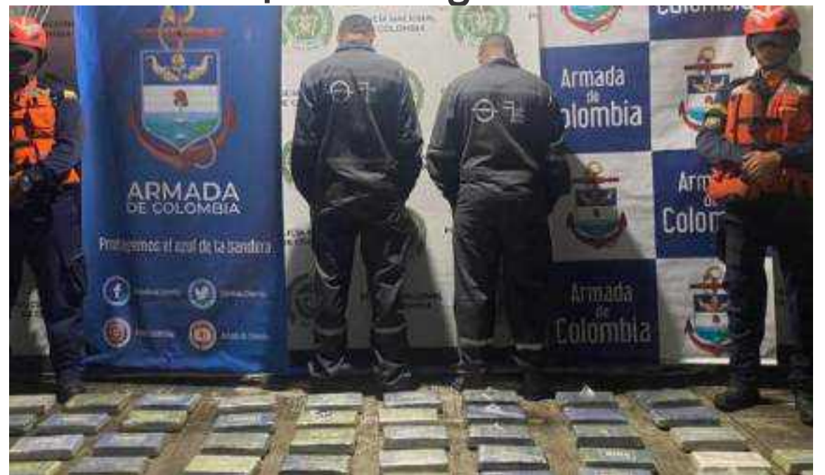
Los 47 paquetes de coca se encontraban ocultos en la proa.

Al llegar a puerto, personal de la Armada, con apoyo de caninos antinarcóticos, inspeccionó el buque y halló 47 paquetes de coca que se encontraban ocultos en la proa. Se capturó a dos colombianos no pertenecientes a la tripulación, quienes portaban GPS y un teléfono satelital.