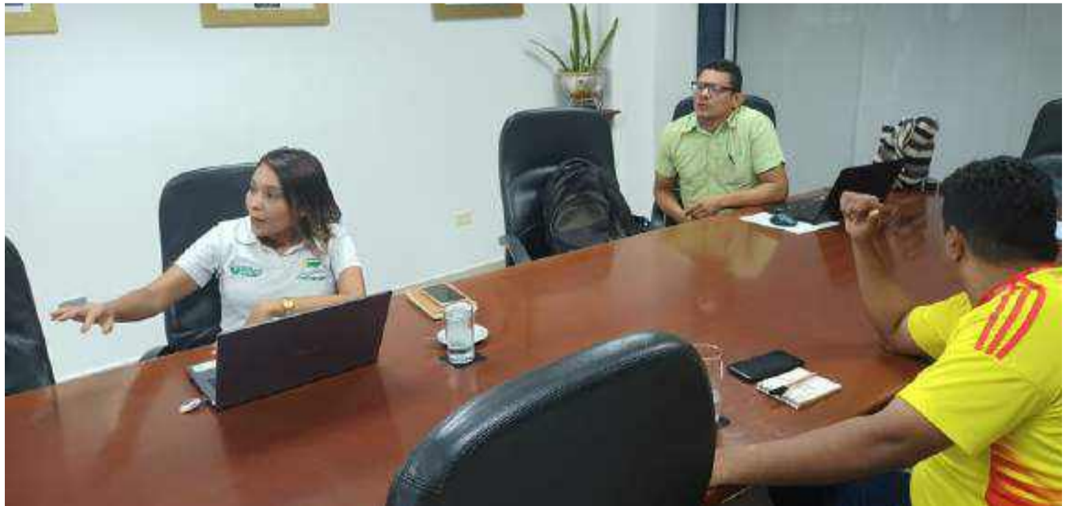
Esta iniciativa refuerza el compromiso de los municipios con la sostenibilidad ambiental.

recordó a las administraciones locales su responsabilidad en el reporte oportuno de los indicadores correspondientes