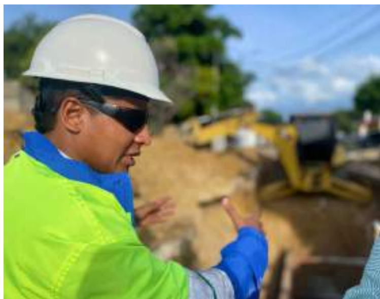
Estas acciones se realizan como medidas temporales ante el daño detectado en el colector principal.

Aqualia reitera a la ciudadanía la importancia de cuidar el sistema evitando el vertimiento de grasas, residuos sólidos y lodos desde los hogares y establecimientos comerciales como restaurantes, estaciones de servicio y lavaderos de vehículos.