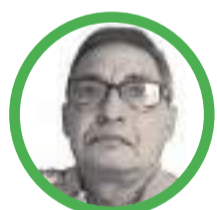
Por José Aragón Jiménez

Llegar a los 50 años de casados es una ocasión especial y única a la que todas las parejas aspiran. Son un momento irrepetible en la vida matrimonial.