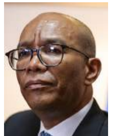
Gerson Chaverra, presidente de la CSJ.

Igualmente, la Corte Suprema de Justicia solicitó al ELN el levantamiento de las acciones violentas y el cese del bloqueo territorial, para que sea posible el ingreso de la ayuda humanitaria a los colombianos y colombianas que habitan en este territorio y necesitan atención urgente.