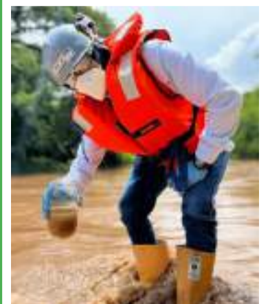
La red de monitoreo incluye puntos de observación.

Además, la empresa ha implementado una red de canales que facilita la separación entre el agua que fluye a través de la mina y aquella que atraviesa áreas no intervenidas. Este sistema garantiza que el agua que ingresa a los cuerpos naturales no haya tenido contacto con áreas de explotación minera, evitando así vertimientos sin tratamiento y protegiendo la calidad de los recursos hídricos de la región.