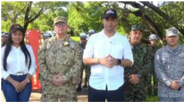
El gobernador reiteró la importancia de continuar con la solidaridad y el apoyo en materia de alimentos.

esfuerzo logístico para garantizar seguridad alimentaria en la Alta Guajira," explicó el gobernador, quien resaltó que el Fondo de Seguridad Alimentaria y Nutricional del Departamento, administrado y operado por el PMA, ha sido esencial para la movilización de esta ayuda humanitaria.