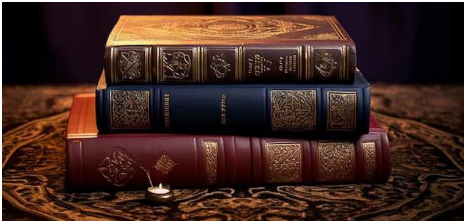
El judaísmo, el cristianismo y el islam son instituciones ancladas en la infalibilidad de la palabra de Dios revelada.

La reflexión de este historiador moderno hace referencia a que, en ocasiones, la autocorrección no opera en ciertos académicos muy conservadores y con mucho poder; al verse amenazados en sus creencias, pueden recurrir al autoritarismo y perjudicar enormemente a quienes los desafían mediante ataques personales o ad hominem. Sin