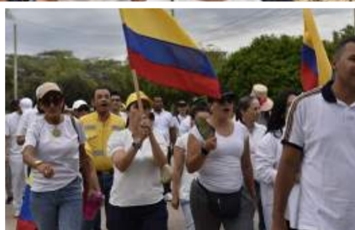
Cerrejón ha sido el mejor aliado para la generación de empleos y el jalonador de la economía guajira.