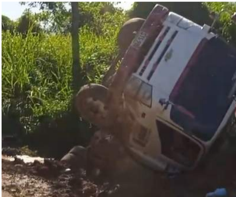
Algunas personas le prestaron colaboración a quienes iban en el pesado vehículo.

Se pudo conocer por algunos conductores que las personas que se movilizaban en el camión de carga resultaron ilesas, sin embargo, hubo daños materiales y parte de la mercancía se dañó al caer a un costado de la vía en