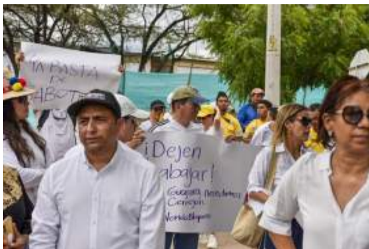
Cerrejón lamentablemente debe enfrentarse a unas asociaciones chupasangre.

La pluma dorada en esta ocasión, plasma la página en blanco con la tinta fina de su pensamiento, inspirada en la situación crítica por la que sigue estando La Guajira en distintas materias, políticas, sociales, humanitarias, culturales, educativas, salud, económicas, en fin, en sus inicios la América de indias, la que un día se encontró con Cristóbal Colón en uno de sus viajes de exploración, quien ágilmente pudo darse cuenta que estas tierras eran 100% indígenas, con civilización propia, tradiciones, con usos y costumbres.