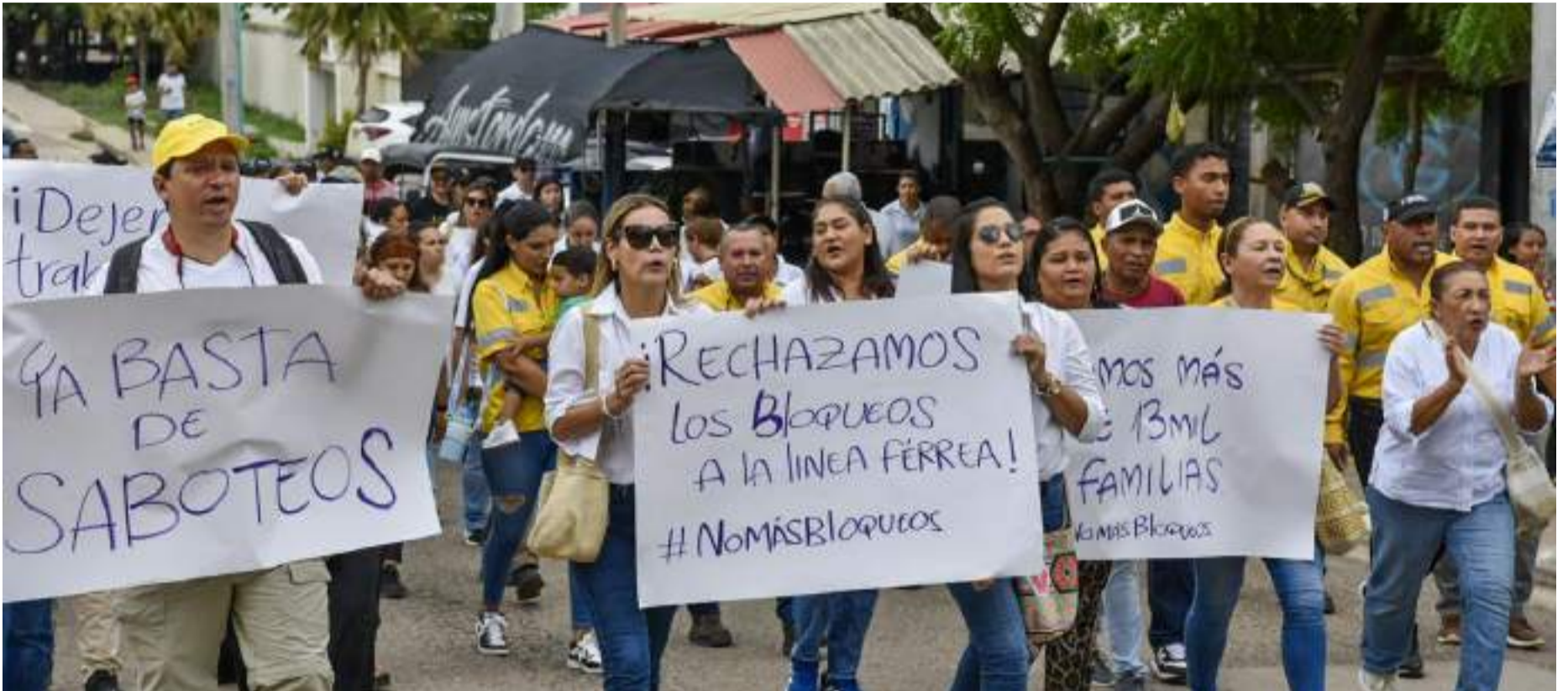
Luego de casi ser exterminados, hoy se han creado miles de asociaciones y fundaciones, supuestamente luchando porque estos se mantengan.