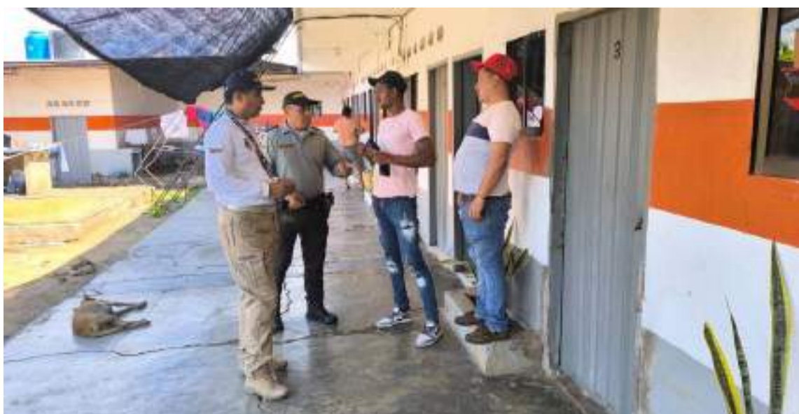
La iniciativa busca fortalecer la seguridad y convivencia en establecimientos turísticos.

colectiva. Esta campaña tiene como propósito prevenir delitos como estafas, falsedad personal, hurto, extorsión, y otros actos delictivos.