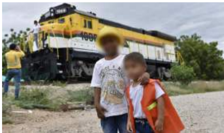
Son esos pocos chupasangre, quienes ponen a los paisanos a bloquear las líneas férreas.

Se tenía que decir y se dice, Cerrejón, es triste decirlo, ha sido afectada por la inconsciencia de las asociaciones y fundaciones que están detrás de los paisanos, son esos pocos chupasangre, quienes ponen a los paisanos a bloquear las líneas férreas afectando a miles de familias que hoy trabajan honrosamente en Cerrejón, esto con el fin de no afectar el bloqueo de sus cuentas, por favor ¿quién pone límite a esta gente sin moral y sin memoria, que abusa de los paisanos, de lo poco que les queda para favorecerse, es hora de que los que trabajan en Cerrejón, empresa que tiene muchos empleados guajiros a su cargo y que esto se verá reflejado en su producción, esto ya colmó los límites, si el tema es con Cerrejón, cierren, pero si el tema es por otro interés vayan y cierren a los que deban cerrar, pero para los defensores de los derechos es más fácil movilizar a los paisanos en su propio entorno, sin importar a quién afecte, movilizarnos es un gasto, le disminuiría sus cuentas, recuerde que son defensores de su chequera.