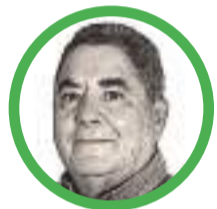
Por Álvaro López Peralta