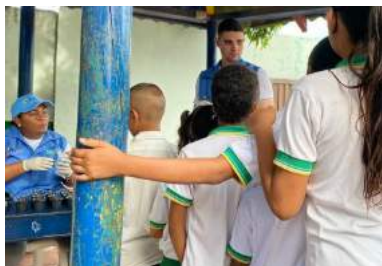
La iniciativa busca garantizar el bienestar y la salud de los niños y niñas de Villanueva.