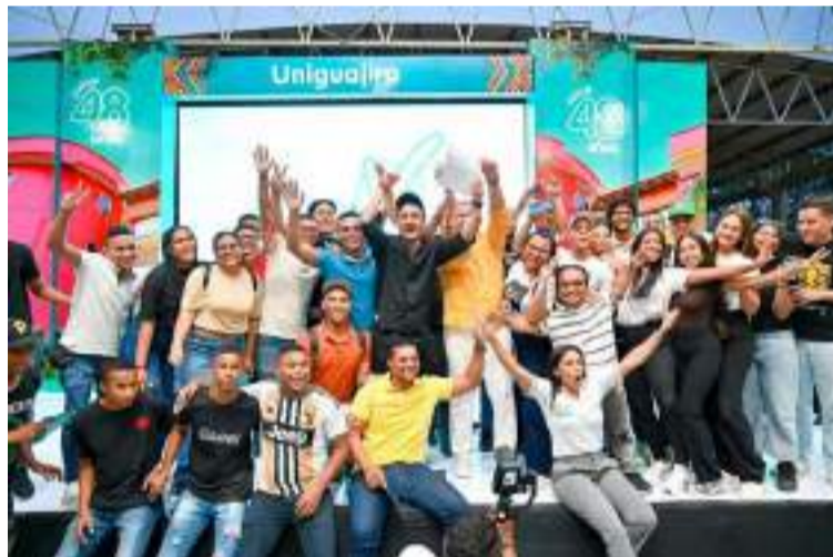
Funcionarios de la Alma Máter, estudiantes y el mismo rector celebraron la noticia de la acreditación.

“Hay externalidades como la educación pública de nuestro depar-