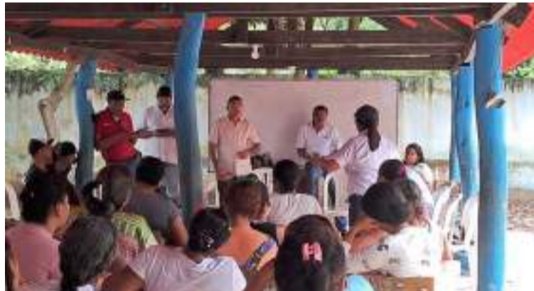
Las conclusiones fueron respaldadas por los padres de familia y líderes comunales asistentes.

4. Garantizar la alimentación escolar con preparación en casa para los niños y niñas desescolarizados y los 8 que serán