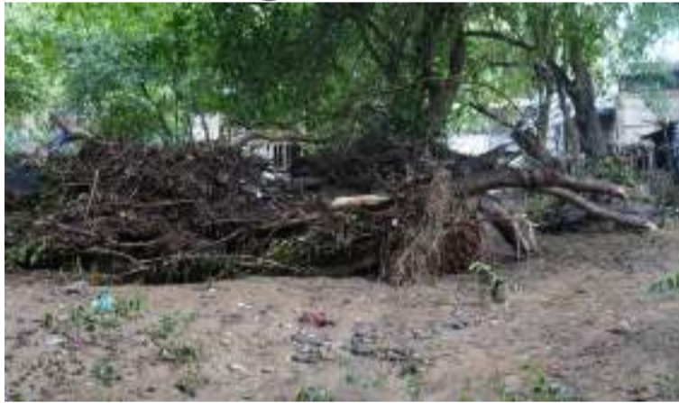
La situación invernal exige medidas urgentes para mitigar los impactos y asegurar una respuesta rápida.

2. Tecnologías para atención remota y comunicación: implementación de telemedicina para optimizar los tiempos de respuesta, comunicación satelital y reactivación de redes de radiocomunicación en zonas remotas.