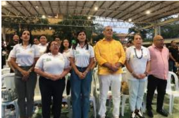
El MEN reconoce que la Uniguajira y sus indicadores están acordes con los estándares exigidos.

Cabe destacar que, para que la Universidad se hiciera acreedora a este reconocimiento, debió cumplir con unos requerimientos y requisitos académicos y administrativos muy exigentes, los cuales