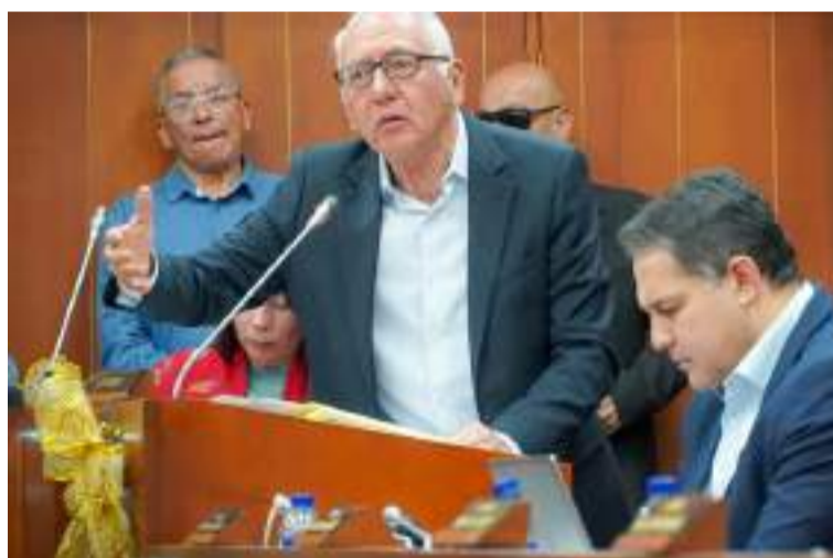
La discusión sobre el sistema de salud es complejo y difícil de comprender o aplicar pragmáticamente.

embargo, Harari subraya que estos ataques modernos distan mucho de los extremos alcanzados en los inicios de la Edad Moderna, cuando la Inquisición Católica perseguía y quemaba en la hoguera a quienes consideraba herejes.