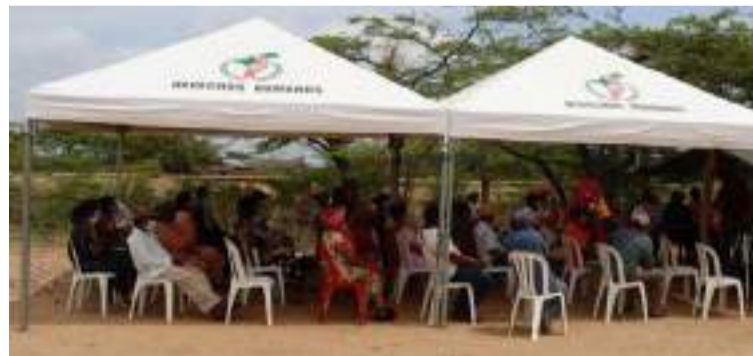
La multiplicación descontrolada de las figuras de autoridades tradicionales es una práctica inconstitucional.

Adicionalmente, supeditar el relacionamiento con este pueblo al uso de figuras ajenas a su mundo territorial, social y cultural, termina promoviendo prácticas clientelistas, ge-