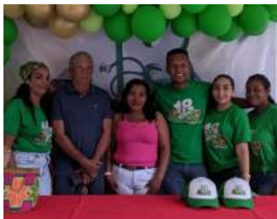
Centro de salud Palaima Puente Bomba.