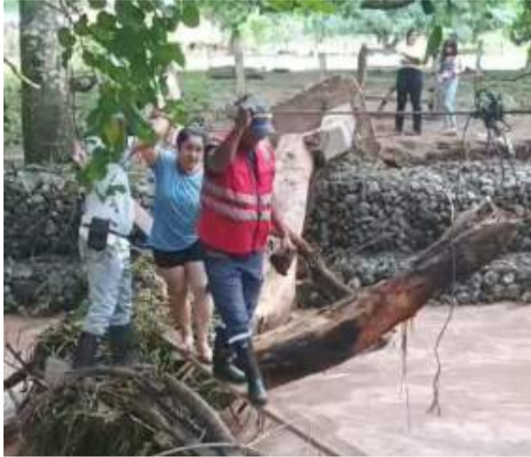
Los Bomberos iniciaron la operación de rescate valiéndose del cable del paso peatonal y las ramas de árboles caídos.

La fuente hídrica cada vez fue tomando más fuerza, al punto de derribar unos árboles y llevarse un puente colgante, que permitía cruzarlo y llegar al lugar de recreación, donde ya comenzaba a sentirse el pánico por lo