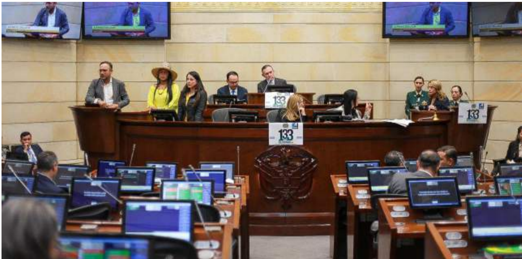
El artículo 1 del texto aprobado modifica por quinta vez (1993, 1995, 2001 y 2007) el artículo 356 y 357 de la Carta Política 1991.