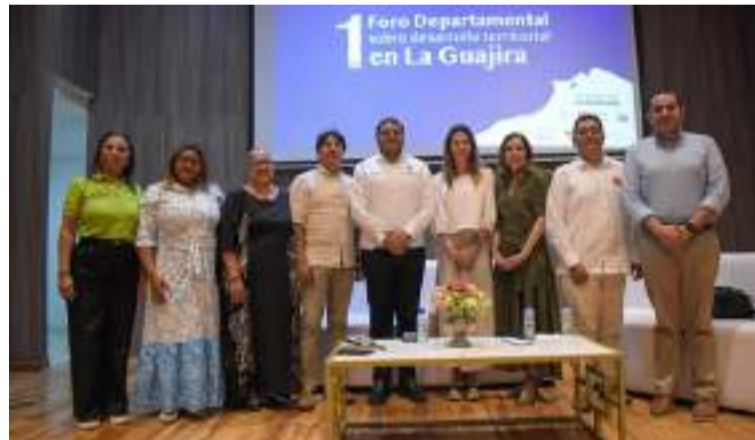
Las instituciones y la empresa privada deben unir esfuerzos para avanzar en el desarrollo del Departamento.