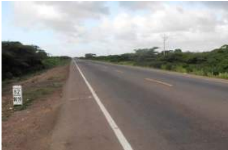
El vigilante explicó que neutralizó a uno de los bandidos e hirió al otro que huyó a la zona boscosa.

El hecho se habría registrado la tarde del domingo 10 de noviembre a la altura del kilómetro 40 a pocos metros del peaje Alto Pino, en donde las autoridades habrían lle-