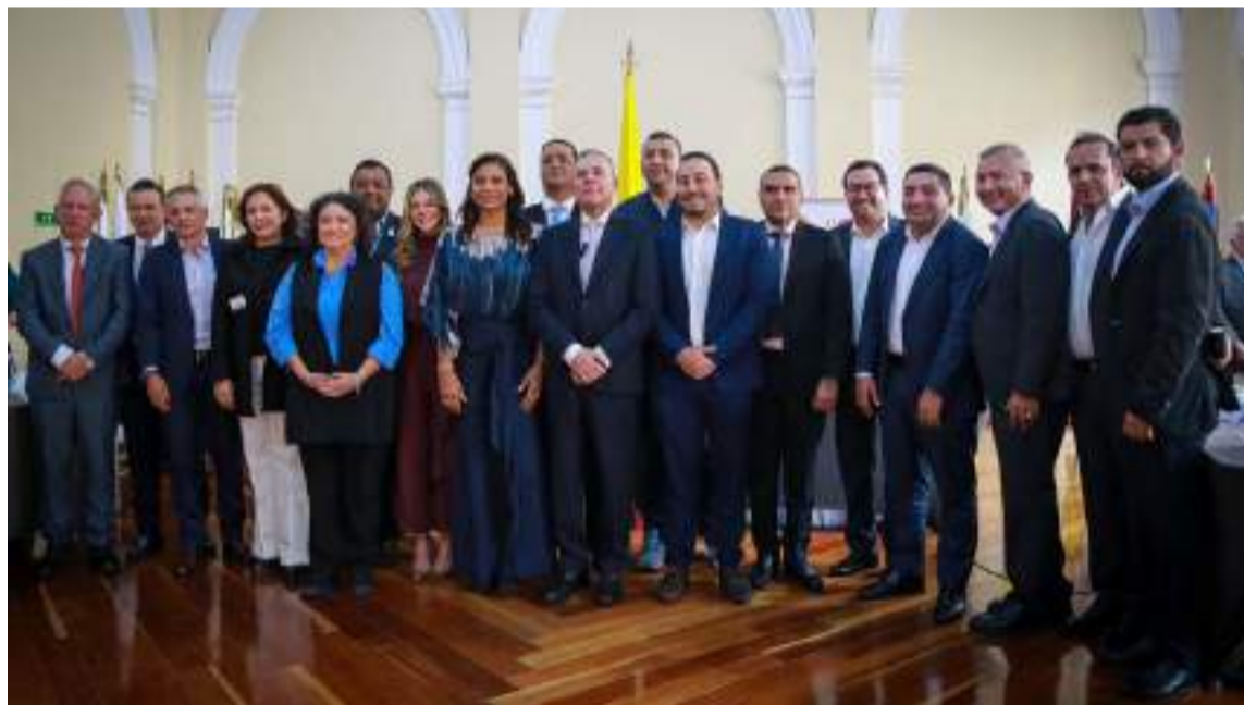
Los gobernadores del país se reunieron con el presidente del Senado, Efraín Cepeda.

El 29 de octubre pasado la plenaria del Senado de la República aprobó en sexto debate (segunda vuelta), el proyecto de Acto Legislativo "Por el cual se fortalece la autonomía de los Departamentos, Distritos y Municipios, se modifica el artículo 356 y 357 de la Constitución Política y se dictan otras disposiciones".