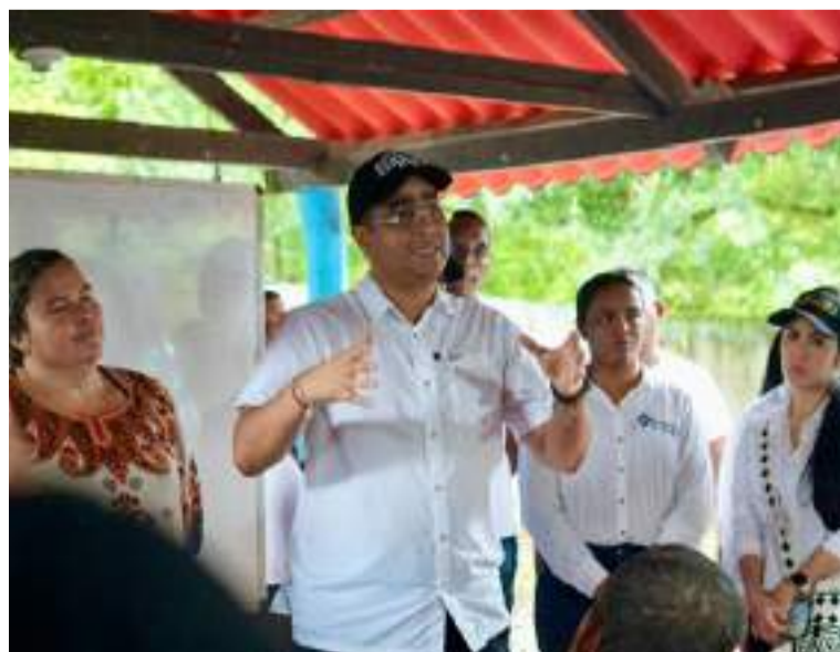
El gobernador dijo que se está avanzando en la firma de un convenio para la compra de maquinaria amarilla.