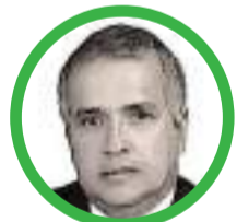
Por Rubén Darío Ceballos Mendoza