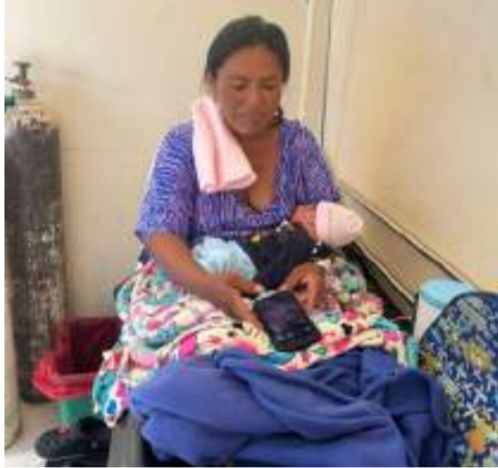
El parto estuvo iluminado por la luna que salió después de las intensas lluvias.

Dicho vehículo se encontraba en otra comunidad a dos horas de camino y por el mal estado