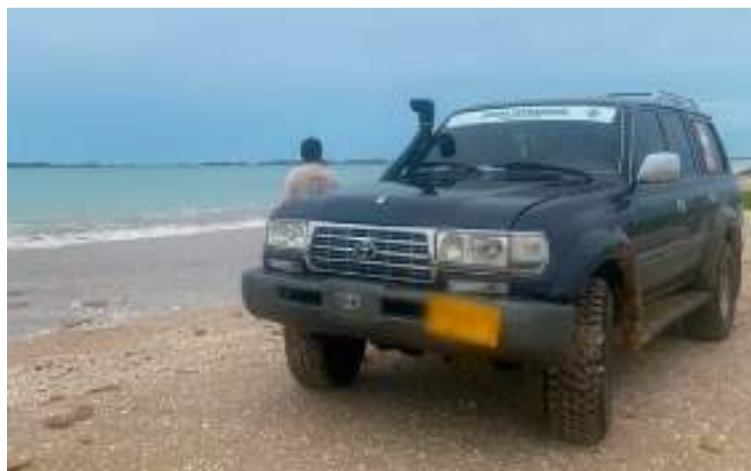
Jairo Aguilar solicitó a los comités municipales, entregar la información de manera oportuna.