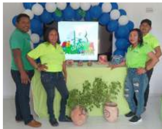
Centro de Salud Sede Mauripao.