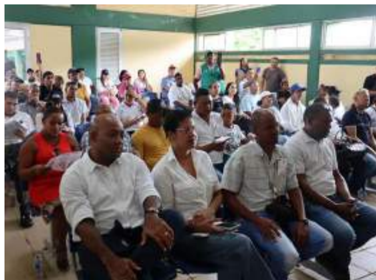
Se beneficiarán a más de 900 habitantes de la zona, entre ellos campesinos y comunidades indígenas.