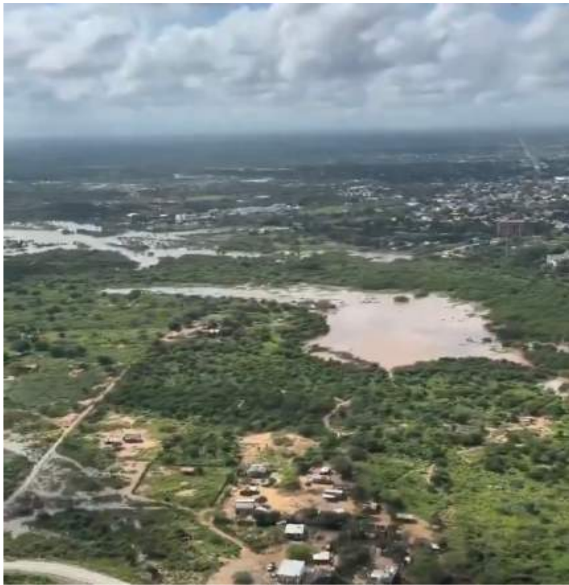
El caudal del arroyo de Paraguachón no baja, dificultando la entrega de ayudas.

Cabe destacar que el gobernador Jairo Aguilar Deluque, precisó que se activó el plan de acción a