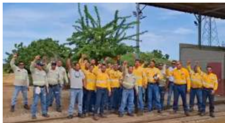
Los trabajadores y residentes reiteran la necesidad urgente de restablecer el tránsito ferroviario.

En lo que va del año, Cerrejón ha registrado más de 282 bloqueos. Por ello, ha hecho un llamado urgente a las comunidades y a todas las entidades públicas y privadas de la región para trabajar en conjunto y de manera inmediata en la búsqueda de soluciones efectivas y sostenibles para evitar que esta problemática se siga agravando.