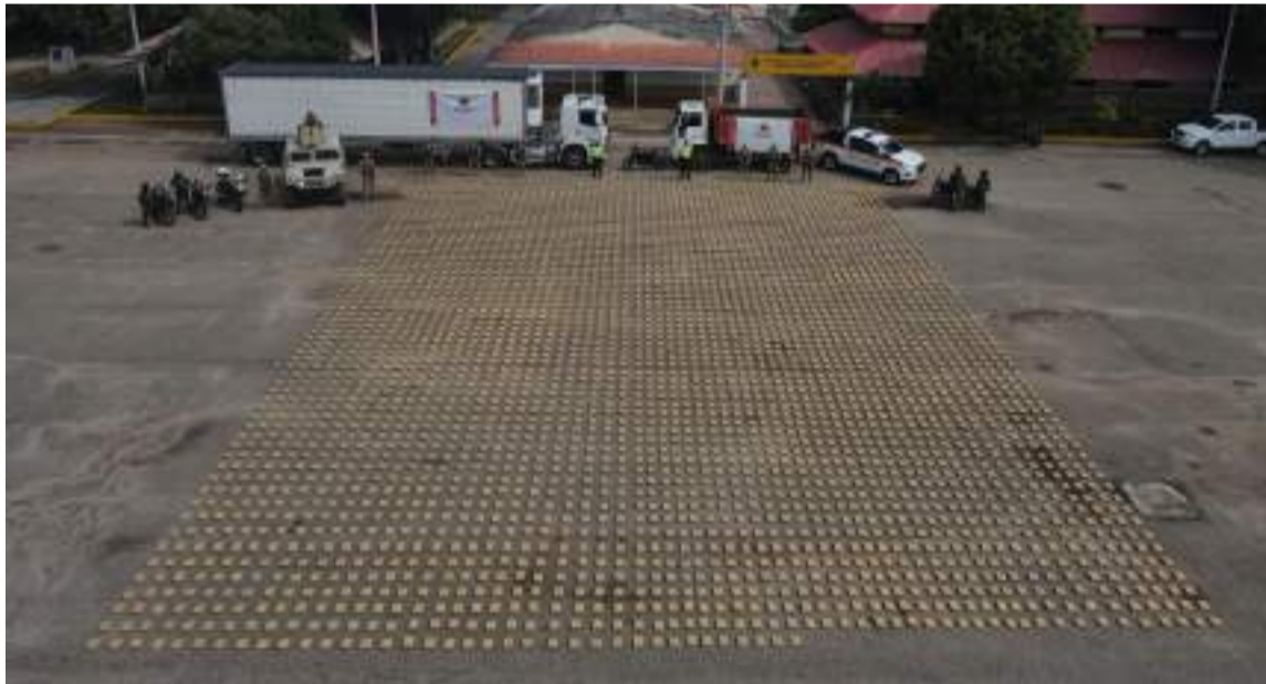
También se logró la incautación de un tractocamión, una volqueta y una motocicleta.

En la operación militar, que busca frenar las economías ilícitas en esta