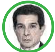
Por José Félix Lafaurie Rivera