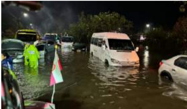
Petro explicó que pueden a partir del decreto, trasladar recursos presupuestales de la nación en otras entidades.

jefe de Estado dijo que “nos centraremos en todo el territorio nacional. Hay impactos en diversos departamentos en este momento de diversa magnitud, pero hay tres zonas hoy con una escala muchísimo mayor, y es donde