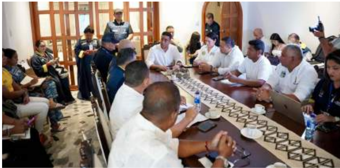
Autoridades instan a los guajiros a mantenerse informados a través de canales oficiales.

La declaración de calamidad pública habilita a la Administración departamental para activar de manera inmediata un plan de acción con el ob-