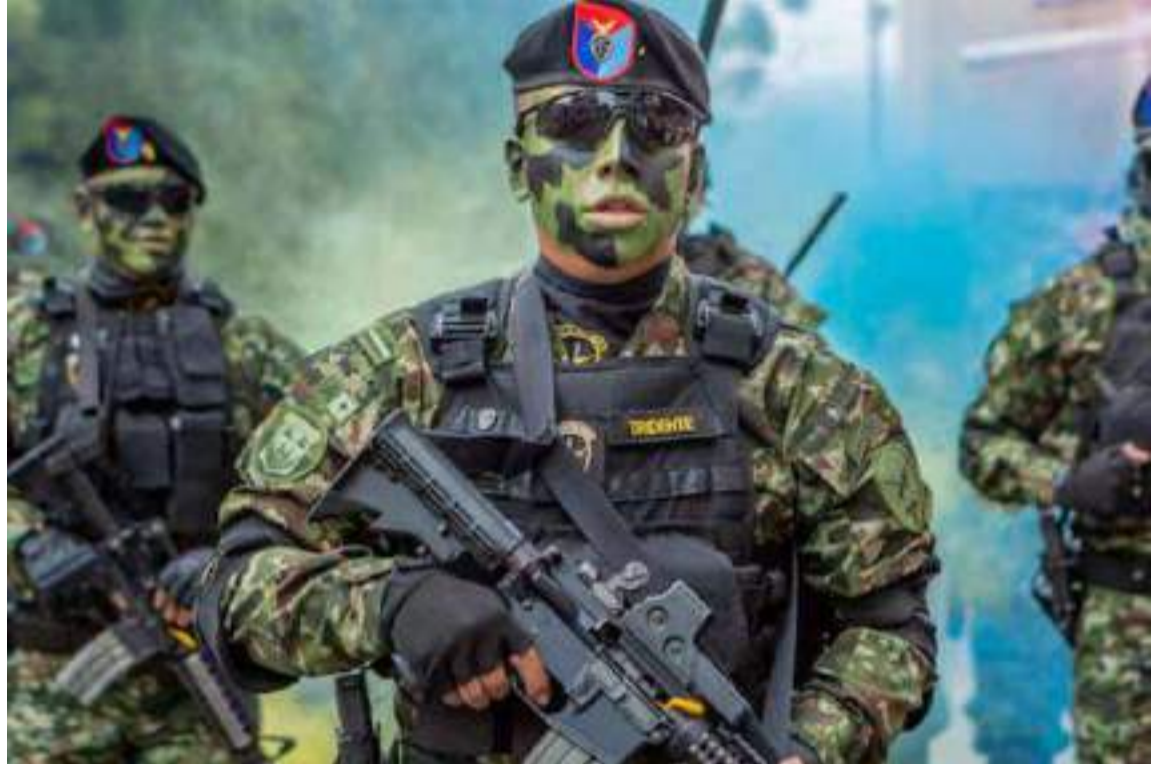
La reestructuración busca optimizar recursos y mejorar la respuesta ante las amenazas.

A partir de ahora, las operaciones ofensivas en el territorio nacional serán responsabilidad de cada comandante de fuerza, es decir, del Ejército, la Armada Nacional y la Fuerza Aérea, que volverán a ope-