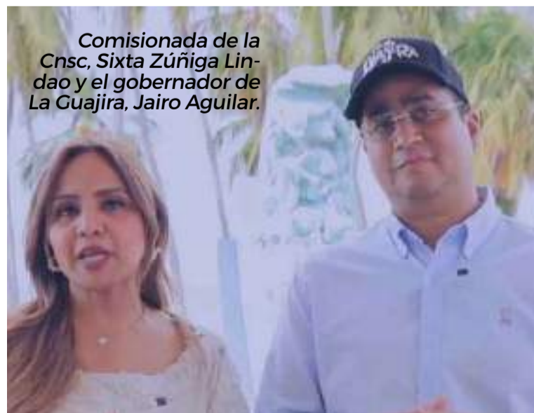
Comisionada de la Cnsc, Sixta Zúñiga Lindao y el gobernador de La Guajira, Jairo Aguilar.

La Cnsc culmina el recorrido de este año por las diferentes regiones del país con su visita a Riohacha, a la fecha se han realizado los Encuentros Macrorregionales en Barranquilla, Yopal y Cúcuta. Para más información e inscripciones a este encuentro macrorregional que se llevará a cabo en Riohacha, ingrese a https://www.cnsc.gov.co/encuentros-macrorregionales-2024 .