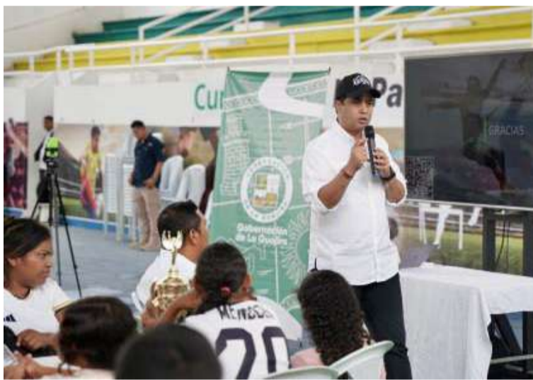
El gobernador Jairo Aguilar expresó su satisfacción por los avances logrados durante la socialización.

Este Plan Decenal de Deportes tiene como propósito fundamental promover la práctica deportiva, mejorar la infraestruc-