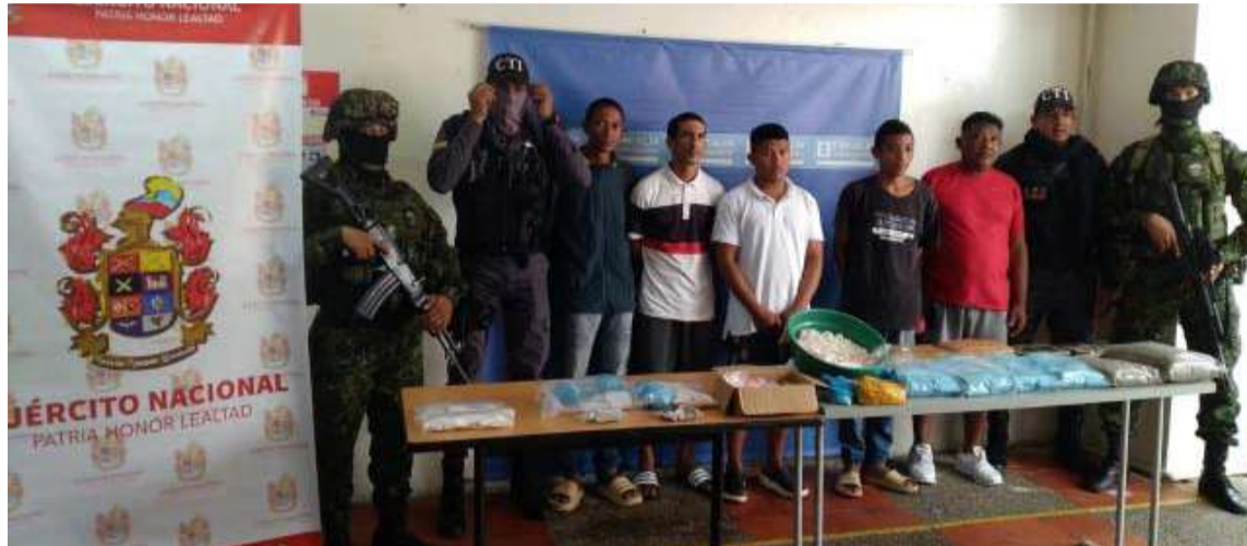
Estas personas fueron capturadas cuando procesaban en pequeñas cantidades la droga.

Hasta el momento las autoridades no han brindado detalles de la cantidad de estupefacientes que fueron incautados, además, con los resultados de este operativo se pudo evidenciar un duro golpe contra el microtráfico en la capital guajira.