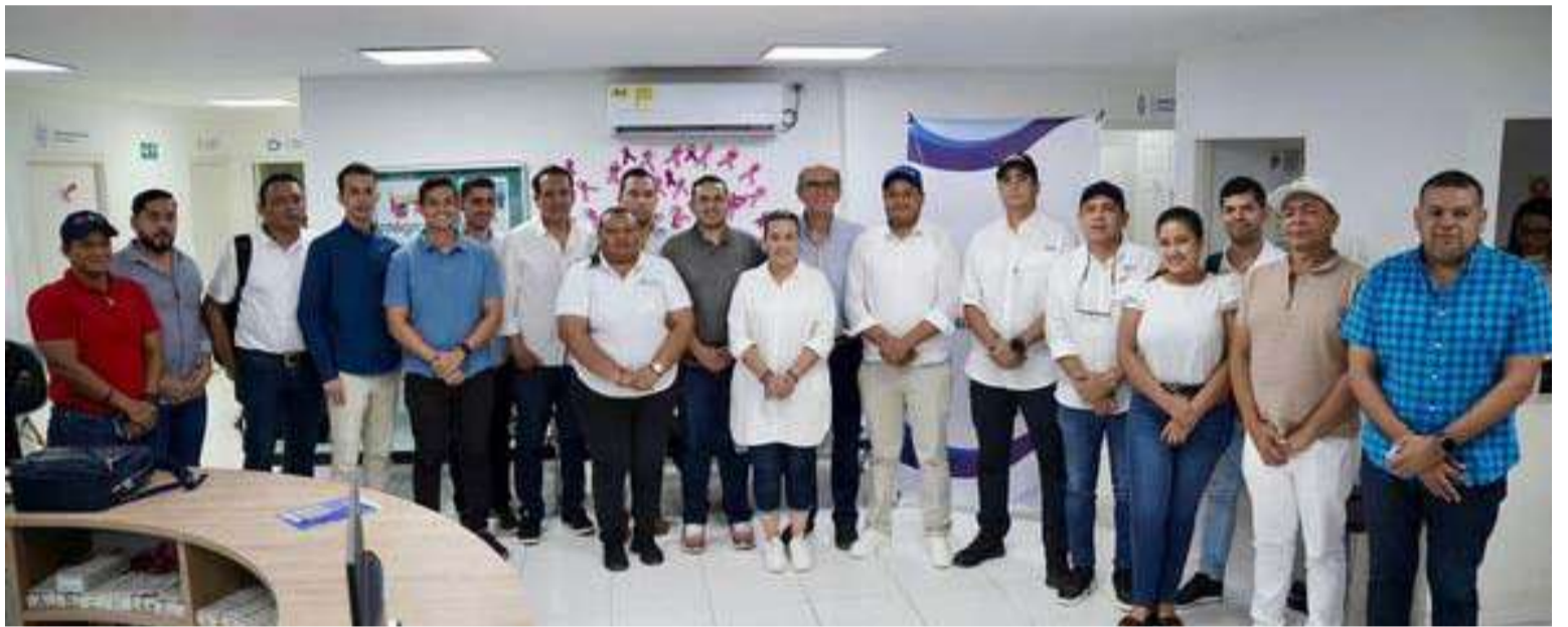
En la actividad se socializó el mecanismo, los proyectos, requisitos y tipos de financiamiento que esta ofrece.

En la mesa participaron empresas como Grupo de Energía Bogotá, Enlaza, Grupo Empresarial Quiroz, Transportadora de Gas Internacional, Hocol y Gases de La Guajira.