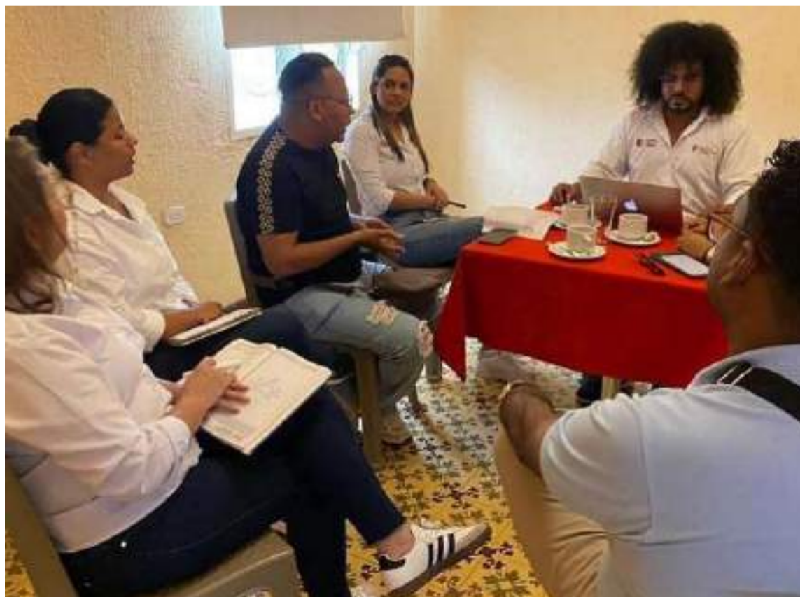
Se reafirmó el compromiso de inclusión y justicia social en la administración de recursos.

Representantes de distintos sectores estuvieron presentes, fortaleciendo el compromiso de trabajo conjunto para mejorar la calidad de vida en Villa-