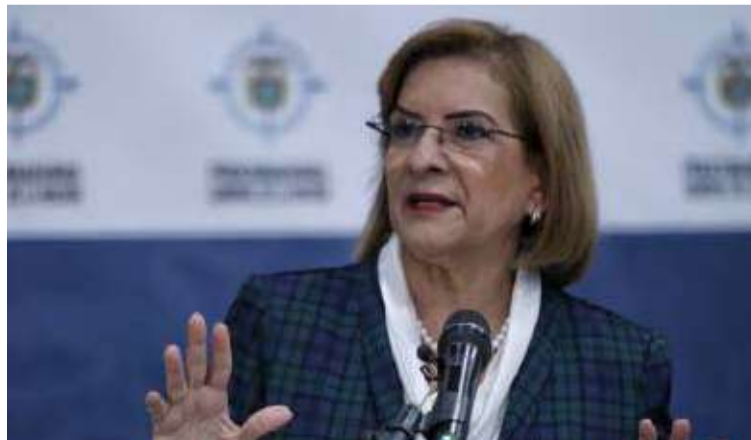
Entre enero y agosto de 2024 se registraron 32.141 casos de violencia intrafamiliar.

Estas cifras incluyen 61.102 de violencia física,