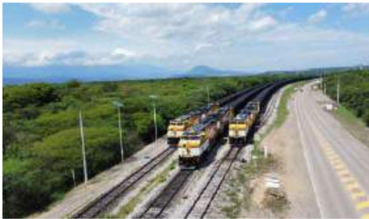
Cerrejón reafirma su compromiso con el respeto a los Derechos Humanos y la seguridad de todos los involucrados.

"Preocupa que en el lugar del bloqueo hacen presencia personas de la tercera edad, quienes, pese a las advertencias de las autoridades sobre