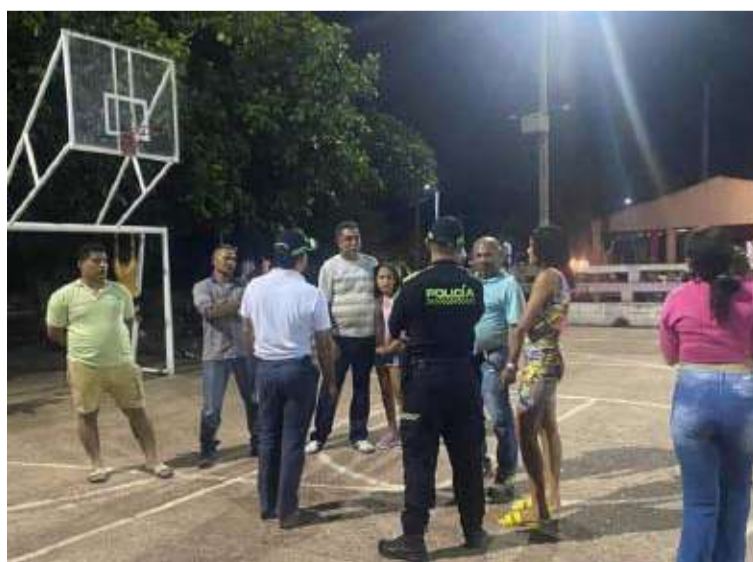
La iniciativa busca recuperar y fortalecer entornos, promoviendo la seguridad y el bienestar de los habitantes.