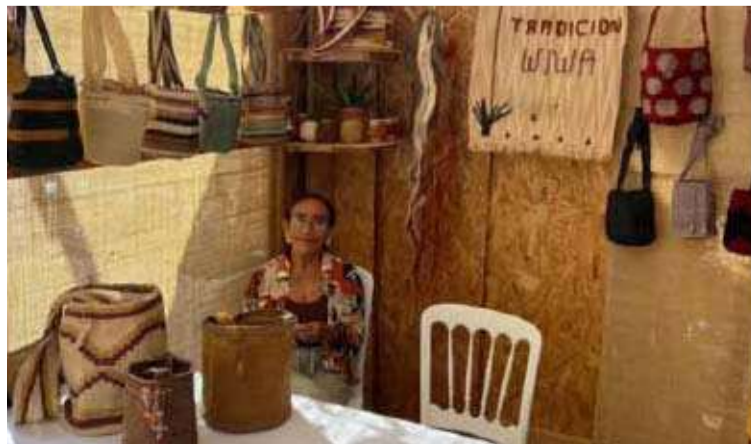
Corpoguajira tuvo una participación muy activa en los diferentes eventos que se presentaron en la COP16.