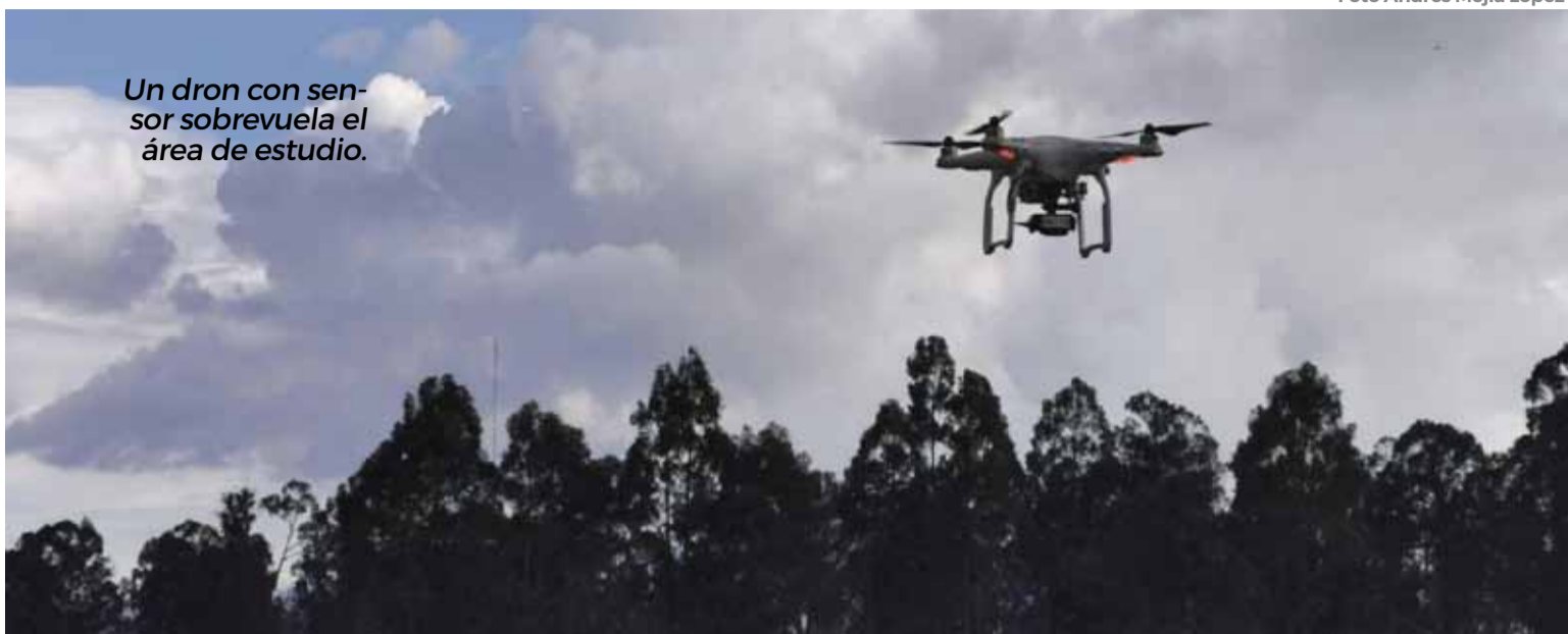
Un dron con sensor sobrevuela el área de estudio.

El GPR es un dispositivo que emite ondas electromagnéticas en el subsuelo y mide la respuesta de los materiales bajo la superficie. Aunque los resultados del GPR mostraron potencial para detectar fosas, el método presentó desventajas por ser costoso, voluminoso y tener una cobertura limitada por la cantidad de tiempo y esfuerzo