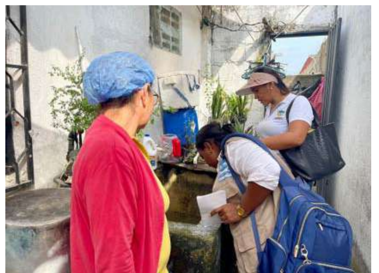
La Secretaría de Salud continuará llevando acciones preventivas en las diferentes comunidades del Distrito.

La prohibición se implementó desde el pasado sábado 2 de noviembre y se extenderá por 8 días o hasta que el caudal disminuya de manera considerable.