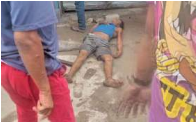
Esta persona quedó gravemente herida, por lo que fue llevada al Hospital Nuestra Señora de los Remedios.

La gresca se originó en horas de la tarde del lunes 4 de noviembre, en el mencionado sitio deportivo que está siendo inva-