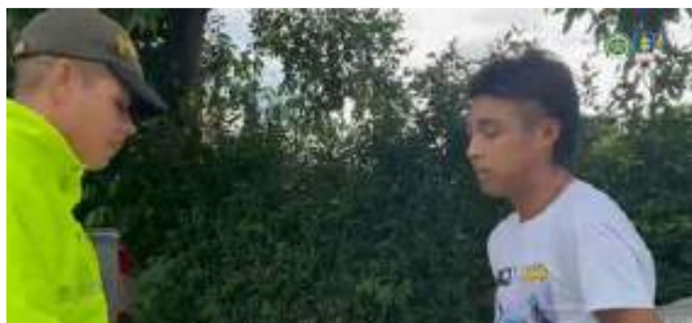
El agresor fue imputado por homicidio y hurto, ambas conductas agravadas.

La víctima presentó una herida con objeto contundente en la región occipital derecha y otra en el antebrazo derecho. El líder indígena llevaba consigo una mochila de lana con un millón de pesos en efectivo, los cuales se llevaron, además de un gorro y el poporo de la etnia indígena arhuaca.