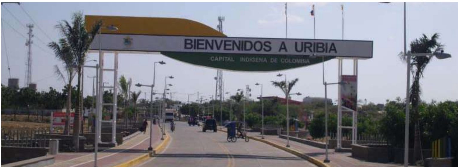
El proyecto de creación de una subestación móvil para Uribia estará a cargo de la empresa Air-e.