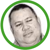
Por Luis Eduardo Acosta Medina