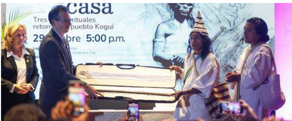
Los objetos retornados son un bastón de mando, una mochila de bejuco y un cesto.