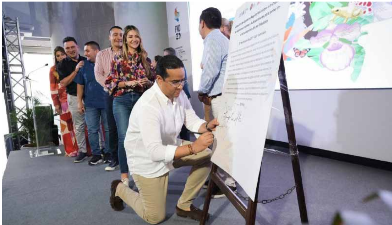
El gobernador Aguilar expresó que iniciaron la recuperación de las más de siete cuencas hídricas del Departamento.

Y cuarto, gracias a la gestión de la COP16, llegaron al país 100 millones de