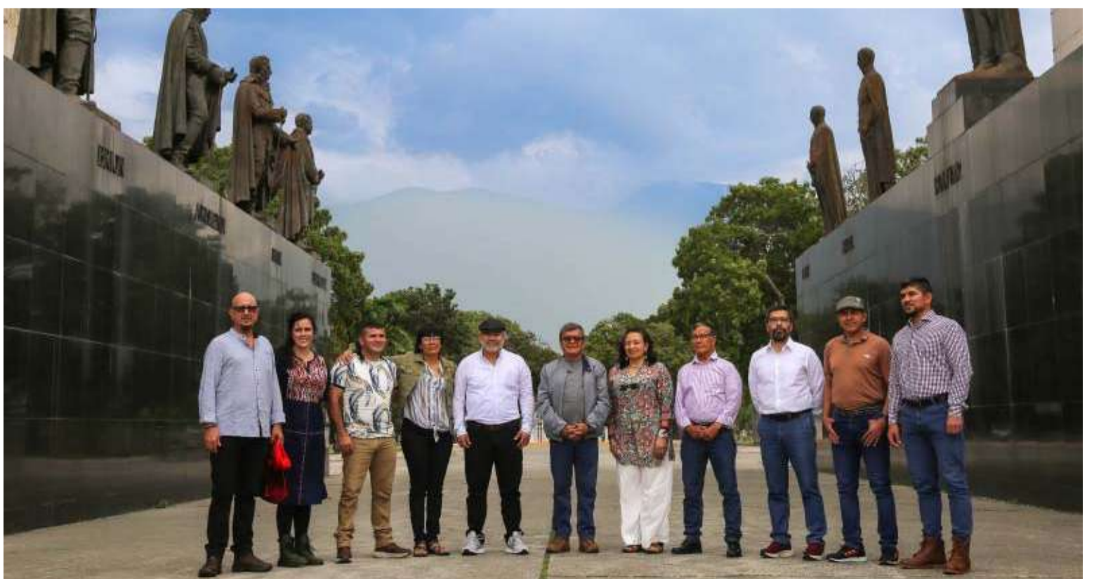
La delegación del ELN llegó a Caracas el sábado, luego de que el proceso estuviera suspendido desde septiembre.

El ELN asiste a esta reunión en el intento de analizar los factores de crisis y empezar a buscar salidas que les permitan avanzar en la construcción de una solución política.