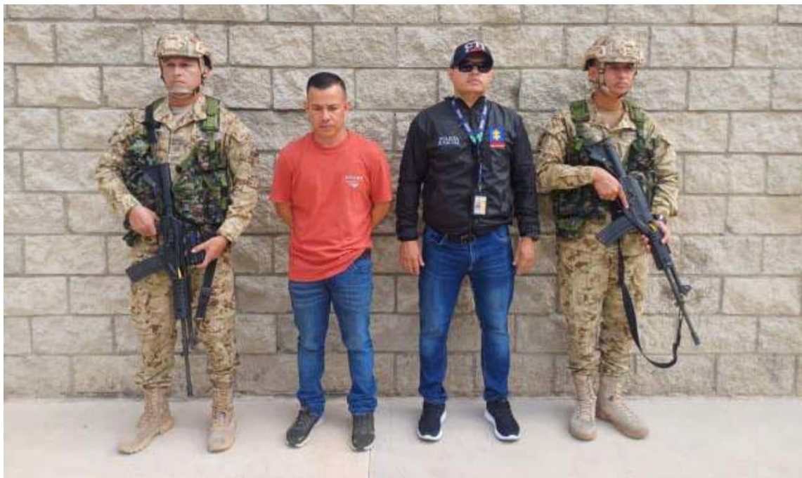
El sargento fue detenido en las instalaciones del Grupo Mecanizado Juan José Rondón.