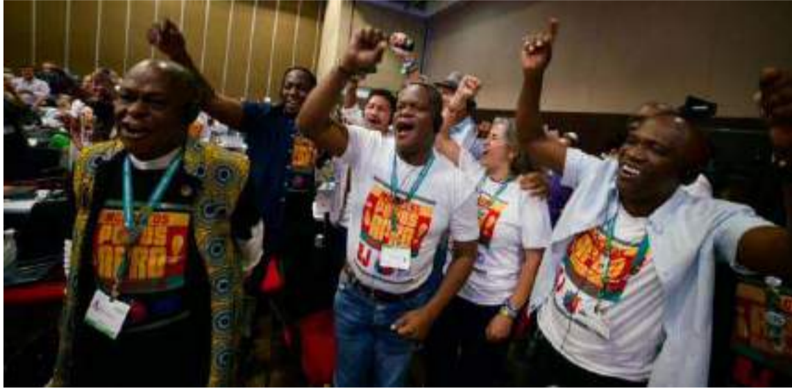
Se les dará a comunidades afro acceso a recibir recursos para financiar sus iniciativas.

El primer acuerdo aprobado anoche, por consenso, es la creación de un órgano subsidiario de trabajo para pueblos indígenas y comunidades locales, en desarrollo del Artículo 8J del Convenio de Diversidad Biológica (CDB), lo