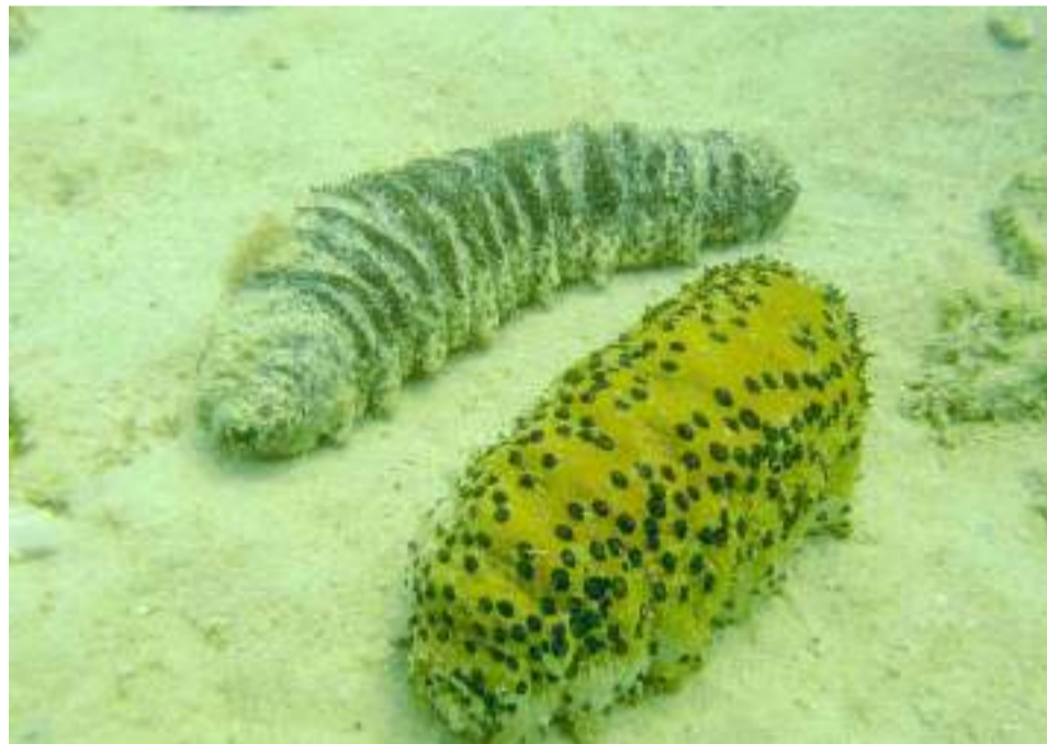
Existen 80 especies de pepinos de mar de interés comercial en el mundo y ocho de ellas se distribuyen en el Caribe y el Pacífico colombiano.