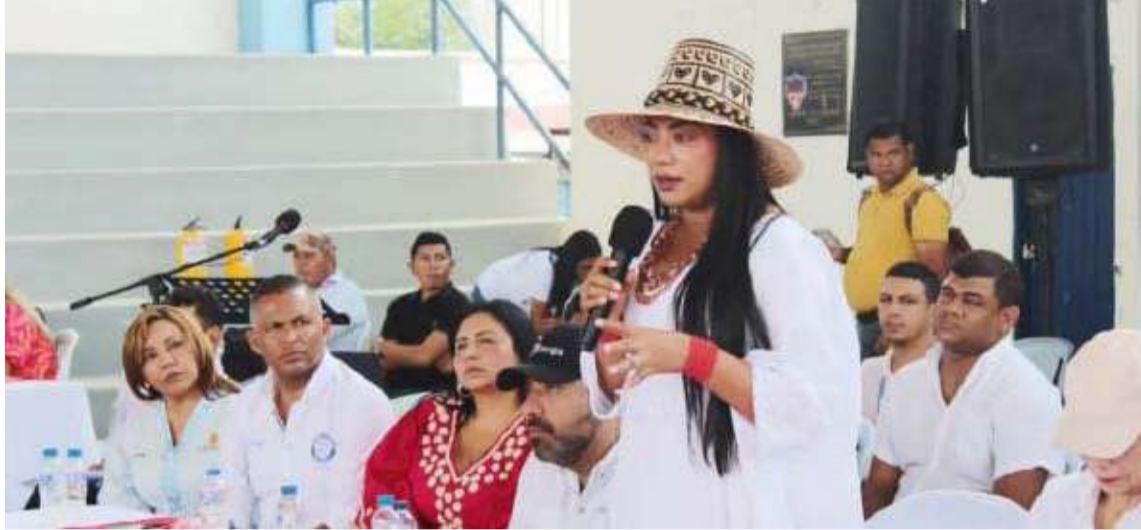
La subestación permitirá fortalecer el servicio de energía en Uribia y Manaure.

Cabe destacar que esta iniciativa permite que se