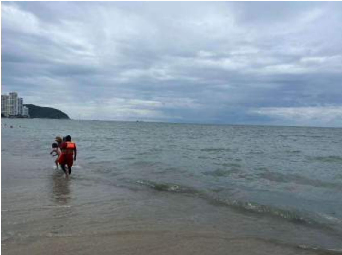
Mientras persistan los riesgos, la medida se mantendrá, advierte el Distrito.

El Ideam elevó la alerta naranja en el Caribe colombiano ante la posible formación de un ciclón que podría alcanzar categoría de tormenta tropical.