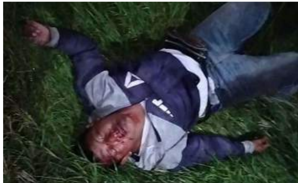
Los familiares de los dos heridos los llevaron hasta un centro asistencial en el Distrito de Riohacha.

Dos personas de la etnia wayuú resultaron heridas en un accidente de tránsito al volcarse la motocicleta en la que se desplazaban, luego de que por razones que son materia de investigación,