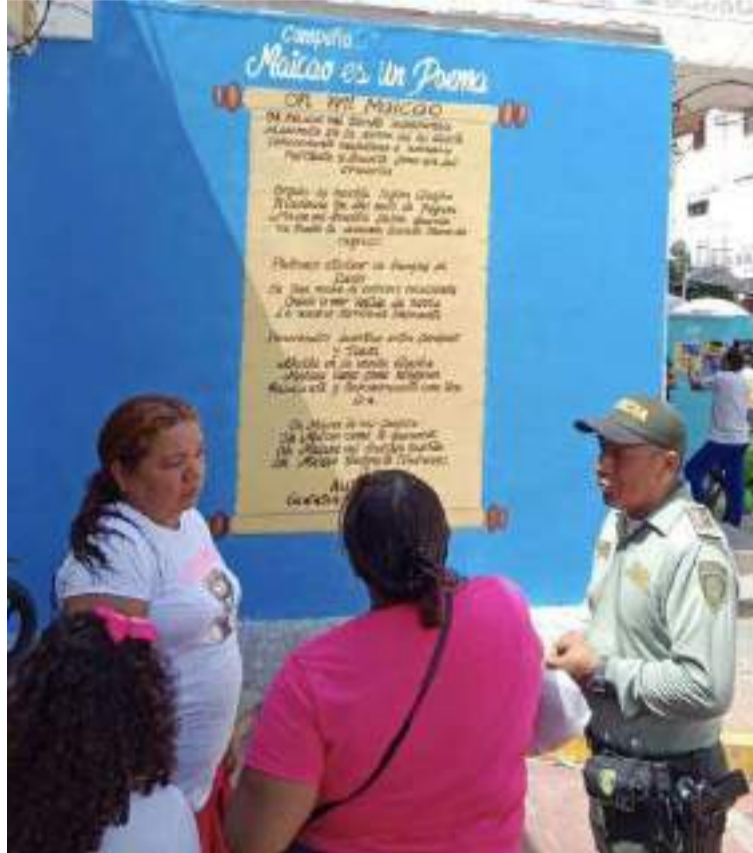
Se invita a los ciudadanos a convertirse en agentes activos en defensa de derechos de niños y adolescentes.

Por otra parte, se dieron a conocer las diferentes