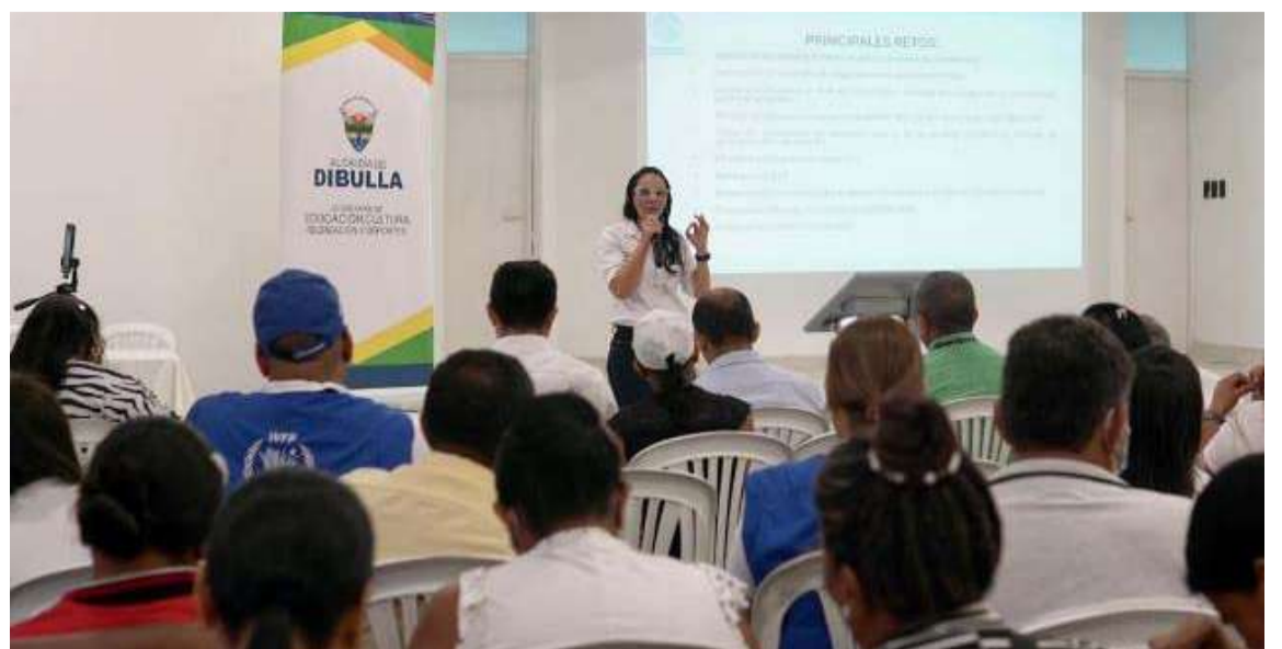
Esta segunda mesa se realiza bajo los lineamientos del MinEducación y la Uapa.

bajo los lineamientos del Ministerio de Educación Nacional y la Unidad de Alimentos para Aprender (uapa). La primera mesa pública del PAE de 2024 se llevó a cabo en el municipio de Fonseca el pasado mes de abril, consolidando este espacio como parte esencial del proceso de planeación y fortalecimiento de estrategias del programa.