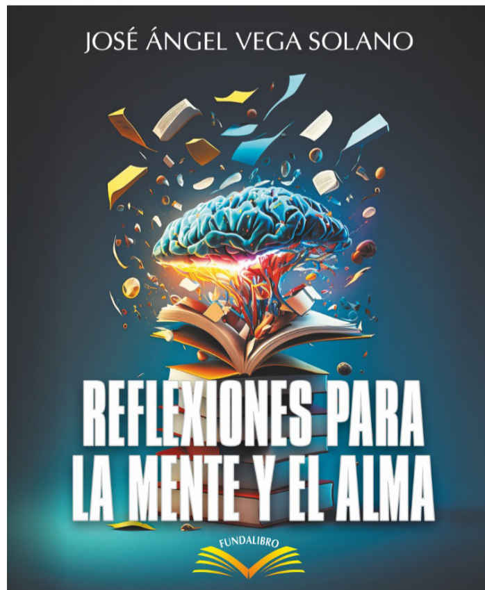
Advierte el autor que quien lee su libro puede mirarse en el espejo de sus páginas.