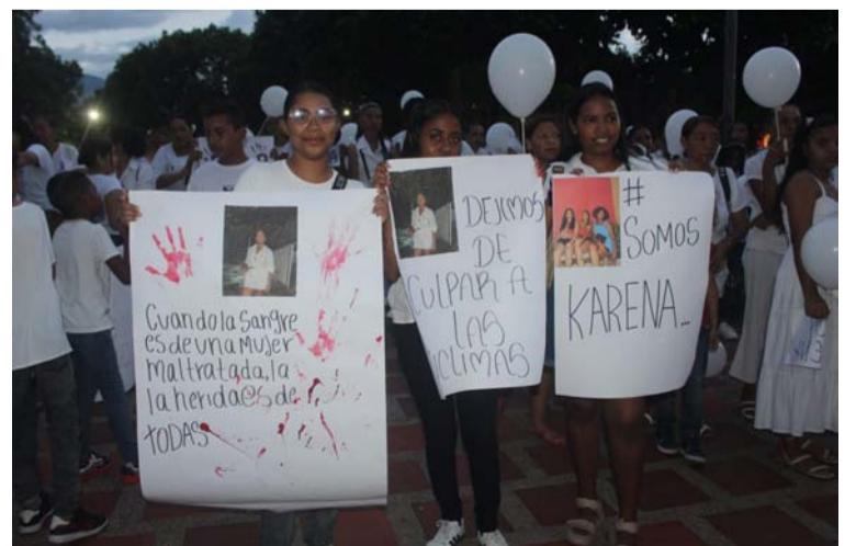
La alcaldesa Cielomar Peñaloza de Lacouture hizo presencia en la velación, acompañada de su equipo de trabajo.