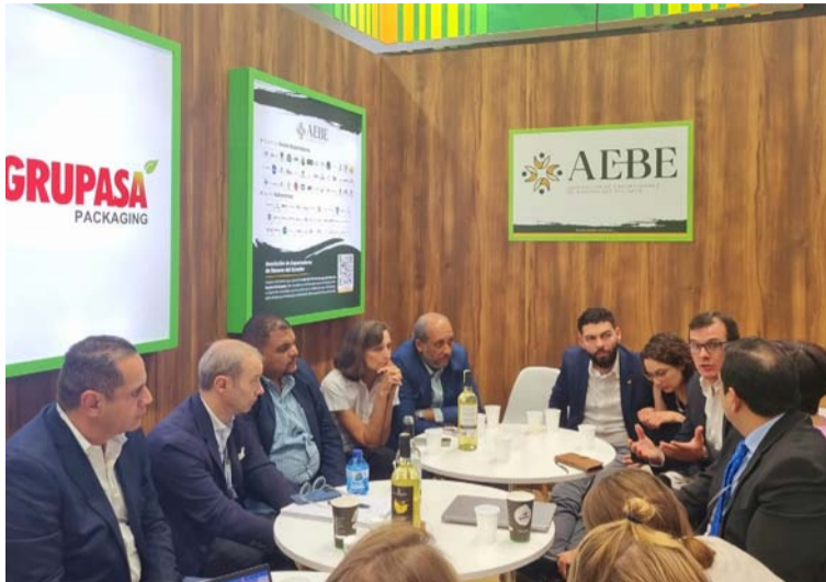
Representantes del sector rechazan las prácticas de ofrecer banano de origen latinoamericano en promoción.

Como representantes del sector bananero rechazaron continuamente las prácticas de los supermercados y tiendas de descuento de ofrecer banano de origen latinoamericano en promociones que desvalorizan los esfuerzos de sostenibilidad de los pro-