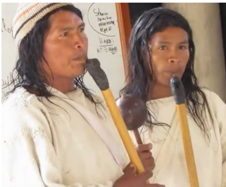
La organología de la gaita wiwa está compuesta por un par de flautas de cera que ellos denominan watuhku.

tienen una ligazón perdurable con la naturaleza (en especial, se le canta mucho a las aves) y los motivos bucólicos.