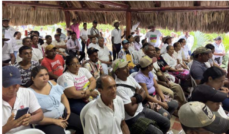
El comité busca garantizar que las voces de las comunidades afectadas por el conflicto sean escuchadas.

El acto, que marca un hito en la historia de la reivindicación de los derechos del campesinado,