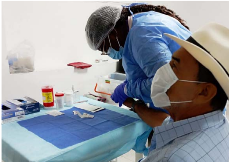
Es necesario seguir implementando estrategias que permitan aumentar la toma de muestras biológicas.

tieron recibir cinco solicitudes nuevas, cuatro aportes de información, el relacionamiento con las entidades y organizaciones de la sociedad civil para continuar desarrollando agendas conjuntas que beneficien los procesos de búsqueda. Estas acciones se llevaron a cabo en los municipios de Fonseca, Villanueva y Hatonuevo, en La Guajira, y Chiriguaná, Pailitas y Curumaní, en el Cesar.