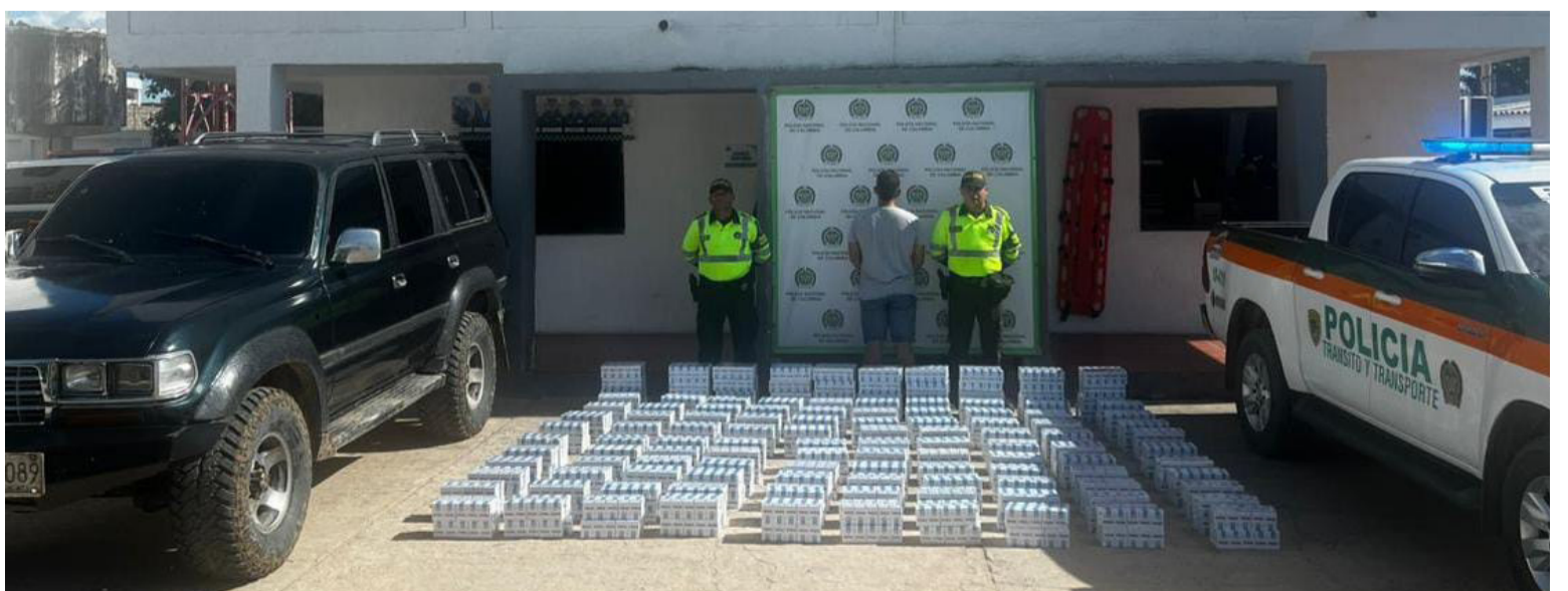
Los cigarrillos de procedencia extranjera eran transportados en un vehículo que fue inmovilizado por la Policía.