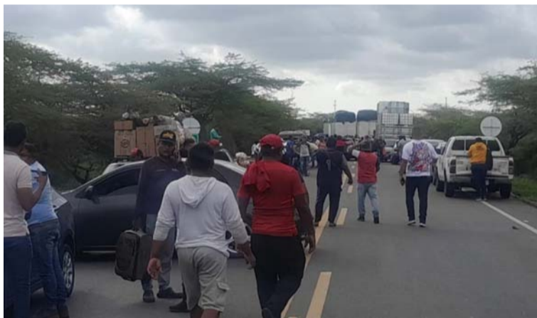
Questionan al Icbf por no cumplir la palabra de hacer los desembolsos y faltar a sus compromisos.

nos recuerda que son las únicas vías de hecho que consideramos veraz para ser escuchados ante las instituciones del Estado”, se indica en el comunicado. Las vías que se tomarán son la troncal del Caribe, y las salidas a Valledupar y Maicao.