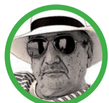
Por José Manuel Aponte Martínez