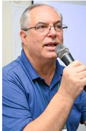
El espacio promovió un diálogo interdisciplinario.