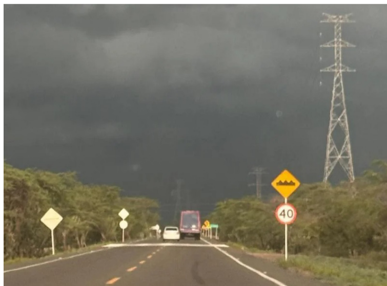
Alerta amarilla por probabilidades de crecientes súbitas en los ríos Palomino, Ranchería, Ancho, y Río Negro.

Hay alerta amarilla por probabilidad de crecientes súbitas en los ríos Palomino, Ranchería, Ancho, Río Negro, Maluisa, Alto Cesar y Badillo. La alerta naranja es en el río Tapias. Las temperaturas máxi-