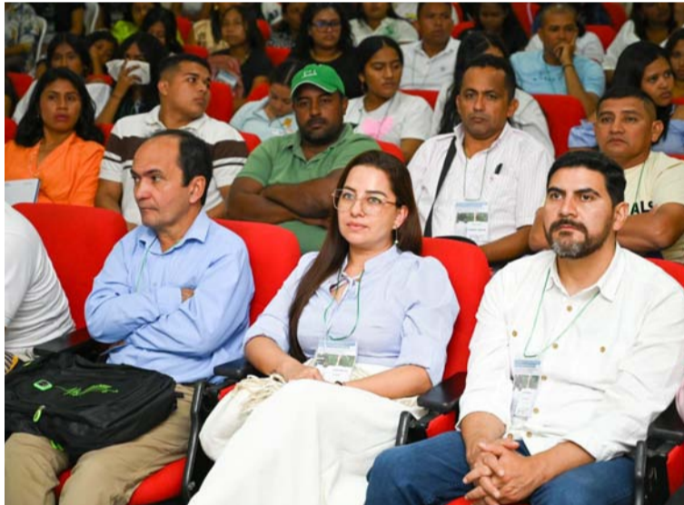
Participaron docentes de toda la región, incluyendo Maicao, Uribia, Barranquilla y Valledupar.

Durante el Congreso, se presentaron 17 ponencias presenciales y 13 virtuales, además de mesas técnicas y conversatorios con valiosos aportes. Participaron docentes de toda la región, incluyendo Maicao, Uribia, Barranquilla y Valledupar, así como de instituciones como la Universidad del Atlántico, la Universidad Pedagógica de Bogotá y el Po-