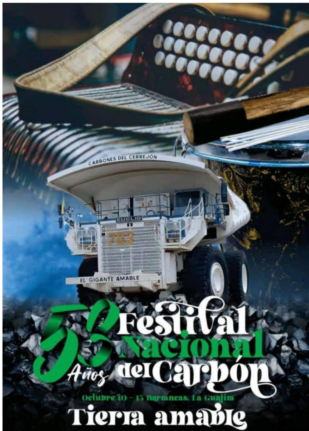
Afiche de la versión 53 del Festival Nacional del Carbón que se cumple en Barrancas del 10 al 13 de octubre de 2024.

Municipio de La Guajira que se ha convertido en el epicentro cultural de nuestro Departamento