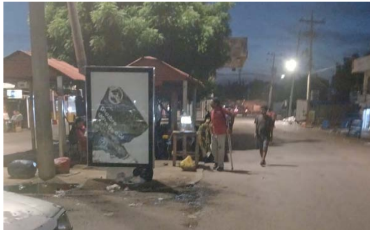
Según la fuente consultada, cada uno de los cambistas tenía el dinero del trabajo del día.

Este hecho se registró en horas de la mañana del viernes 11 de octubre en el sector de La Raya en el corregimiento de Paraguachón, zona rural del municipio de Maicao, frontera con Venezuela,