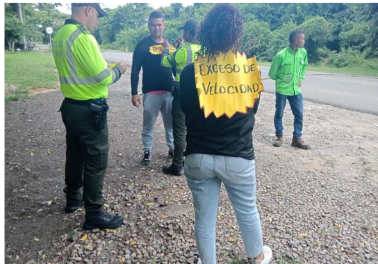
Se impusieron 341 órdenes de comparendo donde el top 3 de las infracciones es no tener licencia de conducción.

Asimismo, la institución policial informó que, por medio de 7 áreas de prevención más de 100 uniformados van a ga-