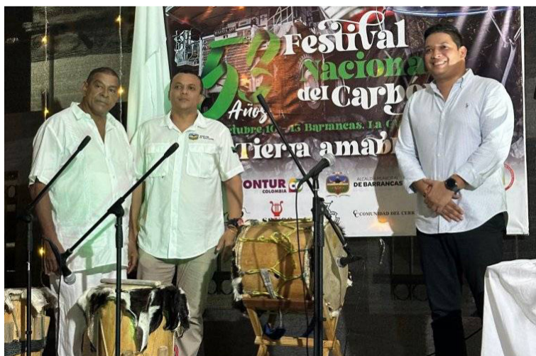
El Festival del Carbón busca preservar la cultura y las tradiciones, las muestras artesanales y las exposiciones de nuestros emprendedores.