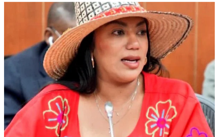
La legisladora explicó que este alivio para el sector quedará en firme la próxima semana.

La congresista guajira informó que este alivio para el sector quedará en firme a partir de la próxima semana, cuando se expidan las resoluciones correspondientes.