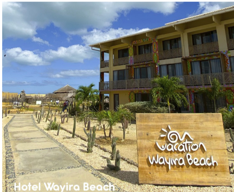
Hotel Wayira Beach

La cadena hotelera On Vacation, dio apertura a una nueva oficina comercial en la ciudad de Barranquilla ubicada en el Centro Comercial Plaza 52, carrera 52 #72-114.