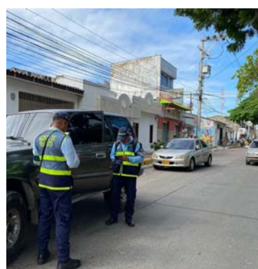
El objetivo es poder tener más control en la ciudad.

En ese mismo sentido, el director del Instramd, solicitó nuevamente a los conductores que respeten las señales de tránsito, y que no conduzcan a altas velocidades para bajar el índice de accidentes en la ciudad.