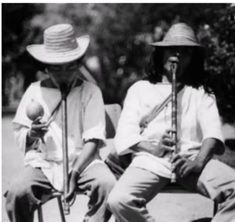
El instrumento se encuentra en las diferentes comunidades de nativos de la Sierra Nevada de Santa Marta entre kogi, ika y wiwa