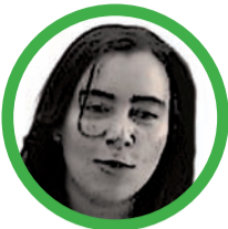
Por Yerlin Carolina Díaz Bonilla

Quién no sabe que Barrancas es tierra amable y que la mayor riqueza está en su gente apasionada entregada por dejar en alto los valores espirituales y los principios que destacan la grandeza de ser parte del territorio próspero y agradable que proyecta bienestar y es ejemplo de superación e inspiración para quienes nos visitan. 'Linda Barranca hermosa tierra mía todas mis melodías te las vengo a cantar que mis canciones las de la ranchería todas las alegrías que sus mujeres dan'.