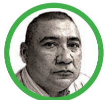
Por Wilfredo Acosta Bolaño