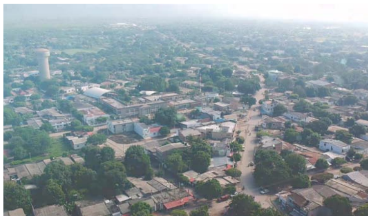
El municipio de Barrancas cuenta con un semillero artístico que contribuye a escribir capítulos destacados en la historia del territorio que enamoran.