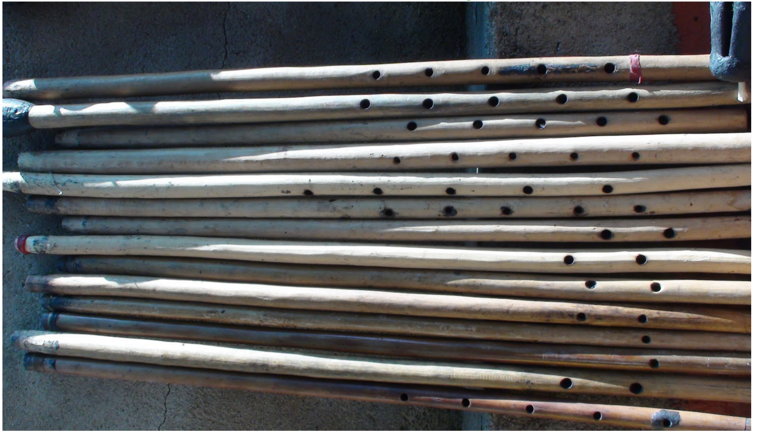
La gaita wiwa es la elaborada con el tallo de la planta kauzhi, la que una vez cortada se le denomina bunkuizhi.

Sin embargo, las temáticas de los cantos man-