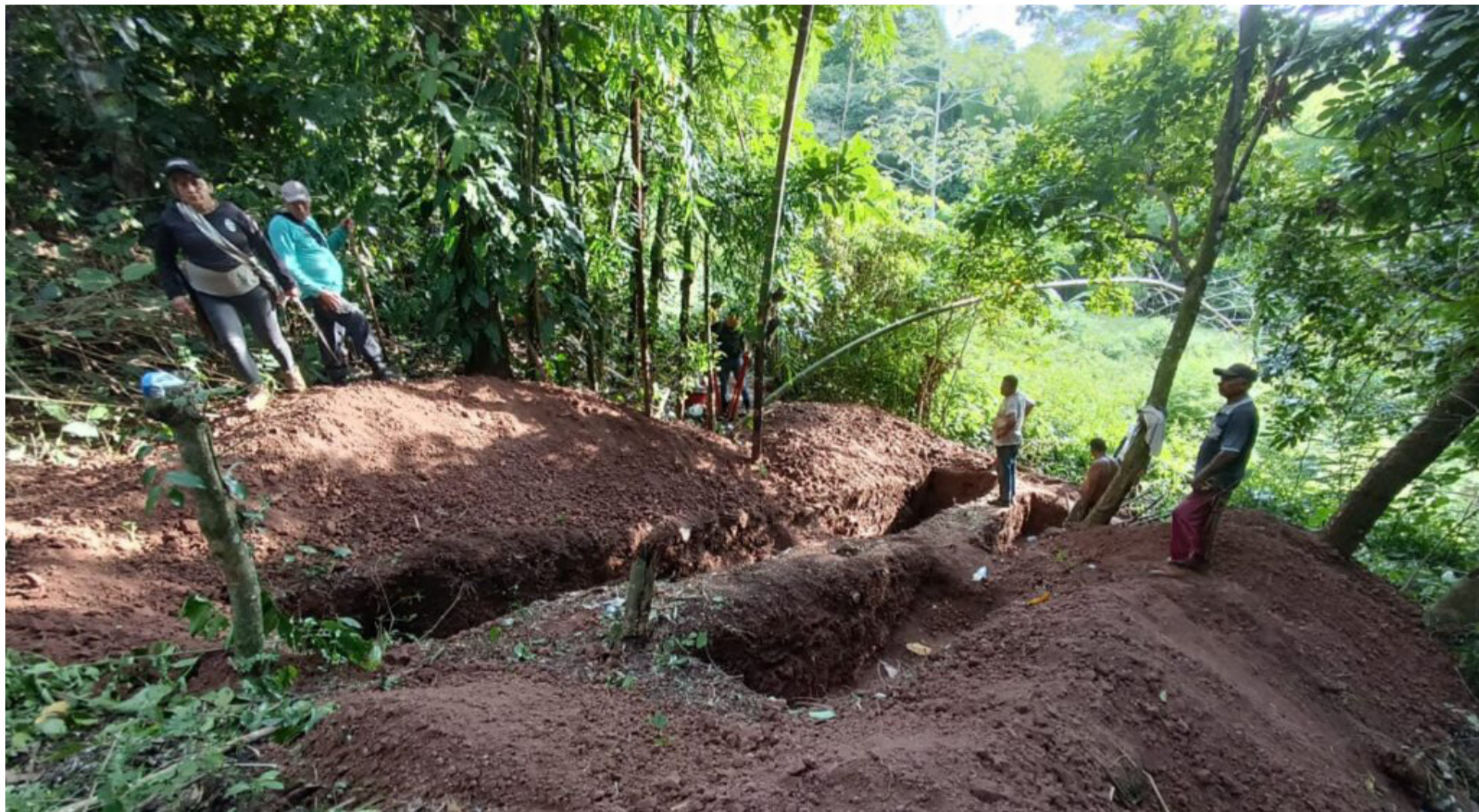
La Ubpd realizó varias jornadas de trabajo con alcaldes, secretarios de Gobierno municipal, personereros y presidentes de Juntas de Acción Comunal.