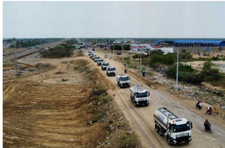
Los actores abordaron la problemática relacionada con la falta de pólizas y procesos contractuales fallidos.

Finalmente, se resaltó que la Ungrd debe llevar la información sobre el inicio del proceso de contratación, para lo cual remitirían el link de publicación en el Sistema Electrónico de Contratación Públi-