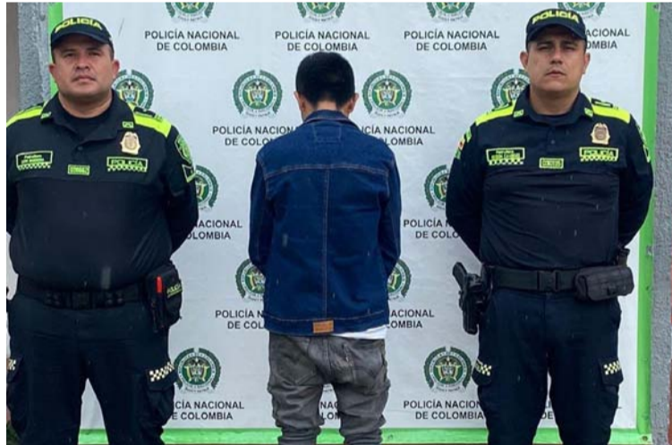
El capturado debe responder por el delito de falsedad para obtener prueba de hecho verdadero.

La Policía Nacional de La Guajira reitera su compromiso con la seguridad