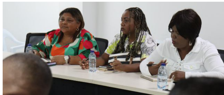
Se logró socializar la oferta y brindar asesorías para el empoderamiento de las comunidades negras.