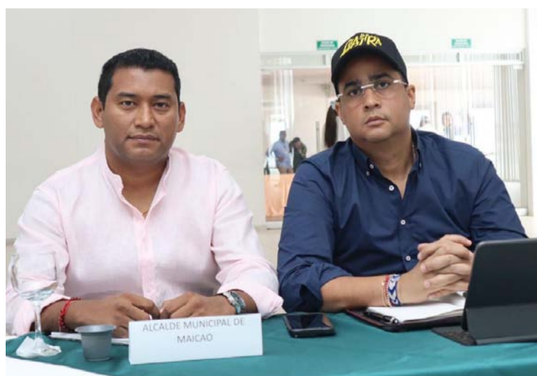
El proyecto será ejecutado por Esepgua en un plazo de 10 meses.

En el desarrollo del Comité Técnico Departamental de La Guajira, se aprobó el proyecto de ampliación del alcantarillado sanitario que beneficiará a tres mil familias residentes en los barrios Flor del Cañahuate, Miguel Lora, La Armonía y Nazareth, en el municipio de Maicao.