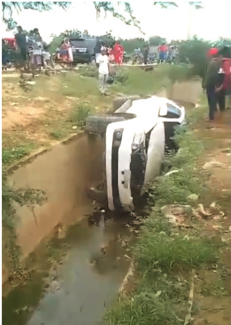
El conductor que no ha sido identificado fue llevado a un centro asistencial para recibir atención médica.

Un hombre que conducía un vehículo tipo camioneta Toyota Fortuner de color blanca, resultó con lesiones leves luego de volcarse y caer en una zanja en el barrio Aipiama en el casco urbano del municipio de Uribia.