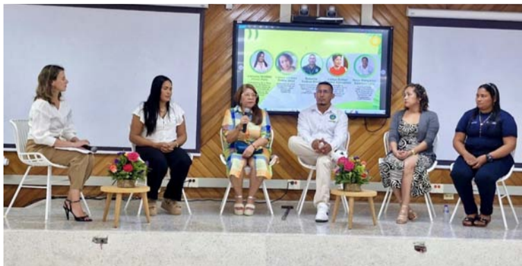
En este espacio, participaron líderes de las cooperativas de pequeños productores y agro empresarios.

Durante el evento, realizado en la ciudad de Santa Marta, pequeños productores, expertos en comercio internacional y líderes sociales de la Zona Bananera visibilizaron la urgente necesidad de acordar con los compradores europeos un precio justo para la fruta, con el fin de proteger la conti-