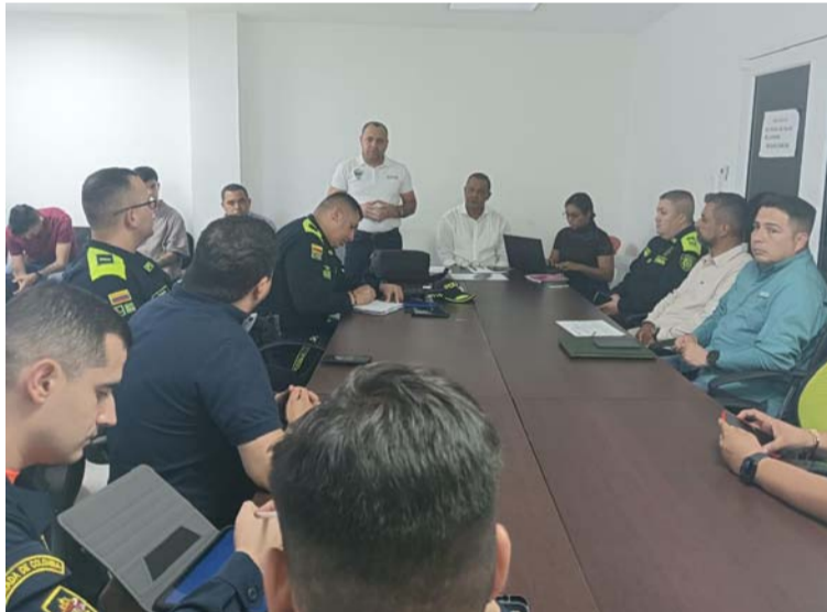
La intervención no se limitará solo a Dibulla, sino que también se extenderá a Palomino y su zona hotelera.

Montero Molina expresó su profunda preocupación al respecto, manifestando