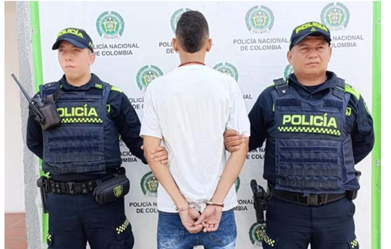
En la requisita se le halló en su poder un arma de fuego tipo pistola con proveedor y cartuchos.

La Policía Nacional reafirma su compromiso con la seguridad de los ciudadanos y continúa con los operativos para combatir cualquier actividad delictiva en la región.