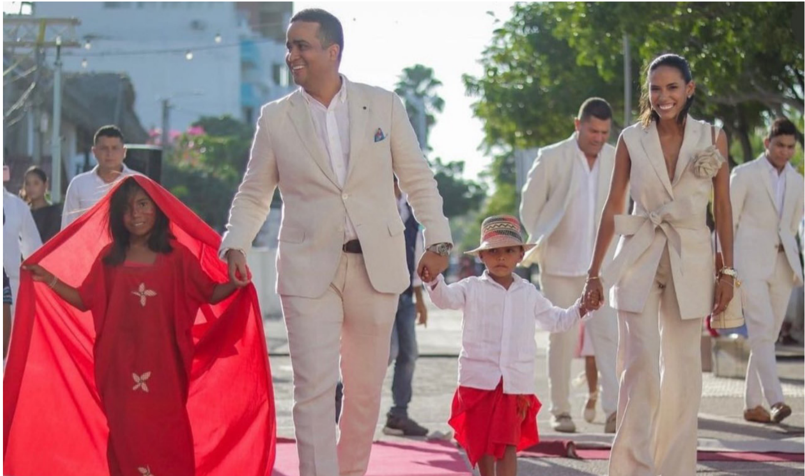
El gobernador Jairo Aguilar expresó su reconocimiento a la comunidad por confiar en su gestión de Gobierno.