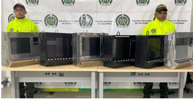
Los elementos incautados fueron puestos a disposición de la Dirección de Impuestos y Aduanas Nacionales.

En un operativo reciente, se llevó a cabo la incautación de seis máquinas tragamonedas conocidas como 'traga billetes', em-