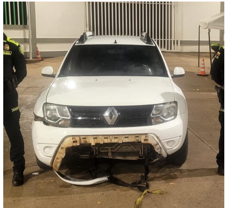
La camioneta fue encontrada abandonada en la zona rural de la vereda Los Remedios, en Albania.