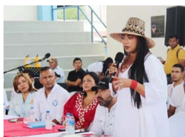
Martha Peralta, Senadora de la República.

Tal como quedó pactado en la primera mesa técnica realizada en el municipio de Uribia el pasado 30 de agosto, este lunes 7 de octubre, la senadora Martha Peralta lideró en Manaure un nuevo encuentro para revisar los avances de los compromisos y darle solución a la problemática de fluctuaciones de energía en estos municipios del norte de La Guajira.