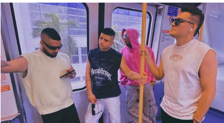
La expectativa por el lanzamiento es grande en el público juvenil que es seguidor de este nuevo sonido.