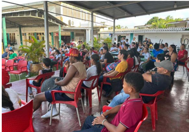
Dos veces por semana son convocados a la capacitación y se utiliza la lúdica como elemento pedagógico.

El evento está programado para el mes de noviembre próximo pero no se ha definido fecha, confiando con la generosidad