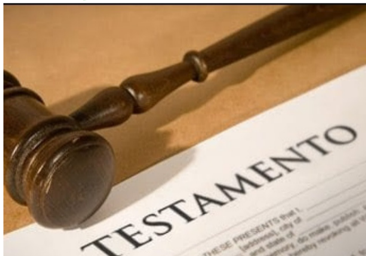
Lo adecuado para repartir y liquidar una herencia, es mediante conciliación que se lleve a cabo en una Notaría.

Por último, relacionar los gastos, que conlleva de manera global, el trámite de herencia, ante notaría, que resultan en extremos, mucho más breves y menos costosos, para los herederos en conjunto, si