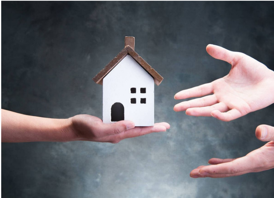
El mejor legado que padres pueden dejar a sus herederos, es la educación y moralidad.

No ocurre lo mismo cuando a los hijos le patrocinan derroches, mantienen en estado de vagancias y desorden, desertando y desaprovechando oportunidad de estudios académicos, ajeno a actividades y servicios laborales, con predominio de indisciplinas y alteraciones personales, sin controles y con complacencias, de pretensiones absurdas, para satisfacer egos y vicios injertados, gozar de un hogar, que toleran berrioches e irrespeto por no contrariar desmanes de sus bebés adultos, que aún dependen de la manutención y financiación para diversión de los padres, criando a un holgazán, haragán y zángano; en tales circunstancias, terminarán torcidos en desacierto, por malos comportamientos y com-