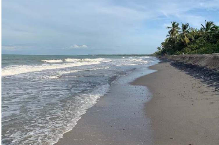
Se recomienda a embarcaciones de poco calado, consultar con las Capitanías de Puerto antes de zarpar.

El pronóstico del tiempo que entregó el Sistema de Alertas Tempranas (SAT) de Corpoguajira, señalaba que ayer lunes en horas de la mañana predominaría el tiempo seco en casi toda La Guajira, ex-