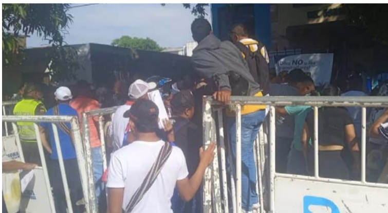
Se estima que 4.974 ciudadanos estarán habilitados para votar en estas elecciones.

Finalmente, se destaca que, una vez se publique el censo electoral de estos comicios, los ciudadanos podrán consultar su lugar de votación en la página web de la Registraduría Nacional del Estado Civil, www.registraduria.gov.co .