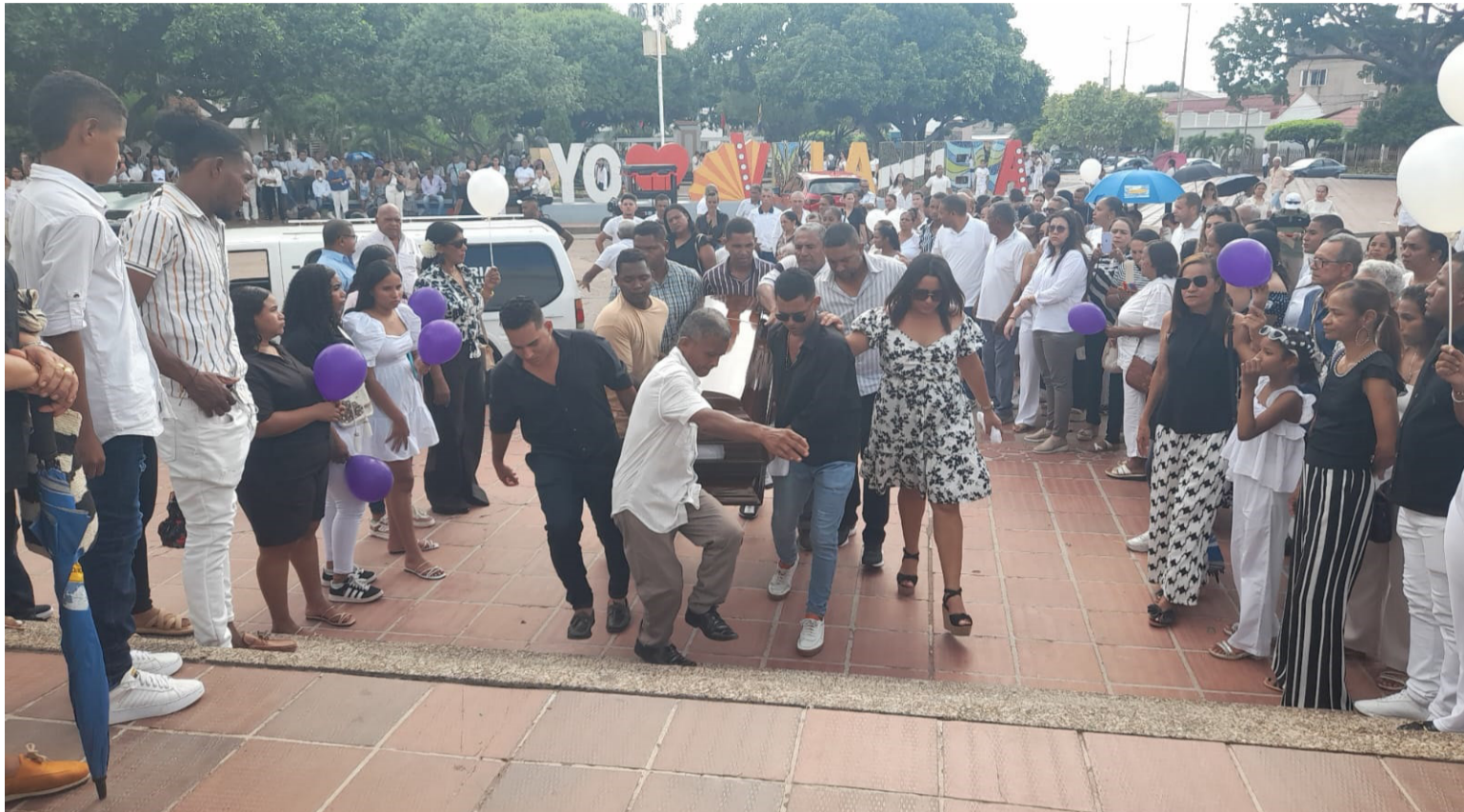
A las 2 de la tarde el cuerpo de la joven fue llevado hasta la Iglesia Santo Tomás en donde se celebró una eucaristía.

El caso ha impactado no solo a la comunidad universitaria, sino a toda la población de Villanueva, que se encuentra consternada por la violencia con la que fue arrebatada