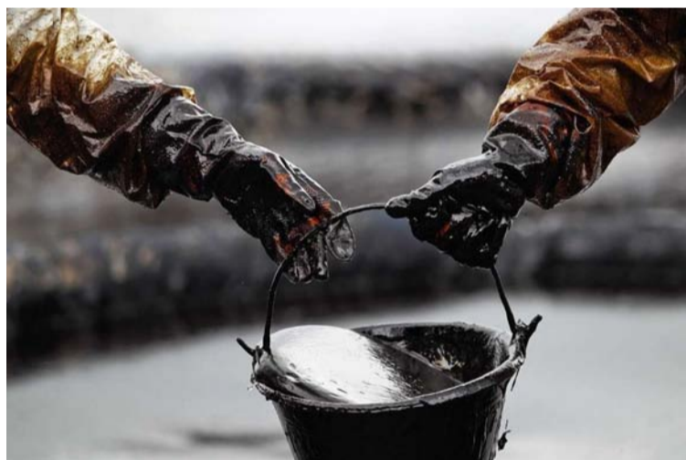
En la COP 28, el presidente Petro fue más lejos aún, al firmar el Tratado de no proliferación de combustibles fósiles.

El Gobierno Petro se ha dejado llevar por el voluntarismo renunciando pronto a los hidrocarburos, dándole la espalda, cuando el resto del mundo se limita a tomar distancia.