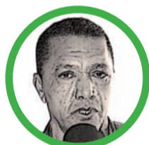
Por Rafael Humberto Frías Mendoza

No se puede criticar constructivamente a un alcalde y a su Gobierno con odio y rencor.