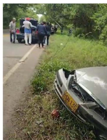
Un ternero causó el siniestro que dejó heridos.

dades competentes para conocer mayores detalles del siniestro vial.