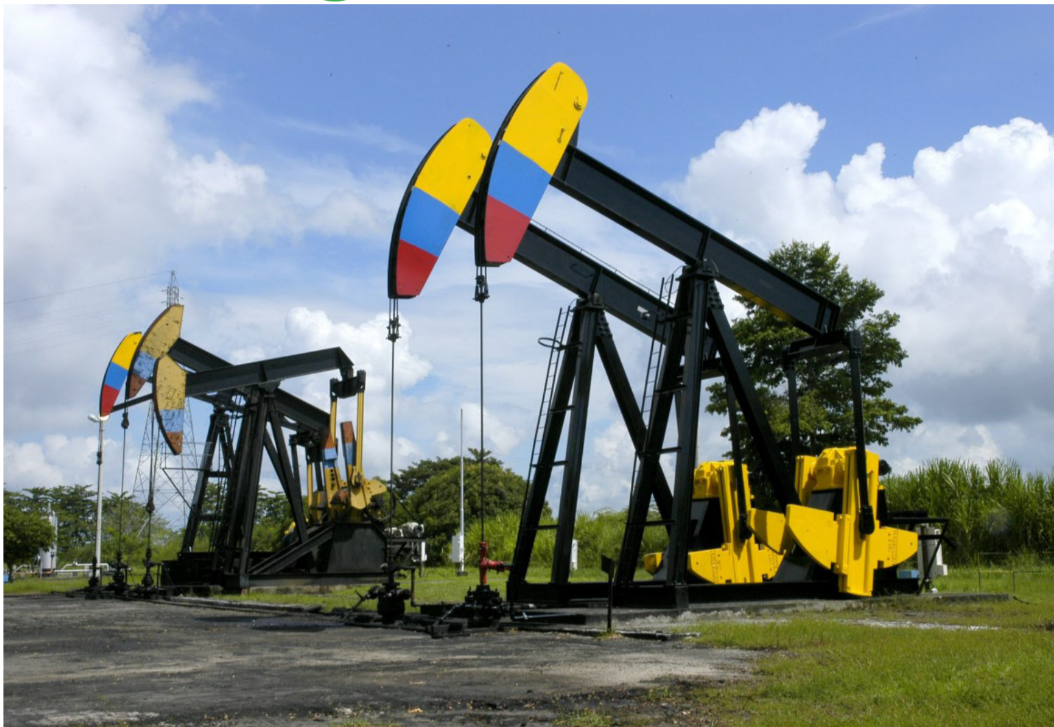
"Dejar de firmar nuevos contratos de exploración no tiene ningún efecto en la reducción de CO2 a nivel global".

Y, tal como quedó consignado en la Declaración final de la COP 28, que tuvo lugar el año anterior en Dubai, se le pide a las partes que contribuyan 'con una lista de acciones climáticas, de acuerdo con sus circunstancias nacionales' y 'acelerar la Transición energética sostenible, asequible e inclu-