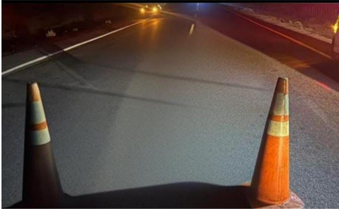
El hombre se encuentra en la morgue de Medicina Legal de Maicao, como Cuerpo CNI.

El hallazgo se registró la madrugada del domingo en el kilómetro 65 de la vía Maicao - Riohacha, en donde inicialmente se había conocido que un vehículo lo había arrollado, pero al verificar notaron