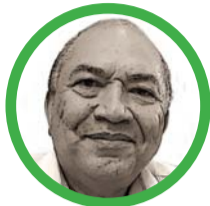
Por Amylkar Acosta Medina