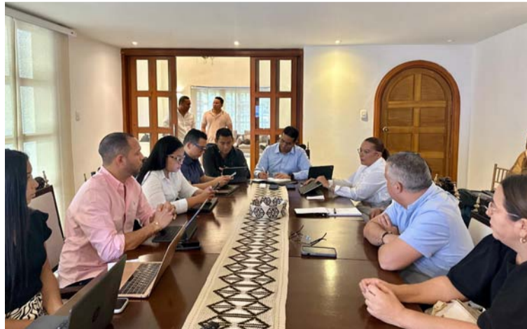
Estos proyectos reflejan el compromiso de la Gobernación con el bienestar de las comunidades wayuú.

Entre los proyectos aprobados destaca la construcción de la línea de conducción que llevará agua desde la Planta de Tratamiento de Agua Po-