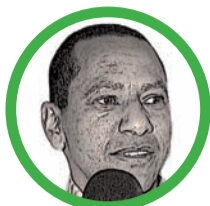
Por Jorge Nain Ruiz Ditta