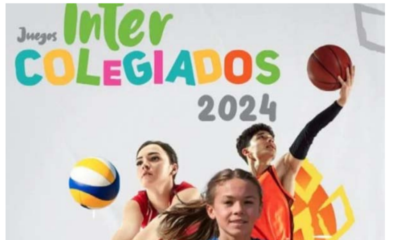
Los Juegos Intercolegiados son un programa integral que promueve el desarrollo deportivo de niños y jóvenes.

se invita a todos los guajiros a apoyar a los atletas y a disfrutar de este importante evento deportivo.