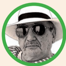
Por José Manuel Aponte Martínez

Los restantes alcaldes, sin embargo, enfrentan la necesidad de rendir cuentas y contratar a los mejores juristas para demostrar que su elección se realizó conforme a la normativa. El tiempo dirá.