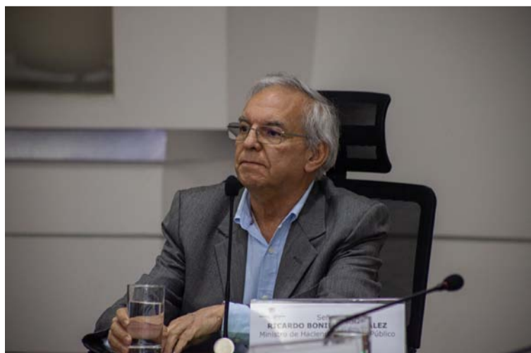
Este debate sobre el PGN y la ley de financiamiento es un reflejo del tipo de país que se desea construir.

El PGN para 2025 está calculado en $523 billones para gastos y $511 billones en ingresos, por lo cual hay un proyecto de ley de financiamiento que ha generado un intenso debate.