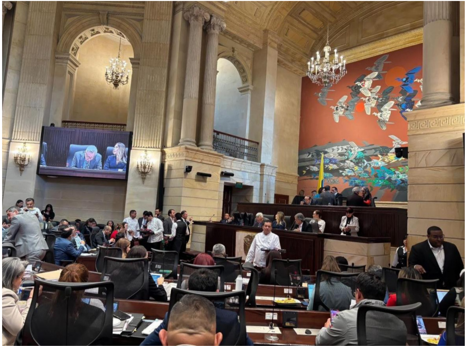
La situación actual pone en evidencia la complejidad de gestionar finanzas públicas en un entorno económico incierto.

El PGN para 2025 está calculado en $523 billones para gastos y $511 billones en ingresos, por lo cual hay un proyecto de ley de financiamiento de $12 billones que ha generado un intenso debate sobre la viabilidad de estas cifras y su impacto en la economía nacional.