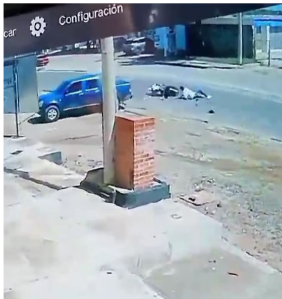
El hecho quedó registrado en videos de cámaras de seguridad de la zona.

Dos jóvenes que se desplazaban en una motocicleta resultaron lesionados en un accidente de tránsito cuando al parecer una camioneta hizo un cruce hacia la izquierda sin percatarse que estas personas venían en sentido contrario, originando que impactaran contra la parte trasera del vehículo.