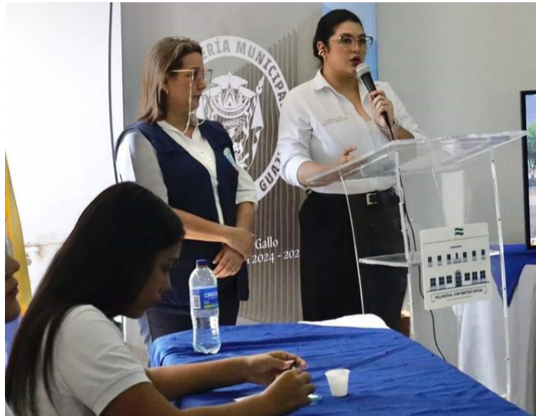
El evento es un paso más hacia el fortalecimiento de la voz estudiantil.

Durante el encuentro, los estudiantes, acompañados por orientadores