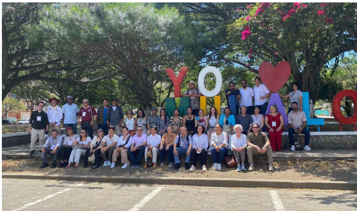
La Mesa permitió la recolección y el análisis de las necesidades de los museos.

voz por el fortalecimiento de los museos del Departamento.