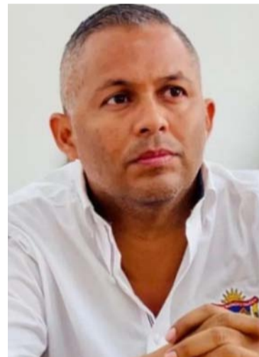
Jaime Luis Buitrago García, alcalde de Uribia.

Sobre el tema no se pronunció la autoridad municipal, por lo que considera el Tribunal, que en efecto, ha actuado de forma negligente y contumaz respecto de la resolución definitiva de las dificultades advertidas en el municipio, al menos, en el componente de agua potable. En ese orden, se tiene por acreditado el ingrediente subjetivo, se indica en el documento del Tribunal.