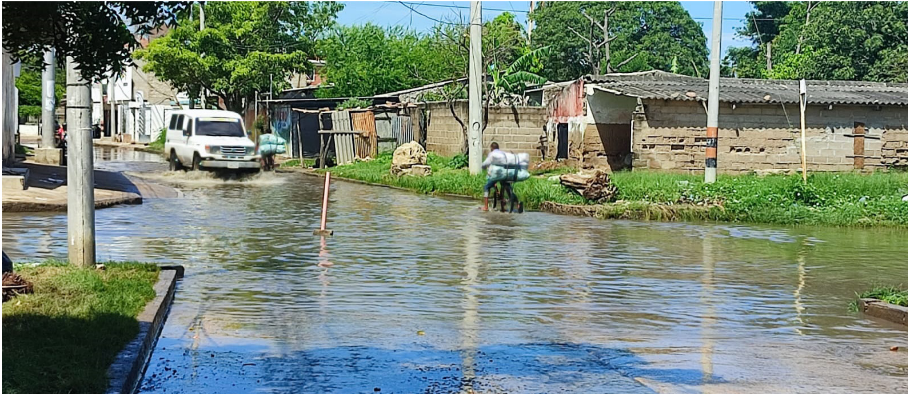
Comunidad llama a las autoridades a intervenir este sector, considerando que son varias las instituciones educativas ubicadas en la zona.