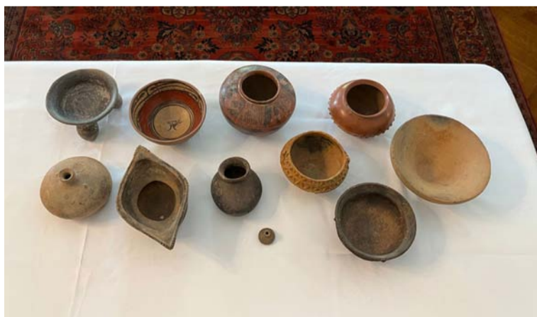
La repatriación de estas piezas culturales marca un avance en la protección del patrimonio colombiano.

El Gobierno nacional, a través del Ministerio de Relaciones Exteriores, autorizó la repatriación de 115 bienes culturales de