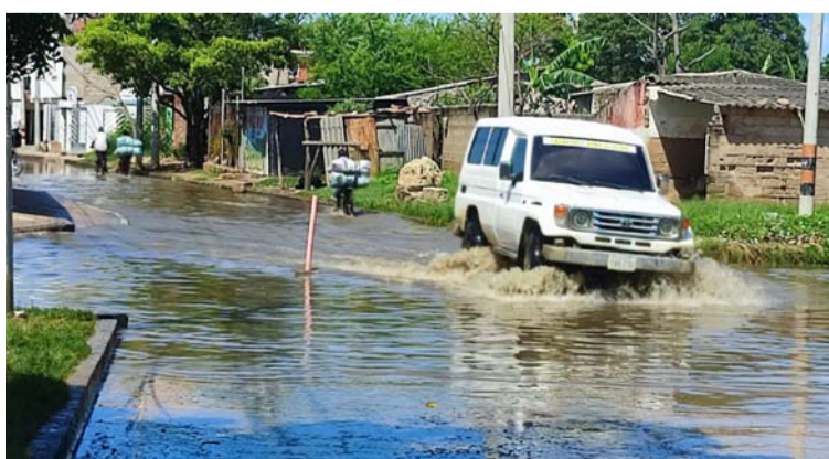
A sus 44 años de fundado el barrio 7 de Agosto no cuenta con un área de recreación para niños y jóvenes.

proporcionan los instrumentos de limpieza necesarios para sacar esa arena", expresó Ariel Corena Alemán.