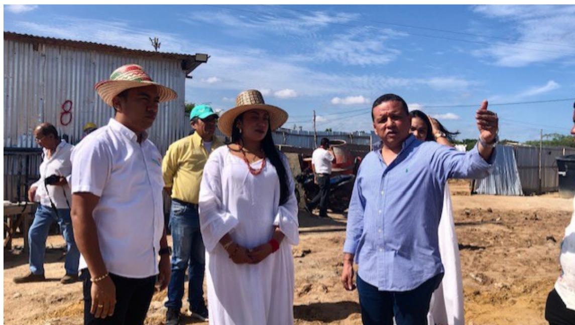
La obra se levanta en 6.000 metros cuadrados, con un enfoque diferencial.

La obra se levanta en 6.000 metros cuadrados, con un enfoque diferencial, y se centrará especialmente en el fortalecimiento de la ruta materno-perinatal con la misión de reducir los altos índices de mortalidad infantil y materna.