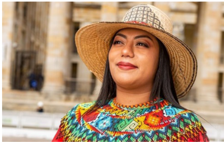
Explicó Peralta que mientras más incautaciones de droga se haga, ellos más atentan contra la sociedad civil.

también le ha formulado las críticas al ministro de Defensa, a quien le ha