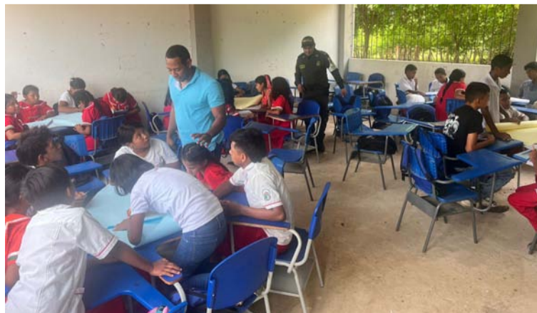
La iniciativa involucró a estudiantes con la participación activa de los padres de familia y docentes.

La iniciativa no solo involucró a los estudiantes, sino que también contó con la participación activa de los padres de familia y docentes, quienes destacaron la relevancia de este tipo de espacios para el desarrollo integral de los menores. Durante