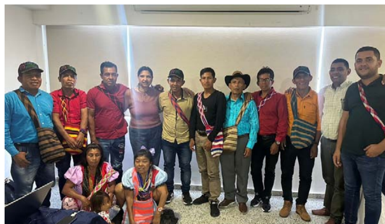
Unas 1.015 familias se beneficiarán, lo que fortalecerá su seguridad alimentaria y autonomía territorial.