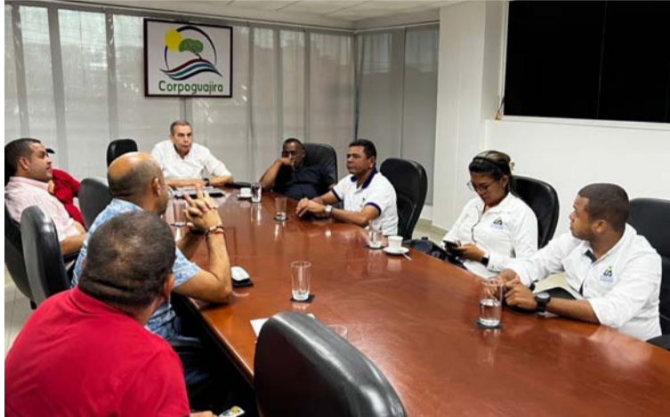
Los actores involucrados dialogaron sobre las posibles soluciones a esta problemática.

Estuvieron presentes funcionarios de la Corporación, de la Administración Distrital, Interaseo y varios concejales del Dis-