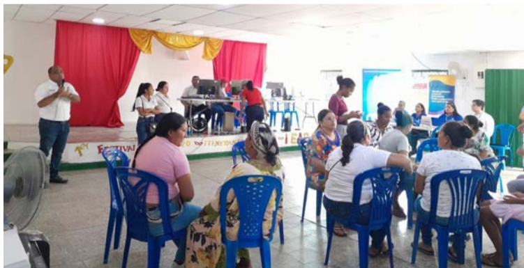
Unas 250 personas se vieron beneficiadas con la jornada 'Personería al Barrio' que atendió población vulnerable.

Los habitantes pudieron acceder a las diferentes ofertas institucionales de Acnur, Save The Children, Funpa, Registraduría, Migración Colombia, Alcaldía de Maicao con