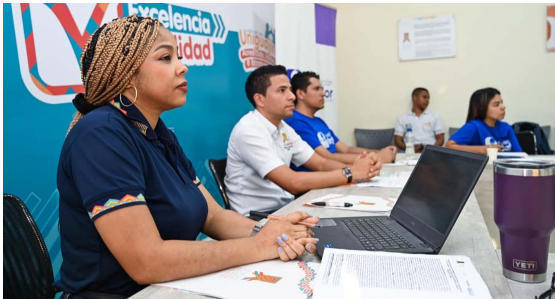
La primera iniciativa de este acuerdo es la implementación de un proyecto de piscicultura sostenible en la comunidad indígena de Jieyusirra.