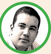
Por Luis Antonio Gómez Peñalver