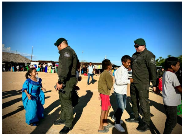
La campaña es parte de los esfuerzos de la Policía para fortalecer los lazos con las comunidades indígenas.

De esta forma se destaca el compromiso con el bienestar de las comunidades. Esta brigada médica es un paso más para garantizar que los habitantes de Uribia, especialmente los más jóvenes, reciban la atención que merecen.