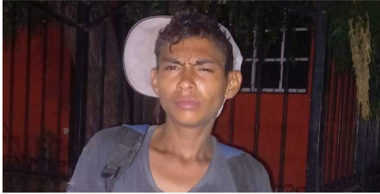
La víctima presentaba varias heridas con arma cortopunzante en partes de su cuerpo.

Esta persona, de quien hasta el momento se sabe que era habitante de calle, fue encontrada sin vida