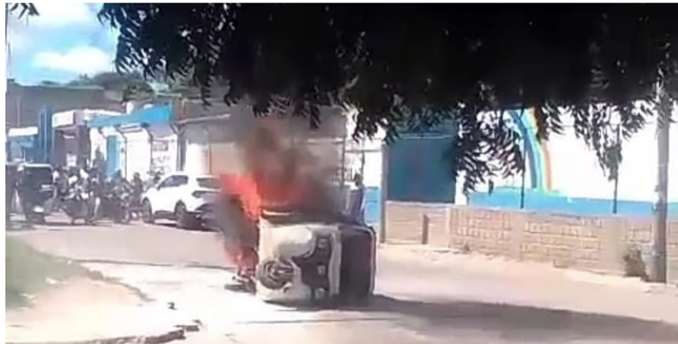
El motocarro se incendió al parecer por un cortocircuito. La pérdida fue total.

El hecho se registró la mañana de ayer viernes 27 de septiembre en la carrera 12 entre calles 16 y 17 del municipio fronterizo de Maicao, en donde algunas personas trataron de cal-