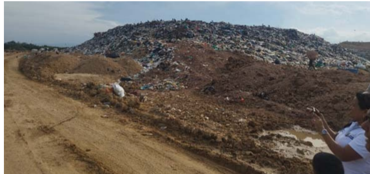
Habitantes de 19 comunidades denuncian que se han sentido afectadas por la contaminación.

las comunidades wayuú, señaló que otro de los aspectos que les afecta es la mala ubicación de las fosas. "No hay un drenaje adecuado a la topografía del relleno sanitario, lo que ha causado que las aguas lluvias y escorrentías las conducen a los diferentes arroyos de esta zona que provienen del relleno sanitario que recogen los residuos y quedan estancados en ellos, convirtiéndolos en verdaderas fosas letales de contaminación y que afecta los jagüeyes y pozos de agua de las comunidades", dijo