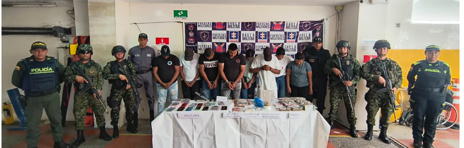
Estas personas luego de proceder a sus respectivas aprehensiones, fueron dejadas ante la Fiscalía URI en turno.

La operación se realizó en diferentes sectores de