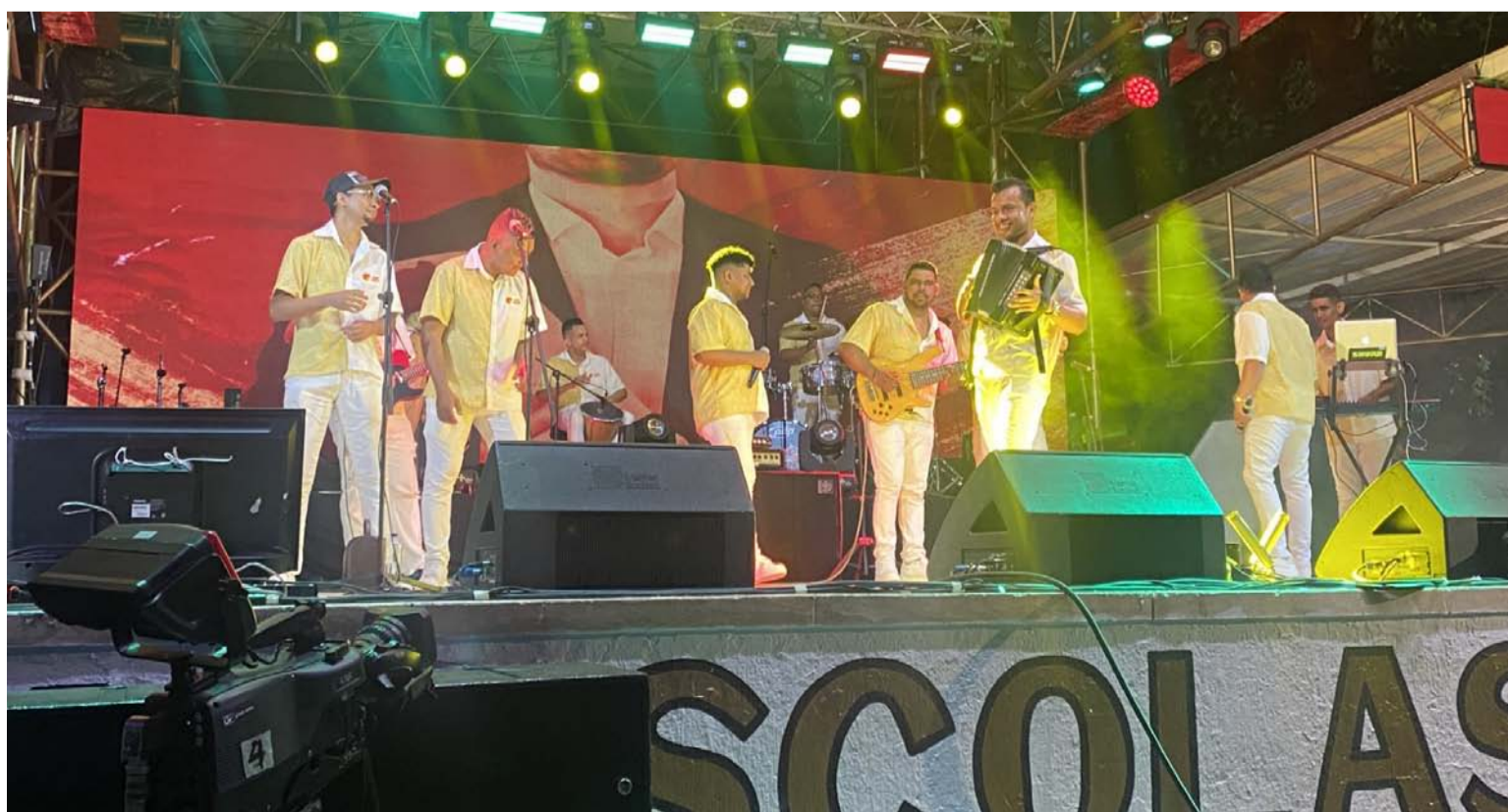
Concursantes durante su participación en el Festival Cuna de Acordeones, versión 46, realizado en Villanueva.

Colofón: Este domingo 29 de septiembre cierra con broche de oro el 41 Festival Folclórico, Agrícola y Minero y las fiestas patronales de San Miguel Arcángel de La Jagua de Ibirico, Cesar, que este año se dio el lujo de presentar nada menos que a Silvestre Dangond, 'Gusi' y la Banda del 5 en el estadio La Villa Deportiva. Allí nos vemos porque no es fácil que en otro pueblo del Cesar presenten a Silvestre y su espectáculo único e irreplicable.