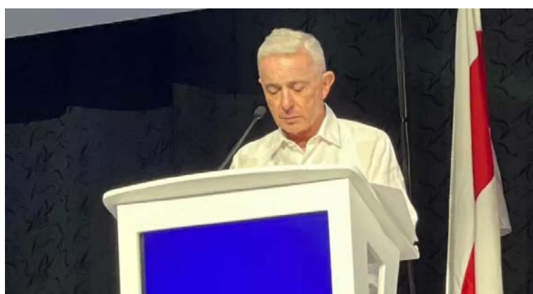
Uribe afirmó que la reforma tributaria está diseñada para "marchitar la inversión privada y consolidar la pública".

En su discurso, Uribe también miró hacia las elecciones de 2026, mencionando la urgencia de que las candidaturas ganen «afecto y confianza popular». Durante este pasaje lanzó una frase "Pienso que mi comunicación debe contribuir a construir credibilidad, no a producir la noticia morbosa de la ofensa".