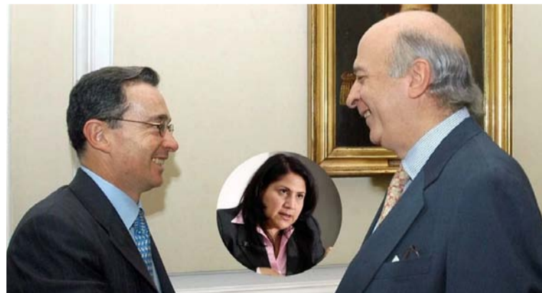
La Corte ratificó la condena a dos exministros y un exdirector del Dapre por cohecho y por dar y ofrecer.

La Sala consideró que la declaración de Yidis Medina y todos los hechos que sirvieron a manera de indicios, "acreditan que los tres acusados, por virtud de la mediación de un acuerdo, actuaron de consuno, con división de trabajo y que el aporte de cada uno fue significativo en orden a la obtención del ingrediente subjetivo, tanto que fue solo de esa manera que se logró que por la acción y omisión respectivas de los dos congresistas, el proyecto