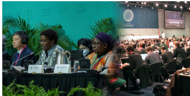
En la COP16 estarán presentes empresas guajiras que son prósperas siendo amigables con el medio ambiente.

“En la Corporación estamos listos para participar en este gran evento ambiental. En este encuentro estaremos junto a las demás corporaciones con varios negocios verdes y en algunos conversatorios