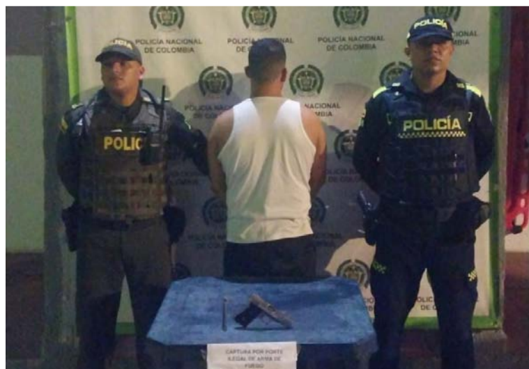
Uniformados del cuadrante en servicio capturaron en flagrancia a este hombre de 28 años de edad.

El Departamento de Policía Guajira en la ofensiva nacional contra los delitos, capturó en las últimas horas a un ciudadano con un arma de fuego tipo pistola con tres cartuchos calibre 380 milímetros.