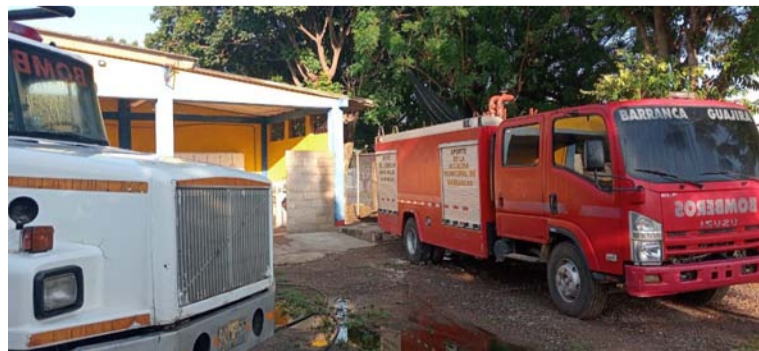
Denuncian que no tienen un salario digno ni seguridad social, y tampoco las condiciones mínimas de trabajo.

En estos momentos el Cuerpo de Bomberos voluntarios de Barrancas no tienen ningún ingreso de sustento para sus familias, a pesar de tener firmado un convenio con la Alcaldía municipal para el giro de la sobretasa bomberil. Por todos estos acontecimientos, invitaron al alcalde municipal para que haga los giros.