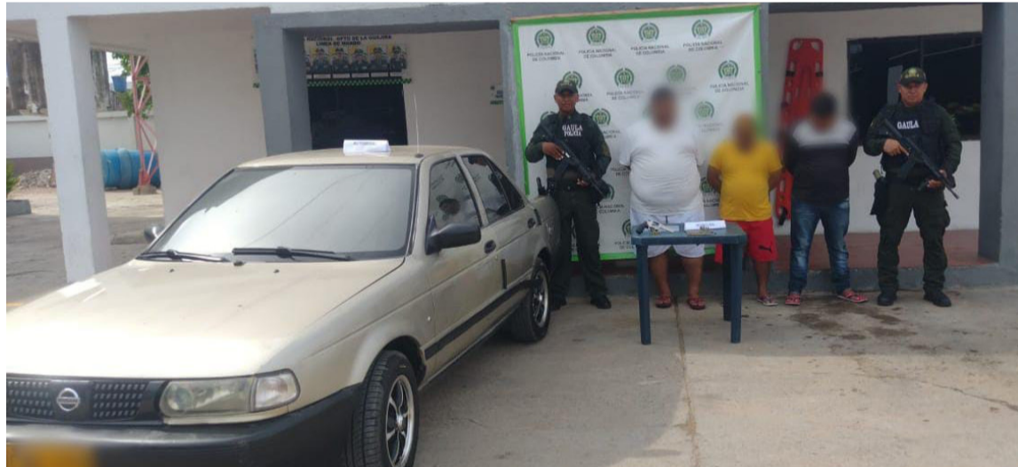
Los capturados y los elementos incautados fueron puestos a disposición de la Fiscalía.

Los capturados y los elementos incautados fueron puestos a disposición de la Fiscalía General de la Nación, por el delito de tráfico, fabricación y porte de armas de uso