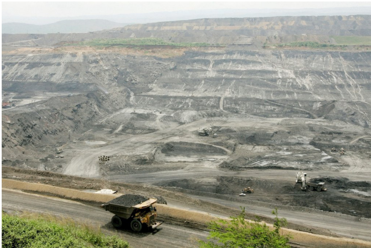
Cerrejón ejecutó una obra por impuestos en el acueducto de Riohacha, por encima de los 5 mil millones de pesos.

Esta solicitud, liderada por el presidente del Cerrejón, en Colombia dio sus primeros frutos, como es la expedición del citado decreto ley. El alto ejecutivo de la empresa Car-