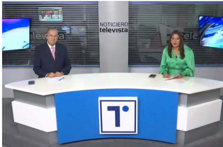
Telecaribe lamenta que la relación con Televista Innova S.A.S. haya llegado a este punto.

septiembre de 2024, a través de correo electrónico se le recordó a la representante legal de Televista Innova S.A.S., que el térmi-