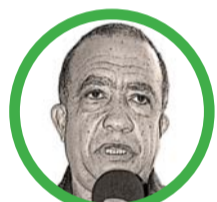
Por Martín Nicolás Barros Choles