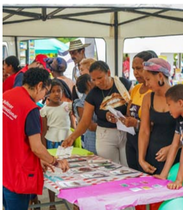
En la jornada se ofrecieron servicios médicos.

"Nuestro objetivo es brindar apoyo integral a las comunidades rurales de Riohacha y Dibulla, fortaleciendo su resiliencia a través de servicios gratuitos que promuevan la salud y el bienestar co-