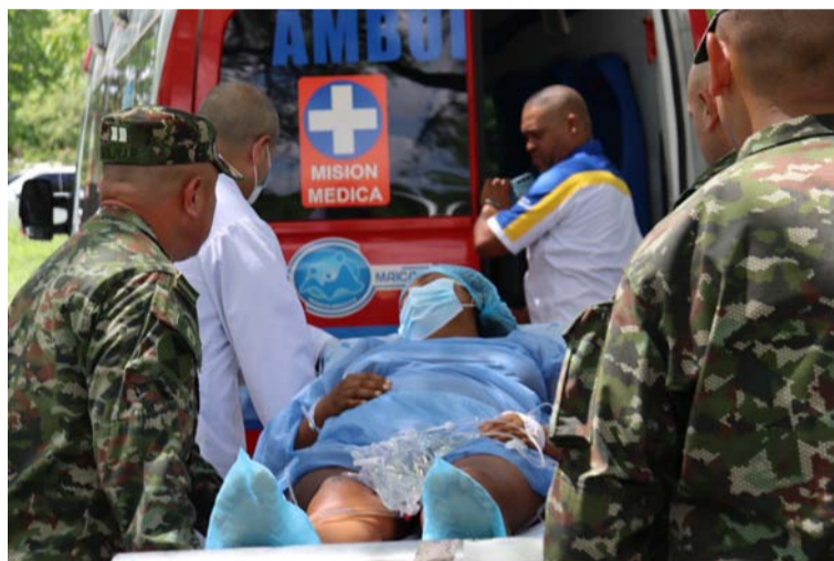
El gobernador Jairo Aguilar destacó la importancia de la rápida intervención del Ejército y del personal médico.

La delicada situación fue informada inicialmente por la Epsi Anas Wayuu, que emitió una alerta ante el estado crítico de las dos mujeres, afiliadas a su sistema, quienes presentaban alto riesgo obstétrico. Ante la imposibilidad de