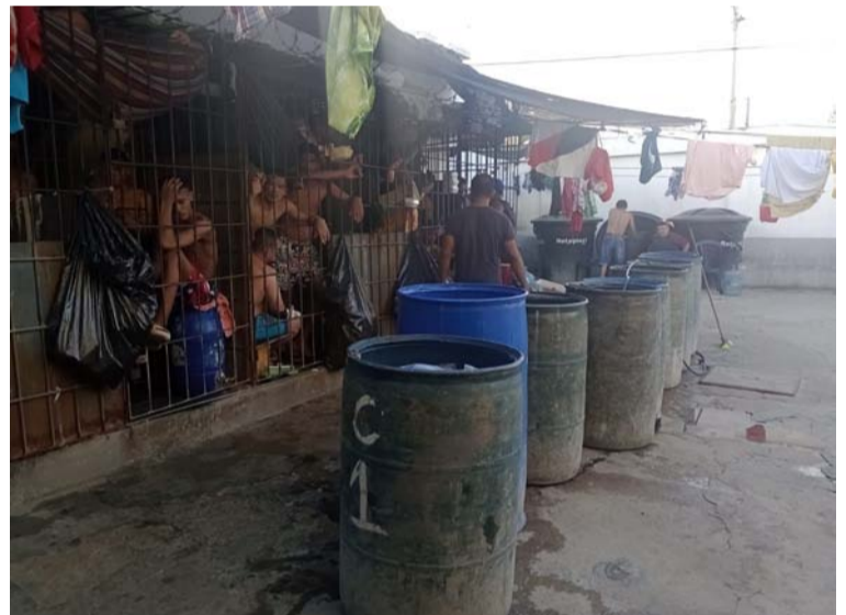
Los privados de la libertad denunciaron que en dichos calabozos hay detenidos con enfermedades crónicas.