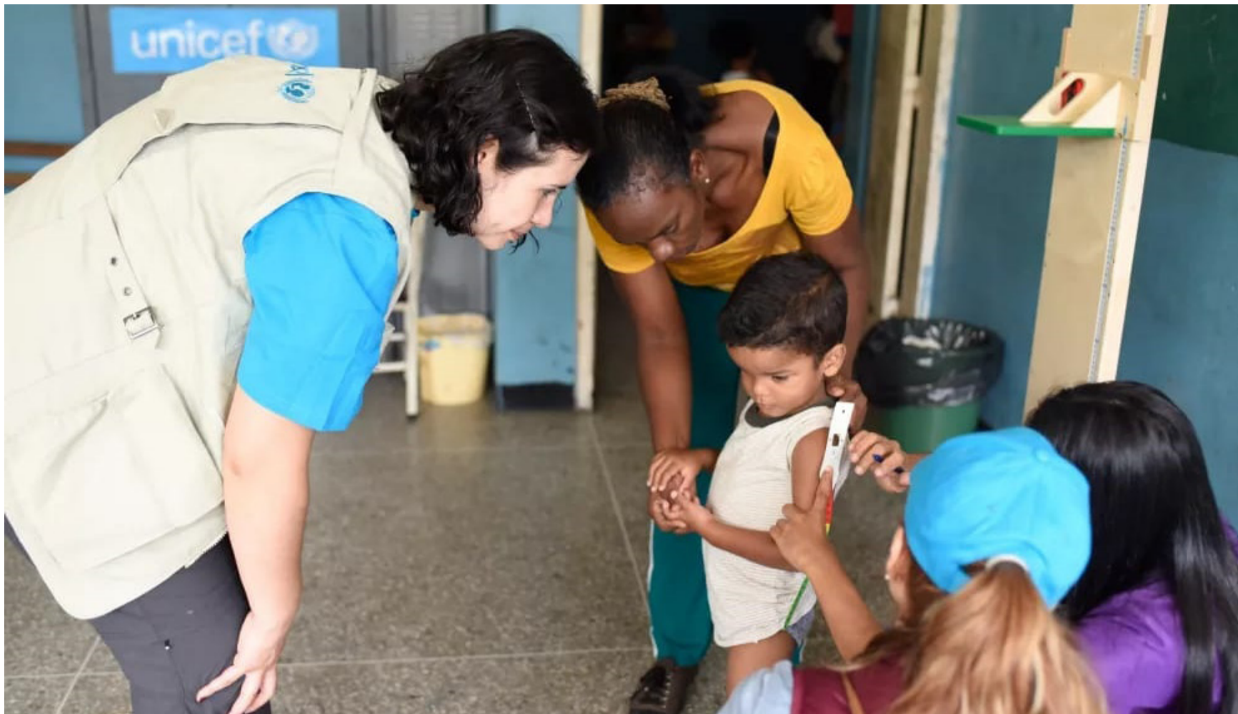
La educación es un derecho para toda la población y un bien público de calidad, garantizado en equidad e inclusión social.