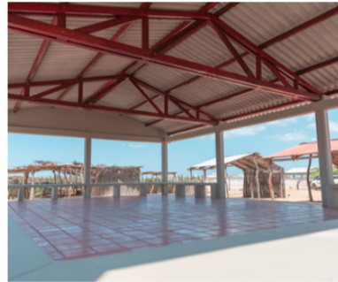
Las tres enramadas cuentan con una extensión de 106 metros cuadrados cada una.

una extensión de 106 metros cuadrados cada una. Estas estructuras tendrán un uso multifuncional, utilizadas para armonizaciones culturales y reuniones comunitarias.