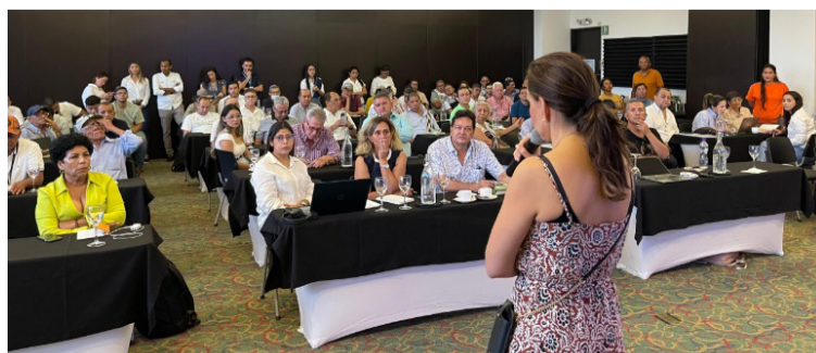
Los propietarios interesados en vender predios podrán asistir sin previa inscripción.

Finalmente, cabe resaltar que estas dos primeras ruedas de negocios en La Guajira refuerzan el compromiso del Gobierno con el desarrollo rural y la justicia social en Colombia. La UGT-Guajira continúa enfocada en la adquisición de propiedades para mejorar la distribución de la tierra y apoyar a las comunidades vulnerables.