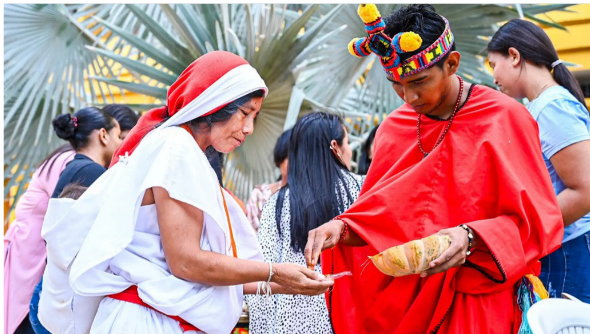
Nuestro quehacer docente exige comprender los alcances de este reconocimiento.

Esta visión de la interculturalidad, que reconoce a la naturaleza como sujeto de derecho, va