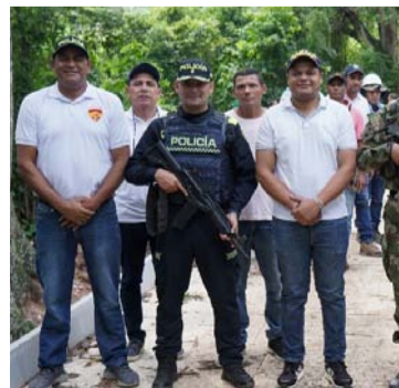
Habitantes podrán transitar sin preocupaciones.