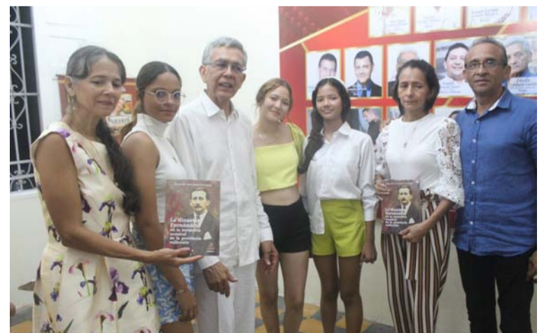
A la presentación del libro asistieron no solo invitados sino varias generaciones de los Fernández.