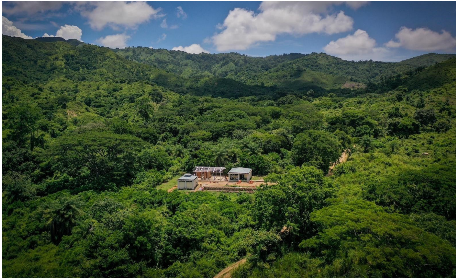
El Ffie ha llevado maquinaria y materiales por carreteras, ríos, montañas a lo más profundo de la geografía nacional.

Para la entrada en funcionamiento de los colegios, se requiere de un trabajo en equipo con las gobernaciones y alcaldías, rectores, maestros y la comunidad. La misión del Ffie consiste en entregar infraestructuras modernas y de calidad; las Enti-