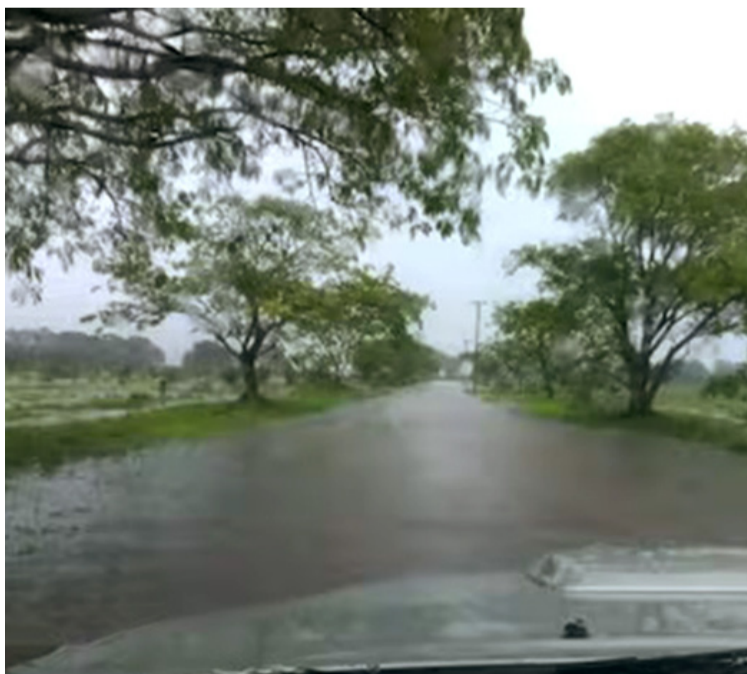
Entre jueves y viernes entrará a territorio colombiano la onda tropical 39, trayendo abundantes lluvias.

Es fundamental recordar que, al estar en septiembre, mes que suele estar tradicionalmente marcado por la actividad ciclónica en el Atlántico y el Mar Caribe. Esto sugiere que es posible la forma-