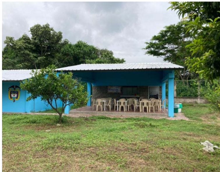
En La Guajira se invirtieron $4.196 millones y fueron beneficiados 7.701 niños, niñas, adolescentes y jóvenes.

dades Territoriales Certificadas (ETC), por su parte, deben aportar un predio propio y saneado para dicha construcción, realizar las obras de urbanismo y dotar el mobiliario.