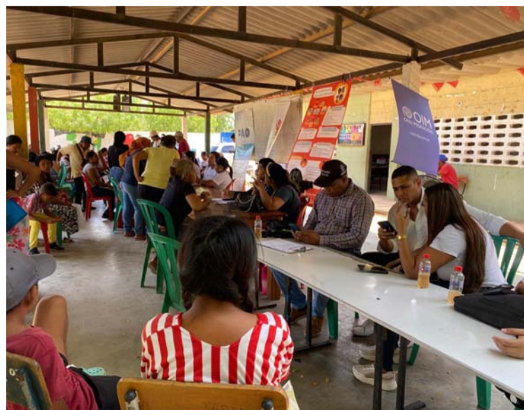
La actividad se desarrolló en la Institución Educativa Número 1 María Concepción Epinayu.