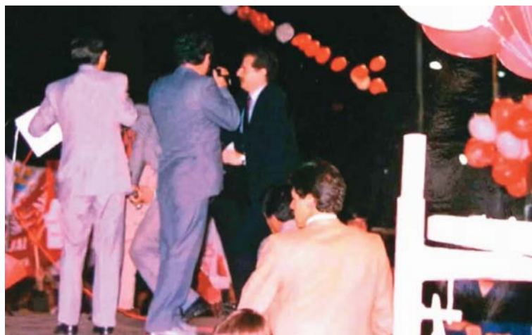
La trágica noche del 18 de agosto de 1989 quedó entronizada con el horrendo crimen de Luis Carlos Galán.

Ahí está parte del misterio de la muerte de Galán. 35 años del crimen y solo dos presos, el exdirigente Liberal Alberto Santofimio Botero y el exdirector del DAS, Miguel Maza Márquez. Si Galán sabía de los políticos que estaban detrás de su muerte, ¿Por qué la justicia ha sido tan pusilánime para esclarecer el homicidio y encerrar a los autores intelectuales que estuvieron detrás del magnicidio?