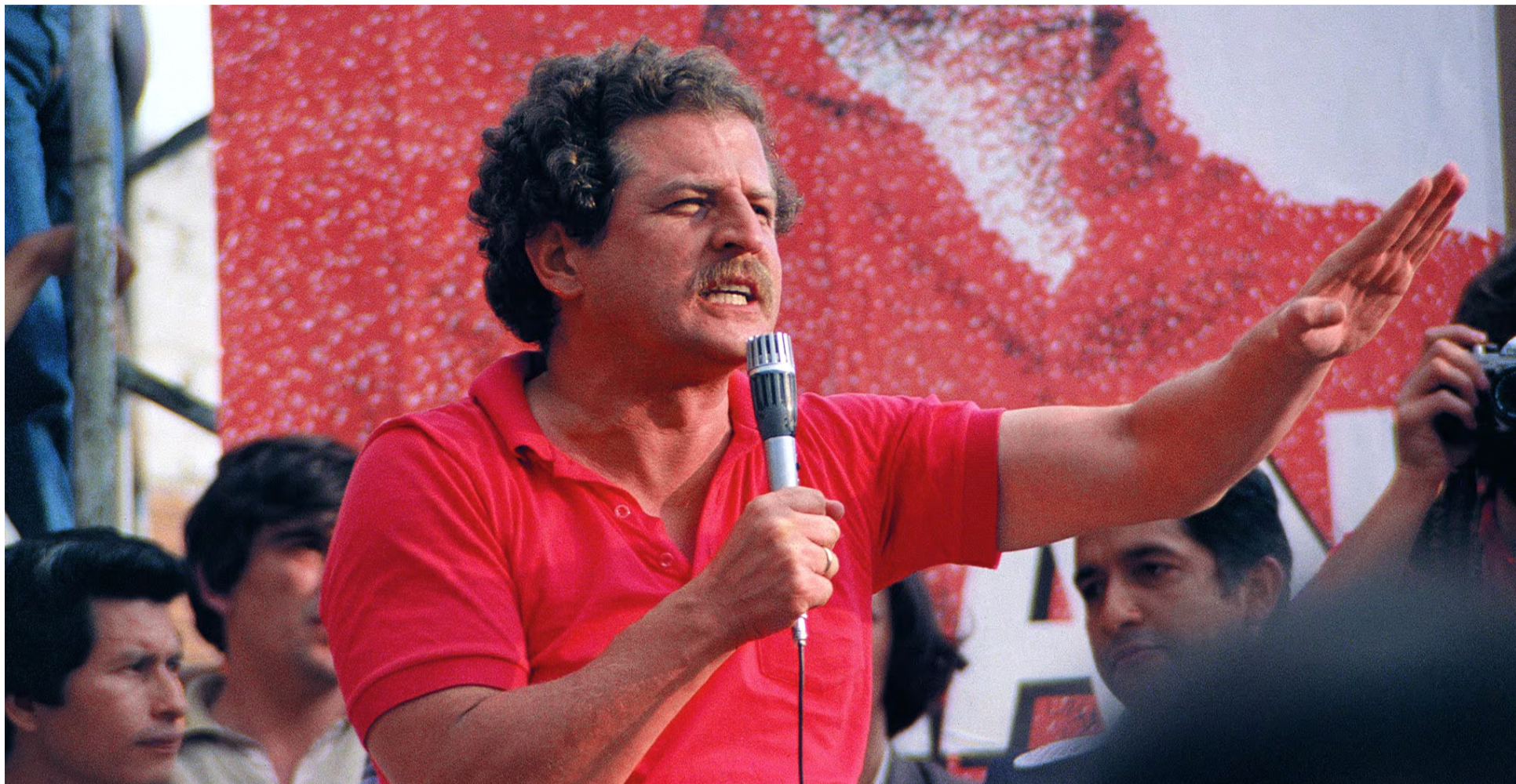
35 años del crimen y solo dos presos, el exdirigente Liberal Alberto Santofimio Botero y el exdirector del DAS, Miguel Maza Márquez.

La corrupción es más galopante y la violencia arrecia más