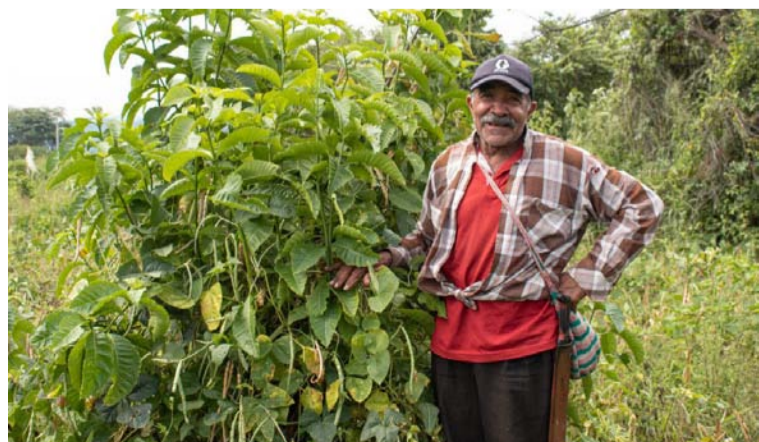
El propósito de los proyectos es impulsar la agricultura campesina, familiar, étnica y comunitaria.