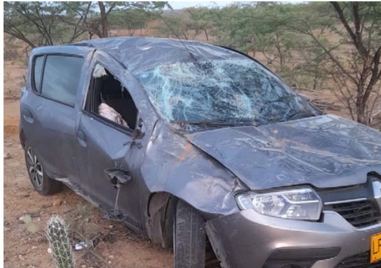
El vehículo quedó parcialmente destruido mientras la víctima fue llevada a un centro asistencial en Maicao.

El percance vial se registró en la carretera que de Uribia conduce hacia Cuatro Vías, a la altura del kilómetro 57, en donde el vehículo quedó al costado