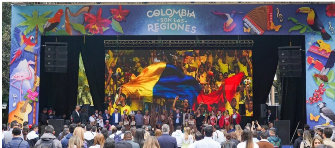
Los eventos culturales y deportivos constituyen un gancho para explotar el turismo.