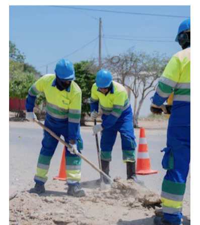
La empresa toma medidas contra la emergencia.