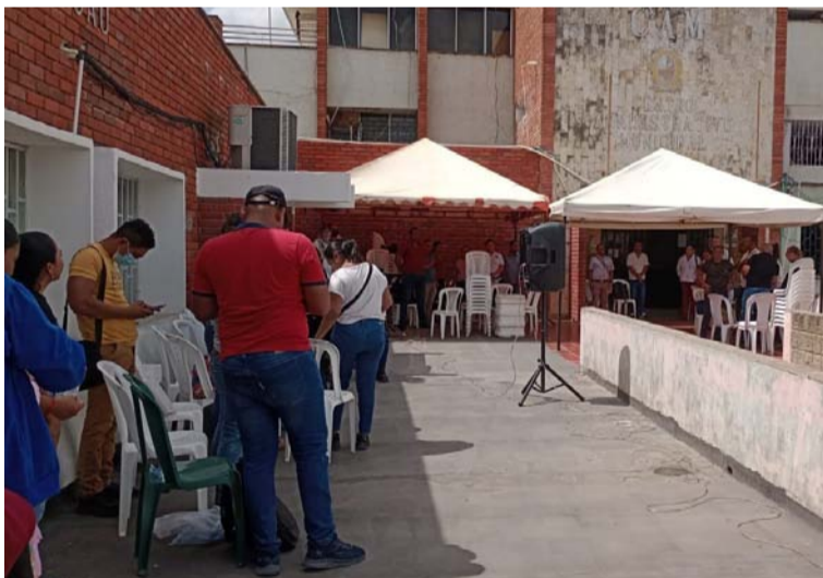
Lo docentes denuncian que pese a los diálogos sostenidos, no se tiene la solución a esta problemática.