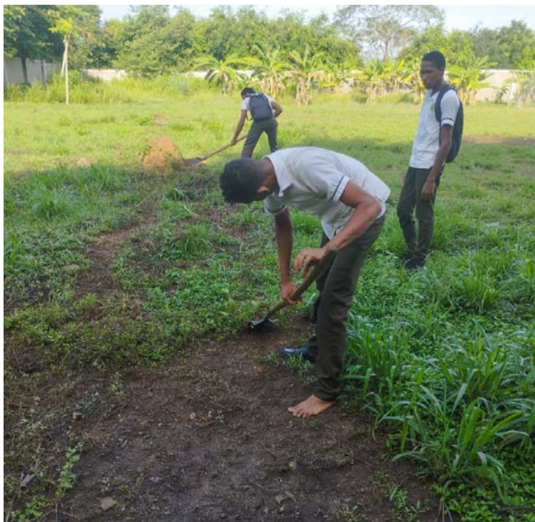
El objetivo es darle un cambio a este espacio que fomenta la actividad deportiva de los estudiantes.