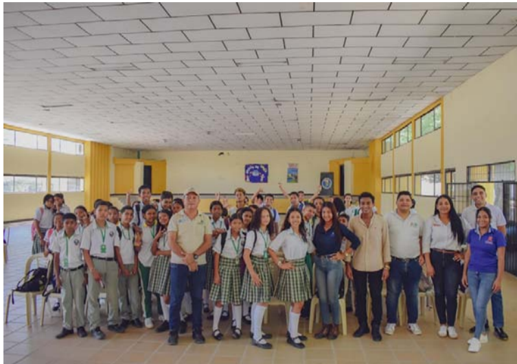
El Grupo Ambiental trató temas como código de colores, restricción de plástico de un solo uso y cambio climático.

El Grupo de Educación Ambiental de la Corporación trató temas como código de colores, restricción de plástico de un solo uso y cambio climático con estudiantes de la Institución Educativa Juan Jacobo Aragón, quienes participaron activamente.