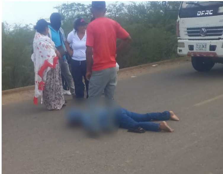
La mujer cayó bruscamente a la carretera mientras que el conductor con la moto 'voló' por los aires.

Este hecho se registró la tarde del miércoles 21 de agosto a pocos metros de la entrada principal del municipio de Uribia, en el sector conocido como Cuatro Vías, donde la mujer falleció de manera inmediata como producto del fuerte impacto.