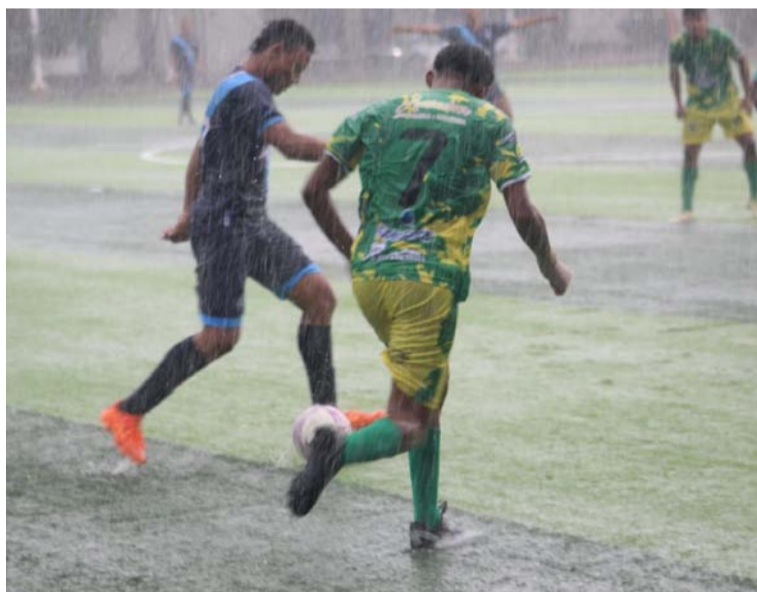
El partido fue suspendido al inicio del encuentro por motivo de un fuerte aguacero.