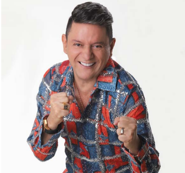
El nuevo trabajo explora nuevos sonidos y propuestas que muestran su potencial musical.

El artista viene con invitados especiales para compartir estas maravillosas experiencias en este nuevo trabajo que tendrá un estilo musical más alegre y parrandero, explorando nuevos sonidos y propuestas que muestran su potencial musical.