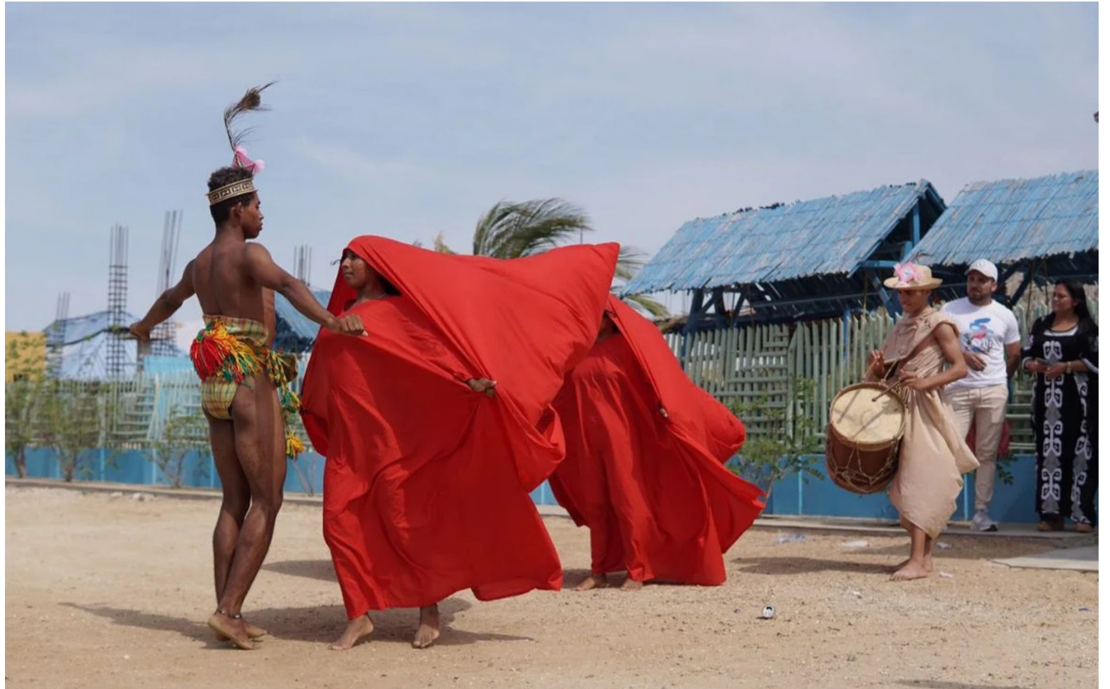
El respeto, disciplina y moralidad, son factores que afianzan algunos temas culturales, para su conservación.

El respeto, disciplina y moralidad, son factores que afianzan algunos temas culturales, para su conservación y prosperidad, sin descartar desórdenes y recochas sociales que hacen parte de nuestra cultura, brillando en activaciones que motivan y atraen observadores, para contagiarlo del ambiente atractivo y distractivo, enriquecedor de almas y pensamientos, saludable para superar monotonías, aburrimientos, tedios y depresiones. Mente sana, cuerpo sano. Aislarse de la participación cultural y deportiva, es desconectarse del entorno y ámbito social, que resulta diferente a las privaciones o exclusiones, por motivos de limitacio-