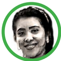
Por Delia Rosa Bolaño Ipuana