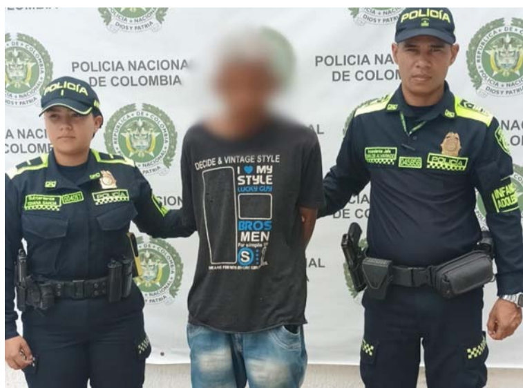
A esta persona le materializaron la captura por el delito de acceso carnal abusivo con menor de 14 años.

En una acción contundente dentro de la estrategia de protección a la infancia y adolescencia, la Policía Nacional ha logrado la captura de un individuo implicado en el presunto delito de acceso carnal abusivo con menor de 14 años en el distrito de Riohacha.