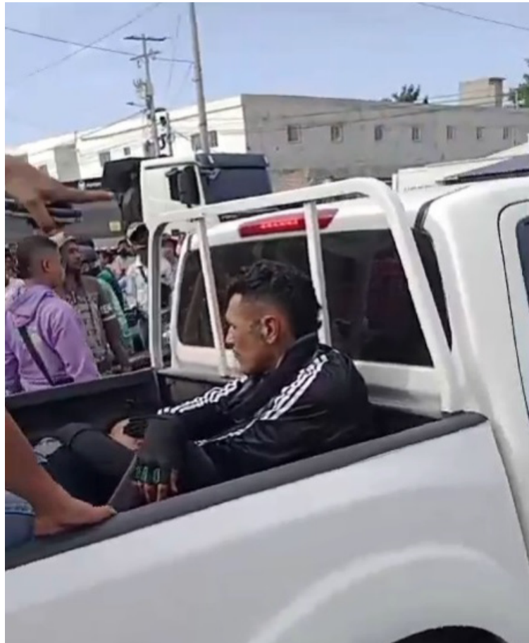
Los hombres fueron subidos en una camioneta de la Policía y llevados hasta la estación policial de Riohacha.

D OS sujetos fueron capturados en flagrancia cuando presuntamente intentaban cobrar un dinero producto de una extorsión a una persona, siendo detenidos por los uniformados de la seccional del Gaula de la Policía Nacional, quienes tenían conocimiento de todo lo que estaba sucediendo.