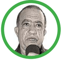
Por Martín Nicolás Barros Choles