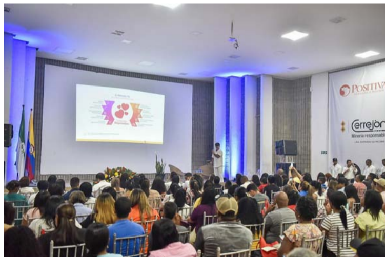
El seminario de la Cultura del Cuidado hace parte del programa Cerrejón en Movimiento.