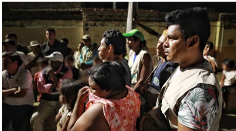
El retorno de los wiwa es solo el primer paso en la recuperación y normalización de más de 200 habitantes.