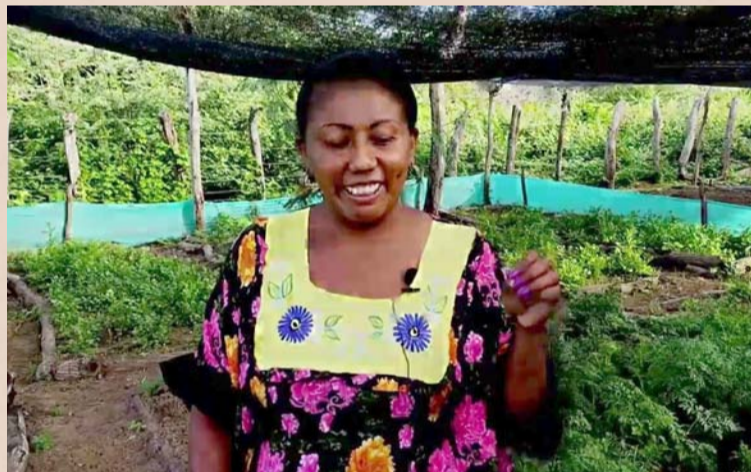
La idea de esta iniciativa comunitaria es que cada vez más wayuú, se sumen a labores de siembra.

Desde Fucái, que tiene como centro a la periferia, se está proyectando, además de obtener cosechas que aseguren una soberanía alimentaria wayuú, sembrar árboles maderables y frutales nativos, lo cual para los extensos territorios semidesérticos de La Guajira es fundamental, porque estos extraor-