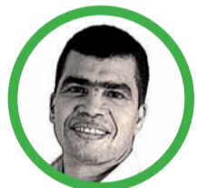
Por Rodney Castro Gulló

130 mil casas por año, cuando hay una necesidad de 200 mil.