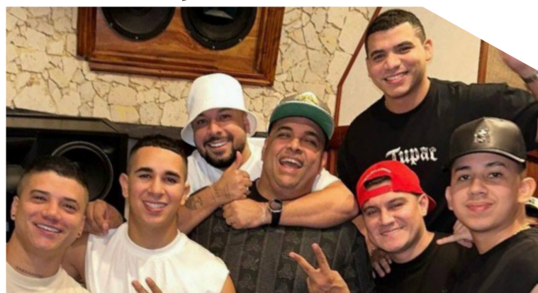
La Banda del 5 anunció la creación de su propio estilo musical, al que han denominado 'Bandanato'.