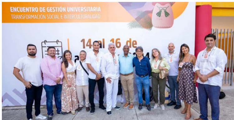
El evento contempló reuniones alternas con diferentes directivos de las IES participantes.