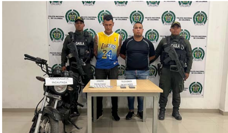
Estas personas exigían pagos a nombre de la mencionada organización criminal.

Las capturas se ejecutaron a través de minuciosos seguimientos y monitoreos realizados por uniformados del Grupo de Acción Unificada por la Libertad Personal (Gaula) de la Policía Nacional, luego que las víctimas de extorsión en su mayoría comerciantes del Distrito de Riohacha, denunciaron lo