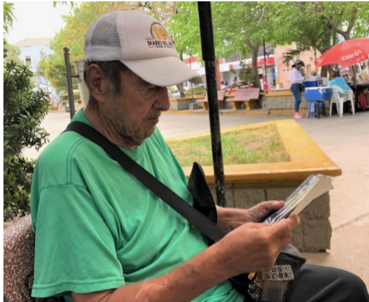
El fotógrafo Franco Estrella, se desempeñó como reportero gráfico en diferentes medios de información como El Heraldo, Guajira Gráfica y Diario del Norte, captando siempre con su lente las noticias del momento.

En su relato contó algunas de sus experiencias como reportero gráfico, cuando en muchas oportunidades desde el periódico El Heraldo al cual le prestó sus servicios enviaban a una persona a esperar la foto en el puente Pumarejo, pero a veces el