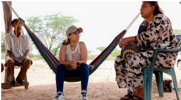
Sarabia reafirmó el compromiso del Gobierno y la alianza público-privada con las comunidades de la región.

De hecho, Laura Sarabia, directora del Departamento Administrativo de la Presidencia de la República (Dapre), visitó el pasado fin de semana las comu-