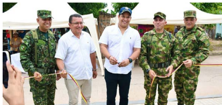
El parque consta de zonas verdes y demás áreas de juegos infantiles, máquinas biosaludables, entre otras.

El parque se ubica en el bulevar del par vial de la calle 10 entre carreras 3 y 4 beneficiando a los habitantes de los barrios El Pilar, Cerrito, Pringamosal, Los Olivos y comunidad en general; consta de zonas verdes y demás áreas de juegos infantiles, máquinas