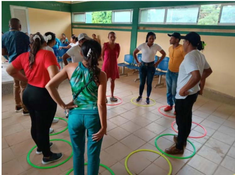
Padres, docentes y demás asistentes, coinciden en que esto fortalece vínculos entre la escuela y la familia,

En esta convocatoria, padres de familia, docentes y demás asistentes, coincidieron en que este tipo de actividades fortalecen los vínculos entre la escuela y la familia, a su vez inciden positivamente