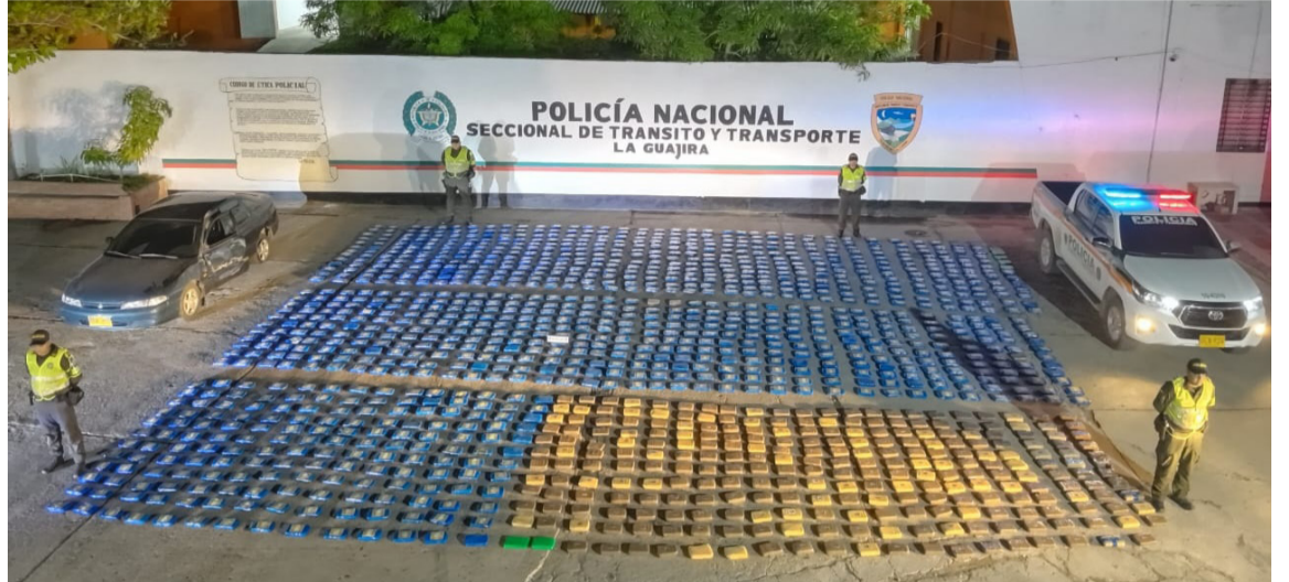
Dentro de un automóvil fueron hallados 1,294 paquetes prensados de marihuana.

Según la fuente policial esta modalidad 'Kamikaze', consiste en que los delincuentes y bandas dedicadas al tráfico de