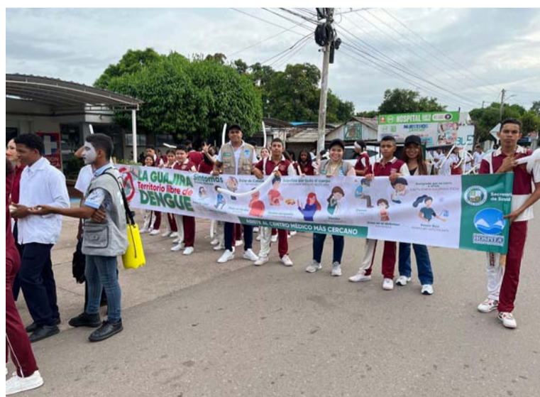
Las acciones están orientadas en el cumplimiento de 4 líneas que permitirán disminuir los índices de dengue.

Cabe resaltar que se ha enfatizado sobre mantener los alrededores limpios evitando los espacios con uso indebido de agua como floreros, tanques y otros lugares, que se puedan convertir en potenciales reservorios del mosquito Aedes aegypti .