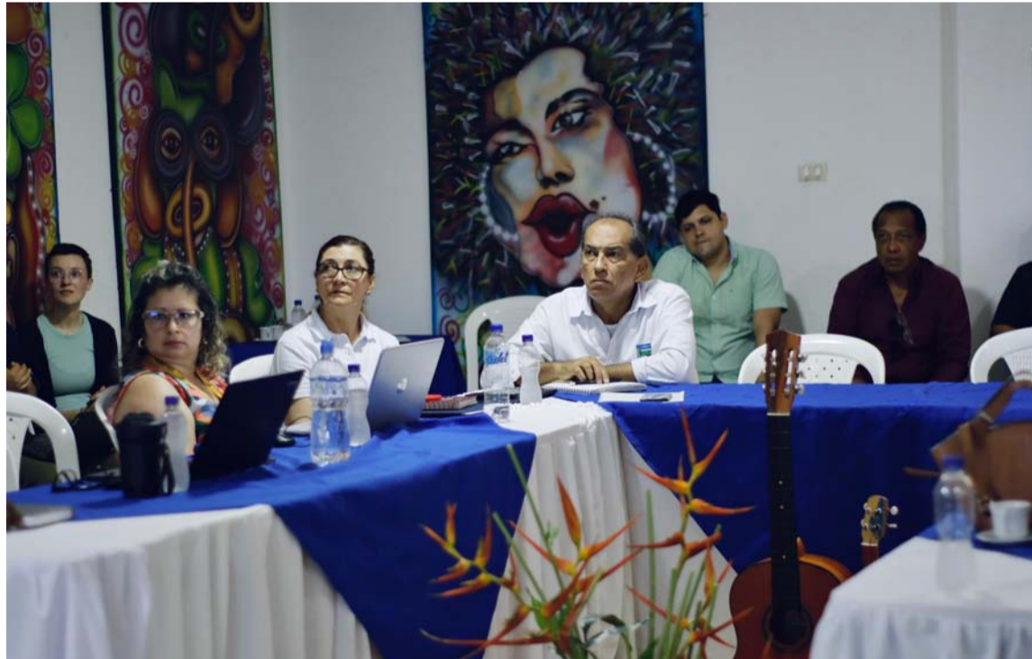
Implementación de las Appa asegura la sostenibilidad alimentaria en La Guajira.

El principal objetivo de la reunión fue coordinar y analizar, junto con las Administraciones locales, la implementación efectiva de las Appa en