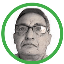
Por José Aragón Jiménez