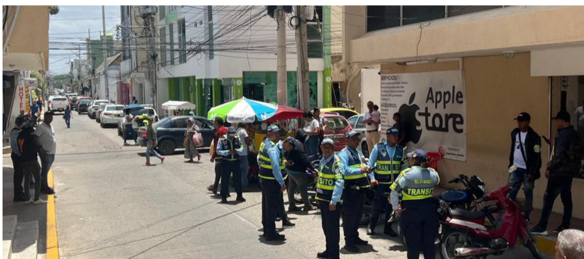
Las acciones buscan fortalecer la campaña institucional 'Salvando Vidas'.

A nuestros niños de La Guajira les digo que desde el Congreso y desde esta Comisión, estamos trabajando en favor de ellos, para proteger su vida y garantizar un Estado no solo asistencialista, sino un Estado que garantiza el derecho a la alimentación de manera transversal en todas las políticas públicas, seguimos firmes en la lucha por una Colombia sin hambre", enfatizó el senador guajiro.