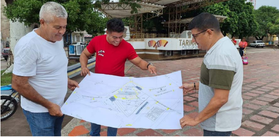
Con planos en mano se están verificando los preparativos para el encerramiento general y la correcta ubicación de los palcos.