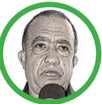
Por Martín Nicolás Barros Choles