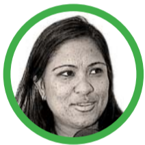
Por Fabrina Acosta