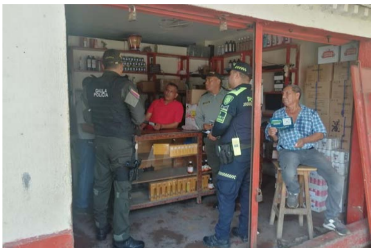
La actividad busca garantizar seguridad en los diferentes entornos y espacios recreativos de Colombia.

Con el fin de preservar la convivencia y seguridad ciudadana en entornos turísticos y emblemáticos del municipio, se realizaron acciones de prevención y control en el sector comercio, asimismo, dirigida a la ciudadanía en general, a quienes se les brindó la socialización de las diferentes modalidades de extorsión que se pueden presentar y que a su vez afectan los entornos y sectores turísticos de Maicao.