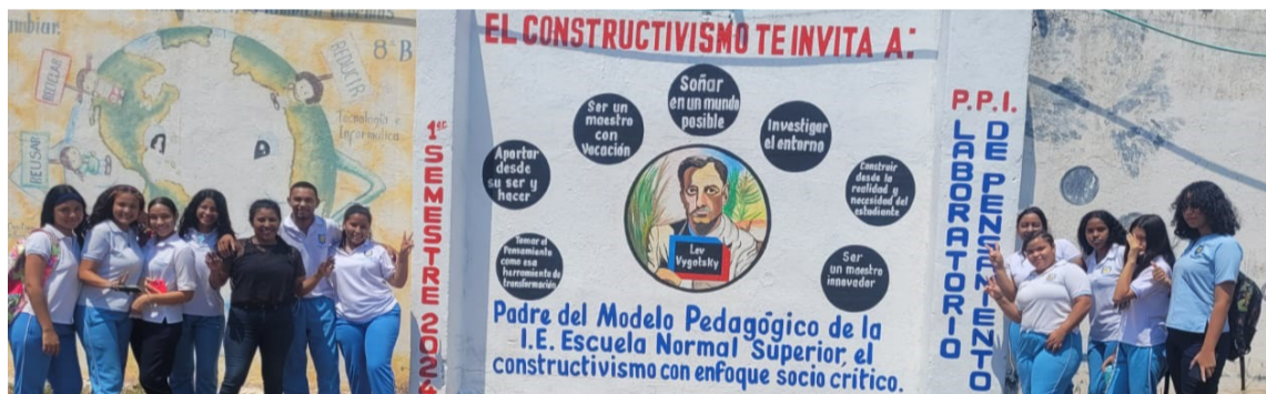
Los maestros en formación de la escuela Normal Superior de San Juan del Cesar, visibilizando el modelo pedagógico de la escuela y su proyecto pedagógico.

En esta ocasión, la pluma dorada plasma la página en blanco con la tinta fina de su pensamiento, inspirada en la historia de los procesos educativos, que se viene dando a lo largo y ancho de la República de Colombia, una Nación, que lleva más de 200 años de historia, bañada de lucha y fuerza ancestral, de valentía criolla y mestiza. Uno de los capítulos que se ha venido leyendo desde el inicio de los 200 años, que se van sumando a la historia, es precisamente la búsqueda de poder plasmar las hazañas de los héroes y heroínas, mercederos de ser leídos. Quienes ahora son protagonistas de la línea histórica, que por supuesto, fue necesaria la continuidad y el fortalecimiento de la educación, en esos inicios de liberación que se daba en el país, replantear la manera de visibilizar el pasado con el presente, que permitiera articular acciones para el futuro del pueblo colombiano, un giro a la educación, que le permitiera ser contada desde la liberación sus tierras, esas que fueron esclavizadas y obligadas a cambiar su civilización, sus costumbres, tradiciones, su educación propia,