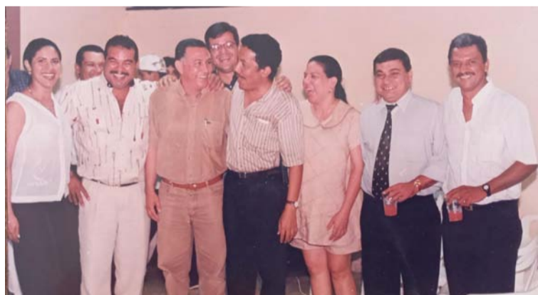
A lo largo de los 46 años de vida del Festival Cuna de Acordeones, muchos jóvenes han hecho parte de la realización del evento folclórico.