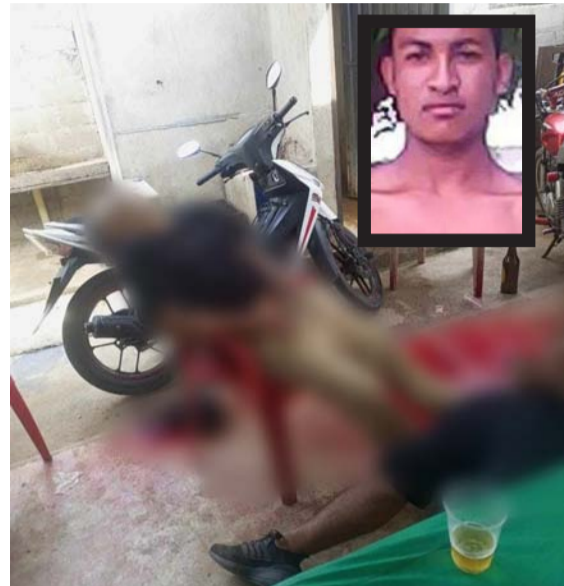
Dos muertos y varios heridos dejó un ataque a bala en zona rural de Riohacha.