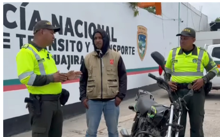
La motocicleta recuperada fue devuelta a su propietario, una vez cumplidos los trámites.

Al llegar al lugar, encontraron la motocicleta abandonada, aparentemente debido a que los