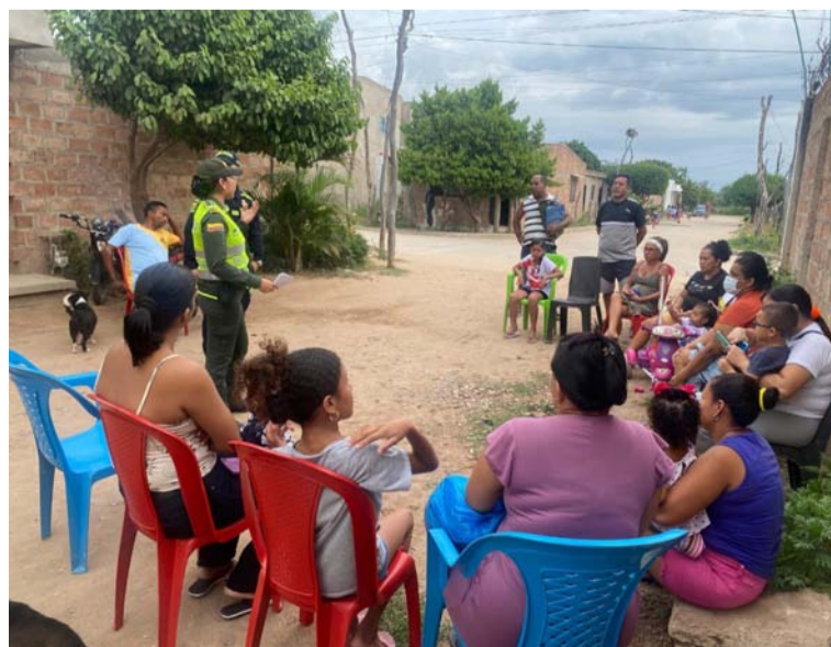
Se generó un espacio de intercambio de ideas, orientado al trabajo conjunto entre comunidad y autoridades.

La Policía Comunitaria en coordinación con el presidente de la Junta de Acción Comunal y la comunidad en general, han llevado a cabo importantes jornadas de sensibilización con el objetivo de fortalecer el frente de seguridad en el municipio.