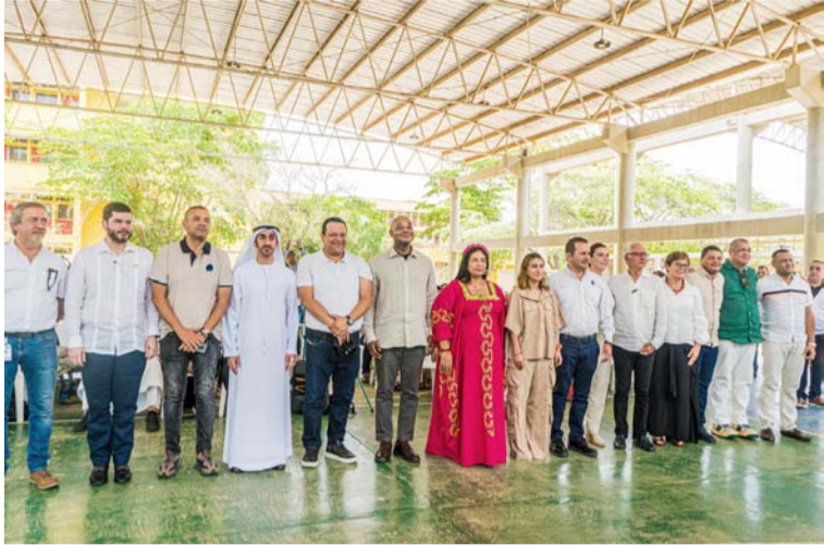
El hospital funcionará como Centro de Prácticas para estudiantes de la Facultad de Ciencias de la Salud de Uniguajira.