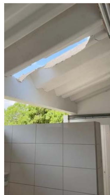
Se registraron daños en la sede del Sena, colegio Cerromar, en la Uniguajira y en comunidades indígenas.

del Batallón para evitar que la comunidad lo manipule.