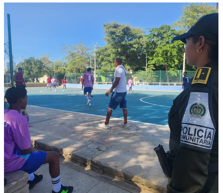
Más de un centenar de jóvenes se han beneficiado de estas actividades.

La Policía Comunitaria insiste en que continuará promoviendo estos programas que, sin duda, marcan una diferencia significativa en la vida de los jóvenes de Riohacha y en la construcción de una sociedad más segura y unida.