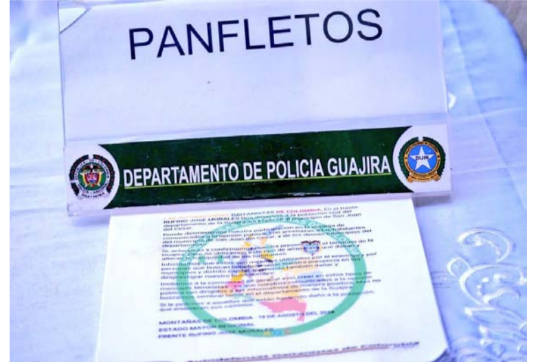
Fueron incautados panfletos alusivos a esta estructura criminal y otros elementos.

tos desempeñaban roles cruciales en la disputa por el control territorial, el manejo financiero del narcotráfico, la coordinación de extorsiones y homicidios selectivos.