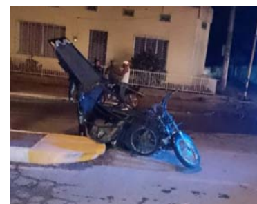
'Bimbo' se desempeñaba como mototaxista.