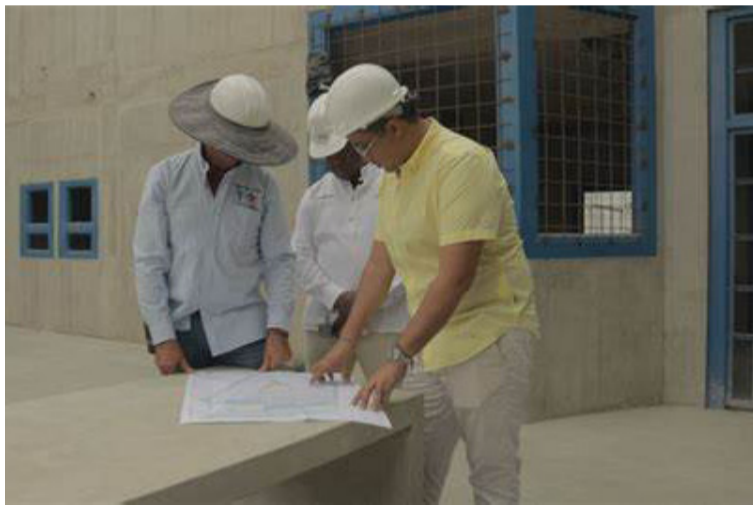
Constantes retrasos y modificaciones a los cronogramas han impedido que las obras avancen según lo pactado.

la Procuraduría se destaca que la construcción de la cárcel de mediana seguridad