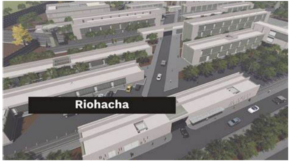
Los trabajos de ejecución en este proyecto en Riohacha solo han alcanzado un 48,14 por ciento.

Las fechas previstas de finalización son junio y diciembre de 2025