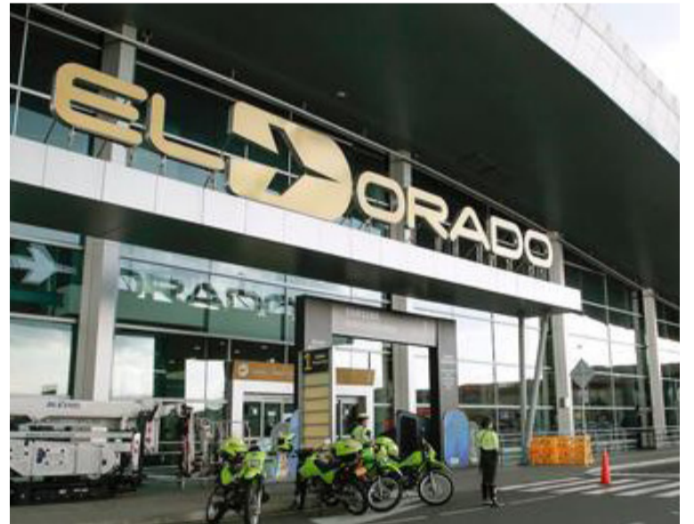
En ‘El Dorado’ de Bogotá poco a poco se está reduciendo el combustible a niveles mínimos.

Esto incluye, entre otras medidas, realizar cargue extra de combustible fuera de Colombia para vuelos internacionales de Latam Airlines, ajustes en procesos operacionales y monitoreo vuelo a vuelo de los consumos para cada aeropuerto en el país.