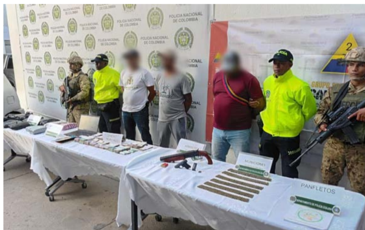
Los capturados son presuntos miembros del Clan del Golfo, con una fuerte presencia criminal en La Guajira.