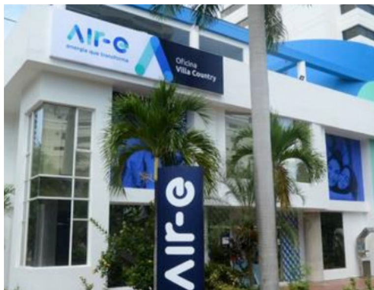
Los resultados de los encuentros de Air-e con los mandatarios del Caribe se conocerán el 30 de agosto.

Las tres empresas que han acudido al llamado de Air-e son EPM, Isagen y Celsia, este último destacó que, a pesar de que sus contratos ya tienen un precio inferior al promedio del mercado, esta reducción adicional busca aliviar la carga económica de las familias de la región.