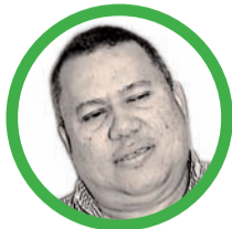
Por Luis Eduardo Acosta Medina