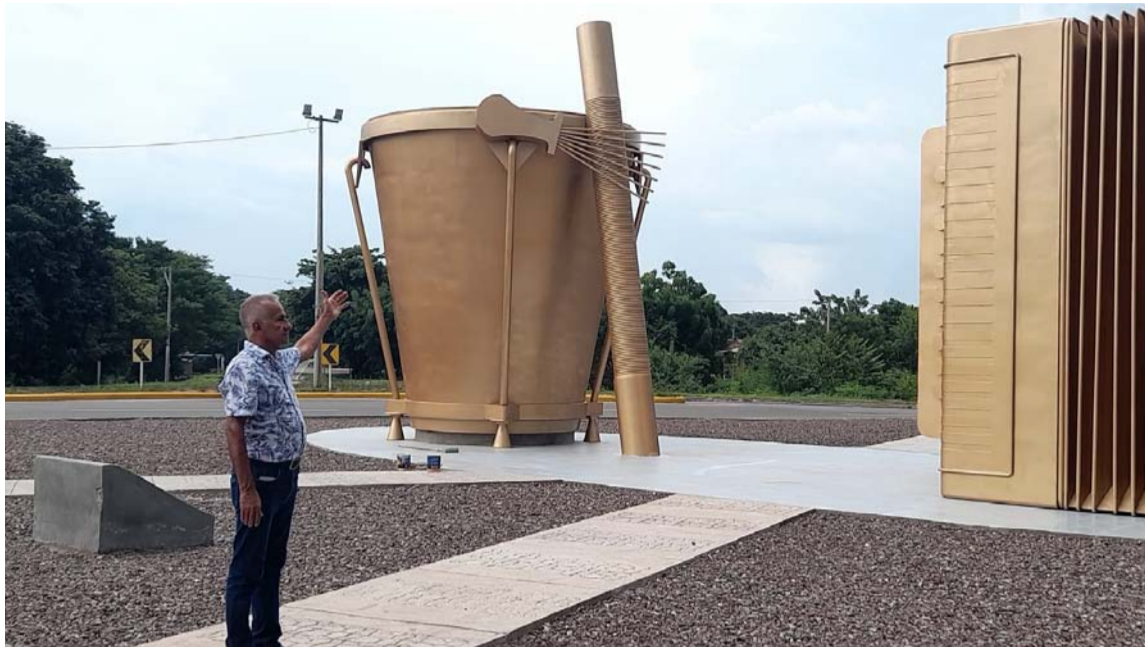
El monumento está ubicado en la glorieta sur que comunica con el Cesar.

del Norte que este esfuerzo soñado tuvo una duración de seis meses y que involucró la movilización de recursos desde Girón, hasta La Guajira, donde celebra la finalización de estos dos monumentos que honran a los íconos del vallenato.