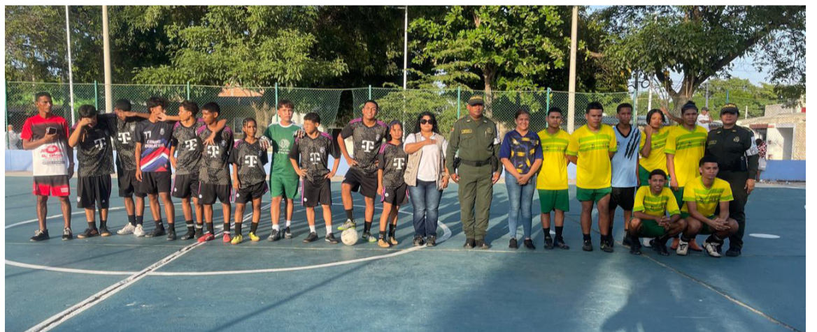
Este proyecto tiene como objetivo principal sacar a los jóvenes de la monotonía, promoviendo prácticas de sano esparcimiento.

En el marco del nuevo modelo de servicio orientado a las personas y los territorios, la Policía Comunitaria, en coordinación con los presidentes de Juntas de Acción Comunal de los distintos barrios del municipio, ha unido esfuerzos para ofrecer a los jóvenes del Distrito de Riohacha, espacios de transformación social y recreativos. Estas actividades buscan fortalecer la convivencia y mejorar la seguridad ciudadana, estrechando los lazos de corresponsabilidad entre el binomio comunidad - Policía.