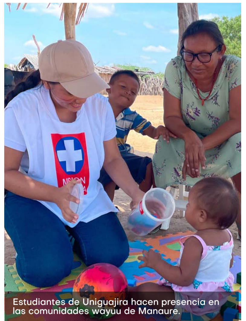
Estudiantes de Uniguajira hacen presencia en las comunidades wayuu de Manaure.

Es importante destacar que, la preparación de los estudiantes es esencial para garantizar que las intervenciones fueran culturalmente pertinentes y eficaces para de esta manera, apostarle al fortalecimiento de la facultad, brindando espacios para lograr la mejora continua de la calidad de vida de los habitantes de La Guajira.