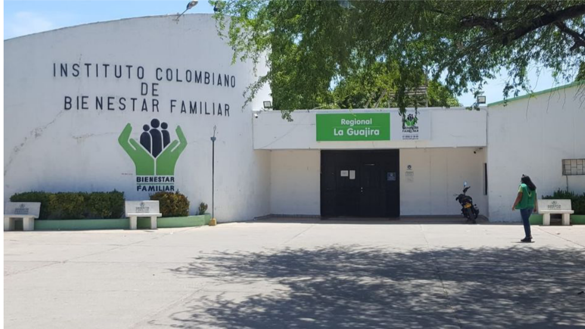
Los padres han agradecido a toda la comunidad riohachera el apoyo brindado.

Las dos jovencitas estudian en la Institución Educativa Divina Pastora del Distrito de Riohacha, de