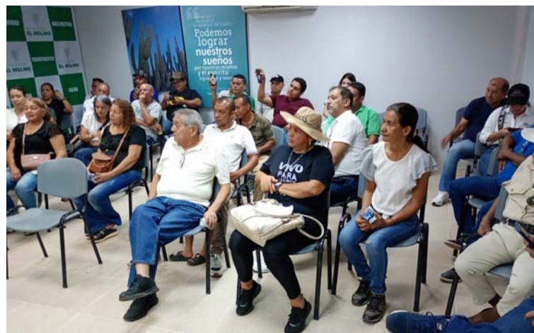
Se conformó un comité para hacer seguimiento a todo el proceso para la solución al problema del Hospital.

rente del hospital, anunciaron que en el transcurso de la presente semana, estarán en la capital del país continuando gestiones para lograr una solución efectiva y acertada con el fin de salvar los recursos asignados a la E.S.E.