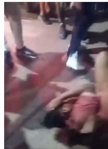
El presunto ladrón fue golpeado por la comunidad.

El sujeto fue conducido hasta la Estación de Policía del municipio fronterizo; se pudo conocer que fue llevado hasta un centro asistencial para la valo-