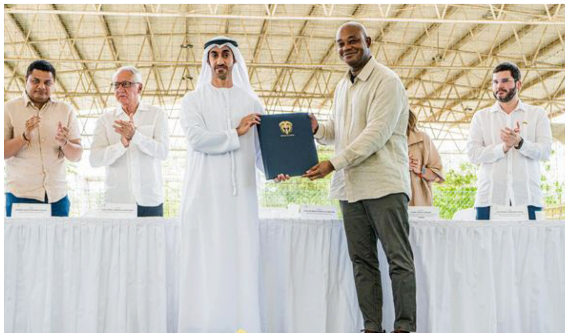
El canciller firmó el memorando de entendimiento con el representante de EAU.

“Ese será el mejor hospital que tendrá la región Caribe y de todo el país; será una obra con tecnología de punta”, dijo.