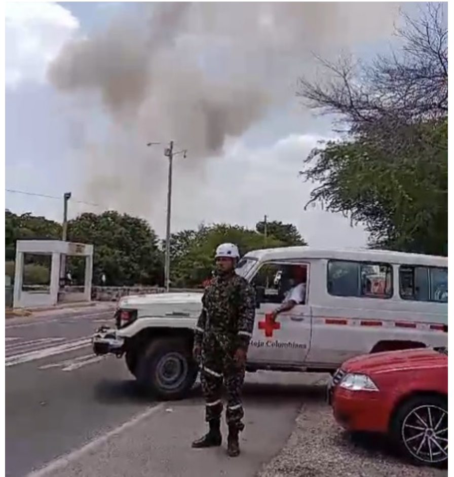
Se conoció que fueron más de cien las detonaciones de los explosivos que se generaron en el sitio conocido como el polvorín.