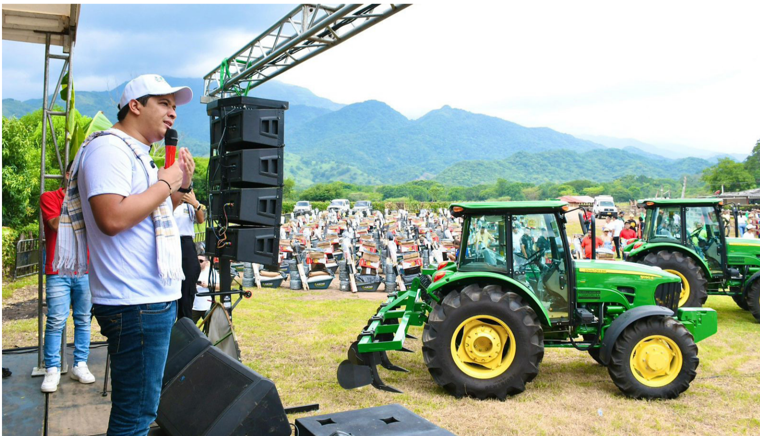
La entrega de los equipos se cumplió en el marco de la feria agro-campesina que organizó la Administración.

“Me siento muy contento de encontrarme con muchos amigos que tienen la voluntad de trabajar y de tener una oportunidad y hoy estamos haciendo eso posible”, dijo.