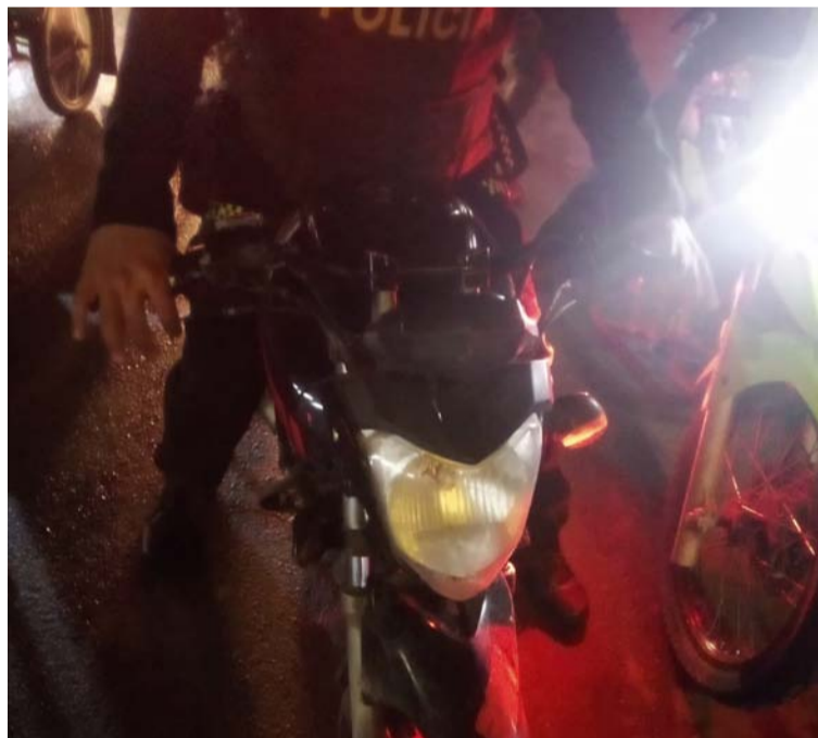
Las dos personas lesionadas fueron trasladadas al Hospital San Agustín de Fonseca.

Se estableció que el accidente se presentó cuando