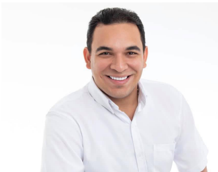
Soto incurrió en la prohibición de posesionar a un funcionario sin el cumplimiento de los requisitos exigidos.

Para el órgano de control, el entonces alcalde “debía observar las normas jurídicas aplicables para la designación y po-