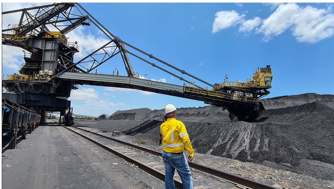
La reorganización inició el 22 de abril de 2016, agotando sus etapas a cabalidad.

La Superintendencia de Sociedades continuará desempeñando las funciones que le fueron asignadas por la ley, e informará sobre el avance de los procesos que adelanta.