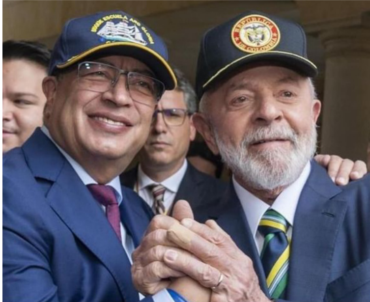
Los presidentes de Brasil, Luiz Inácio Lula da Silva y de Colombia, Gustavo Petro.

El jueves el Tribunal Supremo de Justicia (TSJ) de Venezuela convalidó la victoria de Maduro en las elecciones del 28 de julio sobre Edmundo González Urrutia, el candidato de la oposición, que denuncia