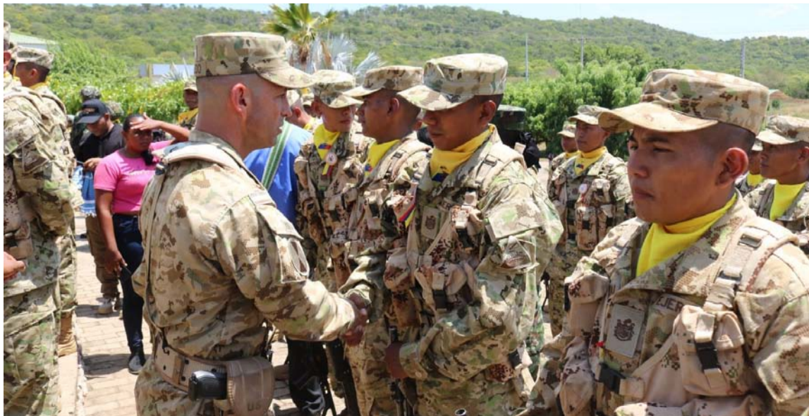
35 soldados terminaron sus primeras 12 semanas de entrenamiento técnico y táctico.

Se comprometieron a servir con profesionalismo, compromiso, disciplina y trabajo incansable para la construcción de un mejor país, donde día a día se convierten en pilares fundamentales en la formación como soldados, para salir a cumplir con misiones y desarrollar operaciones militares, con plena fe en la causa de minimizar factores de inestabilidad que se generan en el territorio del departamento de La Guajira