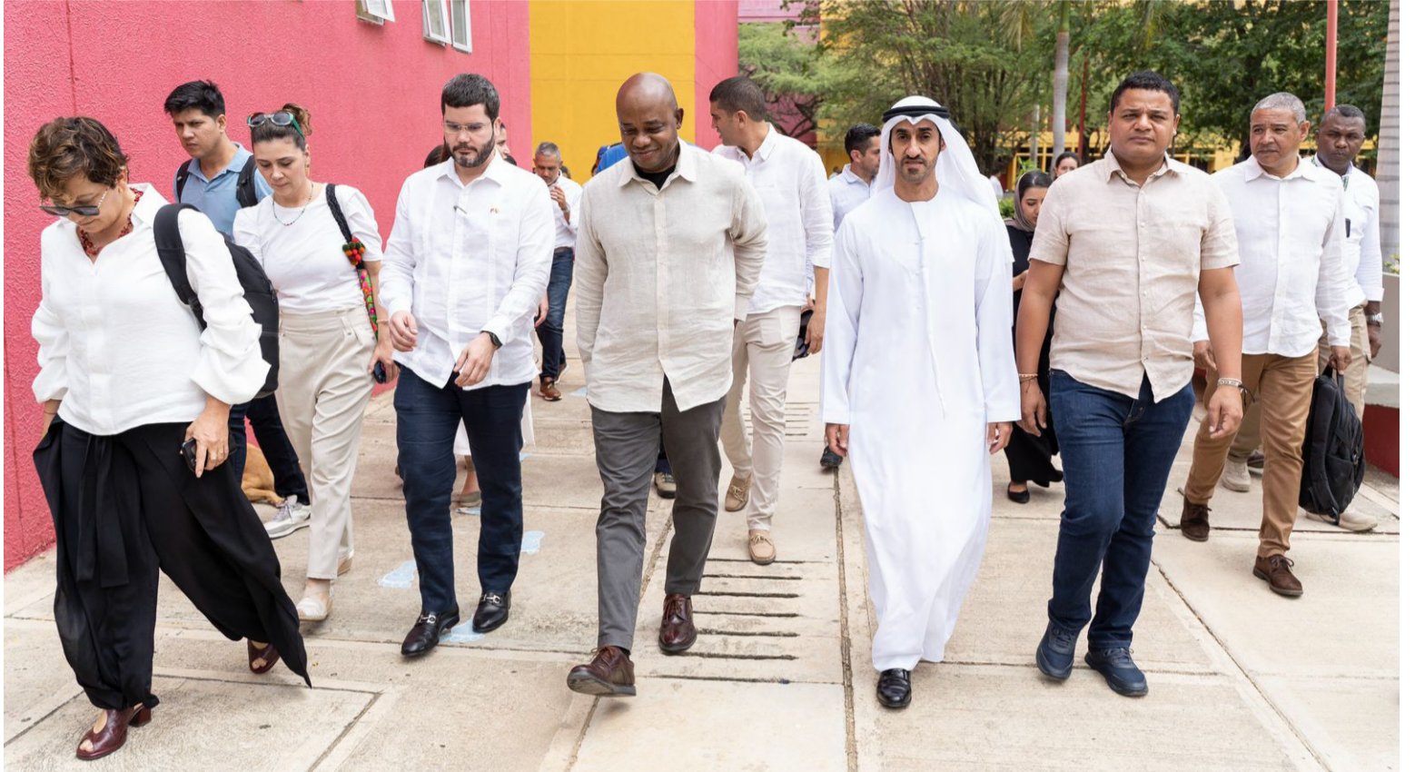
Del 26 al 30 de agosto la Cancillería hará presencia en Maicao para ofrecer trámites y servicios a la comunidad.