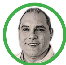
Por José David Name Cardozo