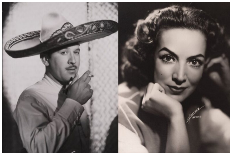
En el mundo esplendoroso del cine mexicano, al lado de Pedro Infante estuvieron María Félix, entre otros.

DESTACADO Una faceta importante de Pedro Infante fue su figuración en el canto. Canciones inolvidables como 'Las mañanitas', 'Amorcito corazón', 'Bésame mucho'.