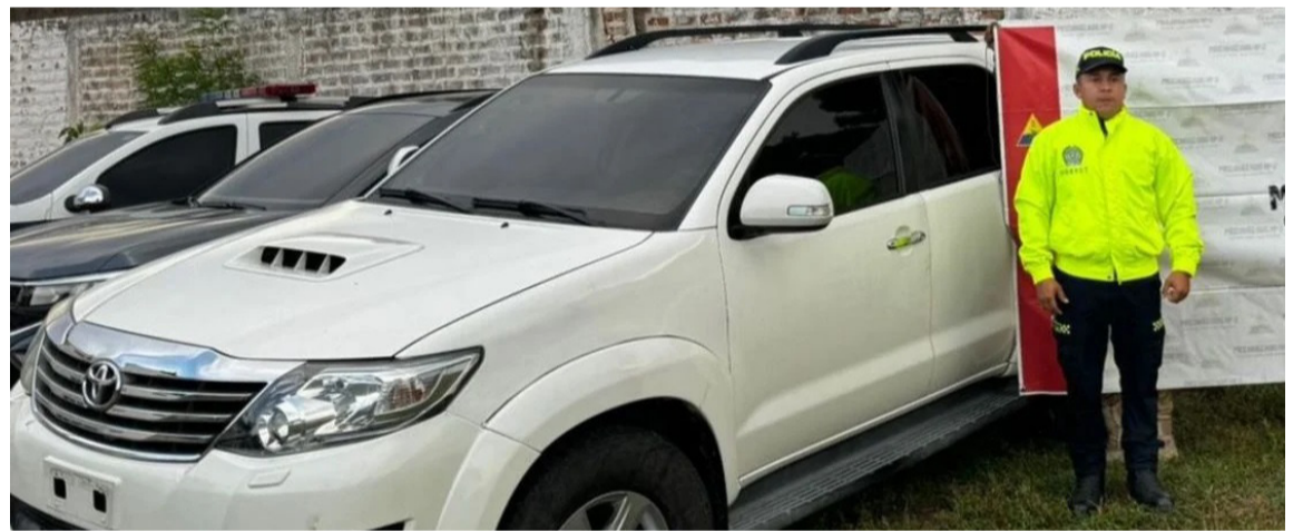
La Toyota Fortuner se encontraba desde hace algún tiempo parqueada en la calle.

La camioneta era requerida por la Fiscalía 28 Local de Pereira, según una denuncia recibida por parte del propietario afectado.