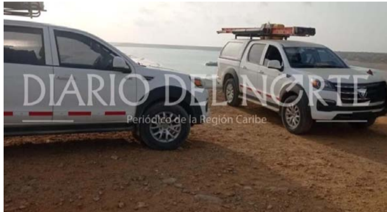
Los antisociales se llevaron además, herramientas, computadores, celulares y documentos.

Los afectados son dos técnicos, un auxiliar y un conductor quien fue retenido en el vehículo y llevado vía La Flotera con Ve-