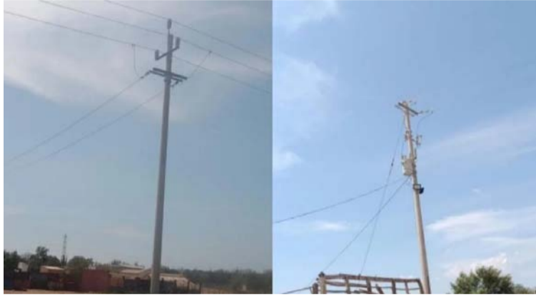
Dice la compañía que las conexiones ilegales representan riesgos, como sobrecargas y cortocircuitos.

Ante el acercamiento del personal de la compa-