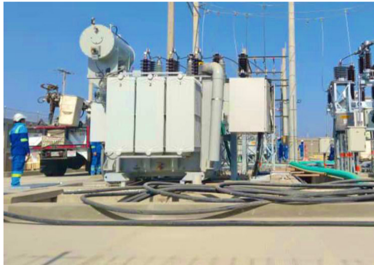
La comunidad debe unirse y elevar su voz en un clamor conjunto.

Sin embargo, cuando se enfrentan dificultades que realmente impactan nuestro día a día, como los cortes de energía, la respuesta es mucho más