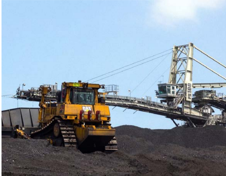
La prohibición no garantiza la seguridad nacional, la soberanía alimentaria, ni la protección de la industria.

Durante su intervención en el Trigésimo Sexto Congreso Nacional de Exportadores organizado por Analex en Barranquilla, la jefe del Ministerio Público reincidió en la inconveniencia del decreto y en los reparos del impedimento de las exportaciones, las cuales