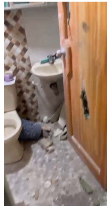
Hasta las horas de la tarde de ayer este fue el único suceso reportado en las viviendas cercanas al Batallón.