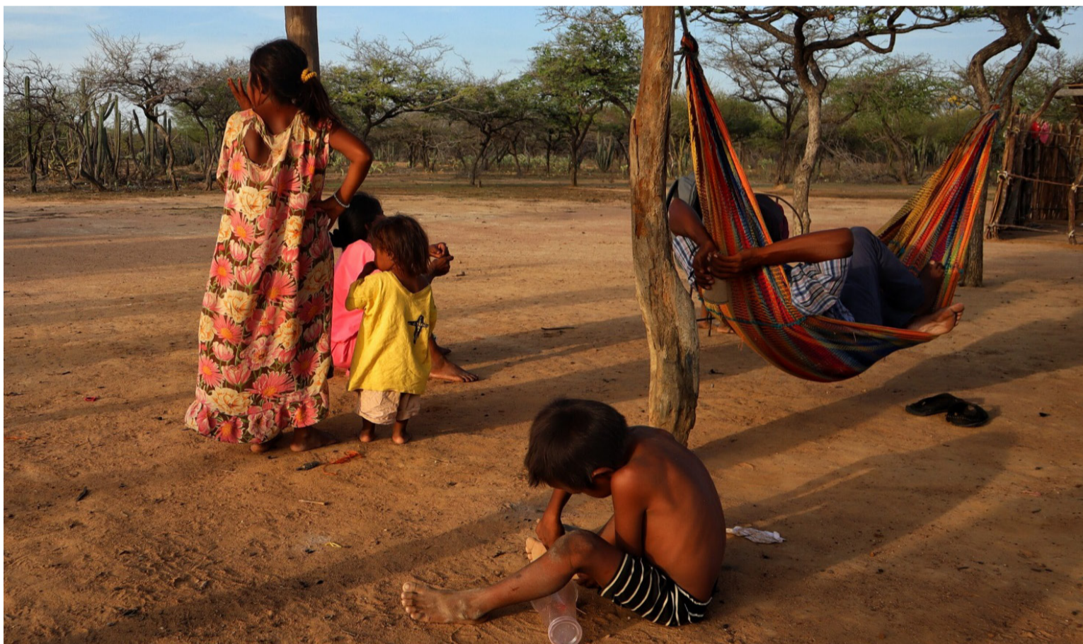
La falta de agua potable, un problema que ha cobrado la vida de cientos de niños guajiros, sigue siendo una realidad.

fundada, sino mi opinión basada en la realidad que viven los guajiros a diario. Basta con mirar el estado intransitable de las vías, los proyectos de infraestructura que parecen estancarse, y los recursos destinados a estos fines se desvanecen. La falta de agua potable, un problema que ha cobrado la vida de cientos de niños guajiros, sigue siendo una realidad inaceptable.