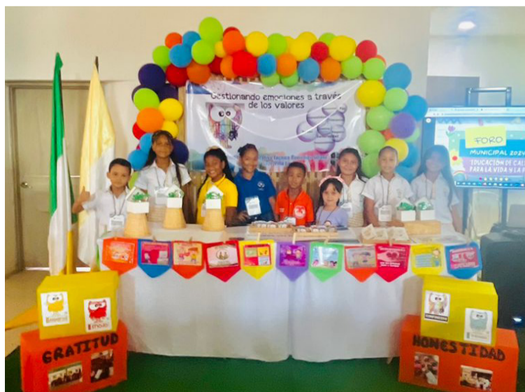
La comunidad educativa Insresolistas, ha manifestado satisfacción y orgullo por este importante logro.