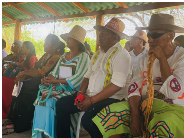
Indígenas wayuú se reunirán en un círculo de la palabra para reflexionar y construir acuerdos de entendimiento.

DESTACADO Este tercer encuentro de 'La historia de los pueblos sin historia' lo organizan la estrategia Cultura de Paz del Ministerio de las Culturas, las Artes y los Saberes con Archivo General de la Nación.