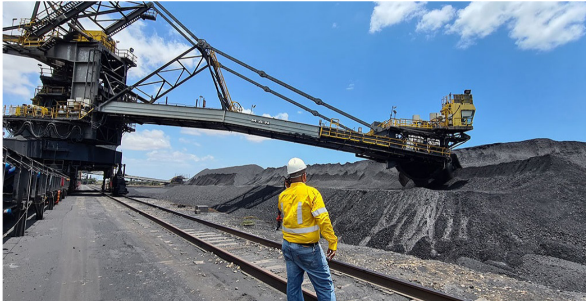
Dice la Andi, que quien pierde con esta medida son los municipios carboníferos.