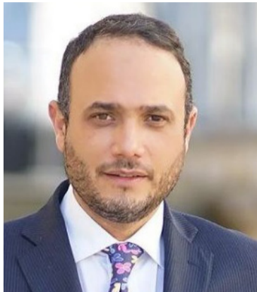
Alfredo Deluque Zuleta, Senador de la República.