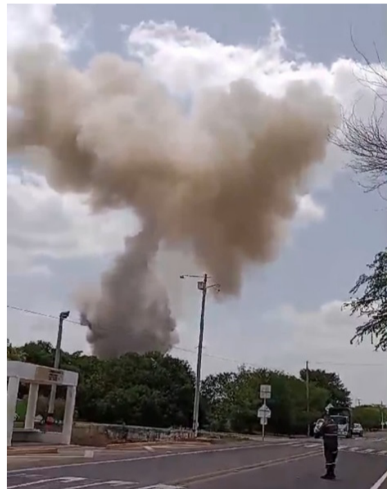
Las más de 100 detonaciones de los artefactos terminaron luego de 10 horas.

teniente coronel Asdrúbal Rico Granados, informó que no se presentaron personas heridas producto de las explosiones y que efectivamente se lograron