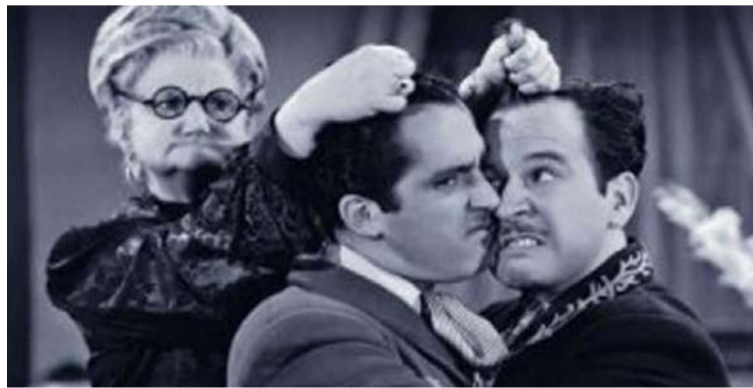
Son inolvidables las películas en las que Pedro Infante trabajó con Sara García, la abuela del cine mexicano.

Los cinéfilos que solo conocimos al actor a través de la magia del celuloide y aún hoy escuchamos sus canciones inolvidables, admiramos las dotes actorales de ese mexi-