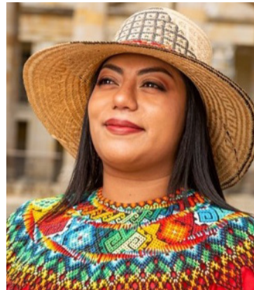
Martha Peralta, Senadora de la República