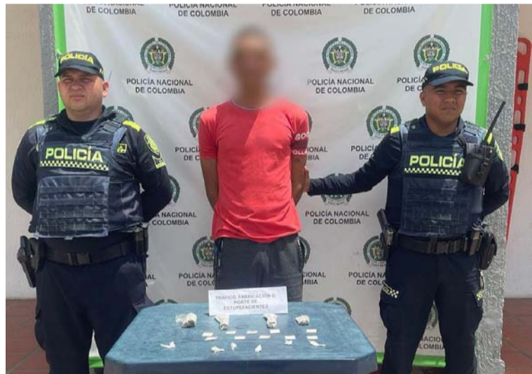
La captura se realizó en el marco de un operativo metódico que involucró patrullajes regulares.

La Policía Nacional sigue demostrando su firme compromiso con la seguridad y el bienestar de los ciudadanos en La Guajira, mediante el fortalecimiento de sus acciones de prevención y control. En respuesta a las crecientes demandas de seguridad en la región, se han intensificado las labores de patrullaje y se han llevado a cabo rigurosas actividades de registro y verificación de antecedentes, con el objetivo de mantener el orden público y prevenir el crimen.