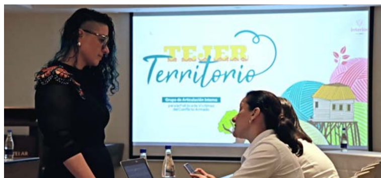
Estas jornadas se extenderán a otras regiones como Nariño, San Andrés, La Guajira y Magdalen.