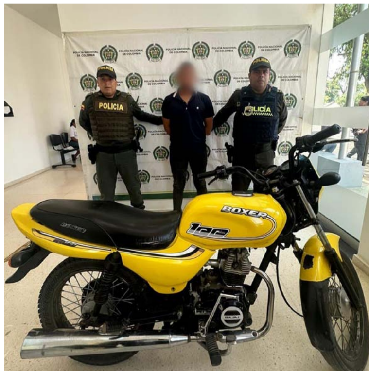
El detenido y la moto recuperada, fueron entregados a la Fiscalía General de la Nación.

La Policía Nacional mantiene su firme compromiso con la seguridad y el respeto a la legalidad, dedicándose constantemente a preservar la paz y bienestar de la comunidad. Valora la cooperación de los ciudadanos en la notificación de actividades delictivas y reafirma que la comunidad puede denunciar situaciones sospechosas en las líneas de emergencia, 123.