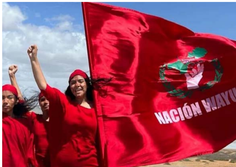
El congreso se desarrollará el 30 de agosto, a partir de las 9 de la mañana en el territorio indígena Pesuapa.

"Será un espacio de diálogo, reflexión y empoderamiento indígena fe-