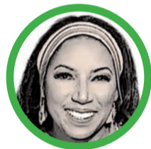
Por Marga Palacio