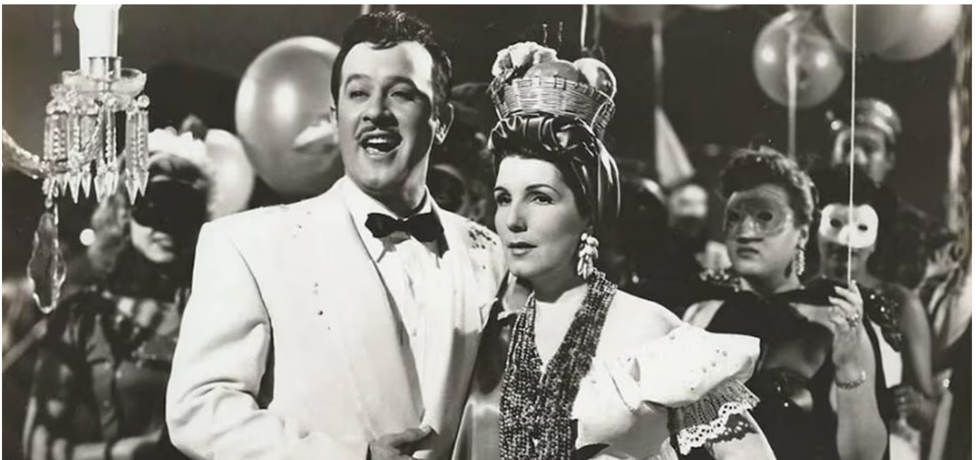
Pedro Infante nació en Mazatlán, Sinaloa, el 18 de noviembre de 1917. Actuó al lado de la legendaria Libertad Lamarque.

Una faceta importante de Pedro Infante fue su destacada figuración en el canto. Canciones inolvidables como 'Las mañanitas', 'Amorcito corazón', 'Bésame mucho' y 'La que se fue' son apenas muestra de su versatilidad como actor integral. Grabó más de trescientas canciones; todas fueron éxitos resonantes. Como la vida de Pedro Infante encontramos otras que brillan en el cine mexicano. Inevitablemente pensamos en Jorge Negrete, su rival en muchas películas, pero también su cómplice en el mundo fantástico del celuloide.