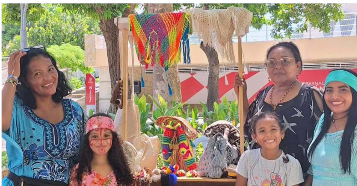
Hubo espacio para presentar danzas tradicionales y una feria de emprendimiento.

tradiciones, usos y costumbres, que los han llevado a estar en riesgo de desaparición.