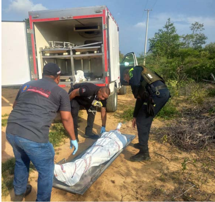
El occiso vestía una pantaloneta de color gris con rayas azules y un suéter morado.

Una fuente policial señaló que hasta el momento se desconoce la