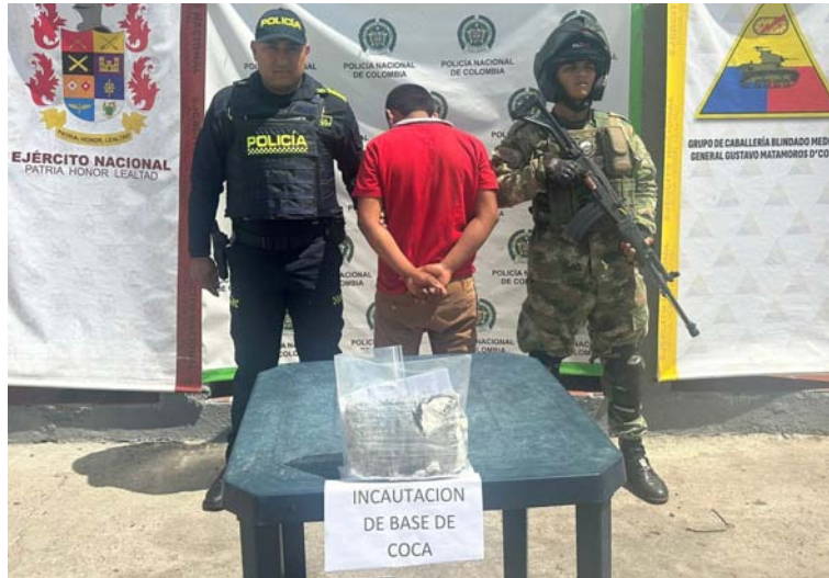
El sujeto fue capturado en flagrancia por el delito de tráfico, fabricación o porte de estupefacientes.

La tarea de acción decisiva fue desarrollada el martes 13 de agosto del 2024, luego de recibir información por parte de la misma comunidad sobre un sujeto que al parecer distribuía y fabricaba pas-