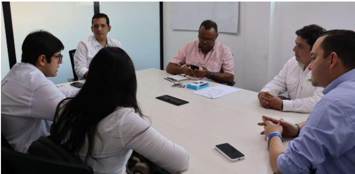
En la reunión se establecieron hojas de ruta y se entregaron los proyectos a Planeación.

Con estos logros, se reafirma el compromiso del Gobierno departamental por mejorar las condiciones de vida en La Guajira y garantizar que las promesas realizadas se traduzcan en acciones concretas que beneficien a todos los ciudadanos.