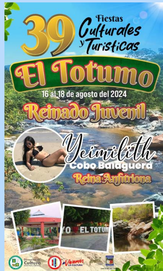
El Totumo celebra sus tradicionales fiestas y el Reinado Juvenil del Turismo.