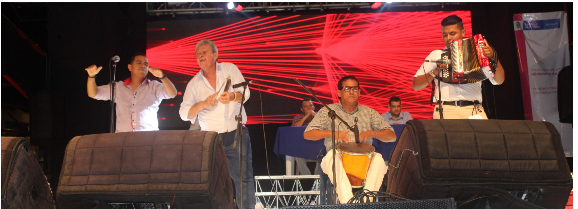
El Festival Cuna de Acordeones a través de los años se ha convertido en uno de los eventos del género vallenato de mayor trascendencia nacional.