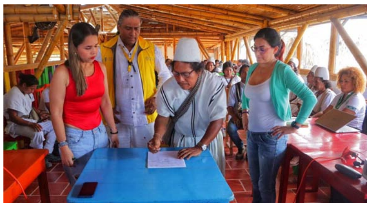
Este pueblo vivió situaciones difíciles con la presencia de grupos al margen de la ley en su territorio.

"Para nosotros ha sido de gran importancia este evento con la Unidad para las Víctimas, es importante porque nosotros somos el único pueblo arhuaco