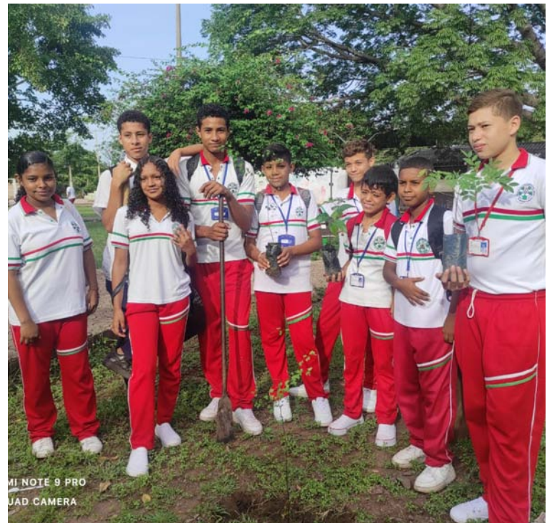
Los estudiantes se unieron al esfuerzo de plantar árboles en las instalaciones del centro educativo.

DESTACADO Esta jornada no solo contribuyó a la reforestación del área, sino que también fortaleció el compromiso de los jóvenes con la protección y el cuidado del medio ambiente.