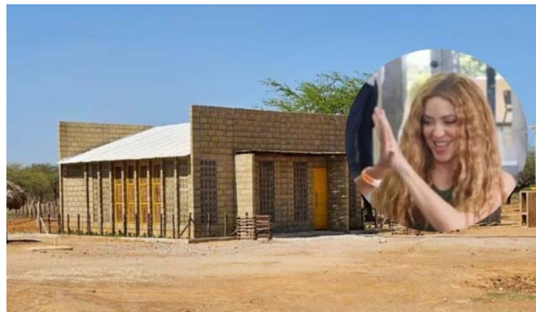
El proyecto iniciado en 2023, se completó en ocho meses con la construcción de más de 2.200 metros cuadrados.

DESTACADO La fundación apostó por trabajar en la ruralidad del país para contribuir a reducir la brecha educativa entre lo rural y lo urbano; llegando a lugares remotos.