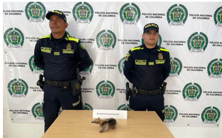
Las autoridades de policía informaron que las dos especies fueron entregadas a Corpogujaira.