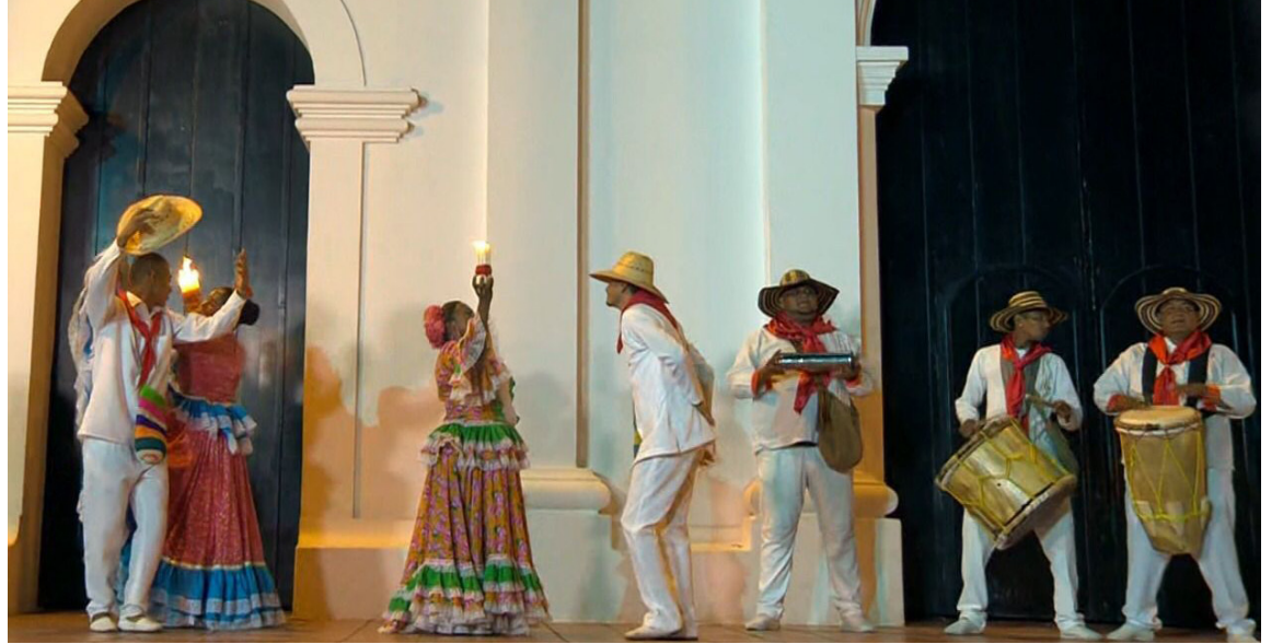
La emisión resalta la esencia de la cumbia, declarada Patrimonio Cultural de la Nación.

Esta transmisión marcó el inicio del proyecto 'De Fiesta por la Región', una ambiciosa iniciativa de Telecaribe que tiene como objetivo resaltar la riqueza cultural del Caribe colombiano. A lo largo de 14 transmisiones en directo, el canal regional recorre-