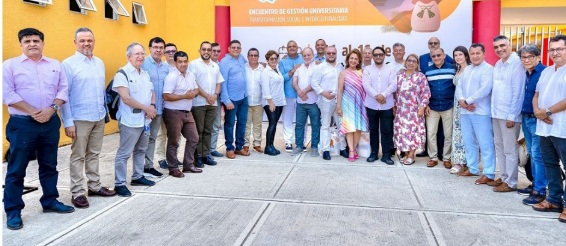
El encuentro abordó el crecimiento sostenible de las universidades públicas del país,

“Este no es un consejo convencional. La presencia de dos entidades del Gobierno nacional como lo son el Ministerio de Educación y el Departamento de Prosperidad Social, además 34 IES pú-