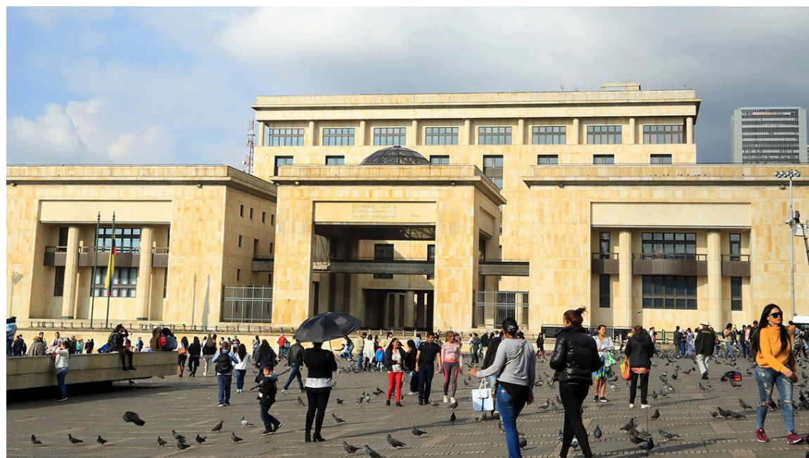
La Corte adoptó medidas extremas de seguridad con presencia del Ejército.

Entre las medidas adoptadas también incluyeron sistemas de drones y equipos antiexplosivos. Además, Comandos de Operaciones Especiales (Copes) serán desplegados para garantizar la seguridad del edificio y sus inmediaciones.