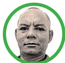
Por Luis Alberto Borja Medina

Nacimos y crecimos en una sociedad de hierro que nos ayudó a forjarnos en medio y bajo las necesidades y carencias de la época, todo este entorno inhóspito donde la psicóloga era la palabra firme de la madre o el padre, el guiño de ojos por las buenas acciones, y con una misma señal de ellos también reprendían las malas acciones.