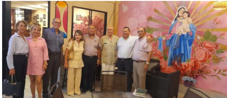
El museo promete ser un referente para la promoción del patrimonio histórico y cultural de la región.