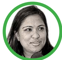
Por Fabrina Acosta