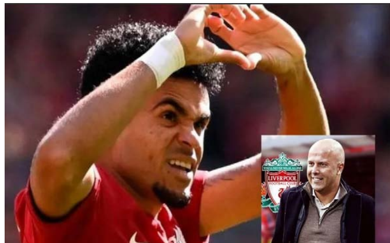
'Lucho' Díaz sería titular en el tridente con Mohamed Salah y Darwin Núñez ante el Ipswich Town.

Díaz sería titular en el tridente con Mohamed Salah y Darwin Núñez ante el Ipswich Town, que será su primer rival. Liverpool jugará de visitante a la espera de refuerzos. Por