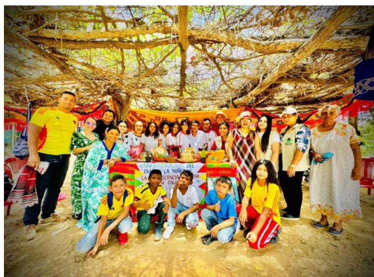
La jornada comenzó con una sensibilización sobre la recuperación de usos y costumbres tradicionales.

En una jornada llena de color, tradición y orgullo cultural, el Instituto Colombiano de Bienestar Familiar (Icbf) celebró el Mes de la Niñez y Adolescencia Indígena en la comunidad Campamento, ubicada en el municipio de Maicao.