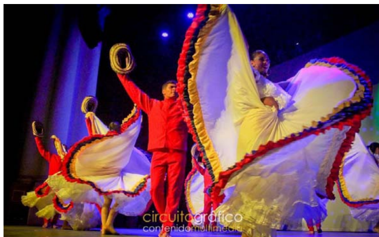
La Fundación ofreció un repertorio de ritmos representativos del Caribe colombiano.

Espectadores mexicanos disfrutaron de interpretaciones de mapalé, bullerengue y sexteto, además de ritmos emblemáticos de La Guajira como la puya provincia-