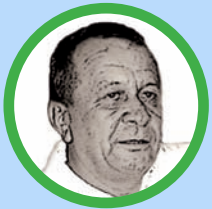
Por Hermes Francisco Daza