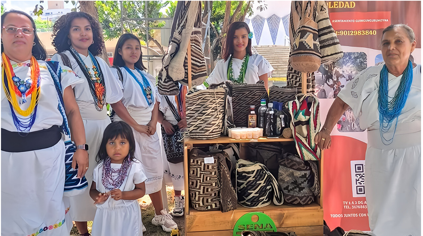
No hay que olvidar que los pueblos indígenas han sido gravemente afectados por el conflicto armado en Colombia.