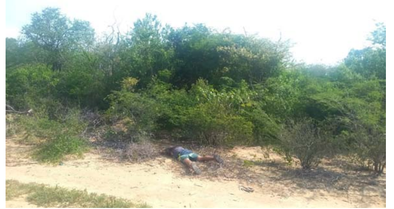
El cadáver fue avistado por moradores de la zona.

identidad de la persona asesinada, ya que al realizar las labores de vecindario, los habitantes de la zona notificaron no conocer al occiso, quien viste una pantaloneta de color gris con rayas azules y un suéter morado.