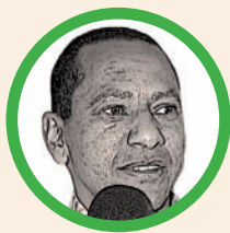
Por Jorge Nain Ruiz Ditta