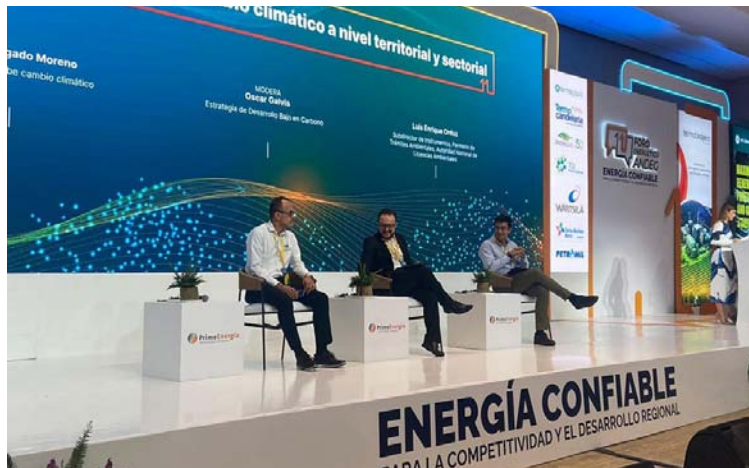
Se realizó una conversación alrededor de lo que requiere Colombia para garantizar energía confiable.

En la actividad participaron empresas como Ecopetrol, el Comité Colombiano del Consejo Mundial de Energía, Probarranquilla, TPL Energía, entre otras.