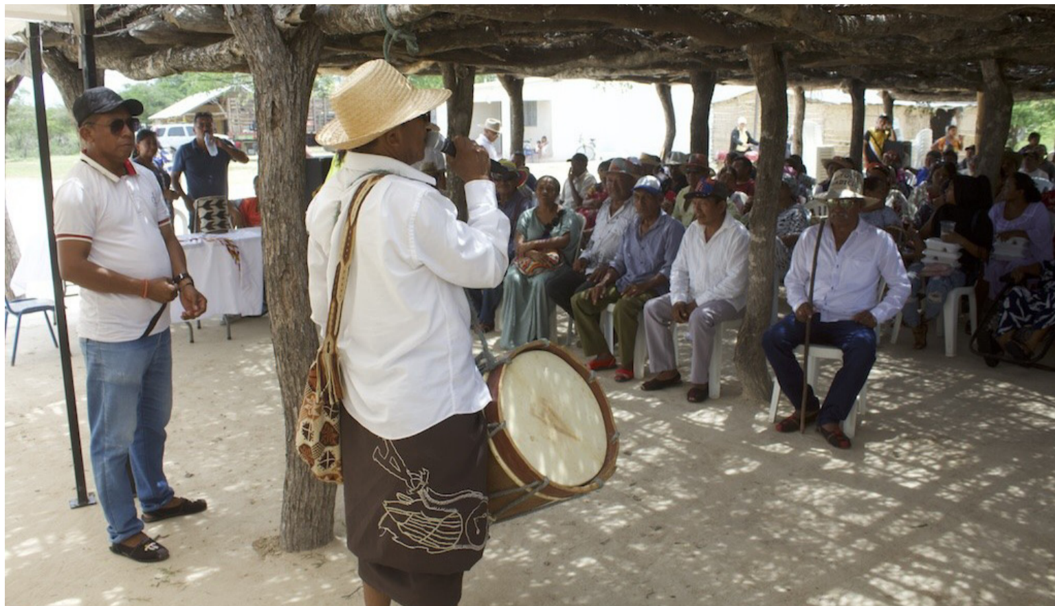
Autoridades indígenas postularán el personal que consideran que cumplen requisitos para ser Promotores de Salud.

Las discusiones sobre las Sentencias T-302 y T-466 evidenciaron las deficiencias en la prestación de servicios básicos, y se subrayó la necesidad de fortalecer la infraestructura para garantizar el bienestar de las comunidades. El estudio de caso presentado destacó la urgencia de mejorar las vías de acceso, el acompañamien-