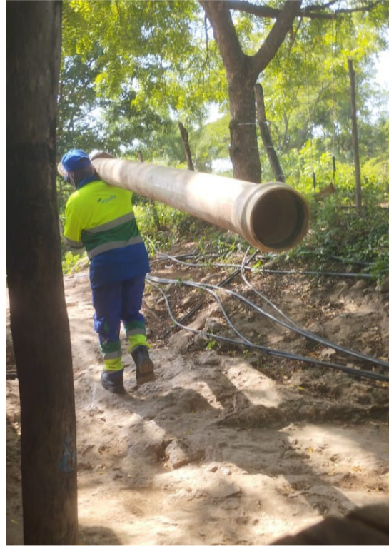
En zona enmontada de Cuestecita fueron recuperados los tubos hurtados.

exclusivo de la empresa de servicios públicos que hacen parte de los 500 metros de tubería hurtada.