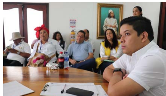
El alcalde explicó que su Administración continúa dando pasos firmes hacia la atención y reparación de víctimas.