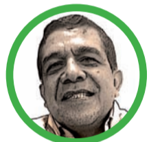
Por Hernán Baquero Bracho