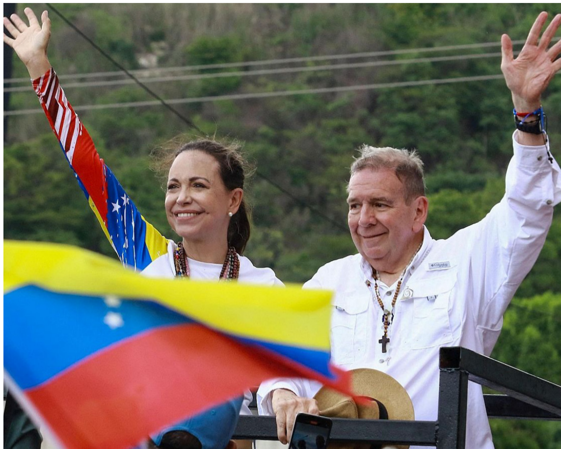
La oposición alcanzó a acumular el 81% de las actas suscritas.

En manifestaciones previas a la elección, el presidente Maduro expresaba que la reelección la ganaba a las buenas o a las malas. A las malas sería violar la democracia e im-