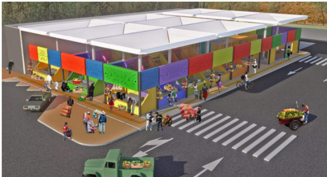
Es un proyecto que apunta al cumplimiento de las metas del PND.

invertirá cerca de 500.000 millones de pesos, para construir inicialmente 150 PAS en los municipios que queden seleccionados. "El presidente Gustavo Petro quiere que sigamos construyendo en todos los territorios donde, según nuestros sistemas de información y mapas de hambre, sea pertinente, porque el hambre no da espera. Abrimos la primera convocatoria, y no va a ser la última. Esta es una inversión y un ritmo inéditos: los últimos cinco años, Prosperidad Social ha entregado ocho plazas de mercado; vamos a construir 150 en este periodo", puntualizó.