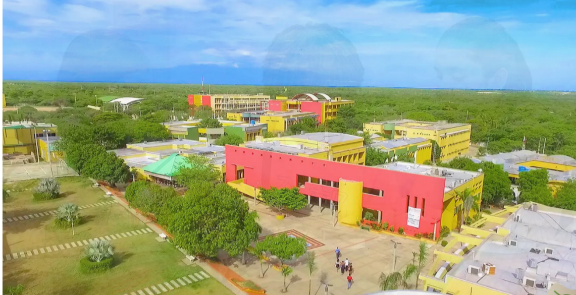
El encuentro busca reconocer y visibilizar la presencia de instituciones públicas y privadas.

Además de identificar y proyectar los aportes de la educación superior a partir del intercambio de buenas prácticas, el traba-