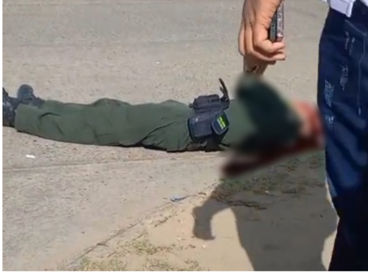
El uniformado fue impactado a bala por sujetos en moto que sin mediar palabra le dispararon.

El Departamento de Policía La Guajira notificó que en el momento que el patrullero y el recluso salían del centro médico donde era atendido el privado de la libertad, el