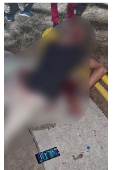
El occiso falleció en el lugar de los hechos.

Romero era conocido como mototaxista y había sido escolta, también fue taxista. Se espera el reporte oficial de las autoridades para conocer detalles del suceso y el posible móvil.