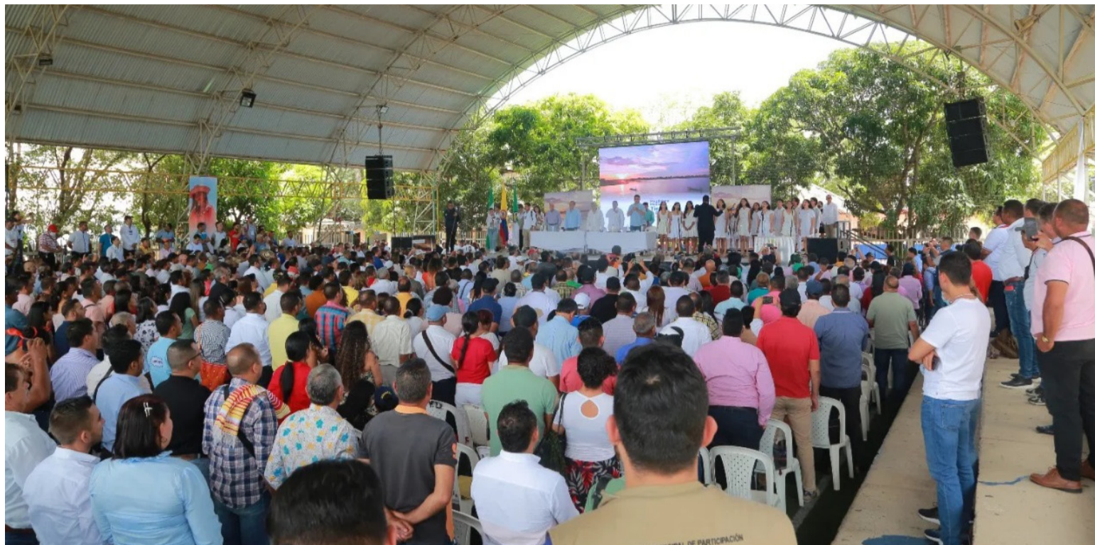
Un plan de desarrollo en Colombia busca promover el desarrollo social en una determinada región.

El Plan Marshall para la reconstrucción de Europa posterior a la II Guerra Mundial, es la demostración contundente del desarrollo de una fase intervencionista del Estado y a la planificación estra-