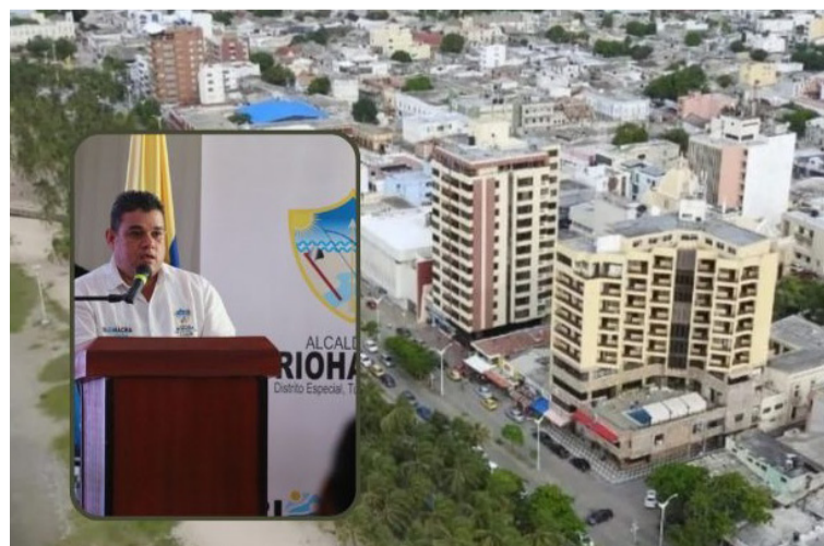
La presunta omisión en la que habría incurrido Suaza Movil fue calificada como falta gravísima.

La presunta omisión en la que habría incurrido Suaza Movil fue calificada provisionalmente como falta gravísima a título de culpa gravísima.