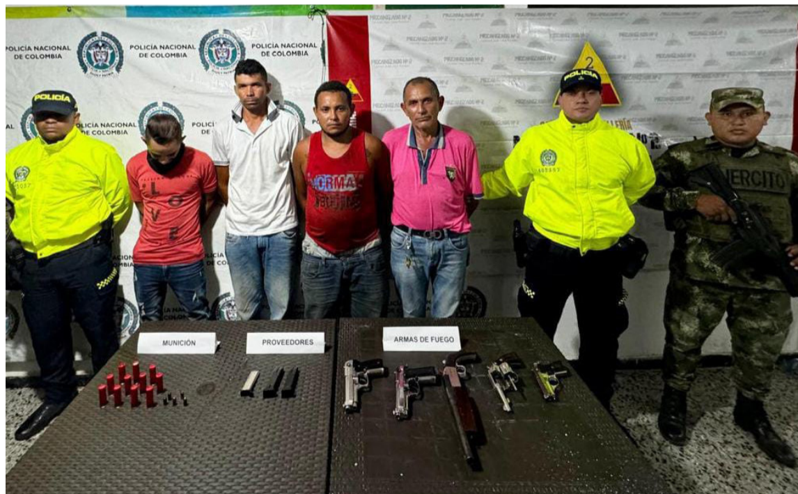
Los uniformados sorprendieron a estos individuos en flagrancia con armas de fuego.

En un operativo llevado a cabo en el sur de La Guajira, la Seccional de Investigación Criminal, en colaboración con el Ejército Nacional y la Fiscalía General de La Nación, logró la captura de cuatro individuos que portaban varias armas de fuego ilegales. El procedimiento se desarrolló en el corregimiento de Caracolí, zona rural de San Juan del Cesar.