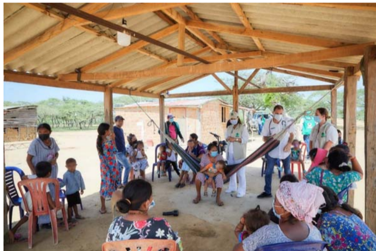
La Sentencia T-302 se constituye en un gran acuerdo para protección de la niñez wayuú y su pervivencia.

Un plan de desarrollo en Colombia, se concibe como un instrumento de gestión formal que busca promover el desarrollo social en una determinada región, que opera como hoja de ruta o guía indicativa para ejecutar el Plan de Gobierno que propuso el candidato ganador durante el periodo electoral