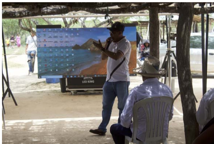
Las funciones del Promotor de Salud, se fundamentan sobre una base comunitaria.

Un eje central de estos encuentros de socialización con el pueblo wayuú, es la postulación y selección de las personas que se formaran como promotores de salud comunitaria, cuyas funciones se fundamentan sobre una base comunitaria, para la atención y asistencia que debe proveer el sistema de Salud a las comunidades, la necesidad de contar con estos equipos, provienen de las ideas expresadas durante la celebración de los diferentes diálogos genuinos, especialmente los realizados, durante el proceso de la ruta metodológica de las reuniones realizadas en el marco de los autos 696 y 1290 de 2023; especialmente en la reunión que