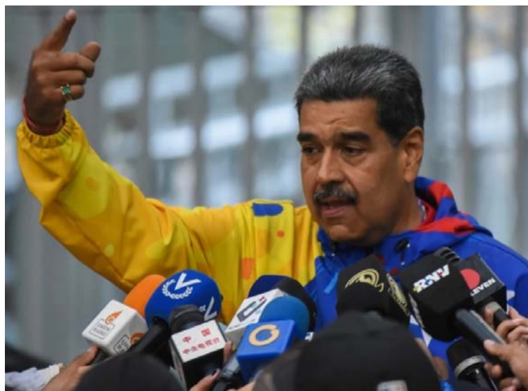
Por las buenas no creo que el presidente de Venezuela entregue el mandato del nuevo Gobierno.

DESTACADO Los venezolanos, en vez de emigrar a otros territorios externos, más bien deben retornar a defender la patria, atrapada y secuestrada por el dictador Nicolás Maduro.