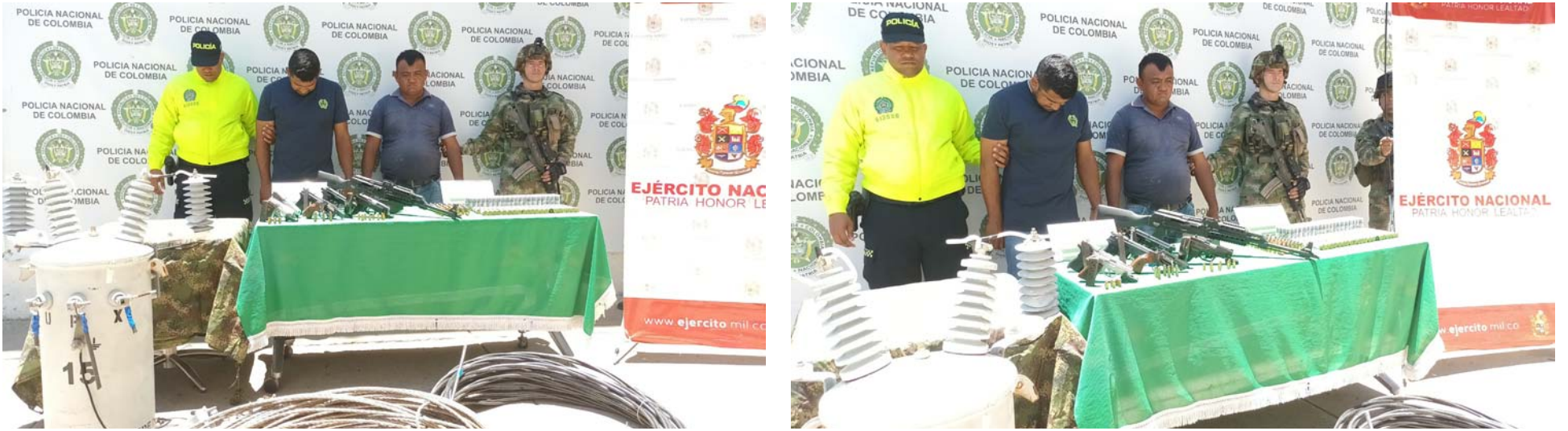
Se incautaron seis armas de fuego cortas, un fusil traumático calibre 9 milímetros, seis proveedores de diferentes calibres, y 252 cartuchos.

La operación se ejecutó por parte de la Sijín y Ejército Nacional