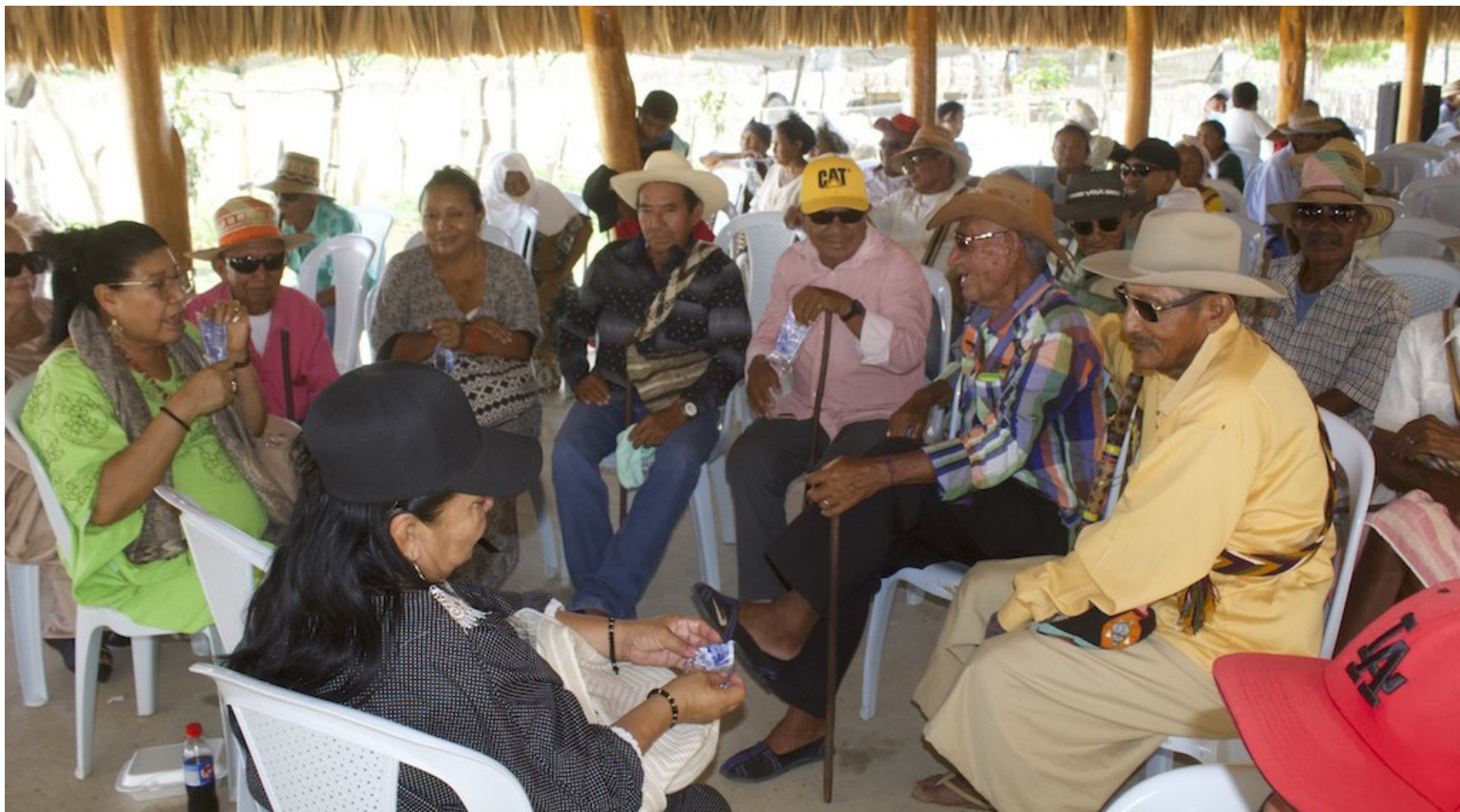
En los encuentros se han recogido diversas percepciones en la prestación de servicios de salud a las comunidades.

Los días 18 y 19 de julio se desarrolló en la comunidad indígena de Jamuchencho, sector de La Sabana, jurisdicción del municipio de Manaure, el cuarto encuentro con las autoridades indígenas del sector donde participaron en promedio unos 400 asistentes; en ese espacio comunitario a los asistentes se les socializó sobre el plan provisional de acción Auto 696 del 2022 y 1290 de 2023, los acuerdos frente al decreto 1270 de 2023 para la adecuación del modelo de salud intercultural, conformación del equipo técnico wayuú en el marco de la mesa técnica de salud, selección del personal que se formará como promotores de salud y garantía