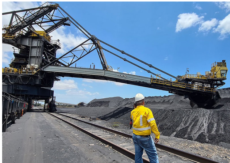
La política minera de este Gobierno se debate entre la coherencia y el dogmatismo, pero alejado del realismo.

La hostilidad hacia la actividad extractiva, se pone de manifiesto en el esperpento jurídico de un decreto del Ministerio de Ambiente, el 044 de 2024, a través del cual se arroga unas competencias desmedidas y se lleva de calle el principio constitucional de la autonomía territorial, así como sucedió con la delegación de la autoridad minera al departamento de Antioquia, que se revirtió. Según la norma cuestionada, al declarar un área como 'reservas temporales' y so pretexto de protegerlas, puede iniciarse un proceso que puede "culminar con la restricción o exclusión definitiva de la minería", aun tratándose de aquella amparada por la ley. Con señales como estas se está espantando a la inversión y a los inversionistas del sector. La política minera de este Gobierno, entonces, se debate entre la coherencia y el dogmatismo, pero alejados del realismo y el pragmatismo.