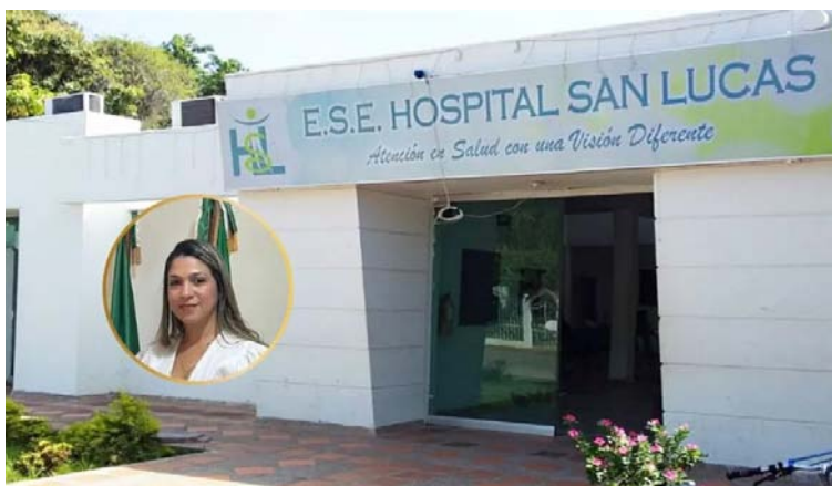
Trabajos iniciaron el pasado 20 de febrero y el 6 de marzo ya se anunciaba un posible incumplimiento..

"Ellos presentaron recurso de reposición tanto la aseguradora como la contratista, sin embargo, posterior a eso recibimos la notificación del Ministerio donde nos solicita la devolución de los recursos y ya el 29 se declaró el incumplimiento definitivo y se emitió la suspensión de la licencia de construcción", agregó.