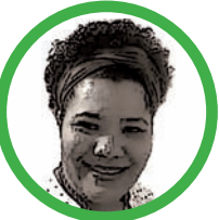
Por Iliana Curiel Arismendy Médica Pediatra

La partería wayuú, tradición ancestral que cuida la vida desde la concepción hasta los primeros años, es un tesoro cultural que requiere reconocimiento y protección.