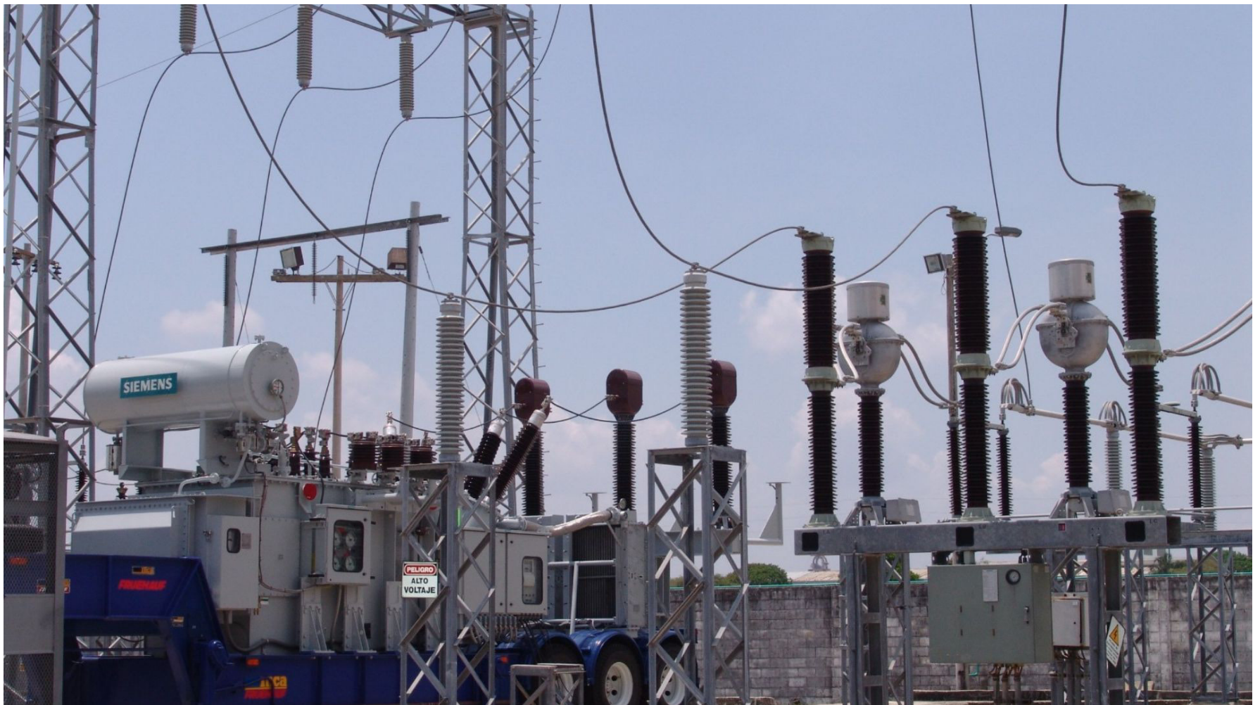
No es justo que los habitantes de estratos bajos en la costa están gastando hasta el 65% de sus ingresos pagando servicios públicos.

Las acciones deben conllevar a incluir más energías renovables