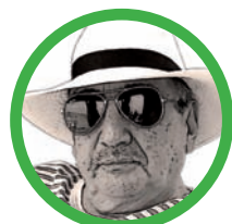
Por José Manuel Aponte Martínez