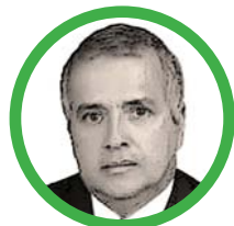
Por Rubén Darío Ceballos Mendoza