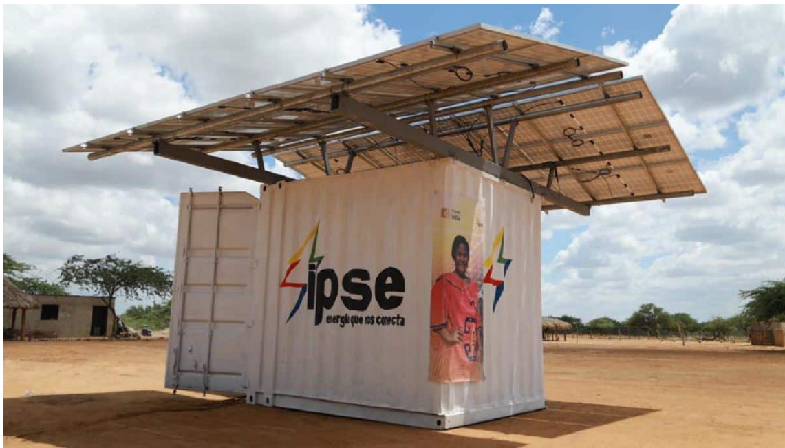
A los gobernadores costeños, solo les queda organizarse en comunidades energéticas.

Las condiciones climáticas excepcionales contribuyen a un consumo eléctrico elevado y cons-