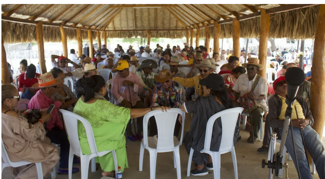
Se busca implementar el proceso de construcción del Modelo de Salud Propia.

del diálogo genuino, en el desarrollo de estos encuentros, se han recogido diversas percepciones de la comunidad wayuú alrededor del enfoque diferencial en la prestación de los servicios de salud a las comunidades indígenas, quienes exigen o esperan del nuevo modelo al menos las siguientes garantías: (i) producir y emplear sus propias medicinas tradicionales y curativas; (ii) organizar y prestar los