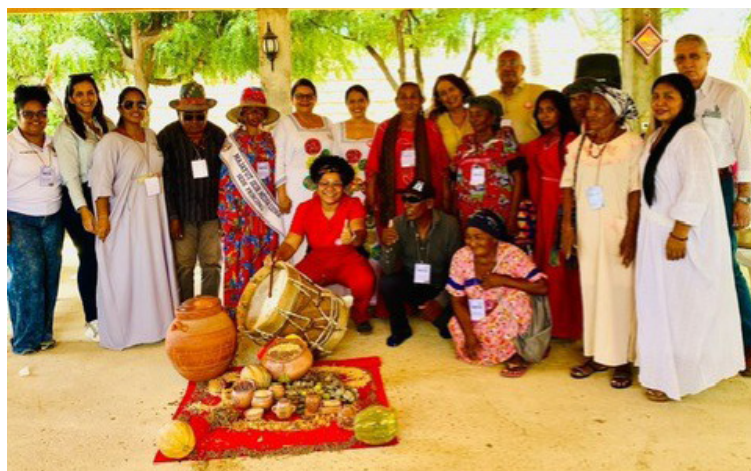
La partería wayuú es un ejemplo de prácticas tradicionales que pueden complementarse con la medicina moderna.

#LaSaludEsPolítica: Insto a las instituciones gubernamentales, a la cooperación internacional y a la sociedad civil a crear y apoyar escenarios propicios para la creación de esta red. En un contexto donde las comunidades wayuú enfrentan desafíos significativos, como la desnutrición y las altas tasas de mortalidad infantil, es imperativo promover políticas y programas que reconozcan y apoyen el trabajo de las parteras. Estas mujeres y hombres no solo son cuidadores, sino también líderes y defensores de la salud y el bienestar en sus comunidades.