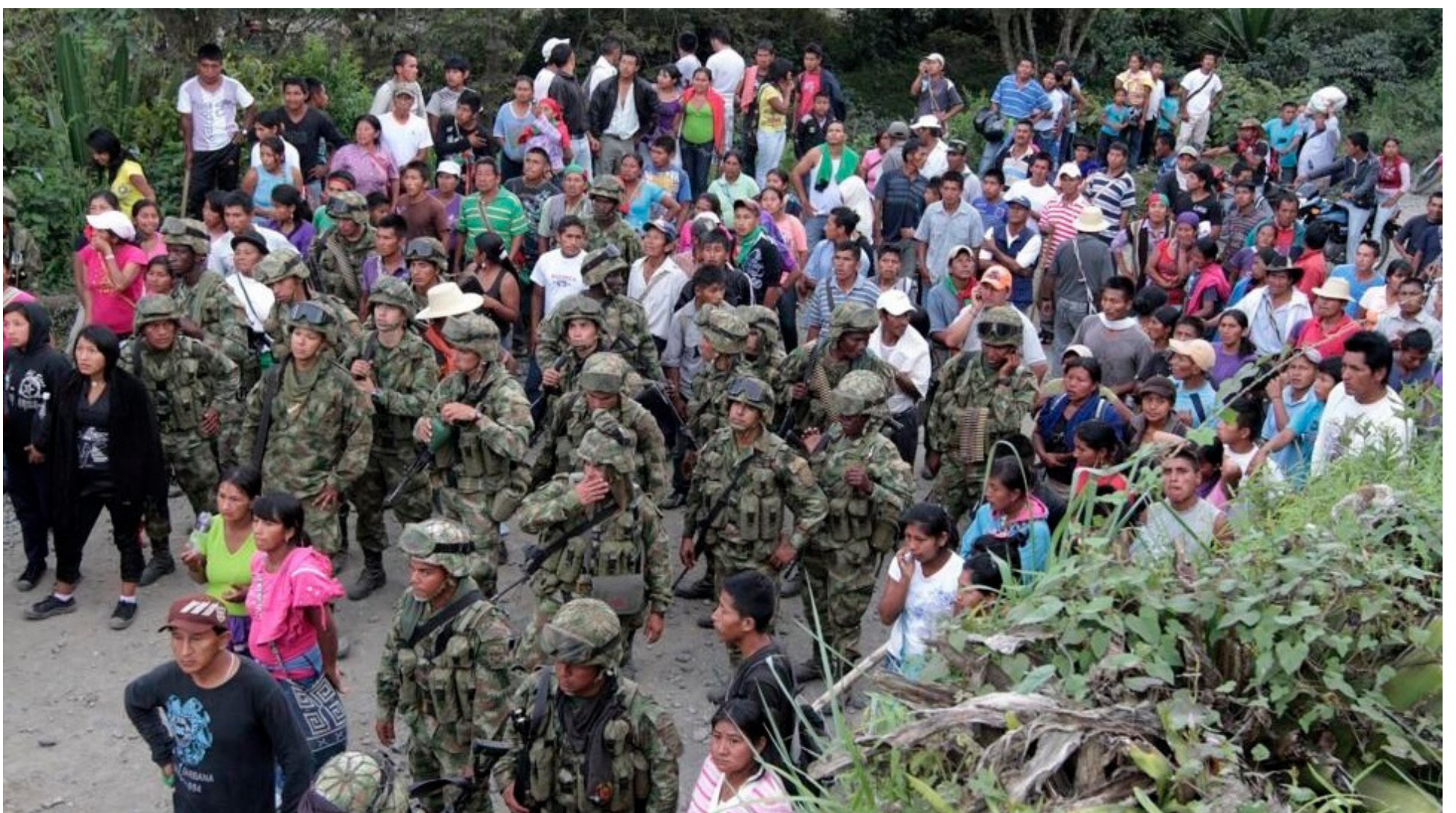
En este Gobierno ellos, los indígenas, han tomado mucho auge, como si en sus territorios, sólo ellos tienen la autoridad.