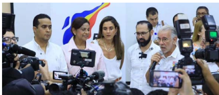
El gobierno acordó implementar medidas con todos los actores para reducir tarifas de energía.

El ministro Camacho Morales señaló que se espera, con las empresas de generación y transmisión, gobernaciones y alcaldías, instituciones de regulación y control, y el Gobierno nacional, "concluir la política que hemos llamado de la perinola.